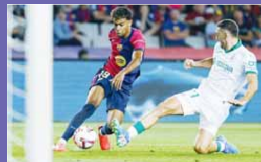
يامال يوقف قلوب جمهور البرشا

هذا الموقف أثار القلق بين جماهير برشلونة، خاصة مع