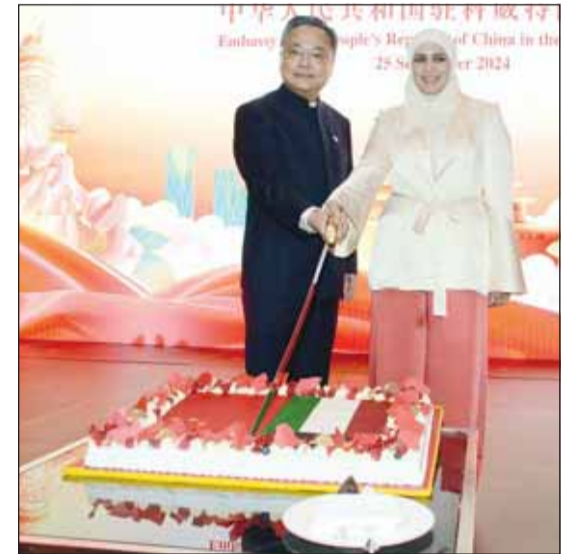
الوزير الفصام والسفير جيانوي يقطعان حلوى الاحتفال