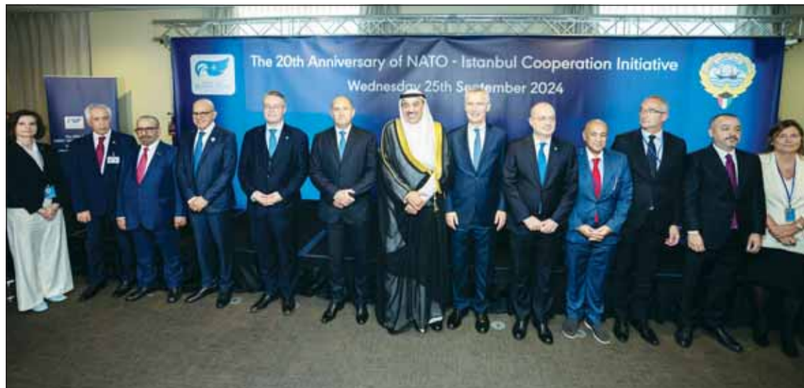
سمو ولي العهد وأمين عام حلف شمال الأطلسي ينوسطان المشاركون فيه احتفالية مرور الذكرى الـ 20 على إطلاق مبادرة إسطنبول

بهده المناسبة أكد خلالها على أهمية الجهود والدور الذي تقوم به دولة الكويت في تعزيز الشراكة بين حلف الناتو ودول المبادرة. حضر الاحتفالية ممثلو الدول الأعضاء في حلف شمال الأطلسي والدول الشركاء في مبادرة إسطنبول للتعاون بالإضافة إلى المملكة العربية السعودية وسلطنة عمان وأمين عام مجلس التعاون لدول الخليج العربية.