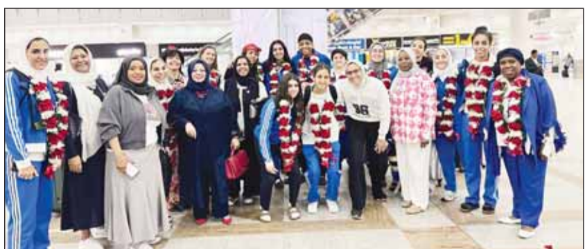
فقد سلة نادي الفتاة

وأضاف أن "كان" أطلقت مسابقة "أخسر... تكسب"، مؤكدة ضرورة التركيز على اتباع نمط صحي للحياة من خلال الارتكاز على عنصرين هامين وهما ممارسة النشاط البدني وتناول الغذاء الصحي، بسبب ارتفاع معدلات السمنة في الكويت.