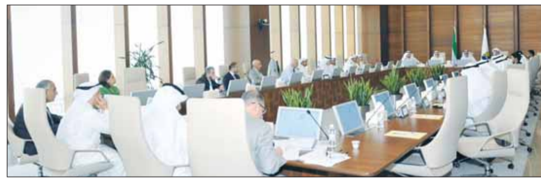
جانب من اجتماع مجلس الجامعة