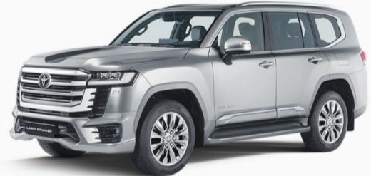
LAND CRUISER (MY 2022, 2023 &amp; 2024)

من رقم فاعدة: JTMAB7BJ6N4000128 إلى رقم: JTMABBBJ9R4157385