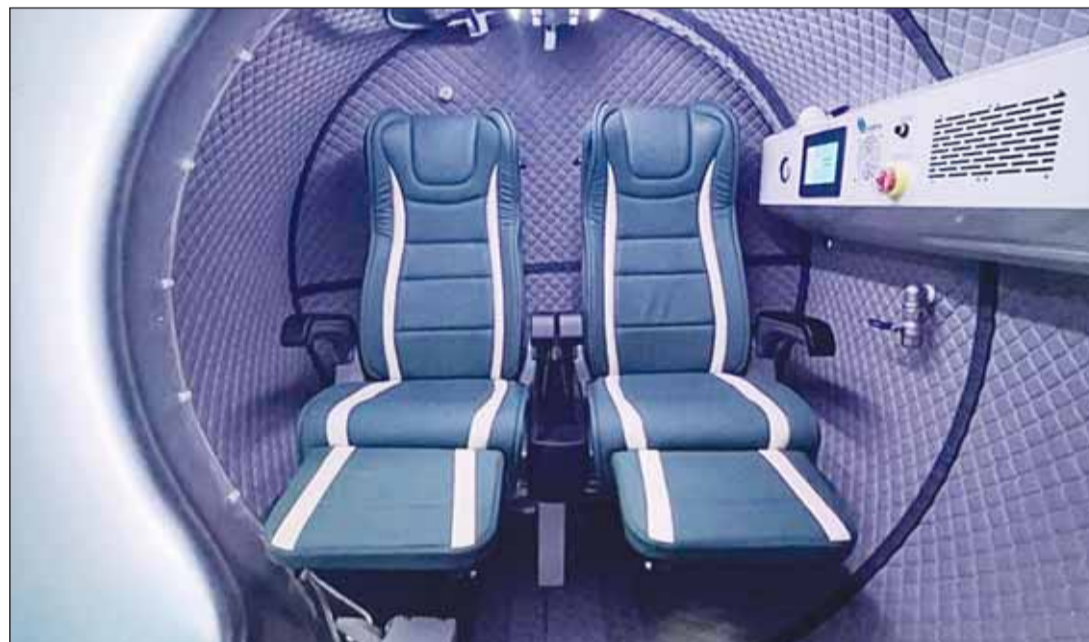
غرفة عالية الضغط من الداخل

الأداء البدني. كما أن ارتفاع نسبة انتشار مرض السكري في الشرق الأوسط يفتح المجال واسعاً أمام حلولنا الطبية لاسيما أن الأكسجين عالي الضغط مفيد لعلاج مضاعفات هذا المرض مثل القرحة السكرية وقضايا الشفاء.