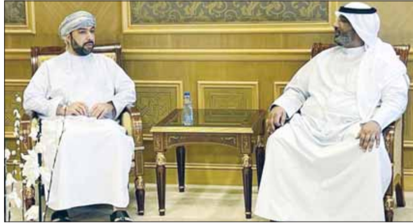
محمد بوعركي مستقبلاً سفير عمان د. صالح الخروصي

بحث رئيس المركز الوطني للأمن السيبراني اللواء ركن متقاعد مهندس محمد بوعركي اليوم، مع سفير سلطنة عمان لدى دولة الكويت الدكتور صالح الخروصي والوفد المرافق له أوجه التعاون المشترك وتعزيز العلاقات الثنائية في مجالات الأمن الرقمي.