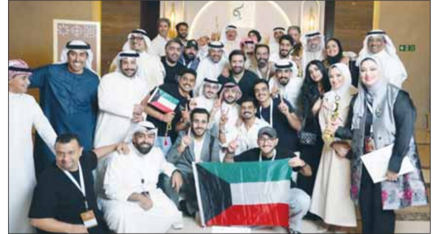
فريق مسرحية "غصة عبور"