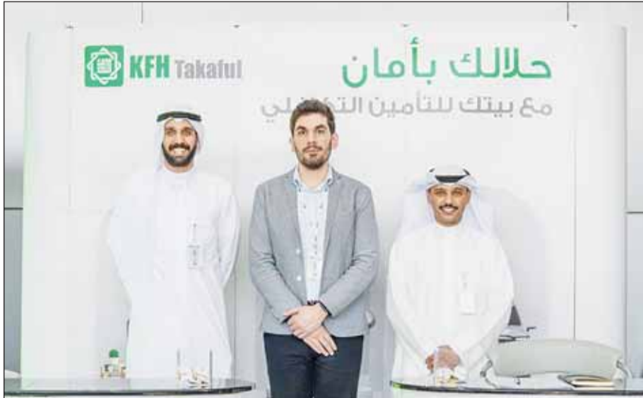
جنار الشركة في المعرض

ويستقبل فريق "بيتك تكافل" العملاء وزوار المعرض من خلال جناح خاص، لعرض منتجات وخدمات الشركة، بالإضافة إلى توضيح الجانب الشرعي في المعاملة وغيرها من الأمور التي تهم العملاء وزوار المعرض، وتقديم العديد من العروض والمزايا على بعض المنتجات التأمينية التي تقدمها الشركة. وتستهدف "بيتك تكافل" من خلال مشاركتها في المعرض، تعزيز الانتشار والتواجد لتصبح أقرب إلى عملائها، وكذلك التعرف على المتطلبات والاحتياجات التي يطرحها العملاء ودراسة آرائهم ومقترحاتهم، حيث تعتبر المعارض فرصة للاعتناء المباشر مع العملاء.