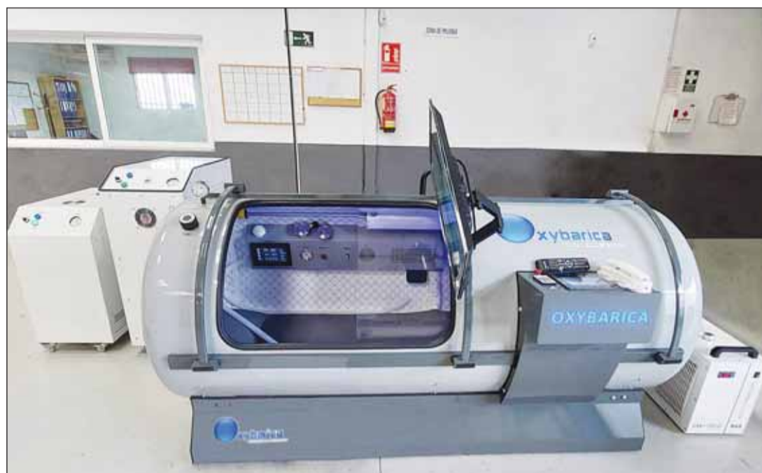
أحد نماذج الشركة من غرف العلاج