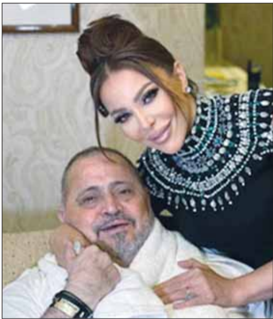
سوزان نجم الدين وجورج وسوف

هذا ويحسب تلفزيون الجديد كانت الممثلة السورية سوزان نجم الدين قمت سلطان الطرب جورج وسوف بالكلمات المؤثرة ذاتها التي نشرتها على "انستغرام"، وذلك في مستهل مظه الذي أقيم قبل أيام في العاصمة السورية دمشق، والذي قدم فيه باقة من أغانيه الشهيرة القديمة والجديدة لجمهوره.