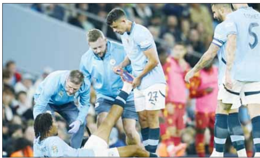
فضايا كثيرة ضد السيتي بالبريميرليغ

تتشعر أندية الدوري الإنجليزي الممتاز بالرعب بسبب قضايا رابطة البريميرليغ ضد مانشستر سيتي. وكانت الرابطة اتهمت مانشستر سيتي بـ 115 مخالفة مزعومة لقواعد الدوري الإنجليزي المالية، والتي تمتد لتسع سنوات منذ عام 2009. ووفقاً لصحيفة "ديلي ميل" البريطانية، ستدفع تكاليف الإجراءات القانونية التي أقامتها رابطة الدوري الإنجليزي الممتاز ضد مانشستر سيتي من الصندوق المركزي للرابطة. وقد بدأت جلسات الاستماع لهذه الاتهامات في وقت سابق من هذا الشهر، لكن من المتوقع أن تستمر الإجراءات والطعون لعدة أسابيع. وأشارت الصحيفة إلى أن رابطة الدوري الإنجليزي قد تدفع فاتورة قانونية تصل إلى عشرات الملايين، حتى لو فازت في القضية ضد مانشستر سيتي.