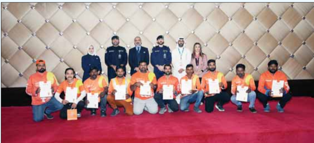
خلال تكريم مجموعة من سائقي طلبات