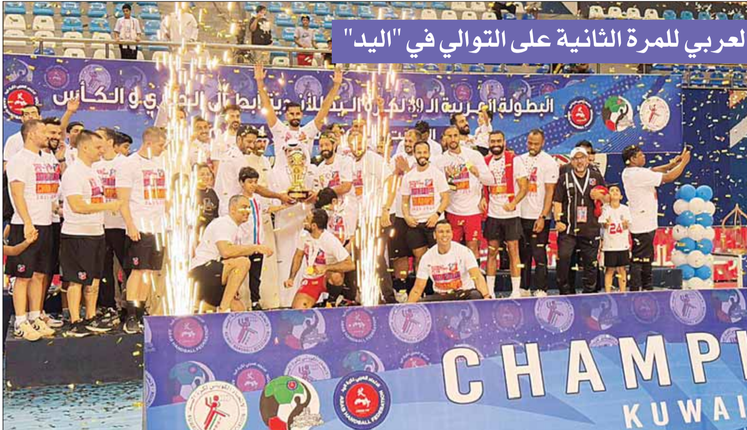
يد "العميد" بطل العرب للمرة الثانية على التوالي