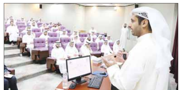
جانب من ورشة العمل

عقدت وزارة المالية ممثلة بقطاع شؤون التخزين ونظم الشراء (إدارة نظم الشراء) ورشة عمل لتطوير أدلة الشراء الجماعي للجهات الحكومية، بهدف تطوير الأدلة والاطلاع على المعوقات التي تواجه الجهات الحكومية في إعدادها والعمل على معالجتها، والأخذ بعين الاعتبار المقترحات المقدمة من قبل الجهات المشاركة،