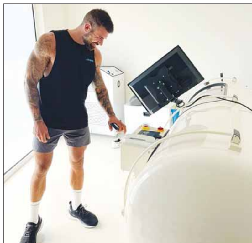
تصافيه الرياضيين أبرز علاجات الغرفة

● ما هي أبحاثكم حول الطلب على العلاج بالأكسجين عالي الضغط في المنطقة؟