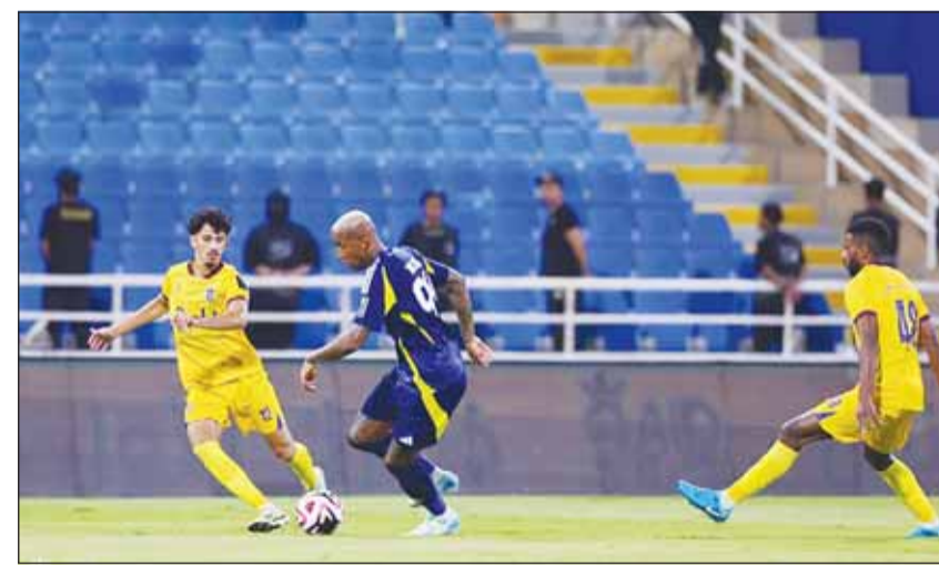
العالمي يطمح للانطلاق قوية اليوم

ليقدم لدور 16. ويسعى الاتحاد لتخطي خسارته 1-3 من الهلال في الجولة الماضية ما أفقده صدارة الدوري، ويستعد للعودة لطريق الانتصارات عندما يستضيف الخليج الذي فاز مرة واحدة في أربع مباريات. ولا يريد المدرب لوران بلان أن تستمر نتائج فريقه السلبية في الدوري بعد بداية صعبة عقب تحقيق انتصاراتين قبل لحظات من النهاية على الخلود والتعاون في أول مباراتين. وفي اليوم ذاته، سجل الأهلي ضيفاً على القادسية بعد خروج مغاضب من كأس الملك أمام الجندل المنافس في الدرجة الثانية. ويحل الهلال ضيفاً على الخلود الصاعد حديثاً الذي حقق فوزه الأول في الدوري الجولة الماضية 1-0 على الوحدة، بحثاً عن الوصول للنقطة 15 وذلك يوم غد.