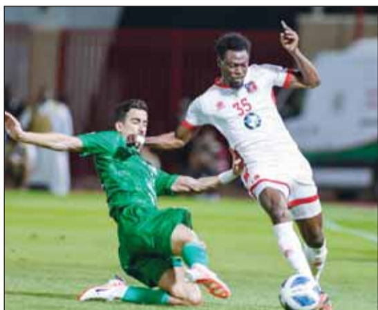
أخذ مواجهة بين الفريقين انتهت للكويت بثلاثية نظيفة

يعتضن ستاد الصداقة والسلام في الساعة والنصف مساء اليوم قمة مباريات الجولة السادسة من دوري زين الممتاز، والتي ستجتمع الكويت مع العربي وتستكمل الجولة عدداً بإقامة مباراتين، يلتقي في الأولى القاسية مع التضامن على ستاد محمد الحميد، فيما يواجه الفيحاني نظيره كاظمة على ستاد صباح السالم. وتفتتح الجولة بعد غد بمواجهتين، تجمع الأولى النصر مع اليرموك على ستاد ثامر، فيما يلتقي في الثانية خيطان مع السالمية على ستاد ناصر الصميمي.