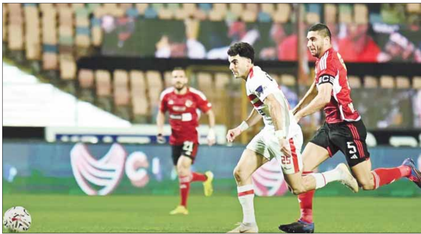
قطب الكرة المصرية يتواجهان في الرياض اليوم

سيلعب الأهلي والزمالك في ملعب مكيف للمرة الأولى في تاريخهما وذلك عندما يلتقيان على ملعب "كينغدوم أرينا" التابع لنادي الهلال السعودي اليوم في نهائي كأس السوبر الإفريقية. وتحتضن السعودية نهائي السوبر للمرة الثانية على التوالي بعدما استضافت النسخة الماضية التي كسبها اتحاد العاصمة على حساب الأهلي في الطائف صيف العام الفائت. وتبلغ سعة الملعب المكيف بالكامل 27 ألف متفرج، وذلك بعد أعمال التطوير التي أجريت عليه بعد نهاية الموسم الماضي رفعت سعته الاستيعابية، بالإضافة إلى تطوير الأضواء وغرف الملاعب.