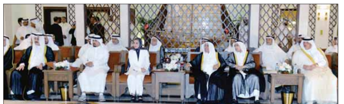
الوزير الفصام والسفير جيانوي يقطعان حلوى الاحتفال

وأوضحت أن ذلك يشمل سبع اتفاقيات موقعة مع الحكومة