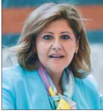
الشيخة جواهر الدعيج

في ذلك استعراض أبرز الأولويات خلال الدورة الـ57 لمجلس حقوق الإنسان وذلك انطلاقاً من عضوية دولة الكويت في المجلس لفترة من 2024-2026. وأثنت في ذلك على دعم الجانب الأوروبي للبيان المقدم من دولة الكويت في اليوم العالمي للعمل الإنساني حول دعم العاملين في العمل الإنساني وتوفير الحماية لهم.