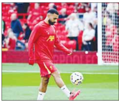
صلاح مقبل علم تعويض كبير

كشفت وسائل إعلام إسبانية أن ليفربول قد يدفع 100 مليون يورو من أجل التعاقد مع البرازيلي رودريغو لاعب ريال مدريد ليكون معوضاً لمحمد صلاح نجم الفريق والذي ينتهي عقده نهاية الموسم الحالي. وينتهي عقد صلاح خامس أهداف في تاريخ ليفربول أواخر يونيو المقبل، بينما أشار اللاعب مطلع الشهر الجاري إلى أن النادي لم يبدأ التفاوض معه على عقد جديد وقد يكون هذا موسمه الأخير.