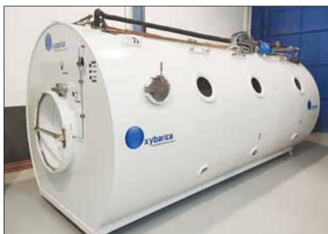
نموذج آخر للغرف