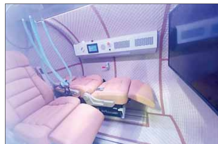
أحد غرف العلاج الحديثة