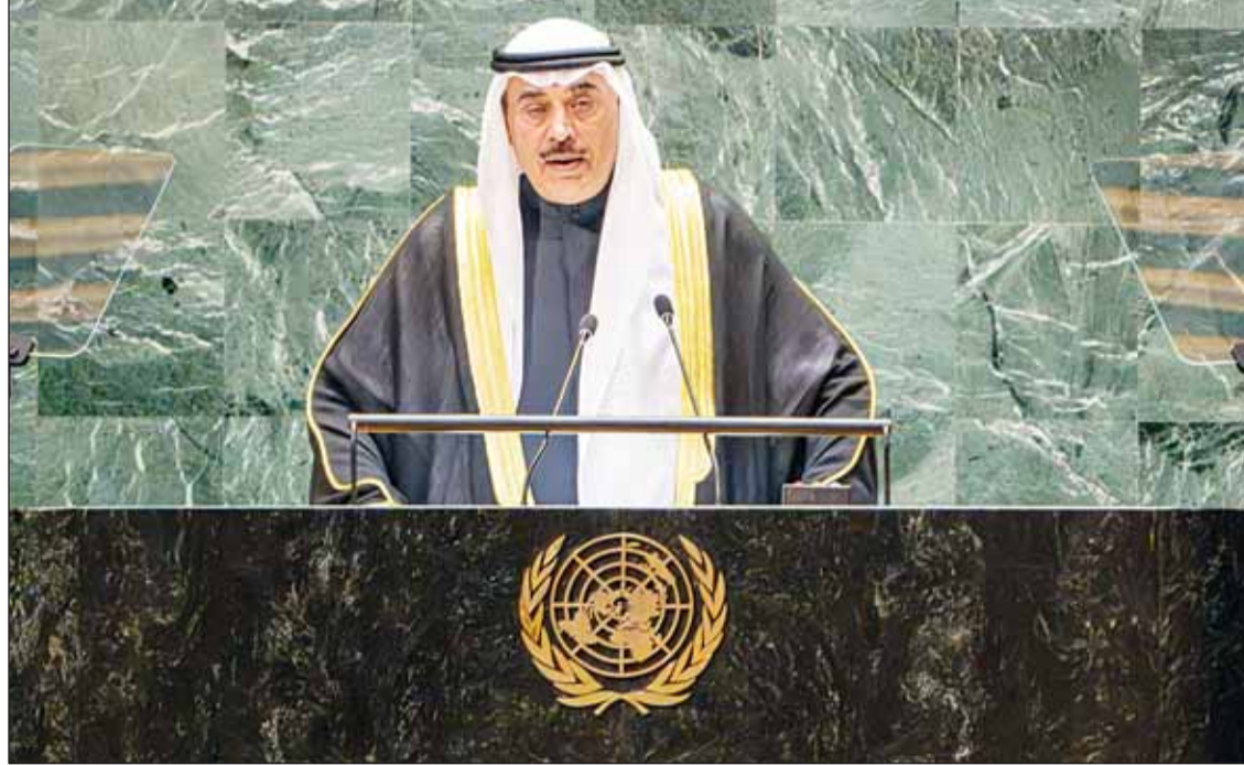
ممثل سمو الأمير سمو ولي العهد الشيخ صباح الخالد يلقي كلمة الكويت أمام الجمعية العامة للأمم المتحدة

وتمسكهم بقيم ومبادئ ميثاق الأمم المتحدة والقانون الدولي.