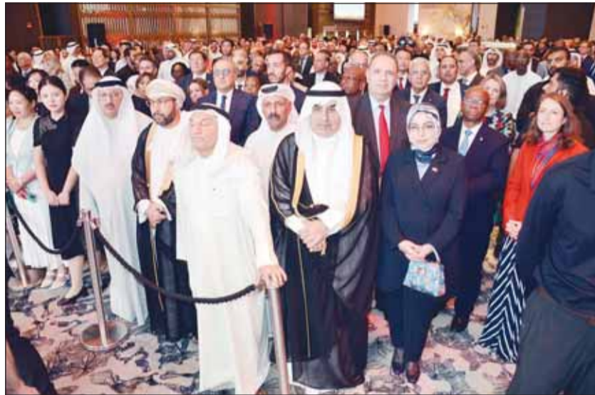
حضور كثيف في احتفال السفارة الصينية بالذكرى الـ 75 لتأسيس الجمهورية

تقيم علاقات دبلوماسية مع الصين، ولقد ظلت علاقتنا الثنائية دائماً في طليعة علاقات الصين مع الدول الأخرى في المنطقة. وأضاف: إن الأبرز من ذلك كان عقد اجتماعين ناجحين بين الرئيس الصيني شي جين بينغ وسمو أمير الكويت الشيخ مشعل الأحمد الذين ضمنا زخماً قوياً للنمو المستقبلي للعلاقات الصينية-الكويتية في العصر الجديد، وفي الوقت الحاضر، يعمل الجانبان بجدية لتنفيذ التوافق الهام بين قيادتي الدولتين، ودفع بقوة المشاريع التعاونية الكبرى بما في ذلك ميناء مبارك الكبير، وبالإضافة إلى ذلك، تزدهر التبادلات الشعبية بين المؤسسات الإعلامية والشباب والطلاب من الجانبين، وقد قُتِمَت العديد من الفرق الفنية الصينية عروضاً مذهلة في الكويت، في حين اكتسبت اللغة الصينية شهرة متزايدة في البلاد، ويوفر هذا أساساً أكثر صلابةً لفهم والصدقة بين الشعبين. وأوضح أنه على مدى الـ 75 سنة الماضية، اتحد الحزب الشيوعي