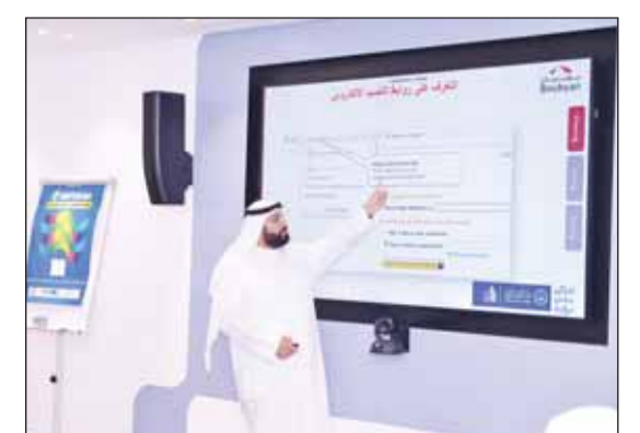
على المتحدث خلال ورشة العمل

وأوضح أن المكالمات الاحتمالية تُعد واحدة من أكثر طرق الاحتيال وسرقة الهوية شيوعاً والتي تتمثل في قيام المبتدئين بالاتصال عبر الهاتف بالضحية وانتحال شخصية موظف بنك أو أي جهة رسمية لإيهام العميل بضرورة تجديد البيانات أو تفعيل البطاقة المصرفية، لذا يتوجب الحذر عند التعامل مع مثل هذه المكالمات كونها ممكن أن تؤدي إلى خسارة مالية وسرقة الهوية وعواقب وخيمة أخرى.