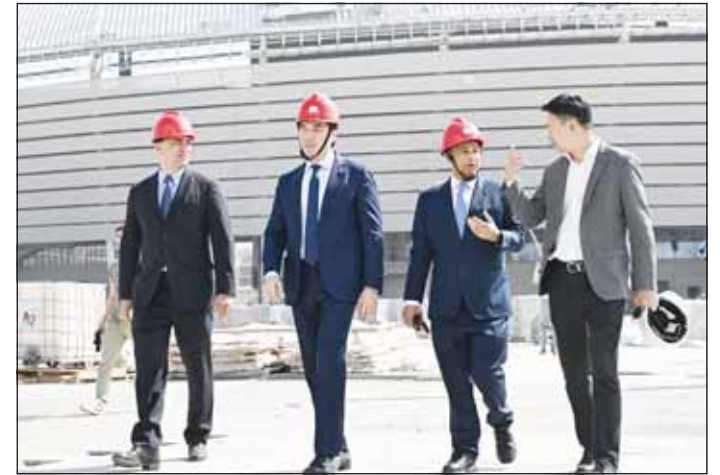
المسلم تفقداً منشآت طشقند

■ قام مدير عام المجلس الأولمبي الآسيوي الكابتن حسين المسلم، بجولة تفقدية في القرية الأولمبية بمنطقة ياشناباد في طشقند، أوزبكستان، والتي تستضيف دورة الألعاب الآسيوية الصيفية للشباب 2025. وتابع المسلم، آخر الاستعدادات وسير العمل الخاصة بالمنشآت الرياضية التي ستقام عليها المنافسات. من جانبه، قال الكابتن حسين المسلم، إنه سعيد بتواجده في القرية الأولمبية بطشقند، وأن سير العمل يسير في الاتجاه الصحيح وبصورة سريعة تضمن جاهزية هذه المنشآت قبل انطلاق الألعاب الآسيوية للشباب بوقت كاف. وأضاف، "جاءت المنشآت الرياضية من صالة سباق الدراجات إلى استاد كرة القدم ومضمار ألعاب القوى ومجمع أحواض السباحة وبقية المنشآت الأخرى حسب المعايير والمتطلبات الرياضية الدولية". وبين المسلم، أن دورة الألعاب الآسيوية للشباب "طشقند 2025"، ستكون دورة ألعاب مهمة للقارة الآسيوية كونها مهولة لدورة الألعاب الأولمبية للشباب في دكار السنغال 2026. وأكد المسلم، المنشآت التي يتم بناؤها الآن بطشقند، مهمة لمستقبل الرياضة في أوزبكستان، ما يمنح البلاد الفرصة لاستضافة أحداث وبطولات عالمية أكبر في المستقبل.