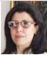
الشيخة حصة الحمود السالم الصباح