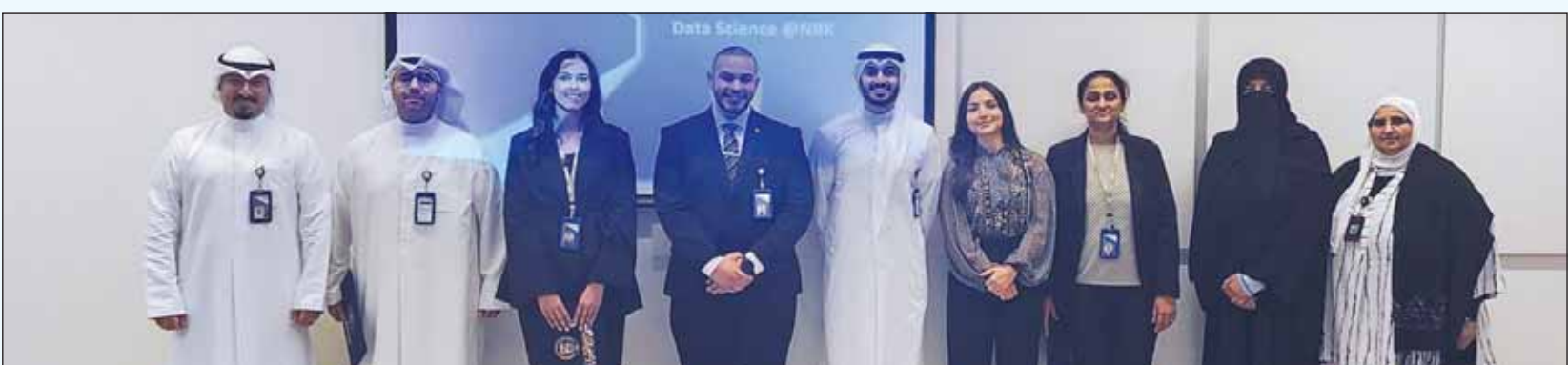
المشاركون في تنظيم الورش بالجامعة

على تدريبها وتنمية مهاراتها وتأهيلها للعمل المصرفي، إضافة إلى سعيها الدؤوب لبناء كوادر متميزة يمكنها تقبل المناصب القيادية في المستقبل وتقديم قيمة مضافة للبنك الوطني والقطاع المصرفي والاقتصاد الكويتي". ويسعى البنك الكويتي الوطني إلى إعداد جيل من الكوادر الوطنية قادر على المساهمة في تطوير الاقتصاد الكويتي وتقديم حلول مبتكرة في مجال الصناعة المصرفية، حيث تمثل مثل هذه الورش خطوة مهمة نحو تحفيز الطلاب على استكشاف خياراتهم المهنية وتوفير أدوات المعرفة والمهارات اللازمة لمواجهة تحديات سوق العمل في المستقبل.