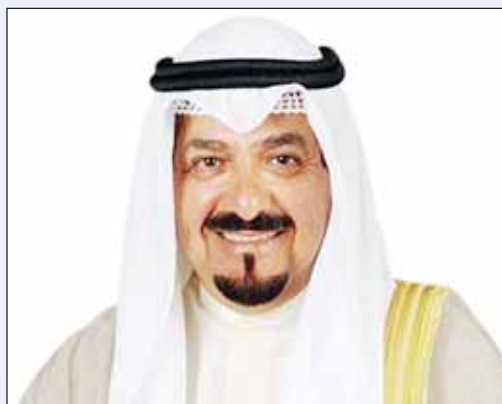
سمو الشيخ أحمد العبدالله

بعث سمو رئيس مجلس الوزراء الشيخ أحمد العبدالله ببرقية تهنئة إلى الرئيس عبدالفتاح السيسي رئيس جمهورية مصر العربية الشقيقة، بمناسبة الذكرى الواحدة والخمسين لانتصارات حرب السادس من أكتوبر.