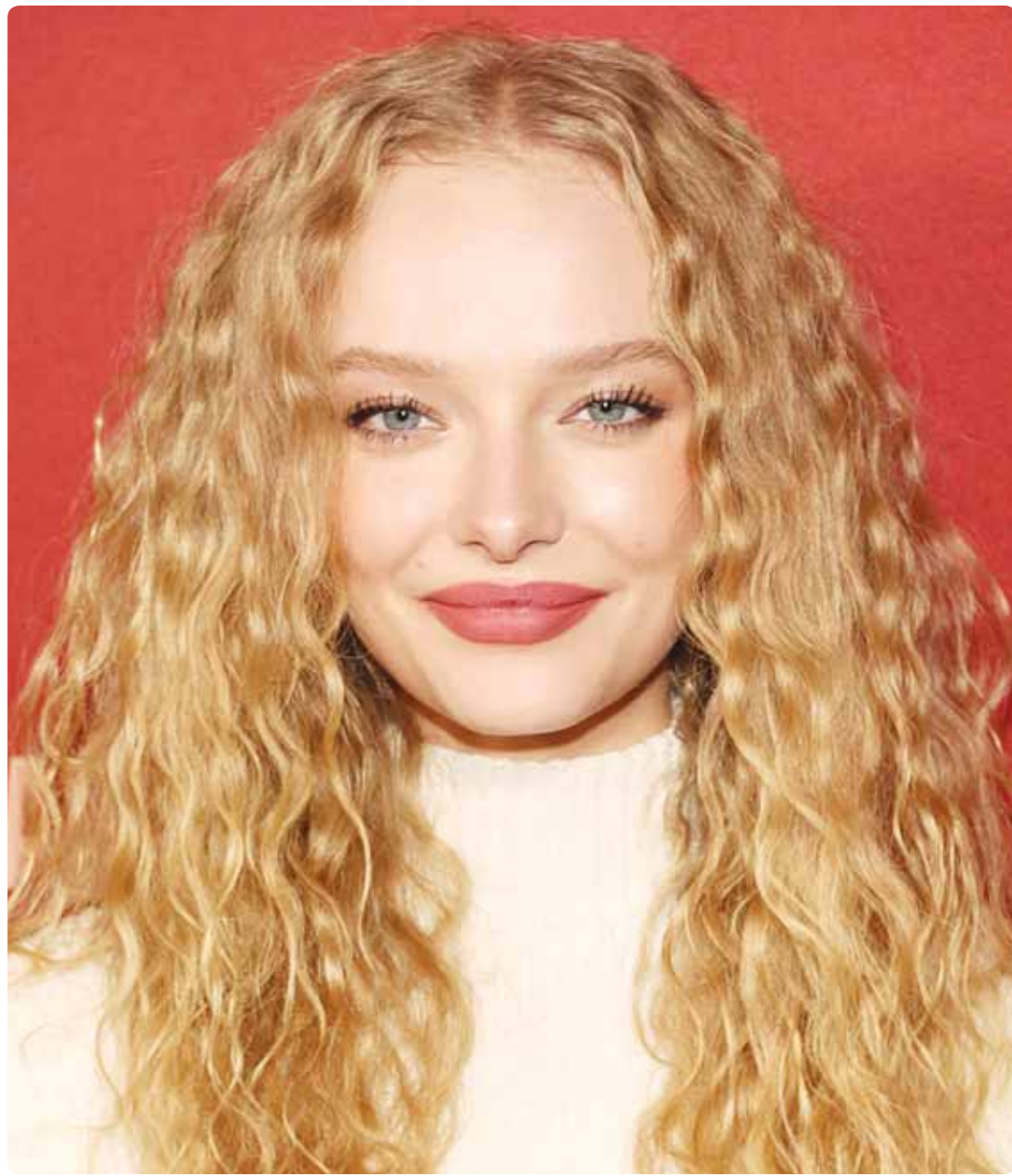
الممثلة الأميركية أميا ميلر خلال حضورها عرض فيلم "امسك أنفاسك" في لوس أنجلوس

يقراً للجميع ما يدور في النفوس، ويحل للجميع تردى الأوضاع الاقتصادية والمالية، لكن سمو رئيس مجلس الوزراء الشيخ أحمد عبداللّه اختار الصمت، وترك لنا ضرب الودع، وقراءة الطالع. مفكرتي ممتلئة بالارهاق والإحباط ومعياًة "ما فيش فائدة"، لكنني أتمنى قراءة مفكرة الشيخ أحمد عبداللّه... فهل يسمح لنا سموه؟