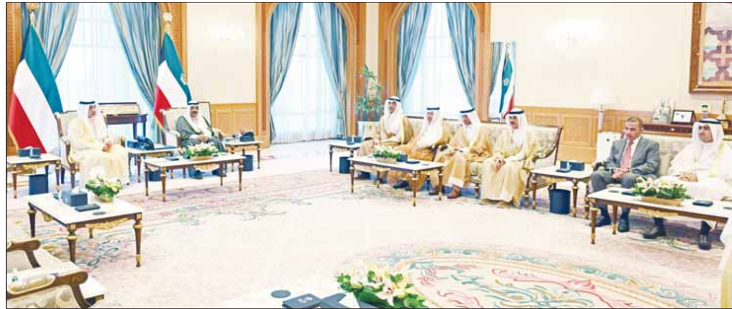
سمو أمير البلاد الشيخ مشعل الأحمد لدم استقبله النائب الأول الوزير الشيخ فهد اليوسف بحضور كبار المسؤولين في الدولة

نستذكر بالكثير من الفخر بطولات القوات المسلحة المصرية وما قدمته من شهداء أبرار