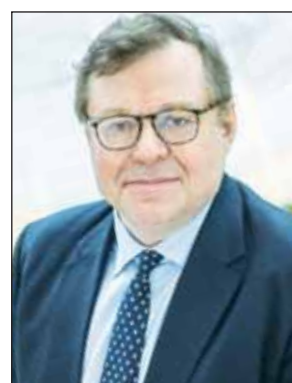
جان بول سيريفيس

وأضاف العصيمي، "بمناسبة أسبوع المستثمر العالمي، يسرنا أن نعلن عن إطلاق مبادرة "الجرس" لتعزيز الثقافة المالية بنسختها الأولى. وتتضمن هذه المبادرة سلسلة من الدورات التدريبية، وورش العمل، والمحاضرات التوعوية، والجلسات الحوارية، التي ستعقد بالتعاون مع نخبة من الخبراء في الأسواق المالية والقطاع المالي. وتعتزم البورصة إطلاق النسخة المحدثّة والمطورة من بوابة البورصة الإلكترونية المعنية بالتعليم، أكاديمية بورصة الكويت أون لاين، والتي تهدف إلى تعزيز المعرفة بسوق المال للمستثمرين الجدد والمحترفين، بالإضافة إلى نشر المحتوى على كافة قنواتها للتواصل. كما سيعمل شركاء بورصة الكويت في هذه المبادرة على إثراء محتوى الأكاديمية من