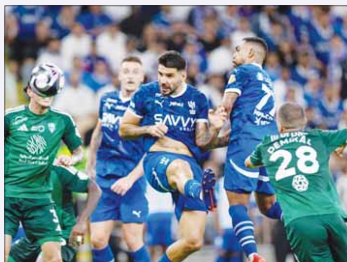
الإثارة حاضرة في لقاء الهلال والأهلي

العربية عند سبع نقاط في المركز 11. وفي مواجهة ثلاثة، تغلب التعاون على الفتح بهدفين دون رد.