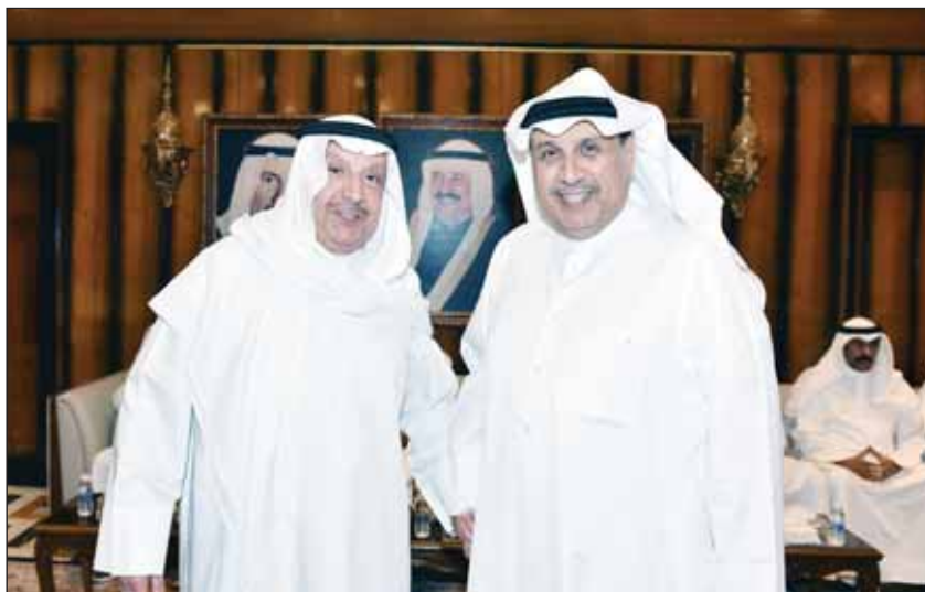
... وبالشيخ مشعل الجراح

■ مقفماً بالمحبة والأخوة، وعامراً بالطيب والترحيب، كان اللقاء الأول بعد انقضاء عطلة الصيف، الذي احتضنه ديوان الشيخ حمد جابر العلي مساء الثلاثاء في منطقة الشامية، إذ جمع حشداً من الأهل والأصدقاء من أبناء المنطقة وعموم أهل الكويت. "يا هلا ومسهلاً... حياكم في ديوانكم، بعد زمان"، بهذه العبارات وإطلالته المشرقة، رحب الشيخ حمد بضيوف الديوان، الذين بادلوه تعابير الود والشوق إلى اللقاء المتجدد، مُجسدين قيم الأخوة والأعراف الأصيلة التي اعتادها الكويتيون جيلاً بعد جيل. وإلى جانب عدد من الشيوخ والشخصيات الرسمية، حضر ديوان "فلتاء المحبة" عدد من الوجهاء، وكثير من الأصدقاء وأهل المنطقة، الذين تعوّدوا حضور هذا اللقاء الأسبوعي، حتى بات موعداً ثابتاً للتواصل الاجتماعي وتوطيد غرى المودة وترسيخ العلاقات الأخوية. وبعد الأحاديث الودية وتبادل المشاعر الأخوية، تناقش الحضور في الشؤون والقضايا المجتمعية العامة، وتبادلوا حولها الآراء، في أجواء حوارية بناءة، تدعم استمرار التواصل والتعاطف على هدف أسمى، هو... حب الكويت.