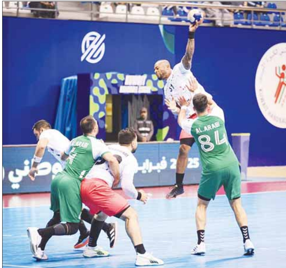
كأس اليد بين الأبيض والأخضر

المباراة النهائية تكسب ولا تلعب، مؤكداً أن المطلوب في نهائي الكأس، اللعب على المضمون والمحافظة على التركيز منذ الدقيقة الأولى ولغاية صافرة النهائية. وتابع، "نطمح لتحقيق اللقب والظهور بصورة تليق بسمعة كرة اليد الكويتية".