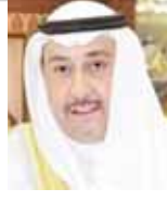
الشيخ فيصل الحمود المالك الصباح