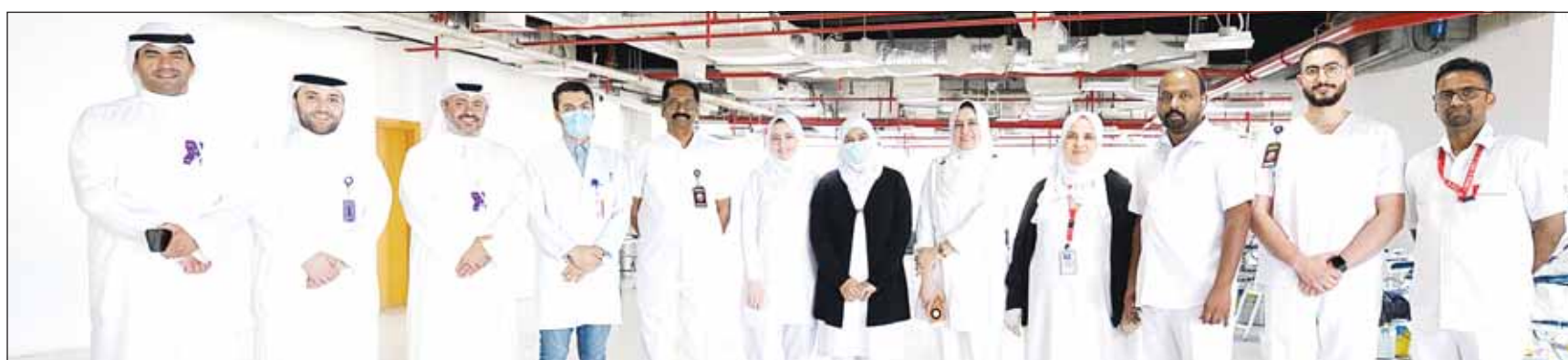
مسؤولو "وربة" وبنك الدم في لحظة جماعية

من الفعاليات الإنسانية والخيرية ومنها حملات التبرع بالدم، حيث قام قطاع التسويق والاتصال الموسمي بتوجيه رسائل للموظفين للمشاركة في هذه الحملة، وساهمت هذه الرسائل بشكل كبير في تعزيز وعي الموظفين حول ثقافة التبرع بالدم وترسيخ مبدأ الشراكة المجتمعية للبنك وتعاونه مع المؤسسات الوطنية ومن ضمنها بنك الدم المركزي وجهوده في إدامة توفير وحدات الدم لتكون جاهزة لمن يستحقها من المرضى المحتاجين.