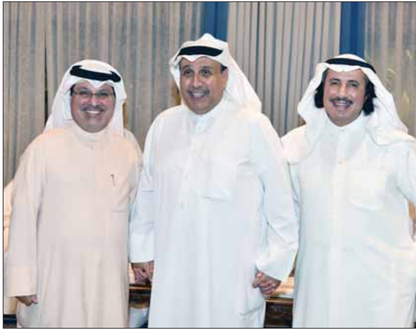
الشيخ حمد متوسطاً الشيخ عزام الصباح وسفير البحرين صلاح المالكي