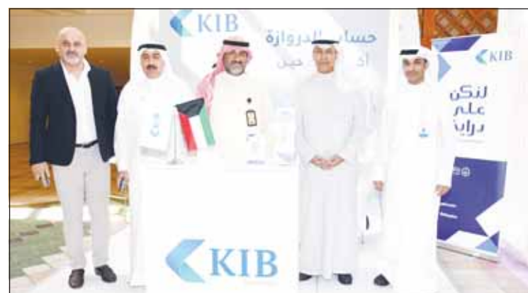
جناح البنك في أمانة مجلس الوزراء

بشكل مباشر مع شريحة واسعة من أفراد المجتمع، وتقديم رؤية واضحة المعالم حول الأدوات المصرفية الأكثر كفاءة وأماناً والطرق الأمثل لاستخدام البطاقات المصرفية وكيفية حماية حساباتهم."