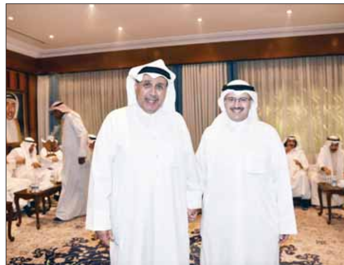
الشيخ فراس المالک والشيخ حمد