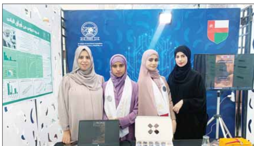
مشاركة طالبات سلطنة عمان

وأشارت إلى أن مبرة السعد، بقيادة الشبيخة فادية السعد، واصلت العمل بمتابعة وإصرار خلال ربع قرن لمواجهة التحديات، معتمدة على فريق متميز وإرادة قوية، مؤكدة أن تجديد الشراكة بين المبرة