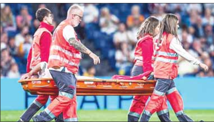
الرباط الصليبي يهنيه موسم كارفاخال

■ أعلن داني كارفاخال، نجم وقائد ريال مدريد، إصابته بقطع في الرباط الصليبي للركبة، خلال الانتصار (0-2) على فياريال، أول من أمس ضمن منافسات الجولة التاسعة من الليغا، على ملعب "سانتياغو برنابيو".