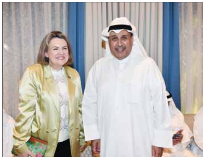
الشيخ حمد مرحباً بالسفيرة الأسترالية ميليسيا كيليم