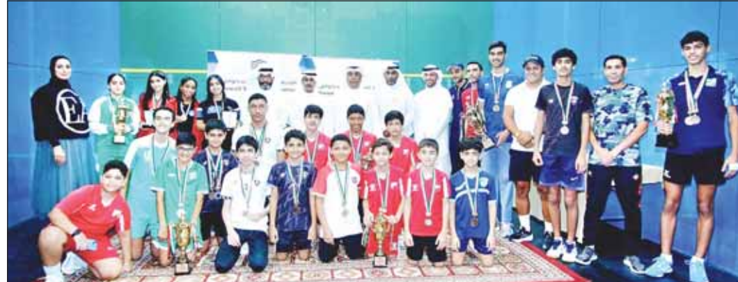
توزيع الفائزين في ختام بطولة السكواش