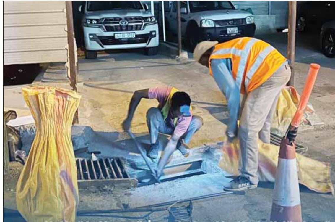
تنظيف منهول في إحدى المناطق