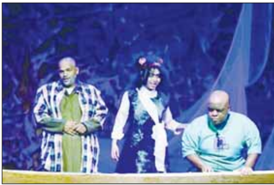
مشهد من العروض المشاركة