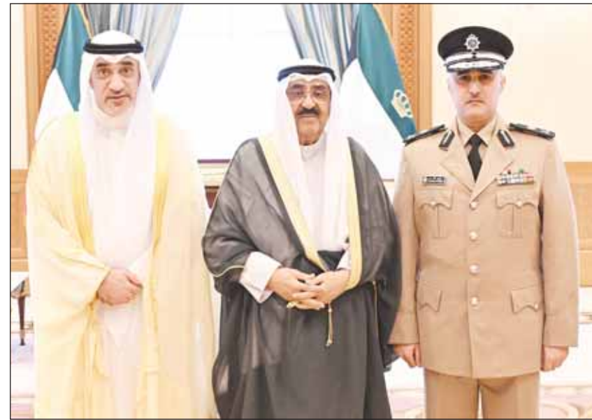
سمو أمير البلاد الشيخ مشعل الأحمد يتوسط الشيخ فهد اليوسف واللواء حقوقيه د. فيصل المكراد

الكثير من الفخر البطولات التي سطرها القوات المسلحة المصرية واستبسالها وما قدمته من شهداء أبرار لتحرير الأراضي المصرية، معرباً سموه في الوقت ذاته عن الاعتزاز الكبير بامتزاج الدماء الكويتية والمصرية معاً خلال هذه الملحمة الخالدة التي جسدت عمق الروابط الأخوية الوطيدة بين دولة الكويت وجمهورية مصر العربية الشقيقة، متمنياً سموه له موفور الصحة والعافية ولجمهورية مصر العربية الشقيقة وشعبها الكريم كل التقدم والازدهار.