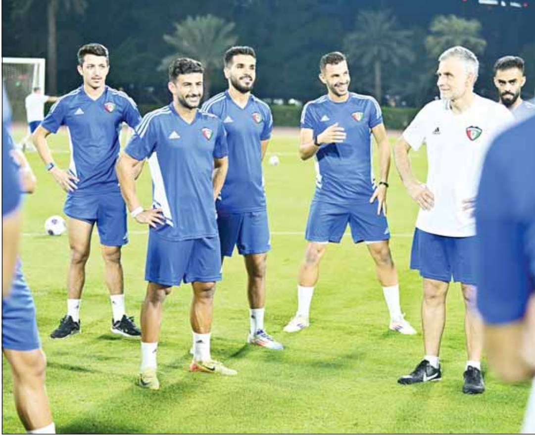
الجهاز الفني يوجه لاعبي الأزرق في المران الأخير

لقت سيدات أرواوا ريد دايوندر الياباني فريق أوديشا الهندي درساً قاسياً وفزن عليهن بنتيجة 0-17 أمس، ضمن الجولة الأولى من منافسات المجموعة الثالثة لدوري أبطال آسيا للسيدات. تقصت ميكي إيتو دور البطولة بتسجيلها أربعة أهداف (سوبر هاتريك) كما أحرزت يوزومو شيوكوشي ثلاثة أهداف (هاتريك) وتكلفت مي شيمادا بتسجيل هدفين للفريق الياباني. وجاءت باقي الأهداف عن طريق يو ايندو واينا تاكاتسوكاي وساتوكو فوجيساكي ويتأهل إلى دور الثمانية صاحبيا المركزين الأول والثاني في كل مجموعة.