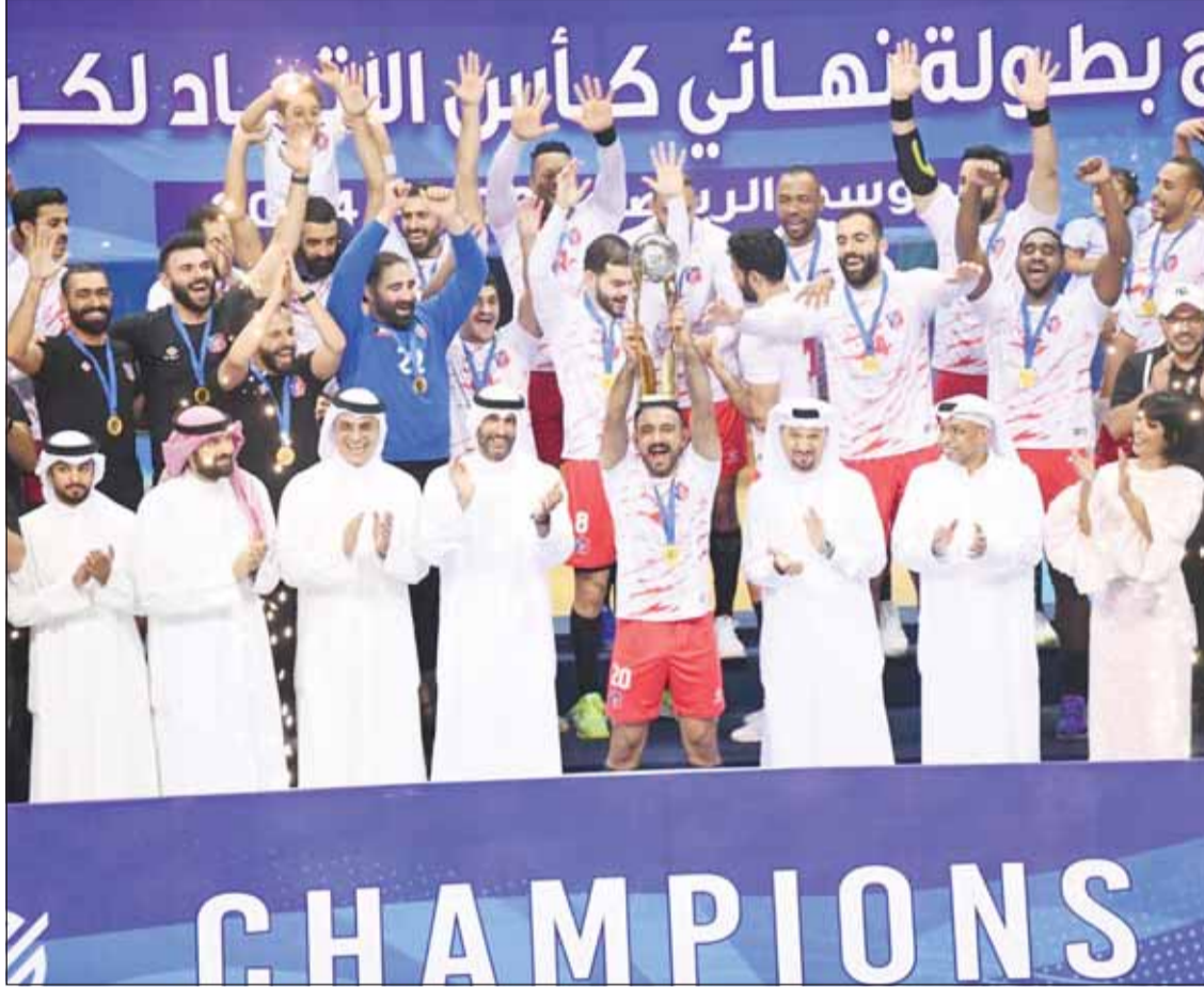
"يد العميد" يحقق الكأس للمرة الـ14 في تاريخه

من جانبه، تقدم أمين سر اتحاد اليد الكويتي قائد العدوان، بالشكر الجزيل للنادية المشاركة في بطولة الكأس بنسخته 56 مشيداً بذات الوقت بالمستوى الفني الجيد الذي قدمته الفرق ما يؤكد، قوة بطولة الدوري التي تنطلق غداً. وهذا العدوان نادي الكويت على تحقيقه لقب الكأس والعربي