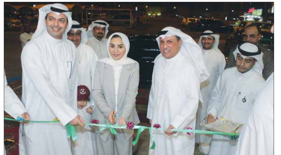
الوزير د. أمثال الحويلة تفتتح المنفذ التسويقي لاتحاد المزارعين بمنطقة فهد الأحمد

بمحافظة الأمدي التي تأتي ضمن الجهود الرامية لتوسيع أسواق المنتجات الزراعية المحلية. وأشادت الحويلة بدور المزارعين في دعم الأمن الغذائي من خلال جودة المنتجات المحلية، معربة عن تقديرها للجهود المبذولة لتعزيز المحصول الزراعي الكويتي. وأكدت التزام الوزارة بدعم كل ما يعود بالنفع على المواطنين ويعزز من قيمة المنتجات المحلية.