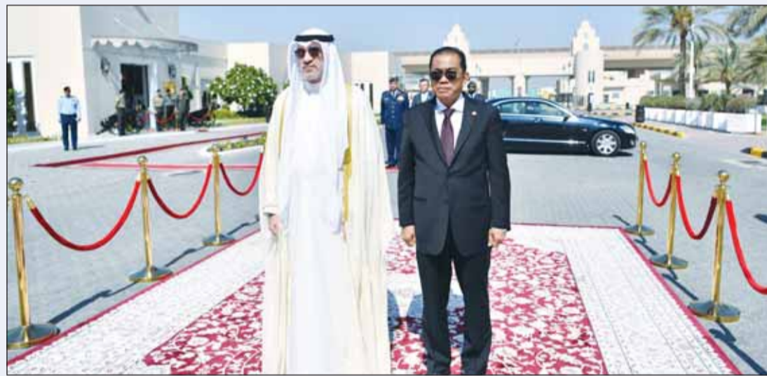
النائب الأول الشيخ فهد اليوسف مستقبلاً وزير دفاع مملكة ماليزيا

وأكد الشيخ فهد اليوسف عمق علاقات الصداقة والتعاون بين الكويت وماليزيا وحرص الجانبين على تطويرها بما يخدم المصالح المشتركة خصوصاً في المجالات العسكرية. من جانبه أعرب الوزير بن نور الدين عن سعادته بزيارة الكويت وأشاد بالعلاقات الوثيقة التي تجمع البلدين، مؤكداً رغبة بلاده في تعزيز الشراكة العسكرية بما يحقق الأمن والاستقرار لكلا الطرفين.