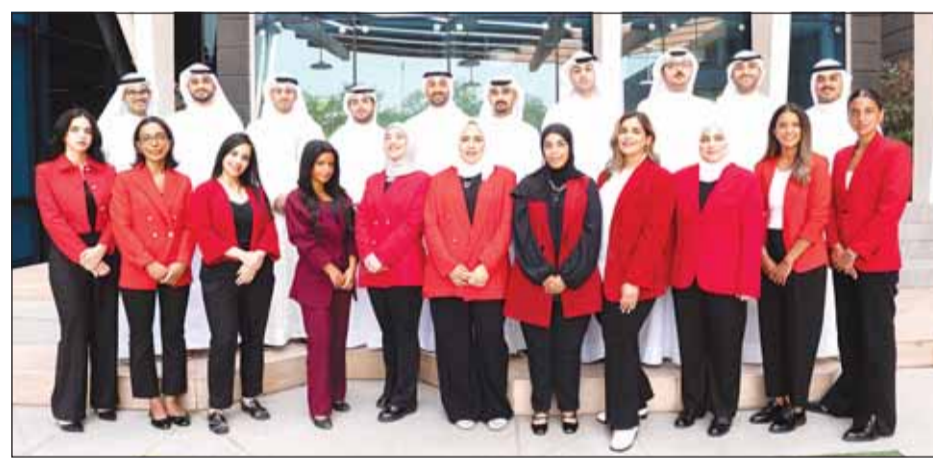
صورة جماعية للمشاركين في برنامج أجيال

الشخصية واختبار المهارات العامة، لينخرط من وقع عليهم الاختيار في رحلة تعليمية شاملة مدتها ستة أشهر بالتعاون مع إحدى الجامعات المحلية الكبرى.