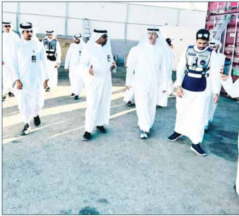
جانب من جولة وزير التجارة والصناعة خليفة العجيل في منطقة أمفرة الصناعية

■ قام وزير التجارة والصناعة خليفة العجيل برفقة فرق التفتيش بوزارة التجارة والهيئة العامة للصناعة بجولة تفقدية لمصانع الزيوت في منطقة أمفرة الصناعية، للاطلاع على سير العمل فيها. وأثناء الجولة تم سحب عدد من عينات خاصة بمنتجات المصانع لفحصها في مختبرات هيئة الصناعة، للتأكد من مدى مطابقتها للمواصفات ومعايير التصنيع.