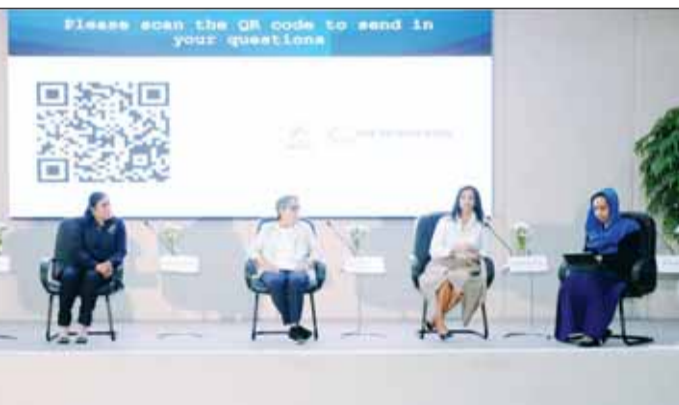
المتحدثات خلال الحلقة النقاشية

الشلفان: المرأة لا تزال تواجه تحديات في طريقها رغم ما حقته من حضور سياسي الرقم: لم أشهد أي تمييز خلال عملي لكن التحديات ظهرت عند المنافسة على المناصب القيادية