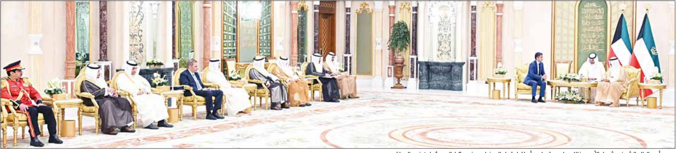
سمو أمير البلاد الشيخ مشعل الأحمد خلال مراسم تسلمه أوراق اعتماد السفراء بحضور كبار المسؤولين في الدولة