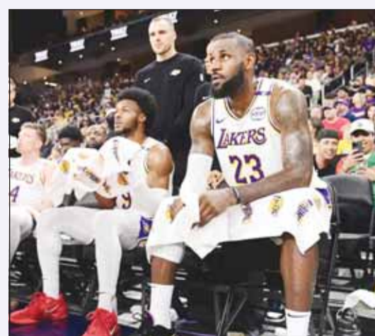
ليبرون وابنه بروني خلال المباراة

حقق فريق السلة الأول بنادي القادسية، فوزه الرابع على التوالي في البطولة العربية الـ36 للنادية لكرة السلة، والمقامة حالياً في مدينة الإسكندرية، بفوزه أول من أمس على الغرافة القطري بنتيجة 92-80 بالمباراة التي أقيمت على صالة برج العرب. وبهذا الانتصار رفع "الأصفر" رصيده إلى ثمانية نقاط بصدارة المجموعة الثانية. واستطاع لاعبو "إبناء حولي" تسديد المباراة منذ بدايتها أمام الغرافة بفضل خبرة نجوم "الأصفر" وحرصهم على مواصلة التعلق في البطولة بروصمهم العالية. وبدوره، خسر ممثل السلة الكويتية الثاني في البطولة فريق كاظمة أمام العربي القطري 56-76 ضمن منافسات المجموعة الأولى، وهي الفسارة الثالثة لـ "البرتقالي" بعد أن خسر أمام الاتحاد السكندري وسموحة وأصبح رصيده خمس نقاط، وتبقى فرص كاظمة بالتأهل للدور ربع النهائية قائمة إذا ما تغلب على نظيره الشارقة الإماراتي في المباراة التي جمعتهم مساء أمس. وتخلد فرق البطولة للراحة اليوم، على أن ينطلق غداً الدور ربع النهائي للبطولة، ويتبعه نصف النهائي مساء الخميس، فيما تقام المباراة النهائية لـ "السلة العربية" مساء السبت المقبل.