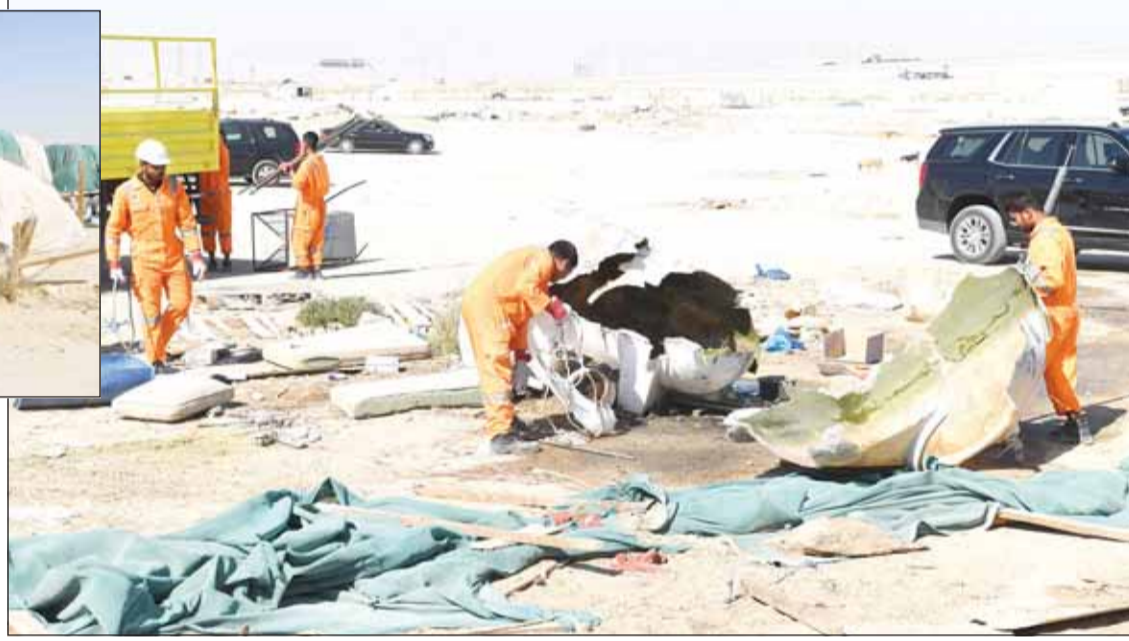
جهود ضخمة يبذلها العمال لإزالة ركام المخلفات والتجاوزات

بالعنوان مع مختلف وزارات ومؤسسات الدولة المعنية وبدأنا بأول منطقة على طريق الوفرة (306) التي تعتبر سوقاً مخالفة، لافتاً إلى أن الحملة في المنطقة الجنوبية مستمرة لحين القضاء على ظاهرة التعديلات في هذه المناطق التي ستزال وفقاً للقانون (105) لسنة 1980. وأوضح أن مدة الحملة مبدئياً وضع لها إطار زمني بمدة 90 يوماً وعلى المخالفين المبادرة لإزالة تعديلاتهم بشكل فوري.