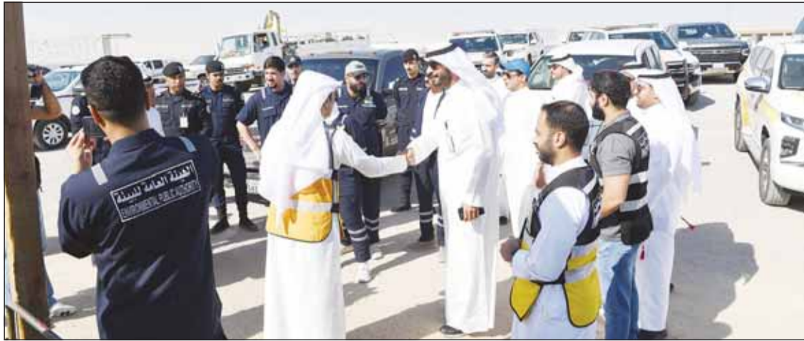
تعاون وتنسيق بين البلدية و"الداخلية" وهيئة البيئة وغيرها من مؤسسات الدولة خلال الحملة