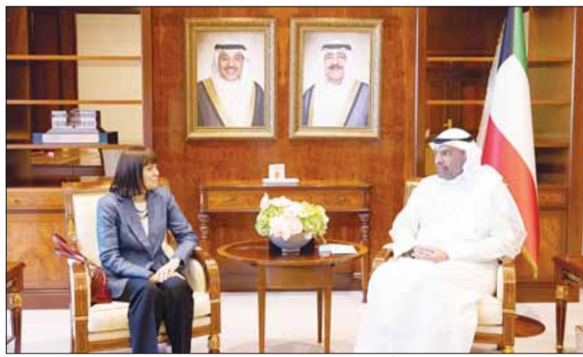
وزير الخارجية عبدالله الجيحا مستقبلاً السفيرة الأميركية كارين ساساهارا