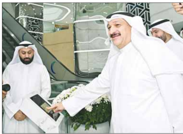
وزير الصحة وخلال الافتتاح ويبدو فيه الصورة حمد المرزوق وخالد الشمالان