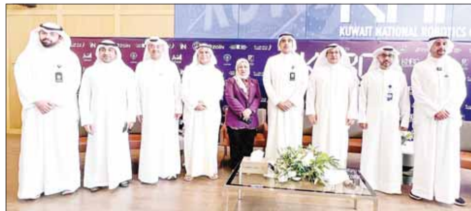
صورة جماعية للفريق المنظم للبطولة

بالتكليف ناصر الشيخ في كلمته أن مشاركة الهيئة في تنظيم "بطولة الكويت الوطنية للروبوت" تأتي تجسيدا لروية الهيئة وتطلعها لمستقبل شباب هذا الوطن، وحرصاً منها على تحقيق أهداف الدولة الخاصة بتنمية الاقتصاد المعرفي وتعزيز دوره في الاقتصاد الوطني.