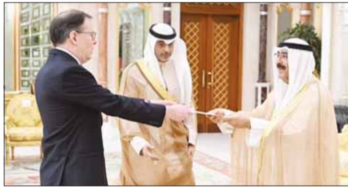
... وسفير البرازيل رودريغو دي أراوجو جابش