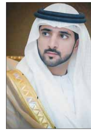
الشيخ حمدان بن محمد

التقى وزير الخارجية عبدالله الجيحا امس، سفيرة الولايات المتحدة الأميركية لدى دولة الكويت كارين هايديوك ساساهارا، وذلك في مكتبه بديوان عام الوزارة. وتم خلال اللقاء استعراض العلاقات الثنائية الوثيقة والتعاون الاستراتيجي القائم بين دولة الكويت والولايات المتحدة الأميركية الصديقة وبحث أطر تعزيزها وتطويرها في مختلف المجالات ومناقشة المستجدات الراهنة على السامعين الاقليمية والدولية.