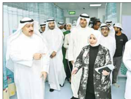
جولة في أقسام المستشفى

المطوع: خطة لتوسيع انتشار مستشفيات السلام وخدماتها