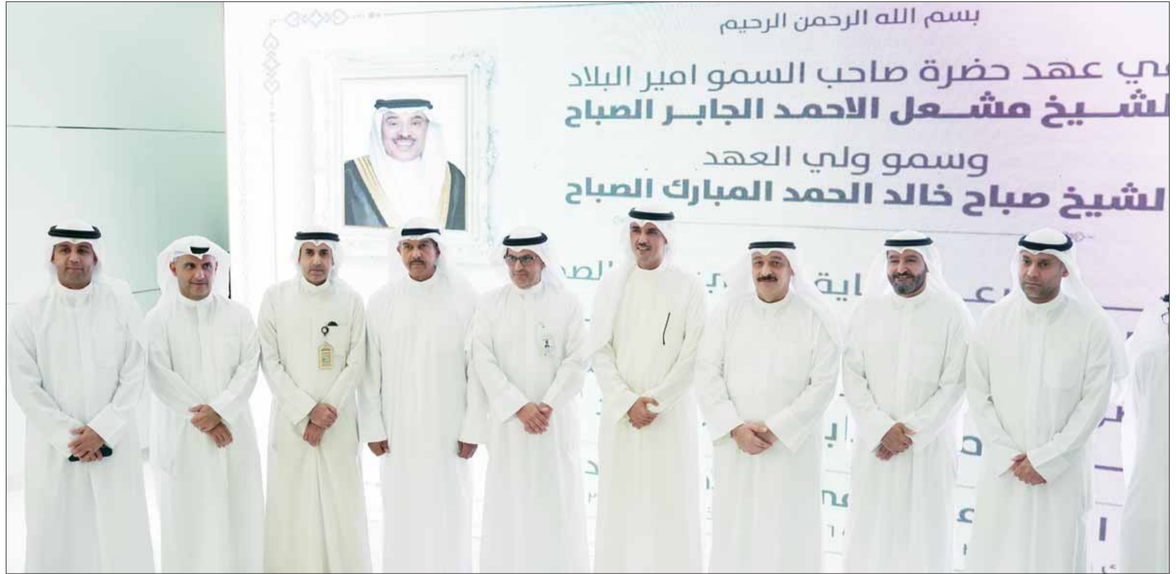
صورة جماعية للمسؤولين المشاركين في الافتتاح