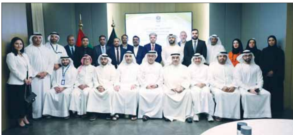
السفير النيادي مع ممثلي الشركات الإماراتية

وأكد أن القطاع الخاص في البلدين على تواصل