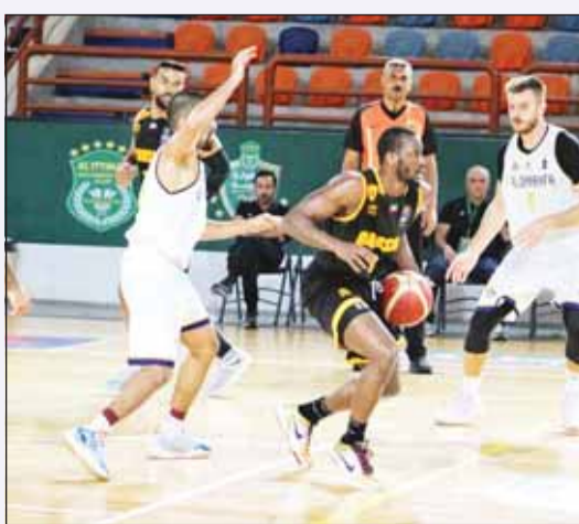
سلة القادسية تألقت في "العربية"

■ كان ليبرون جيمس وابنه بروني بطلين للحظة تاريخية في الدوري الأميركي للمحترفين لكرة السلة عندما شارك سويا لأول مرة في مباراة مع فريق لوس أنجلوس ليكرز ضد فينيكس صنز أول من أمس. وكانت هذه هي المرة الأولى التي يلعب فيها أب وابنه بفريق واحد في مباراة في الدوري الأميركي للمحترفين. وشارك ليبرون لأول مرة في مباراة إعدادية للموسم حيث خسر فريقه بنتيجة 114-118 بينما شارك ابنه بروني في مباراة أخرى مع ليكرز، يوم الجمعة. ويبلغ بروني من العمر "20 عاماً" بينما يستعد والده ليبرون لموسمه الثاني والعشرين في الدوري الأميركي للمحترفين. وسيحتفل ليبرون بعيد ميلاده الأربعين في ديسمبر، وسجل لفريق ليكرز 19 نقطة بينما أضع نجله محاولة وحيدة.