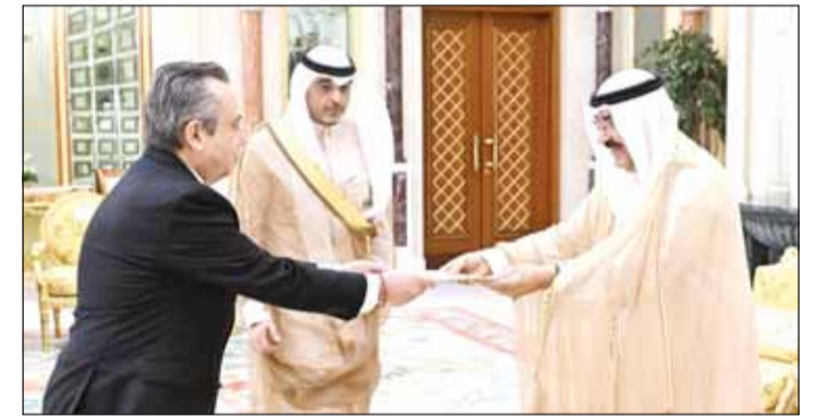
سمو الأمير الشيخ مشعل الأحمد يتسلم أوراق اعتماد سفير المكسيك إدواردو بينيا هالر