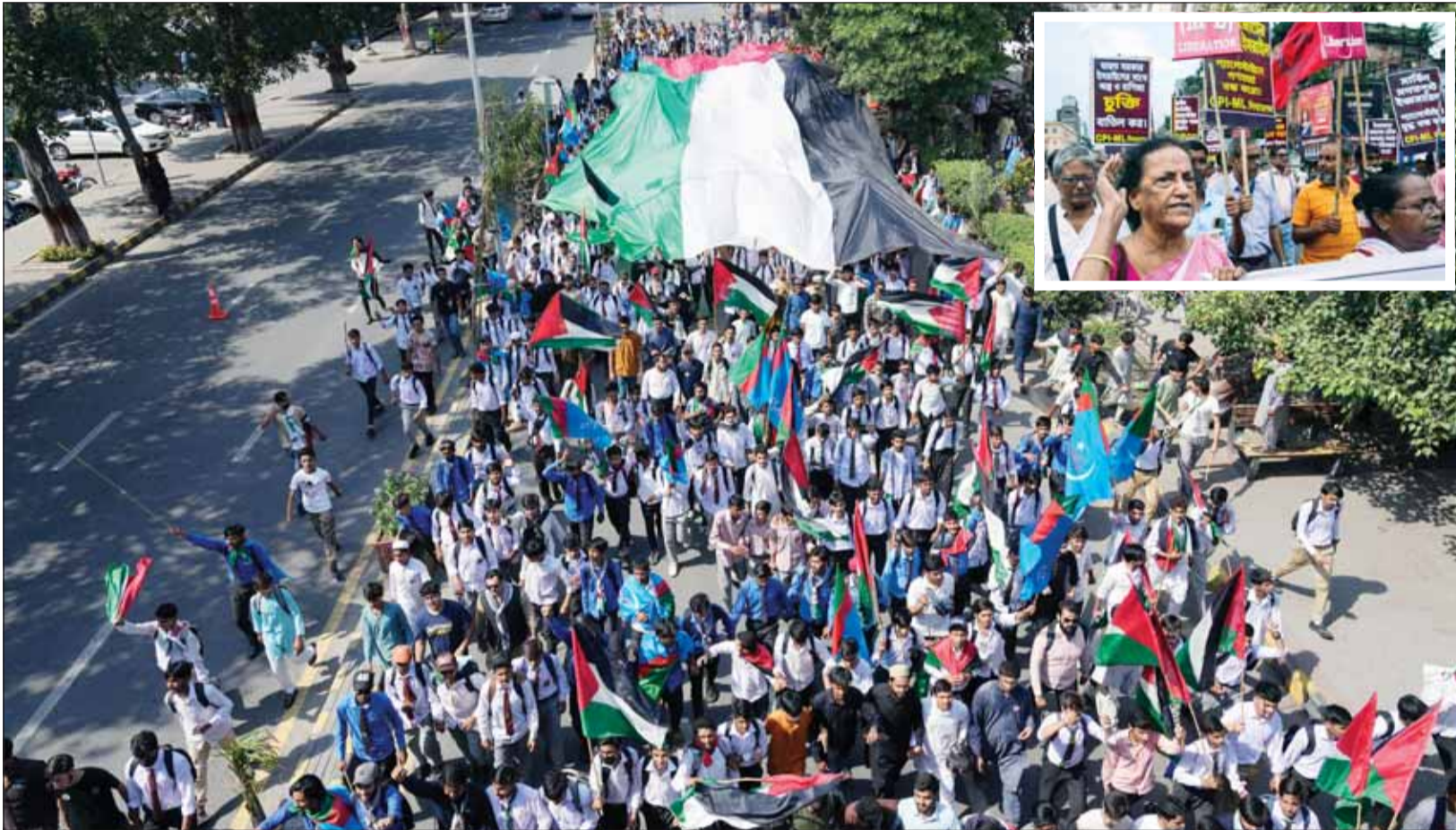
آلاف الباكستانيين خرجوا في لاهور لتدبير بحرب الإبادة في غزة ولبنان وهم الإطارات محتجون شهود في كوكاتا خرجوا تضامنا مع غزة ولبنان في تظاهرات حاشدة أمس (أب)

غزة، عواصم - وكالات، فيما تدخل حرب الإبادة على غزة عامها الثاني اليوم، وسط تواصل قوافل الشهداء، كان يوم أمس الأعتف والأكثر ضراوة في مختلف جبهات الحرب، وجاء إحياء الذكرى الأولى لاندلاع معركة "طوفان الأقصى" مضجبا بالدماء، وسط تصلب المواقف وإثبات المقاومة أنها بألف خير وتأكيدها الإصرار على تحقيق النصر في النهاية.