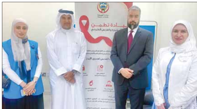
جانب من افتتاح عيادة "تظمن"

وأماكن وألية إجراء الفحص مؤكدة أن الفحوصات تتم بسرية وطوعية كما أنها معتمدة من الهيئات الطبية العالمية. يذكر أن وزارة الصحة تقدم تلك الخدمة في عيادة متخصصة بمستشفى الجهراء 2 "مستشفى الأمراض السارية" وعبارة أخرى في إدارة الصحة العامة بمنطقة الصباح الطبية التخصصية.