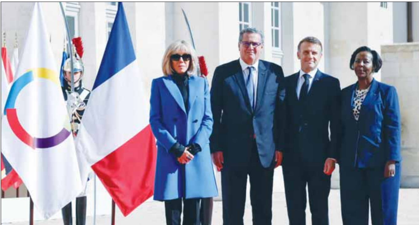
الرئيس الفرنسي إيمانويل ماكرون والسيدة بريجيت ماكرون يستقبلان رئيس الحكومة المغربية عزيز أخنوش في القمة التاسعة عشرة للفرانكوفونية في باريس (مواقع)

وأكد وزير الخارجية الإسباني خوسيه مانويل ألباريس أمام لجنة الشؤون الخارجية بمجلس النواب، أن الموقف الإسباني من قضية الصحراء ليس معزولاً عن سياق الدينامية التي يشهدها هذا الملف وتوالي الاعترافات بسيادة المغرب على أراضيه الجنوبية، مشيراً في هذا الإطار إلى موقف فرنسا والندماكر اللتين التحقتا مؤخرًا بكونية الداعمين للوحدة الترابية للمملكة، التي تضم قوى دولية كبرى أبرزها الولايات المتحدة الأميركية، وشدت الديبلوماسية الإسباني على تشبّث بلاده بهذا الموقف الداعم لسيادة المغرب على صحرائه، مذكراً في هذا الإطار بالرسالة التي وجهها رئيس الحكومة في مدريد إلى الملك محمد السادس في مارس من العام 2022، والتي أكد من خلالها أن بلاده تعتبر مخطط الحكم الذاتي الذي تقدمت به المملكة سنة 2007 بمقابلة الأساس الأكثر جدية واقعية ومصداقية لتسوية النزاع.