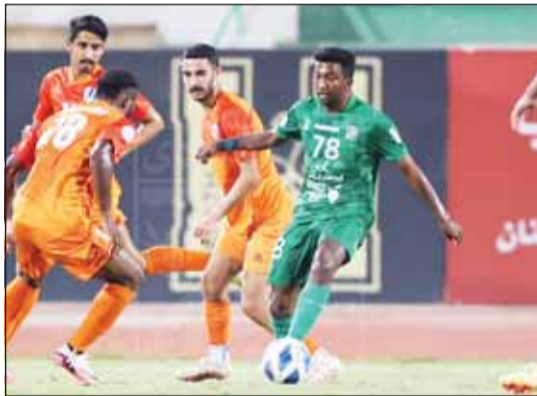
العربي تعادل مع كاظمة سلباً

يلتقي القادسية مع الشباب في مباراة ودية الساعة السادسة مساءً اليوم على ستاد محمد الحميد، وذلك ضمن استعدادات "الأصفر" لدوري زين الممتاز، حيث تنتظره مواجهة أمام النصر يوم 19 أكتوبر الجاري ضمن الجولة السابعة، فيما يستعد الشباب لانطلاق دوري الدرجة الأولى. ويشارك عن المتصدر الكويت. وتوقفت مسابقة الدوري بسبب فترة التوقف الدولية، حيث يستعد منتخبنا الوطني لمواجهة عمان وفلسطين يومي 10 و15 أكتوبر الجاري ضمن التصفيات الآسيوية المؤهلة إلى نهائيات كأس آسيا 2026.