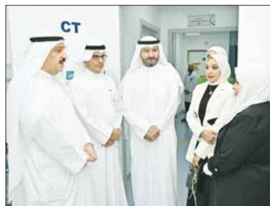
وزير الصحة ود. أيمن المطوع وحمد المرزوق