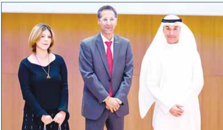
"أجيليتي" تكتمل إحداه الطالبات في برنامج "الكويت تبرمج"

أعلنت أجيليتي، الشركة العالمية المتخصصة في خدمات وابتكارات سلاسل الإمداد وبنيتها التحتية، عن الافتتاح الناجح لرعايتها لبرنامج "الكويت تبرمج 2024" و"أكاديمية X"، حيث دعمت أجيليتي تطوير المهارات البرمجية لأكثر من 1,300 شاب وفتاة في الكويت من خلال رعايتها لبرامج أكاديمية "كود CODED" التي تهدف إلى تطوير مهارات المبرمجين والمبرمجات الشباب في الكويت من خلال التدريب المجاني على أساسيات ولغات وتقنيات البرمجة الحديثة.