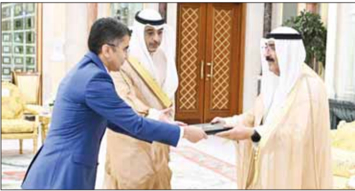
... وسفير أوزبكستان أيوب خان يونسوف

احتفل في قصر بيان أمس، بتسلم سمو أمير البلاد الشيخ مشعل الأحمد أوراق اعتماد كل من السفير سعيدي حسين ماسورو سفيراً لجمهورية تنزانيا الاتحادية، والسفير إدواردو باتريسيو بينيا هالر