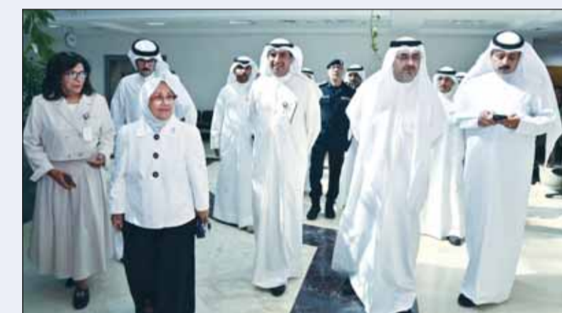
محافظ العاصمة خلال الجولة في "التطبيقي"

شدد محافظ العاصمة الشيخ عبدالله سالم العلي على ضرورة بذل المزيد من العطاء من أجل توفير الكفاءات البشرية لخدمة الوطن والمساهمة في العملية التربوية والتعليمية، والتركيز على مخرجات سوق العمل في التخصصات والمهن المتنوعة التي تساهم في تطوير ورقي عجلة التنمية الاقتصادية الشاملة. جاء ذلك خلال الزيارة التي قام بها أمس إلى هيئة التعليم التطبيقي والتدريب والمعهد العالي للاتصالات والملاحة وكلية العلوم الصحية، وشملت جولة المعرض الطلابي الثالث "من قراارك إلى استقرارك"، بحضور مدير الهيئة د. حسن الفجاف، وعدد من القيادات والكوادر الإدارية والفنية. ونكر المحافظ أن الكويت تحتاج دوماً إلى سواعد أبناءها في سبيل التدريب الأكاديمي والمخرجات المتعددة في المجالات الفنية والمهنية والتربوية، مندداً على الحاجة إلى تطوير مجال التدريب داخل الهيئة، وحصر الاحتياجات التدريبية في سوق العمل، وتحسين فرص توظيف خريجي الهيئة. ودعا إلى الاهتمام بالتعليم الفني والمهني، بما ينعكس إيجاباً على قطاع التدريب في مجال توفير الكوادر الوطنية المؤهلة، مؤكداً أن الكويت تفخر بسواعد أبناءها الشباب المتسلح بالعلم والمعرفة.