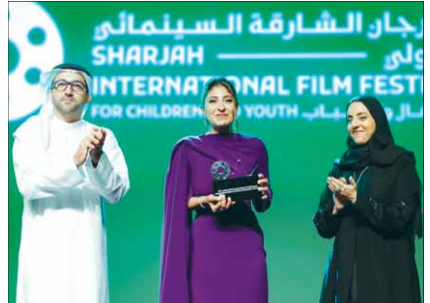
شجون الهاجري مع الشبيخة جواهر القاسمي والشيخ فاهم القاسمي