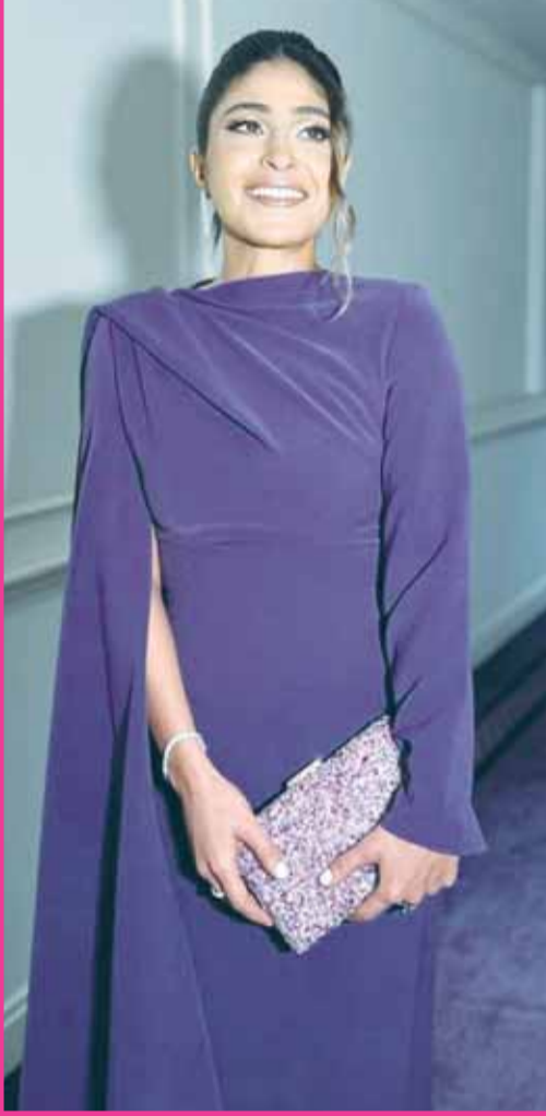
الفنانة شجون الهاجري