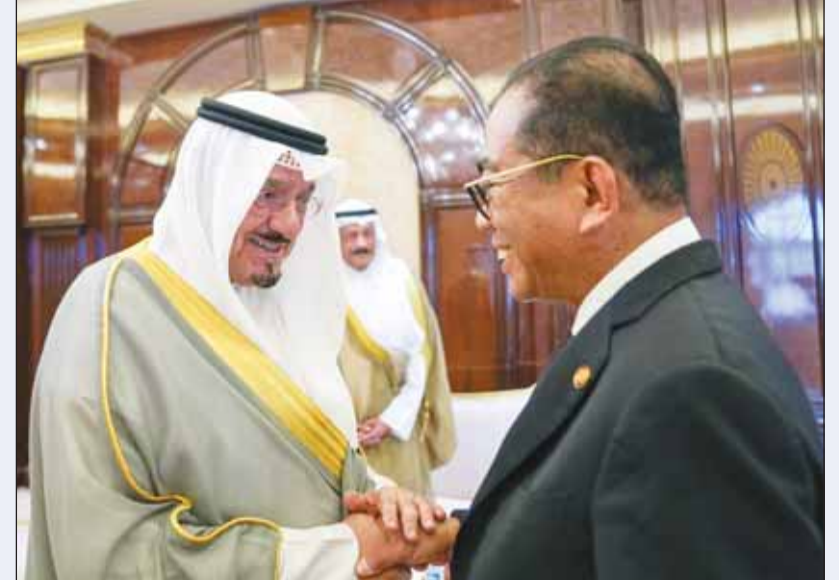
سمو رئيس مجلس الوزراء مستقبلاً وزير دفاع مملكة ماليزيا