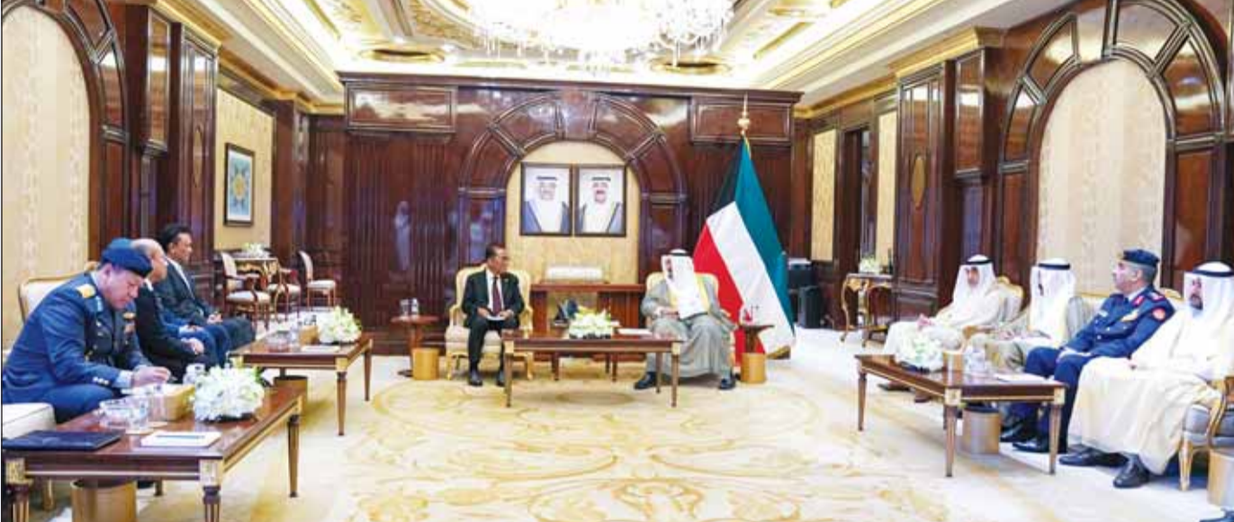
سمو رئيس مجلس الوزراء الشيخ أحمد عبدالله لدم استقبله بحضور النائب الأول الشيخ فهد اليوسف وزير دفاع مملكة ماليزيا والوفد المرافق

الثلاثاء 5 ربيع الآخر 1446 هـ - الموافق 8 أكتوبر (تشرين أول) 2024م (السنة 55) العدد (19681)