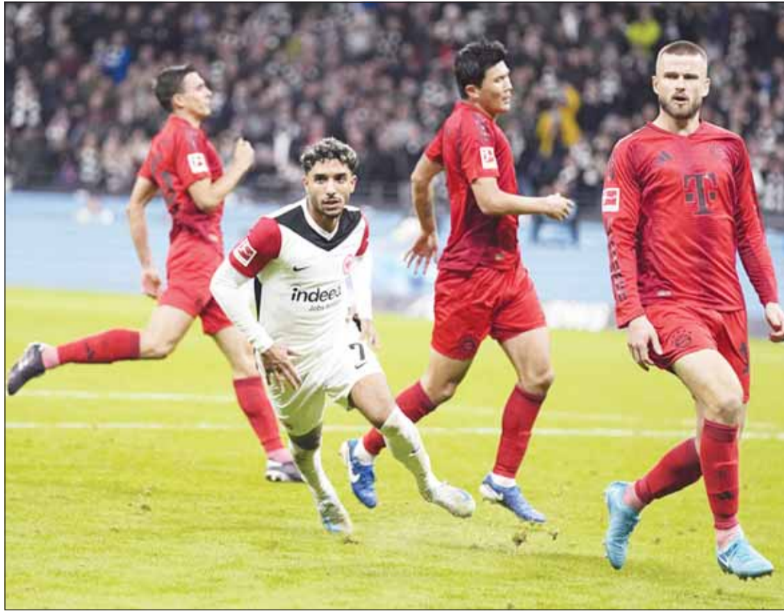
عمر مرموش صال وجال وتائق أمام العملاق البافاري