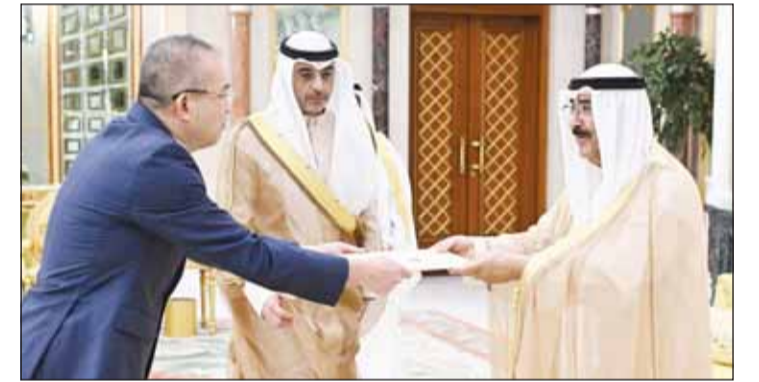
... وسفير فيتنام نغيون دوك ثانغ