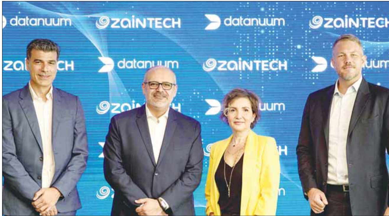
مسؤولو الشركتين عقب توقيع الاتفاقية الاستراتيجية

وتلتزم شركة ZainTECH وشركة DATANUUM معا بدفع عجلة التحول الرقمي، ودعم الشركات في أسواق المنطقة لإطلاق العنان للإمكانيات الكاملة لبيانات عملها بطريقة بسيطة ومتكاملة وفعالة، وهو من شأنه سيسهم في تعزيز علاقات العملاء، والانطلاق إلى مستقبل أكثر ربحية.