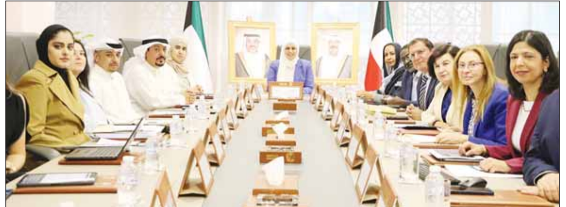
جانب من اللقاء

على إصلاحات تستهدف تعزيز العدالة الاجتماعية وتحقيق التنمية المستدامة. وبيّنت أن الوزارة تعمل وفق استراتيجية شاملة للإصلاحات تركز على تحسين النظام الاجتماعي والاقتصادي بما يضمن تحقيق العدالة والاستقرار على المدى الطويل موضحة أن هذه الاستراتيجية تأتي ضمن الجهود الرامية لتحقيق رؤية الكويت التنموية وتعزيز رفاهية المواطنين والمحافظة على مكتسبات الوطن. وذكر البيان أن الاجتماع تناول مجموعة من القضايا المهمة أبرزها موضوع المساعدات الاجتماعية والإصلاحات الاقتصادية التي تحتاجها الكويت لتحقيق استقرار اجتماعي مستدام. ولفت إلى أن وفد الصندوق قدم خلال الاجتماع 3 توصيات رئيسية للكويت تضمنت التركيز على تنويع مصادر الاقتصاد وتطوير وتحسين بيئة الأعمال وذلك للحفاظ على ثروة الوطن وضمان استخدامها للأجيال القادمة. وأفاد أن هذه التوصيات ستكون خطوات أساسية للحفاظ على استقرار الاقتصاد في مواجهة التحديات المستقبلية.