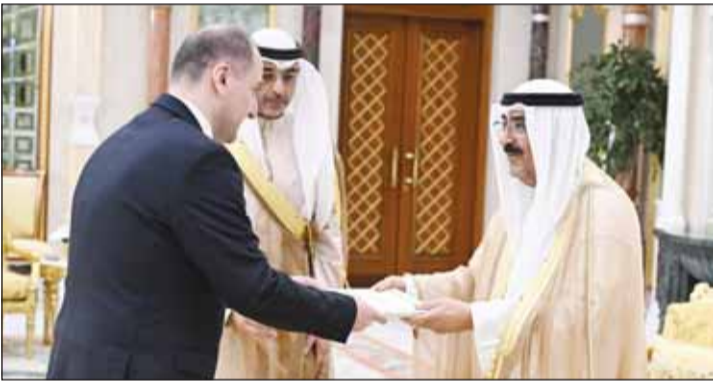
... وسفير جورجيا نوشرفان لوماتايزة