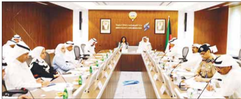
جانب من اجتماع لجنة تحديد أوجه استخدامات المياه المعالجة بحضور الوزيرين بوشهري والمشعان

عقدت لجنة تحديد أوجه استخدامات المياه المعالجة "لثلاثيا وربعا" التي شكلها وزير الكهرباء والماء والطاقة المتجددة د.محمود بوشهري برئاسة مدير معهد الكويت للأبحاث العلمية د.مشعان العتيبي أول اجتماعاتها أمس بحضور الوزير بوشهري ووزيرة الأشغال العامة د.نورة المشعان، وممثلين عن الجهات الحكومية التي تضمها اللجنة. وعلى هامش الاجتماع، قال العتيبي، إن اللجنة تعنى بدراسة الاستخدام الأمثل للمياه المعالجة والاستفادة من جميع الكميات المنتجة من المياه المعالجة بالشكل الأمثل، بحيث لا يكون هناك فائض لا يمكن استغلاله، لافتاً إلى أن اللجنة ستقوم بدراسة أوجه استغلال المياه المعالجة سواء للزراعة أو الزراعات التجميرية واستخدامات أخرى في المناطق السكنية. وأوضح العتيبي أن الوزير حرص خلال تشكيل اللجنة أن تكون ذات طبيعة تنفيذية لما تراه مناسباً، أي أن الأمر يغطى مسألة وضع تصورات وتوصيات، مبيناً اللجنة ستقوم برفع تقاريرها إلى لجنة الخدمات العامة في مجلس الوزراء والمباشرة في تنفيذ الإجراءات الواقعية للاستفادة من المياه المعالجة. وأشار إلى النتائج التي يمكن تحقيقها في حال الاستفادة من المياه المعالجة بالشكل الأمثل، منها تخفيف