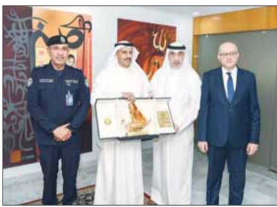
وزير الداخلية خلال حضوره الدورة التدريبية

نظمت أكاديمية (سعد العبدالله) للعلوم الأمنية دورة تدريبية في مجال الذكاء الاصطناعي والجرائم السيبرانية لمنحسبي وزارة الداخلية والمؤسسات الحكومية والتعليمية المختصة برعاية وحضور النائب الأول لرئيس مجلس الوزراء وزير الدفاع وزير الداخلية الشيخ فهد اليوسف ووكيل وزارة الداخلية المساعد لشؤون التعليم والتدريب اللواء فواز الصباح.