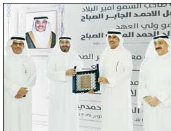
المرزوق مكرماً محافظ الأحمدية، بحضور وزير الصحة والمطوع