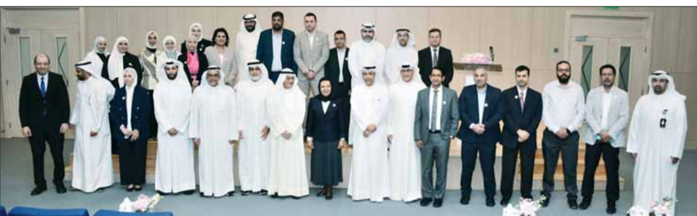
الوزير د. نادر الجلال ود. موضعي الحمود يتوسطان المشاركين في الاحتفال

لهذه الجامعة وإصراره على تنفيذها على أرض الواقع بأقرب وقت وأعلى جودة ممكنة حتى صارت واقعاً ملموساً. كما فصت بالشكر مجلس الوزراء ووزراء التعليم العالي المتعاقبين وجميع مؤسسات الدولة على دعمهم ومساندتهم لهذه الجامعة الفعّلة خلال مراحل إنشائها وعملها، مشيرة إلى أن جامعة عبدالله السالم ممثلة بمجلس إدارتها وأعضاء هيئتها الأكاديمية والإدارية تسعى نحو تحقيق الرسالة السامية لدولة الكويت. من ناحيته، قدم نائب مدير الجامعة للتخطيط والتميز المؤسسي ونائب مدير الجامعة للمعلوماتية والرقمنة د. فواز العنزي عرضاً تناول رؤية الجامعة وخطتها الاستراتيجية. كما عرض العنزي كيفية تصميم برامج الجامعة ومقرراتها والمركزات التي قامت عليها وإنجازاتها منذ تأسيسها علاوة على لوائحها وسياساتها وأنظمتها الإدارية وأنظمتها المتكاملة. وشهد الافتتاح عرض فيلم مرثي عن انطلاق الجامعة وتدشين العام الدراسي الأول فيها واستعدادها لاستقبال أول دفعة دراسية خلال العام الجامعي 2024/2023.