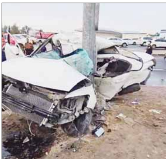
مركبة الضحية وقد شقها عمود الإنارة تصفيان بفعل الاصطدام

شهد طريق الدائري الرابع مقابل منطقة الدوحة حادثاً مروياً مروعا راح ضحيته شخص وأصيب آخر بعد اصطدام مركبتهما في عمود للإنارة. ووفق مصدر أمني فإن غرفة العمليات تلقت بلاغا بوقوع حادث الاصطدام، وعلى الفور سارع إلى موقع البلاغ رجال الأمن الإسعاف والإطفاء وشرعوا بإخراج الشخصين من بين طام المركبة وتبين بأن أحدهما فارق الحياة وجرى نقل الجثة إلى الطب الشرعي ونقل المصاب إلى المستشفى وتسجيل قضية في الحادث. من جهة أخرى، توفي مقيم سوري أثر سقوط رافعة عليه أثناء عمله بمنطقة المطالع، وجرى نقل جثته إلى الطب الشرعي وتسجيل قضية. وبحسب مصدر أمني، إن غرفة عمليات وزارة الداخلية تلقت بلاغا عن إصابة مقيم سوري في سقوط رافعة أثناء عمله بمنطقة المطالع، وعلى الفور توجه إلى موقع البلاغ رجال الأمن والإسعاف وفور وصولهم تبين أنه فارق الحياة وعلى الفور جرى نقل جثته إلى الطب الشرعي وتسجيل قضية.