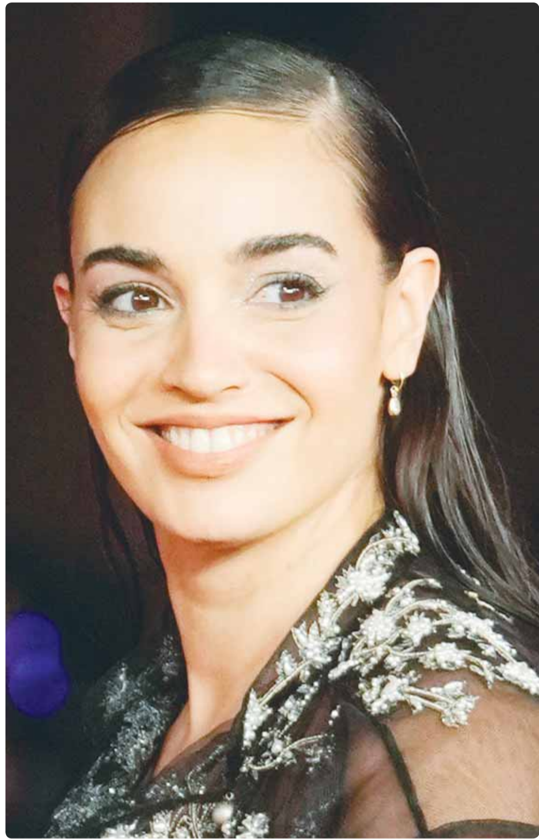
الممثلة السوبرية سهيلة يعقوب خلال حضورها عرض فيلم "فم الشرفة" فم مهرجان روما السينمائي (ب)

أدعو المولى عز وجل أن يفقر للأخ العزيز عبدالله الطويل، ويسكنه الفردوس الأعلى، وأن يلهمنا الصبر والسلوان.