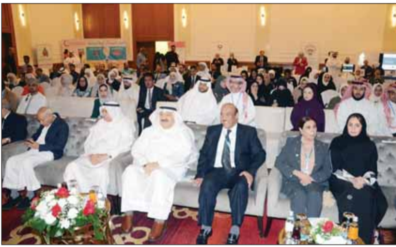
الوزير د. أحمد العوضي ود. خالد الصالح يتقدمان الحضور

العامة من تأثير دوائر صناعة التبغ والتصدي لحملات الترويج لهذه الآفة، لافتاً إلى أن المؤتمر يسلط الضوء على إحدى أخطر الآفات الاجتماعية التي تهدد حياة الملايين حول العالم وهي آفة التبغ والتدخين. من جانبه، شدد رئيس مجلس إدارة جمعية مكافحة التدخين والسرطان د. خالد الصالح - في كلمته - على أهمية العمل الجاد المخلص لحماية مجتمعاتنا وخاصة النشء من صناعات التبغ التي أصبحت تستهدفهم مستغلة نفوذها الذي أضخى مؤثراً بشكل كبير على اقتصاديات الدول النامية. وقال، إن التحديرات تطال السجائر الإلكترونية أيضاً التي تحوي النيكوتين وتعتبر ضارة للصحة مثل منتجات التبغ التقليدية والمتنشرة بشكل واسع وسريع بين جميع فئات المجتمع وخاصة الشباب صغار السن والمرافقين بالإضافة لانتشار التدخين بين النساء.