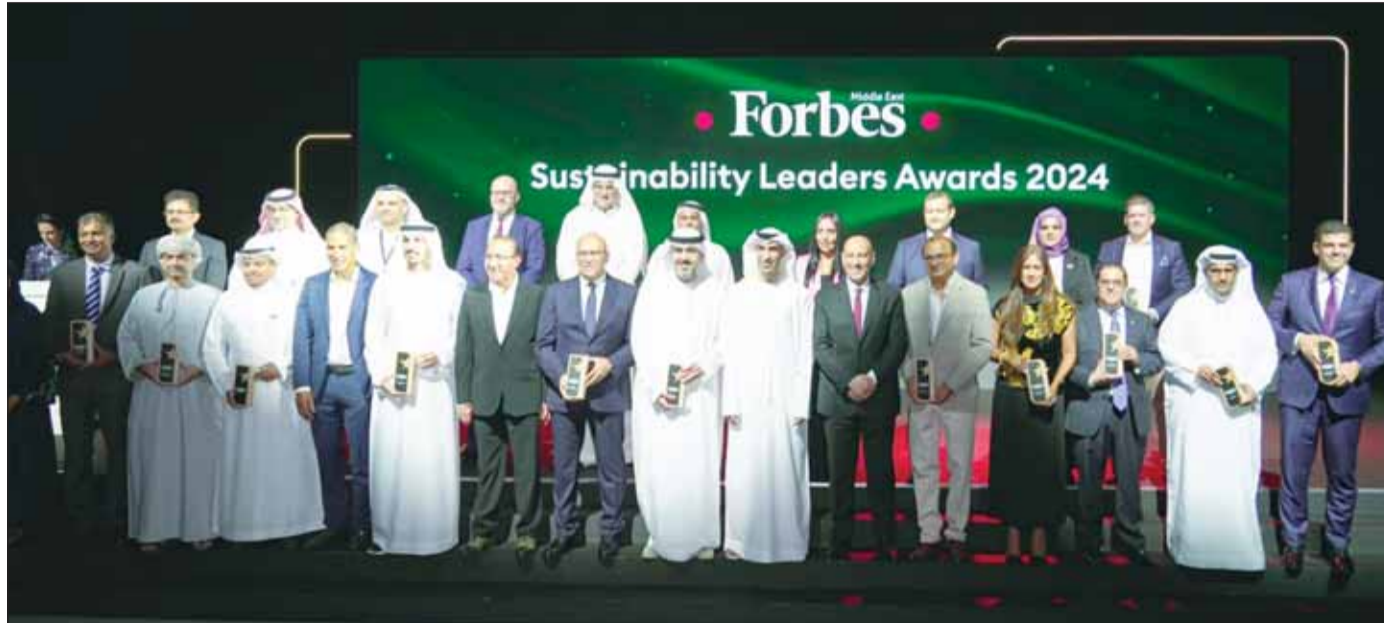
صورة جماعية لقادة الاستدامة في الشرق الأوسط 2024