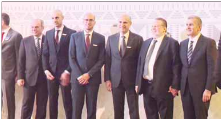
باسل الهارون ومحافظ "المركزي" المصري وقيادات البنوك الكويتية