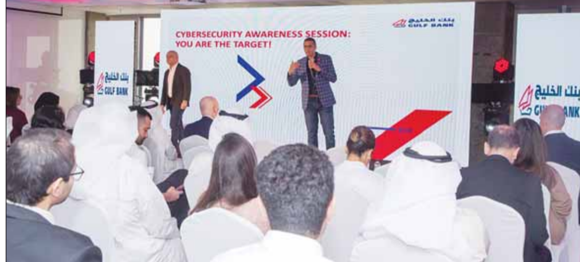
جانب من الندوة

مع الاستثمارات الكبيرة التي ضفها في الحلول التكنولوجية الشاملة في رحلة التحول الرقمي، التي تعد أحد ركائز الاستراتيجية الخمسية. ويتعامل بنك الخليج مع تحدي المخاطر السيبرانية وضمان أمن وسلامة بيانات العملاء ومعاملاتهم باهتمام شديد، من خلال الاستثمار في الموارد البشرية والتطوير المستمر لأنظمة والتقنيات في مجال الأمن المعلوماتي. على صعيد متصل، يقوم بنك الخليج بدور رئيسي، في دعم حملة "لنكن على دراية"، التي يشرف عليها بنك الكويت المركزي بالتعاون مع اتحاد مصارف الكويت، وساهم بدور ملموس في تحقيق أهدافها المنشودة بنشر الثقافة المالية في المجتمع، وزيادة الوعي بدور القطاع المصرفي، وكيفية الاستفادة من الخدمات المتنوعة، التي تقدمها البنوك على الوجه الأمثل لعملائها. ويحرص البنك على توفير كافة مقومات النجاح لحملة "لنكن على دراية"، من خلال نشر المواد التوعوية في كافة الوسائل والقنوات المتاحة، سواء عبر قنوات التواصل الاجتماعي، أو وسائل الإعلام المختلفة من صحافة وإذاعة وتلفزيون، وذلك بهدف الوصول إلى أكبر شريحة ممكنة من الجمهور المستهدف. ويشارك البنك بشكل فاعل في مختلف الموضوعات التي تبنتها الحملة، في ومقدمتها التوعية بحقوق العملاء عند التعامل مع البنوك في إطار تعليمات بنك الكويت المركزي.