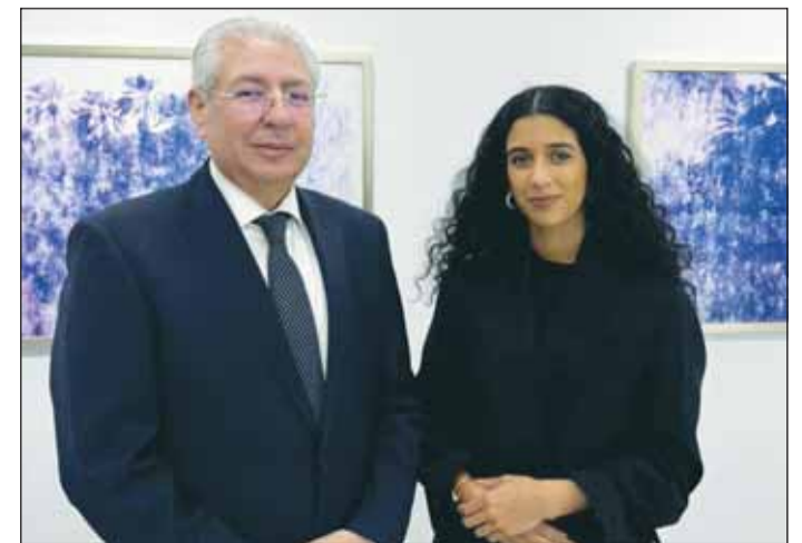
السفير المصري أسامة شلتوت ومشاعل الساعي