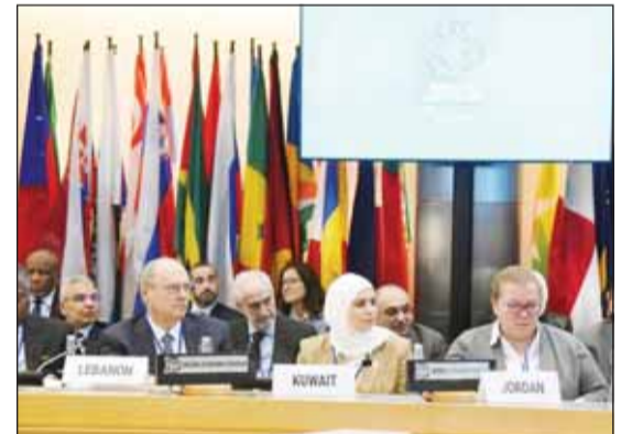
وزيرة المالية خلال مشاركتها في الاجتماع

شدت وزيرة المالية ووزيرة الدولة للشؤون الاقتصادية والاستثمار ووزيرة النفط بالوكالة المهندسة نورة الفصام على أن الكويت تركز على تطوير بيئة الأعمال وتعزيز رأس المال البشري وتوسيع نطاق التمويل وتشجيع الشركات الطويلة الأجل وإنشاء الإطار التنظيمي الملائم للمستثمرين ضمن ستراتييجيتها للتنوع الاقتصادي. جاءت تصريحات الوزيرة الفصام خلال الاجتماع المشترك بين الرئيس الـ 14 لمجموعة البنك الدولي ومحافظي الدول العربية آجاي بانغا وذلك ضمن مشاركة دولة الكويت في الاجتماعات السنوية للمؤسسات المالية الدولية لمجلس محافظي مجموعة البنك الدولي وصندوق النقد الدولي في واشنطن. وأضافت الفصام أن الكويت أيضا تركز جهودها في استراتيجية التنوع الاقتصادي على التوسع في القطاعات ذات الأولوية مع اغتنام فرص السوق وتعزيز ركائز البنية التحتية الأساسية ضمن مساعيها الدووية لبناء اقتصاد مرن ومستدام ومزدهر ومستعد لمواجهة التحديات المستقبلية.