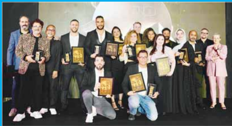
تكريم فريق "بيتس بان جلف"