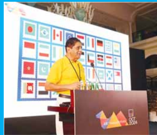
خلال إحداهم المحاضرات