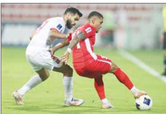
من لقاء العميد وشباب الأهلي

نفي نادي الكويت في بيان رسمي ما تناقله بعض وسائل الإعلام بخصوص مشاركة لاعب إسرائيلي مع فريق شباب الأهلي الأربعة الماضي خلال مواجهة الفريقين في الجولة الثالثة من منافسات المجموعة الرابعة لمسابقة دوري أبطال آسيا 2 مؤكدا أن ما يتداول غير صحيح بعد أن أكد النادي الإماراتي أن اللاعب مسلم ويحمل جواز سفر فلسطينيا. وجاء في البيان "نؤكد على تمسكنا بالتوابت الدينية والمواد الوطنية والقضايا المصرية التي تأتي في طبيعتها مناصرة القضية الفلسطينية".