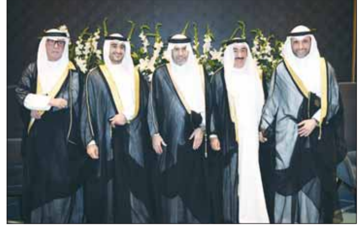
مزيق الغانم وسفير قطر علي آل محمود يقدمان التهاني