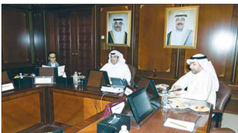
الوزير عبدالرحمن المطيري مترأساً اجتماع اللجنة بحضور الشيخة أمثال الأحمد

يذكر أن اللجنة قد اعتمدت في وقت سابق شعار الاحتفالات الوطنية "عز وفخر" وسيتم اعتماده للسنوات المقبلة، فيما تم اختيار درجة معينة من اللون الأزرق في الشعار وهو اللون الرسمي لدولة الكويت.