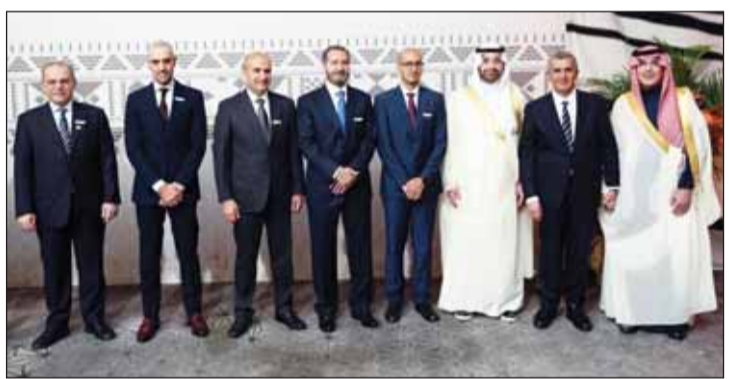
"الوطني" يختتم مشاركته في اجتماعات "صندوق النقد" و"البنك" الدوليين

فيما قتل ستة جنود إسرائيليين وأصيب العشرات في عمليات دهم في تل أبيب والقدس، لاحت في الأفق بوادر انفراجة في الموقف، مع إعلان الرئيس المصري عبدالفتاح السيسي، أمس، أن القاهرة اقترحت وقف إطلاق النار لمدة يومين في غزة لتبادل أربع رهائن إسرائيليين مع بعض السجناء الفلسطينيين. وأضاف السيسي، "مصر في خلال الأيام القليلة الماضية قامت بجهد في إطلاق مبادرة تهدف إلى تحريك الموقف وإيقاف إطلاق النار لمدة يومين يتم (خلالهما) تبادل أربع رهائن مع أسرى".