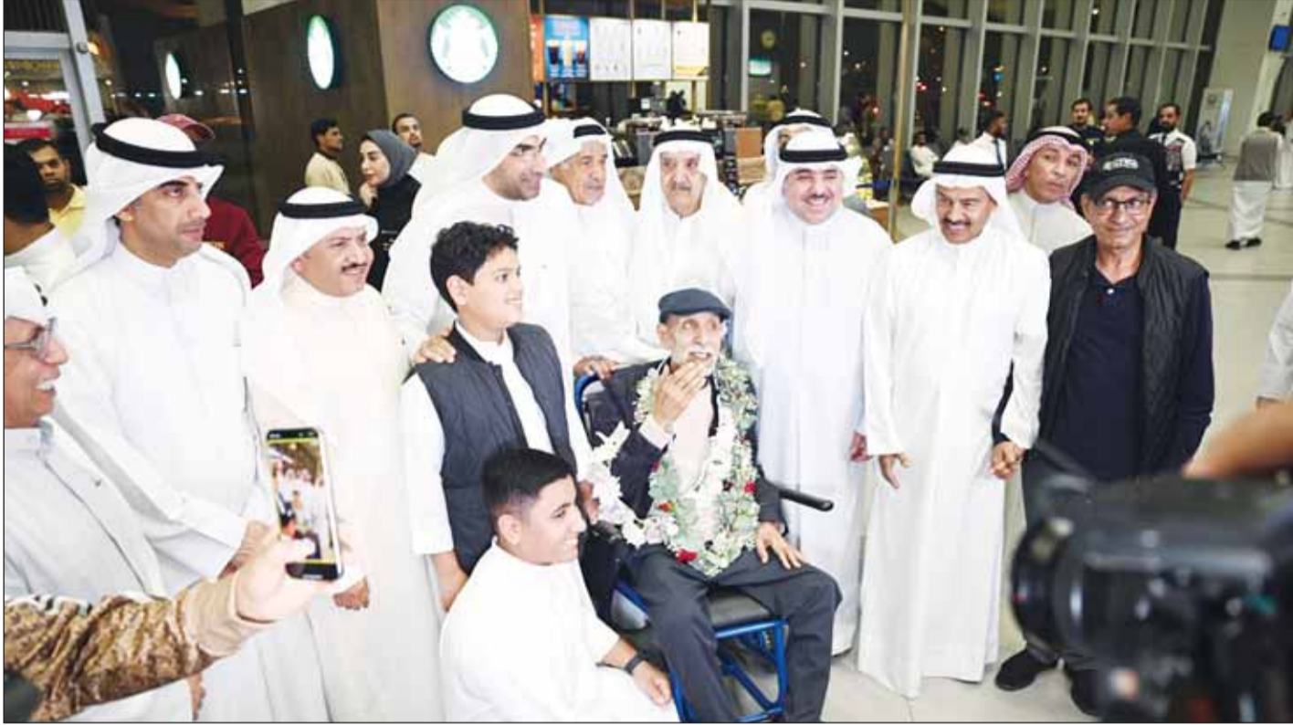
النجوم والقياديون في استقبال "بوخالد"

الاثنين 25 ربيع الآخر 1446 هـ - الموافق 28 أكتوبر (تشرين أول) 2024 م (السنة 55) العدد (19698)