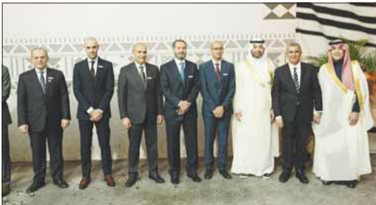
محافظ "المركزي" السعودي والهارون مع قيادات البنوك