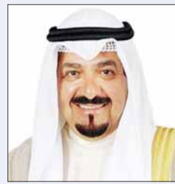
سمو الشيخ أحمد العبدالله

بعث سمو رئيس مجلس الوزراء الشيخ أحمد العبدالله ببرقية تهنئة إلى الحاكم العام لسانت فينسنست والغرينادينز الصديقة سوزان دوغان ني رايبان بمناسبة العيد الوطني لبلادها.