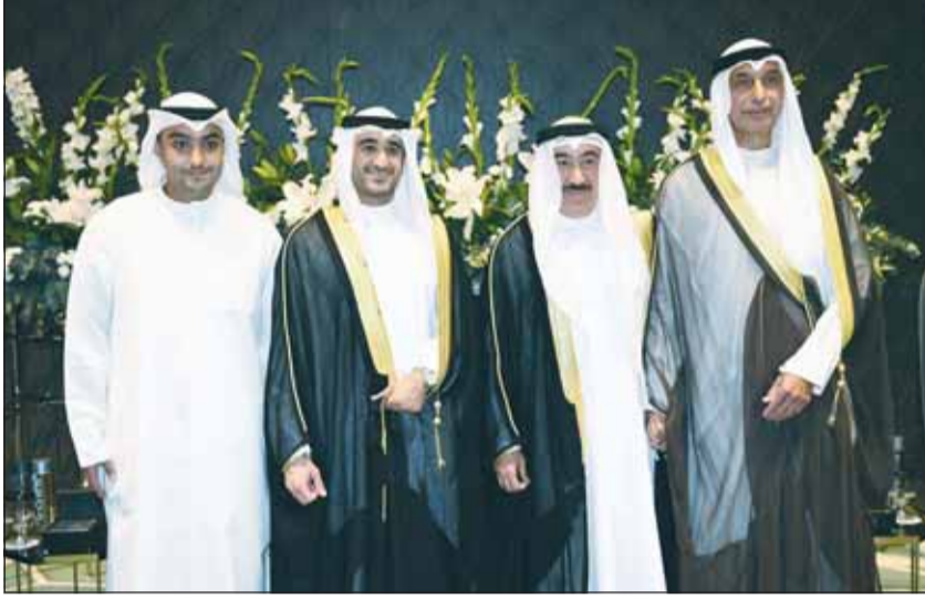
السفير مجدي الظفيري يبارك