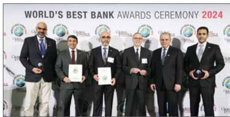
"غلوب فاينانس": "بوبيان" الأفضل إسلامياً في الكويت... وعالمياً بالمسؤولية المجتمعية