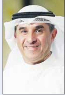
د. حسن الفجام

أعلنت الهيئة العامة للتعليم التطبيقي والتدريب عن استقبال مدير الهيئة، الدكتور حسن الفجام، المراجعين الراغبين في مقابلته خلال الفترة الصباحية يوم الثلاثاء من كل أسبوع في مقر ديوان عام الهيئة بمنطقة الشويخ. وتأتي هذه الخطوة لاتاحة الفرصة للموظفين والطلبة وأفراد المجتمع لمقابلة مدير الهيئة وتقديم استفساراتهم ومناقشة مقترحاتهم وشكاواهم مباشرة. وتعزز هذه المقابلات فرصة التواصل الفعال بين الهيئة والمراجعين وتقديم حلول سريعة للمواضيع المتعلقة بالتعليم والتدريب كما تمكن المراجعين من عرض مشاكلهم المتعلقة بالخدمات المقدمة في الهيئة، ما يسهم في تحسين مستوى الأداء والخدمات التي تقدمها الهيئة.