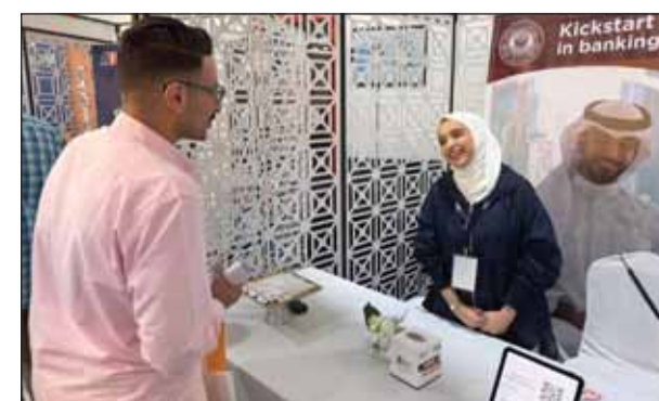
جناح المعهد في المعرض

شارك معهد الدراسات المصرفية في معرض الفرص الوظيفية والذي تقيمه الجامعة الأسترالية "AU" في الكويت يوم الخميس 24 أكتوبر 2024 ضمن إطار دعم المعهد لحديثي التخرج من الكويتيين، وجاءت هذه المشاركة بهدف التواصل مع الخريجين الكويتيين الجدد وإطلاعهم على الخدمات التي يقدمها المعهد، والمساهمة في توفير فرص وظيفية لهم. وحرص معهد الدراسات المصرفية على تلبية دعوة الجامعة الأسترالية في الكويت، وشارك في هذا المعرض الهام،