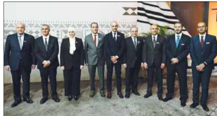
وزيرة المالية والهارون خلال حفل استقبال اتحاد المصارف

والتنمية، وبرلمانيين، وكبار المسؤولين من القطاع الخاص، وممثلي منظمات المجتمع المدني، والأكاديميين، حيث تمت مناقشة القضايا موضع الاهتمام العالمي، كما عقدت ندوات وورشات عمل إقليمية ومحتمرات صحافية وكثيرة من الفعاليات الأخرى التي ركزت على الاقتصاد العالمي والتنمية الدولية والنظام المالي العالمي. وناقشت الاجتماعات السنوية هذا العام العديد من الموضوعات المهمة من بينها كيفية بناء المرونة الاقتصادية في ظل الاقتصاد العالمي الضعيف وارتفاع حالة عدم اليقين، حيث يحتاج قطاع السياسات إلى بناء مستقبل أكثر مرونة من خلال تعزيز شبكات الأمان الاجتماعي لحماية الفئات الأكثر ضعفاً، وتمسين الحوكمة والمساءلة، وتعزيز أطر السياسات، ومعالجة تغير المناخ. وشملت الاجتماعات السنوية العديد من اللجان أهمها: لجنة التنمية، واللجنة الدولية للشؤون النقدية والمالية، ومجموعة العشرة، ومجموعة الأربعة والعشرين، ومجموعة الثلاثين حيث ناقش اجتماع اللجنة النقدية والمالية تطورات أداء الاقتصاد العالمي واستشراف اتجاهاته المستقبلية، وأداء الأسواق المالية الدولية وطبيعة المخاطر التي يمكن أن تؤثر في اتجاهات ذلك الأداء.