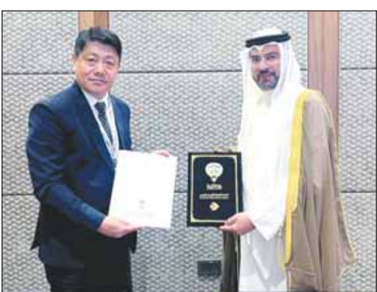
الشيخ حمود المبارك ووكيل الطيران المدني فيع الهند

حول الأحداث المقبلة الخاصة بالطيران المدني على الصعيدين الإقليمي والعالمي. وأشار إلى أنه التقى أيضاً رئيس الطيران المدني في الدومينيكان هكتور بورتيلو حيث وجه التهنئة له للحصول بلاده على موافقة منظمة الطيران المدني الدولي (إيكاو) على شرف تنظيم مؤتمر (إيكان) لعام 2025 معرباً عن تمنياته للدومينيكان بكل التوفيق والنجاح مع تقديم سبل التعاون معها لإنجاح هذا الحدث العالمي.