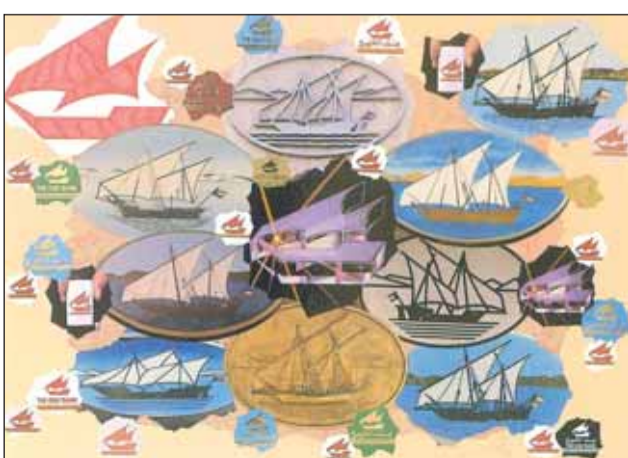
شعارات قديمة للبنك

ولمواصلة التطور والتطوير، حرص البنك على وضع خطط طموحة تركز على التطور الرقمي وتقديم أفضل الخدمات للعملاء، كما يولي قطاع الشركات اهتماماً خاصاً، لاسيما الشركات الصغيرة والمتوسطة، لما لها من دور مهم في تنويع الاقتصاد الوطني، وخلق فرص عمل جديدة، ورفع قيمة ريادة الأعمال.