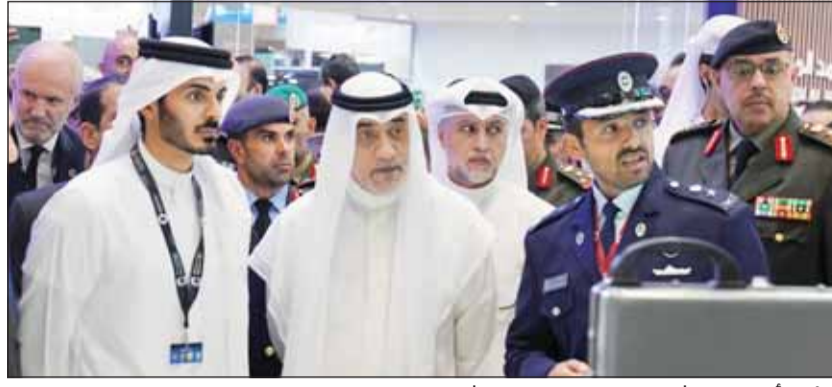
النائب الأول الوزير الشيخ فهد اليوسف خلال مشاركته في افتتاح معرض (مليبول قطر)