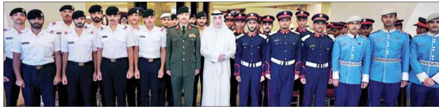
النائب الأول متوسماً الطلبة الضباط الكويتيين الدارسين في الكليات العسكرية في قطر

الدوحة - كونا، عاد النائب الأول لرئيس مجلس الوزراء ووزير الدفاع ووزير الداخلية الشيخ فهد اليوسف إلى البلاد أمس بعد زيارة رسمية إلى دولة قطر. وأعرب اليوسف - في بيان صحفي صادر عن وزارة الدفاع - عن خالص شكره وعظيم امتنانه لدولة قطر - قيادة وحكومة وشعباً - على ما لقيه والوفد المرافق له من حفاوة استقبال وكرم ضيافة، متمنياً للعلاقات قطر دوام التقدم والرفعة والازدهار وللعلاقات الأخوية بين البلدين المزيد من التطور والنماء.