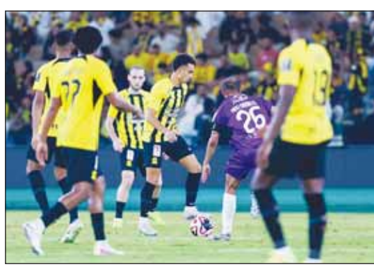
الاتحاد عبر الجندل بكأس الملك

وتغلب القادسية على الوحدة خارج ملعبه بنتيجة 1-2 وبلغ الدور ربع النهائي أيضاً. وسجل هدفي القادسية المكسيكي فولجان كينونيس (37 و45+4)، فيما سجل للوحدة الهولندي جونينيو باكوتا (7) وتُسبب قرعة ربع النهائي اليوم.