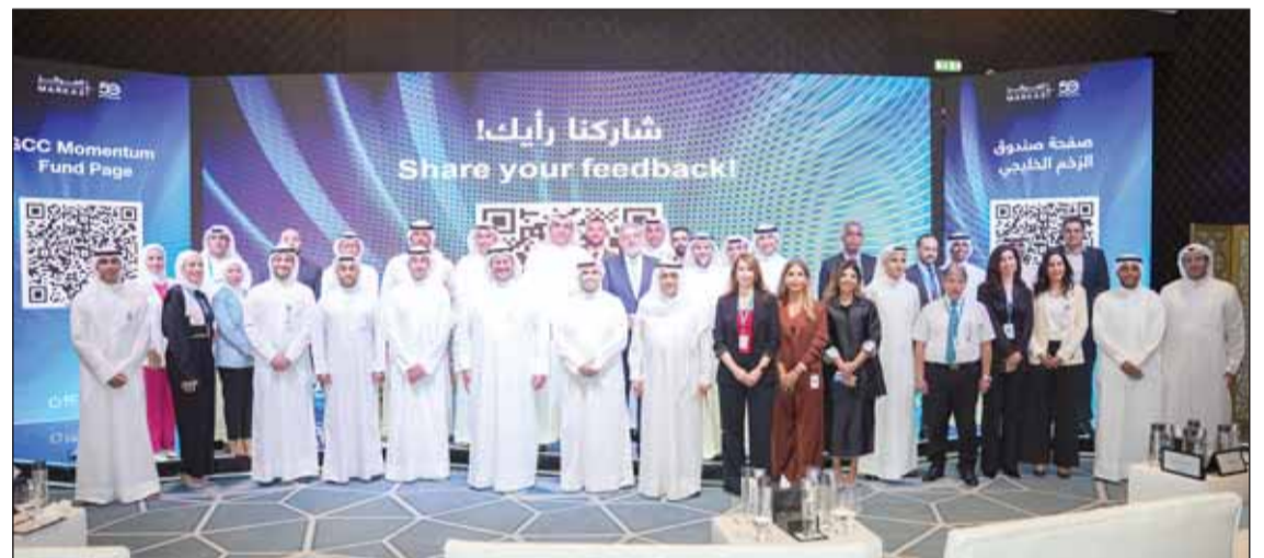
جانب من إحدى فعاليات 'المركز'