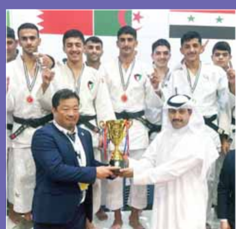
الحمد يتوج شباب أزرق الجودو

وأشاد بالجهود المبذولة من قبل الهيئة العامة للرياضة في دعم ومساندة الاتحادات الرياضية وتقديم الدعم والمساندة لها لتحقيق نتائج إيجابية تعكس مستوى الرياضة الكويتية ودورها البارز على مستوى المنطقة.