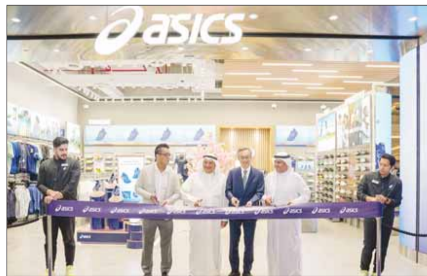
افتتاح الفرع الجديد

أعلنت شركة علي عبدالوهاب المطوع التجارية عن افتتاح الفرع الرابع للعلامة التجارية اليابانية العالمية ASICS، المختصة بتوفير الملابس والأحذية الرياضية، في الكويت، وذلك في مول العاصمة، خلال أسبوعاً احتفالياً أقامتها بطابع ياباني.