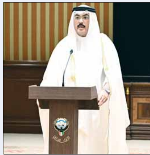
وزير التربية يُوَدِّعُ اليمين الدستورية

من مواليد العام 1967 ويحمل شهادة البكالوريوس بالهندسة الميكانيكية من جامعة الكويت عام 1992. حاصل على شهادة الماجستير في الإدارة الهندسية من جامعة سنديلاند في بريطانيا. عمل مدققا أول لنظم إدارة الجودة الإدارية (ISO 9001) من مجلس شهادات وتقييم المحترفين العالمي ومدققا أول لنظم إدارة الجودة ISO 9000 - 14000 من الهيئة العالمية للمدققين المسجلين المعتمدين. كما عمل الطبباطي مديرا دوليا معتمدا لأنظمة الجودة وإدارة التغيير وإدارة الأزمات من البورد الأمريكي للمدرسين الدوليين وكان كبير مديري إدارة المشاريع بالجمعية السويسرية لإدارة المشاريع ومحكما وخبيرا (أ) تحت رقم 123 باتحاد المنظمات الهندسية في الدولة الإسلامية. وتقلد عدة مناصب بالهيئة العامة للتعليم التطبيقي والتدريب رئيسا لمكتب الجودة في معهد تدريب الكهراء والماء (1998 - 2001). وعمل مساعد مدير مركز التدريب أثناء الخدمة (2001 - 2005) ثم مدير المعهد العالي للطاقة (2005 - 2011) ومدير المعهد العالي للطاقة بالتكليف 2022. وأخيرا نائب مدير العام للتدريب بالهيئة العامة للتعليم التطبيقي والتدريب منذ عام 2003. متزوج ولديه 5 أبناء.