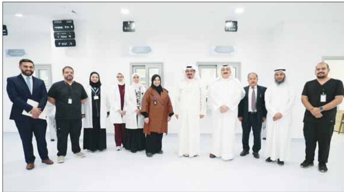
سمو رئيس مجلس الوزراء الشيخ أحمد العبدالله ووزير الصحة د. أحمد العوضي خلال الجولة التفقدية لمستشفى الولادة الجديد

يتكون المستشفى من أربعة مبان ويضم ستة أدوار متصلة بالإضافة إلى السرداب والدور الأرضي وثلاثة أبراج كبيرة.