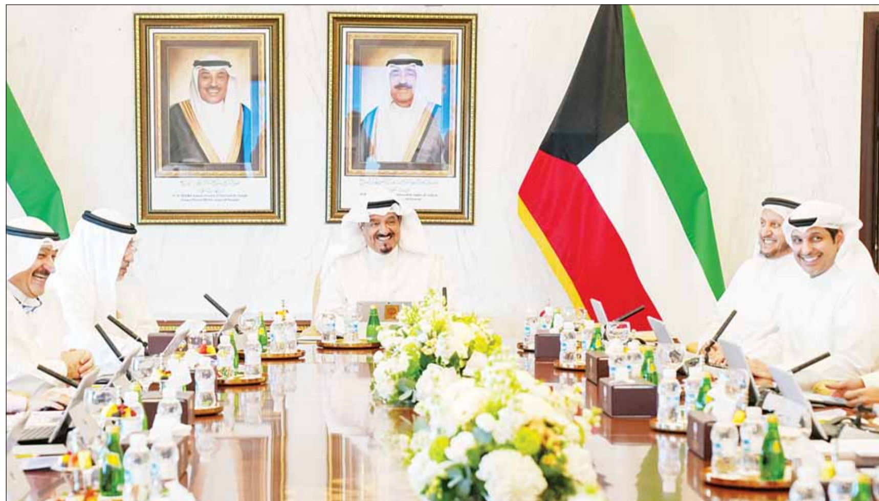
سمو الشيخ أحمد العبدالله مترشداً اجتماع مجلس الوزراء

الاستعانة بالقطاع الخاص لإنشاء وتشغيل محطات التوليد بنظام مزود الطاقة المستقل