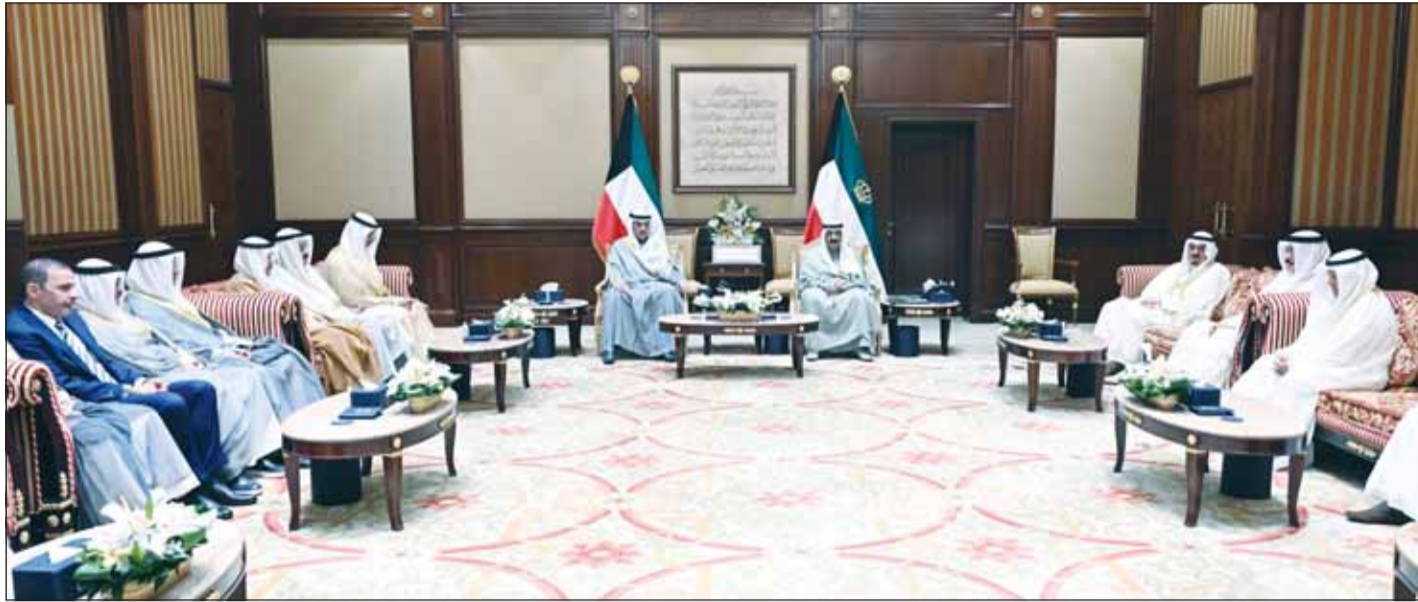
سمو أمير البلاد لدى استقباله بحضور سمو ولي العهد سمو رئيس مجلس الوزراء الشيخ أحمد العبدالله ووزيري التربية والنفط