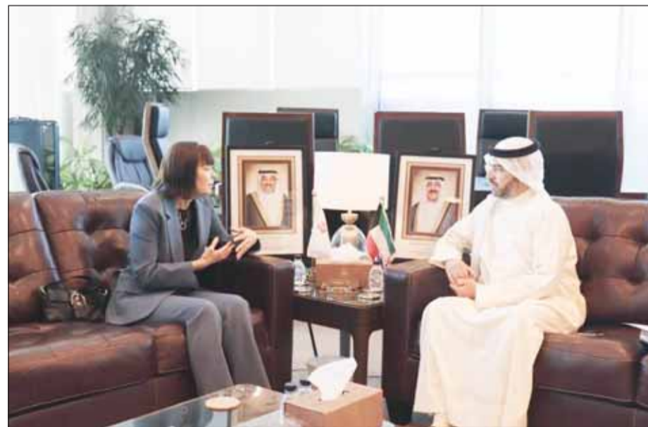
رئيس "الطيران المدني" الشيخ حمود المبارك خلال مباحثاته مع السفيرة الأميركية كارين ساساهارا

بحث رئيس الإدارة العامة للطيران المدني الشيخ حمود المبارك الصباح وسفيرة الولايات المتحدة الأميركية لدى البلاد كارين ساساهارا أمس، أوجه التعاون بين البلدين في مجالات الطيران المدني والسبل الكفيلة بتعزيزه وتطويره.