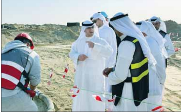
الوزير عبداللطيف المشاري خلال الجولة التفتيشية

تفقد وزير الدولة للشؤون البلدية وزير الدولة لشؤون الإسكان عبداللطيف المشاري عددا من مشروعات الرعاية السكنية جنوب البلاد إلى جانب مساكن الرعاية السكنية في منطقة صباح السالم. وقالت المؤسسة إنه وخلال جولة وزير الإسكان على مجمع صباح السالم للرعاية السكنية بحضور محافظ مبارك الكبير الشيخ صباح بدر الصباح ورئيس فريق شؤون إسكان المرأة الشيفة بيبي الصباح والمدير العام للمؤسسة راشد العنزي وقيادتها جرى الاطلاع على حجم الخدمات المقدمة لسكانه والوقوف على بعض الملاحظات الخاصة به واتخاذ الإجراءات نحو إزالة أي مخالفات إن وجدت.