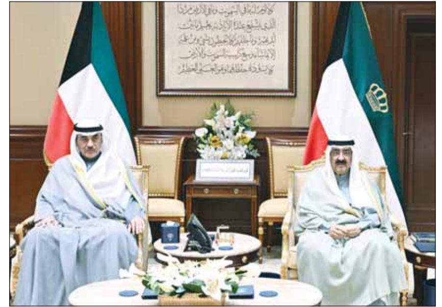
سمو أمير البلاد الشيخ مشعل الأحمد وسمو ولي العهد الشيخ صباح الخالد خلال مراسم أداء القسم