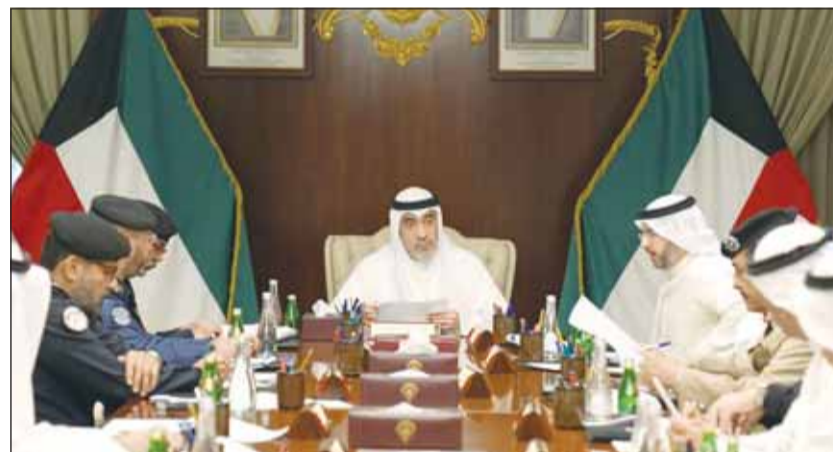
النائب الأول الشيخ فهد اليوسف خلال لقائه ممثلي "الداخلية والطيران المدني والإطفاء والجمارك"

ووفق بيان صحفي لـ"العدل" يتيح الخدمة للمستخدم (المدعي أو المدعى عليه) الحصول على صورة من صحيفة الدعوى التي تم إيداعها في المحكمة الكلية ومحكمة الأسرة الكلية أو في محكمة الاستئناف