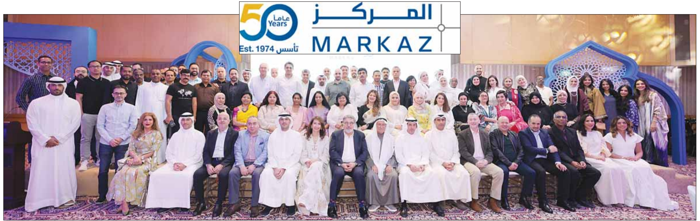
فريق شركة المركز المالي

أسس في 1974 وتطور كشركة رائدة في القطاع المالي مع إجمالي أصول تحت الإدارة بقيمة 1,38 مليار دينار