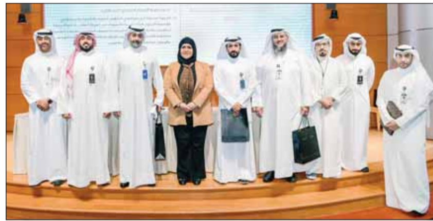
صورة جماعية خلال الحلقة النقاشية

التكرير لضمان تصريف النفط الكويتي الخام وتم تحديد أولويات الصرف الرأسمالي للمحافظة على استقرار الشركة المالي والمحافظة على المستوى الأمثل للصرف التشغيلي مع تحسين كفاءة التشغيل. وقالوا إن قطاع البيع بالجملة في "البتترول العالمية" يقوم بتسويق المنتجات مثل الغاز البترولي المسال وغيرها من المنتجات البترولية في الأسواق الأوروبية إذ يتم بيع حوالي 100 ألف برميل يوميا من خلال قطاع التوزيع المباشر لعملاء الشركة.