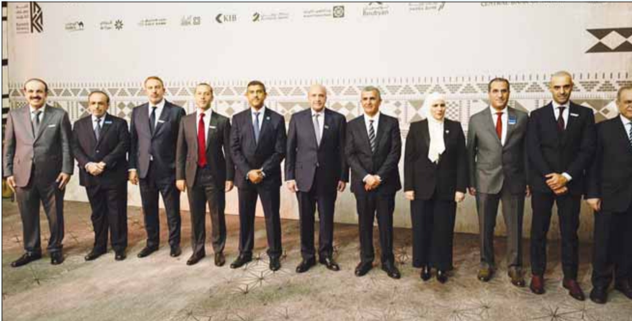
السميط في لقطه جماعية مع وزيرة المالية بمشاركة مسؤولي البنك