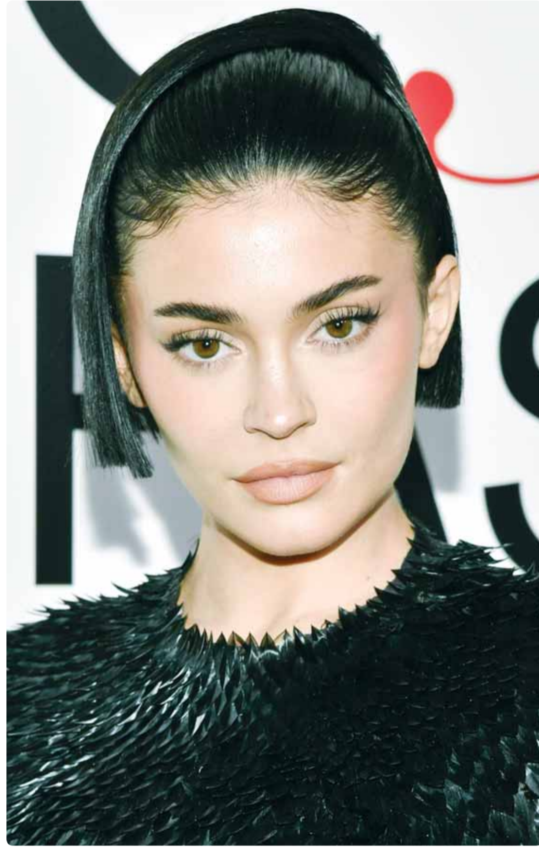
العارضة الأميركية كايلي جينر خلال حضورها حفل توزيع جوائز للأزياء في نيويورك

نسال الله أن يحفظ الكويت وشعبها من كل مكروه، تحت قيادة سيدي حضرة صاحب السمو الأمير، وسمو ولي عهده، حفظهما الله ورعاهما. اللهم ارحم شهداءنا الأبرار.