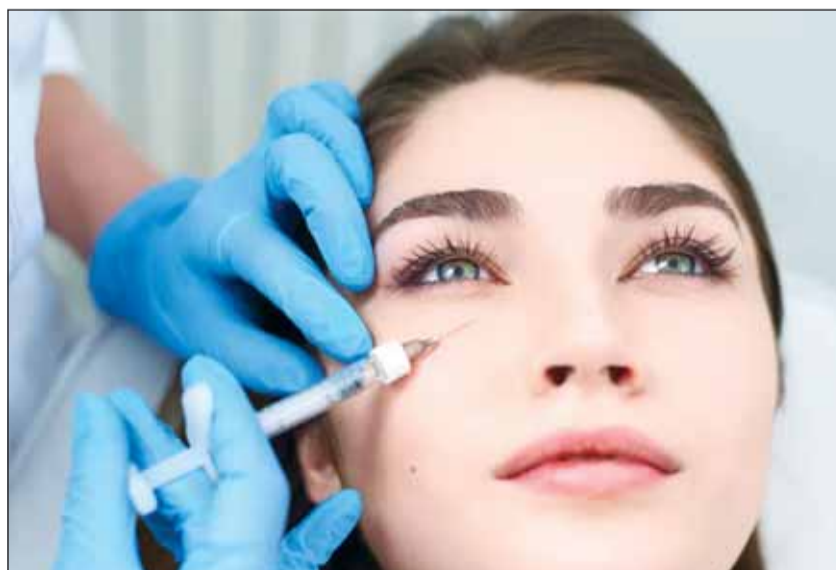
خطأ أفقد العروس بصرها (أرشيف)

الرياض - وكالات، فقدت عروس بصرها، قبيل حفل زفافها، في السعودية، بسبب خطأ وقع خلال حقن مادة أسفل عينيها لأغراض التجميل.