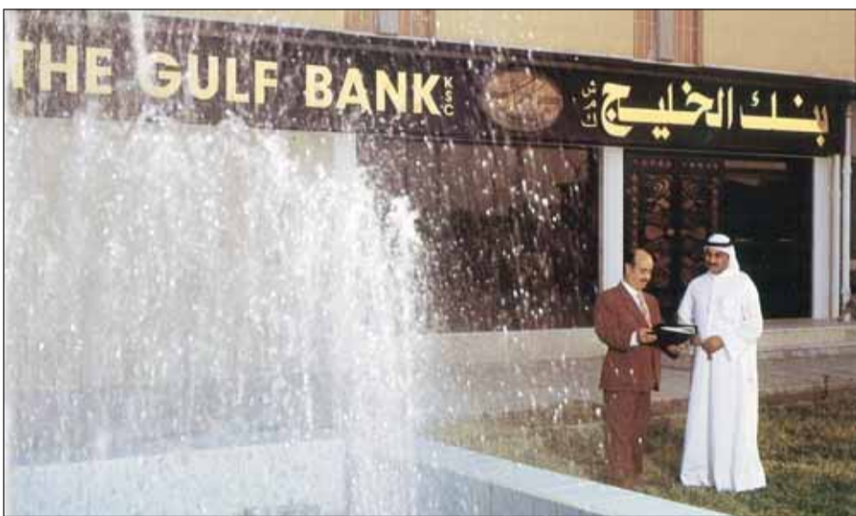
صورة أمام الفرع الرئيسي