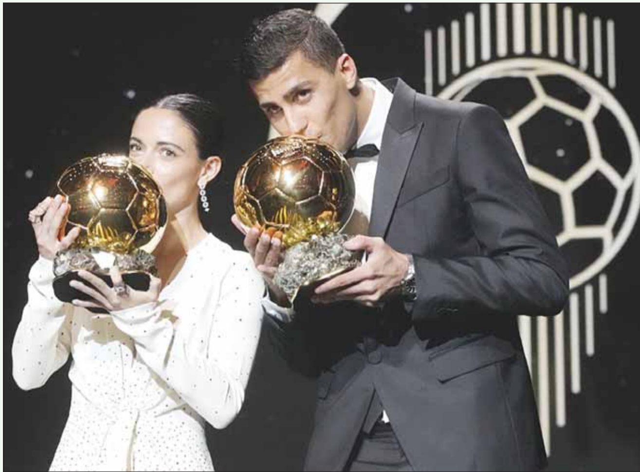
رودري وبوناماتي يقبلان الكرة الذهبية لأفضل لاعب في العالم.

وساهم مارتينيز في تتويج منتخب الأرجنتين ب كأس أمم أمريكا الجنوبية (كوبا أمريكا) بعد أقل من عامين من الفوز مع "التانغو" بلقب مونديال قطر 2022.