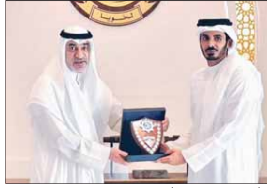
الشيخ فهد اليوسف والشيخ خليفة بن حمد

ضباطنا الدارسون في قطر سيقومون بدور محوري في دعم مسيرة الكويت العسكرية والأمنية