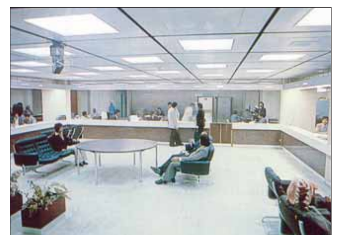
تاريخ طويل من تجربة العميل المميزة مع بنك الخليج