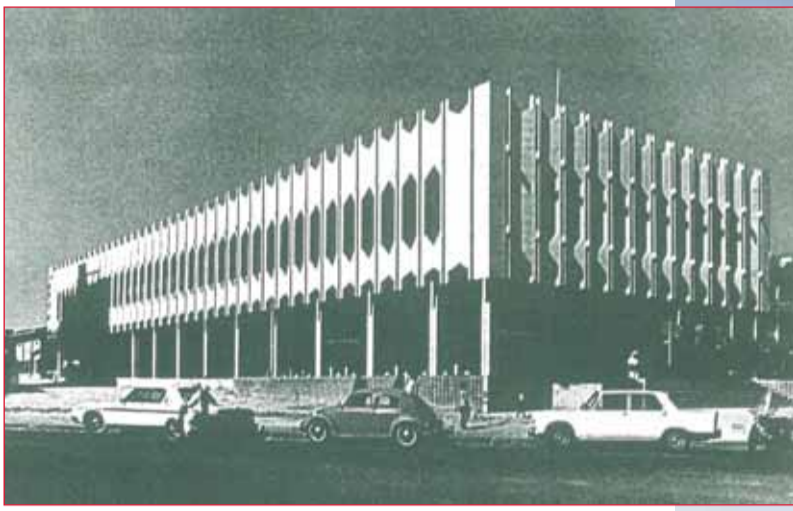
صورة لأول مقر رئيسي للبنك