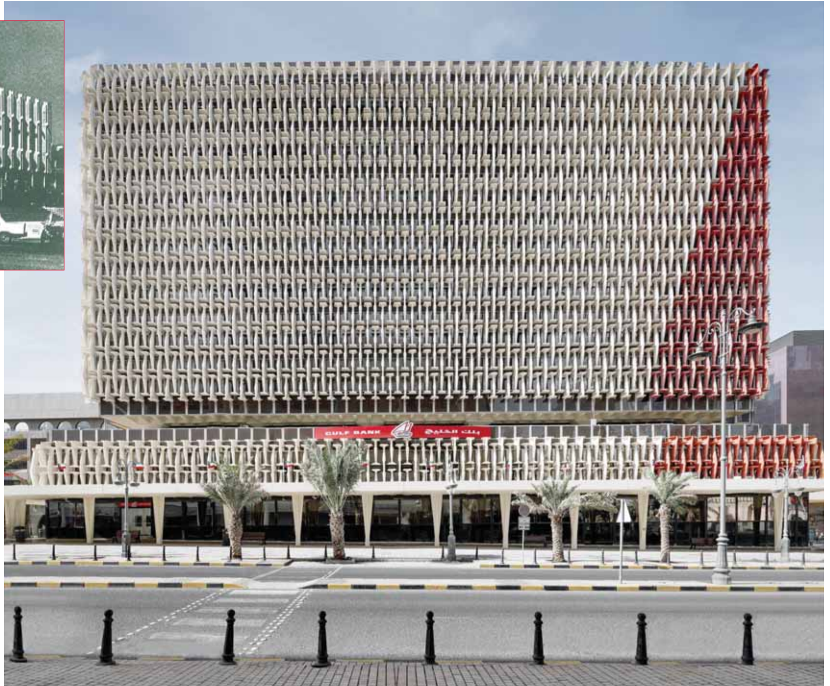
المقر الرئيسي للبنك حالياً

تقديرًا لدوره الرائد في الكويت والمنطقة، جاء بنك الخليج ضمن قائمة "فوربس" قائمة لأكثر 50 بنكاً في الشرق الأوسط، بقيمة سوقية بلغت 3,2 مليارات دولار في عام 2023، كما اختارته ضمن أكبر 100 شركة مدرجة في المنطقة لعام 2024، ومن جهتها اختارته مجلة "ذي بانكر" ضمن أفضل 100 بنك عربي لعام 2024.