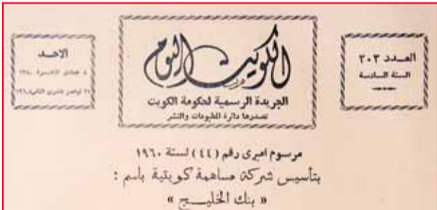
صورة لمرسوم لإنشاء البنك المنشور في الجريدة الرسمية