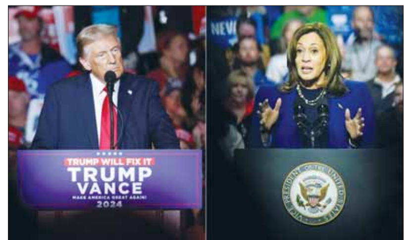
المرشحاتان الديمقراطي كامالا هاريس والجمهوري دونالد ترامب

المنظرات الأخيرة تقارباً شديداً بين المتنافسين، وبحسب أحدث استطلاع صدر عن صحيفة "نيويورك تايمز" و"كلية سينا"، فهناك تقدم لهاريس في ولايتي نورث كارولينا وجورجيا، فيما نجح الرئيس السابق دونالد ترامب في تضيق الفارق في ولاية بنسلفانيا، ويمتصق بأفضليته في أريزونا، ويجعل التقارب الحالي بين المرشحين في الولايات المتأرجحة من الصعب التكهّن بالنتيجة النهائية لانتخابات اليوم. وبينما يشير الاستطلاع إلى تقدم هاريس بفارق ضئيل في نيفادا ونورث كارولينا وويسكونسن، في حين يتقدم ترامب في أريزونا، بينما يبقى التنافس شديد القرب في ميشيغان وجورجيا وبنسلفانيا، التتممة 06