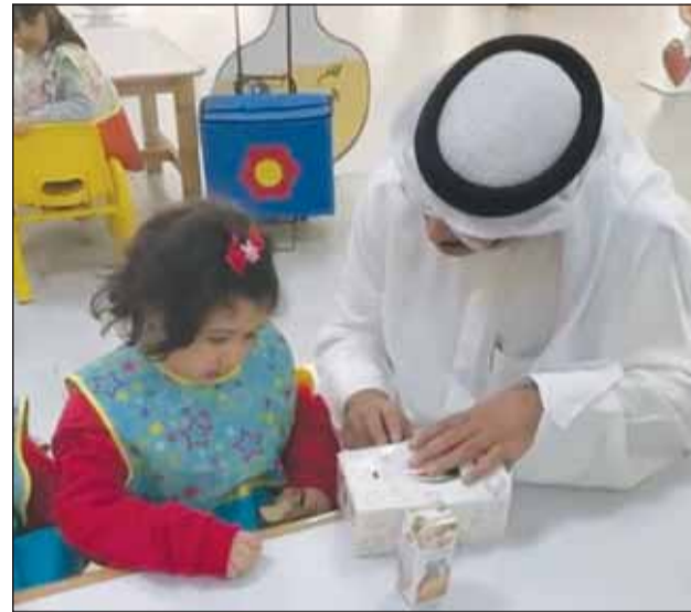
أش فيك زلانة

الوزير بالتفاصيل الدقيقة التي تلمس المجتمع المدرسي. ويهدف الوزير من هذه الجولات إلى تقييم البنية التحتية للمرافق التعليمية لاسيما الفصول الدراسية، والمختبرات، والمكتبات، وتطوير مهاراتهم.