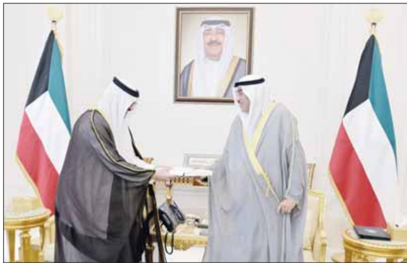
سمو ولي العهد يتسلم دعوة خادم الحرمين من السفير السعودي الأمير سلطان بن سعد

تسلم سمو ولي العهد الشيخ صباح الخالد، بقصر بيان أمس، الدعوة الموجهة إلى سمو أمير البلاد الشيخ مشعل الأحمد من أخيه خادم الحرمين الملك سلمان بن عبدالعزيز آل سعود ملك المملكة العربية السعودية الشقيقة للمشاركة في قمة متابعة عربية وإسلامية مشتركة غير عادية والتي ستعقد في مدينة الرياض بتاريخ 11 نوفمبر الجاري. وقام بتسليم الرسالة لسموه سفير خادم الحرمين الشريفين لدى دولة الكويت الأمير سلطان بن سعد. حضر اللقاء وزير شؤون الديوان الأميري الشيخ محمد العبدالله وكبار المسؤولين بالديوان الأميري وديوان سمو ولي العهد.