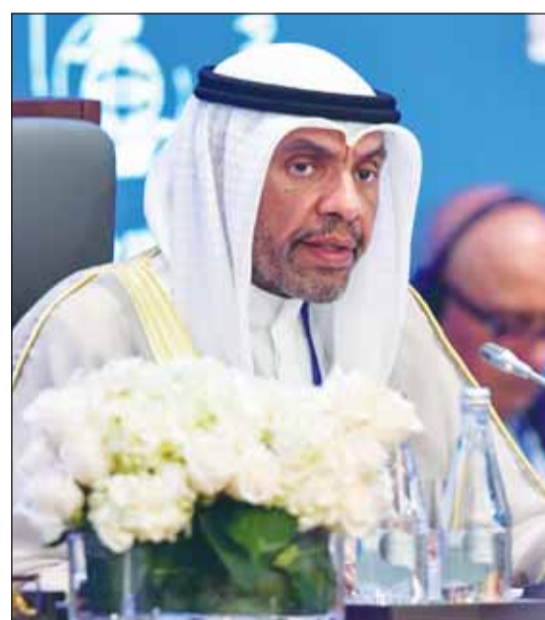
وزير الخارجية عبدالله الجعيا متحدتاً خلال المؤتمر

السبل الكفيلة لمعالجة الأسباب الجذرية لهذه الآفة المتجددة عبر السنين. وأعرب عن تطلع الكويت بأن يكون لهذا المؤتمر نتائج إيجابية وملموسة تستكمل سلسلة النجاحات التي حققها المجتمع الدولي