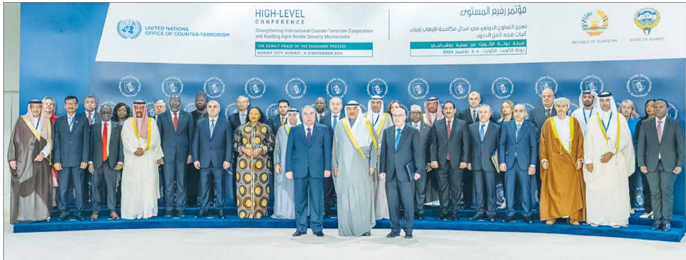
ممثل سمو الأمير سمو ولي العهد الشيخ صباح الخالد ورئيس طاجيكستان إمام علي رحمان يتقدمان الحضور