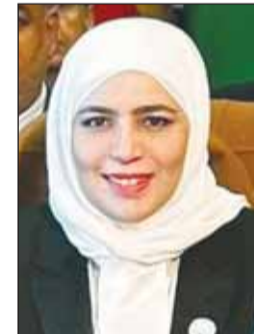
وزيرة المالية خلال المؤتمر

الرقمي في أنظمة الدفع المالي في الدول الأعضاء في منظمة التعاون الإسلامي، فقد أظهرت أهمية التكنولوجيا الرقمية لتحقيق النمو والتنمية المستدامة، وأن التزاماً على الدول تسريع وتيرة هذا التحول في جميع المجالات، حيث يشكل ركيزة أساسية تستند إليها رؤية الكويت لعام 2035، لذلك تسمى الكويت إلى اعتماد تقنيات ذكية ورقمية للارتقاء بخدماها والدفع بعجلة الاقتصاد وتحسين جودة الحياة، فضلاً عن تعزيز الكفاءة التشغيلية ودعم أداء القطاعات الرئيسية، وغير مثال على ذلك تطبيق "سهل" وهو تطبيق يتكون من 35 جهة حكومية جميعها في تطبيق واحد يسهل إنجاز المعاملات من دون الحاجة إلى التعامل