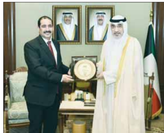
رئيس مجلس الوزراء بالإتابة الشيخ فهد اليوسف ووزير الداخلية اليمنية

استعراض عدد من القضايا الإقليمية والدولية ذات الاهتمام المشترك. من جهة أخرى، استقبل رئيس مجلس الوزراء بالإتابة أمس، سفير إيطاليا لدى الكويت لورنزو موريني.