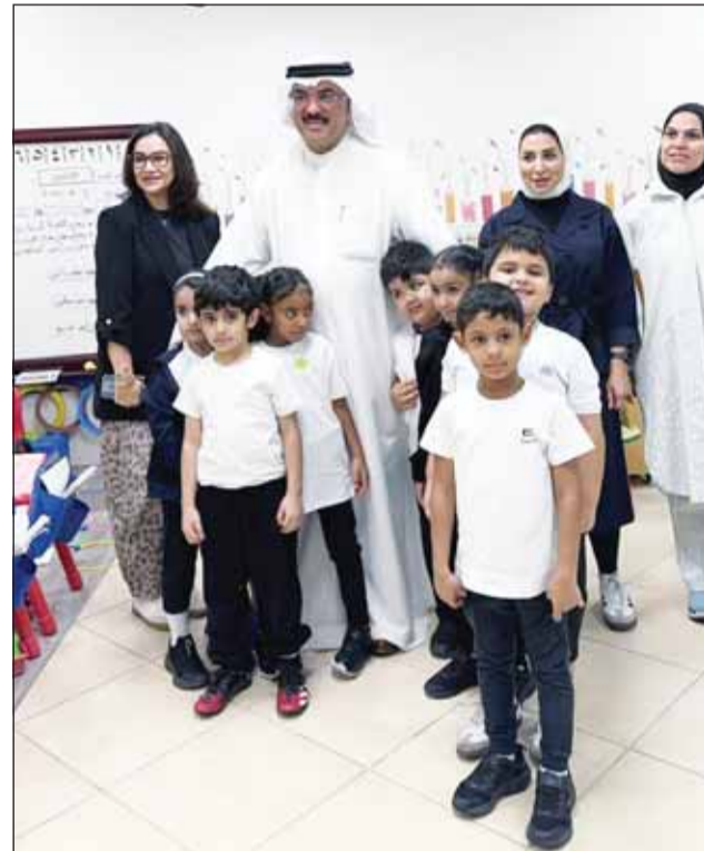
وزير التربية محاطاً بأطفال الروضة ومعلماتها

الجولات تستهدف تقييم البنية التحتية للمرافق التعليمية والاستماع إلى آراء الميدان لتطوير الأداء