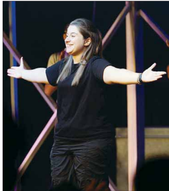
المخرجة فرح الحجلي تحيي الجمهور