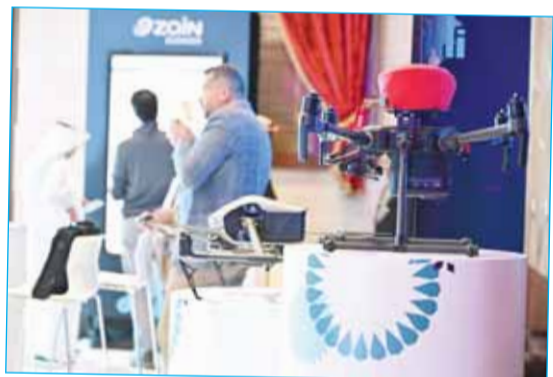
زين استعرضت حلول طائرات الدرون المدعومة بالذكاء الاصطناعي