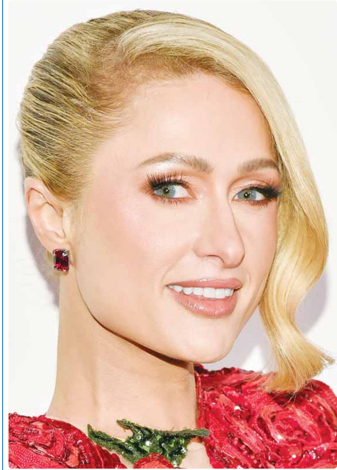
المغنية الأميركية باريس هيلتون خلال حضورها حفل توزيع جوائز الأرياء في نيويورك

نحشر كل هؤلاء، حتى لو رحلت الحكومة كلها، او تغيرت، فإن النهج لن يتغير، نهج المحافظة على الهوية الوطنية الذي بدأنا معه نتخفف الصعاء، ولن يتغير وزير داخلية يتحدث معهم بالتليفون... زين.