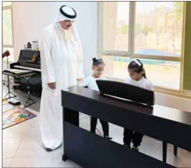
ما شاء الله... تعزفون زين

الوزير بالتفاصيل الدقيقة التي تلمس المجتمع المدرسي. ويهدف الوزير من هذه الجولات إلى تقييم البنية التحتية للمرافق التعليمية لاسيما الفصول الدراسية، والمختبرات، والمكتبات، وتطوير مهاراتهم.