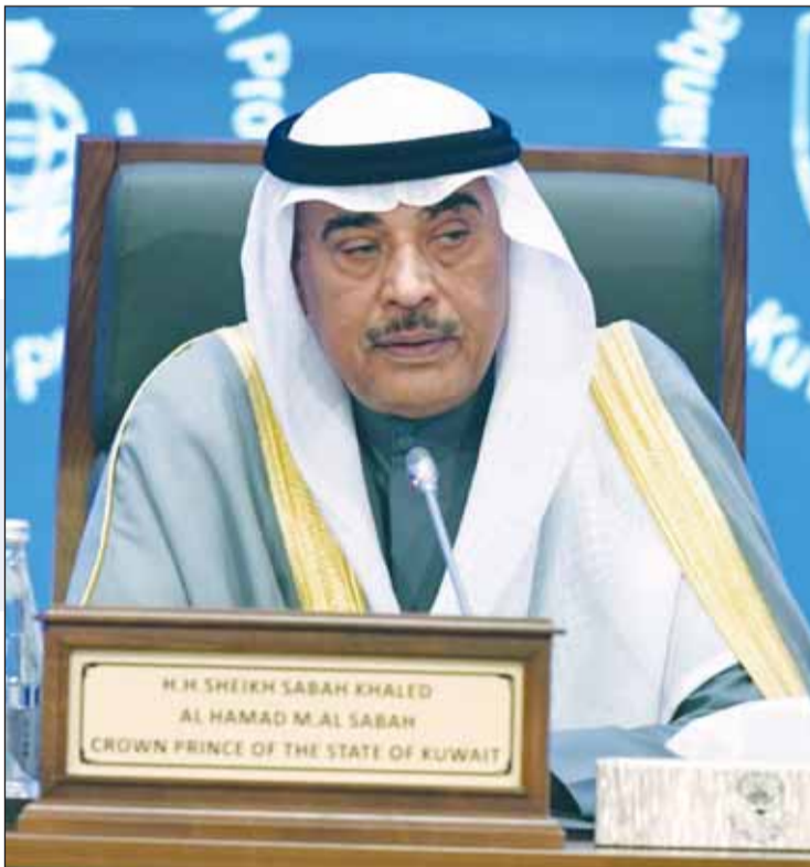
ممثل سمو الأمير سمو ولي العهد الشيخ صباح الخالد يلقي كلمته في الافتتاح