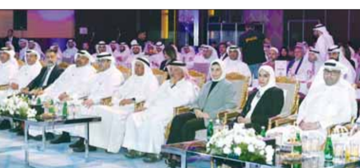
جانب من حضور المؤتمر

تقدم جميع الخدمات الحكومية. وفيها لفت عدد من المتحدثين إلى أهمية الخطوات التي قامت بها الحكومة ومنها تطبيق "سهل"، أكد رئيس الهيئة العامة للاتصالات وتقنية المعلومات بالانابة عبدالله العجمي، أن تطوير الخدمات الحكومية المتكاملة والشاملة يوفر الكثير من الجهد والتكلفة على الجهات الحكومية وميزانية الدولة. وأوضح العجمي في كلمة ألقاها نيابة عن وزير الدولة لشؤون الاتصالات عمر العمرخلال الافتتاح أن هذا التطوير الذي سيفضي إلى توفير خدمات أفضل للمواطنين والمقيمين سوف يتزامن مع رفع مستوى قدرات الجهات الحكومية والدولة بشكل عام في التخطيط المستدام