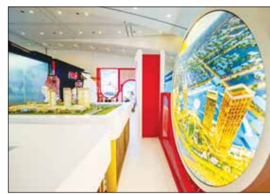
جانب من المشاركة فيه المؤتمر

تميز بتصاميمها التي تجمع بين روح الحداثة وعراقة تاريخ السعودية، بالإضافة إلى خدمات التجزئة الراقية التي تلبى احتياجات المتسوقين والزوار. يتميز مشروع الأفنيوز- الرياض بموقع استراتيجي متميز في قلب السعودية، في شمال مدينة الرياض، حيث يطل على تقاطع طريق الملك سلمان وطريق الملك فهد، كما يمتد الأفنيوز- الرياض والذي تفوق قيمته 17 مليار ريال سعودي على مساحة بناء تبلغ 1,870,000 متر مربع.