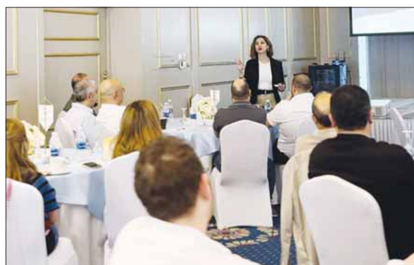
جانب من الدورة

ويؤمن بنك وياي بأن تطورات عملاء المكافأة الطلابية تتجاوز مجرد الحصول على الخدمات المالية والمصرفية التقليدية، بل تشمل أيضاً الاستمتاع بمزايا قيمة تلائم نمط حياتهم. ومن