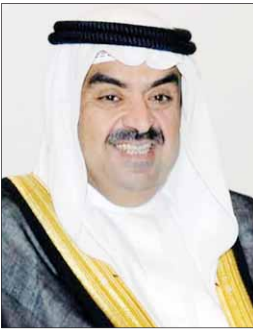
الشيخ خالد البدر الصباح