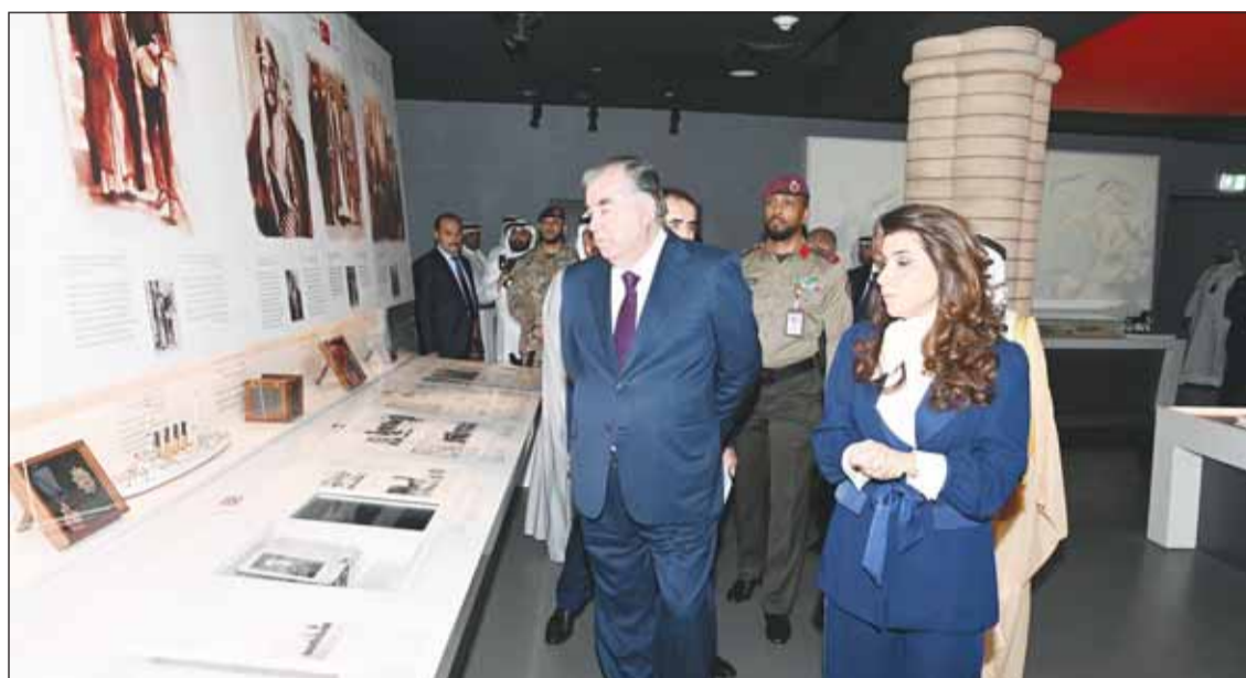
رئيس طاجيكستان امام علي رحمان يطلع على الوثائق المعروضة في متحف قصر السلام

من جهة أخرى، زار الرئيس امام علي رحمان والوفد الرسمي المرافق أمس، متحف قصر السلام. وقام الرئيس رحمان بجولة في أرجاء قصر السلام حيث اطلع على ما يحتويه من مقتنيات ووثائق تاريخية وجوانب مهمة من تاريخ وحضارة دولة الكويت والقاعات الرئيسية المكونة لمتحف قصر السلام وهي متحف الكويت عبر حكاهما ومتحف تاريخ قصر السلام ومتحف الحضارات التي سكنت الكويت. ورافق الرئيس الطاجيكي خلال الزيارة رئيس بعثة الشرف المرافقة المستشار بالديوان الأميري محمد أبو الحسن.