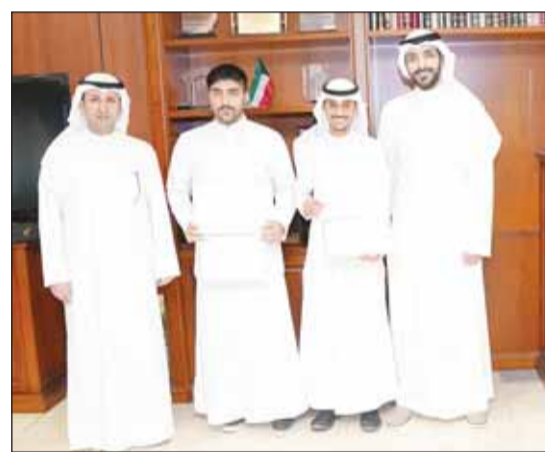
جانب من تكريم المشاركين

وأوضح أن مشروع التدريب الميداني يسهم في إعداد طاقات شبابية وطنية ذات مهارات عالية في تخصصات القطاع المصرفي، وهو ما يتماشى مع رؤية KIB الرامية إلى تمكين الطلبة والخريجين الشباب من الالتحاق بالعمل في القطاع المصرفي. وفي إطار الشراكة الاستراتيجية التي أبرمها KIB مع اتحاد الجمعيات التعاونية الاستهلاكية لتعزيز تواجده في الجمعيات التعاونية في الكويت، يسعى البنك إلى توسيع مثل هذه الشراكات مستقبلاً بهدف إتاحة خدماته المصرفية للملاء أثناء تسوقهم.