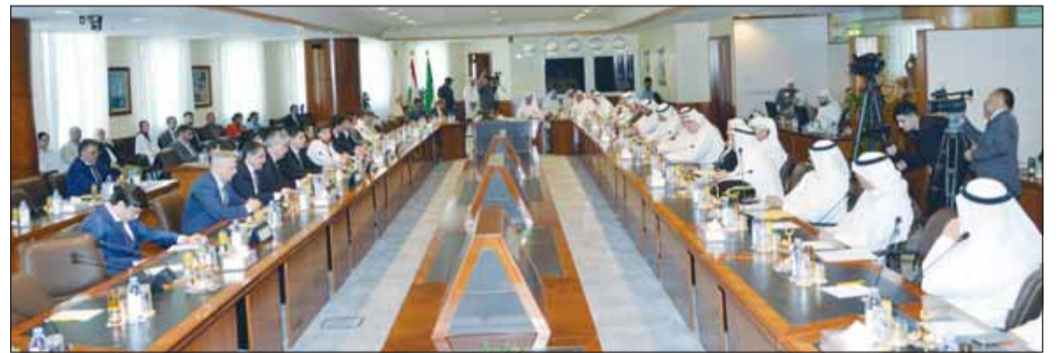
جانب من اللقاء المشترك

تتوافق استراتيجية التنمية الوطنية لطاجيكستان 2030 مع رؤية الكويت 2035 من خلال خلق اقتصاد متنوع يقوده السوق. وأشارت الغرفة إلى أن الخبرة الواسعة التي يتمتع بها المستثمرون الكويتيون في مجال الأعمال التجارية تحمل إمكانات كبيرة في النمو المزدهر في القطاعات الرئيسية التي تتفوق فيها الكويت، مثل القطاع المصري والاتصالات ومراكز الرعاية الأولية والبروتوكوليات. وأشدت الغرفة بالاتفاقيات المتبادلة التي تم توقيعها بين البلدين في مجالات تبادل العملة في القطاع الخاص، مؤكدة أن هذه الاتفاقيات ستمهد الطريق لفتح آفاق جديدة وتوسيع العلاقات إلى مجالات أوسع. من جانبهم، أكد المتحدون من الوفد الطاجيكي أن لدى بلدهم العديد من المشاريع الاستثمارية في مجال إنتاج الطاقة والمياه، مشيرين إلى أن الحكومة الطاجيكية تعمل بنظام النافذة الواحدة لتسهيل إجراءات المستثمرين، في حين تم تطبيق نظام التأشيرات الالكتروني لأكثر من 80 دولة.