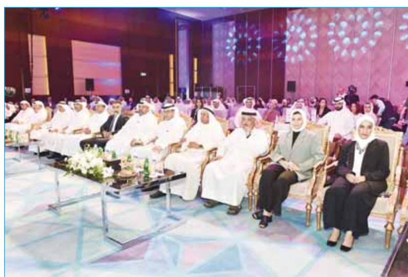
جانب من حفل الافتتاح

ودخلت الأكاديمية منذ عام 2002 في شراكات مع أكثر من 290 منظمة في 143 دولة لبناء مجتمعات رقمية ناجحة تعمل على تحسين حياة مواطنيها، وتعزيز اقتصاداتها، وتطوير إدارات عامة شفافة وديمقراطية وفعالة، وتعاونت مع مؤسسات في جميع أنحاء أوروبا الشرقية والوسطى وآسيا وأفريقيا وأميركا الوسطى.