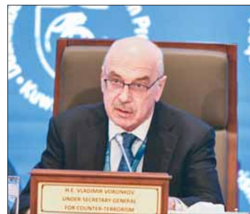
فلاديمير فورونكوف يلقي كلمته

أعرب وكيل الأمين العام لمكتب الأمم المتحدة لمكافحة الإرهاب فلاديمير فورونكوف عن الامتنان العميق للكويت وطاجيكستان على دعمهما تعزيز (عملية دوشنبه). وقال فورونكوف في كلمته خلال الجلسة الافتتاحية للمؤتمر، إن ما يزيد على 480 مشاركاً يجتمعون في الكويت اليوم ومنهم وزراء وممثلون رفيعو المستوى من الدول الأعضاء والمنظمات الدولية والإقليمية والمجتمع المدني إلى جانب مجموعات للشباب والنساء، موضحاً أن هذا التجمع يؤكد التزامنا الجماعي بالتعددية والتعاون في مكافحة الإرهاب وهدفنا المشترك لبناء حدود آمنة ومرنة لحماية السلم والأمن العالميين.