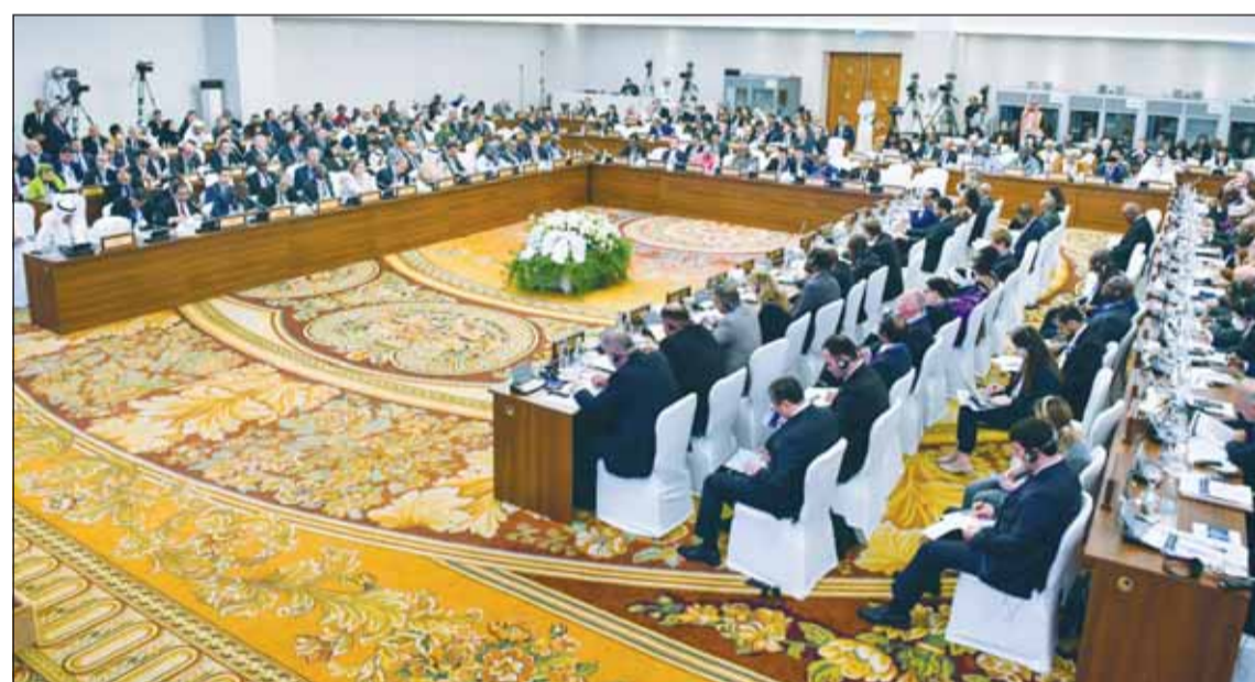
جانب من المؤتمر

لللقاء على الإرهاب والتطرف وإجتثاث جذورها، وعبر عن بالغ التقدير والشكر لكل الوفود المشاركة في هذا الاجتماع بالقيمة والأهمية والهادف إلى تعزيز التعاون في مجال مكافحة الإرهاب وبناء الآليات المرنة لأمن الحدود.