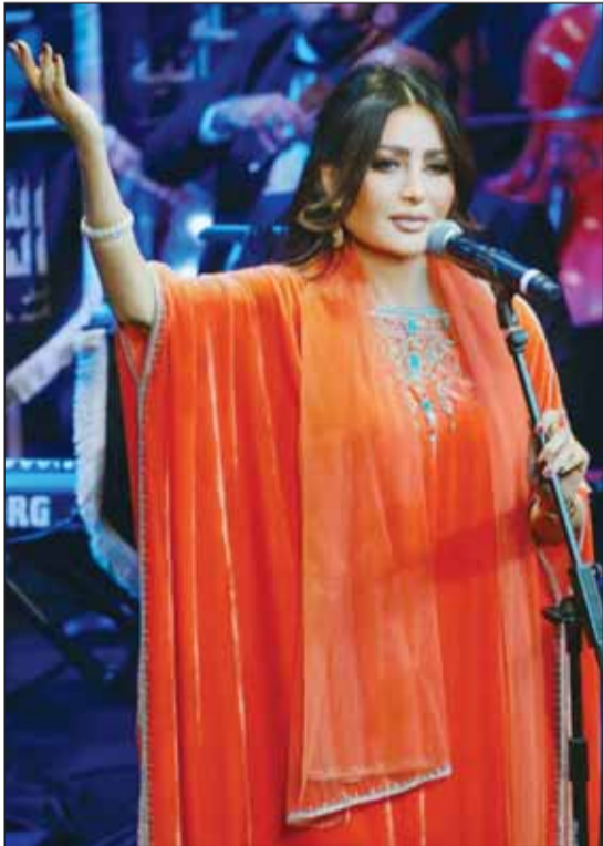
لطيفة تشارك في الليلة العمانية

كرمت سلطنة عمان، النجمة لطيفة مساء أمس، وأهدت لها شهادة تقدير وشكر، بعد مشاركتها كضييفة شرف في الليلة العمانية بمهرجان الموسيقى العربية، وهو الحفل الذي قدمت لطيفة خلاله أغنيتين هما "أشوفك"، و"الدفا"، وقدمت لطيفة فقرة استثنائية خلال الحفل، برفقة الموسيقار العماني خالد بن حمد البوسعيدي، والذي سلمها بنفسه تكريم سلطنة عمان، ووجه لها الشكر نيابة عن السفير العماني بالقاهرة. ويحسب "اليوم السابع" أيدت لطيفة سعادتها بالتكريم، مؤكدة أنها تشرفت بالمشاركة في حدث فني مهم وهو "الليلة العمانية" على هامش مهرجان الموسيقى العربية، وزادت أهميته لأنه على المسرح الكبير بدار الأوبرا المصرية، ورفقة المايسترو أمير عبدالمجيد. فيما أكد الموسيقار العماني خالد بن حمد البوسعيدي، أن سبب تأخر التكريم بعد الحفل مباشرة، يرجع لانشغال النجمة لطيفة بحفلها في دبي بمهرجان تحدي العلم، وبحضور ورعاية الشيخ محمد بن راشد آل مكتوم حاكم دبي. وأكد البوسعيدي، أنه فور عودة لطيفة من دبي إلى مصر، ذهب لتسليمها التكريم الذي تستحقه عن مسيرتها، وشكرها على المشاركة بالليلة العمانية ضمن فعاليات مهرجان الموسيقى العربية. وتستعد لطيفة لجولة عربية خلال الأيام القليلة المقبلة، إذ تحضر عدة مقابلات فنية في الكويت والأمارات، إذ تسافر أولاً للكويت لإحياء حفل كبير بمهرجان الموسيقى، ثم تتجه إلى دبي لتقديم حفل آخر، وستعلن تفاصيلها لاحقاً. جدير بالذكر أن أفر اليومات النجمة لطيفة "مقيش ممنوع" تحظى 60 مليون مشاهدة على القناة الرسمية لها بموقع الفيديوهات العالمي يوتيوب، ويواصل الألبوم حصد المزيد من المشاهدات، وهو ما أهلها للحصول على جائزة أفضل الألبوم لعام 2024 في الديريبيست، وأفضل مطربة عربية بملتقى التميز والإبداع، والذي يقام ديسمبر المقبل.