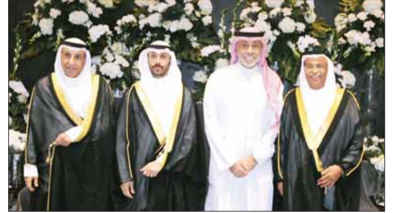
الشيخ عبدالله النواف يهنئ