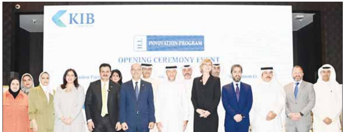
صورة جماعية خلال إطلاق البرنامج

وتابعت أنه يمكن للتجار استخدام منصة Al Tajar Pay بسرعة بدون التأثير على عملياتهم التجارية، مبيّنة أن فريق عمل البنك الأهلي الكويتي على جاهزية تامة لتقديم المساعدة والدعم المستمر، بما في ذلك خط المساعدة على مدار ساعات العمل، بهدف الرد على استفساراتهم وحل أي مشكلة قد يواجهونها.