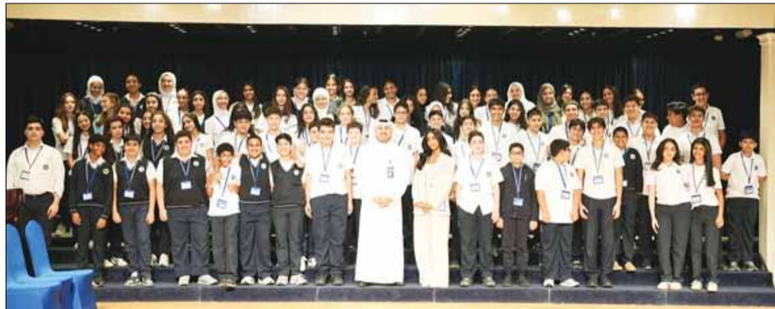
صورة جماعية للمشاركين في الجلسة

الوظيفية التي يوفرها البنك التجاري للكوادر الكويتية الشابة، منوهاً في هذا الصدد بأن جهود التجاري لا تقت عند تعيين فحسب، بل يقوم البنك بتوفير التدريب اللازم للفريجين حسب تخصصاتهم وكذلك تحديد المسارات الوظيفية للفريجين الكويتيين بحسب موهلاتهم العلمية. واختتم محمد البلاغ حديثه معرباً عن شكره للتكريم الذي حظي به التجاري