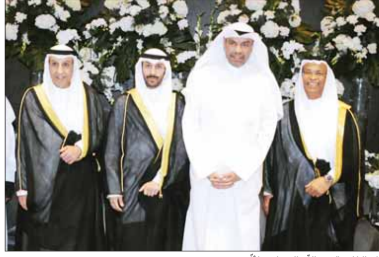
وزير الخارجية عبدالله الجبير مهنتاً