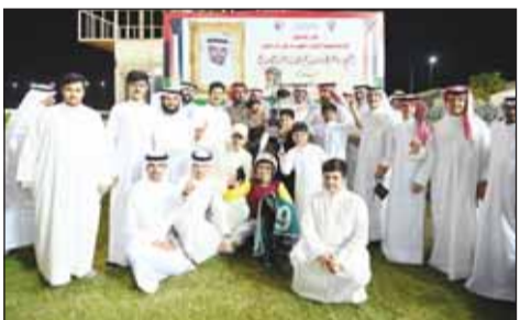
تسليم الكأس لاسطنبول العذاب

حقق "أيدي تيمبل" لاسطنبول العذاب بقيادة المدرب خالد فهد العذاب والخلايا لوسيانو، كأس المرحوم الشيخ ناصر فهد صباح الناصر الصباح، في الشوط الخامس ضمن منافسات كأس الافتتاح بخادي الصيد والفروسية، على مسافة 1400 متر بزمن 1,36,33 دقيقة. وقام الشيخ ضاري الفهد رئيس مجلس إدارة نادي الصيد والفروسية، وأمين السر العام رئيس الهيئة العليا لسباق الخيل الشيخ صباح فهد صباح الناصر بتسليم الكأس إلى عمدة الإسطنبول.