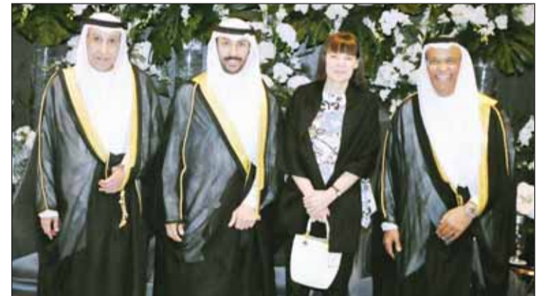
السفيرة الأميركية كارين ساساهارا تبارك