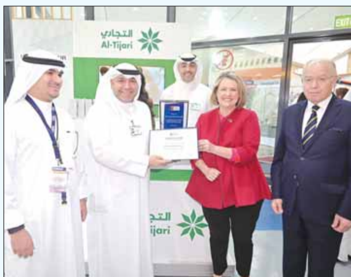
فريق "التجاري" مع سفيرة أستراليا

في إطار مسؤوليته الاجتماعية تجاه الفريجين من الشباب الكويتي الطموح، وسعيًا منه لتأكيد دوره كموسسة مصرفية تحرص على توفير فرص العمل المناسبة للطلاب والطالبات الكويتيين الدارسين والذين اتعوا من دراستهم الجامعية، شارك البنك التجاري الكويتي في معرض الفرص الوظيفية الذي أقيم في الجامعة الأسترالية بمنطقة مشرف لمدة يوم واحد.