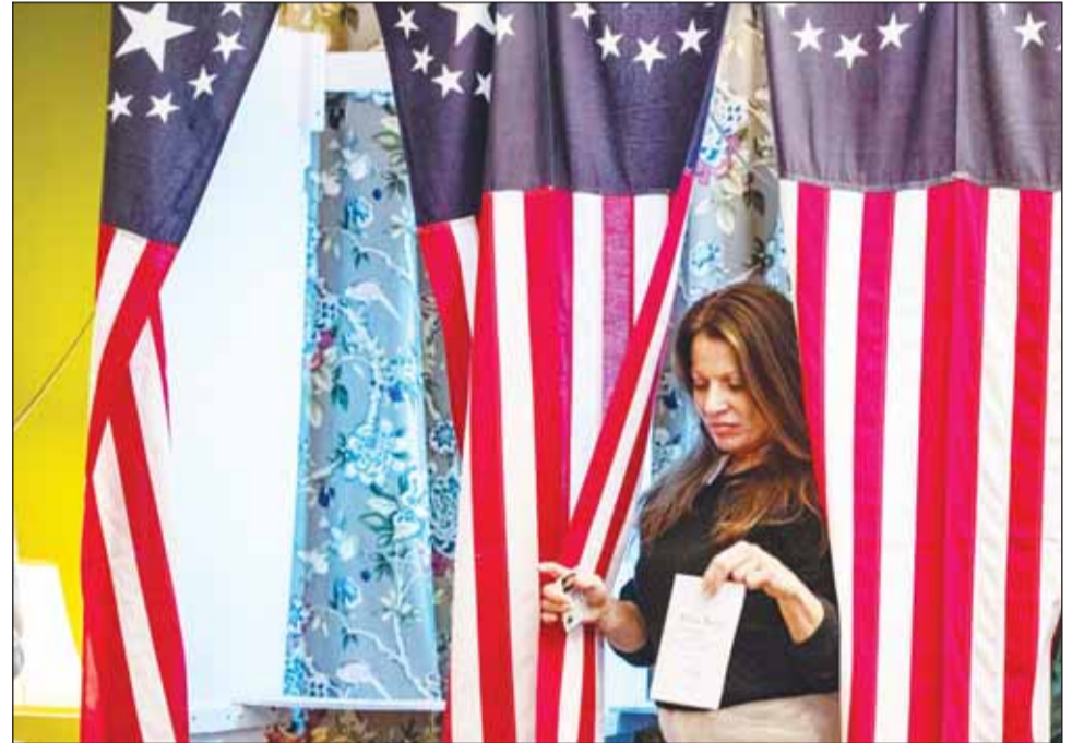
ناخبة أميركية تدلي بصوتها في الانتخابات