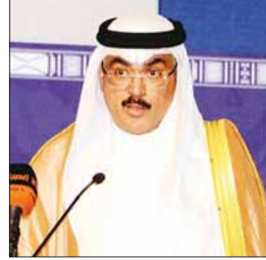
وزير التربية يلقي كلمته

أكد وزير التربية د. جلال الطبطبائي أن التعليم اليوم لم يعد يقتصر على نقل المعرفة، بل أصبح يشمل تطوير المهارات المعرفية والقدرة الابتكارية والإبداعية، التي تمكن أبنائنا من التكيف مع متطلبات العصر الجديد.