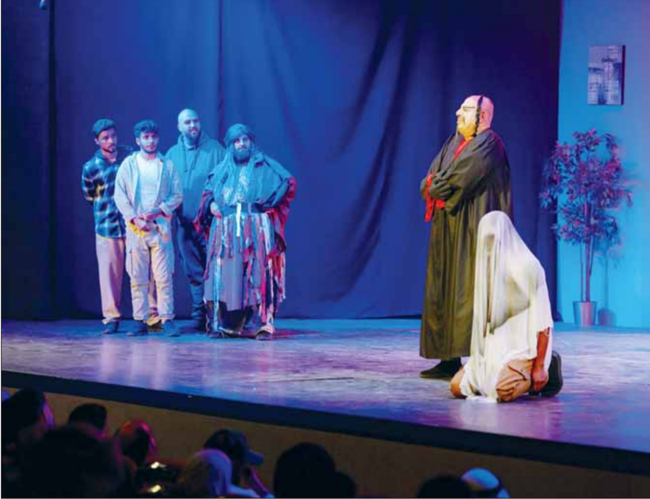
مشهد من مسرحية "قضية غير محلولة"