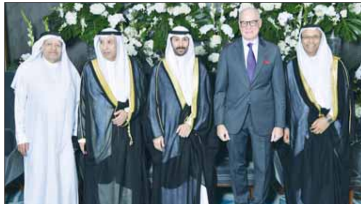
سفير اليونان يوانيس بلوتاس مهنتاً