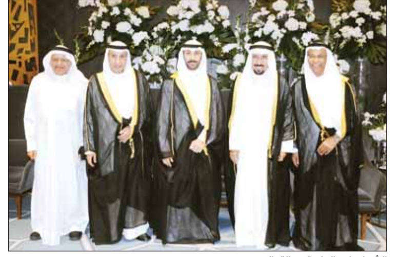
الشيخ علي الجابر قدم التهاني