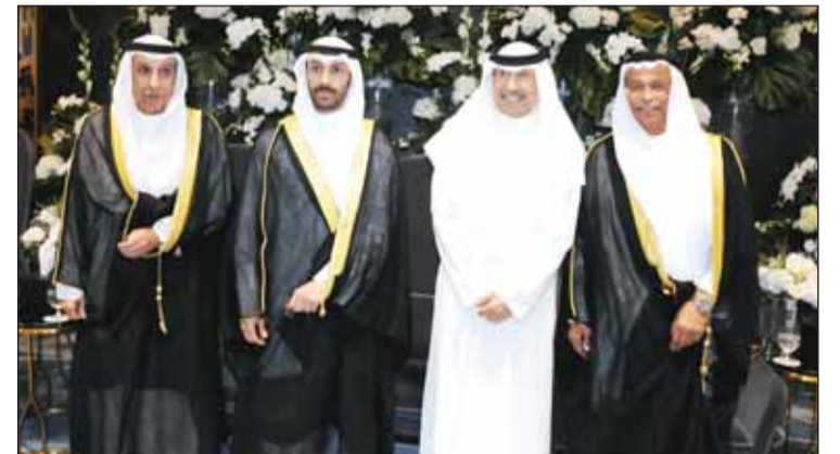
فهد البحر قدم التهاني