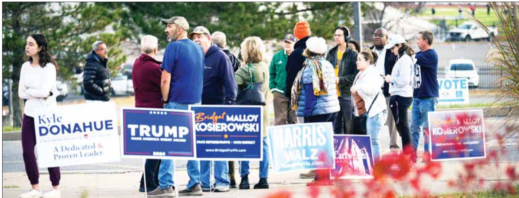
ناخبون أميركيون ينتظرون في طابور للإدلاء بأصواتهم في الانتخابات الرئاسية بمدينة سكرانتون الثانوية في سكرانتون بولاية بنسلفانيا

جيدة لاستعادة الأغلبية في مجلس الشيوخ حيث يحظى الديمقراطيون حاليا بأغلبية 51 مقابل 49، لكن قد يفقد الجمهوريون أيضا الأغلبية في مجلس النواب حيث لا يحتاج الديمقراطيون إلا إلى الفوز بأربعة مقاعد لاستعادة السيطرة على المجلس الذي يضم 435 مقعدا. وكما هو الحال في الانتخابات الرئاسية، من المرجح أن تحدد شريحة صغيرة من الناخبين النتيجة، وتعتمد معركة مجلس الشيوخ على سبع منافسات، أما مجلس النواب فالسباق على أقل من أربعين مقعدا هو الذي تحتمد فيه المنافسة حقا، ولا يشير الناخبون على ما يبدو إلى تفضيل واضح لأي من الحزبين، حيث أظهر استطلاع للرأي أجرته "رويترز- إيسوس، في أكتوبر أن 43 في المئة من الناخبين المسجلين سيؤيدون المرشح الجمهوري في منطقتهم، كما سيؤيد 43 في المئة منهم أيضا المرشح الديمقراطي والديمقراطيون في موقف دفاعي وهم يحاولون الاحتفاظ بأغليبتهم في مجلس الشيوخ، الذي يشغل أعضاؤه المقعد لولاية مدتها