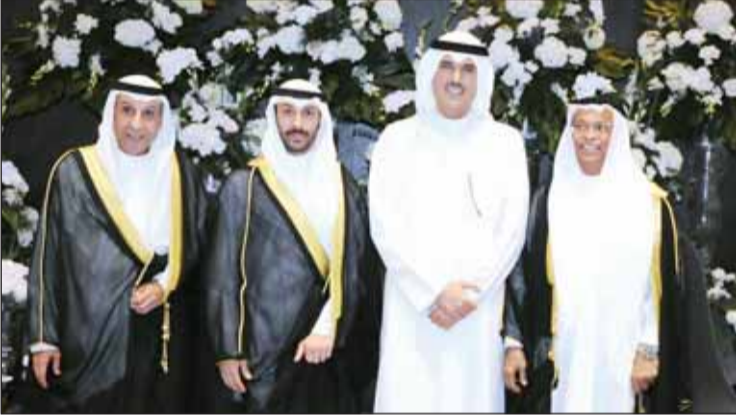
الشيخ حمود جابر الأحمد يبارك