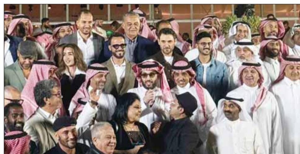
تركي آل الشيخ مع النجوم في افتتاح ستيديوهات الحصن

دشّن المستشار تركي آل الشيخ، رئيس مجلس إدارة الهيئة العامة للترفيه ستيديوهات "الحصن بيغ تايم - AlHisn Big Time Studios"، غرب العاصمة الرياض. وتعد الستيديوهات، التي بُنيت في فترة قياسية قصيرة، تقدّر بـ 120 يوماً، وأمّدة من أكبر وأحدث قاعات الإنتاج السينمائي والتلفزيوني في الشرق الأوسط. وتضمّ المنطقة سبعة مبان ستيديوهات على مساحة 10,500 متر مربع، ضمن رقعة المشروع التي تبلغ 300 ألف متر مربع، إضافة إلى قبة إنتاج تحتوي على ورش للنجارة والمعاداة وتصنيع الأزياء.