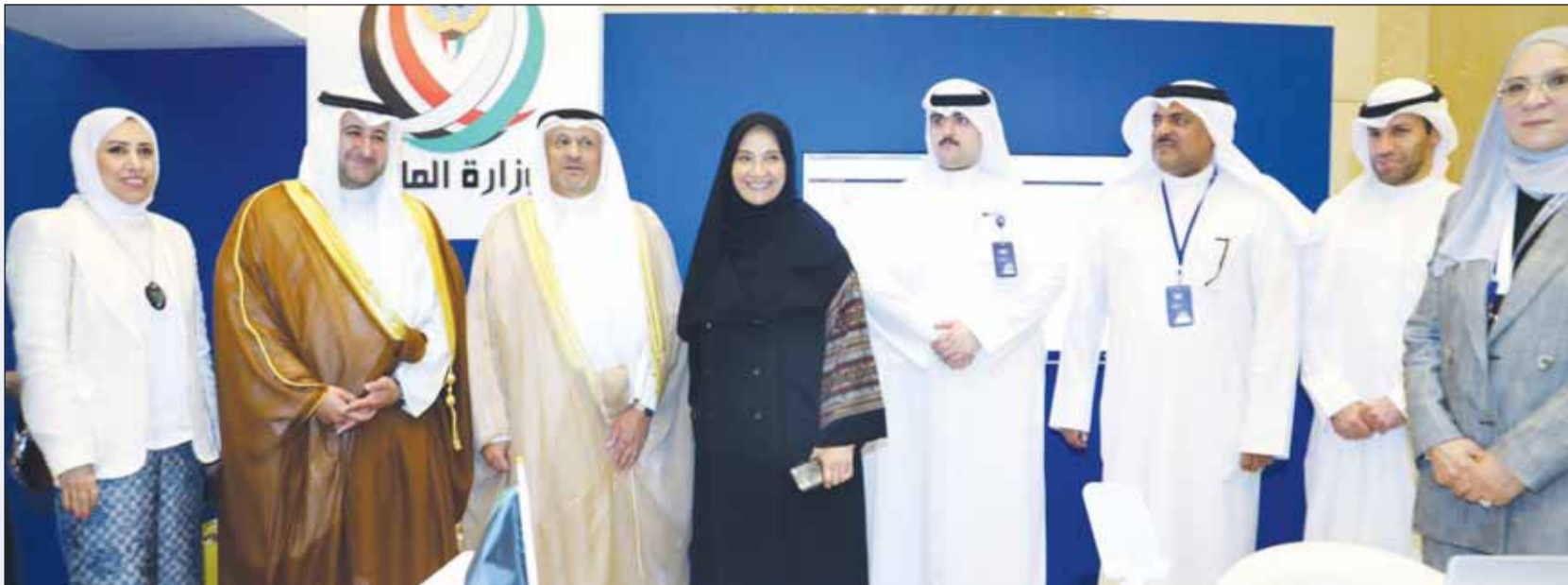
الوزير العمر ووكيل وزارة الدفاع الشيخ عبدالعزيز مشعل الصباح مع جناح وزارة المالية