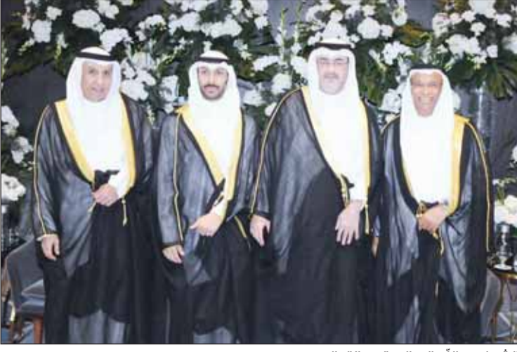
الشيخ عبدالله السالم قدم التهاني