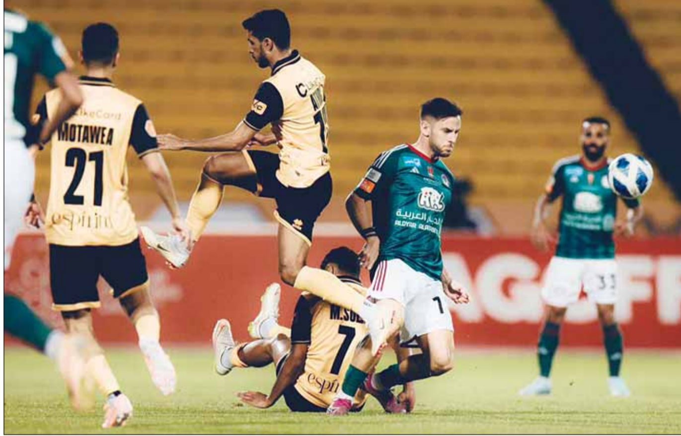
تسابق للسيطرة على الكرة