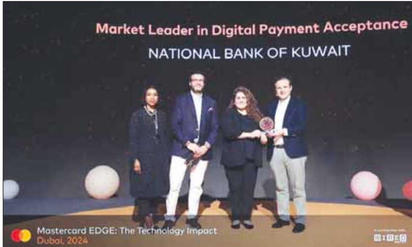
صورة خلال تسلم الجائزة

وستعزز هذه الجائزة من جهود البنك لمواصلة الابتكار وتوسيع نطاق بصمته الرقمية ومساهمته في تحقيق الازدهار الاقتصادي في الكويت. ويعد الإنجاز الجديد الذي حققه بنك الكويت الوطني بتتويجه بجائزة "الريادة في حلول الدفع الرقمي" من ماستر كارد، شهادة على التزام وتعاون فريق العمل بأكمله، وجهوده الدؤوبة في مواصلة التكيف والابتكار في مشهد مالي سريع التطور، كما يعكس هذا التكريم من ماستر كارد التزام "الوطني" بتوفير تجارب دفع سلسة وأمنة وشاملة، ويبرهن على مدى تفاني كوادره البشرية وما يحظى به من ثقة لدى عملائه. ومع استمراره في دفع مسيرة الابتكار، يواصل البنك تركيزه على دعم الشركات في رحلتها نحو التحول الرقمي والمساهمة في بناء منظومة مالية أكثر ترابطاً في الكويت.