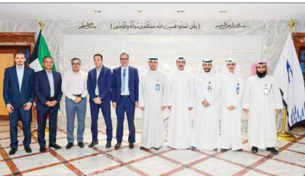
الكابتن عبد المحسن الفقعان متوسطاً وفد "أماديوس"

أعلنت شركة الخطوط الجوية الكويتية عن تعزيز الشراكة مع شركة أماديوس، المتخصصة في تقديم خدمات وطول التكنولوجيا والابتكار لشركات الطيران، وذلك لتطوير آلية وعملية الحجز الإلكتروني للركاب المسافرين على متن طائرات الخطوط الجوية الكويتية. وبهذا الصدد، قال رئيس مجلس إدارة الخطوط الجوية الكويتية الكابتن عبدالمحسن سالم الفقعان، "يسر الخطوط الجوية الكويتية أن تعلن عن تعزيز الشراكة مع أحد أهم وأكبر الشركات المتخصصة في تزويد شركات الطيران بأحدث التقنيات والتقنيات الخاصة بقطاع النقل الجوي في العالم وهي شركة أماديوس، حيث ستقوم أماديوس بتطوير آلية الحجز الإلكتروني لمسافرين الكرام عبر عملية مبسطة وسهلة". وأضاف الفقعان، "بإمكان عملاء الخطوط الجوية الكويتية الآن حجز رحلاتهم بسهولة في ثلاث خطوات بسيطة فقط، حيث تم تصميم عملية الحجز وتحسينها لخدمة العملاء على أكمل وجه ودون تعقيدات تذكر، إضافة إلى تزويدهم بالمعلومات الأساسية اللازمة لاتخاذ قرارات سليمة وبسرعة".