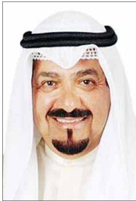
سمو رئيس الوزراء الشيخ أحمد العبدالله