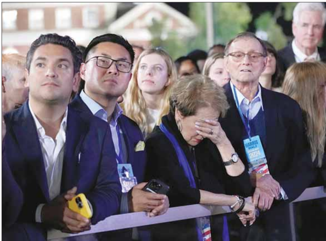
علامات الهجوم تبدو علمه مؤيدمة نائبة الرئيس الأميركي كاملا هاريس وهم يتابعون النتائج في مقر الحملة الانتخابية لهاريس

وعلى مدار نحو ثماني سنوات، مرت العلاقات الأميركية الخليجية بمنعطفات مختلفة وتحولات كان حجر زاويتها الرئيس الأميركي القاطن في البيت الأبيض وسياساته تجاه دول الخليج، فبين وجود ترامب وبايدن في سدة الحكم تشكلت العلاقات بين البيت الأبيض والتكلم الخليجي وفقاً لمصالح اقتصادية وسياسية تدعم الجانبين، وخلال فترته الأولى، سعى ترامب لإنشاء كتل خليجي في وجه إيران "المارقة" من وجهة نظره، والدفع باتجاه تطبيع دول المنطقة للعلاقات مع دولة الاحتلال بشكل غير مسبوق، والاعتراف بالقدس المحتلة عاصمة لإسرائيل، ويتوقع أن يواصل الضغط تجاه إعطاء دفعة قوية لملف التطبيع في ولايته الجديدة، خصوصاً مع السعودية، رغم كل ما جرى من حرب إبادة جماعية في غزة على مدى شهر طويلاً من طرف جيش الاحتلال، ورغم تطابق مواقف الإدارات الأميركية السابقة مع المبادرة العربية التي طرحها السعودية عام 2002، والتي حظيت بإجماع عربي، فإن الانحياز الأميركي إلى الاحتلال الإسرائيلي خلال حرب غزة أدخل العلاقات بين الجانبين في اختبار صعب.