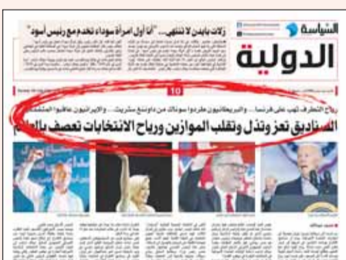
صورة فوتوية من تحليل نشرته "السياسة" في يوليو الماضي

واشنطن، عواصم - وكالات، لايمكن النظر إلى مفاجأة نتائج الانتخابات الأميركية المدوية بمعزل عما دار قبل شهر في فرنسا وبريطانيا ومروراً بإيران ووصولاً إلى الولايات المتحدة، حيث يبدو أن صناديق الاقتراع وإرادات الناخبين في طريقها إلى فرض واقع عالمي جديد تحركه رياح قوية تدفع نحو التغيير وتقتلع أوضاعاً ظلت راسخة لأعوام طويلة، ولم تعد قادرة على الصمود، ففي فرنسا قلبت نتائج الانتخابات في يوليو الماضي