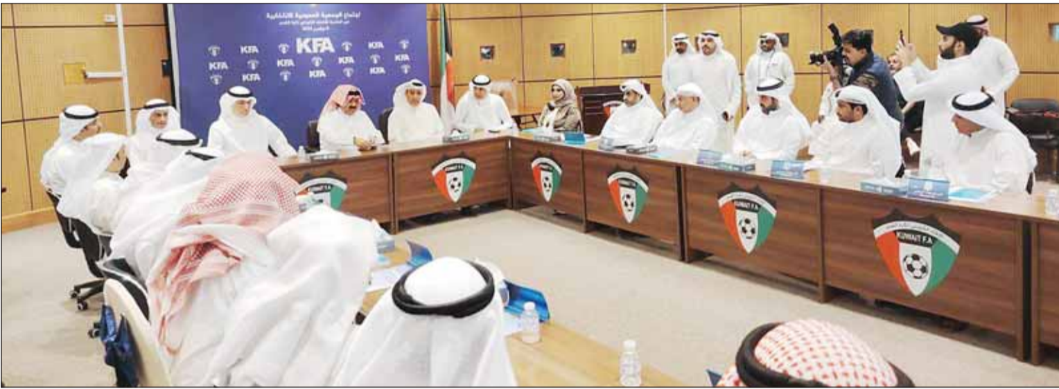
رئيس الاتحاد الشيخ أحمد اليوسف مترشاً الاجتماع