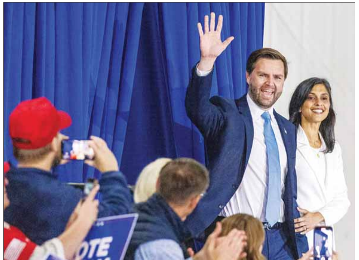
نائب الرئيس الأميركي المنتخب جيم دي هانس وزوجته يحتفلان