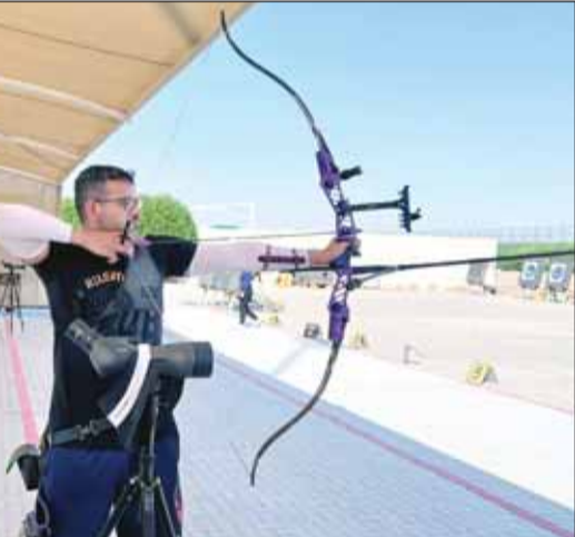
قوس البالود جاهز للبطولة