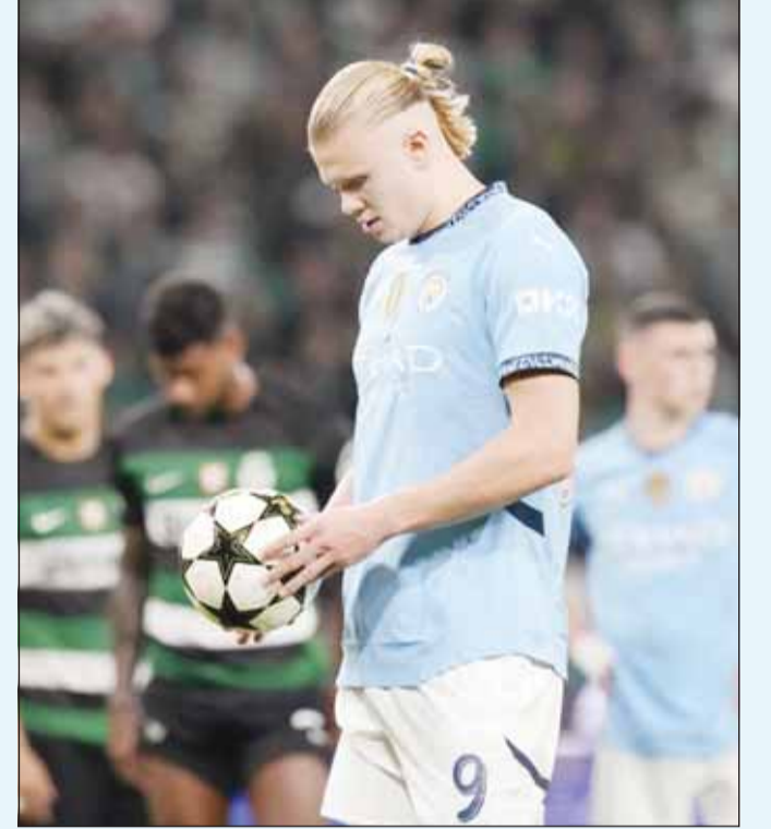
سقوط منزل للسبت أمام لشبونة

أكد بيب غوارديولا، المدير الفني لمانشستر سيتي الإنجليزي، أن تركيزه منصب حالياً على قيادة فريقه للعودة لطريق الانتصارات بعد الخسارة 1-4 أمام سبورتنغ لشبونة البرتغالي في دوري أبطال أوروبا. وكانت هذه هي أول خسارة للفريق في دوري أبطال أوروبا هذا الموسم، والهزيمة الثالثة في أسبوع لمانشستر سيتي بعد خسارتين 1-2 أمام توتنهام وبورنموث في كأس الرابطة والدوري الإنجليزي الممتاز. كما تعد المرة الأولى التي يخسر فيها فريق غوارديولا ثلاث مباريات متتالية منذ أبريل 2018. وفي حديثه لوسائل الإعلام بعد المباراة، قال غوارديولا إن تركيزه وطاقته موجهان فقط لمساعدة لاعبيه على إيقاف سلسلة الهزائم. وأوضح، إنه تحد صعب لكنني هنا، سيكون موسمنا صعباً كنا نعلم ذلك منذ البداية، لكن هذا هو الأمر، أنا أحب ذلك وأريد مواجهته ورفع معنويات لاعبي فريقتي. وزاد، هذه هي الحياة. ربما كان التعويض بلقب الدوري الإنجليزي ست مرات في آخر سبع سنوات من بينهم أربع تتويجات متتالية هو أمر استثنائي. أحياناً تخسر. وأكد، لعبنا بشكل سيئ جداً ضد بورنموث ولكننا لعبنا بشكل جيد اليوم، يجب أن أحاول إيجاد تفسير، لكن أحياناً يكون الأمر مجرد كرة قدم، ويجب أن نقبل ذلك. هذه هي الرياضة، يجب على الجميع أن يكون أفضل وسنجد الحل". وختم غوارديولا، ننافس على جميع البطولات، وسنستمر. سنعود إلى مانشستر للتحضير للمباراة ضد برايتون، لن نستسلم، ربما ينتظر الناس ذلك ولكنني لن أستسلم.