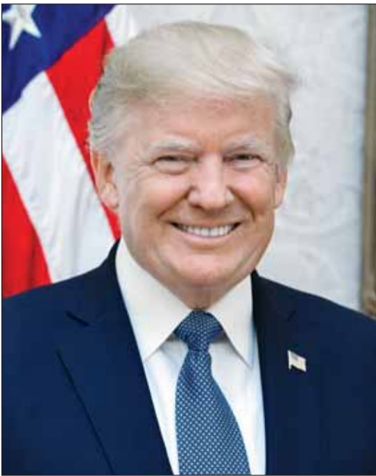
الرئيس الأميركي المنتخب دونالد ترامب