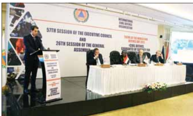
المقدم العميد متحدثاً بالندوة 26 للجمعية العامة للحماية المدنية