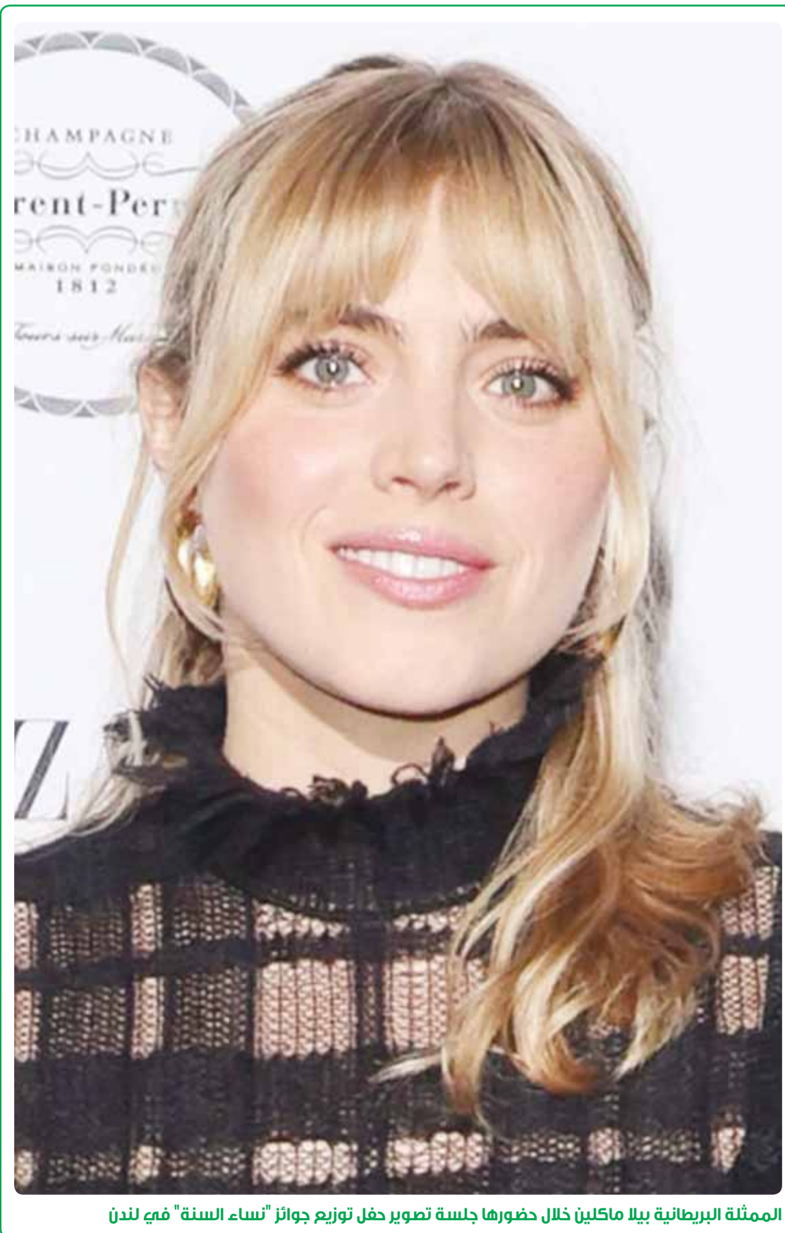
الممثلة البريطانية بيلا ماكليين خلال حضورها جلسة تصوير حفل توزيع جوائز "نساء السنة" في لندن

القاهرة - وكالات، فيما وصفها البعض بـ"عقوبة مغلظة تكاد تكون غير مسبوقه بهدف الردع وحماية المجتمع"، قضت محكمة جنايات مدينة نجع حمادي، جنوب مصر، بمعاقبة شاب بالسجن المشدد 15 عاماً، بتهمة ابتزاز امرأة وتهديدها عبر تطبيق "واتساب". وطالب الشاب المجني عليها بدفع مبلغ قدره عشرة آلاف جنيه، وإلا سينشر ما لديه من صور لها. وتعود أحداث القضية إلى ديسمبر عام 2022، عندما وجهت جهات التحقيق للمتهم تهمة ابتزاز وتهديد المجني عليها، عبر تطبيق إلكتروني، وكشفت التحقيقات عن أن المتهم هدد المجني عليها كتابياً، بإرسال رسائل نصية تؤكد جديته في التنفيذ إذا لم تخضع لمطالبه.