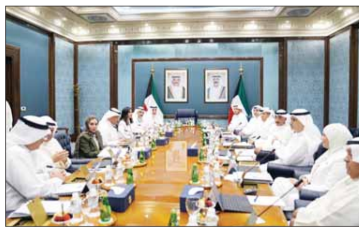
رئيس الوزراء بالإدارة وزير الدفاع ووزير الداخلية الشيخ فهد اليوسف مترئسا الاجتماع