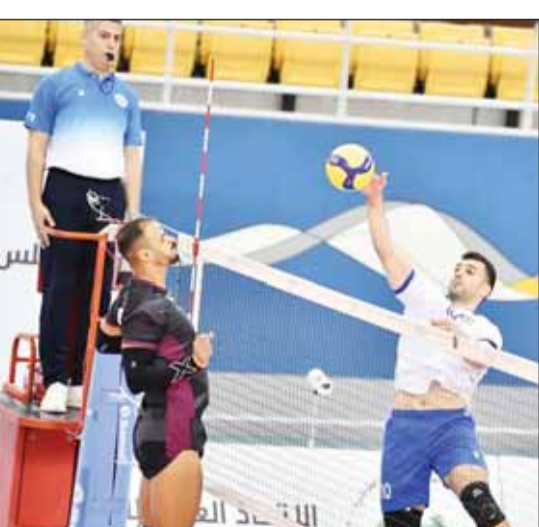
ظهور كبير للأزرق أمام عمان اليوم

وامتل "أزرق الطائرة" المركز الثاني في ختام مباريات المجموعة الثانية بالدور التمهيدي من "العربية" برصيد خمس نقاط، خلف منتخب قطر المتصدر، حيث فاز "الأزرق" على الأردن والسعودية وفسر من قطر. ويسعى أزرق الطائرة لتحقيق الفوز من خلال عرض جيد طمعا في الصعود للدور نصف النهائي في البطولة وذلك عبر بوابة منافسه العماني الطامع