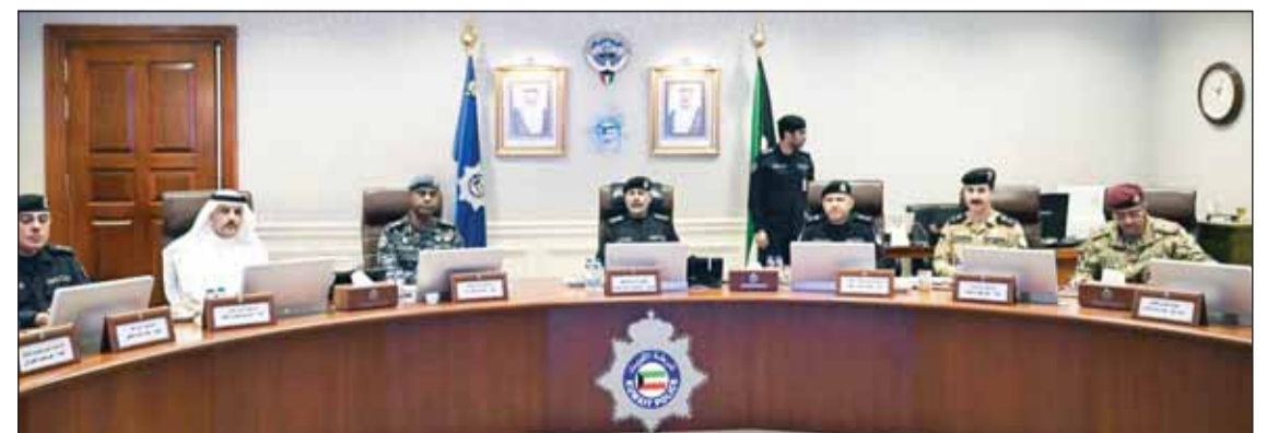
وكيل وزارة الداخلية الشيخ سالم النواف مترأساً الاجتماع الأمني

ترأس وكيل وزارة الداخلية رئيس اللجنة الأمنية الفريق الشيخ سالم النواف أمس اجتماعاً أمنياً في إطار التحضيرات والاستعدادات لمؤتمر القمة للمجلس الأعلى لمجلس التعاون لدول الخليج العربية في دورته الـ 45 الذي سيعقد بدولة الكويت في الأول من شهر ديسمبر المقبل. وذكرت وزارة الداخلية - في بيان صحفي - أن النواف استمع خلال الاجتماع إلى تقارير مفصلة عن محاور الخطة الأمنية للقمة والمهام والواجبات المنوطة لكل وحدة من الوحدات العاملة ودور كل منها في الحماية والتأمين والسيطرة والوقاية في إطار التنسيق والعمل الميداني المشترك مع جميع الأجهزة المعنية.