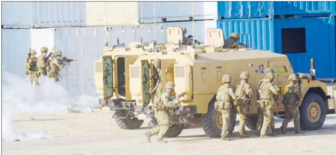
هجوم بالآليات والأفراد للتعامل مع الإرهابيين في الأماكن المبنية

السفيرة لويس: التمرين إشارة إلى التزام بريطانيا الدائم بأمن الكويت | الفرغان: "الدرع الحديدي" انعكاس للعلاقة الوطيدة بين الكويت وبريطانيا