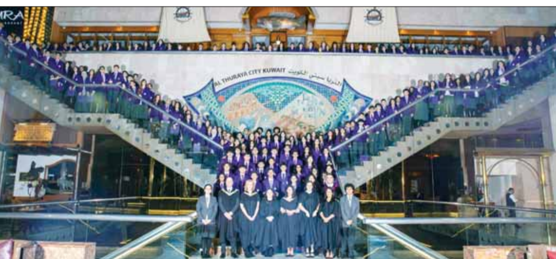
هيئة التدريس والطلبة المكرمون في لحظة تكاربية