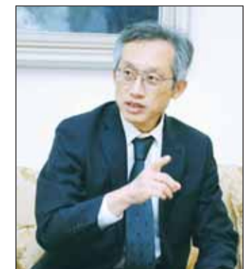
السفير الياباني مورينو ياسوناري

الشراكة الشاملة في عام 2016. وأكد ياسوناري أن تجارة النفط تشكل حجر الزاوية في العلاقات الثنائية بين البلدين، حيث شرعت اليابان في استيراد النفط الخام من الكويت حتى قبل إقامة العلاقات الدبلوماسية في عام 1958، ومنحت الحكومة الكويتية امتيازاً لشركة الزيت العربية- اليابانية لاستكشاف وتطوير احتياطيات