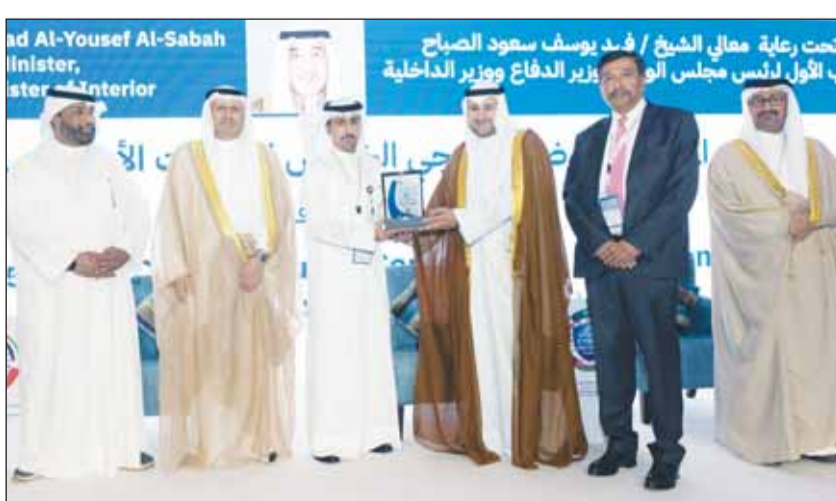
تكريم البنك خلال المؤتمر

المهم الذي جمع قادة السوق وصنّاع القرار في دول مجلس التعاون الخليجي بهدف مشترك يتمثل في وضع استراتيجية إقليمية للتصدي للهجمات السيبرانية وسرقة البيانات من خلال الاستفادة من أحدث تقنيات الأمن السيبراني وأنظمة إدارة المخاطر. ومن منطلق ريادتنا في مجال الأمن السيبراني والمصرفي، سررنا بمشاركة رويتنا ونجاننا في حماية بيانات عملائنا من عمليات الاحتيال ومحاولات النصب، تحت إشراف وتوجيه بنك الكويت المركزي. كما سلطنا الضوء على الجهود المشتركة الرامية إلى الحفاظ على استقرار القطاع المصرفي الكويتي".