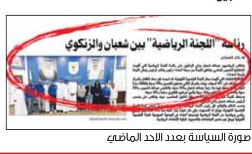
صورة السياسة بعدد الادم الماضي