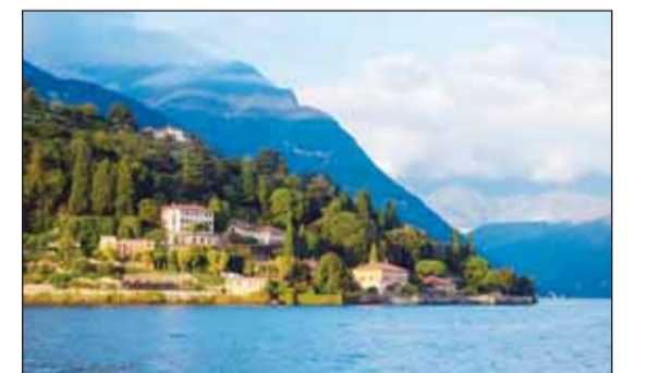
بحيرة كومو الإيطالية

روما - وكالات، تقدم بحيرة كومو الإيطالية، المعروفة بجمالها الخلاب وفيلاتها الفاخرة، تذكاراً غير تقليدي للسياح، وهو عبارة عن علب محكمة الإغلاق تحتوي على "هواء بحيرة كومو" بـ11 دولاراً أميركياً للعلبة الواحدة. وتسوق هذه العلب كفرصة لاقتناء "نسمة من النقاء" من واحدة من أجمل بحيرات العالم، ونشر موقع "إن بي سي نيوز" الأميركي، أن هذه العلبة تهدف إلى منح الزوار فرصة لاستعادة لحظات من الهدوء والجمال. وتتوافر العلب حصرياً في المتاجر المحلية حول بحيرة كومو فقط، كوسيلة للترويج لزيارة المنطقة، وتشتهر البحيرة الواقعة على بُعد 50 ميلاً شمال ميلانو، بجذبها للمشاهير والزوار الأثرياء من حول العالم. ورغم استحسان البعض لفكرة التذكار الطريفة، أعرب آخرون عن انتقادهم للمنتج، معتبرين بيع الهواء المعبأ "فكرة قديمة".