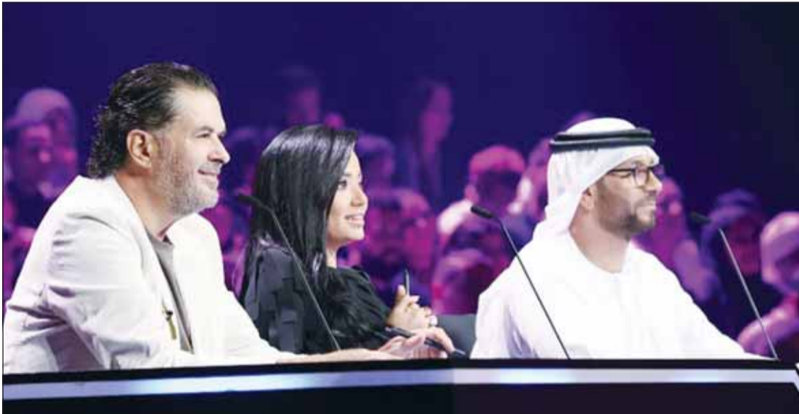
مع أعضاء لجنة التحكيم الفنانة رحمة رياض والفنان راغب علامة