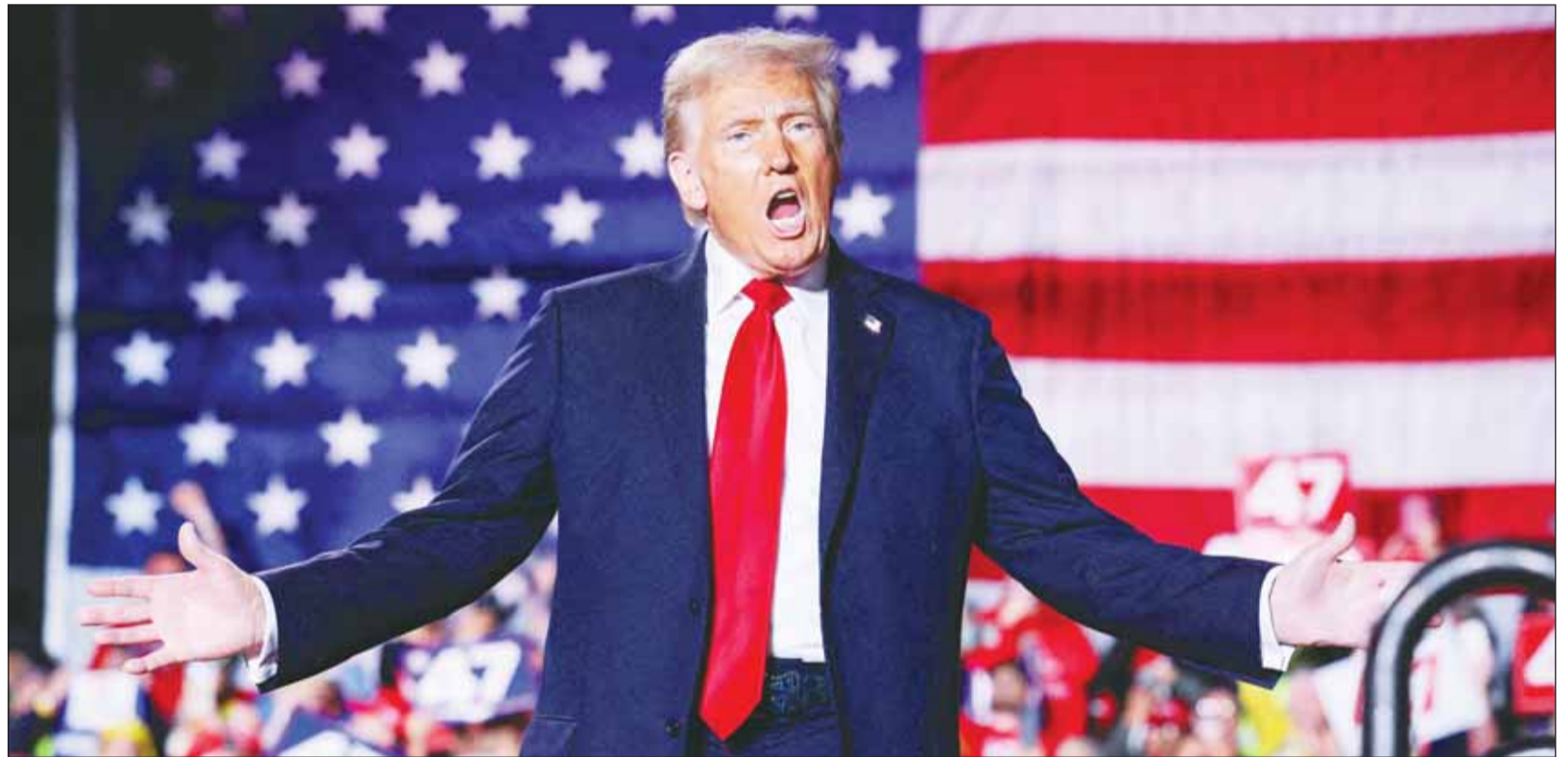
الرئيس الأميركي المنتخب دونالد ترامب