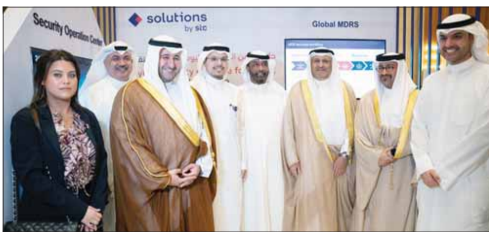
الوزير عمر العمر خلال زيارته لجناب stc

المتنام للجهات السيبرانية والأهمية المتزايدة لحماية البيانات الحساسة والبنية التحتية الرقمية. وضم الحدث متحدتين دوليين رفيعي المستوى ومناقشات خبراء وعارضين يعرضون حلول الأمن السيبراني المتطورة.