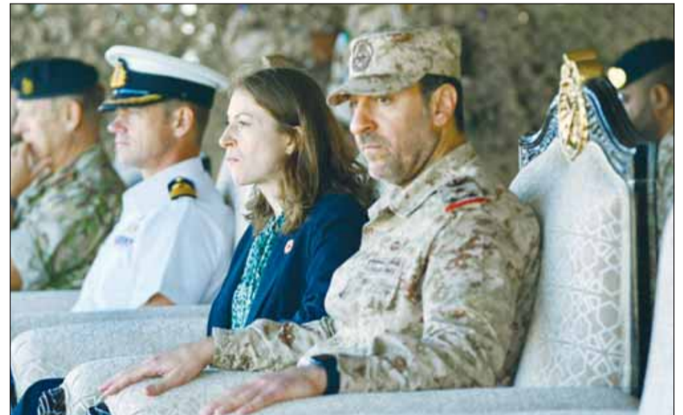
السفيرة البريطانية بليندا لويس وأمر اللواء العميد ركن براك الفرغان والعميد ركن جافين ثومبسون

وأفاد العميد ثومبسون أن التمرين ساهم في تعزيز التواصل الثقافي والروابط المتصلة من خلال تبادل المعرفة ومشاركة المهارات في مجال التدريب على الأسلحة وإطلاق الذخيرة الحية وتنفيذ دوريات المراقبة والحراسة والعمليات الليلية والعمليات في المناطق المبنية واستخدام الطائرات المسيرة بدون طيار. وأضاف أن تنفيذ العمليات المشتركة مع اللقضاء يعمل على تعزيز القدرات التشغيلية لدى الجميع، إذ يعتبر تمرين "الدرع الحديدي" مثالاً حياً على التزام المملكة المتحدة بالعمل جنباً إلى جنب مع شركائها لضمان تحقيق الاستقرار في المنطقة. حضر فعاليات ختام التمرين عدد من كبار الضباط القادة من كلا الجانبين.