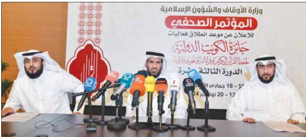
جانب من المؤتمر الصحفي للإعلان عن انطلاق جائزة الكويت الدولية لحفظ القرآن الكريم

وأضاف أن الجائزة تستضيف 85 مشاركة دولية من متسابقين ولجنة تحكيم، لافتاً إلى أن إجمالي عدد المشاركين حتى الآن 127 متسابقاً من 75 دولة بينهم 75 متسابقاً في فرع الحفظ و16 في فرع القراءات و13 في