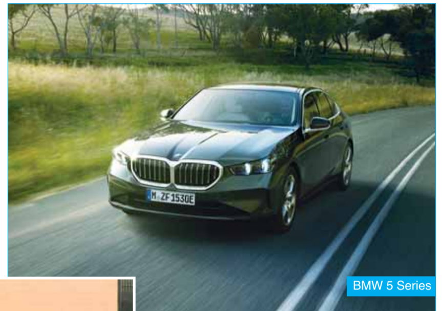
BMW 5 Series