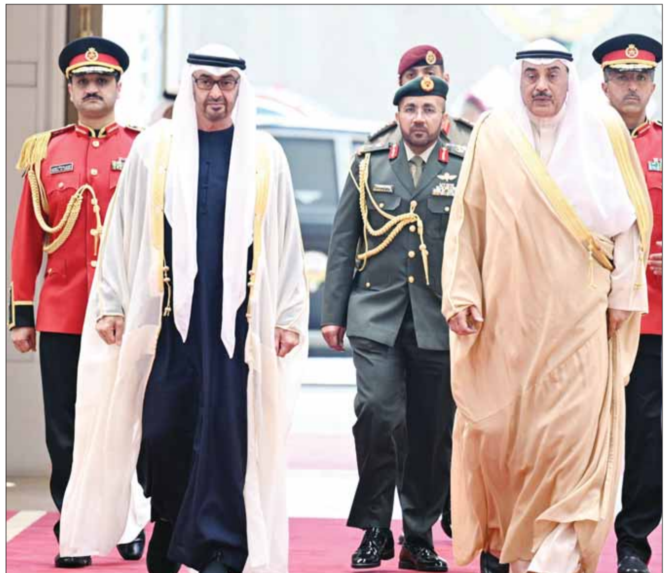
سمو ولي العهد الشيخ صباح خالد فودع رئيس الإمارات الشيخ محمد بن زايد

وكان على رأس مودعي سموه على أرض المطار إخوه سمو ولي العهد الشيخ صباح خالد، ورئيس مجلس الوزراء (بالإنابة) وزير الدفاع ووزير الداخلية الشيخ فهد اليوسف، ونائب رئيس الحرس الوطني الشيخ فيصل النواف، ووزير شؤون الديوان الأميري الشيخ محمد عبدالله، ووزير الخارجية عبدالله الجعيا وكبار المسؤولين بالدولة.