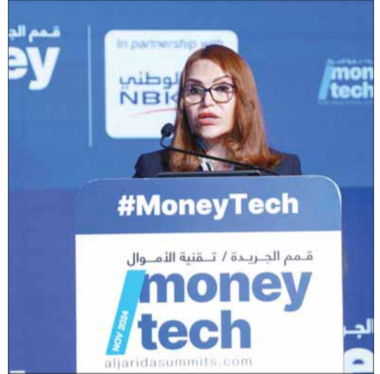
شيخة البحر متحدثه خلال القمة

يعني أننا نفتقد إلى مجموعة واسعة من المواهب وتنوع الفكر والخبرة التي يمكن أن تؤدي إلى أفكار رائدة، موضحة أن الأبحاث تشير إلى أسباب متعددة لهذه القفوة، إذ إن الصور النمطية، وضغوط الأقران، والافتقار إلى النماذج النسائية، عوامل قد تؤدي إلى اعتقاد الفتيات بأن العلوم والتكنولوجيا والهندسة والرياضيات ليست من اختصاصهن، على الرغم من أدائهن الجيد في هذه المجالات.