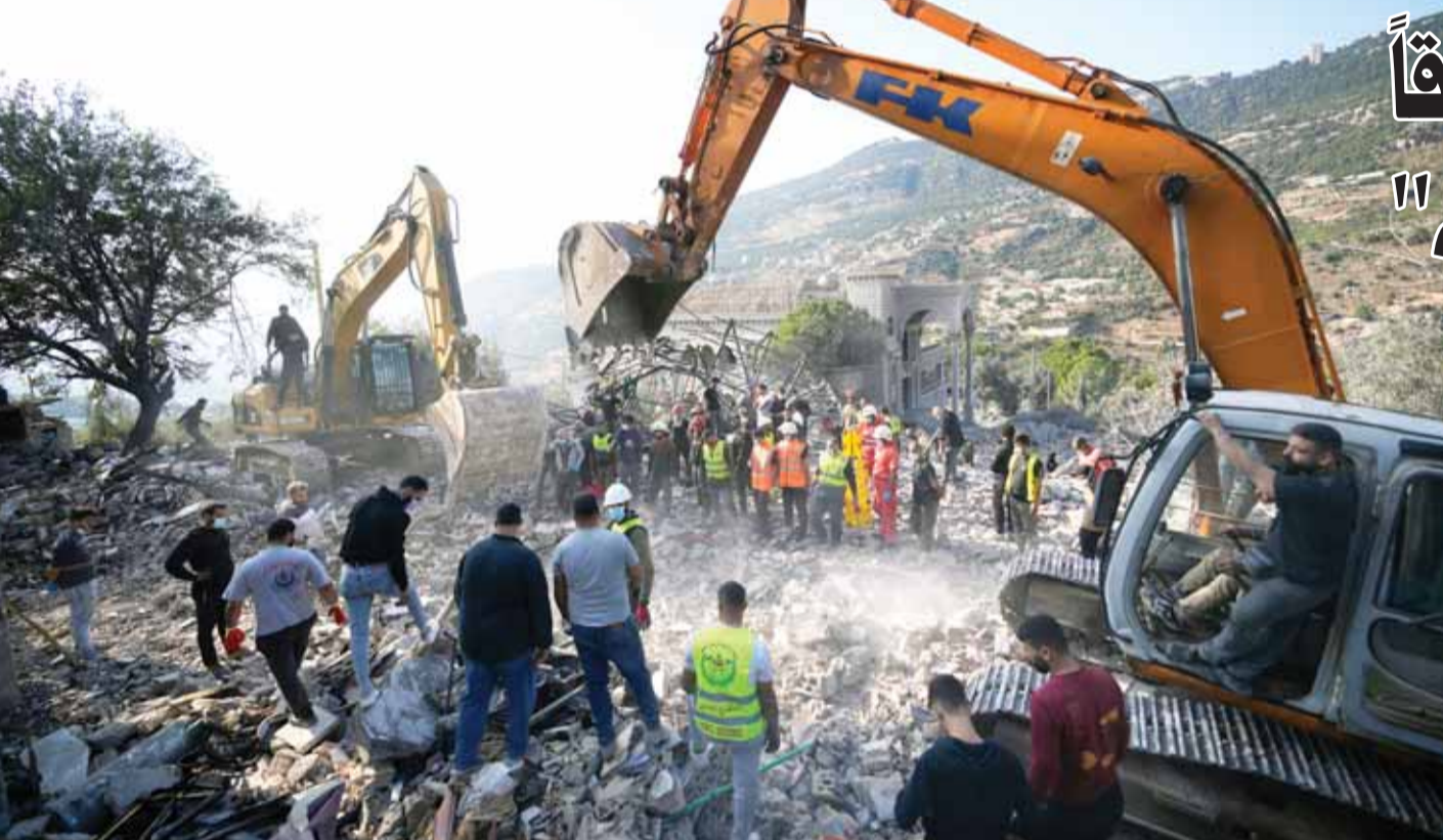
عمال الإنقاذ اللبنانيون يبحثون عن ناجين تحت أنقاض منزل مدمر أصيب فيه غارة جوية إسرائيلية في قرية علمات بشمال لبنان