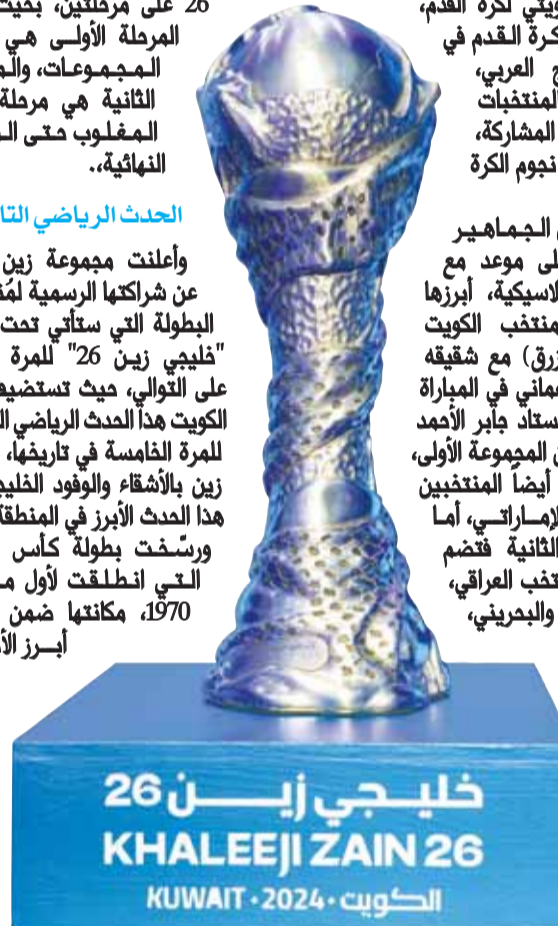
خليجي زين 26 KHALEEJI ZAIN 26 الكويت 2024