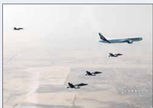
سرب طائرات حربية كويتية يرافق طائرة ضيف الكويت الكبير

رافق سرب من الطائرات الحربية الكويتية طائرة رئيس دولة الإمارات العربية المتحدة سمو الشيخ محمد بن زايد فوق الأجواء الكويتية.