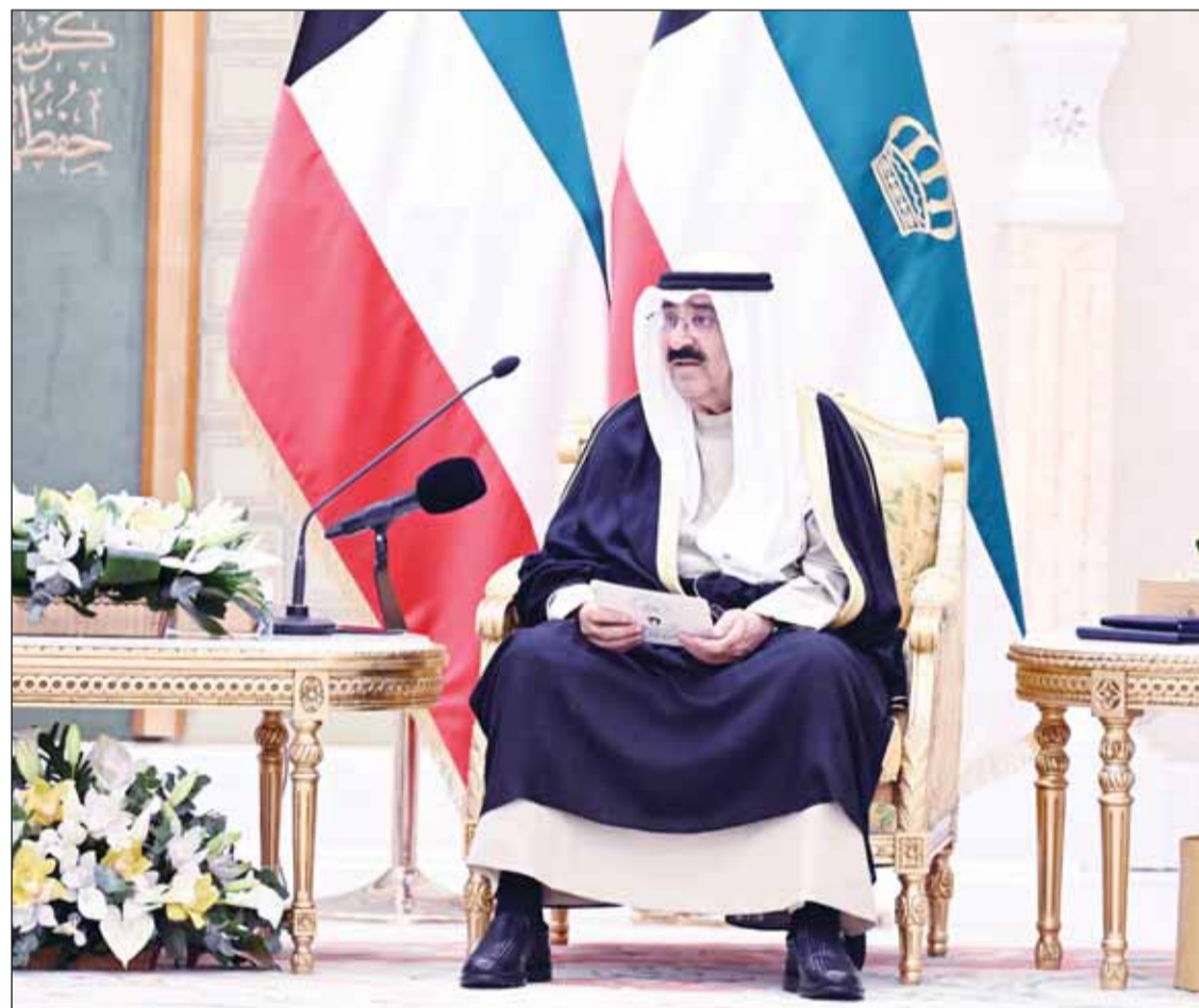
سمو أمير البلاد الشيخ مشعل الأحمد يلقي كلمته خلال جلسة المباحثات

السابقين (رحمهم الله جميعاً) وتواصل للروابط التي تجمع بلدينا وشعبينا، مريصين على المضي بها في حاضر مشرق ونحو مستقبل واعد، سواء على المستوى الثنائي، من خلال اللجنة المشتركة الكويتية-الإماراتية، وما تقوم به من تنسيق في المجالات كافة، لاسيما الاقتصاد والاستثمار والتبادل التجاري، أو من خلال البيت الخليجي الواحد ومسيرة مجلس التعاون لدول الخليج العربية، بما يحقق مصالح بلدينا وصالح شعبينا.