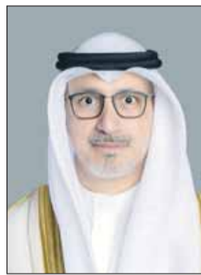
الوزير خليفة الجبير

□ الديون أثقلت كاهل الصيادين والقرارات غير المدروسة ستقضي على مهنة الصيد