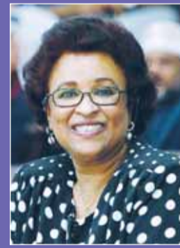
الشيخة نعيمة الاحمد

ينظم نادي سلوى الصباح، البطولة الودية الثالثة لكرة اليد للسيدات في الفترة من 17 حتى 22 نوفمبر الجاري، ويشارك في البطولة الفريق الأول لكرة اليد في نادي سلوى الصباح إلى جانب منتخب قطر ونادي البحرين ونادي مصيرة العماني ونادي فناة كركوك العراقي. وهي البطولة الثالثة التي تقيمها رئيسة النادي الشيغة نعيمة الاحمد الصباح وتشهد مشاركة كبيرة على مستوى رياضة كرة اليد النسائية خليجياً وعربياً.