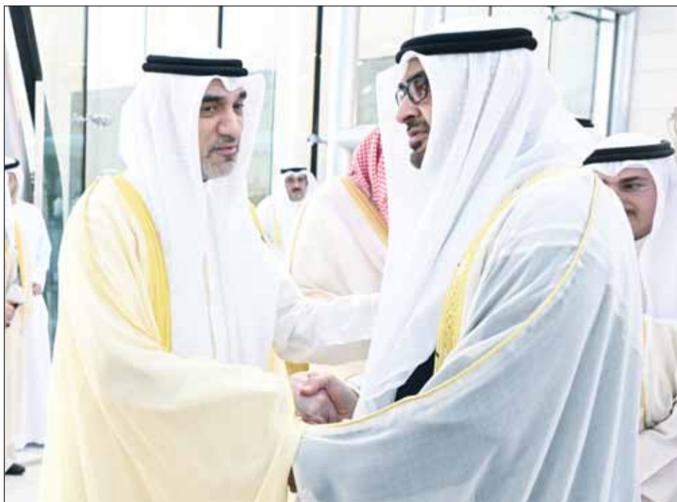
الشيخ محمد بن زايد مودعاً رئيس الوزراء بالإنابة الشيخ فهد اليوسف

وأضاف: مضت السنوات والعقود، ونحن على العهد نفسه، وعلى الود نفسه، وعلى الرابط نفسه، والله المهم، توهم الإمارات بأن التعاون الاقتصادي هو الأساس القوي لدعم العلاقات والمصالح بين الأشقاء وتحقيق تطورات شعوبنا نحو التقدم والازدهار، سواء في مجلس التعاون