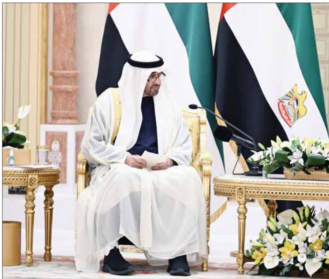
رئيس دولة الإمارات الشيخ محمد بن زايد يلقيه كلمته خلال جلسة المباحثات

حريصون على التعاون مع الكويت وجميع دول الخليج لتعزيز المنظومة لمصلحة شعوبنا