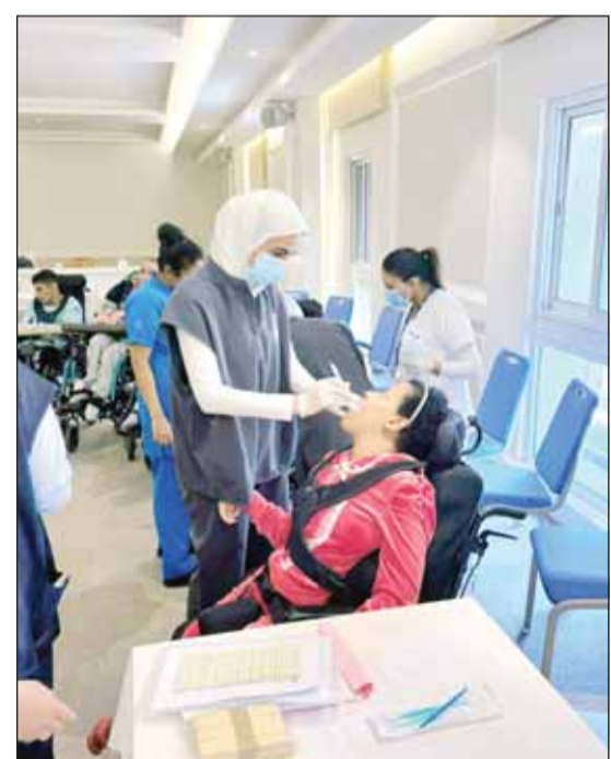
طلبة طب الأسنان خلال إجراءات الفحوصات لتدعيم الاحتياجات

وذكر أن باحثي المعهد الكويتيين تصدروا قائمة العلماء في مجال أبحاث السكري ونال البعض منهم جوائز وعرضيات في هيئات علمية مرموقة، مؤكداً أن أبحاث المعهد تسهم بشكل فعال في الارتقاء بالمنظومة الصحية والعلاجية وتقديم التوصيات والإرشادات حول مرض