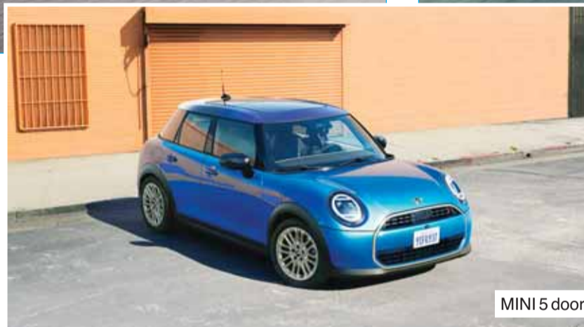
MINI 5 door

أعلنت شركة أولاد علي الغانم للسيارات تحقيق أرباح صافية خاصة بمساهمي الشركة الأم خلال التسعة أشهر المنتهية في 30 سبتمبر 2024 بقيمة 21,485 مليون دينار، بنمو 2,6% عن الفترة المقابلة من العام الماضي.