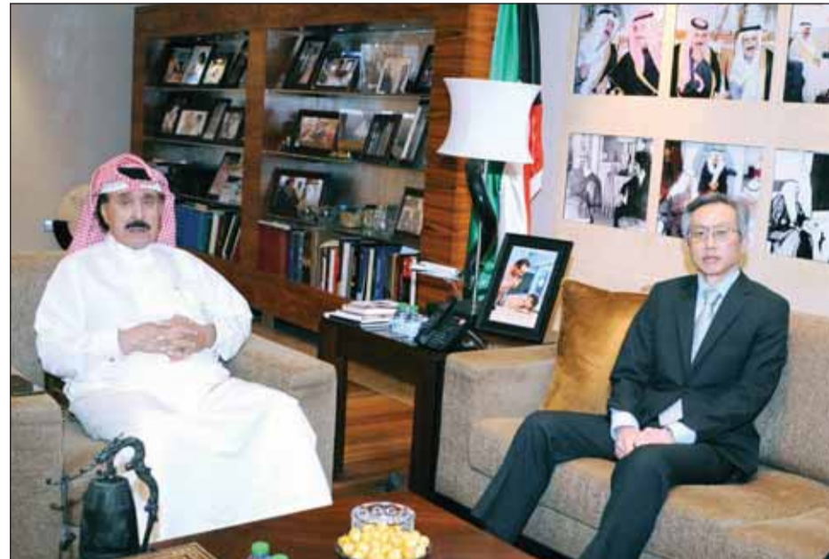
العميد رئيس التحرير أحمد الجارالله مستقبلاً السفير الياباني مورينو ياسوناري

وأعرب الجارالله عن شكره للسفير ياسوناري على جهوده خلال فترة عمله في الكويت، متمنياً له التوفيق والنجاح في مهامه المقبلة، وموكداً متانة العلاقات بين الشعبين الصديقين ودور وسائل الإعلام في تعزيزها.