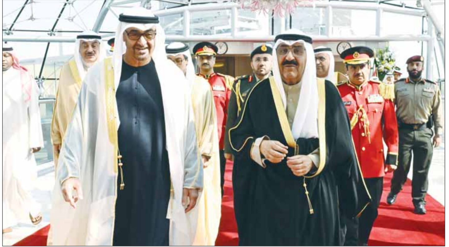
سمو أمير البلاد الشيخ مشعل الأحمد مستقبلاً رئيس دولة الإمارات الشيخ محمد بن زايد

سموه ترأس وولي العهد وبن زايد جلسة المباحثات الرسمية بين البلدين