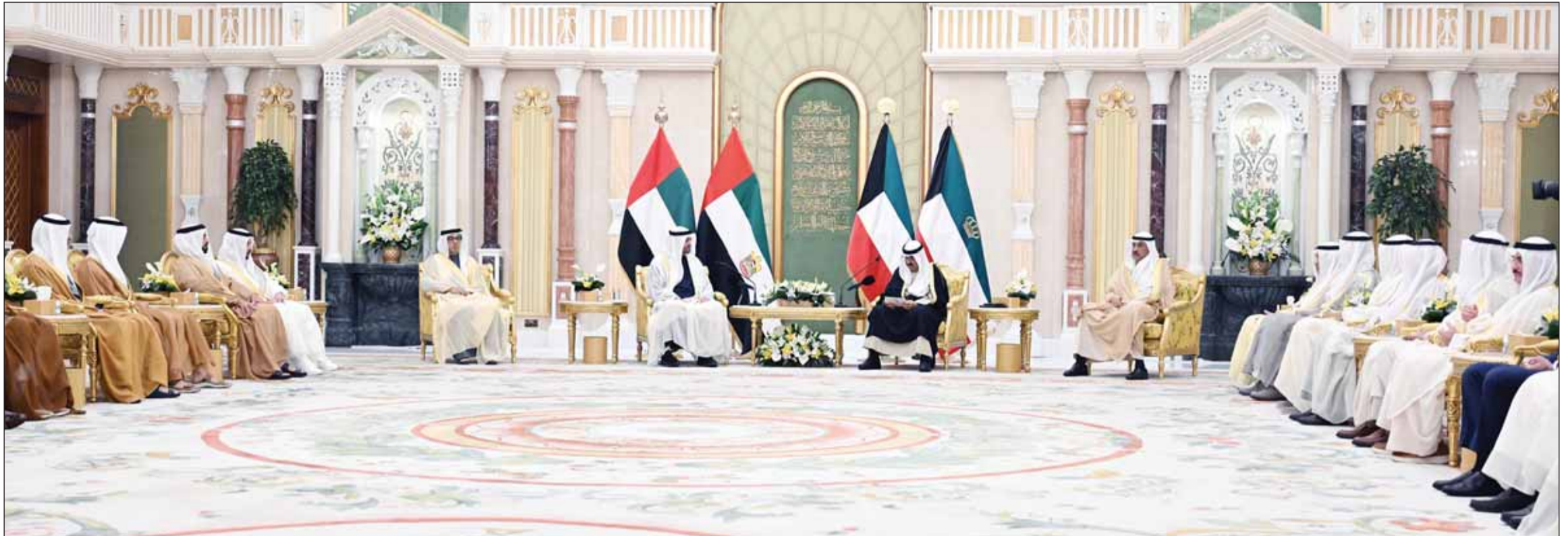
سمو أمير البلاد الشيخ مشعل الأحمد وسمو ولي العهد الشيخ صباح خالد ورئيس دولة الإمارات الشيخ محمد بن زايد خلال ترؤسهم جلسة المباحثات بحضور عدد من كبار مسؤولي البلدين