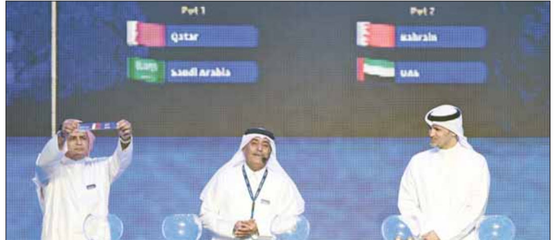
جانبا من سحب القرعة

الفعاليات التي ستعظمها فصيماً لهذا الحدث الكروي الإقليمي.