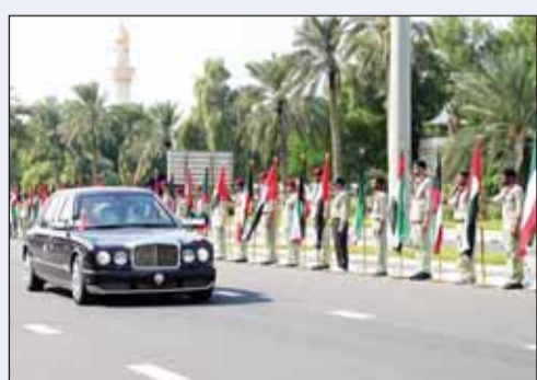
جانب من استقبال موكب ضيف الكويت أمام قصر بيان

رافق سرب من الطائرات الحربية الكويتية طائرة رئيس دولة الإمارات العربية المتحدة سمو الشيخ محمد بن زايد فوق الأجواء الكويتية.