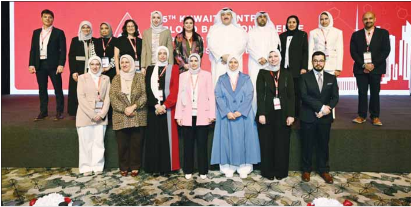
الوزير د. أحمد العوضي، متوسطاً منسوبي إدارة خدمات نقل الدم خلال المؤتمر

ولفت إلى أن إدارة خدمات نقل الدم حرصت على تأمين إمدادات آمنة ومستدامة للدم وفقاً لأعلى المعايير العالمية، ما يعزز من جودة وسلامة