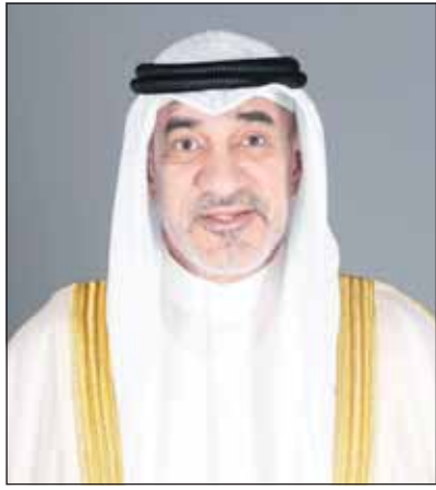
الشيخ فهد اليوسف

بعث رئيس مجلس الوزراء بالإنابة ووزير الدفاع ووزير الداخلية الشيخ فهد اليوسف أمس ببرقية تهنة إلى نائب رئيس مجلس الوزراء لشؤون الدفاع لدى سلطنة عمان الشقيقة شهاب بن طارق آل سعيد، وذلك بمناسبة ذكرى العيد الوطني الـ 54 للسلطنة.