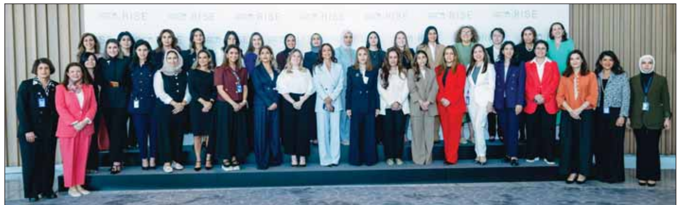
المشاركات في النسخة الثانية من البرنامج