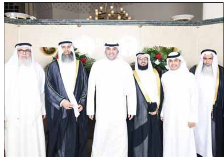
مهلهل السابر قدم التهاني