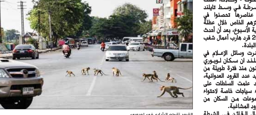
القرود تقطع الشارع في لوبوري

بانكوك - وكالات، أعلنت الشرطة في وسط تايلند أن عناصرها تحصنوا في مركزهم الخاص خلال عطلة نهاية الأسبوع، بعد أن أمحت 200 قرد هارب أعمال شغب في البلدة. ونشرت وسائل الإعلام في تايلند أن سكان لوبوري يعانون منذ فترة طويلة من تزايد عدد القرود العدوانية، وقد علمت السلطات على بناء سياجات خاصة لامتواء مجموعات من السكان من القرود المشاغبة. وقال القائد في الشرطة سومتشاي سيدي، "كان علينا التأكد من إغلاق الأبواب والخوافد لمنعها من دخول المبني لتناول الطعام، كنا