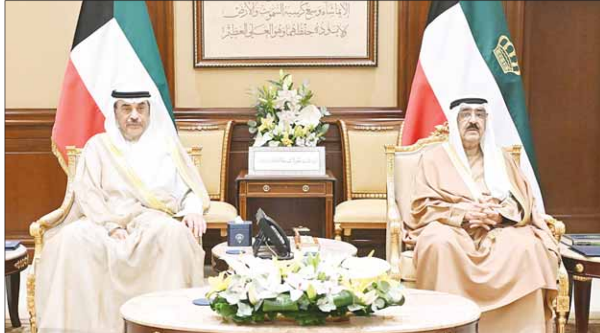
سمو أمير البلاد الشيخ مشعل الأحمد وسمو ولي العهد الشيخ صباح الخالد خلال مراسم أداء القسم

استقبل سمو أمير البلاد الشيخ مشعل الأحمد، بقصر بيان أمس، وبحضور سمو ولي العهد الشيخ صباح الخالد، استقبل سموه رئيس الحرس الوطني الشيخ مبارك حمود الجابر الصباح، حيث أدى اليمين الدستورية أمام سموه بمناسبة تعيينه في منصبه الجديد.