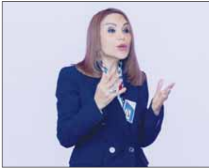
شيخة البحر متوسطة خلال افتتاح البرنامج

البنك يسعى إلى تحقيق المزيد من التنوع والشمولية وإعداد قيادات نسائية فعالة