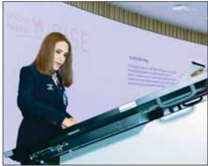
... وتوقع التعهد نيابة عن البنك الوطني