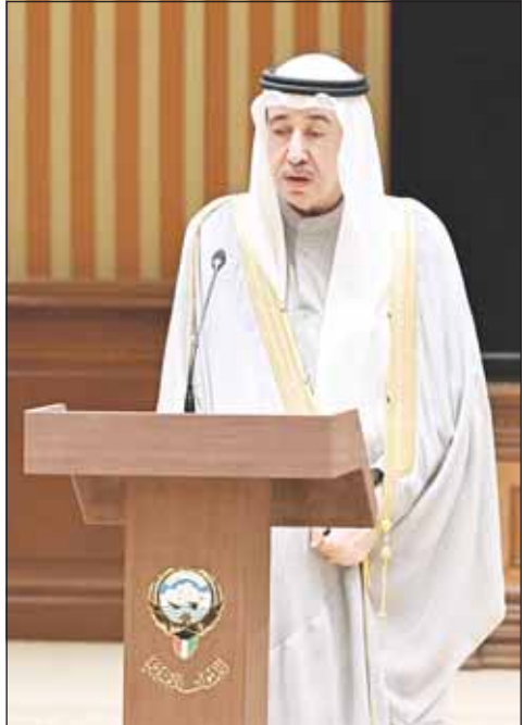
الشيخ مبارك حمود الصباح يؤدي اليمين الدستورية