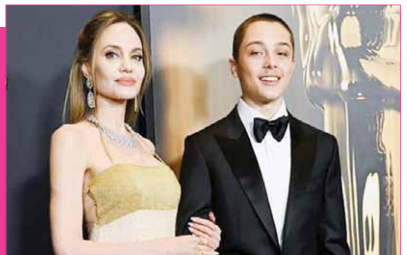
أنجلينا جولي ونوكس

ظهرت الفائزة بجائزة الأوسكار أنجلينا جولي مع ابن براد بيت زوجها السابق البالغ من العمر 16 عاماً في حفل توزيع جوائز الحاكم في لوس أنجلوس في 17 نوفمبر. وكانت هذه المرة الأولى التي ظهر نوكس على السجادة الحمراء منذ أكثر من ثلاث سنوات، وأظهر الثنائي الأم والابن حيث بدت أنجلينا متألقة في ثوب أصفر ممشس، حافظت على ذراعها مع ابنها المراهق، الذي بدا كبيراً جداً في بدلة كلاسيكية وتصفيقة شعر جدابة.