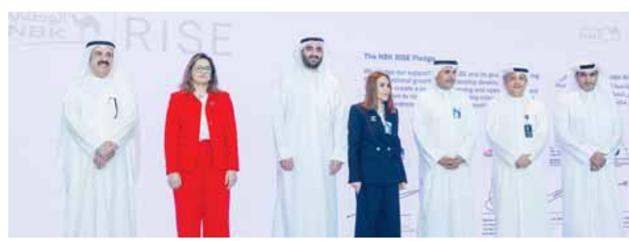
"NBK RISE" يواصل رحلة نجاحه نحو تعزيز ودعم القيادات النسائية 10