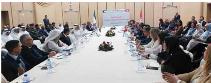
جانب من اجتماعات اللجان التحضيرية

والصناعات الدوائية والتجديد التكنولوجي. وأضاف ان اللجان المشتركة ستعمل على تحليل بعض الصعوبات التي يواجهها التجار التجاري الثنائي، مشدداً على أهمية إعادة تشغيل الخط الجوي المباشر بين تونس والكويت. من جانبه، أكد مساعد وزير الخارجية لشؤون الوطن العربي ورئيس الوفد الكويتي السفير أحمد البكر أهمية العلاقات التونسية - الكويتية، معتبراً أنها