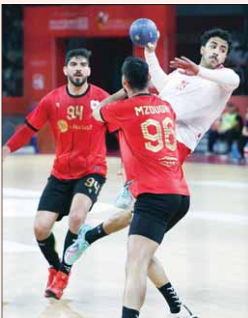
الكويت لمواصلة المشوار بنجاح في "اليد الآسيوية"