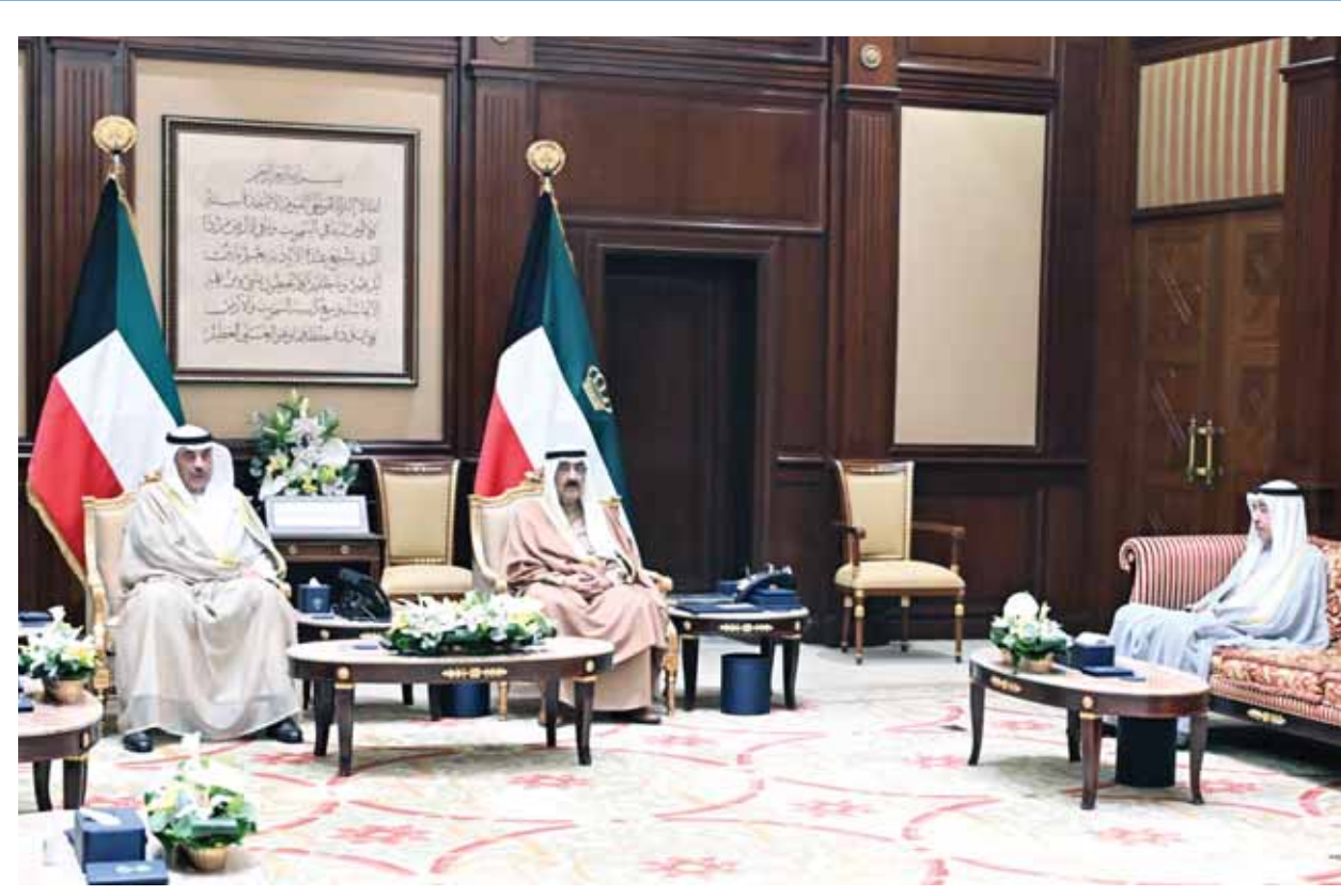
03 الأمير استقبل رئيس الحرس الوطني لأداء اليمين الدستورية

مع ترشيح الرئيس الأميركي المنتخب دونالد ترامب، أمس، الرئيس التنفيذي لشركة ليبرتي إنرجي (Liberty Energy) كريس رايت - الذي وصفه بأنه أحد الرواد الذين ساعدوا في إطلاق ثورة النفط الصخري الأميركي - وزيراً للطاقة في إدارته، والإعلان عن عزمه إنشاء مجلس جديد لزيادة إنتاج الطاقة، ووسط توقعات بـ"الضغط" على أسعار النفط "نحو التراجع خلال العامين المقبلين مدفوعة بسياسات الإدارة الجديدة التي ستترسخ زيادة المعروض وعدم التركيز على القضايا البيئية، كشفت مصادر نفطية مطلعة لـ"السياسة" عن توجه مؤسسة البترول إلى زيادة وتنويع مصادر الدخل وتحقيق الأرباح عبر التركيز على دعم المشاريع التي تضمن ثبات وزيادة كميات النفط والفاز. (راجع ص7) وأوضحت المصادر أن المؤسسة - وبتعليمات مباشرة من الرئيس التنفيذي الشيخ نواف السعود - ستركز خلال الفترة المقبلة على التوسع في الصناعات البتروكيمياوية، مشيرة إلى أنها تعد حالياً دراسة لزيادة التتمة 13