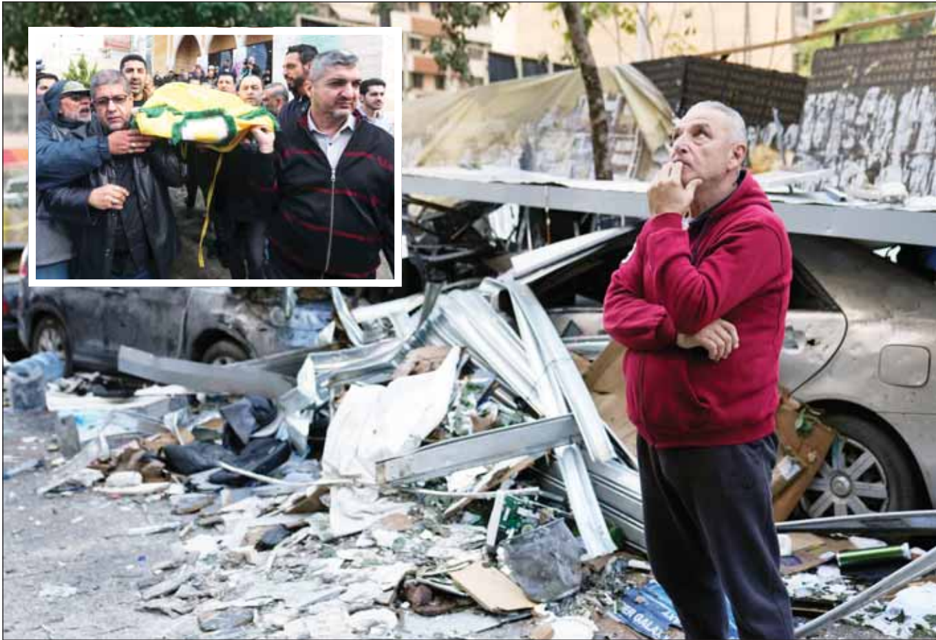
لبناني يتفقد بوجوم أضرار غارة إسرائيلية في وسط بيروت وفيه الإطار مشيخو وأقارب المتحدث باسم "حزب الله" محمد عفيف يحملون جثته خلال جنازته في مدينة صيدا أمس