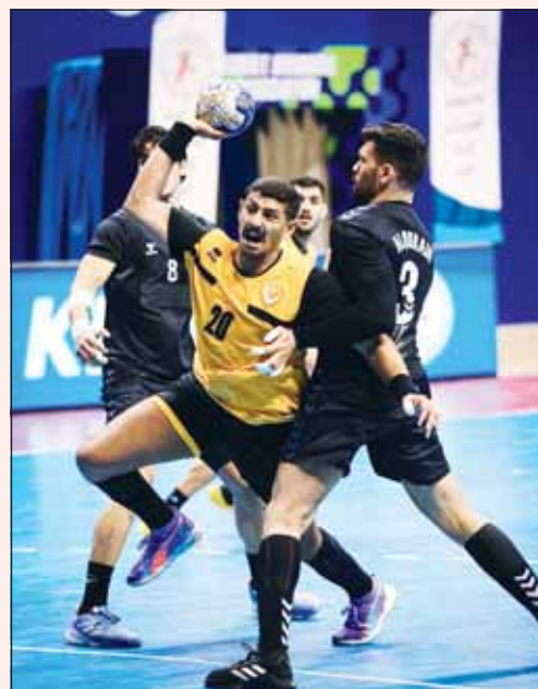
القادسية يسعدهم للفوز اليوم