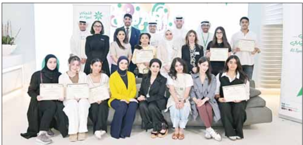
المشاركون والمشاركات في الورشة

يواصل البنك التجاري الكويتي فعاليات حملة "التجاري آرت" (Tijari Art) من خلال تنظيم ورشته الثانية - الرسم بالأكريليك، والتي تم تنظيمها بالتعاون مع منصة VO والرئاسة غلا البديع، حيث شهدت الورشة حضور عدد كبير من العملاء وأبنائهم من مجبي الرسم الذين استمتعوا بتجربة استثنائية تعلموا من خلالها أسرار الرسم بالأكريليك وعبروا عن إبداعاتهم وأفكارهم.