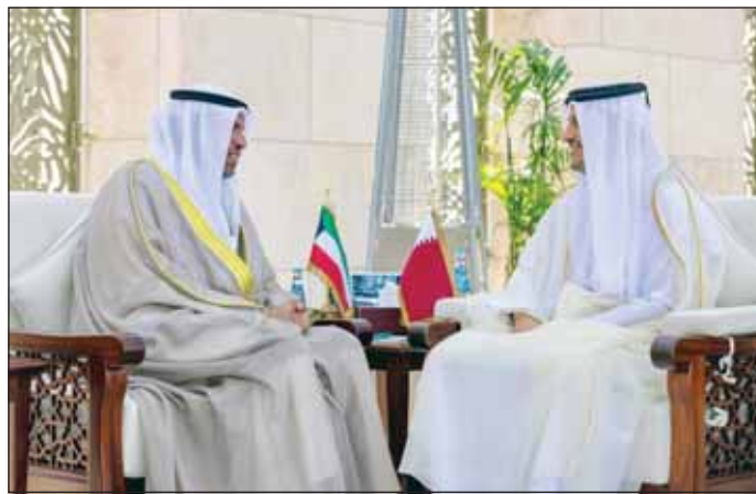
الوزير عبد الله اليحيا ورئيس الوزراء القطري الشيخ محمد بن عبد الرحمن