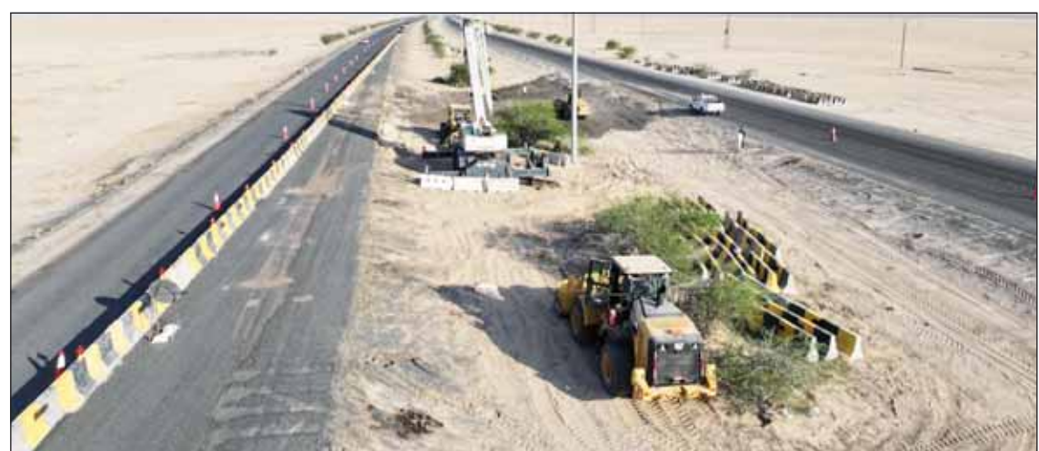
جانب من الأعمال في طريق السالمي