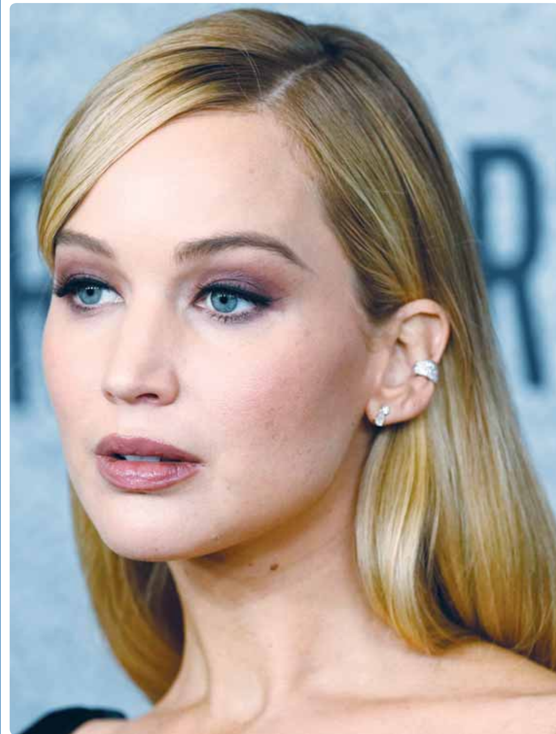
الممثلة الأميركية جينيفر لورانس خلال حضورها العرض الأول لفيلم "الخبز والورد" في لوس أنجلوس

أكملوا الطريق، ولا تخافوا بالحق لومة لائم، ولا تأخذكم بالمتلاعبين والمزورين رحمة، فهم لم يرحمونا...زين.