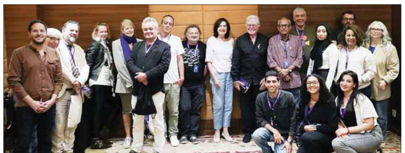
حسين فهمي مع الصحافيين

يمنح مهرجان القاهرة المق في أن يكون صوتاً قوياً يدعم القضية الفلسطينية بكل الوسائل المتاحة. وافتم حسين فهمي حديثه بالتأكيد على أن مهرجان القاهرة السينمائي الدولي سيظل جسراً للتواصل الثقافي بين مصر والعالم، وناقدت تعكس أصالة السينما المصرية وتاريخها العريق. كما عبّر عن تطلعه لمواصلة تعزيز مكانة المهرجان كمنصة تدعم الابداع السينمائي وتساهم في إيصال رسائل إنسانية وفنية تعبر عن قضايا العصر وألام الأجيال القادمة. وتشهد الدورة الخامسة والأربعين من مهرجان القاهرة السينمائي، مشاركة 194 فيلماً من 72 دولة، بينما تشمل الفعاليات 16 عرضاً للسجادة الحمراء، و37 عرضاً عالمياً أول، و8 عروض دولية أولى، و119 عرضاً لمنطقة الشرق الأوسط وأفريقيا.