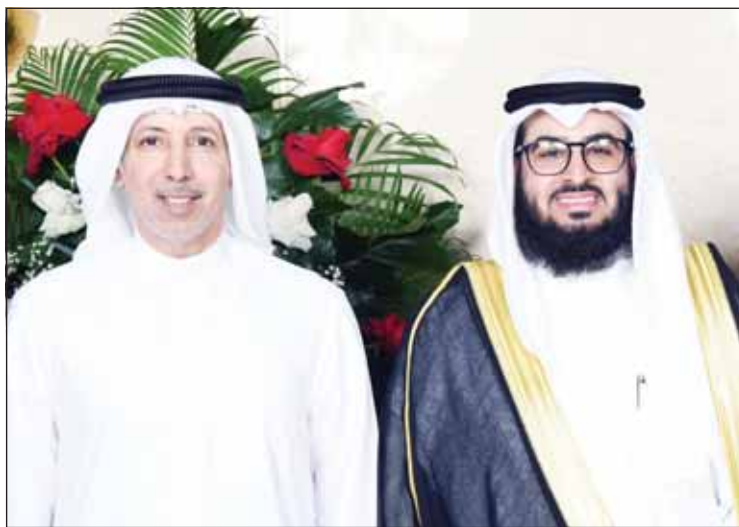
مهلهل المصنف مع المعرس