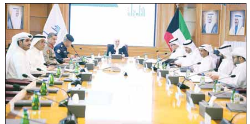
وزيرة المالية نورة الفصام مترئسة الاجتماع

عقد مجلس إدارة المؤسسة العامة للتأمينات الاجتماعية أمس أول اجتماعاته برئاسة رئيسة مجلس إدارة المؤسسة وزيرة المالية نورة الفصام والاستثمار نورة الفصام لمناقشة جدول الأعمال المعروض على مجلس الإدارة.