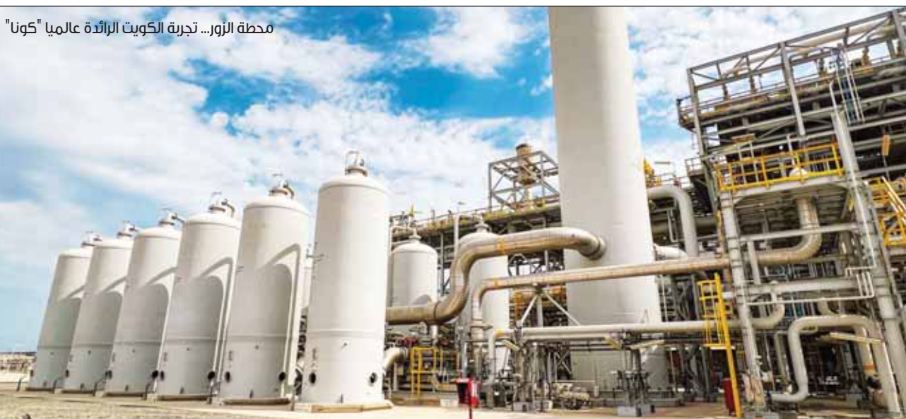
محطة الزور... تجربة الكويت الرائدة عالمياً "كونا"

وأضاف المصدر أن الهدف من مشاركة القطاع الخاص في صناعة البتروكيماويات كذلك للاسهام في حل مشكلة التوظيف خصوصاً للريجيين أصحاب التخصصات التي تمتازها الصناعة النفطية والصناعات المرتبطة بها.