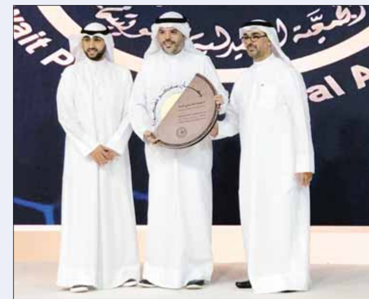
مجلس إدارة الجمعية الصيدلية بكرم وكيل وزارة الشؤون د. خالد العجمي

ونوهت بنجاح إدارة خدمات نقل الدم في تحقيق العديد من الإنجازات هذا العام منها تجميع نحو 80 ألف كيس دم في مؤشر على الالتزام الثابت بتوفير إمدادات دم آمنة وموثوقة، لافتة إلى إنتاج أكثر من 190 ألف منتج من مكونات الدم المختلفة بما في ذلك صفاغ الدم و بلازما الدم وتوفير 140 ألف وحدة من الدم لتغطية احتياجات المستشفيات كافة من الحاجة الكلينيكية لمرضى السرطان ومرضى التلاسيميا وضحايا الحوادث وحالات النزيف. ولفتت إلى أن إدارة خدمات نقل الدم تعمل على تعزيز ثقافة التبرع والتطوع في المجتمع من خلال تنظيم 248 حملة تبرع حتى الآن، حيث شارك في هذه الحملة العديد من الجهات الحكومية والأفراد والمؤسسات والشركات والجهات لتسهم جميعها في إنقاذ الأرواح حيث جمع 15 ألف و 800 كيس دم وهو رقم غير مسبوق يعكس التضامن الكبير في سبيل تحقيق الهدف السامي "إنقاذ حياة الإنسان".