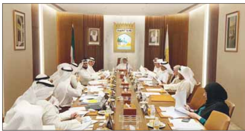
الوزير عبداللطيف المشاري مترئساً الاجتماع

شدد وزير الدولة لشؤون البلدية وزير الدولة لشؤون الإسكان عبداللطيف المشاري على أهمية التعاون بين قطاعات البلدية المختلفة، ووضع خطة عمل وتطويرها بشكل متواصل، بالإضافة إلى توجيه رؤساء بلديات المحافظات إلى تكثيف الجولات الميدانية بشكل مستمر، بهدف التوعية الكاملة باللوائح والنظم والالتزام بها دون تهاون مع المخالفين.