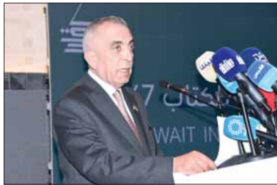
مصطفى نصر الرواشدة

وقدم وزير الثقافة بالمملكة الأردنية الهاشمية مصطفى نصر الرواشدة، قائلاً: شكراً للكويت هذا المعرض الذي يمثل مؤتمراً لصناع الثقافة الأردنية أمام ثقافات العالم، وأن اختيار الأردن ضيف شرف المعرض يمثل توطيماً للعلاقات الثقافية الممتدة عميقاً بين البلدين الشقيقين.