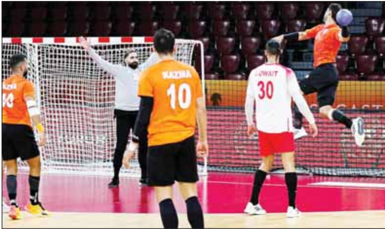
كاظمه يبحث عن النهائي في "اليد الآسيوية"

على الريان 24-23. وبعد فوز كاظمه مفاجأة، لعدم تقديمه المستوى المأمول في دور المجموعات إذ حقق فوزاً وميداً على أهلي سداب العماني (الذي غادر البطولة من دور المجموعات)، مقابل 3 هزائم أمام الخليج والدحيل ومس كرمان. في المقابل تصدر الكويت مجموعته بتحقيقه 3 انتصارات على الريان والشارقة والشباب دون هزيمة وهو ما كان يرجع كفته بالوصول إلى نصف النهائي. وأظهر "البرتقالي" رغبة كبيرة في تحقيق الفوز منذ انطلاق المباراة أمام الكويت، وتمكن من تحييد مفتاح اللعب لدى الكويت وتنفيذ الهجمات المرتدة السريعة ما منحه الفرصة في التفوق وإنهاء المباراة بفوز صريح 32-25. وقال الصربي روديك بوزو مدرب كاظمه إن فريقه حقق المطلوب بالتأهل إلى نصف النهائي.