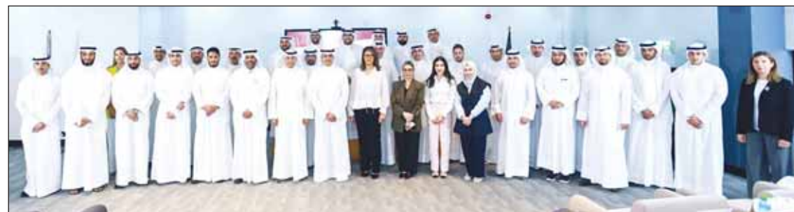
صورة جماعية خلال افتتاح البرنامج

الكفاءة المهنية للمقيمين العقاريين، وقد تم تصميم هذا البرنامج بالتعاون مع نخبة من خبراء التقييم العقاري في الكويت، بناءً على أحدث الأساليب العلمية والتطبيقية. ويعكس هذا البرنامج التزام المعهد بتوفير بيئة تعليمية تحفز التطوير المهني، وتمكن المتدربين من اكتساب المهارات والخبرات اللازمة لتلبية متطلبات سوق العمل كما يحقق هدف وزارة التجارة والصناعة في ضمان التطبيق الأمثل للقرار الوزاري رقم (152) لسنة 2023، الخاص بتنظيم مهنة مقيمي العقار ومقدمي خدمات التقييم في دولة الكويت، إن دور التقييم العقاري كبير ليس فقط في القطاع العقاري بل أيضاً في القطاع المصرفي، حيث يساهم بتحديد القيمة العادلة للعقارات في اتخاذ قرارات استثمارية مدروسة، سواء في حالة البيع أو الشراء كما يساعد الراغبين في تملك السكن.