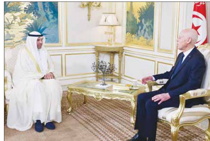
الرئيس التونسي قيس سعيد مستقبلاً وزير الخارجية عبدالله يحييا

تونس - "كونا"، استقبل رئيس الجمهورية التونسية قيس سعيد، أمس، وزير الخارجية عبدالله يحييا بمناسبة زيارته الرسمية والوفد المرافق إلى العاصمة تونس. ونقل الوزير يحييا إلى الرئيس التونسي تحيات أخيه سمو أمير البلاد الشيخ مشعل الأحمد وتمنيات سموه للجمهورية التونسية وشعبها الشقيق المزيد من التقدم والازدهار فيما حمل الرئيس تحياته إلى سمو أمير البلاد وتمنياته له بدوام الصحة والسعادة ولدولة الكويت وشعبها المزيد من التطور والنماء. وتناول الرئيس التونسي وزير الخارجية أواخر العلاقات الأخوية الراسخة ومسارات التعاون المشترك وسبل تعزيزها في مختلف المجالات التي تخدم مصالح البلدين الشقيقين.