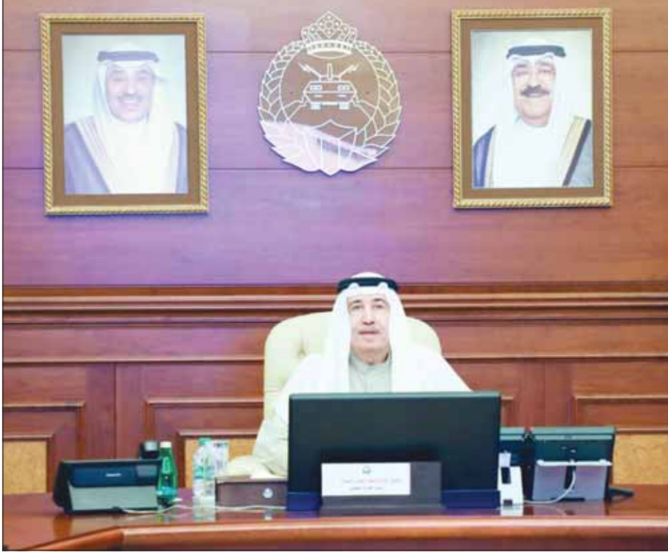
رئيس الحرس الوطني الشيخ مبارك الحمد مترأساً الاجتماع