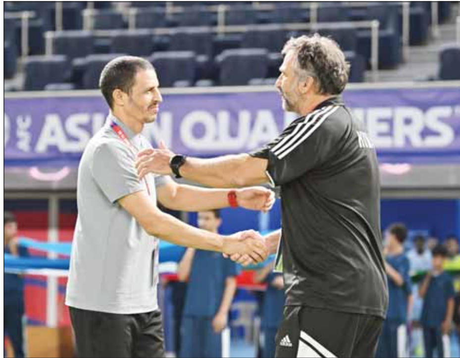
بيتزي والسلامه قبل اللقاء أول من أمس

يتطلع كاظمه إلى استكمال مشواره بنجاح، وبلوغ المباراة النهائية لبطولة الآسيوية الـ 27 للأندية الأبطال لكرة اليد، عندما يلتقي الشارقة الإماراتي في 07:00 مساء اليوم في العاصمة القطرية الدوحة، وتسبقها مواجهة في الدور ذاته، تجمع الخليج السعودي مع الدحيل القطري في 05:00 مساءً. وفي أدوار تحديد المراكز يلعب الكويت مع مس كرمان الإيراني في 03:00 عصرًا، والريان القطري مع الشباب البحريني في 01:00 ظهراً. وحقق "البرتقالي" مفاجأة "مدوية" بالتغلب على الكويت 32-25 أول من أمس في ربع النهائي الذي شهد فوز الخليج على الشباب 35-20، والشارقة على مس كرمان 36-25، فيما انتهى "الديري" القطري بفوز الدحيل