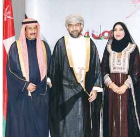
الشيخ د.إبراهيم الدايج مع السفير د.صالح الخروصي وحرمه