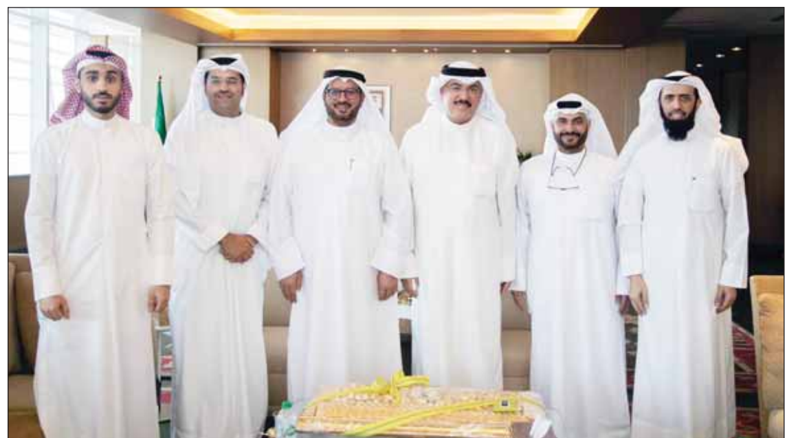
وزير التربية سيد جلال الطبطبائي خلال لقائه رئيس نادي الصم وجمعية مترجمي لغة الإشارة

وتمت مناقشة أبرز القضايا التي تهم طلبة فئات الصم في مدارس التربية الخاصة، وجهود تسهيل الخدمات التعليمية المقدمة لهم، وإعداد الكوادر التعليمية المتخصصة لهم. وأكد الطبطبائي حرص وزارة التربية دعم هذه الفئات والعمل على تلبية متطلباتهم، لضمان حقوقهم وإشراكهم في المجتمع وإعطائهم الأولوية والاهتمام في دمجهم وتفعيل دورهم للإسهام في تطوير عجلة التنمية بالبلاد.