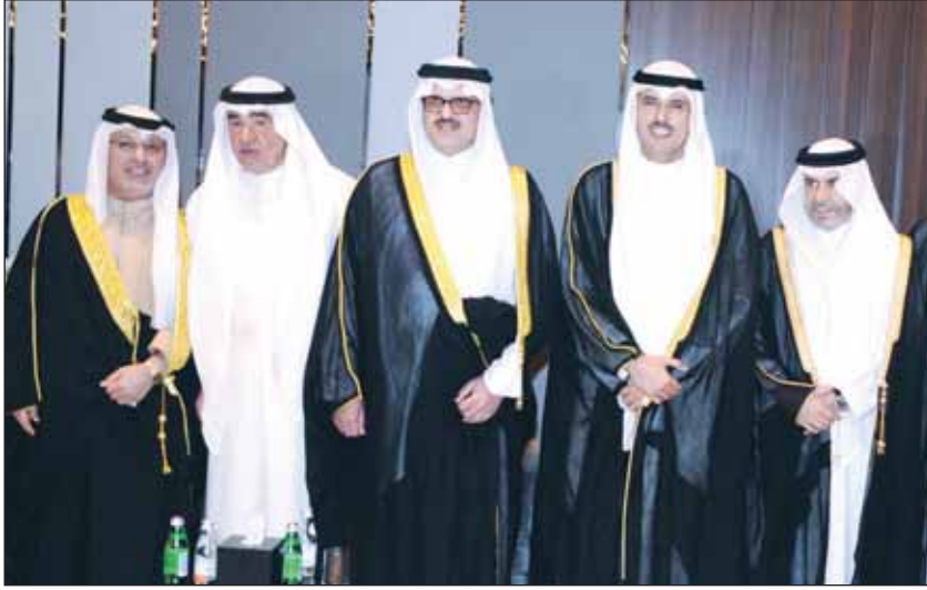
سفير قطر والشيخ حمود الجابر والسفير السعودي وسعود الباطين وسفير البحرين