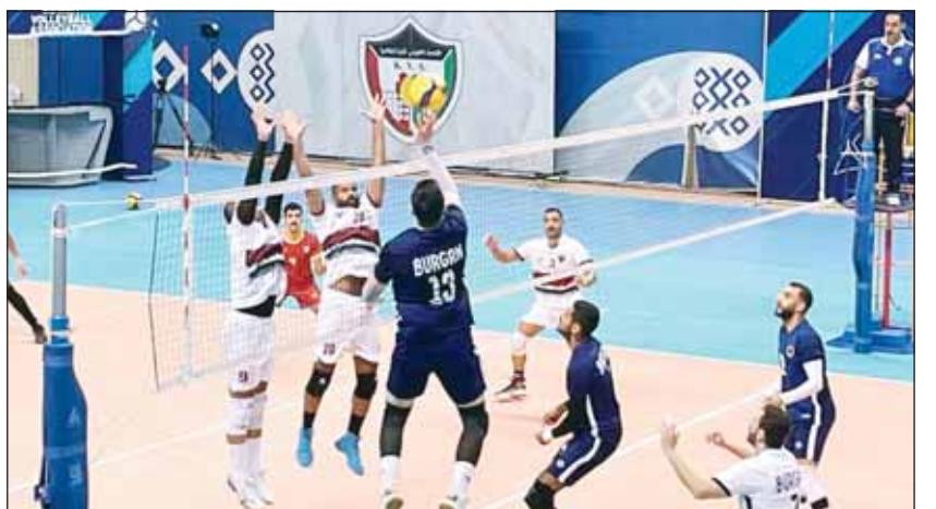
من لقاء برقان والنصر