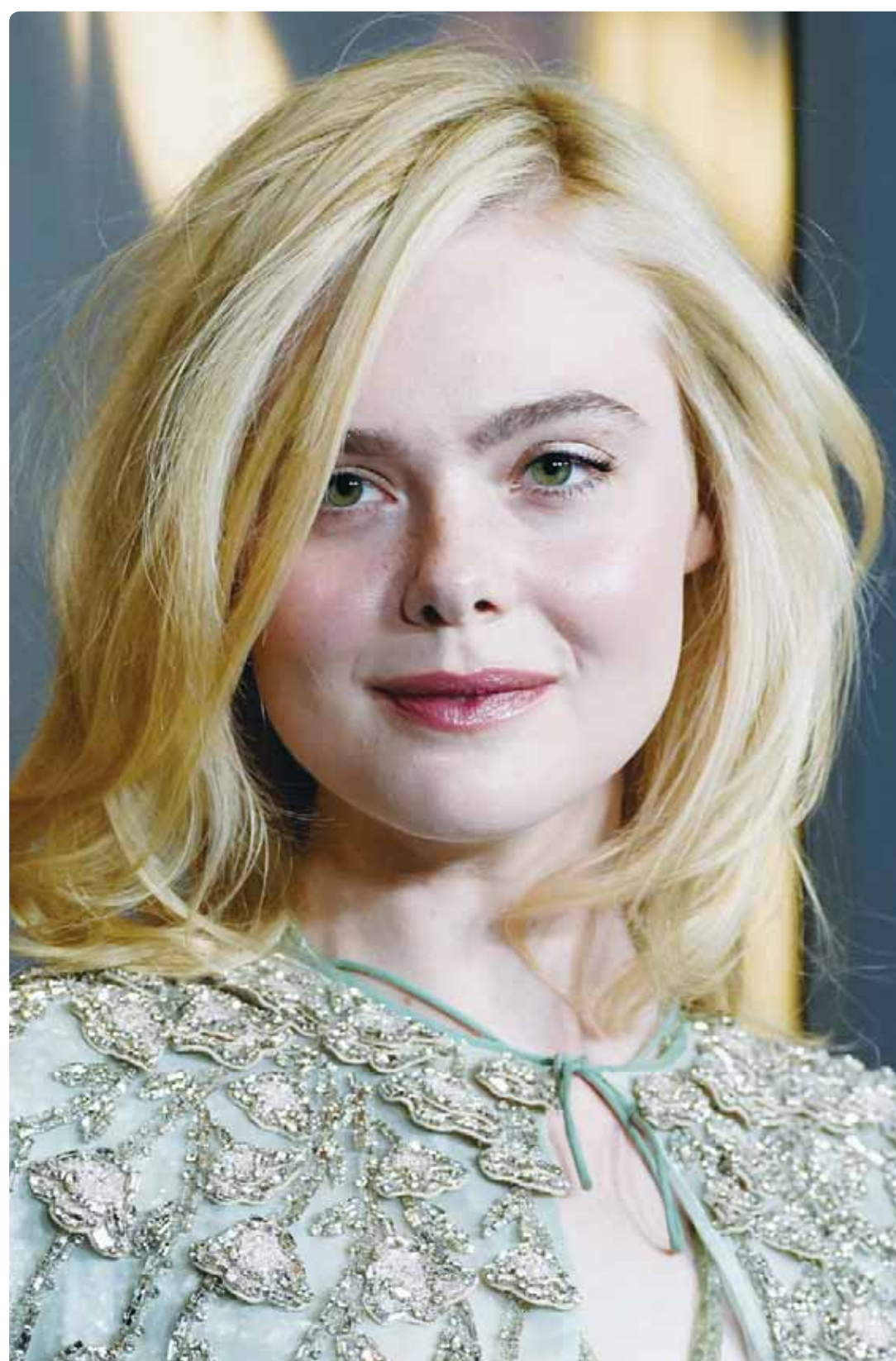
المخرجة الهولندية ميريام غوتمان خلال عرض فيلمها "الصف الامامي" بمهرجان "DOC NYC" في نيويورك