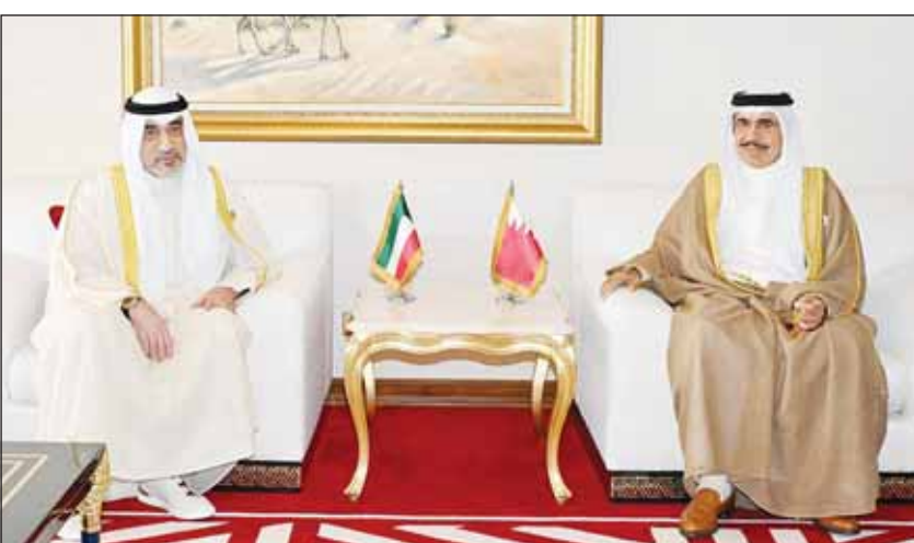
اليوسف خلال لقائه وزير الداخلية البحريني الفريق أول الشيخ راشد آل خليفة

ترسيخ روح الأخوة والتكامل بين الأشقاء في "التعاون" بما يلبي تطلعات شعوبنا نحو الأمن والاستقرار