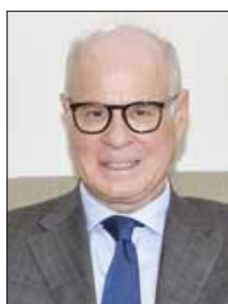
السفير بلوتاس متحدثاً

الكويت تعتبر شريكاً رئيساً لليونان في منطقة الخليج والشرق الأوسط الأوسع 3500 سائح كويتي زاروا اليونان خلال العام الحالي وتنتقل إلى تعزيز التعاون السياحي