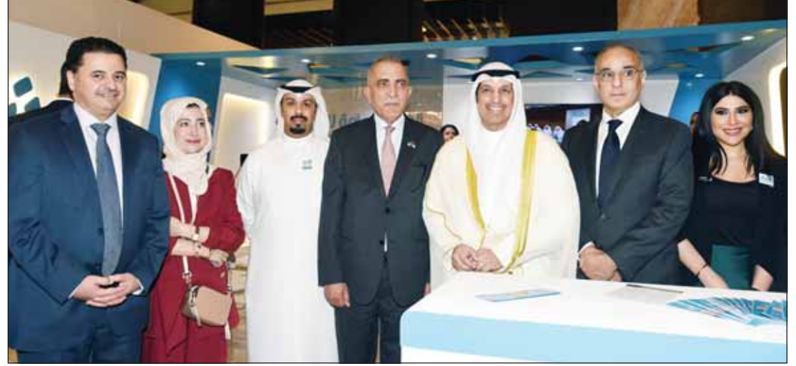
وزير الاعلام عبدالرحمن المطيري ومصطفى الرواشدة خلال جولة في المعرض

افتتاح دورته الـ 47 برعاية سمو رئيس مجلس الوزراء