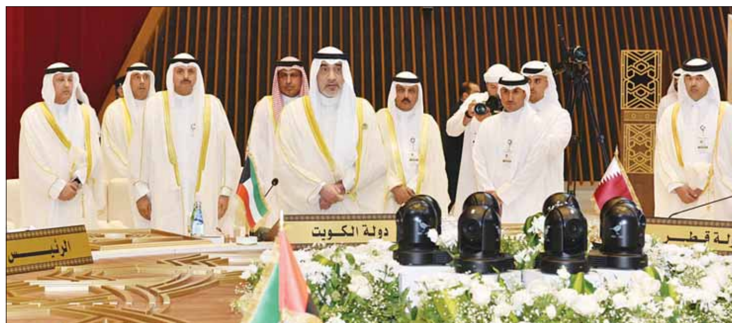
رئيس مجلس الوزراء بالإنابة الشيخ فهد اليوسف مترأساً وفد الكويت في اجتماع وزراء الداخلية بالدوحة