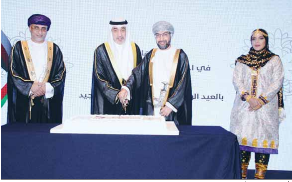
الشيخ فهد اليوسف يشارك السفير د.صالح الخروصي قطع قالب الحلوى

□ الخروصي: الحضور الرسمي والشعبى الكبير يعكس عمق العلاقات بين بلدينا □ سفير إيران: نأمل أن ترتقى علاقاتنا مع دول المنطقة إلى مستوى عُمان