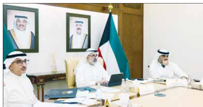
الشيخ جراح الجابر مترأساً الاجتماع المزمع للجنة الصياغة

ترأس نائب وزير الخارجية السفير الشيخ جراح الجابر أمس، اجتماعاً مزمعاً للجنة صياغة مشاريع قرارات وتوصيات المجلس الوزاري في دورته الـ (162) التحضيرية للدورة (45) للمجلس الأعلى لدول مجلس التعاون الخليجي والتي ترأسها دولة الكويت دورتها المقبلة.