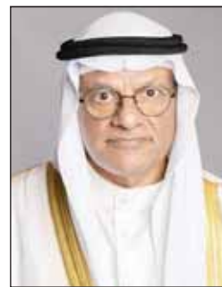
د. نادر الجلال

وقالت في كلمة لها خلال الاحتفال بمناسبة اليوم العالمي للطفل صباح أمس إن وزارة الشؤون الاجتماعية تعمل باستمرار على تعزيز حقوق الطفل وتقديم كل ما يسهم في تنمية السليمة، من خلال دعم الأنشطة والبرامج الخاصة بالطفولة والمضامات، وتطوير السياسات التي تضمن توفير بيئة آمنة وصحية تعزز نمو الأطفال وتساعد على اكتشاف أقصى إمكاناتهم. وأضافت إننا نؤمن بأن الاستثمار في الطفولة هو استثمار في مستقبل الكويت، فكل خطوة نخطوها نحو دعم الطفولة وحمايتها هي لبنة في