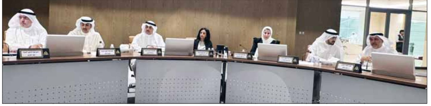
جانب من الورشة