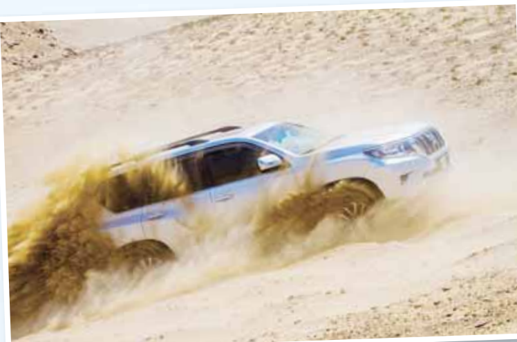
حصان "تويوتا" الراج "لاند كروزر"

العلامة التجارية، ذكر التقرير أن تويوتا أن تويوتا هي الرائدة من خلال بيع 25533 وحدة وحصّة سوقية 27,4% رغم تراجع هذه المبيعات بالمقارنة بالفترة المماثلة من العام الماضي نحو 17,1%، في حين جاءت نيسان في المركز الثاني بحصة سوقية بلغت 8 في المئة بمبيعات بلغت 7673 وحدة وبتراجع 3,3% عن العام السابق.