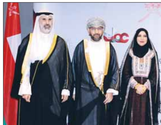
السفير الشيخ جراح الجابر قدم التهانى