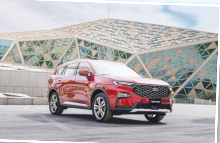
ارتفاع بـ 19,6% في مبيعات "تويوتا" من "فورد"