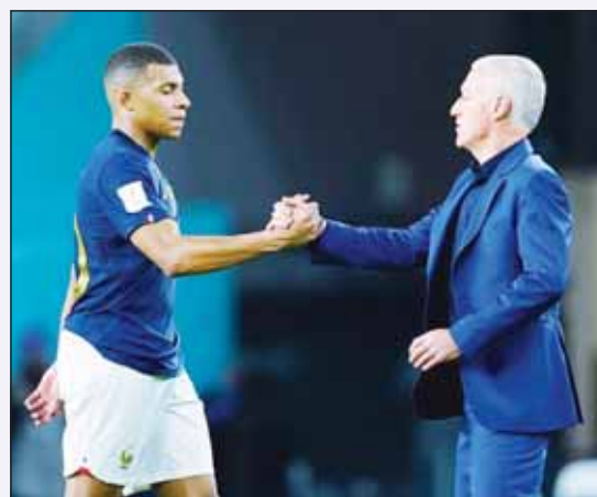
ديديه ديشامب وكيليان مباني يبدأ بيد

كشفت تقارير صحافية أن ديديه ديشامب مدرب منتخب فرنسا، سيسعدعي كيليان مباني نجم ريال مدريد الإسباني، لمناقشة مستقبله كقائد لمنتخب فرنسا بعد استبعاد من القائمة في التوقف الدولي الأخير.