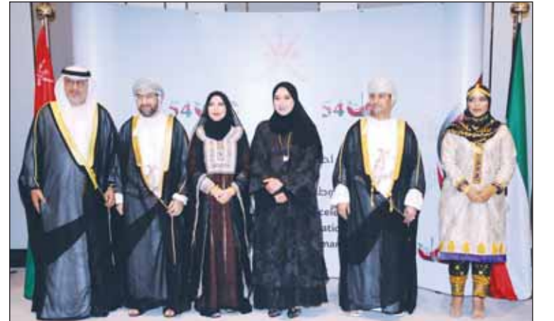
سفير الإمارات د.مطر النيايدي وحرمه يقدمان التهانى