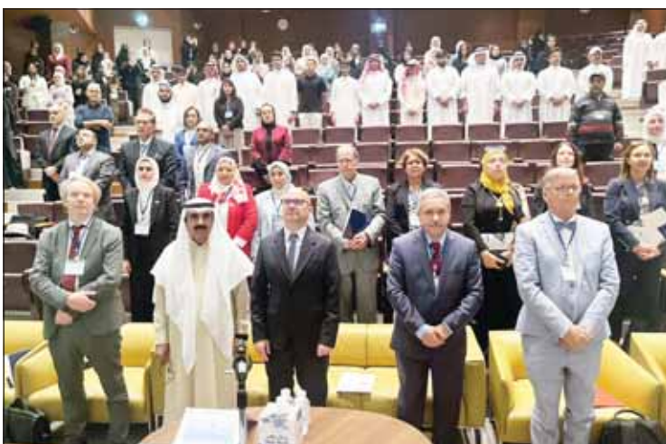
السفير الفرنسي أوليفييه جوفان في مقدم حضور المؤتمر

على جهودهم. بدوره أعرب سفير جمهورية فرنسا أوليفييه جوفان خلال كلمته عن سعادته بالمشاركة في المؤتمر بمناسبة مرور