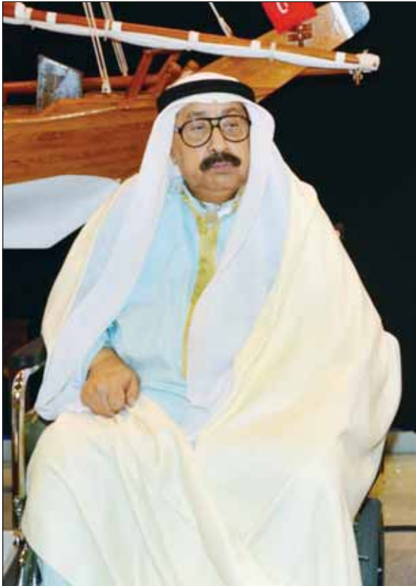
الفنان شادي الخليج