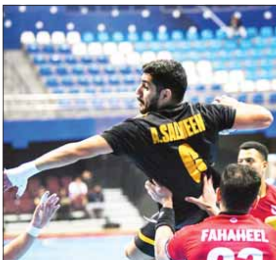
هجوم قدساوي ودفاع من الفحيحيل