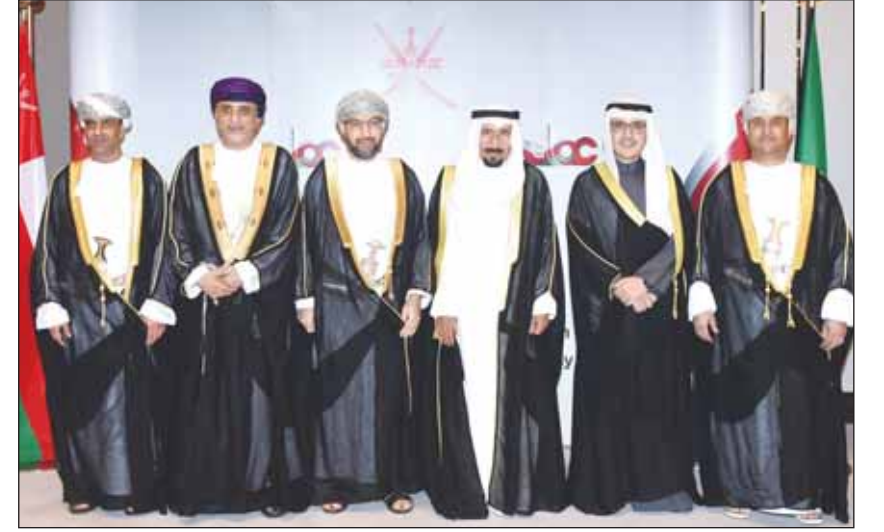
الشيخ علي الجابر والشيخ د.أحمد الناصر بهتان