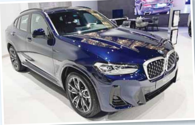
السيارات الفاخرة حاضرة دائماً وأبداً بالسوق الكويتية

10,4 ألف سيارة مبيعة في سبتمبر بانخفاض | "تويوتا" بالريادة بـ 25,5 ألف وحدة وحصّة 14,4% مقارنة بالشهر المقابل من العام الماضي | 27% ونيسان ثانياً بـ 8% عبر 7673 مركبة