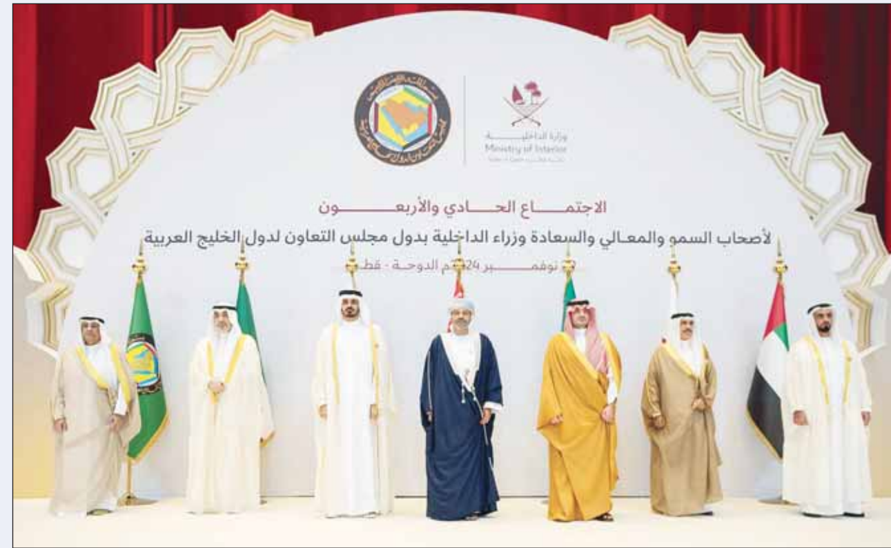
رئيس الوزراء بالإنابة الشيخ فهد اليوسف ووزراء داخلية "الخليجي" والأمين العام للمجلس جاسم البديوي قبيل الاجتماع أمس

وأشارت إلى أن الفرق مهمتها التحقيق لتحديد مكانم الخلل فقط وليس من صلاحياتها إمالة تقاريرها إلى لجنة الفتوى والتشريع المشكلة من قبل وزيرة الشؤون.