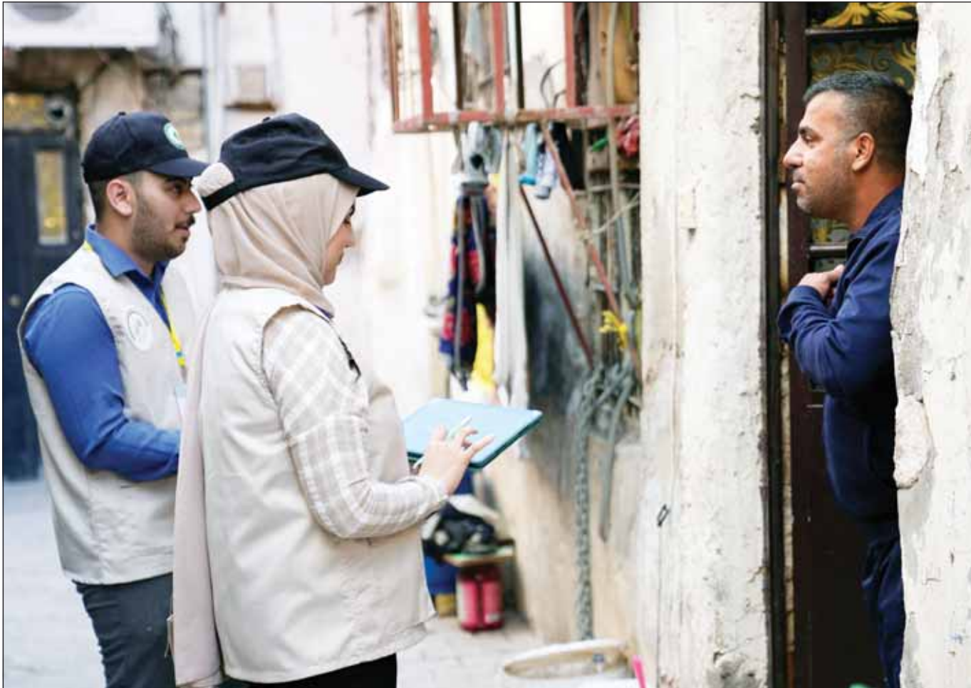
موظفان عراقيان يجمعان المعلومات من الجوهور، في مدينة النجف، في أول تعداد سكاني علمي مستخدم في العراق منذ عقود.

بدوره، كشفت مصادر أن الولايات المتحدة الأمريكية أبلغت بغداد بأنها استنفدت كل وسائل الضغط على إسرائيل، لمنع تنفيذ ضربات جوية ضد أهداف عراقية رداً على استمرار هجمات الفضائل المسلحة ضد إسرائيل، وأن واشنطن طلبت من العراق منع الهجمات بسرعة، مؤكداً أن الضربات الجوية الإسرائيلية ستكون وشيكة إذا لم تمنع الحكومة العراقية هجمات الفضائل من داخل الأراضي العراقية ضد إسرائيل، بينما كشفت مصادر عراقية أمنية أن الحكومة اتخذت التدابير اللازمة للتعامل مع الضربات الجوية الإسرائيلية، قائلة إن رئيس الوزراء أطلع الكتل السياسية على خطورة الموقف إذا استمرت الفضائل بشن هجمات.