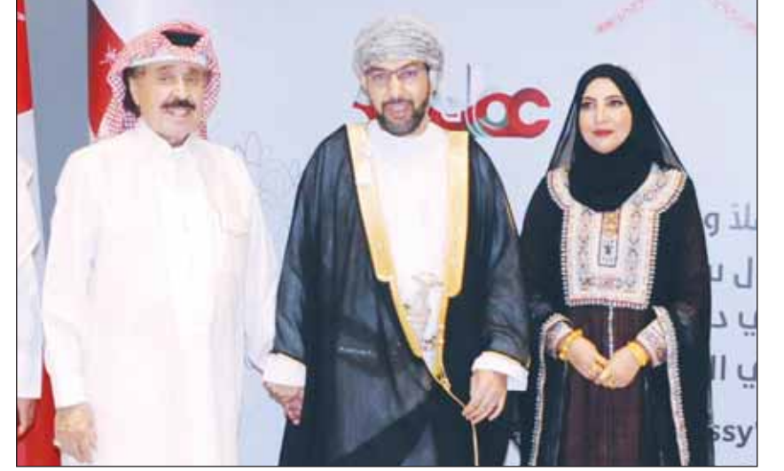
العميد رئيس التحرير أحمد الجارالله قدم التهانى