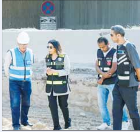
الوزير د. نورة المشعان خلال الجولة

تفقدت وزيرة الأشغال العامة د. نورة المشعان أمس أعمال طريق الدائري السابع للاطلاع والوقوف على آخر المستجدات ومتابعة التنفيذ ميدانياً. ووجهت د. المشعان الفرق المعنية بالوزارة والهيئة العامة للطرق والنقل البري الى المضي قدماً نحو استكمال تنفيذ الأعمال واستعمال المراحل التنفيذية، كما وجهت كذلك بضرورة تحقيق الإنجاز المطلوب في المواعيد المحددة لها وفق المعايير المتفق عليها. جدير بالذكر ان الوزيرة د. نورة المشعان كانت وقعت عقد