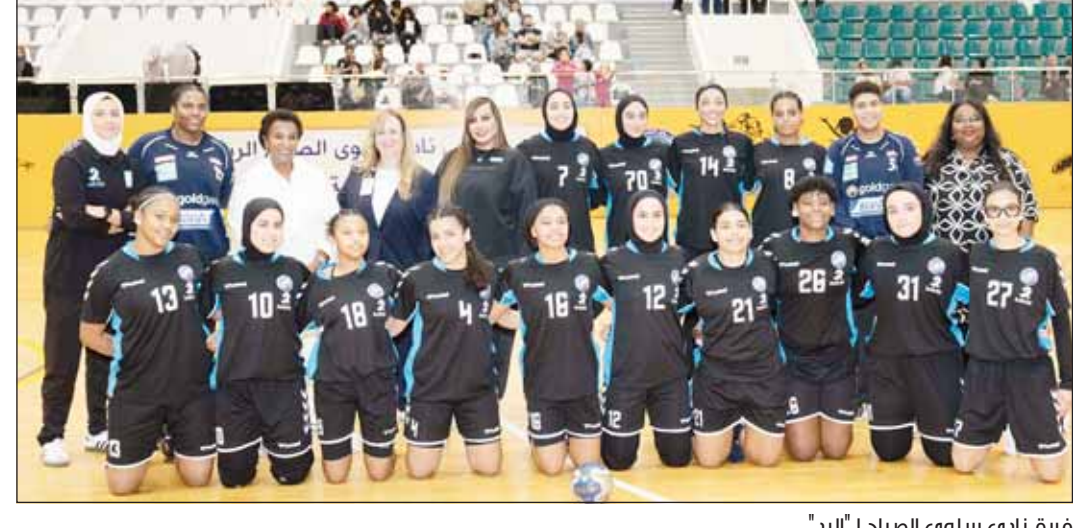
فريق نادى سلوى الصباح لـ "اليد"