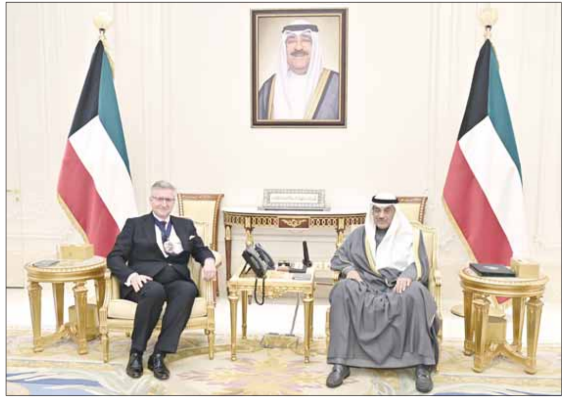
سمو ولي العهد الشيخ صباح خالد مستقبلاً عمدة لندن الدرمان كنج

حضرت اللقاء وزيرة المالية ووزيرة الدولة للشؤون الاقتصادية والاستثمار نورة الفصام ومدير مكتب سمو ولي العهد الفريق متقاعد جمال الدياب ووكيل الشؤون الخارجية بديوان سمو ولي العهد مازن العيسى وسفيرة المملكة المتحدة لدى الكويت بيليندا لويس.