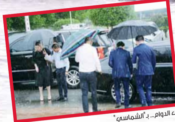
إلى الدوام... بـ الشمس

عن مياه الأمطار كما تتابع الوزارة حالة الأرصاد الجوية مع إدارة الأرصاد لاستباق التجهيز والاستعداد لأي حالة مطرية. وناشدت الوزارة عبر منصة x في حال وجود أي تجمع الأمطار أو شكوى الاتصال على الخط الساخن 150 أو الواتس اب. على خط مواز، تأهبت قوة الإطفاء العام في جميع مراكز الإطفاء للتعامل مع جميع البلاغات التي تصل إلى غرفة العمليات بالتزامن مع هطول الأمطار بالإضافة إلى انتشار رجال الأمن والدوريات والنجدة لتنظيم حركة السير، فيما أعلن الجيش عن تأهب واستعداد قوة الواجب "غيث" للمشاركة في تقديم الدعم والاسناد وكافة الخدمات اللوجستية والانسانية جراء الأمطار الغزيرة والاموال الجوية التي تشهدها البلاد.