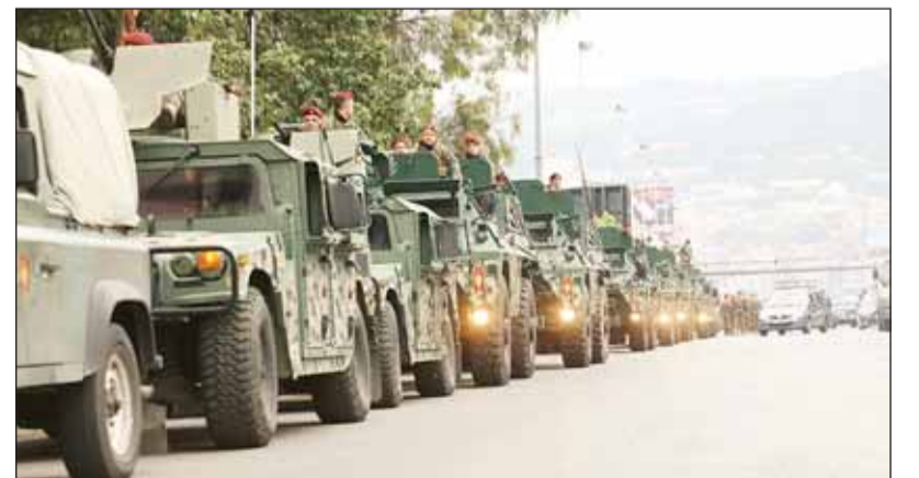
عربات الجيش اللبناني متجهة إلى الجنوب

وضعت حرب لبنان أوزارها مع دخول اتفاق لبنان وإسرائيل على وقف إطلاق النار حيز التنفيذ، أمس، فيما أعلن الجيش اللبناني بدء نقل وحدات عسكرية إلى قطاع جنوب نهر الليطاني، ليبدأ تعزيز انتشاره فيه، بالتنسيق مع قوة الأمم المتحدة الموقفة في لبنان (يونيفيل). (راجع ص12) وقال الجيش في بيان إن ذلك يأتي "استناداً إلى