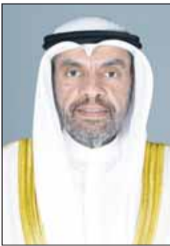
الوزير عبدالله الجعيا

الكويت. من جهة أخرى، قال الأمين العام لمجلس التعاون لدول الخليج العربية جاسم البديوي، إن الاجتماع الوزاري الـ162 لمجلس التعاون الخليجي سيعقد اليوم الخميس في الكويت برئاسة وزير الخارجية بدولة الكويت عبدالله الجعيا رئيس الدورة الحالية للمجلس الوزاري ويحضر وزراء خارجية دول مجلس التعاون. وأضاف، ان الاجتماع يأتي في إطار التحضيرات الجارية لانعقاد الدورة الـ45 للمجلس الأعلى لمجلس التعاون لدول الخليج العربية المقرر عقدها الأحد المقبل بحضور قادة دول مجلس التعاون.