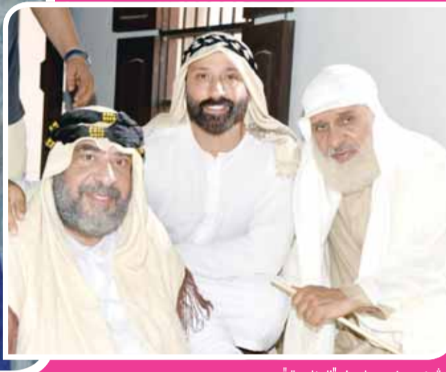
مشهد من مسلسل "الطابحة"