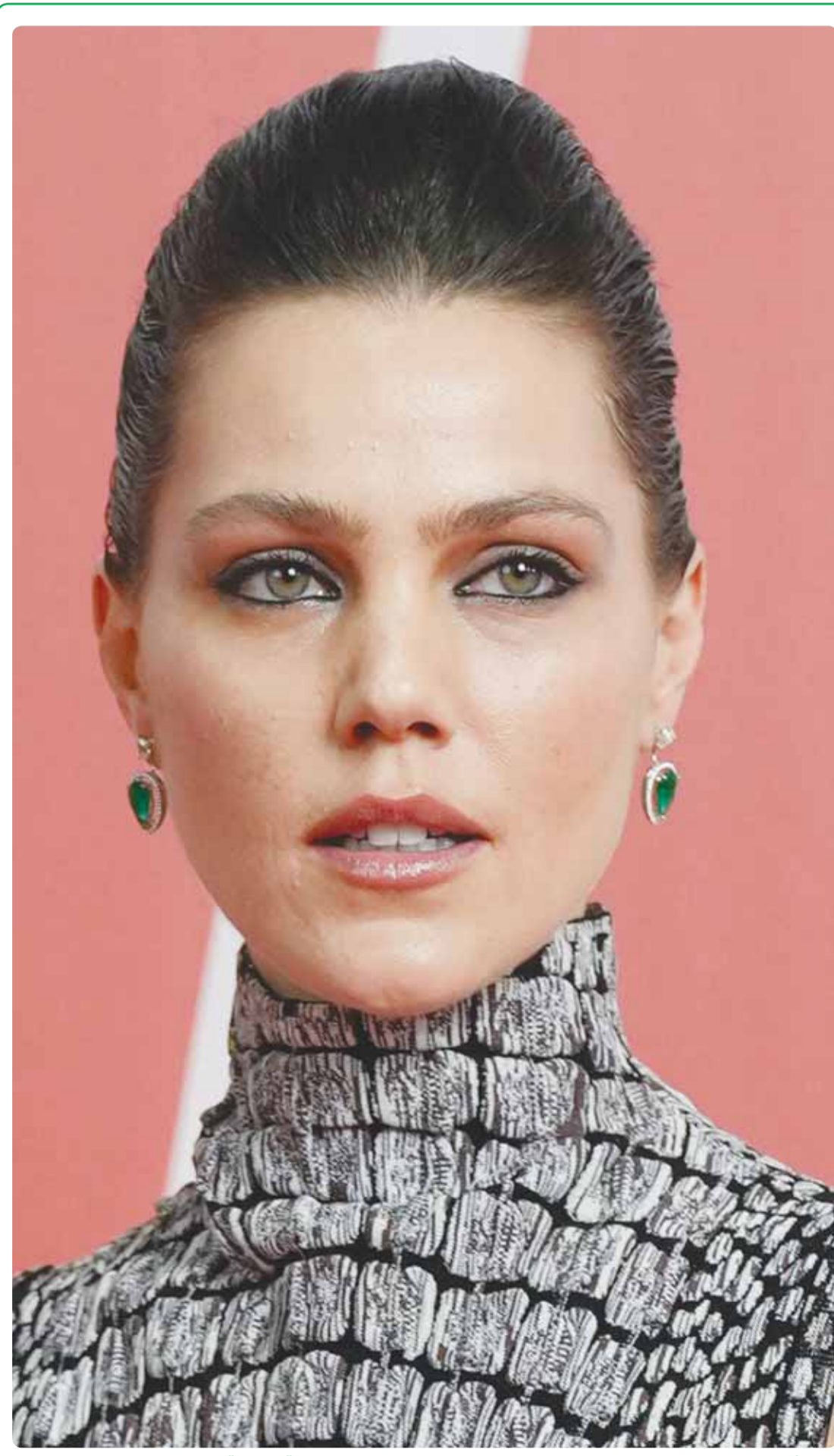
الممثلة البرازيلية بامبيليا تومبي خلال حضورها لإطلاق المسلسل التلفزيوني "Senna" في ساو باولو

فقد اثبتت أن الإصابة الشديدة بـ"كوفيد19" قد تسهم في تقليص حجم الأورام السرطانية من خلال تحفيز الجسم على إنتاج نوع خاص من الخلايا المضادة لها. ونشرت الدراسة في موقع "ساينس أليرت" العلمي، وورد فيها أن هذه النتائج تفتح أفقاً جديدة لفهم دور الجهاز المناعي في محاربة السرطان، خصوصاً أنها تستهدف العديد من الأدوية الحالية الجهاز المناعي لتعزيز قدراته الدفاعية. وفي الدارسة الجديدة ركز الباحثون على نوع من خلايا الدم البيضاء تعرف بالخلايا الوحيدة، إذ أنها تؤدي دوراً أساسياً في الدفاع عن الجسم ضد العدوى والتحديات الأخرى. فيمكن أن تحتفظ هذه الخلايا بوساطة الخلايا المصابة، وتحتول خلايا داعمة للورم تحميها من الهجمات المناعية.