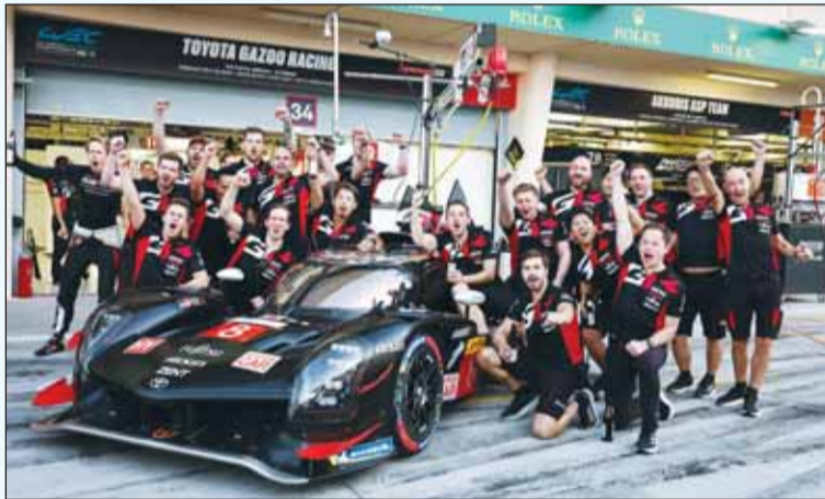
فريق "تويوتا جازو" خلال الاحتفال بالفوز

قدموه هو ما جعل هذا الموسم ناجحاً لفريق تويوتا جازو للسباقات، ومنح شركة تويوتا لقب البطولة عن فئة المصنعين".