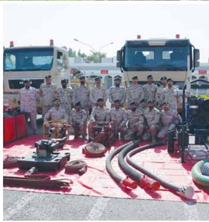
قوة الواجب "غيث" على أهبة الاستعداد لأي طارئ