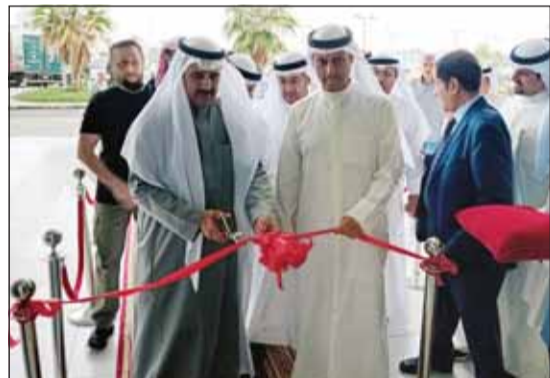
عزارة الحسيني خلال افتتاح معرض الغذاء

التجارة والصناعة في مكافحة ارتفاع الأسعار وذلك من خلال قياديي الوزارة وفرقها التنفيذية. ودعا جميع المستثمرين ورجال الأعمال الكويتيين الى ضرورة الاستثمار بالسوق المحلي كونها الأفضل وهي البيئة الآمنة للاستثمار.