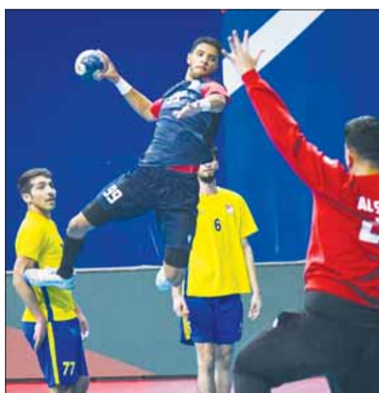
جانب من لقاء اليرموك والساحل

وبعد 8 جولات من المسابقة، باتت فرق العربي والسالمية