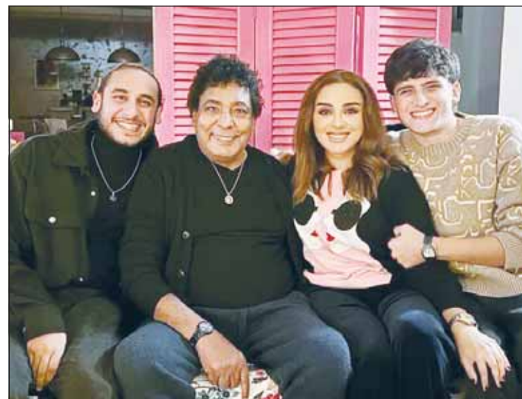
أنغام مع ابنها بصحة محمد منير

منير وإعادة نقله للمستشفى، واصفاً الأخبار المتداولة عن تدهور الحالة الصحية للكينج محمد منير بأنها "فبركة". وأضاف "أبو المجد"، خلال مداخلة هاتفية مع الإعلامية كريمة عوض، ببرنامج "حديث القاهرة"، المداع عبر قناة "القاهرة والناس"، أنه بعد انتشار الأخبار بشأن نقل الكينج للمستشفى توجه نقيب الموسيقيين الفنان مصطفى كامل ووكيل النقابة للاطمئنان على حالته الصحية، موضحاً أنه تم اكتشاف أنه لم يدخل العناية المركزة أو أنه يعاني من أي أزمة أو وعكة صحية، والأمر لا يتخطى إجراء الفحوصات الطبية للاطمئنان على حالته الصحية. وأشار إلى أن الفنان محمد منير حاليا في منزله بعد إجراء الفحوصات الطبية بالمستشفى، مضيفاً، "الكينج تواجد في المستشفى لمدة 48 ساعة للفحص الطبي الشامل ولم يكن يعاني من أي أزمت صحية كما تداولت المواقع والصفحات على مواقع التواصل الاجتماعي"، مؤكداً أن ما حدث هو متابعة دورية وهو بخير الآن.