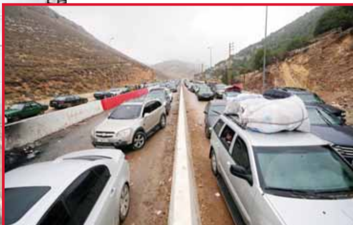
طوابير من السيارات تحمل النازحين العائدين إلى لبنان عند معبر المصنع الحدودي مع سورية