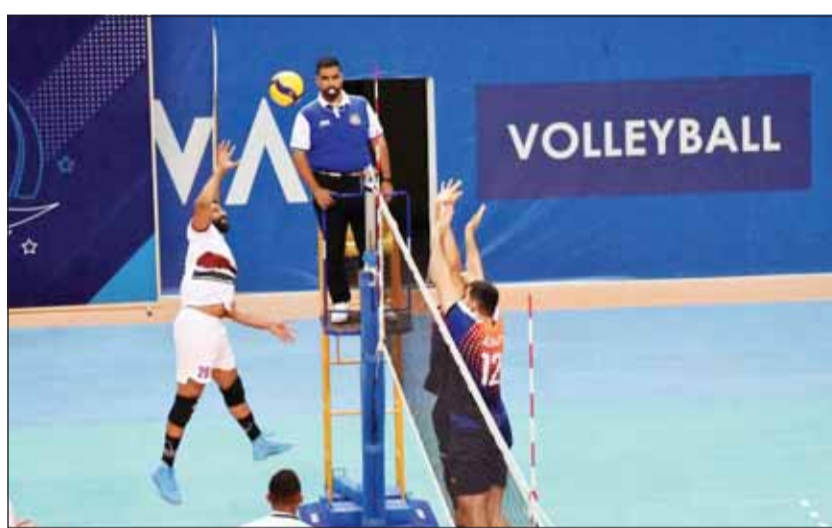
فوز سهل لكازمة على النصر أول من أمس

وفي مباريات أول من أمس، حقق كازمة انتصاراً سهلاً على النصر 0-3 في اللقاء الذي جمعتهما ضمن الجولة الرابعة من البطولة التي شهدت