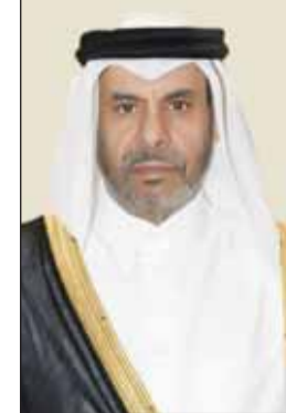
السفير علي آل محمود

اتخاذ موقف خليجي موحد تجاه الهجمات الإسرائيلية البربرية على قطاع غزة ولبنان