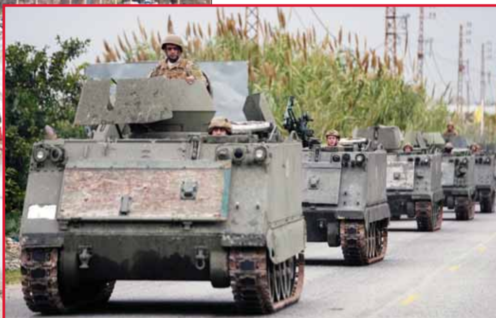
جنوب لبيانيون في قافلة مع مركبات الجيش في الطريق لبيسط سيطرتها على قرى جنوب لبنان