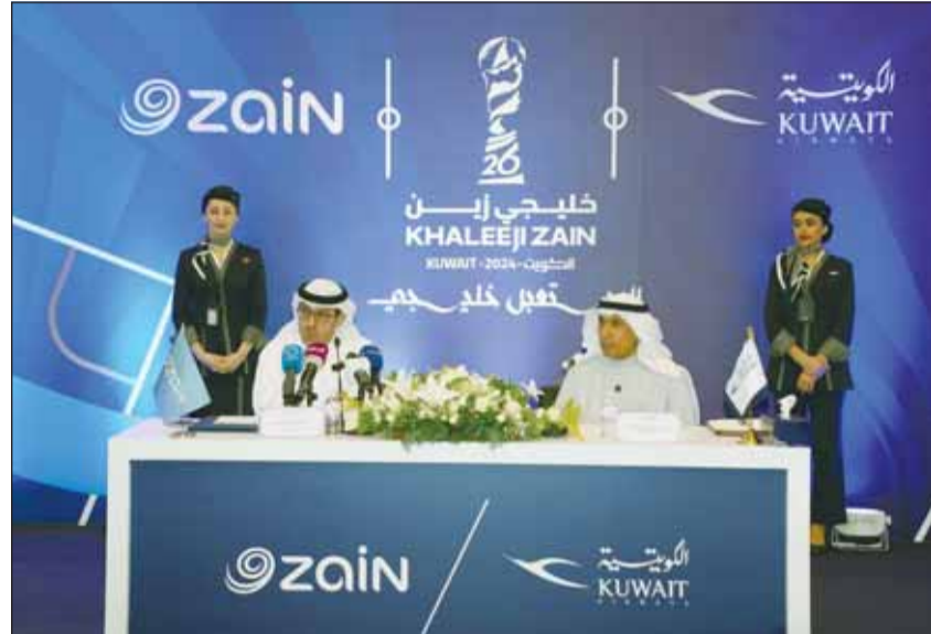
جانب من حفل إعلان الشراكة