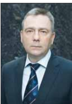
السفير فلاديمير جيلتوف

التطور بمختلف المجالات بالرغم من الأوجه العالمية المتوترة". وأوضح السفير الروسي أن بلاده تحرص على تعزيز الحوار المتعدد الأطراف مع شركائها في الخليج، وهو متوافر في شكل الحوار الاستراتيجي بين روسيا ومجلس التعاون الخليجي، الذي يعقد سنويا على المستوى الوزاري، حيث عقدت دورته الأخيرة في سبتمبر الماضي بالسعودية، ومن المقرر عقد الاجتماع المقبل عام 2025 في روسيا، حيث تترأس الكويت مجلس التعاون الخليجي.