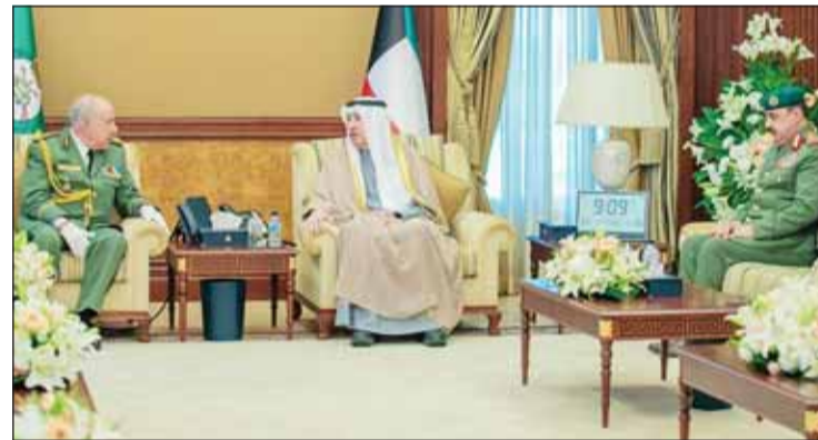
الشيخ مبارك الحمود خلال استقباله رئيس أركان الجيش الجزائري بحضور وكيل الحرس الوطني

لرئيس أركان الجيش الوطني الشعبي الجزائري والوفد المرافق له حيث تم خلال اللقاء بحث أهم الموضوعات ذات الاهتمام المشترك. وأكد الفريق الرفاعي أهمية الزيارة في فتح باب التواصل والتنسيق والتعاون