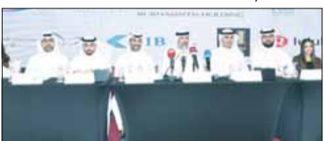
منظمو البطولة خلال المؤتمر الصحفي

أعلنت مجموعة بوخمسين القابضة بالتعاون مع شركة "فورما فتنس" عن إقامة حدث رياضي كبير يتمثل في بطولة "فورما هايركس" يوم 11 يناير المقبل في مواقف فندق "هوليدي إن السالمية".