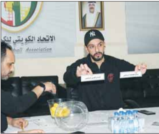
جانب من سحب القرعة

على اللقب من جهة أخرى. وفي المباراة الأخرى ستكون الفرصة سانحة أمام العربي السادس بـ 6 نقاط إلى تحقيق الانتصار على اليرموك السابع (3 نقاط) نظراً للفرق الفني بينهما. من جانب آخر، سحبت أول من أمس قرعة بطولة الدوري العام وبطولة السوبر لفتة العمومي للموسم الرياضي 2024-2025. واسفرت القرعة عن مواجهات الجولة الأولى، حيث ستجمع العربي مع كاظمة، الشباب مع التضامن، الصليبخات مع النصر، القادسية مع الساحل، برقان مع اليرموك، فيما جنبت الكويت خوض الجولة الأولى. وفي بطولة السوبر، سيلتقي الكويت مع كاظمة، والقادسية مع العربي، على أن يتأهل الفائز للمباراة النهائية للبطولة.