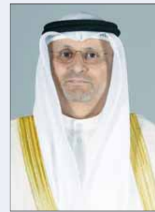
الوزير عمر العمر

أكد وزير الدولة لشؤون الاتصالات عمر العمر أمس، حرصه على تعزيز المكانة الإقليمية لدولة الكويت باعتبارها مركزاً رائداً في مجال التكنولوجيا والابتكار ودعم ريادة الأعمال وامتضان الطاقات الشبابية وتمكينها من التميز والإبداع في مسيرة التنمية المستدامة. جاء ذلك في كلمة ألقاها العمر خلال رعايته افتتاح معرض (نيكسز) لعام 2024 للتكنولوجيا والابتكار والشركات الناشئة الذي يعد منصة تجمع أهم الخبراء والشركات الناشئة في مجالات الذكاء الاصطناعي والتحول الرقمي والأمن السيبراني وتكنولوجيا الاتصالات ويستمر