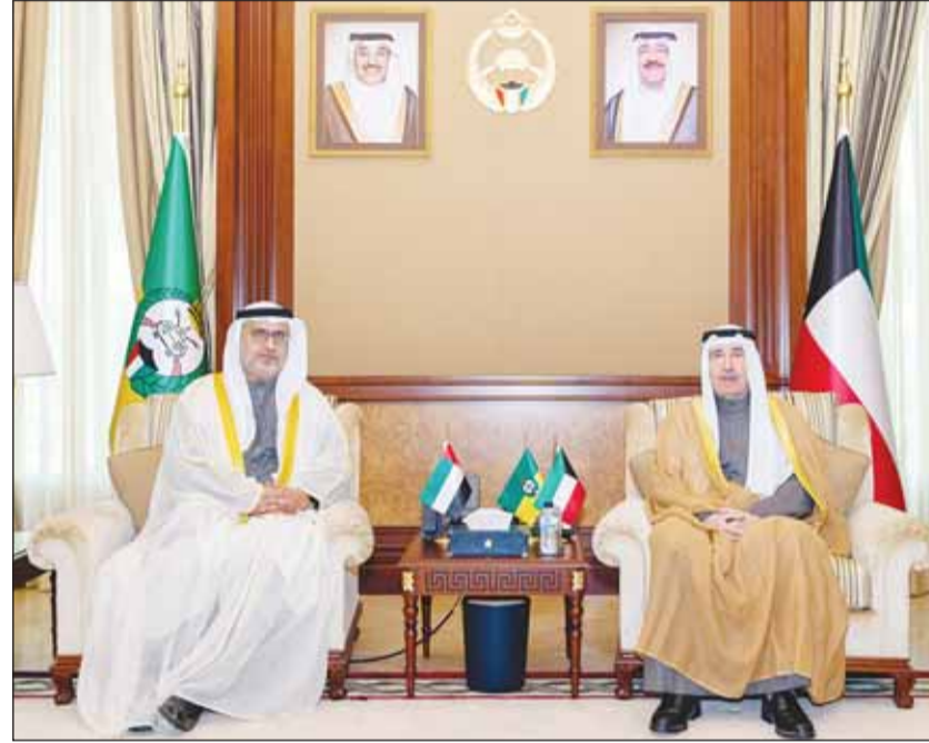
رئيس الحرس الوطني الشيخ مبارك الحمد مستقبلاً سفير الإمارات د.مطر النيايدي

أشاد رئيس الحرس الوطني الشيخ مبارك حمد الصباح بالروابط التاريخية وعمق العلاقات المتميزة بين دولتي الكويت والإمارات العربية المتحدة الشقيقة. جاء ذلك حسب بيان صحفي للحرس الوطني أمس، خلال استقبال الشيخ مبارك الحمد في ديوانه بالرئاسة العامة للحرس سفير الإمارات لدى الكويت الدكتور مطر النيايدي الذي قدم له التهنئة بمناسبة حصوله على ثقة القيادة السياسية وتعيينه رئيساً للحرس الوطني. وأضاف البيان أن رئيس الحرس الوطني تقدم من جهته بالشكر والتقدير للسفير النيايدي على تهنته.