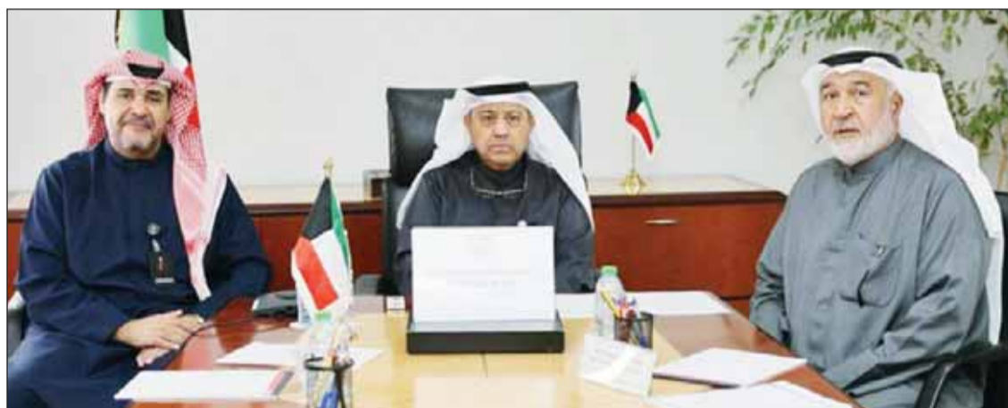
وزير النفط طارق الرومي منوطاً لوفد الكويت المشارك بالتحالفات "أوبك+" عبر تقنية الاتصال المرئية

تخفيضات إنتاج النفط الإجمالية للمجموعة بمقدار 3,65 مليون ب/ي حتى نهاية 2026. ومن المقرر أن يعقد الاجتماع الوزاري التاسع والثلاثون لأوبك والدول غير الأعضاء في المجموعة في 28 مايو 2025. وقال محلل السلع الأساسية لدى رابوتن للأوراق المالية، ساتورو يوشيدا، "يراقب المشاركون في السوق عن كثب معرفة ما إذا كان "أوبك+" سيركز على دعم الأسعار من خلال تمديد تخفيضات الإنتاج، أو يختار الدفاع عن حصته في سوق النفط الخام العالمية من خلال تخفيف تلك التخفيضات". وأضاف أن "قرار" أوبك+" ربما يثير رد فعل قصير الأجل، لكن من المرجح أن ترتفع سوق النفط بحلول نهاية العام وسط توقعات بانتعاش الاقتصاد الأمريكي في ظل إدارة ترامب والتوترات المستمرة في الشرق الأوسط". وسبق الاجتماع الوزاري انعقاد الاجتماع الـ 57 للجنة المراقبة الزوارية المشتركة التي ناقشت أوضاع السوق ورفعت توصياتها إلى الاجتماع الوزاري للتحالف الذي يضم الأعضاء في منظمة الدول المصدرة للنفط (أوبك) والدول المنتجة للنفط من خارج المنظمة. وقال هاينز غارتنربروفيوسور في جامعة فيينا ومدير مركز الدراسات الاستراتيجية في النمسا في تصريح لـ "كونا" إن أبرز التحديات التي تواجه السوق النفطية حالياً تتعلق بالضغوط الاقتصادية العالمية بما في ذلك ارتفاع معدلات التضخم وزيادة تكاليف الطاقة. وأضاف أن تحالف (أوبك+) يبذل جهوداً كبيرة لتعزيز التنسيق بين أعضائه لتحقيق استقرار السوق وضمان التوازن بين العرض والطلب، مشيراً إلى أن أسعار النفط شهدت خلال الأشهر الماضية تقلبات حادة تراوحت بين الارتفاع لأكثر من 90 دولاراً للبرميل في بعض الأحيان والتراجع في فترات أخرى بسبب انخفاض الطلب.