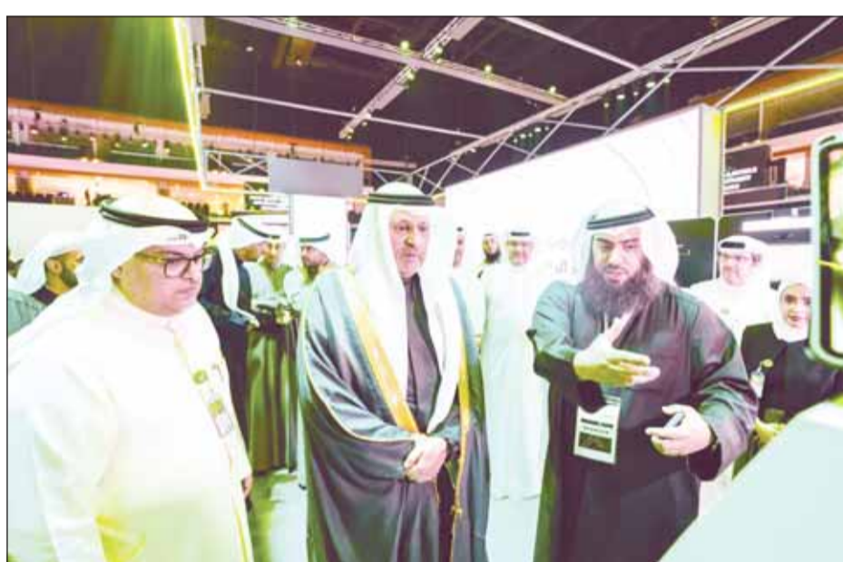
استعراض خدمات "بيتك" لوزير الاتصالات

Nexus، أكبر تجمع تكنولوجي و رقمي في الكويت، لتعزيز ريادة الأعمال وتطوير حلول تقنية مبتكرة لمستقبل مستدام. يذكر أن جناح "بيتك" في Nexus يضم أكبر مركز تكنولوجي يشمل أجهزة رقمية متطورة تقدم تجربة مبتكرة للعملاء والزوار، وقام فريق "بيتك" بتقديم شرح عن تلك الأجهزة والحلول الرقمية للحضور ووزير الدولة لشؤون الاتصالات عمر العمر خلال زيارته لجناح "بيتك" والذي ثمن بدوره المبادرات الرقمية المميزة لبيتك ودوره الكبير في دفع التحول الرقمي. ويعتبر بيت التمويل الكويتي "بيتك" مؤسسة