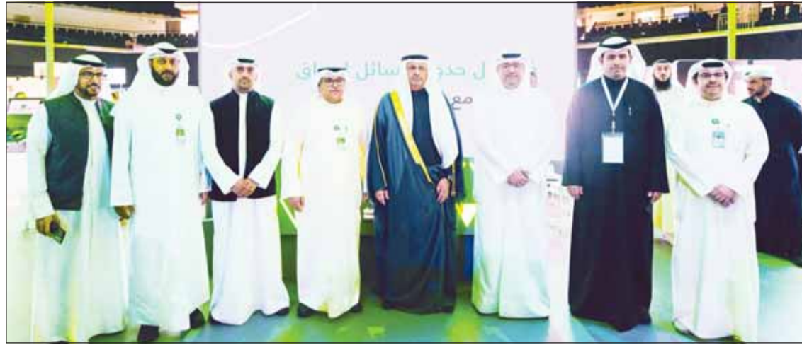
وزير الدولة لشؤون الاتصالات عمر العمر متوسطا يوسف الرويح وطارق العجيل وفريق "بيتك"