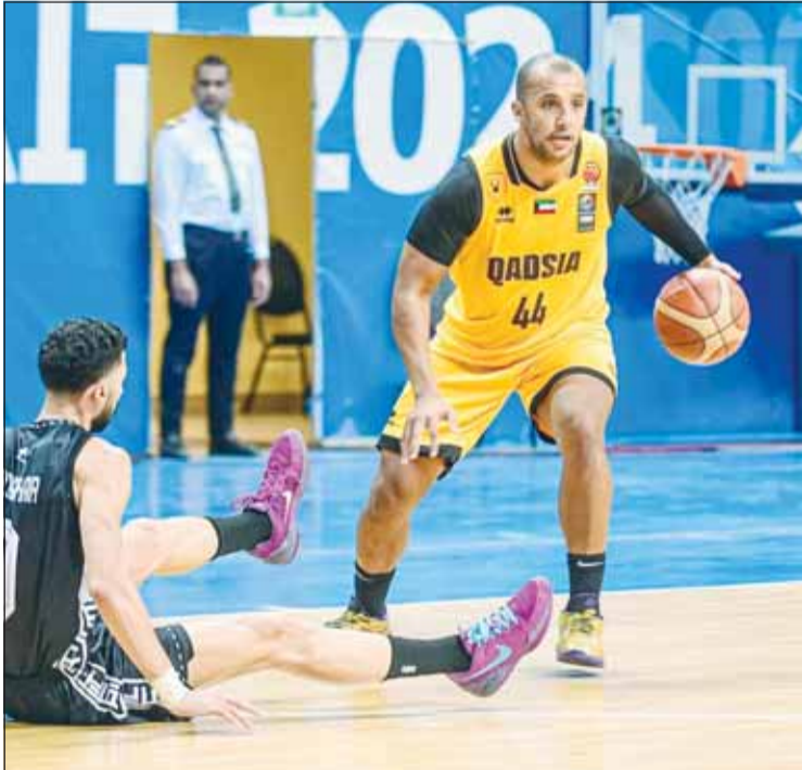
القادسية أطاح بالقرنين بسهولة

تصدر القادسية دوري كرة السلة، بعد أن فاز على القرنين 76-118، أول من أمس ضمن الجولة الرابعة من الدور الأول للمسابقة، وفي مباراة أخرى، تغلب النصر على الصليبخات 107-102. ورفع القادسية رصيده إلى 6 نقاط، في حين ارتفع رصيد النصر إلى 5 نقاط أيضاً والصليبخات 4 والقرنين نقطتان. وأستم الربع الأول من لقاء القادسية مع القرنين باللندية، قبل أن ينهي الأصفر الربع الأول لمصطلحه 29-24، ولم يختلف الربع الثاني عن سابقه بعدما تبادل الفريقان التسجيل، حتى اللحظات الأخيرة التي شهدت تسجيل القادسية ثلاثيتين وسلّة دون أي رد من منافسه ما منحه الأفضلية ليخرج مقدماً 49-40. وكان الربع الثالث نقطة التحول في المباراة بعدما تلقى الكرواتي زيتش في التسجيل من داخل وخارج القوس وسط تسرع من لاعبي القرنين في إنهاء الهجمات ما سمح للقادسية برفع الفارق مع نهاية الربع الثالث إلى 16 نقطة 79-63، واستطاع القرنين تقليص الفارق في الربع الرابع إلى 10 نقاط 81-71، قبل أن يستعيد الأصفر الأفضلية وينهي المباراة لمصلحته.