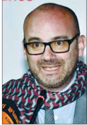
السفير أوليفيه غوفان