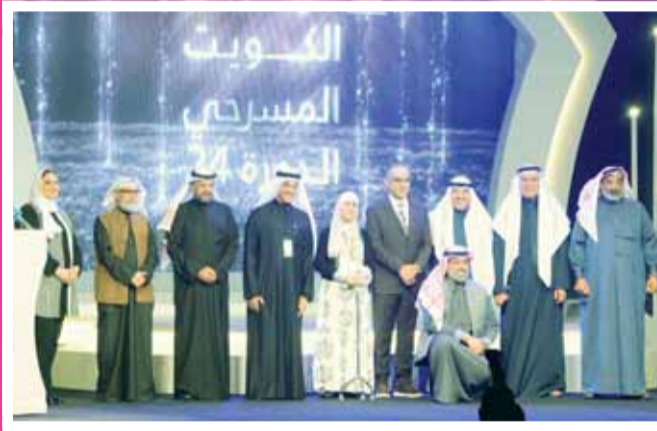
المكرمون وأعضاء لجنة التحكيم