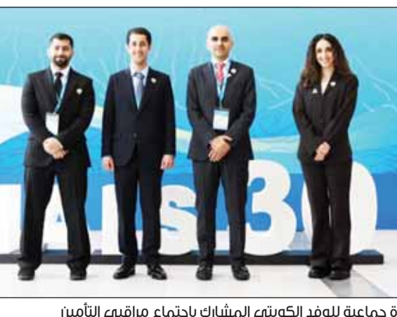
صورة جماعية للوفد الكويتي المشارك باجتماع مراقبي التأمين