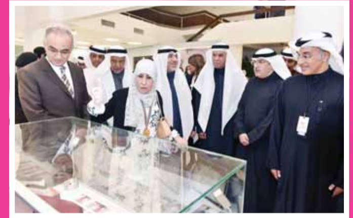
افتتاح المعرض الفني