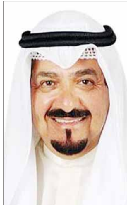
سمو أمير البلاد الشيخ مشعل الأحمد