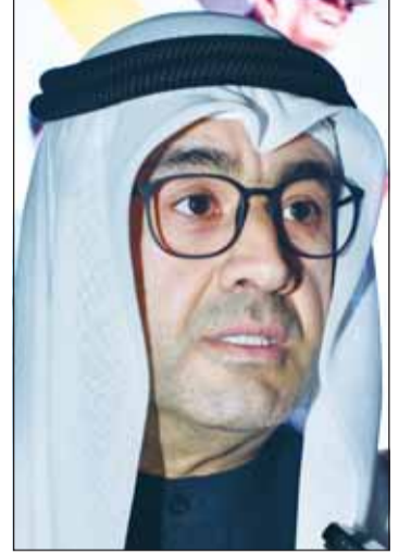
السفير صادق معرفي

سوتيا، ويخوض نحو 10 آلاف منهم اختبار اللغة الفرنسية في الثانوية العامة، مشيراً إلى أن "قسم اللغة الفرنسية في جامعة الكويت يلعب دوراً محورياً في تعزيز الثقافة واللغة الفرنسية، مع وجود 300 طالب مسجلين في القسم". وسلط السفير الفرنسي الضوء على الجهود المبذولة لدعم الفرائنكوفونية في الكويت، لاسيما من خلال إنشاء المجلس لتعزيز الفرائنكوفونية عام 2021، الذي يضم سفراء الدول الأعضاء في الفرائنكوفونية، كما يحظى بدعم سمو الشيخ ناصر المحمد، الذي يترأس المجلس شرقياً.