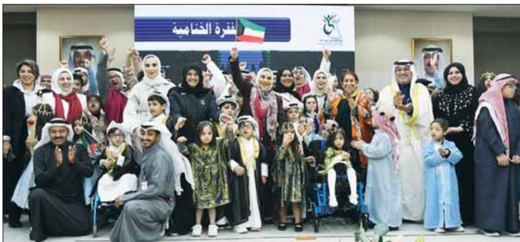
الوزيرة الحويولة وعدد من ممثلي الجهات الحكومية يشاركون ذوي الاحتياجات احتفالهم باليوم العالمي

المختلفة من رسومات وأعمال فنية وتقديم فقرات على المسرح تمثل رسالة بأنهم مؤثرون وقادرون على النجاح على كل الصعد. وذكر أن إحياء اليوم الدولي لذوي الإعاقة (الذي يصادف 3 ديسمبر كل عام) ليس بالفريب على الشعب الكويتي وقيادته السامية الحكيم التي منحت الحقوق لذوي الإعاقة وأنشأت المراكز والمدارس المتنوعة بهدف تعليمهم وتأهيلهم إلى جانب العمل على دمجهم في سوق العمل، معرباً عن الشكر لوزارة الشؤون وهيئة ذوي الإعاقة على تنظيم هذه الفعالية الهادفة.