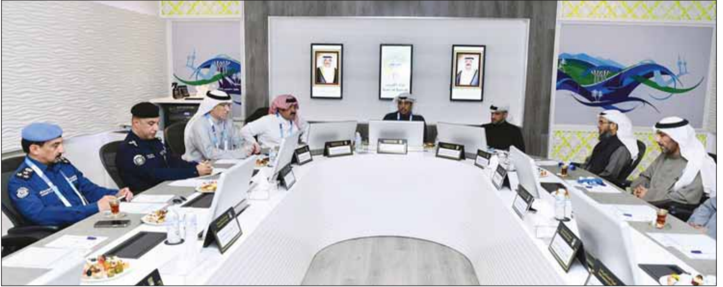
جانب من الاجتماع أمس