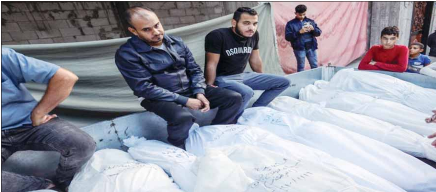
جثامين لشهداء فلسطينيين مهجرة للدفن في مئواها الأخير

في غضون ذلك، ظهرت إلى السطح مرة أخرى قضية زوجة الرئيس الكوري الجنوبي يون سوك يول، بقبولها هدية من قس أميركي كوري. وكشفت مصادر بارزة أن النائب السابق وليد جنبالا يستعد للقيام بجولة مشابهة، وأنه مطلع الأسبوع المقبل على مساعلة الرئيس، بسبب محاولته فرض الأحكام العرفية، التي تراجع عنها بعد ساعات، واستقال وزير الدفاع الذي أقيمت عليه مسؤولية تقديم مشورة فرض الأحكام العرفية للرئيس.