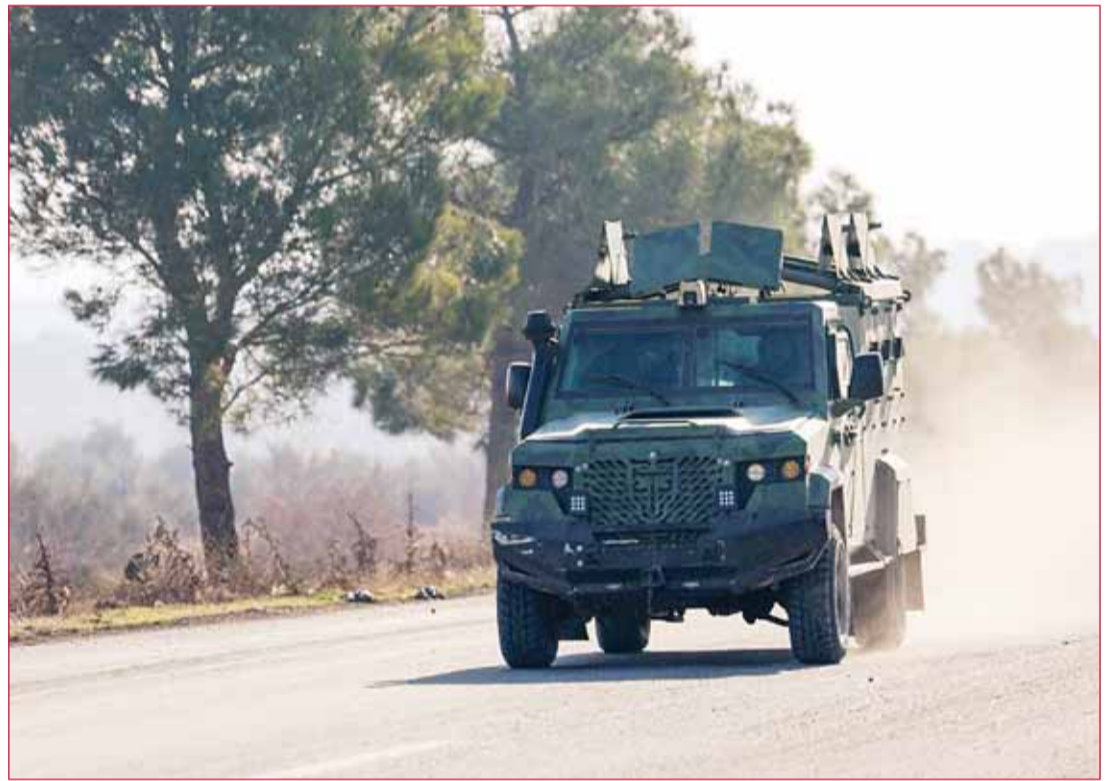
مقاتلون من فصائل المعارضة السورية المسلحة يقودون مركبة مدرعة على طريق دمشق عند وصولهم إلى بلدة صوران شمال حماة

من جهته، أعلن الجيش السوري في بيان أن وحداته العسكرية