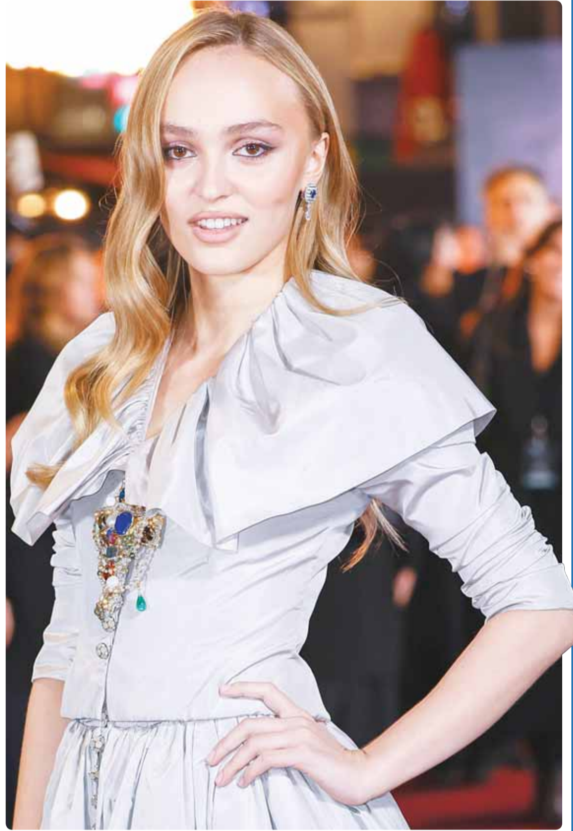
الممثلة الأميركية ليلي روز ديب خلال حضورها العرض الأول لفيلم "توسفاراته" في لندن

لندن - وكالات، خلص باحثون إلى أن تناول قطع من الشكولاتة الداكنة خمس مرات أسبوعيا، مع تجنب تناول شكولاتة الحلبي ارتبط بالحد من خطورة الإصابة بداء السكري من النوع الثاني. واعلن الباحثون أن العلاقة بين تناول الشكولاتة وخطورة الإصابة بداء السكري من النوع الثاني مثيرة للجدل. ومن أجل هذه الدراسة، استخدم الفريق البحثي بيانات من ثلاث دراسات مستمرة منذ فترة طويلة حول الممرضين والعاملين في مجال الرعاية الصحية في الولايات المتحدة. وفحص تحليل استبيانات بشأن معدل تكرار تناول الطعام، يتم إجراؤها كل أربعة أعوام، العلاقة بين داء السكري من النوع الثاني وتناول الشكولاتة بصورة عامة لدى 192 ألفا و280 شخصا، ونوع الشكولاتة - داكنة أو بالحليب لدى 111 ألفا و654 شخصا. وبلغ متوسط فترة المراقبة 25 عاما. وخلص الباحثون إلى أن الذين يتناولون 3. 28 غرام من الشكولاتة، ما لا يقل عن خمس مرات أسبوعيا، تنخفض لديهم فرصة الإصابة بداء السكري من النوع الثاني بنسبة 10 في المئة، مقارنة بالذين لا يتناولون الشكولاتة مطلقا أو نادرا ما يتناولونها.