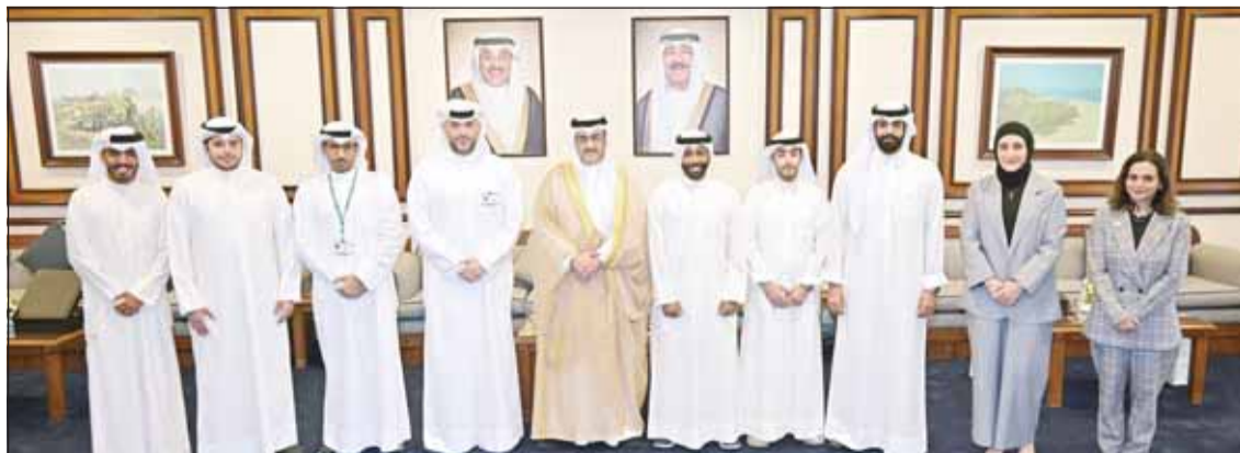
صورة جماعية خلال حفل التكريم

وفريقه التطوعي مع محافظة العاصمة، وذلك في إطار الترتيبات التي ينظمها البنك التجاري مع محافظة العاصمة لرعاية الأنشطة الاجتماعية لخدمة أفراد المجتمع.