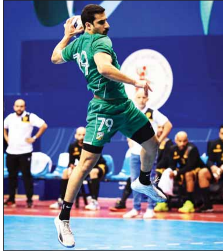
تنتظر العربي مواجهة صعبة أمام الكويت

تحتضن صالة مجمع الشيخ سعد العبدالله للصالات المغفظة اليوم ثلاث مواجهات حاسمة ومثيرة في الجولة الـ 11 من الدور التمهيدي لدوري كرة اليد، حيث يلتقي الكويت حامل للقب مع العربي في السابعة والنصف مساءً، كما يواجه السالمية نظيره كاظمة في السادسة مساءً، في حين تفتتح المنافسات بقاء هام يجمع خيطان مع الصليبخات في الرابعة والنصف عصراً. ويأمل الكويت رابع الترتيب بـ 12 نقطة، الذي يقوده المدرب الوطني هيثم الرشيد في مواصلة عروضه القوية وتحقيق انتصار جديد على العربي الذي خاض 3 مباريات أكثر من خصمه وهو يحتل المركز الثالث بـ 14 نقطة. وفي المباراة الثانية ستكون المنافسة على أشدها بين السالمية الثاني بـ 14 نقطة والذي خاض 10 مباريات، وكاظمة السابع بـ 10 نقاط والذي خاض 6 مباريات فقط. وفي المباراة الأخيرة يبدو الصليبخات الثامن بـ 10 نقاط بأهمس الحاجة إلى تحقيق الفوز على نظيره خيطان الـ 11 بـ 6 نقاط، من أجل المحافظة على آماله في التأهل إلى الدرجة الممتازة التي تضم الفرق الستة الأولى في الدور التمهيدي.