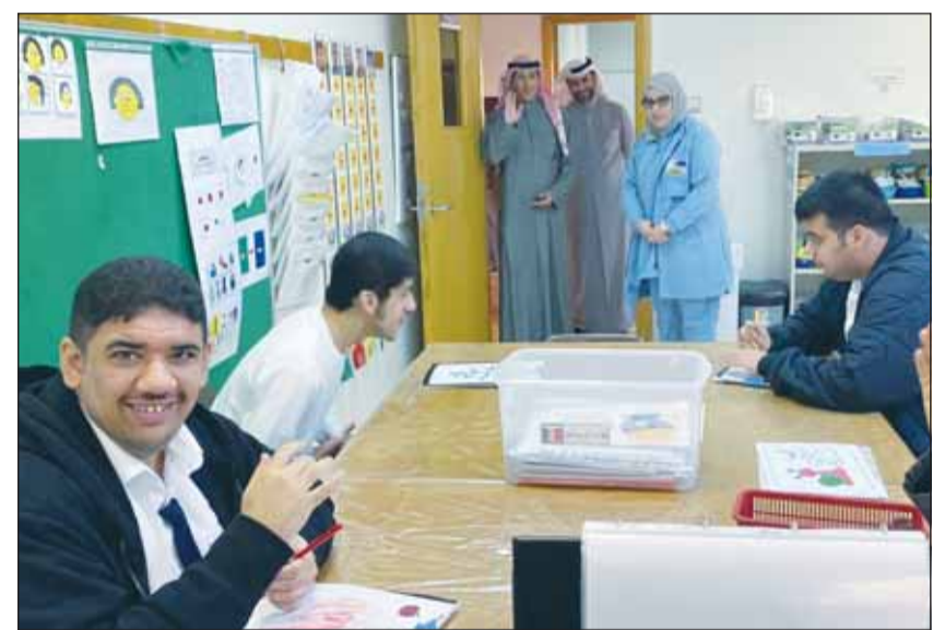
الوزير د.محمد الهوسمي خلال تفقده مركز التوحد

وأضافت، إن الكويت تولي اهتماماً كبيراً بقضايا ذوي الإعاقة وأن قانون حقوق الأشخاص ذوي الإعاقة رقم (8) لسنة 2010 يعتبر نموذجاً مشرفاً للتشريعات الوطنية التي تدعم هذه الفئة إذ يهدف إلى توفير منظومة متكاملة من الحقوق والخدمات التي تمكنهم من تحقيق تطلعاتهم، مؤكدة أن الكويت ملتزمة بتنفيذ المزيد من المبادرات والمشاريع التي تخدم الأشخاص ذوي الإعاقة ودمجهم بشكل كامل في المجتمع. وأعربت عن الشكر والتقدير لهيئة شؤون ذوي الإعاقة وكل الجهات والفرق التي ساهمت في تنظيم هذه الفعالية مشددة على التزام الهيئة بمواصلة