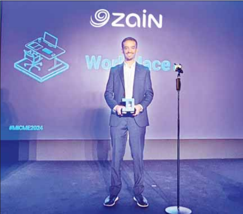
صورة خلال تسلم الجائزة

على رفاهية الموظفين والصحة العقلية، برنامج زين لتنمية الشباب ZY الذي تسعى فيه إلى تمكين الشباب المهرة داخل بيئة العمل، منصة ZAINIAC التي تقدم فرص عمل جديدة للأفكار الناشئة، ومبادرة BE WELL لرفاهية الموظفين. وتعد شركة ZainTECH الذراع التكنولوجي لمجموعة زين من أفضل الشركات في مجالات الابتكار، وذلك لدورها في عمليات التحول الرقمي في أسواق الشرق الأوسط، ودعمها للمؤسسات الحكومية والخاصة عبر توفير مركز فريد من نوعه للتميز والمولود الاستشارية والمهنية والمهارة في العديد من قطاعات تكنولوجيا المعلومات والاتصالات، بما في ذلك السحابة، الأمن السيبراني، البيانات الضخمة، إنترنت الأشياء، الذكاء الاصطناعي، المدن الذكية، الطائرات بدون طيار، الروبوتات، والتقنيات الناشئة. وتدير شركة ZainTECH مختبر بيانات يعمل كمركز ابتكار متعدد التخصصات، حيث يجمع بين العقول المتمسكة والأفكار المبتكرة من خلال نظام بيئي يجمع تحالفات وشراكات البيانات التي تعزز الاستخدام الفعال والأمن والمسؤول للبيانات، ويبرز فوز شركة ZainTECH بجائزة أكثر الشركات ابتكاراً للقطاع المؤسسي التنوع في التطبيقات التكنولوجية لمحفظة أعمالها عبر 8 أسواق في المنطقة.