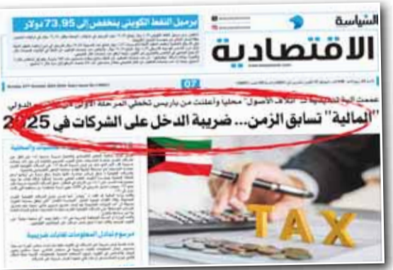
خبر "السياسة" في 27 أكتوبر الماضي

بعد الأول من يناير 2026، وبدء سريان القانون على باقي الفئات المكلفة على الفترات الضريبية التي تبدأ بعد الأول من يناير 2027.