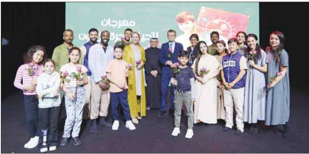
فازعة السقايف والسفير الإسباني مانويل إيراندنيث غمايو والدكتورة تينا زاوبفيتش يتوسطون المشاركين