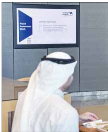
جانب من مشاركة "الوطني" في الفعالية

بالقضايا المتعلقة بالاحتيال والخطوات التي يجب اتباعها لضمان أمن الحسابات المصرفية والشخصية. وتعكس مثل هذه المبادرات والأنشطة حرص بنك الكويت الوطني على تمكين موظفيه وإطلاعهم على أحدث طرق الاحتيال الشائعة، ودعم الجهود العالمية الرامية إلى رفع الوعي المالي للتصدي لكافة أشكال الاحتيال وضمان الاستقرار الاقتصادي وتعزيز الثقة في القطاع المصرفي. ويؤمن بنك الكويت الوطني إيماناً راسخاً بأن الوعي هو مفتاح مكافحة عمليات الاحتيال، لذلك يحرص البنك على تكثيف المحتوى التوعوي الذي ينشره عبر صفحاته في وسائل التواصل الاجتماعي، ولتحسين لمخاطبة مصالح العملاء وتعزيز ثقافتهم، وتوفير بيئة مصرفية آمنة، خاصة في ظل التطورات التكنولوجية السريعة وتقنيات الذكاء الاصطناعي. كما يسخر البنك كافة إمكاناته الهائلة، بما في ذلك جميع قنواته الرقمية التي تحظى بمتابعة هي الأكبر على مستوى مصارف الكويت، وذلك لضمان وصول أهداف حملة التوعية المصرفية "لنكن على دراية" إلى أكبر شريحة ممكنة من الجمهور.