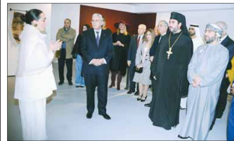
الفاتنة راية تشجر فكرة المعرض للسفيرين الفلسطيني والعالمي والظهور

لجنة الفاتنة وهي تعود لما قبل 1948 ويتم عرضها بهذا المعرض من أجل ان يرى الجمهور بأن الشعب الفلسطيني شعب حضاري ومتطور دون تدخل غربي. وأضاف ان المعرض يعكس صراع الهوية والصراع الداخلي لآبناء الشعب الفلسطيني خاصة الذين يعيشون خارج فلسطين المحتلة. وقال انها تحاول الوصول الى الجمهور العربي