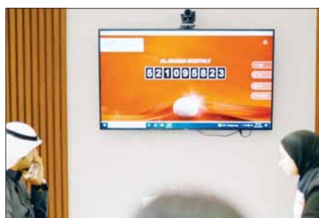
جانب من السحب تحت إشراف وزارة التجارة والصناعة

في إطار حرصه على مكافأة عملائه، أعلن بنك الخليج أسماء 10 فائزين في السحب الشهري عن شهر نوفمبر الماضي بجائزة قيمتها 1,000 دينار لكل منهم، والفائزون العشرة هم: