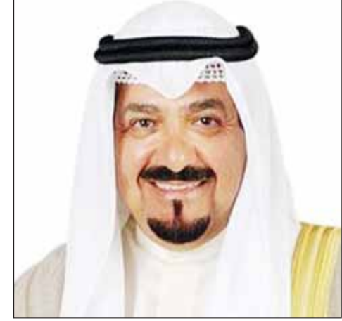
سمو الشيخ أحمد العبدالله

أكد مدير الإدارة العامة للطيران المدني (بالتكليف) دعيح العتيبي أمس أن الإدارة تولى تحقيق أعلى معايير الأمن والسلامة اهتماماً بالغاً بالتعاون مع المنظمة الدولية للطيران المدني (إيكو) وكل المنظمات الإقليمية والدولية. وقال العتيبي - في تصريح صحفي بمناسبة احتفال الإدارة باليوم العالمي للطيران المدني الذي يصادف السابع من ديسمبر كل عام - إن دولة الكويت نجحت في تطوير البنية التحتية لقطاع النقل الجوي واعتمدت أفضل المعايير الدولية في مجال صناعة الطيران المدني. وأضاف: إن هذه الجهود ساهمت في تعزيز كفاءة الخدمات الجوية ما انعكس إيجاباً على تجربة المسافرين وأدى إلى تحسين مستوى الأمان والراحة في الرحلات الجوية، وأكد التزام البلاد بالتطوير المستمر لهذا القطاع الحيوي، مؤكداً أن (الطيران المدني) نجحت في تطوير البنية التحتية للقطاع وإنشاء مدينة شحن جديدة