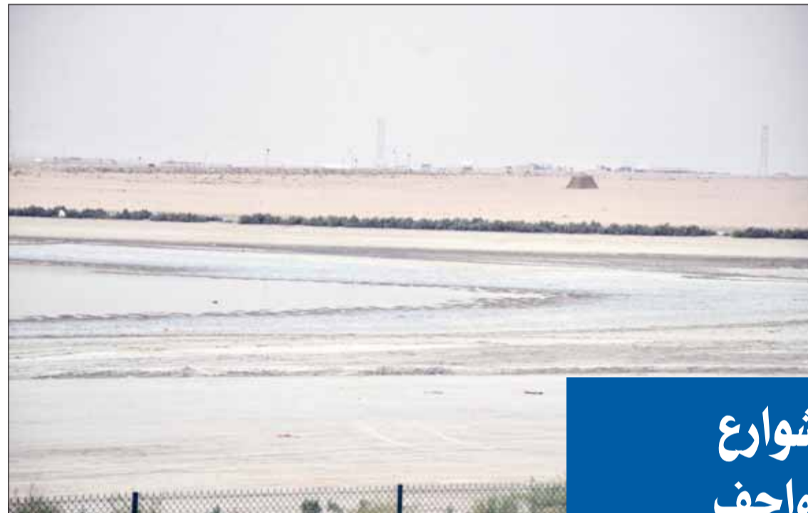
مستنقعات مياه الأمطار الملسودة