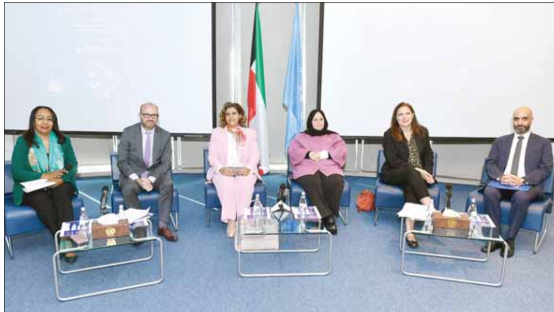
المندوبون في الحلقة النقاشية

وبيّن أن من جهود البلاد أيضاً إنشاء مراكز إيواء لضحايا العنف الأسري لتقديم المساعدة النفسية والاجتماعية والقانونية علاوة على إطلاق خطوط ساخنة لاستقبال البلاغات وضمان السرية التامة وتقديم الدعم الفوري للنساء وتوفير الحماية الفورية لهن. ولقّبت إلى أن الكويت تولي أهمية بالغة بالتعاون مع منظمات المجتمع المدني لنشر الوعي بأهمية مكافحة العنف ضد المرأة وضرورة تأمين الحماية لهن، مؤكدة التزام البلاد بتعزيز مكانة المرأة وحمايتها من كل أشكال العنف بما يعكس صورة الكويت