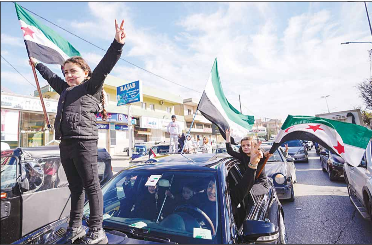
فرحة السوريين بسقوط النظام