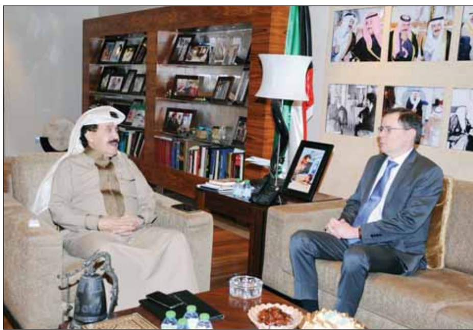
العميد رئيس التحرير أحمد الجارالله وسفير البرازيل رودريغو جابيش