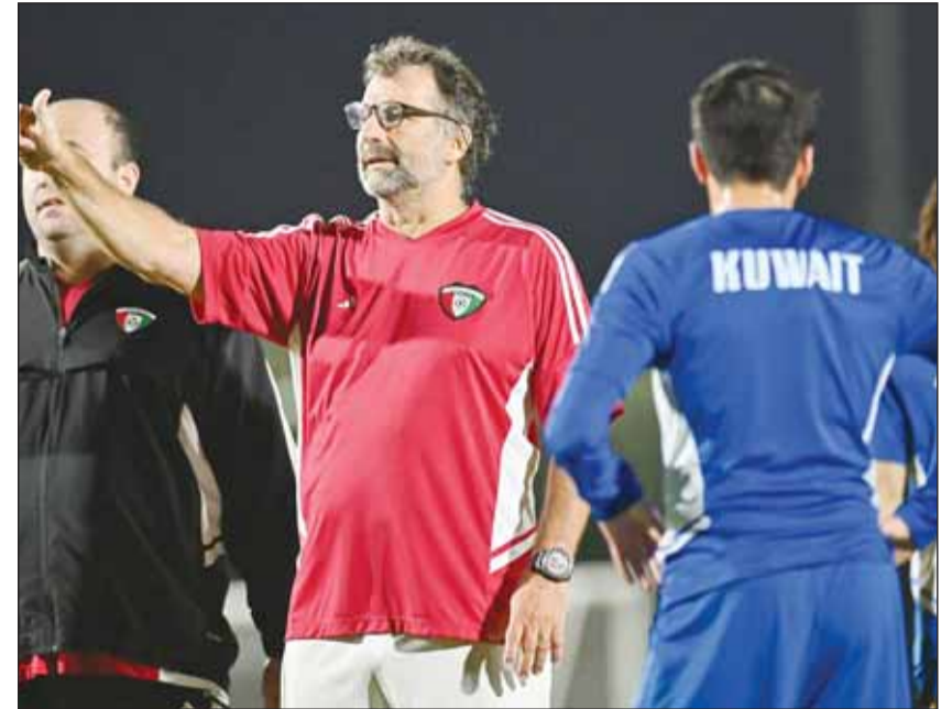
بيترز يسلمه لإشراك أكبر عدد من اللاعبين اليوم

يخوض منتخبنا الوطني أولى مبارياته الودية في الساعة السادسة مساءً اليوم، حيث يلتقي منتخب اليمن على استاد عبدالله بن خلية بنادي الدحيل، ضمن معسكره الذي يقام في العاصمة القطرية. ومن المقرر أن يخوض الأزرق مواجهة ودية ثانية أمام لبنان يوم 12 ديسمبر الجاري، فيما يتم التنسيق لإقامة مباراة ثالثة. وانتظم الأزرق في المعسكر الإعدادي منذ 28 نوفمبر الماضي، وذلك ضمن برنامج الإعداد لبطولة "خليجي 26" المقررة استضافتها في الكويت في الفترة من 21 ديسمبر الجاري حتى 3 يناير المقبل. وأسفرت قرعة "خليجي زين 26"، عن تواجد الكويت في المجموعة الأولى إلى جانب قطر والإمارات وعمان، فيما جاء في المجموعة الثانية منتخبات العراق والسعودية والبحرين واليمن. واختار مدرب الأزرق الأرجنتيني فوان بيترز 30 لاعباً