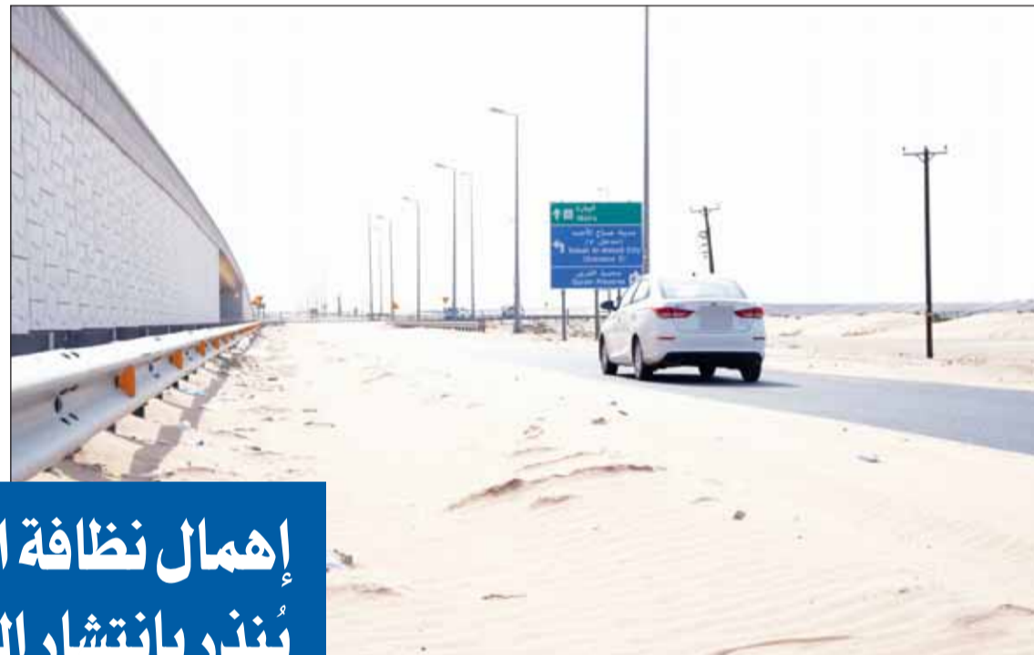
"السافي" يكاد يغطي الطريق

شدد العصيمي على ضرورة الاسراع في إنشاء المدينة الطبية في مدينة صباح الاحمد. وقال: لو ترك الأمر للدارة المستندية لن ترى هذه المدينة النور قبل 10 سنوات، فهي حاليا في مرحلة الطرح للتصميم ولمدة 3 سنوات وبعد التصميم 4 أو 5 سنوات للتنفيذ فهذا الأمر يحتاج إلى تسريع الإجراءات المناقصة.