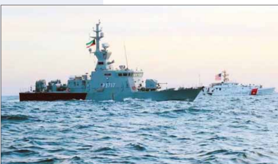
سفن البحرية الكويتية ونظيرها الأميركية خلال تنفيذ العملية

نفذت قوة الواجب المختلطة 152 بقيادة القوة البحرية الكويتية ومشاركة خفر السواحل والطيران العمودي التابع لوزارة الداخلية وقوة من البحرية الأميركية عملية مركزية باسم "درع البحر" يومي 2 و3 ديسمبر الجاري في منطقة شمال الخليج العربي. وقالت وزارة الدفاع في بيان أمس إنه من خلال العملية نفذت السفن والطائرات دوريات مسح بحري مكثفة بهدف المحافظة على الأمن والاستقرار ومواجهة التحديات البحرية بالمنطقة. وذكرت الوزارة أن عملية "درع البحر" المركزة تهدف إلى رفع الجاهزية القتالية وتبادل الخبرات بين المشاركين والتدريب على أحدث التقنيات المستخدمة في مجال دعم وتعزيز الأمن البحري.