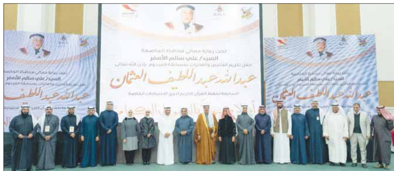
محافظ حولي علي الأضر والصميمي والعثمان يتوسطون القائمين على المسابقة

محافظ حولي: إنجاز عظيم حققته المسابقة بتطورها واستمرارها للعام السابع على التوالي