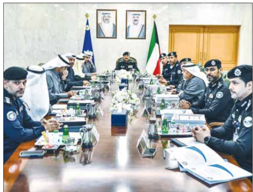
الفريق الشيخ سالم النواف مترئساً اجتماع مجلس أكاديمية سعد العبدالله للعلوم الأمنية

ترأس وكيل وزارة الداخلية الفريق الشيخ سالم النواف أمس، الاجتماع الـ (39) لمجلس أكاديمية سعد العبدالله للعلوم الأمنية بحضور أعضاء المجلس. وقالت "الداخلية" في بيان صحافي إنه تم خلال الاجتماع مناقشة البنود المدرجة على جدول الأعمال والتي شملت بحث آلية تحديث العمل داخل الأكاديمية وتطوير المناهج الدراسية لتتواءم مع أحدث الأساليب العلمية العالمية. وأضافت أن الفريق الشيخ سالم النواف أكد دعم وزارة الداخلية المستمر لأعمال المجلس، مشيدا بالجهود المبذولة للارتقاء ببرامج التعليم والتدريب بما يساهم في تعزيز مستوى الكفاءة والتأهيل الأمني.