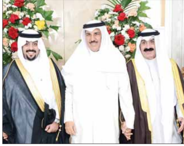
المستشار محمد بوطالب يبارك