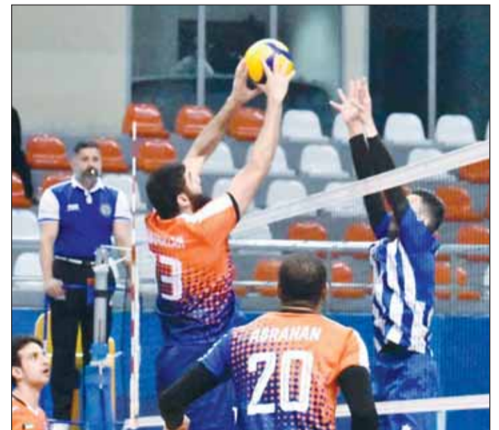
من لقاء كاظمة والشباب

وفي المباراة الثانية لم يجد كاظمة الساسي إلى المنافسة على اللقب أي صعوبة في السيطرة على مباراته أمام الشباب وإنهاء الأشواط الثلاثة لصالحه على النحو التالي 25-14، و26-24، و25-19 محققا انتصارا حاسما منحه بطاقة التأهل إلى الدور التالي.