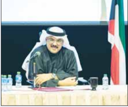
وزير التربية م. سيد جلال الطيباني

واصل وزير التربية المهندس سيد جلال الطيباني عقد جلساته الحوارية المقنونة مع أهل الميدان التربوي، حيث التقى أول من أمس مديري ومديرات مدارس المرحلة المتوسطة في مختلف المناطق التعليمية، بهدف مناقشة أبرز القضايا والتحديات التي تواجه سير العمل، والاستماع إلى مطالب وتطلعات القائمين على هذه المدارس. وتناول اللقاء المفتوح تبادل الحديث عن أهمية المرحلة المتوسطة ودورها المحوري في بناء شخصية الطالب وتأهيله للمرحلة الثانوية، وضرورة التركيز على تعزيز القيم التربوية وتطوير مهارات التفكير النقدي لدى الطلاب، كما تم طرح أفكار لتطبيق برامج تعليمية حديثة تعزز من تجربة الطالب في هذه المرحلة وتواكب التطورات العالمية في مجال التعليم. واستمع الوزير إلى مداخلات مديري ومديرات المدارس التي تطرقت إلى قضايا تربوية عديدة منها احتياجات البنية التحتية، وتوفير الدعم التكنولوجي داخل الفصول الدراسية وغيرها، وتم التأكيد على أهمية التعاون المستمر بين الوزارة والإدارات المدرسية لتحقيق الأهداف المشتركة. من جهته، أكد مدير مدرسة عثمان بن مظعون