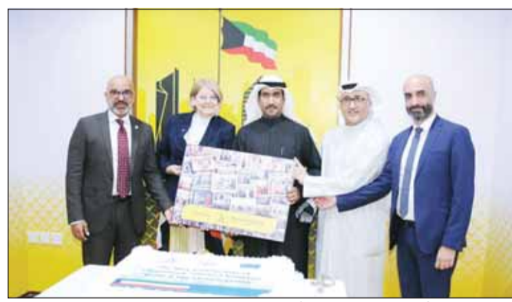
سفيرة الاتحاد الأوروبي أن كويستين وأبو الحسن والصالح خلال الاحتفال