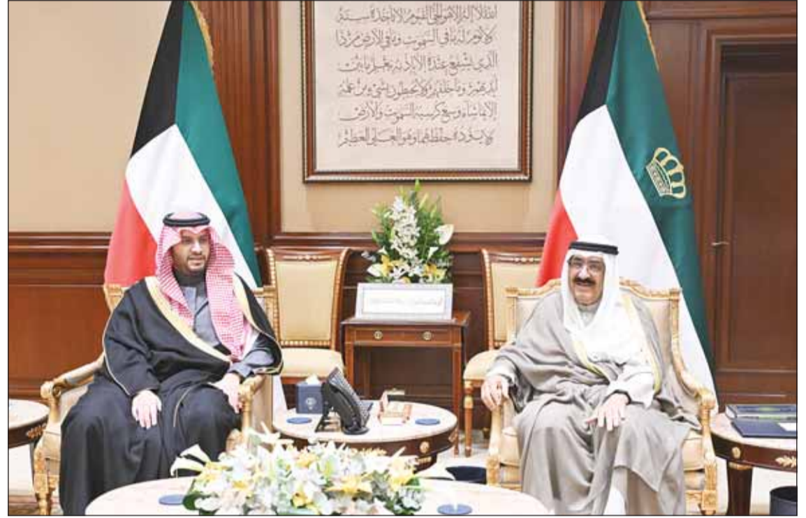
سمو أمير البلاد الشيخ مشعل الأحمد مستقبلاً وزير الدولة السعودي الأمير تركي بن محمد

عبدالعزیز وأخيه الأمير محمد بن سلمان وتمنياته لهما بموفق الصحة وتمام العافية سائلاً سموه المولى تعالى أن ينعم على المملكة العربية السعودية وشعبها الشقيق بمزيد من التقدم والازدهار تحت ظل القيادة الحكيمة لأخيه خادم الحرمين الشريفين. حضر اللقاء وزير المالية السعودي محمد الجعدان ووزير الخارجية عبدالله الجبجبا والمسؤولين بالدولة. على خط مواز، استقبل سمو ولي العهد الشيخ صباح الخالد بقصر بيان أمس، وزير الدولة عضو مجلس الوزراء بالمملكة العربية السعودية الشقيقة الأمير تركي بن محمد آل سعود وذلك بمناسبة زيارته للبلاد، حيث نقل لسمو ولي العهد تحيات وتقدير أخيه خادم الحرمين الشريفين الملك سلمان بن عبدالعزيز ملك المملكة العربية السعودية وأخيه الأمير محمد بن سلمان آل سعود ودوام الصحة والعافية ولشعب دولة الكويت المزيد من الرخاء والنماء. وقد حمل سمو أمير البلاد تحياته لأخيه خادم الحرمين الشريفين الملك سلمان بن