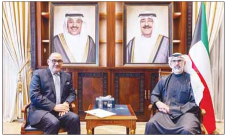
الشيخ جراح الجابر مستقبلاً السفير العراقي الممثل الصافي

استقبل نائب وزير الخارجية السفير الشيخ جراح الجابر - كلا على حدة - امس، سفير جمهورية العراق لدى دولة الكويت المنهل الصافي وسفير جمهورية بنغلاديش الشعبية اللواء سيد طارق مسين. وجرى خلال اللقاءين بحث سبل توطيد العلاقات الثنائية في المجالات كافة بالإضافة إلى مناقشة القضايا محل الاهتمام المشترك. كما استقبل الشيخ جراح الجابر، سفير جمهورية سنغافورة غير المقيم لدى دولة الكويت زين العابدين رشيد وذلك بمناسبة انتهاء مهام عمله سفيراً لبلادته لدى الكويت.