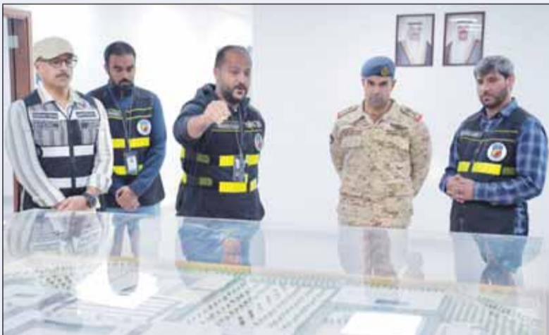
نائب رئيس الأركان اللواء الركن طيار الشيخ صباح الجابر يستمع له شرح عن مرافق المشروع

صباح الجابر وكيل هندسة المنشآت العسكرية بالتكليف المهندس حسام العتيقي إلى جانب عدد من كبار الضباط القادة في الجيش.