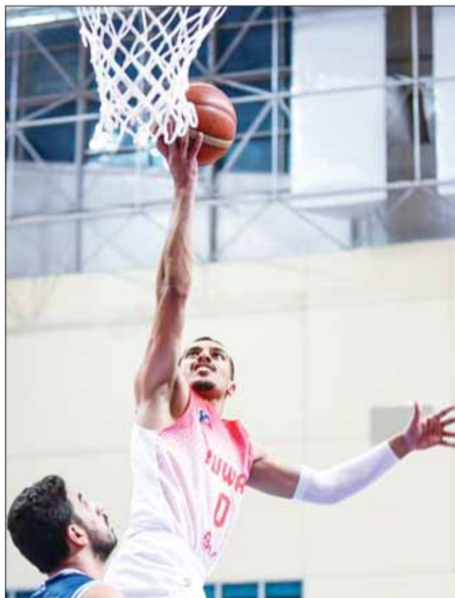
الكويت يبحث عن انتصار جديد في السلة

ومن المقرر إقامة البطولة مايو المقبل بعد ختام دورة الألعاب الرياضية الشاطئية الخليجية التي تقام بعمان أبريل عام 2025.