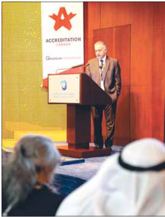
الدكتور عبدالمحسن التركي متحدثاً