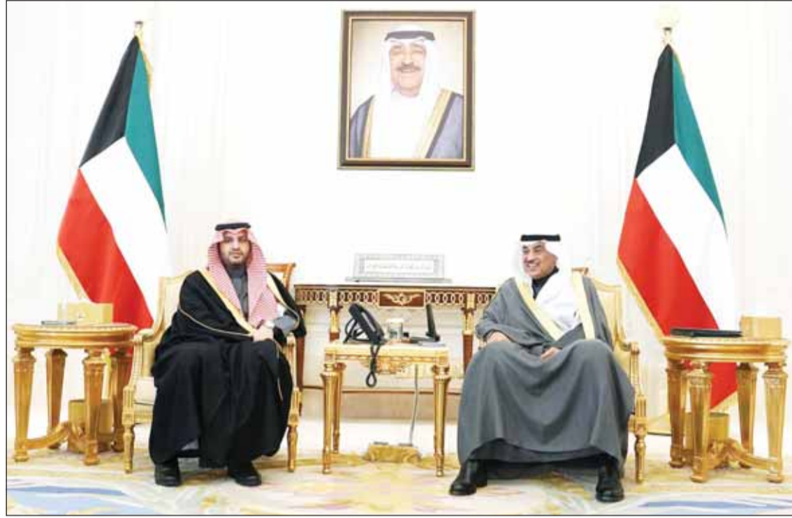
سموه ولي العهد الشيخ صباح الخالد مستقبلاً وزير الدولة السعودي الأمير تركي بن محمد

الكويت المزيد من التقدم والرفاء في ظل القيادة الحكيمة لسمو أمير البلاد الشيخ مشعل الأحمد. وقد حمل سموه تحياته لأخيه خادم الحرمين الشريفين وأخيه ولي العهد الأمير محمد بن سلمان وتمنياته لهما بموفق الصحة وتمام العافية، سائلاً سموه المولى تعالى أن ينعم على المملكة العربية السعودية وشعبها الشقيق بمزيد من التطور والازدهار تحت ظل القيادة الحكيمة لأخيه خادم الحرمين الشريفين. حضر اللقاء وزير المالية السعودي محمد الجعدان ووزير الخارجية عبدالله الجبجبا ووزيرة المالية ووزيرة الدولة للشؤون الاقتصادية والاستثمار نورة الغصام ومدير عام هيئة تشجيع الاستثمار المباشر الشيخ الدكتور مشعل جابر الأحمد وعضو مجلس إدارة الهيئة العامة للاستثمار الشيخ سعود سالم الصباح وكبار المسؤولين بالدولة.