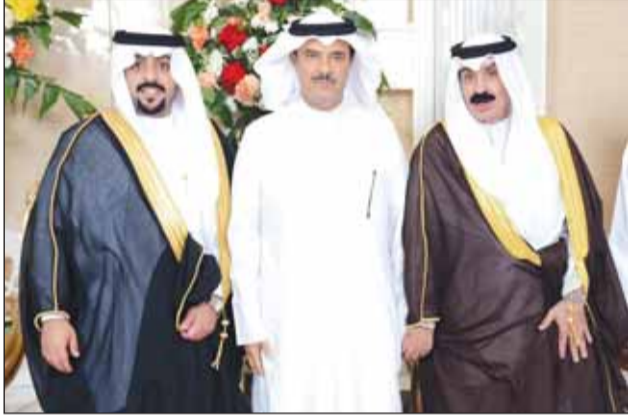
المستشار سعد العجمي يبارك