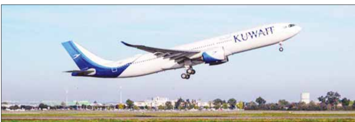
الطائرة الجديدة من نوع "أرباص 900NE-A330"

استلمت شركة الخطوط الجوية الكويتية أولى طائراتها من نوع أرباص "900NE-A330" والتي أطلق عليها "بوبيان"، قادمة من مصنع الأرباص في مدينة تولوز بفرنسا يوم الاثنين.