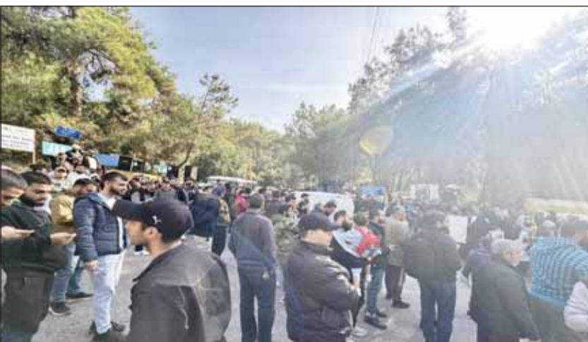
من الاعتصام أمام سجن رومية

بيروت - وكالات، نفذ أهالي الموقوفين اللبنانيين في سجن رومية اعتصاماً في محيط السجن مطالبين القضاء بتسريع المحاكمات والإفراج عن الموقوفين.