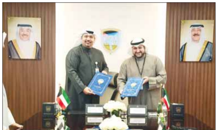
وكيل وزارة الدفاع ومدير مركز صباح الأحمد للموهبة خلال مراسم توقيع المذكرة

توقيع المذكرة يأتي في خطوة تهدف إلى تعزيز التعاون المشترك بين المؤسسات الحكومية ومراكز الإبداع الوطنية.