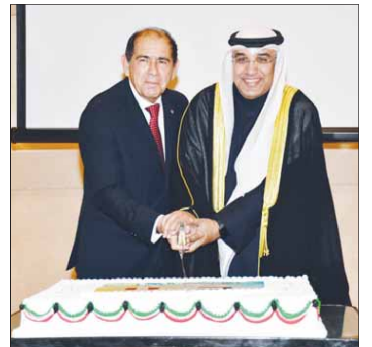
الجار الله وسفير بيرو يقطعان قالب لحوم الاحتفال

أكد السفير المعين لبيرو لدى دولة الكويت كارلوس إنريكي فورتول أن شعب بيرو سيفت إلى جانب دولة