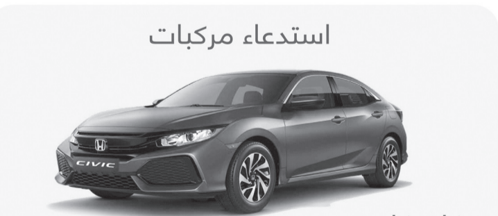
هوندا سيفيك (FC1, FC2, FC5) موديل 2020 &amp; 2019 &amp; 2018

عطل في مضخة الوقود مما قد يؤدي إلى توقف المحرك أثناء القيادة وعدم القدرة على إعادة تشغيله