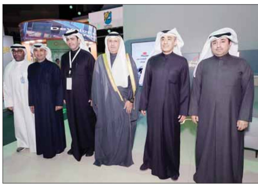
الوزير عمر العمر خلال زيارته لجناح بوبيان بحضور التويجيري والمجتم مع أعضاء من الإدارة التنفيذية

افتتح بنك بوبيان مشاركته المتميزة ورعايته البلاغية لمعرض "NEXUS 2024" الحدث التكنولوجي الأكبر والأول في الكويت، والذي أقيم تحت رعاية وضور وزير الدولة لشؤون الاتصالات عمر العمر، خلال الفترة من 5 حتى 7 ديسمبر الجاري في الأرينا الكويت بمشاركة العديد من المؤسسات والشركات التكنولوجية الرائدة في مختلف قطاعات الأعمال.