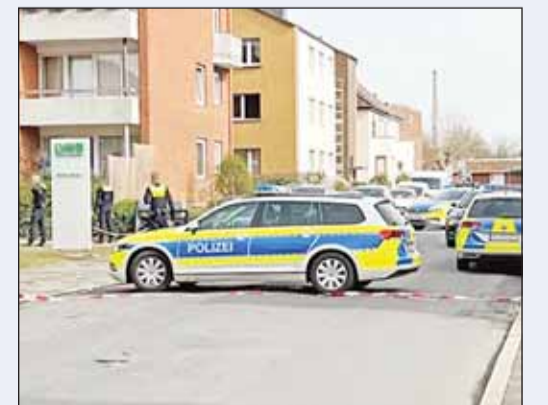
دوريات الشرطة تطوق منزل القتيل

وحاصرت سيارات دورية عدة منزل الرجل في مدينة غراساو بولاية بافاريا الألمانية، وعندما قرع أفراد الشرطة جرس الباب، فتحه الرجل، وهاجمهم على الفور بسكين، ولهذا السبب تم استخدام أسلحة نارية، وأصيب الرجل، وتوفي في الموقع رغم المحاولات الفورية لإسعافه، فيما لم تصب والدته، أو أي من أفراد الشرطة بأذى.