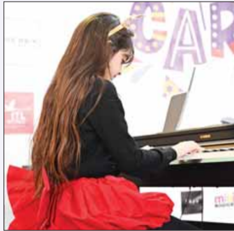
عزف على البيانو