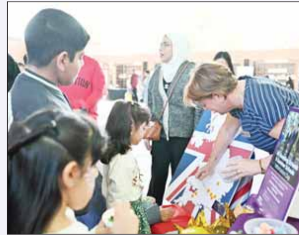
من الفعاليات الفنية