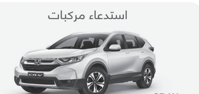
هوندا CR-V (RW5 &amp; RW6) موديل 2020 &amp; 2019 &amp; 2018

عطل في مضخة الوقود مما قد يؤدي إلى توقف المحرك أثناء القيادة وعدم القدرة على إعادة تشغيله