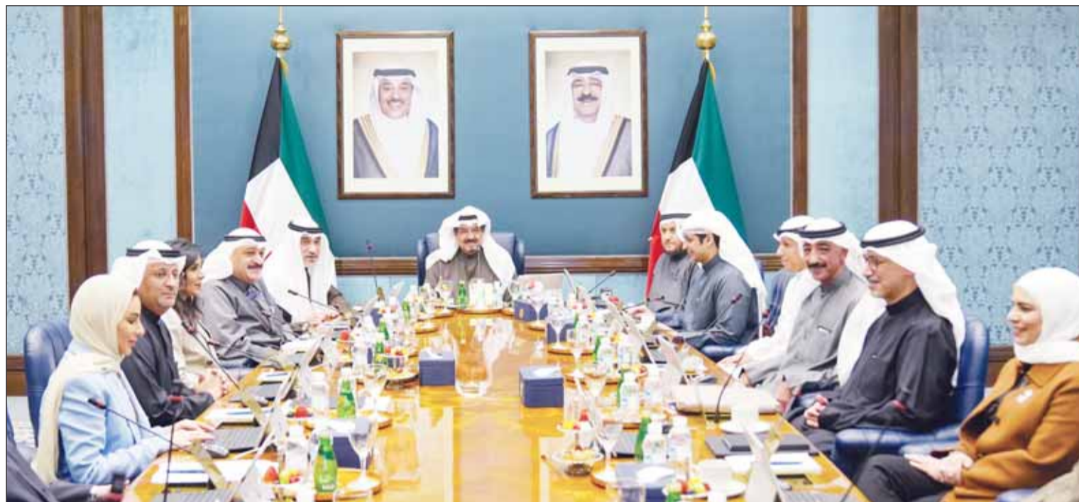
سمو رئيس مجلس الوزراء الشيخ أحمد عبدالله مترشاً اجتماع المجلس

اعتمد مجلس الوزراء مقرر اللجنة العليا لتحقيق الجنسية الكويتية والمتمضمّن حالات فقد وسحب الجنسية الكويتية من بعض الأشخاص، وذلك وفقاً لأحكام المرسوم بالقانون رقم (15) لسنة 1959 بشأن الجنسية الكويتية وتعديلاته.