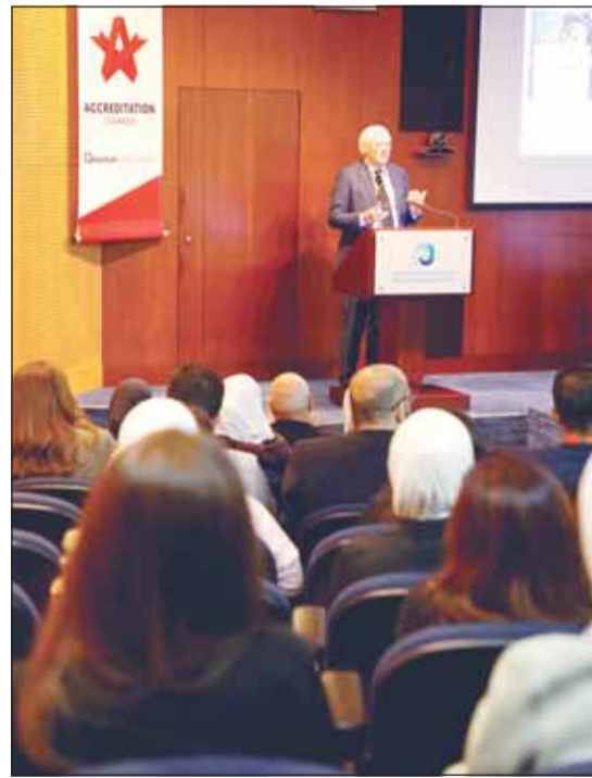
البروفيسور Nico DeVries

بالتنسيق مع معهد دسمان للسكري واهتمامهم بهذا المرض الصامت ومحاولة تعريفه للجمهور عن طريق مثل هذه الفعاليات القيمة دورهم الكبير في تشجيع الباحثين على البحث والتقصي لمعرفة المزيد عن الاختناق التنفسي أثناء النوم وتطوير كيفية تشخيصه وكذلك آخر الطرق العلاجية من أساليب جراحية وغير جراحية للتخلص من هذه المشكلة. وفي ختام الندوة تم توزيع العدد الرابع عشر من مجلة العربي والذي صدر في يناير عام 1960 ويأيدن خاص من المجلس الوطني للثقافة والفنون والآداب وذلك لتضمنه مقالاً علمياً عن النوم تحت عنوان "ثلث عمرك تعيشه نائماً" حيث تناول المقال بعض المشاكل الصحية التي قد يواجهها الإنسان أثناء نومه، مما يعكس اهتمام المجلة بالقضايا الصحية والعلمية التي تهم المجتمع آنذاك.