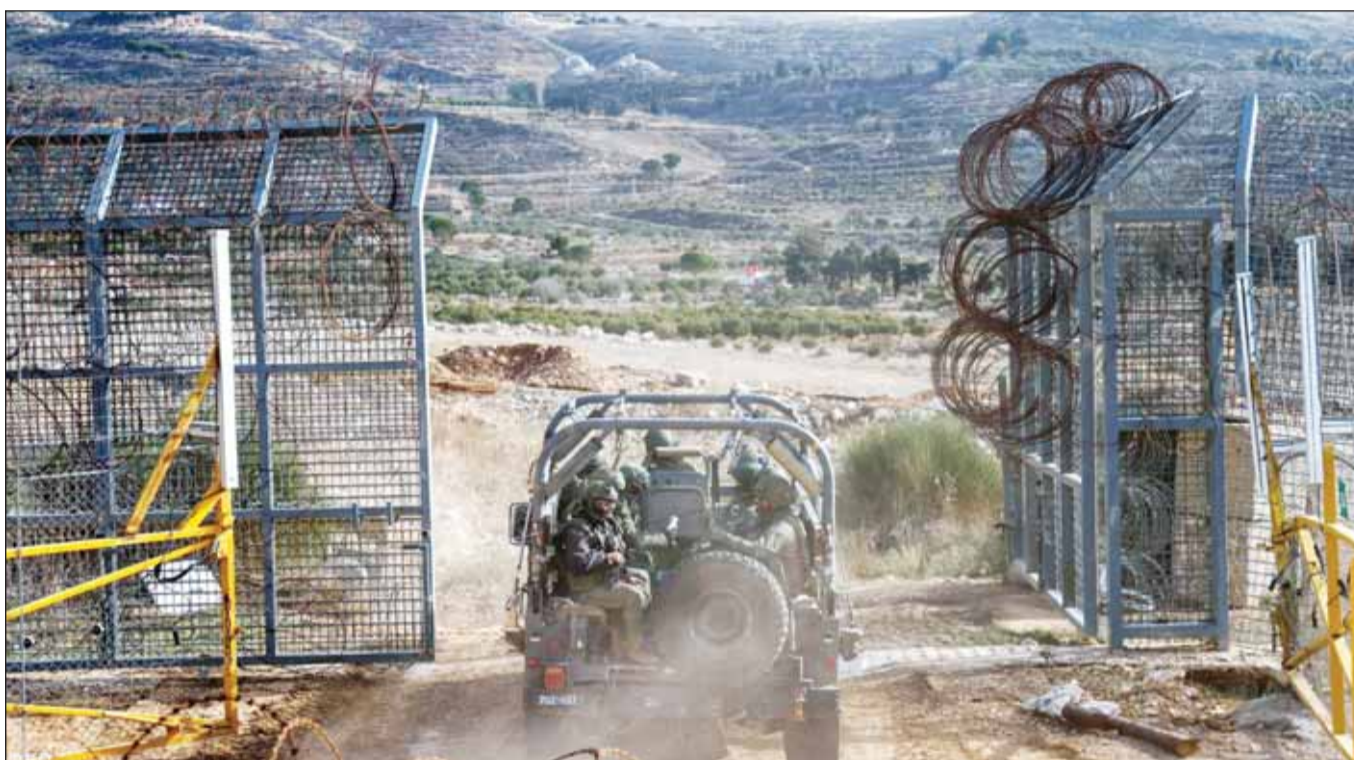
مركبات عسكرية إسرائيلية تعبر السياج إلى المنطقة العازلة

كما أضاف قائد الحرس الثوري، حسين سلامي، الذي حضر الجلسة غير العلنية، أن "القوات العسكرية الإيرانية كانت موجودة في سورية حتى اللحظة الأخيرة"، أي قبل سقوط نظام الرئيس السابق بشار الأسد، وفق ما نقل النائب الإيراني أحمد نادري.