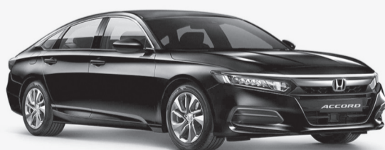
هوندا أكورد (CV1 &amp; CV2) موديل 2017 &amp; 2018 &amp; 2019 &amp; 2020

الخلل عطل في مضخة الوقود مما قد يؤدي إلى توقف المحرك أثناء القيادة وعدم القدرة على إعادة تشغيله