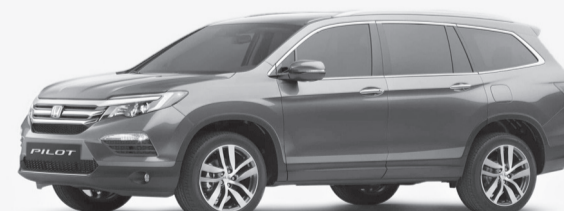
هوندا بايلوت (YF5 &amp; YF6) موديل 2018 &amp; 2019 &amp; 2020

الخلل عطل في مضخة الوقود مما قد يؤدي إلى توقف المحرك أثناء القيادة وعدم القدرة على إعادة تشغيله