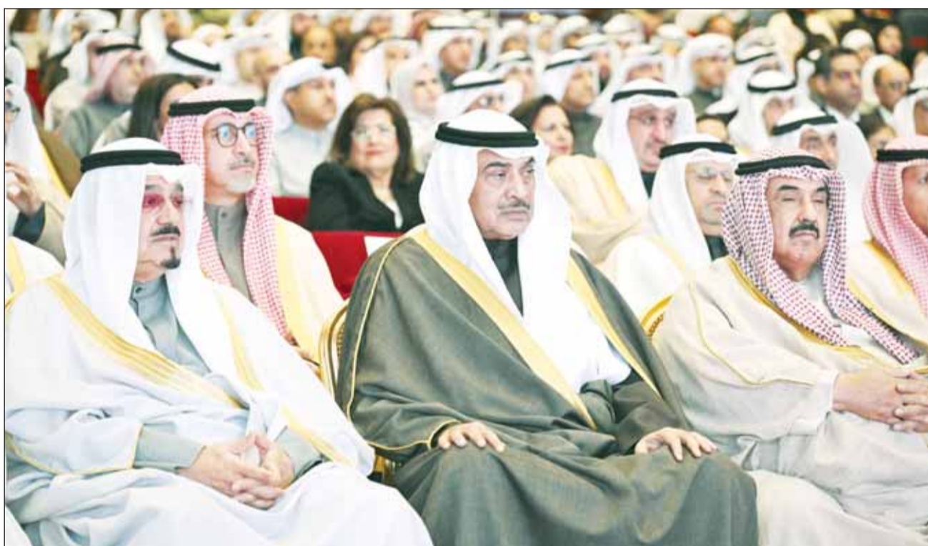
سمو وليه العهد الشيخ صباح الخالد يتوسط سمو الشيخ ناصر المحمد وسمو الشيخ أحمد العبدالله