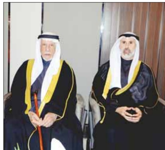
الشيخ جراح جابر الأحمد وعبدالعزیز الغانم