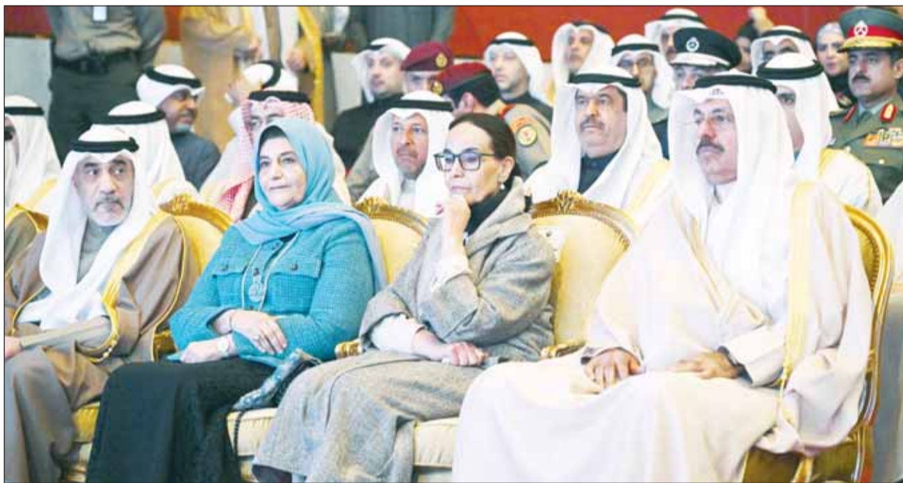
سمو الشيخ أحمد النواف والشيخة أمثال الأحمد ود. فائزة الخرافيم والنائب الأول الشيخ فهد اليوسف

برعاية وحضور سمو أمير البلاد الشيخ مشعل الأحمد، تم تكريم الفائزين بجوائز مؤسسة الكويت للتقدم العلمي لعامي 2022 و2023 في جوائز "جابر الأحمد للباحثين الشباب" و"الكويت" و"السميط للتنمية الأفريقية".