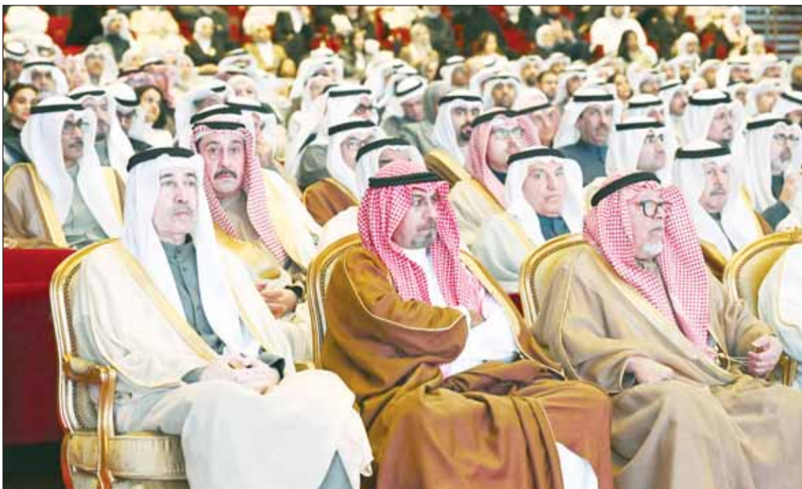
الشيخ علي الجراح وسمو الشيخ د. محمد الصباح والشيخ مبارك الحمد

بدأ المحفل بالنشيد الوطني ثم تلاوة آيات من الذكر الحكيم بعدها ألقى مدير عام مؤسسة الكويت للتقدم العلمي د. أمينة رجب كلمتها.