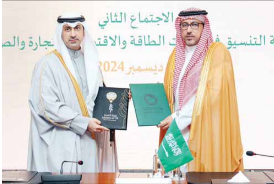
الشيخ د.نمر الصباح خلال تبادل مذكرات التفاهم مع ناصر بن الحميد، الدوسري

واتفق الجانبان كذلك على التعاون في المجال الجمركي حيث تم إنجاز الربط الإلكتروني برا بين الجمارك في دولة الكويت والمملكة العربية السعودية، والتي تسهم في دعم مستهدفات تيسير التجارة وتحقيق انسيابية تدفق البضائع بين البلدين، حيث تجسد هذه الخطوة التعاون والتكامل الاقتصادي القائم، وترسيخ مبدأ الشراكة بين