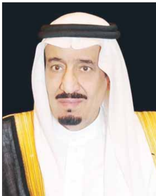
خادم الحرمين الشريفين الملك سلمان بن عبدالعزيز