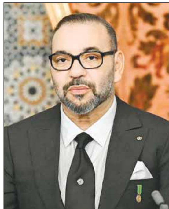
الملك محمد السادس