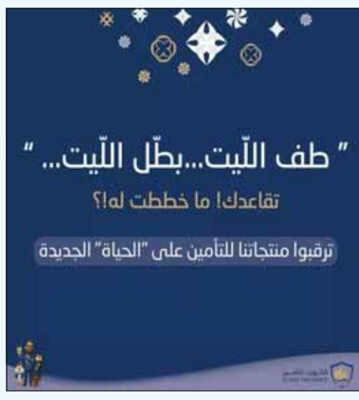
التزامنا الثابت بتوفير برامج تأمينية قيمة تتناسب مع مختلف مراحل الحياة وظروفها.

أعلنت شركة الكويت للتأمين، الرائدة في قطاع التأمين، عن إطلاق حملتها الموسعة لمنتجات التأمين على الحياة للعام 2025.