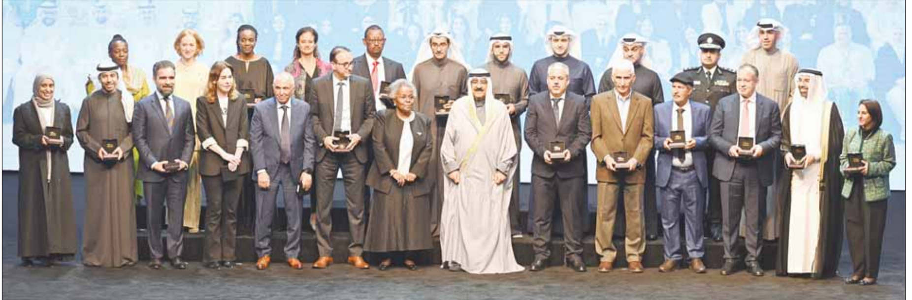
سمو أمير البلاد الشيخ مشعل الأحمد ود. أمينة فرحان يتوسطان المكرمين الفائزين بجوائز "التقدم العلمي"

صاحب السمو يُكرم كوكبة الفائزين بجوائز مؤسسة التقدم العلمي