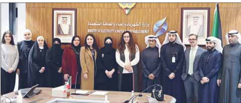
ممثلو "الكهرباء" وخبراء البنك الدولي علم هامش الاجتماع

وكشفت عن عقد لقاءات دورية في القريب العاجل