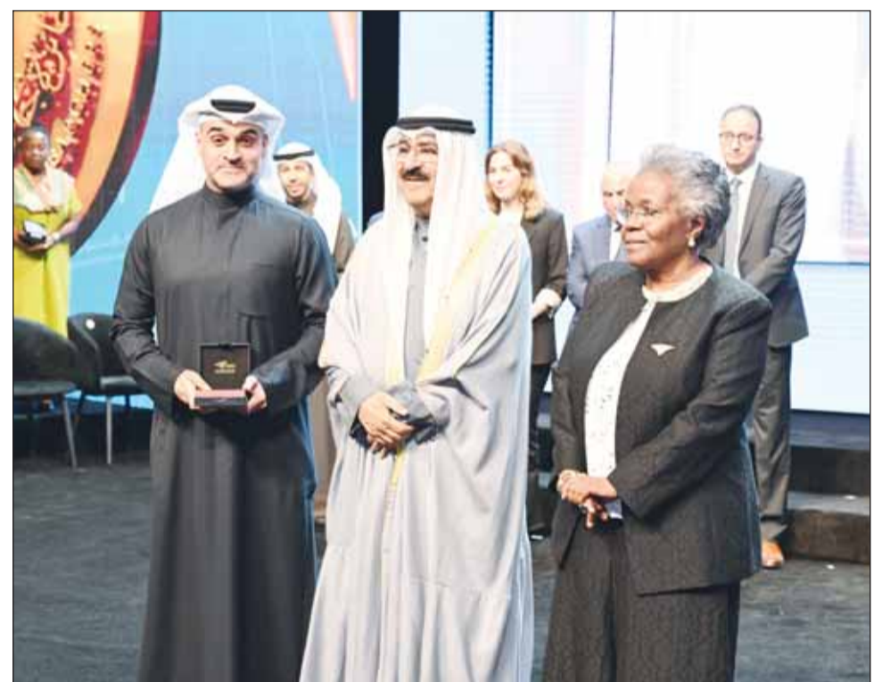
سمو الأمير بكرم أحد الفائزين