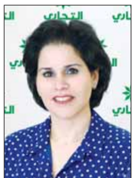
الشيخة نوف الصباح

الكويتي القديم، وإبراز جوانب ثقافية متنوعة من التاريخ. وأضافت الشبيخة نوف أن فكرة رزنامة 2025 جاءت لتعكس بعض الأماكن التراثية التي تميزت بها الكويت، مثل ساحة الصفاة، بيت اللوات، ومدينة الكويت والآلات الموسيقية التقليدية مثل الربابة، وحياة التجارة والتنقل والرحلات الطويلة والسفر عبر القوافل، بالإضافة إلى جوانب من البيت الكويتي القديم مثل اللبان والحوش. وحرصت الشبيخة نوف على أن تفرح رزنامته للعام 2025 في 12 لوحة فنية، بريشة الفنان إبراهيم حبيب، وتوجهت الشبيخة نوف صباح بالشكر إلى كل من ساهم في توثيق المعلومات البنك لعام 2025، متمنية للجميع عام ميلادي سعيد.