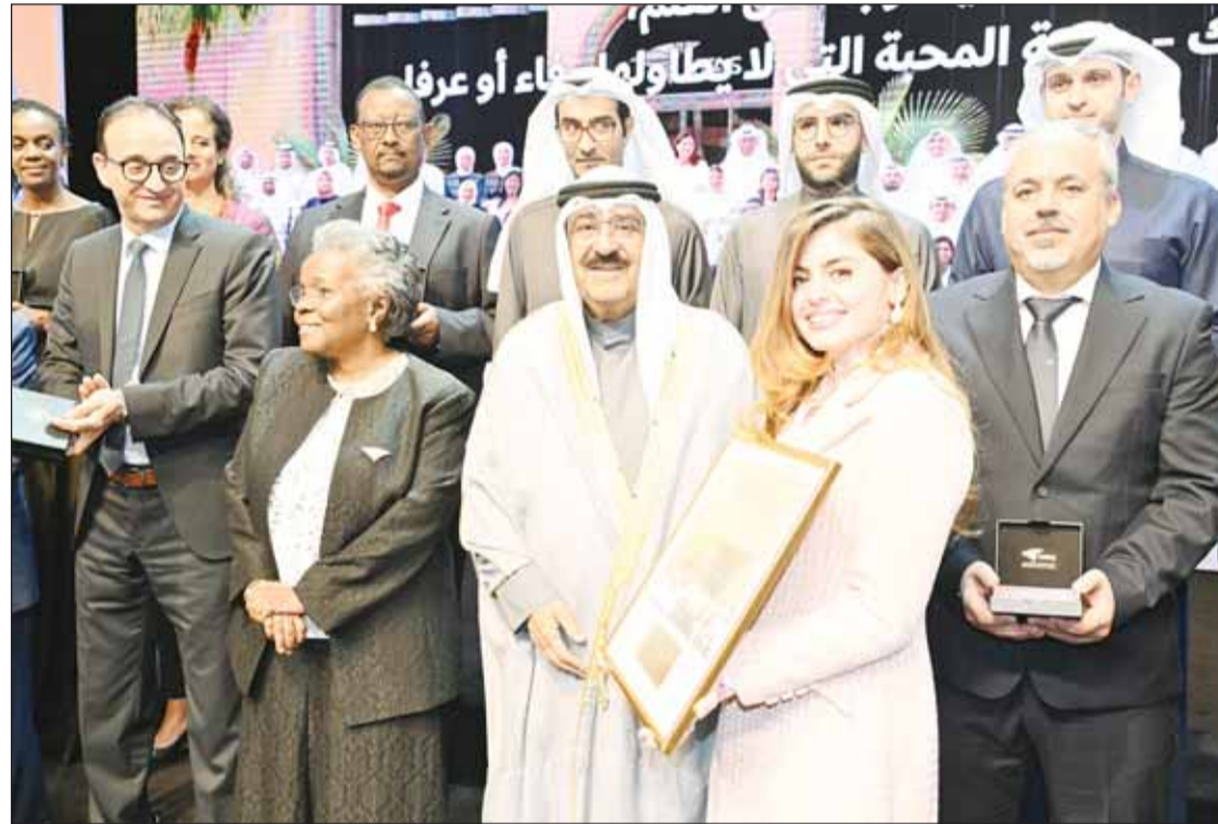
سمو الأمير الشيخ مشعل الأحمد يتسلم هدية تذكارية

المحلل العلمي العالمي البهيج العزيز على قلوبنا جميعاً، يعيدنا هذا الحفل إلى ماضٍ من التاريخ مجيد، إلى ذلك الأمير الرشيد جليل القدر، عظيم الذكر (طيب الله ثراه)، إذ تبقى عارفة العوارف له أن أسس ومكن، ونصح وأرشد، ولعلي غير مبالغ إن قلت، إن ما نحن فيه اليوم إنما هو من ثاقب نظره، وعميق تأمله، ويعيد استشرافه قبلاً، لواقع الكويت بعداً، فقد عدت مؤسستكم يا سمو الأمير، وأنتم خير خلف لخير سلف نموذج لتسريع التقدم، ولكل امرئ من اسمه نصيب، فهي مؤسسة التقدم، وهي نموذج التقدم، وغدت، من وجهة أخرى، نموذج يحتذى في بث المعرفة ونشرها، وإشهارها وتطوير البحث العلمي ودعمه، فكان لها، ومنها، وفيها، تعزيز للعلوم والتكنولوجيا والابتكار بغية استشراف مستقبل زاهر مستدام جامعة في ذلك كله بين تطوير البحث والمعرفة، وتعزيز الهوية الوطنية.