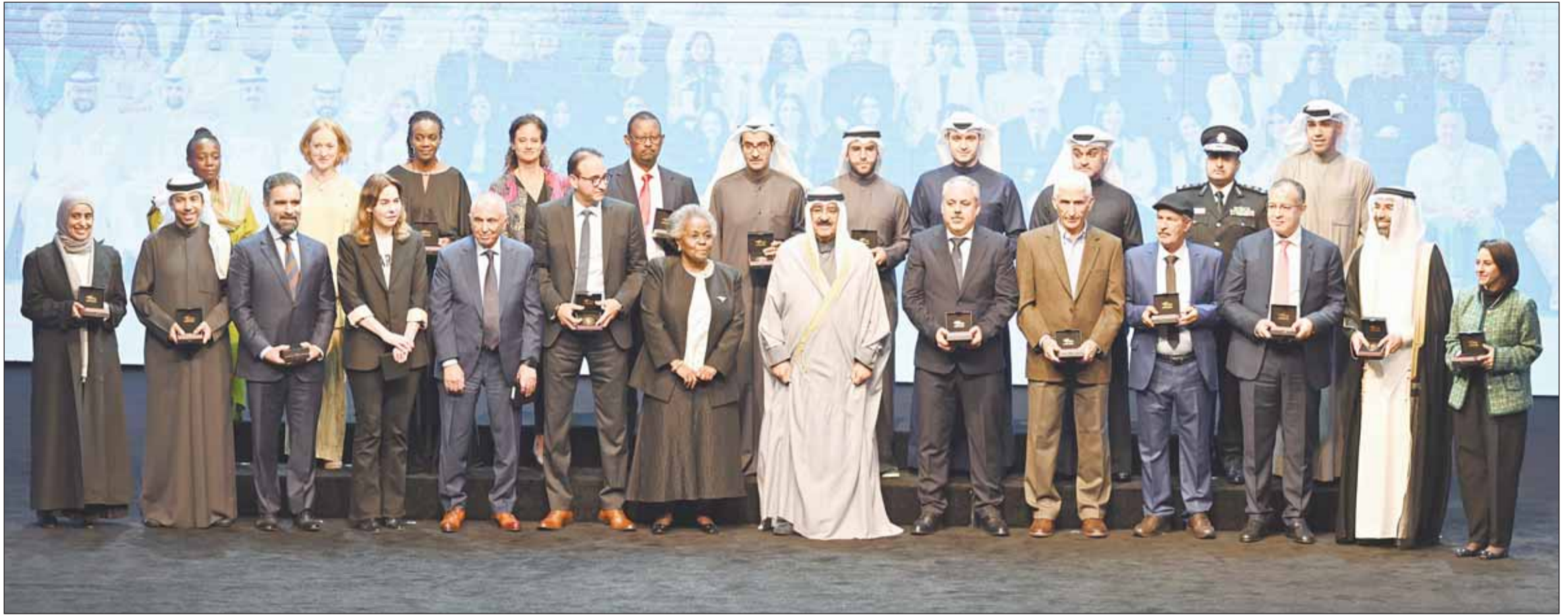
سمو أمير البلاد الشيخ مشعل الأحمد يتوسط د. أمينة فرحان والمكرمين الفائزين بجوائز "التقدم العلمي"