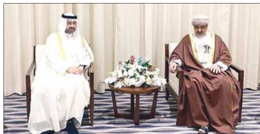
الشيخ حمود الصباح مع وزير النقل العماني سعيد المعمول

مسقط - "كونا"، أكد رئيس الإدارة العامة للطيران المدني الشيخ حمود الصباح أمس أهمية إقرار "إعلان مسقط الوزاري" الذي يركز على أبرز القضايا الأمنية في الطيران مثل الأمن الإلكتروني وحماية البنية الأساسية والجوية للطيران.