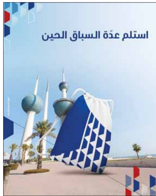
استلم عذة السباق الحين

يستقبل بنك الكويت الوطني المسجلين في سباق الوطني للجري 2024 اليوم الخميس 12 ديسمبر وغدا الجمعة 13 ديسمبر من الساعة الثالثة عصراً ولغاية التاسعة مساءً بجانب أبراج الكويت، لتسليم أرقام المتسابقين، حيث سيلتزم كل مشارك في السباق بإرتداء الرقم الخاص الذي استلمه عند التسجيل، والذي يتميز بألوانه على شريحة ذكية تسمح للجنة المنظمة بمعرفة الوقت الذي استغرقه المتسابق في قطع مسافة السباق.