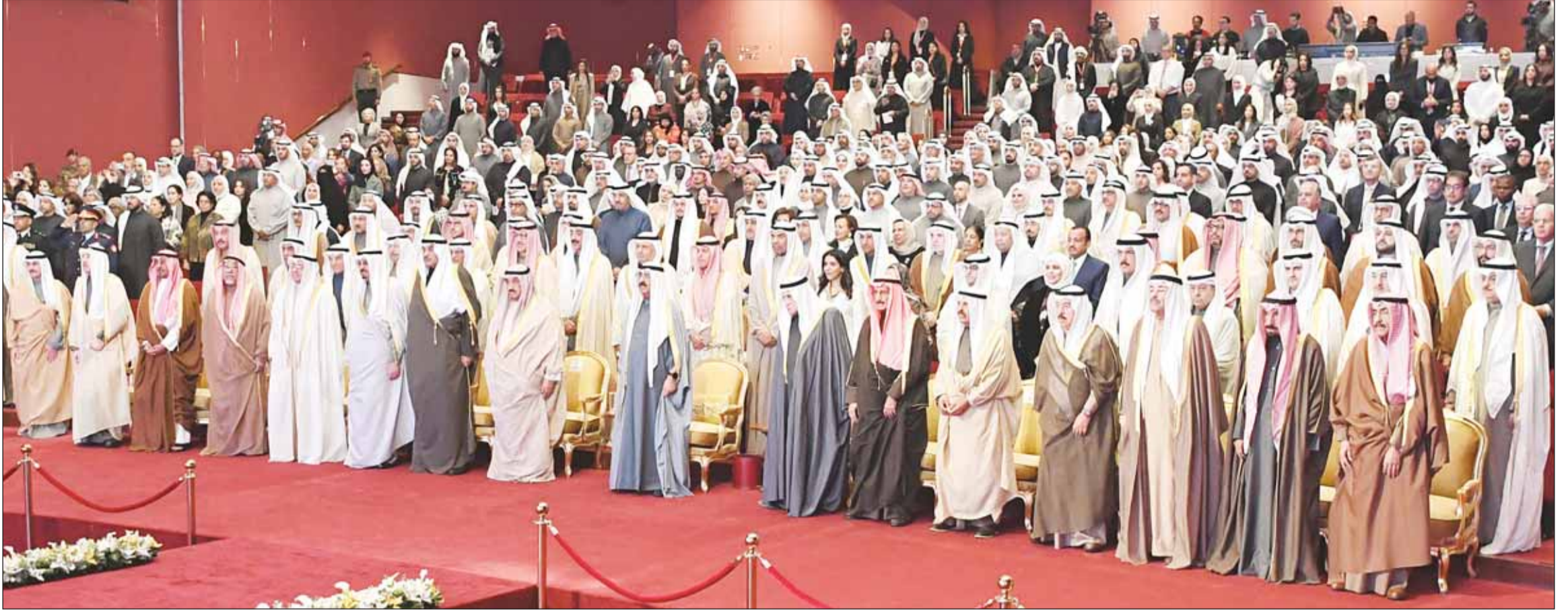
سمو أمير البلاد الشيخ مشعل الأحمد يتقدم وكبار الشيوخ والمسؤولين بحضور الحفل