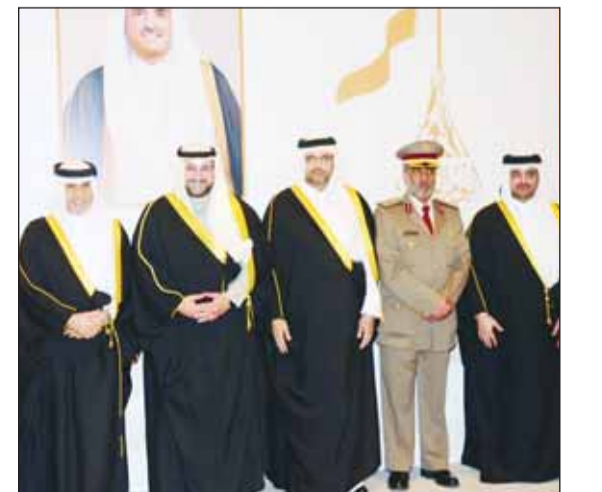
الشيخ د.عبدالله المشعل والسفير القطري وأركان السفارة