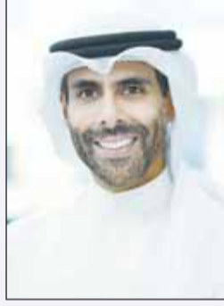
الشيخ جابر بندر الصباح

وبيّن أن خطة الإعداد للدورة تم تجهيزها من قبل مجلس إدارة النادي برئاسة فهد العجمي والتي تأتي في إطار حرصهم على الاستعداد الأمثل للمنافسة معرباً عن شكره لدعم اللجنة الأولمبية الكويتية والهيئة العامة للرياضة.