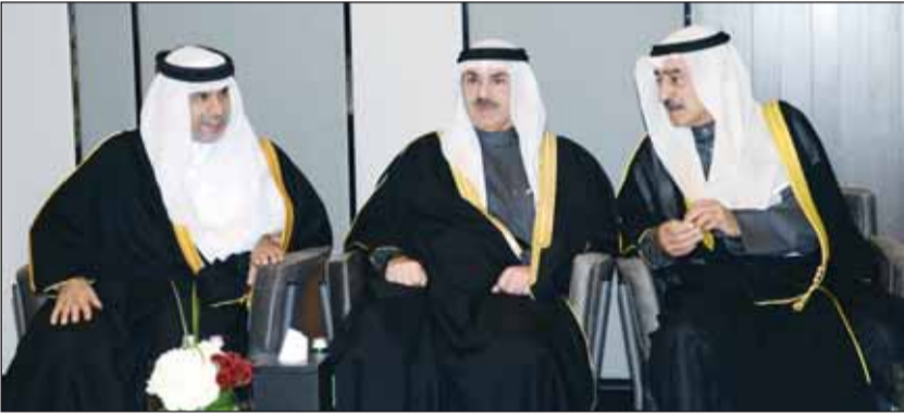
ناصر الروضان والشيخ خالد العبدالله والسفير علي آل محمود