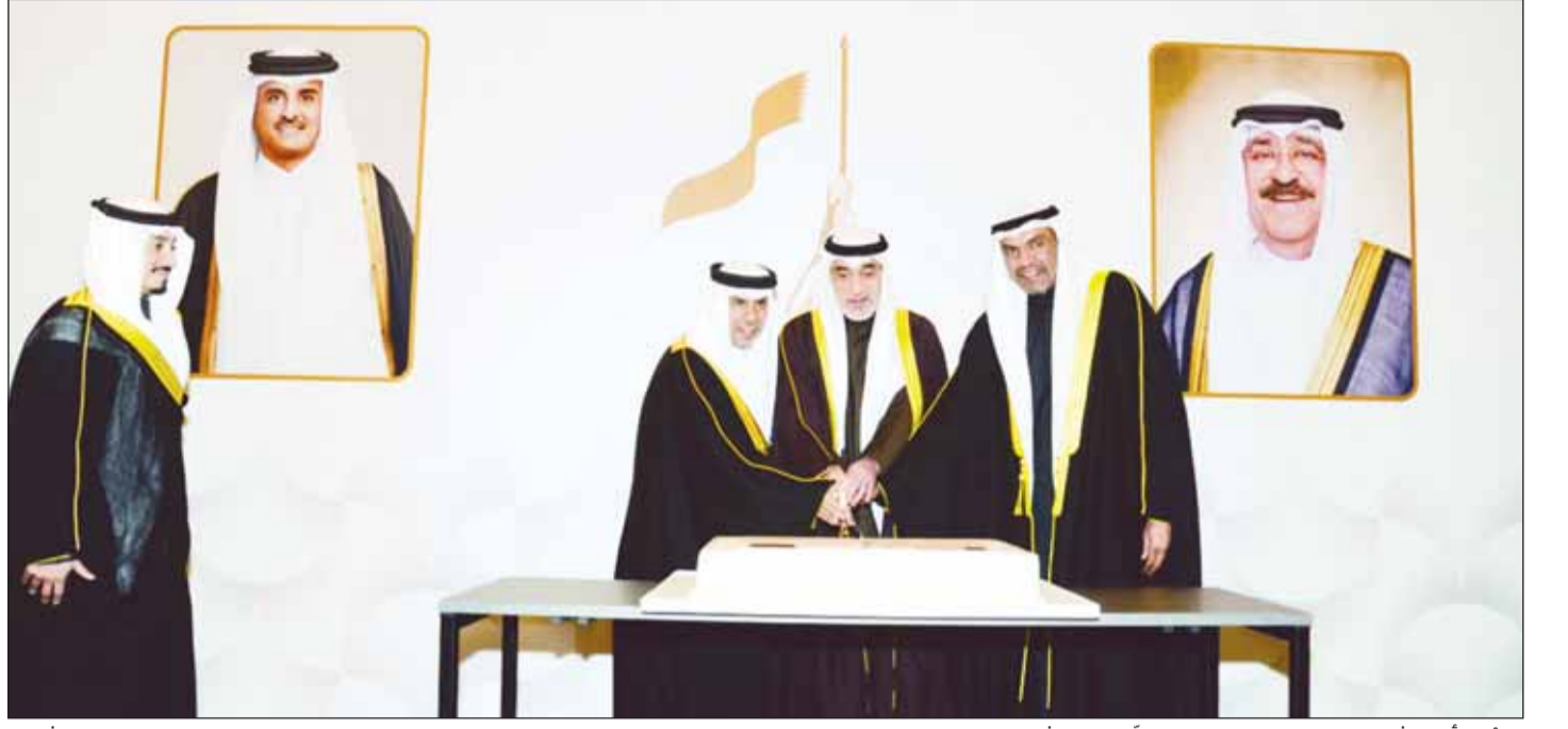
الأول الشيخ فهد اليوسف والوزير عبدالله اليحيى يشاركان السفير القطري قطع قالب الحلوة