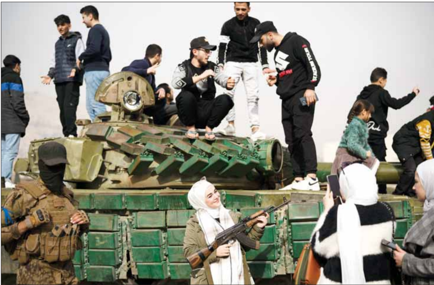
سوريون يلتقطون صوراً بجوار دبابة تابعة للقوات الحكومية

دمشق، عواصم - وكالات، بعدما كلف رسمياً بتشكيل حكومة انتقالية لتسيير الأعمال في سورية حتى مارس من العام المقبل، ووسط ترقب دولي على ما سيسفر عنه المشهد السوري عقب سقوط الرئيس السابق بشار الأسد، دعا رئيس الحكومة الانتقالية محمد البشير كافة السوريين في الخارج إلى العودة.