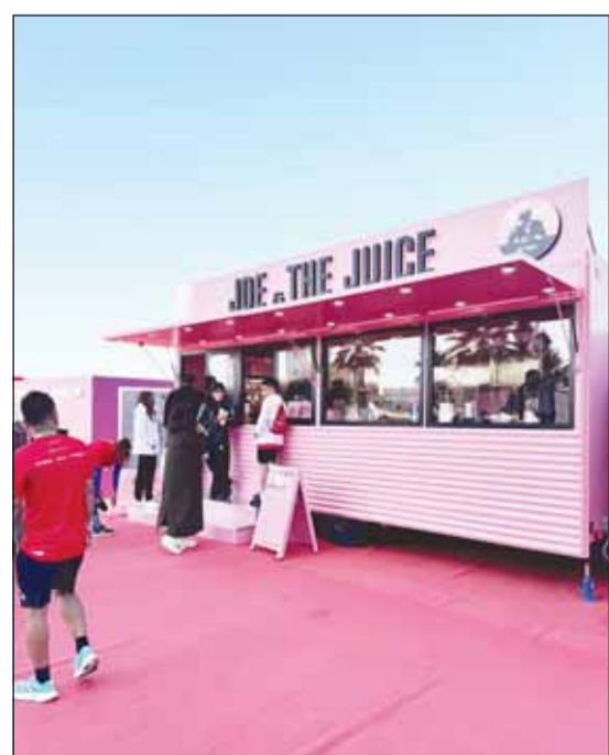
أو الجري، وسباق الجري لمسافة 10 كيلومترات، وسباق النصف ماراثون لمسافة 21 كيلومتراً، والماراثون الكامل لمسافة 42 كيلومتراً.

أعلنت شركة علي عبدالوهاب المطوع التجارية عن رعايتها لماراثون بنك الخليج 642 بنسخته العاشرة، والذي أقيم يوم السبت 30 نوفمبر على طول شاطئ الخليج العربي. وقد تمثلت رعاية الشركة من خلال قطاع الرياضة ونمط الحياة عبر العلامة التجارية "إنترسبورت" INTERSPORT، وقطاع المأكولات الخفيفة بمشاركة مقهى "جو أند ذا جوس" Joe & The Juice. وتأتي هذه الرعاية انطلاقاً من حرص الشركة على تشجيع أفراد المجتمع لممارسة الرياضة وجعلها جزءاً أساسياً من حياتهم اليومية.