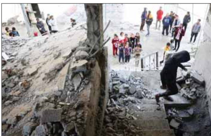
مبنى مدمر في غزة بغارة إسرائيلية

ولفت البيان إلى أن "عدد حالات الاعتقال منذ بدء الحرب الإسرائيلية على قطاع غزة منذ 7 من أكتوبر 2023 بلغت أكثر من 12 ألفاً و500 مواطناً من الضفة والقدس".