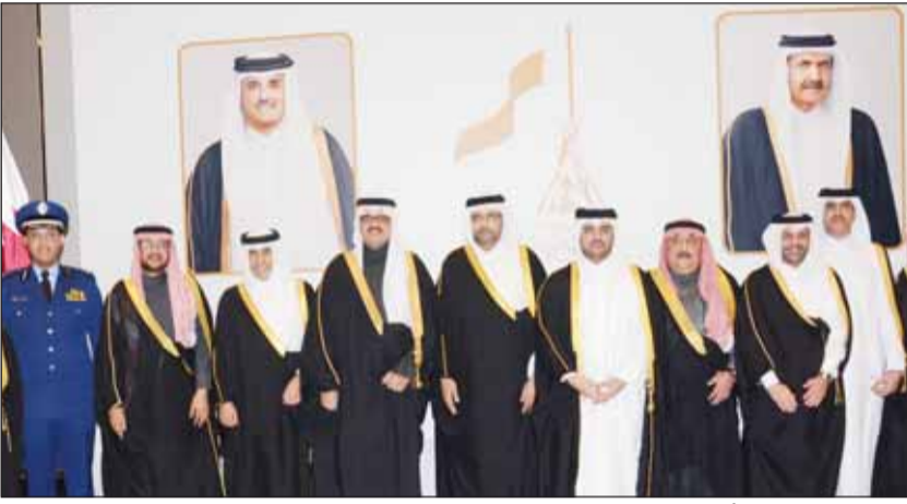
السفير السعودي الأمير سلطان بن سعد