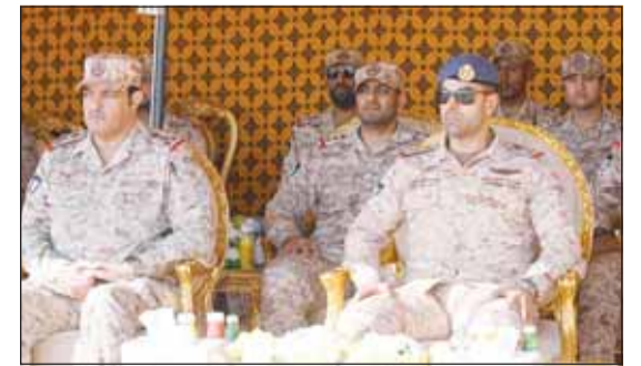
نائب رئيس الأركان وأمر كلية علي الصباح العسكرية يتابعان المشروع

من المشاركين والمشرفين على التمرين، التي انعكست من خلال أدائهم الفعال وتطبيقهم للنجاح للدرس والتدريبات التي تلقوها خلال دراستهم بالكلية، وحثهم على بذل المزيد من الجهد والعطاء في طلب العلم والمثابرة في العمل والتدريب لتحقيق الأهداف المرجوة منهم في الدفاع عن الوطن الغالي وتسيير كل إمكانياتهم لخدمة الوطن والعمل من أجله، سائلا المولى - عز وجل - أن يحفظ الكويت وأهلها من كل مكروه تحت ظل سمو أمير البلاد القائد الأعلى للقوات المسلحة وسمو ولي العهد الأمين.