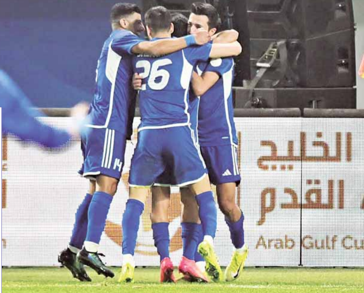
"الأزرق" بمواجهة مصيرية أمام العنابي في "خليجي زين 26"

وتعد نتائج الأزرق في الجولتين الأولى والثانية من هذه البطولة هي الأفضل التي يحققها منتخبنا منذ سنوات عدة، وتحديدًا منذ "خليجي زين 22" التي استضافتها السعودية عام 2014. ويدرك مدرب منتخبنا الأرجنتيني خوان بيتزري أن جهد الأيام الماضية ربما "يضيع" اليوم، في حال عدم اللعب بتركيز عالٍ وتنظيم مميز في خطوط الأزرق الثلاثة، وتلافى الوقوع في أخطاء ربما تكلف المنتخب غالباً، خصوصاً في ظل مواجهة خصم عنيد ومنتخب متمرس، يحمل لقب كأس آسيا في