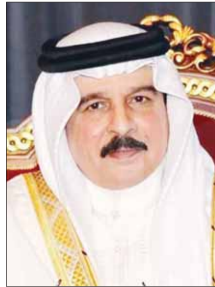
الملك حمد بن عيسى