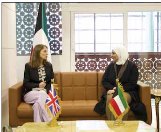
نورة الفصام مستقبلة السفيرة بيلندا لويس

استقبلت وزيرة المالية ووزيرة الدولة للشؤون الاقتصادية والاستثمار نورة سليمان الفصام في مكتبها امس سفيرة المملكة المتحدة لدى دولة الكويت بيلندا لويس، وتم خلال اللقاء استعراض العلاقات الاستراتيجية المتميزة التي تجمع البلدين الصديقين، وتبادل الآراء وجهات النظر حول العديد من القضايا ذات الاهتمام المشترك في المجالين المالي والاستثماري.