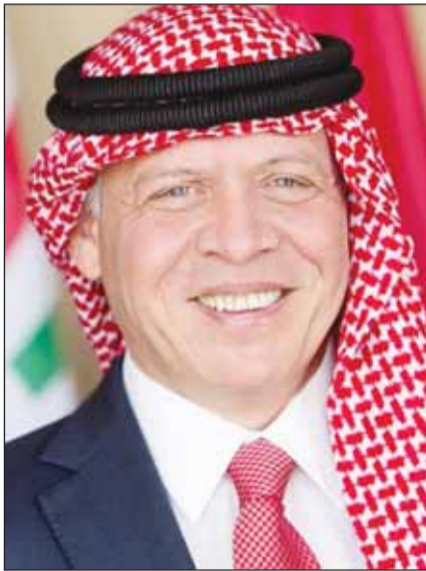
الملك عبدالله الثاني