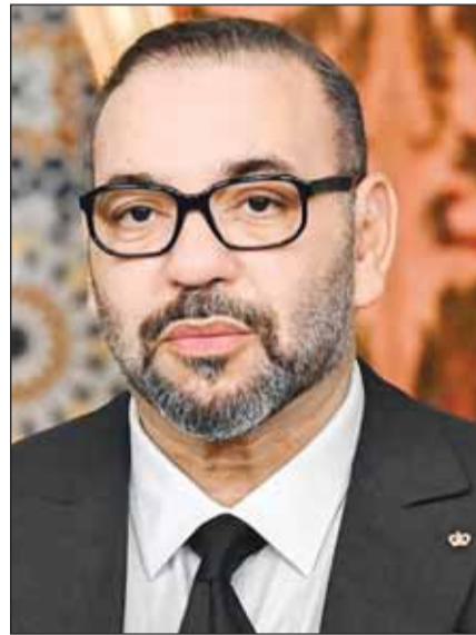
الملك محمد السادس