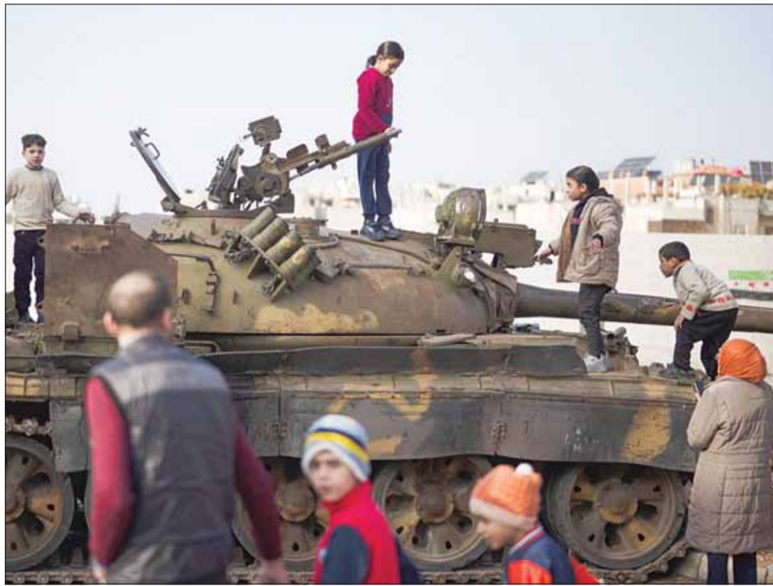
أطفال على قمة دبابة بأحد شوارع حلب علوي في حمص

من جهته، التقى محافظ طرطوس أحمد الشامي، عدداً من وجهاء ومتقفي وأعيان طرطوس على خلفية الأحداث الأخيرة في بعض مناطق المحافظة. ودعا المحافظ إلى تحكيم العقل والوعي ولغة