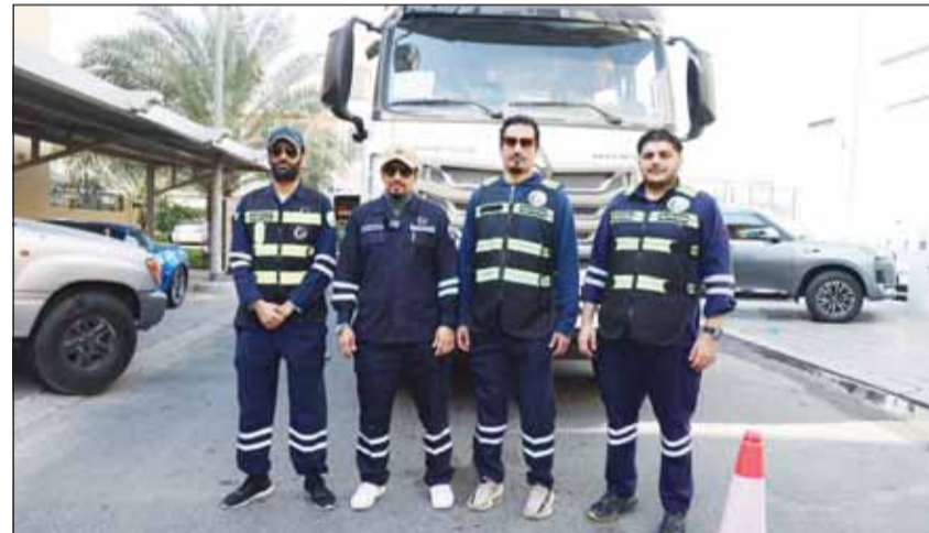
استعدادات لانطلاق عمليات صيانة الطرق في الفيحاء