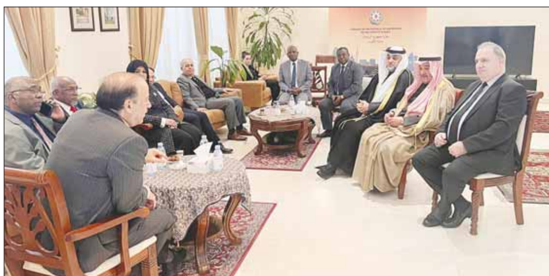
السفير كريموف مستقبلاً المعززين في ضحايا حادث سقوط الطائرة الأذربية

وصف سفير أذربيجان أميل كريموف الحادث الذي تعرضت له احدى طائرات الخطوط الجوية الأذربية بأنه «كارثة مأساوية» للشعب والأمة الأذربية، مشيراً إلى أن الحادث راح ضحيته 38 راكبا فيما نجا 16 آخرون. وقال كريموف - في تصريح صحفي خلال افتتاح سفارة أذربيجان سجل التعازي بعد سقوط طائرة الخطوط الجوية الأذربيجانية - بأمر من رئيس الدولة شكلت لجنة تحقيق للوقوف على ملابسات الحادث، ونحن بانتظار المعلومات الرسمية التي ستسفر عنها تحقيقات هذه اللجنة». وعن تقيمه لردود أفعال الدول تجاه الحادث، أعرب عن تقديره لموقف القيادة الكويتية على رأسها سمو الأمير ولي العهد، وسمو رئيس الوزراء الذين قدموا تعازيمهم للرئيس، وأضاف: تلقينا الكثير من برقيات التعازي من مختلف دول العالم ومن الأمم المتحدة والعديد من المنظمات الدولية بما فيها منظمة المؤتمر الإسلامي، وهذا يعكس حجم الكارثة الكبيرة. وأشاد كريموف بالبيان الذي أصدرته وزارة الخارجية وأعربت فيه عن تعاطف الكويت وتضامنها مع جمهورية أذربيجان حكومة وشعباً، إثر حادث تحطم الطائرة التابعة للخطوط الجوية الأذربيجانية غربي كازاخستان.