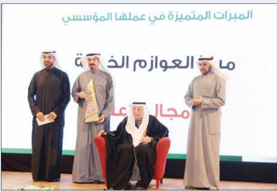
تكريم مبرة العوازم

بطرق مبتكرة وفعالة، وشكر فريق العمل في المبرة على تفانيهم وإخلاصهم، كما شكر لجنة الجائزة على هذا التقدير الذي يعزز من مسؤوليتنا وحمولتنا لمواصلة العطاء.