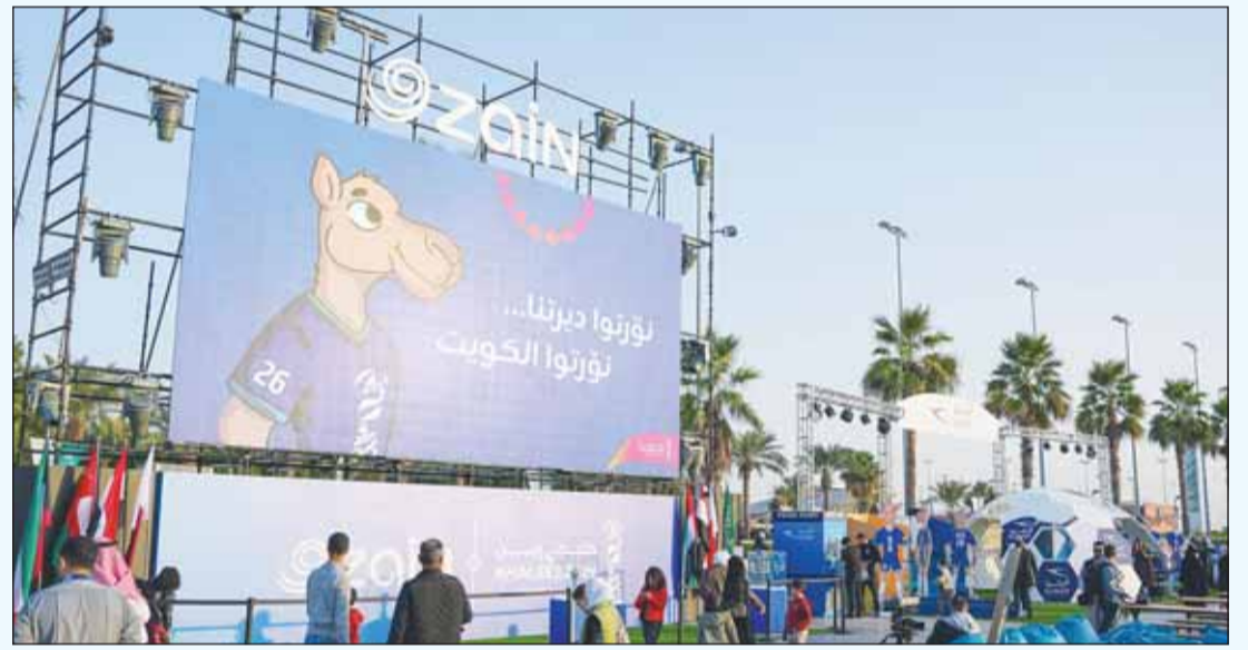
إدعاء مناطق نقل المباريات للمشجعين

منذ انطلاق أول صافرة بداية في بطولة خليجي زين 26، حرصت زين، الشريك الرسمي للبطولة، على إثراء تجربة الجماهير الخليجية داخل وفارج حدود الملعب، وذلك عبر مناطق المشجعين التي خصصتها الشركة في جميع أنحاء الكويت للاحتفاء بالعرس الخليجي طوال أيام تنظيم البطولة. وتستقبل زين الجماهير في ساحة مروج يومياً من 4 عصرًا وحتى 10 مساءً، بالإضافة إلى منطقة المشجعين في استاد جابر الأحمد الدولي خلال أيام المباريات، بحيث يتم نقل المواهب مباشرة على الهواء عبر شاشات ضخمة، بالإضافة إلى تنظيم مسابقات شيقة وتقديم جوائز مميزة، وتقديم أنشطة وعروض ترفيهية تفاعلية مثل الفرق الشعبية وغيرها، إلى جانب الألعاب والأنشطة المخصصة للأطفال