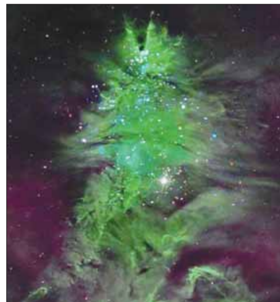
الشجرة الفضائية (موقع "ناسا")

ووفقاً لتوضيح العلماء، تظهر النجوم في الصورة على شكل أضواء زرقاء وبيضاء، ماطة بغاز يعمل بمثابة "إبر التنبؤ".