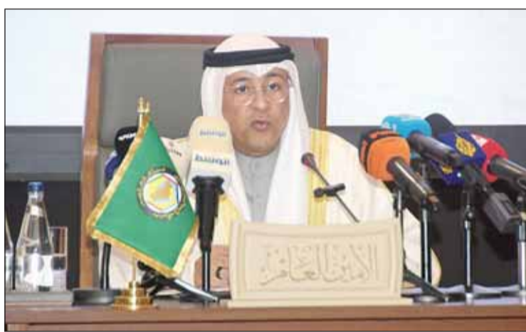
الأمين العام لمجلس التعاون الخليجي جاسم البيديوي خلال المؤتمر الصحافي

وأوضح أن ما ورد في البيان الختامي الصادر عن المجلس الأعلى في دورته الخامسة والأربعين، والمتعلق بالتطورات التي تشهدها الجمهورية اللبنانية الشقيقة، أكد على مواقف مجلس التعاون الثابتة مع الشعب اللبناني الشقيق وعن دعمه المستمر لسيادة لبنان وأمنه واستقراره، وإدانة الهجمات الإسرائيلية الخطيرة والتأكيد على أهمية تنفيذ إصلاحات سياسية واقتصادية هيكلية شاملة تضمن تغلب لبنان على أزمتته السياسية والاقتصادية، وعلى ضرورة تطبيق قرار مجلس الأمن 1701 وعودة النازحين والمهجرين إلى ديارهم، واستعادة الأمن والاستقرار الدائم في لبنان، وضمان احترام سلامة أراضيها واستقلالها السياسي وسيادتها داخل حدوده المعترف بها دولياً، وبسط سيطرة الحكومة اللبنانية على جميع الأراضي اللبنانية، وفق قرارات مجلس الأمن ذات الصلة واتفاق الطائف. واقتحم كلمته بالتأكيد على حرص واهتمام دول مجلس التعاون، بعلاقتها الأخوية والتاريخية، وروابطها المتينة مع الجمهورية العربية السورية والجمهورية اللبنانية، ويدل كافة الجهود لضمان أمنهما واستقرارهما بما يسهم في ازدهارهما والعيش الكريم المستدام لشعوبهم.