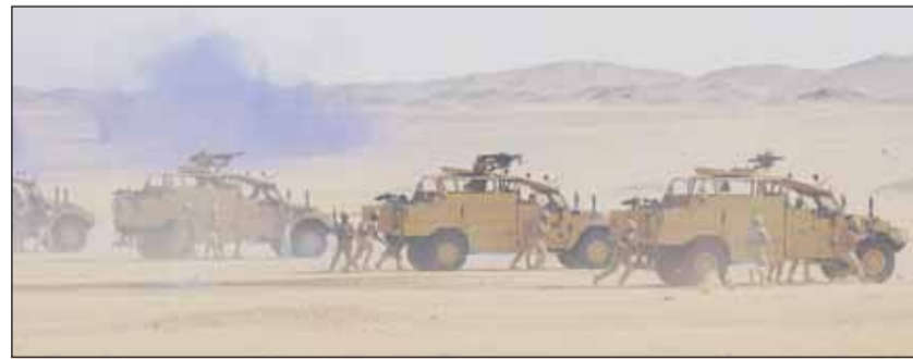
جانب من التمرين