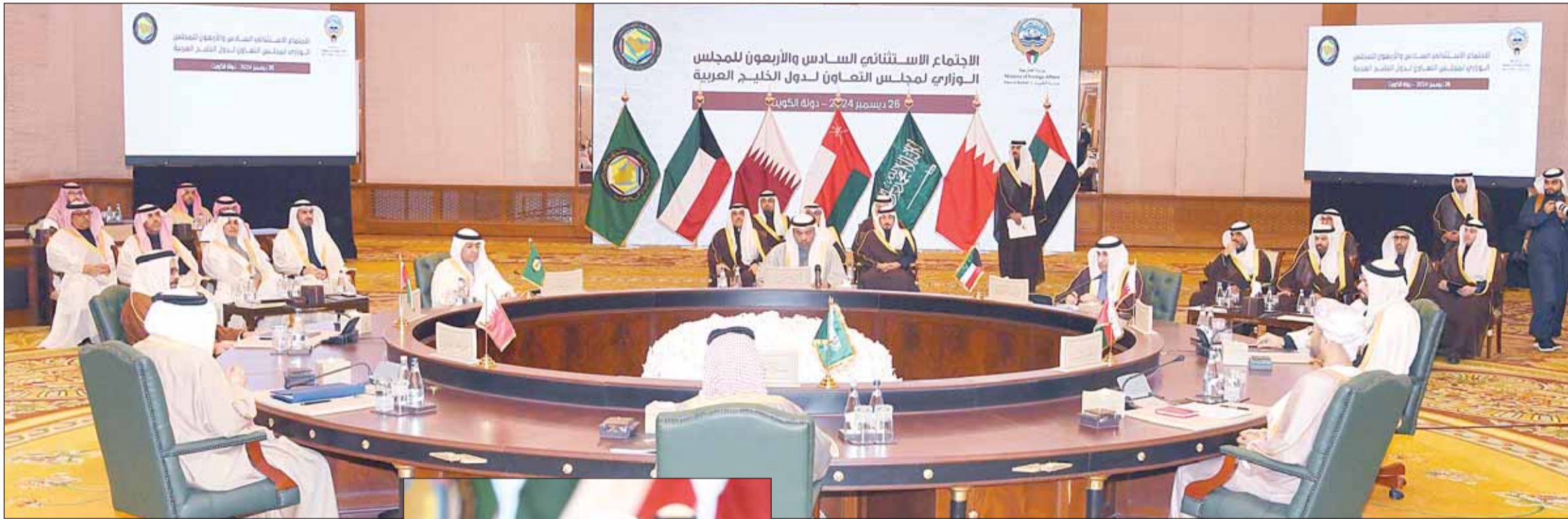
جانب من الاجتماع الاستثنائي الـ 46 للجلسة الوزاري لمجلس التعاون المنعقد في الكويت

أجل سورية خلال الأعوام (2013-2014-2015)، إلى جانب رئاستها المشتركة لمؤتمر لندن (2016) وبروكسل (2017). وأضاف: "ونجدد التزامنا بمواصلة هذا الدعم الإنساني، ونحث المجتمع الدولي على مضاعفة الجهود لتخفيف معاناة الشعب السوري، معبرين عن تضامننا معه لتعزيز علاقات الأخوة والتعاون لتحقيق كل ما من شأنه أن يحفظ أمنه ويمحق له التنمية والتقدم".