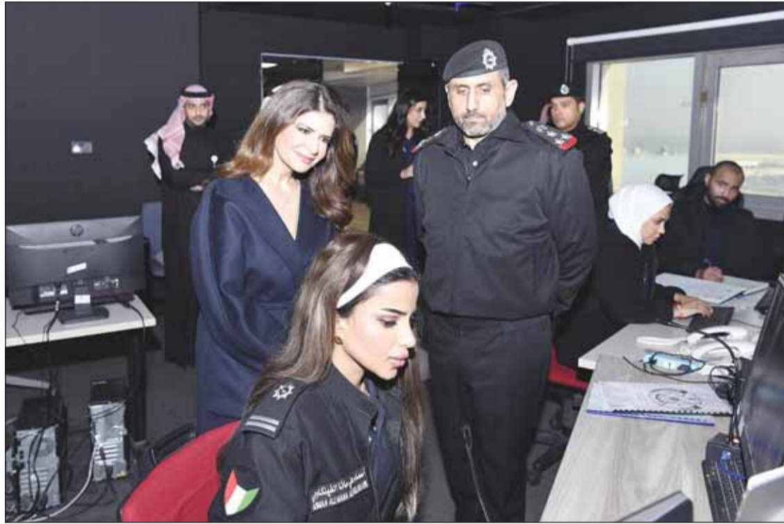
الشيخ مبارك الصباح ومهاجمة السالم في قاعدة "صباح الأحمد البحرية"

ونكر أنه في الأول من شهر يناير المقبل سيتم التخلص من التراخيص الورقية الخاصة بـ "الطراريد" والسفن والأوراق البحرية ورخص القيادة البحرية بعد تحويلها من النظام الورقي إلى الإلكتروني موضحا أن إصدار النسخ الورقية سيكون مقابل رسوم مالية. وعن العقوبات الجزائية لغير الملتزمين بتركيب جهاز التعريف الذاتي (AIS) قال الشيخ مبارك الصباح إن المهلة لتسجيل القطع البحرية ستنتهي في أواخر العام الحالي مؤكدا أن الهدف من هذا القرار هو تعرفه جميع القطع البحرية عند دخولها مياه الكويت الإقليمية وحمايتها ومراقبة أرواح مرتادي البحر. وأضاف أنه بانتهاء المهلة الممددة لن يسمح لأي من أصحاب القطع البحرية الذين لم يقوموا بتركيب جهاز التعريف الذاتي بالإبحار إلا عند تركيب الجهاز أو إضمار ما يثبت شراؤه مع توقيع تعهد بتركيبه وعند الانتهاء من ذلك تمنح مهلة سماح مدتها 3 أشهر مراعاة لأصحاب القطع البحرية ونظرا لزيادة الطلب على هذه الأجهزة.