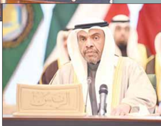
وزير الخارجية عبدالله اليماني ملقيا كلمته

وتابع، تؤكد دول المجلس على حقوق الشعب الفلسطيني غير قابلة للتصرف، وفي مقدمتها حقه في إقامة دولته المستقلة على حدود الرابع من يونيو 1967 وعاصمتها القدس الشرقية، كما نجدد مطالبتنا للمجتمع الدولي بحتمل مسؤوليته لوقف الاعتداءات الإسرائيلية المستمرة وضمان إيصال المساعدات الإغاثية والإنسانية والإمدادات الطبية لتلبية الاحتياجات الأساسية لسكان قطاع غزة دون قيود، مع توفير الحماية الدولية للشعب الفلسطيني الأحرار، كما نشدد على أهمية إحياء عملية السلام وضمان استئناف المفاوضات لتحقيق حل عادل وشامل للقضية الفلسطينية".