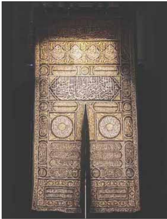
من المتحف الإسلامية