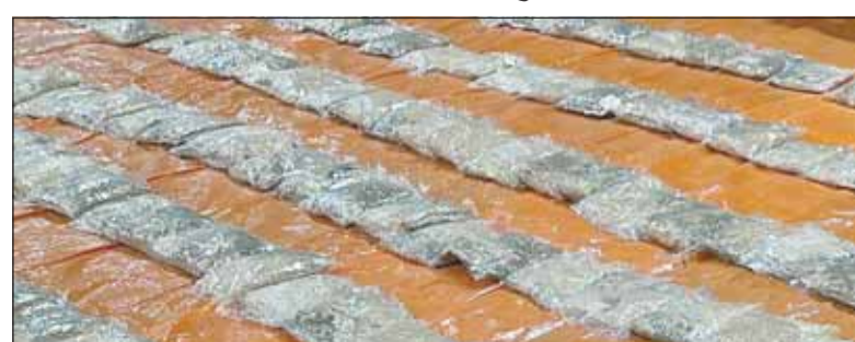
جانب من الحبوب المضبوطة

وفي تفاصيل الضبطية أن رجال إدارة جمارك الموانئ الشمالية بميناء الشويخ واثناء عمليات التفتيش الاعتيادية للماويات اشتهبه في بضاعة "طقم كنبات وطقم طاولات قهوة"، وبعد الفحص عثر بداخل البضاعة على حبوب صفراء اللون (كبتاغون) - حوالي 1,8 مليون حبة - واعد محضر الضبط واحيلت المضبوطات الى جهات الاختصاص.