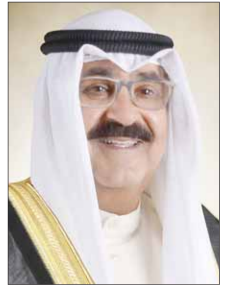
سمو الأمير الشيخ مشعل الأحمد

علييف رئيس جمهورية أذربيجان الصديقة عبر فيها سموه عن خالص تعازيه وصادق مواساته بضحايا حادث تحطم طائرة الركاب التابعة للخطوط الجوية الأذربيجانية في جمهورية كازاخستان الصديقة الذي أسفر عن سقوط الكثير من الضحايا والمصابين، سائلا سموه المولى تعالى أن يتفهم الضحايا بوسع رحمته ومغفرته ويسكنهم فسيح جناته وأن يمن على المصابين بسرعة الشفاء والعافية.