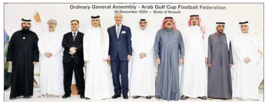
إجماع على إقامة النسخة 27 بالسعودية

يذكر أن السعودية استضافت بطولة كأس الخليج العربي لكرة القدم 4 مرات أعوام 1972 و1988 و2002 و2014 وسيكون (خليجي 27) المرة الخامسة.