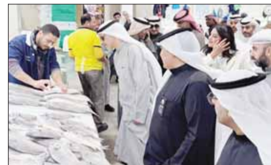
وزير التجارة يتفقد السمك الطازج

وتمركزت الحملة على التأكد من سير العمليات التجارية وفق الأنظمة والقوانين، شهد سوق المباركية أمس، جولة تفتيشية مشتركة بين وزارة التجارة والصناعة وبلدية الكويت، بهدف تعزيز حماية المستهلك والتصدي لعمليات الغش التجاري، وذلك تزامناً مع بطولة كأس الخليج العربي الـ 26.