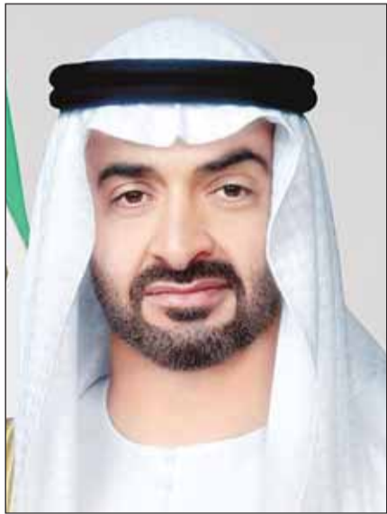
سمو الشيخ محمد بن زايد