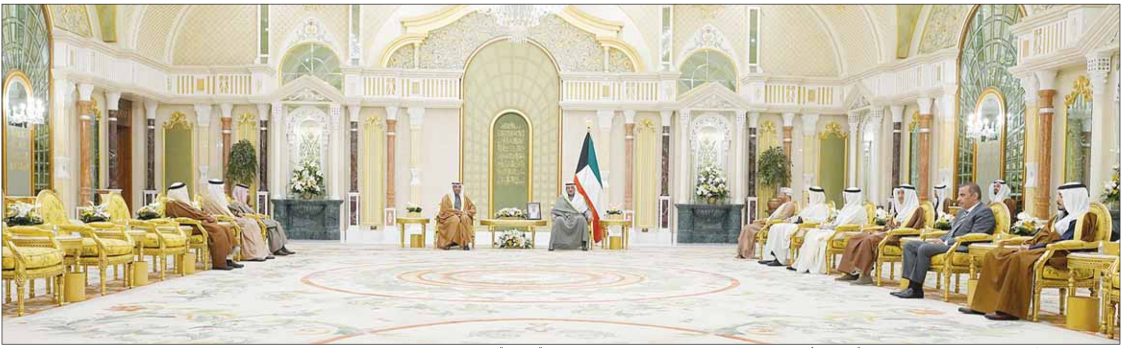
سمو ولي العهد الشيخ صباح خالد مستقبلا وزير الخارجية عبدالله اليحيا والأمين العام لمجلس التعاون الخليجي جاسم البديوي ووزراء خارجية "الخليجي"

جمهورية كازاخستان الصديقة الذي أسفر عن سقوط العديد من الضحايا والمصابين مبتغلا سموه إلى الباري جل وعلا أن يتفهم الضحايا بوسع رحمته ومغفرته ويسكنهم فسيح جناته وأن يمن على المصابين بسرعة الشفاء والعافية. كما بعث سموه ببرقية تهنئة إلى دولة الدكتور محمد يونس المنفي رئيس المجلس الرئاسي الليبي في دولة ليبيا الشقيقة ضمنها سموه خالص تهنئته بمناسبة الذكرى الثالثة والسبعين لعيد الاستقلال لبلاده وراجيا له دوام الصحة والعافية وللبلد الشقيق وشعبه الكريم كل التقدم والازدهار.