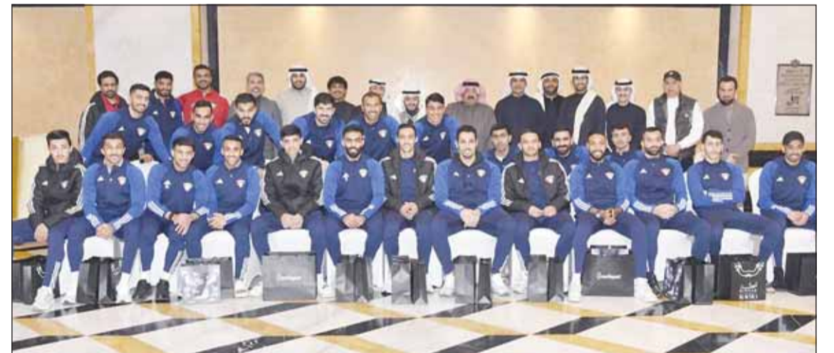
مهرجان الكويت للتسوق كرم أبطال المنتخب الوطني

ووقع روحهم المعنوية، وتقديم كل ما في جعبتهم في المباريات المقبلة، وقال، "من المؤكد أن التكريم، يُعد حافزا مهما للغاية لجميع اللاعبين دون استثناء، لتحقيق الانتصارات ورفع علم الكويت عاليا خفاقا في جميع المحافل".