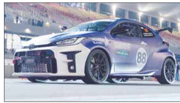
إدعاء سيارات ياريس المشاركة في السباق