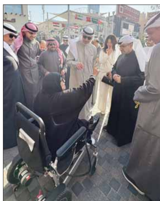
العصفور والعجيل والمشاري يستمعون إلى شكواهم المواطنين

استقبلت وزيرة المالية ووزيرة الدولة للشؤون الاقتصادية والاستثمار نورة سليمان الفصام في مكتبها امس سفيرة المملكة المتحدة لدى دولة الكويت بيلندا لويس، وتم خلال اللقاء استعراض العلاقات الاستراتيجية المتميزة التي تجمع البلدين الصديقين، وتبادل الآراء وجهات النظر حول العديد من القضايا ذات الاهتمام المشترك في المجالين المالي والاستثماري.