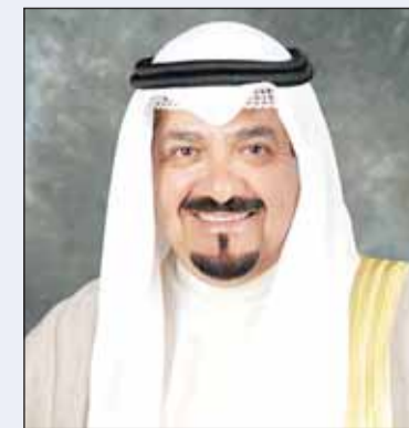
سمو رئيس الوزراء الشيخ أحمد عبدالله

بعث سمو رئيس مجلس الوزراء الشيخ أحمد عبدالله ببرقية تعزية إلى الرئيس الهام علييف رئيس جمهورية أذربيجان الصديقة ضمنها سموه خالص تعازيه وصادق مواساته بضحايا حادث تحطم طائرة الركاب التابعة للخطوط الجوية الأذربيجانية في جمهورية كازاخستان الصديقة. كما بعث سموه ببرقية تهنئة إلى دولة الدكتور محمد يونس المنفي رئيس المجلس الرئاسي الليبي في دولة ليبيا الشقيقة ضمنها سموه خالص تهنئته بمناسبة الذكرى الثالثة والسبعين لعيد الاستقلال لبلاده.