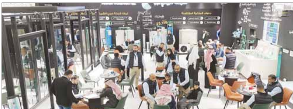
إقبال ملحوظ على جناح الشركة في المعرض

وأضاف أن الشركة تفخر بخدمات الصيانة المدعومة بأسطولها الأكبر والأقدم في الكويت، والمخصص لخدمة الأنظمة المركزية، معدات المياه، للتكييف المركزي، وأحواض السباحة، مع توفير خدمات ما بعد البيع على مدار الساعة وطوال أيام الأسبوع. وأشاد خنفر بالنمو المتسارع الذي يشهده قطاع البناء والتشييد المحلي، لا سيما في المناطق السكنية الجديدة مثل المطامع وغرب عيد الله المبارك، والمشاريع الحكومية التي تهدف إلى تمسين البنية التحتية.