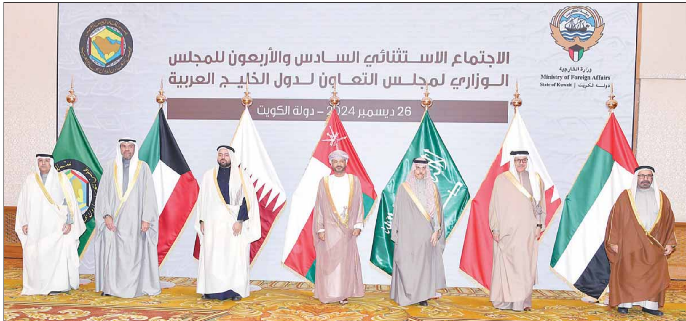
وزراء الخارجية لدول مجلس التعاون لدول الخليج العربية