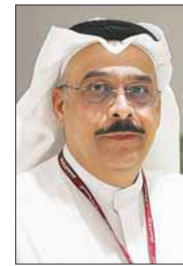
المستشار نصر سالم آل هيد

وهبت النيابة العامة إلى المتهم بصفته موظفاً عاماً "منسّق إداري" بقسم حسابات الخدمات والمكلف بتحصيل قيمة المستحقات المالية من المشتركين في تلك الخدمات تهمة اختلاس 6 ملايين دينار المملوكة لجهة عمله والمسلمة إليه بسبب عمله، بأن قام بتحصيل المبلغ من المشتركين قيمة المديونية المستحقة عليهم لصالح جهة عمله دون أن يقوم بتحويله لها قامداً امتساعاً لنفسه.