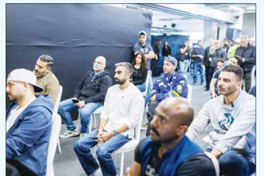
جانب من الحضور فيء الفعالية