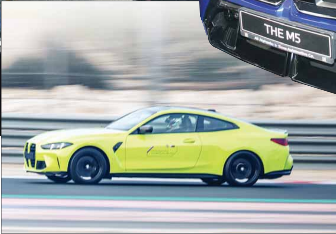
انسيابية فيء الأداء