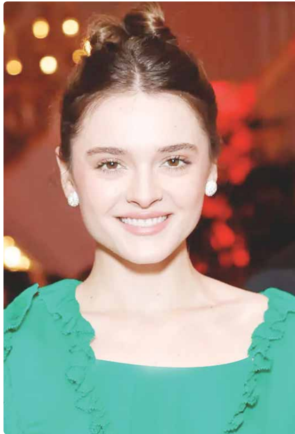
المغنية الأميركية شارلوت نورانس خلال حضورها حفل توزيع جوائز "WWD Style" في لوس أنجلوس