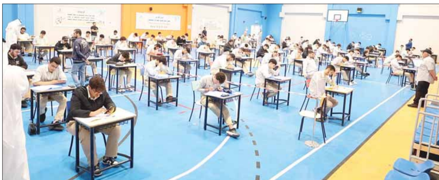
"التربية" جاهزة لاختبارات الثاني عشر