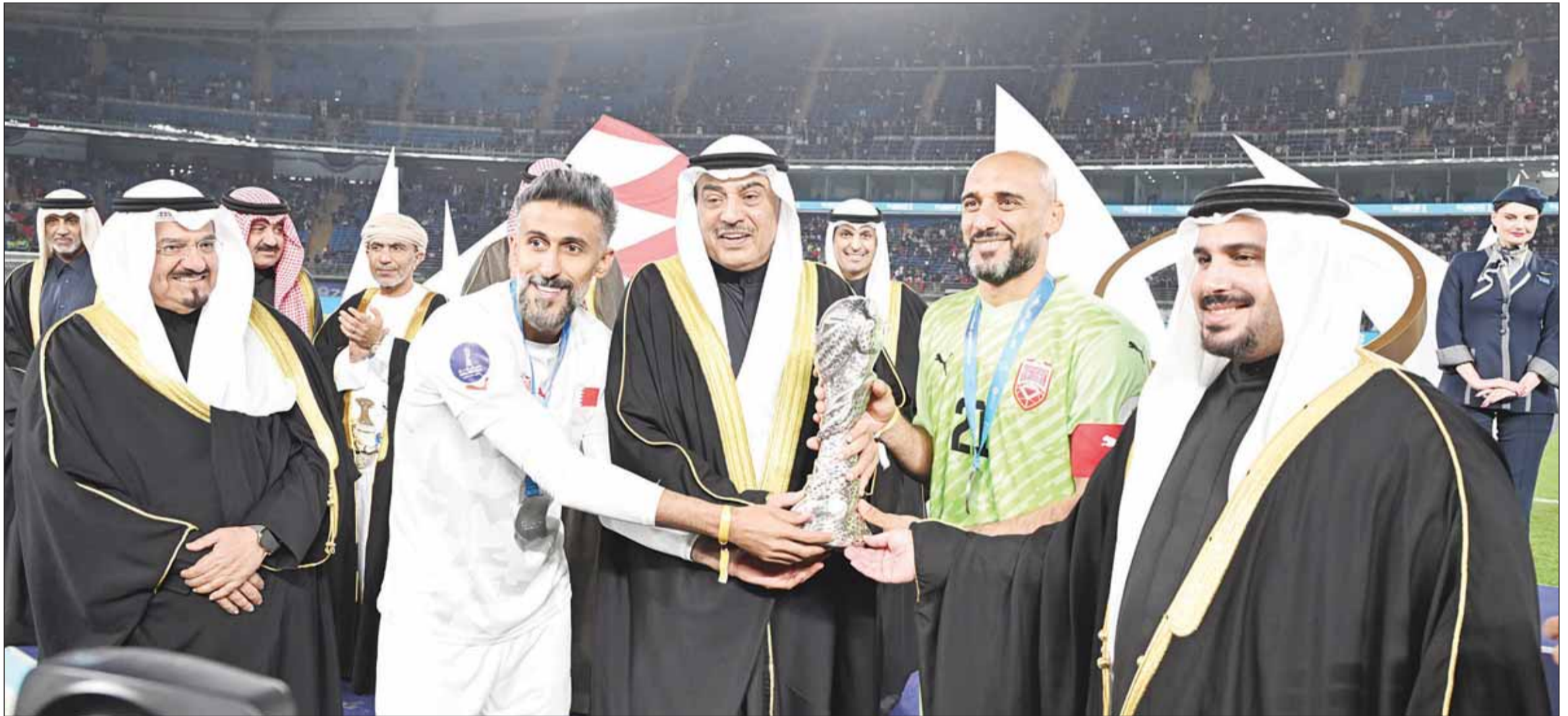
ممثل سمو الأمير سمو ولي العهد الشيخ صباح خالد يسلم قائد المنتخب البحريني سيد جعفر كأس البطولة

بعث سمو أمير البلاد الشيخ مشعل الأحمد بترقيات شكر بمناسبة اختتام بطولة كأس الخليج العربي السادسة والعشرين التي استضافتها دولة الكويت خلال الفترة من 21 ديسمبر 2024 إلى 4 يناير 2025 إلى كل من: سمو رئيس مجلس الوزراء الشيخ أحمد العبدالله، رئيس الحرس الوطني الشيخ مبارك الحمود، النائب الأول لرئيس مجلس الوزراء وزير الدفاع وزير الداخلية الشيخ فهد يوسف، وزير الإعلام والثقافة وزير الدولة لشؤون الشباب عبدالرحمن المطيري، وزير الصحة د.أحمد العوضي، وزيرة الأشغال العامة د.نورة المشعان، وزير الكهرباء والماء والطاقة المتجددة د.محمود بوشهري، وزير الدولة لشؤون البلدية وزير الدولة