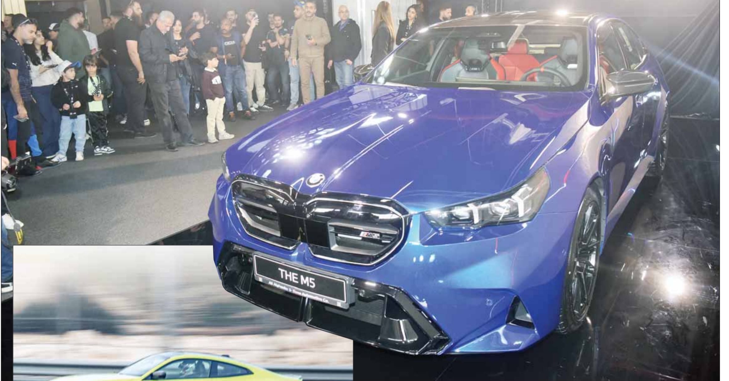
طراز "BMW M5" الجديد

السيارة تجسد مزيجاً رائعاً يجمع بين الهندسة المتقنة والفن ... ومزودة بمحرك V8 ثماني الأسطوانات بسعة 4.4 لتر