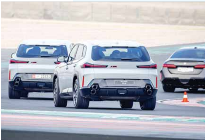
حلبة عالمية المستوى

التي تتمتع بها طرازات BMW M والتي تختصر ذروة الابتكار والأداء والرفاهية. وقد سعدت بمشاركة عشاق السيارات في الكويت لحظات لا تنسى على الحلبة العالمية المستوى، وذلك ضمن فعالية لم تقتصر فحسب على السيارات، بل قدمت تجارب فريدة تعكس شعار BMW القائم على الشغف والتشويق ومتمعة القيادة.