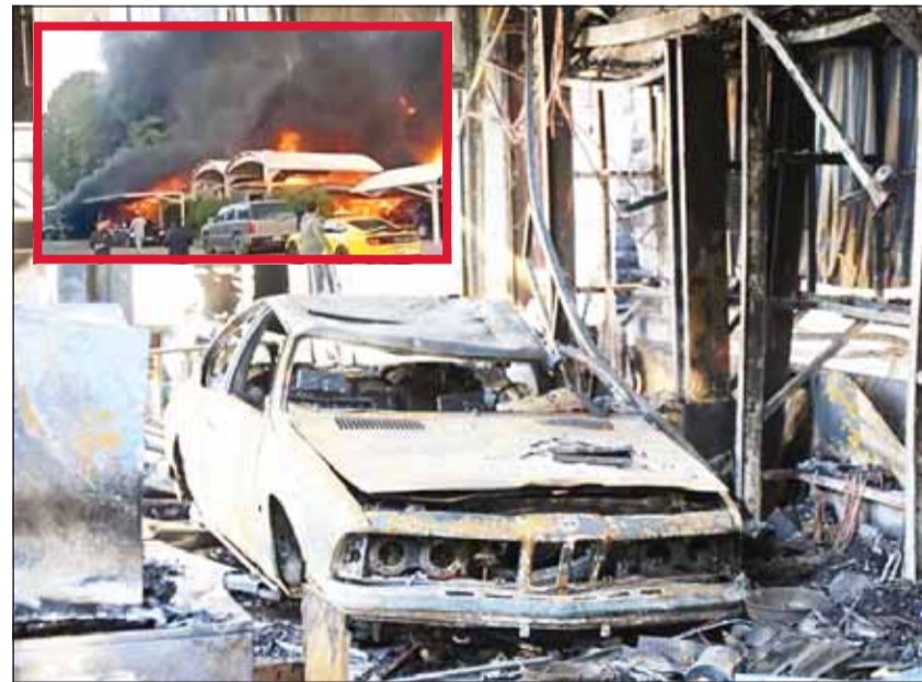
آثار الحريق وفيه الإضرار أسنة النيران تتصاعد

أعلنت قوة الإطفاء العام عن تمكن فرق الإطفاء من مركزي البدع والسالمية من السيطرة البدع حريق اندلع صباح أمس في عدد من المركبات والأشجار أمام منزل في منطقة الرميثية، ثم امتدت أسنة النيران إلى أجزاء من واجهة المنزل. ولفتت "الإطفاء" إلى أن فرقها كافتت الحريق وأخمده دون تسجيل أي إصابات تذكر حيث اقتصر الأضرار على الماديات. وكانت فرق إطفاء مركزي الوفرة والنويصيب سيطرت مساء أول من أمس، على حريق اندلع في مخزن يحتوي على مواد زراعية في مزرعة بمنطقة الوفرة، حيث تمكنت من إخماد الحريق دون وقوع إصابات بشرية.