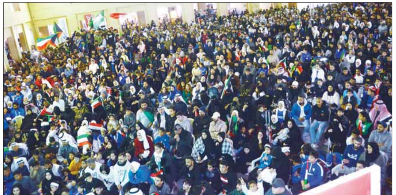
إقبال جماهيري لافت على المباركية

ونذكرت أن الوزارة وفرت جميع الخدمات اللوجستية اللازمة للقنوات الفضائية الخليجية والمشاركة، بما في ذلك تسهيل عمليات البث المباشر وتقديم الدعم الفني لضمان نقل البطولة بصورة تليق بمكانتها.