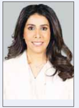
د. نورة المشعان

أعلنت وزارة الأشغال العامة أمس، بدء أعمال الصيانة الجذرية للطرق في منطقة بيان، ضمن عقد صيانة الطرق في محافظة حولي، موضحة ان فرق الوزارة عاينت المنطقة قبل البدء في الأعمال. وفي السياق، قالت وزيرة الأشغال العامة الدكتورة نورة المشعان ان أعمال صيانة الطرق ستنتقل في المناطق الأكثر تضرراً ثم الأقل، مع وجود رقابة وإشراف ومتابعة على أعمال الصيانة، موضحة أن فرق عمل من وزارة الأشغال ستراقب تنفيذ أعمال الصيانة. وبينت المشعان، في تصريح صحفي أن توجيهاتها