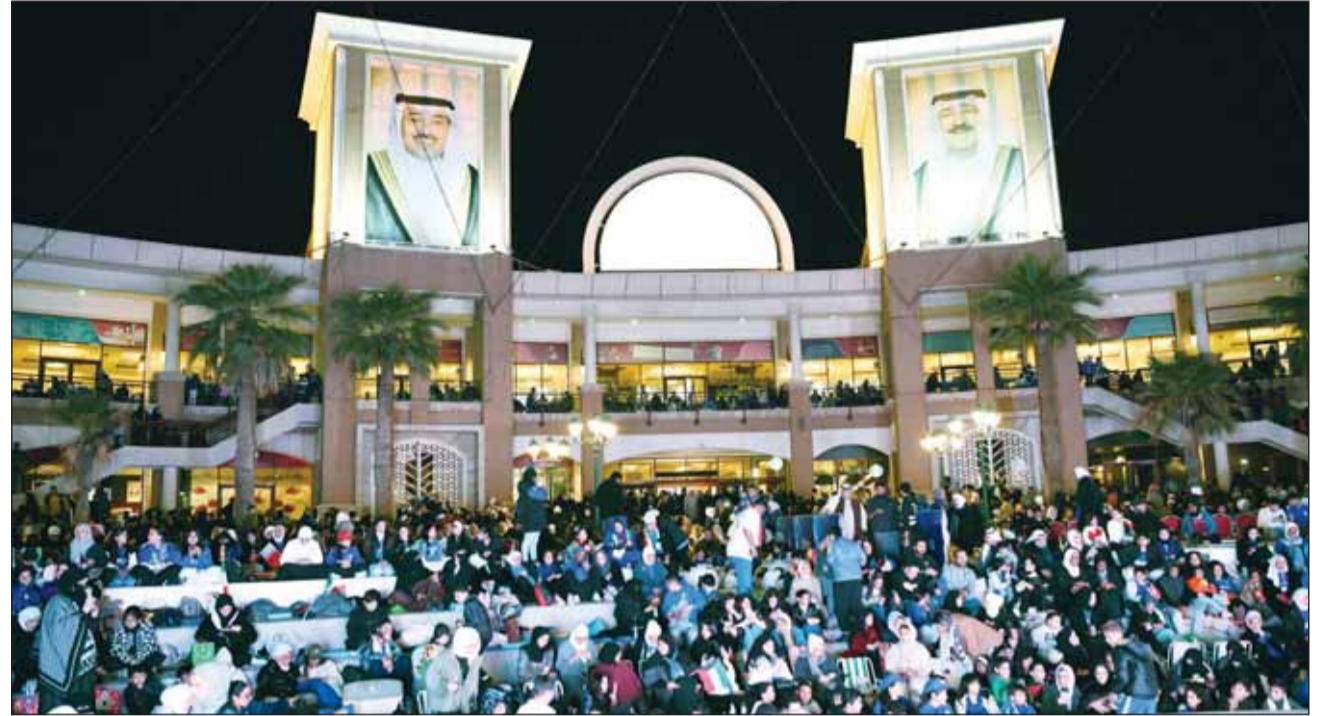
حشد توابع "خليجي 26" في سوق شرق

ملء بالفرض والتحديات، ولقد أثبتت أنها ليست فقط قادرة على تنظيم البطولات الكبرى، بل إنها تتمتع بقدرة استثنائية على جعل مثل هذه الفعاليات محفزاً للنهضة الشاملة، اقتصادياً وسامياً واجتماعياً. هذا الإنجاز يعد دعوة مفتوحة للكويت لمواصلة العمل الجاد وتحقيق المزيد من الإنجازات التي تعزز مكانتها في المنطقة والعالم.