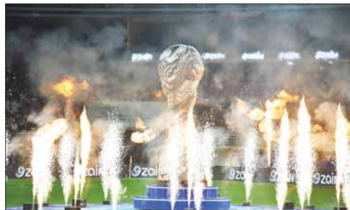
جانب من حفل ختام البطولة

قام سمو ولي العهد الشيخ صباح خالد، قبل انطلاق المباراة النهائية لبطولة "خليجي زين 26" بين البحرين وعمان، بتكريم أساطير كرة القدم الخليجية، وهم: إسماعيل مطر "الإمارات"، وطلال يوسف "البحرين" ومحمد عبدالجواد "السعودية"، وحسين سعيد "العراق"، وعلي الحبسي "عمان"، ومبارك مصطفى "قطر"، وجاسم يعقوب "الكويت"، وأنور السروري "اليمن".