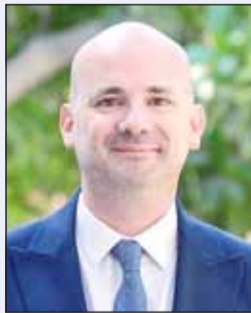
السفير أوليفييه غوفين

جّد السفير الفرنسي لدى البلاد أوليفييه غوفين، الخزام بلاده بمواصلة تعزيز روابط الصداقة والتعاون مع الكويت في جميع المجالات. وقال غوفين في رسالة مرسلة على حساب السفارة الخاص على موقع "انستغرام"،