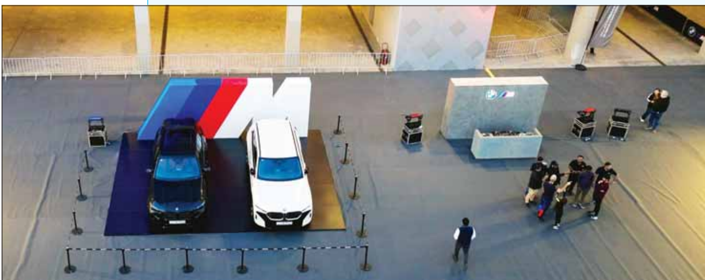
صورة من أعلى للسيارة