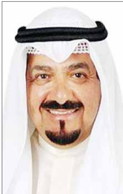
سمو الشيخ أحمد العبدالله