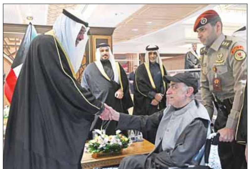
سمو ولي العهد الشيخ صباح خالد مكرماً "المربع" جاسم يعقوب

قام سمو ولي العهد الشيخ صباح خالد، قبل انطلاق المباراة النهائية لبطولة "خليجي زين 26" بين البحرين وعمان، بتكريم أساطير كرة القدم الخليجية، وهم: إسماعيل مطر "الإمارات"، وطلال يوسف "البحرين" ومحمد عبدالجواد "السعودية"، وحسين سعيد "العراق"، وعلي الحبسي "عمان"، ومبارك مصطفى "قطر"، وجاسم يعقوب "الكويت"، وأنور السروري "اليمن".