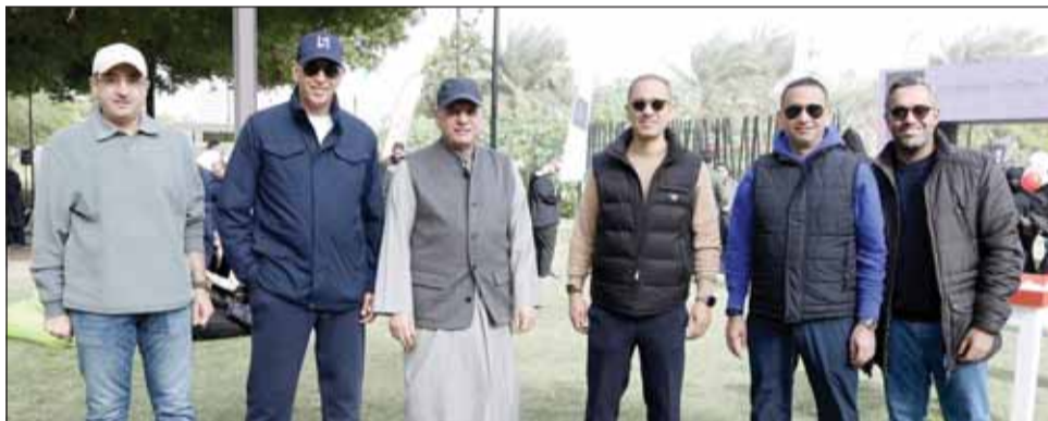
أعضاء الإدارة التنفيذية لبوبيان أثناء المهرجان