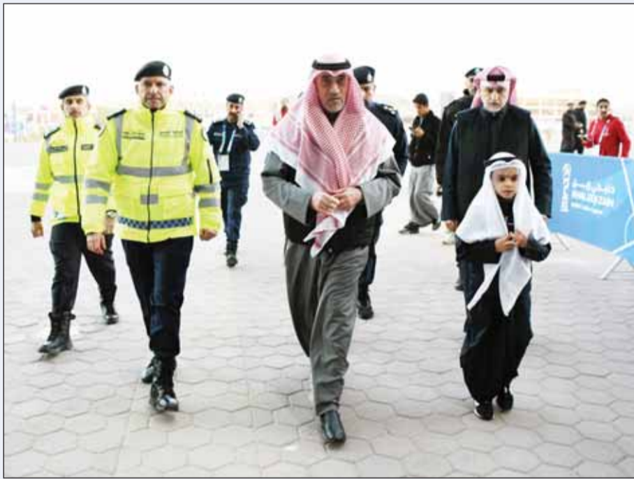
الوزير الشيوخ فهد اليوسف خلال جولاته الميدانية على الملاعب وأماكن الفعاليات

وفي أجواء سياحية غير مسبوقه اكتفت الفنادق بالنزلاء، وغصت المطاعم بالزوار، فيما كانت الأسواق نابضة بالحياة، في مشهد أعاد للأذهان