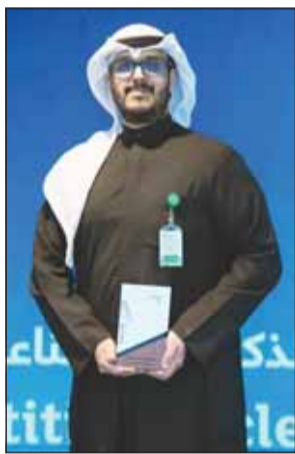
احد الفائزين في مسابقة الابتكار

الرشود: تبني الأفكار المميزة للمحافظة على ريادة "بيتك" التركيت: فخورون بالحلول التكنولوجية الفريدة لكوادرنا