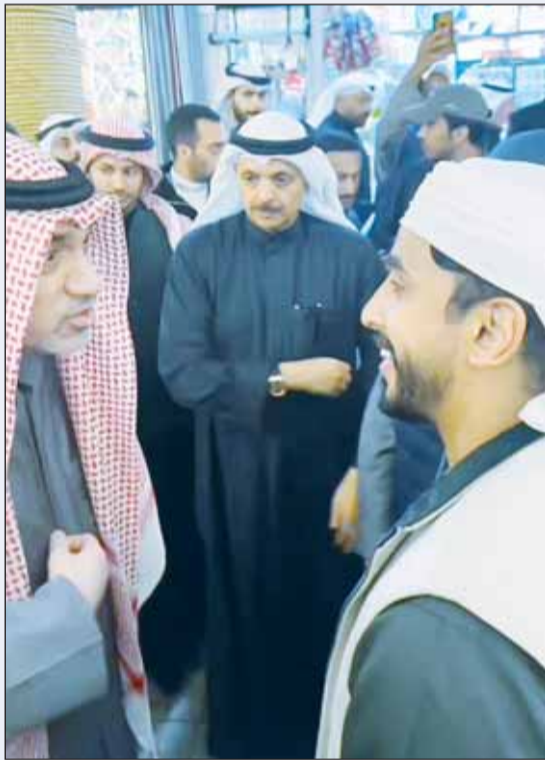
اليوسف في إحدى جولاته على أسواق المباركية

وأشاد غير واحد من الزوار والجماهير بدور وزارة الداخلية وتواجدها الدائم والمميز، كما أشادوا بدور الحرس الوطني في نقل الجماهير إلى استاد جابر الدولي من أماكن وقوفهم بانسيابية.