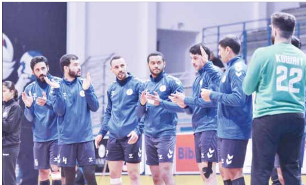
منتخبنا الوطني أمام استحقاق دولي

عبر رئيس اللجنة الأولمبية الكويتية، الشيخ فهد الناصر، عن سعادته باستضافة دولة الكويت لأول بطولة دولية في فروسية قفز الحواجز والموهلة إلى كأس العالم، في الموسم الرياضي الحالي 2024-2025، وسط منافسة قوية بين أكثر من فارس وفارسة على اللقب. وقال الشيخ فهد الناصر، خلال حضوره فعاليات بطولة الكويت الدولية الموهلة لكأس العالم في رياضة فروسية قفز الحواجز التي تقام منافساتها في مركز الكويت للفروسية بمنطقة صبحان، "نحن اليوم نشهد أول بطولة دولية موهلة لكأس العالم في رياضة فروسية قفز الحواجز تقام في مضمار مركز الكويت للفروسية وهذا فخر كبير لنا جميعاً كجنة أولمبية كويتية واتحادات رياضية محلية أنا نستضيف مثل هذه البطولات الدولية الموهلة إلى كأس العالم". وبارك الشيخ فهد الناصر لرئيس وأعضاء الاتحاد الكويتي للفروسية على تزكية الجمعية للفروسية لقيادة الفروسية الكويتية في الدورة الانتخابية 2024-2028، مشيراً إلى أن