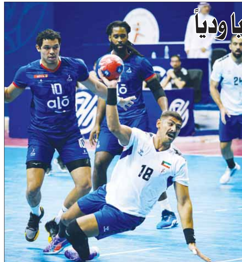
أزرق اليد يخوض وديته الثانية غداً

تعود السعودية لتحتضن للمرة الخامسة، الرابعة تواليًا، كأس السوبر الإسباني، بمشاركة ريال مدريد وبرشلونة وأتلتيك بلابو ومليوركا. وتطلق البطولة اليوم بمواجهة برشلونة وبلابو، ثم سيلعب الريال ومليوركا غداً. وسيحتضن ملعب الملك عبدالله وسعته