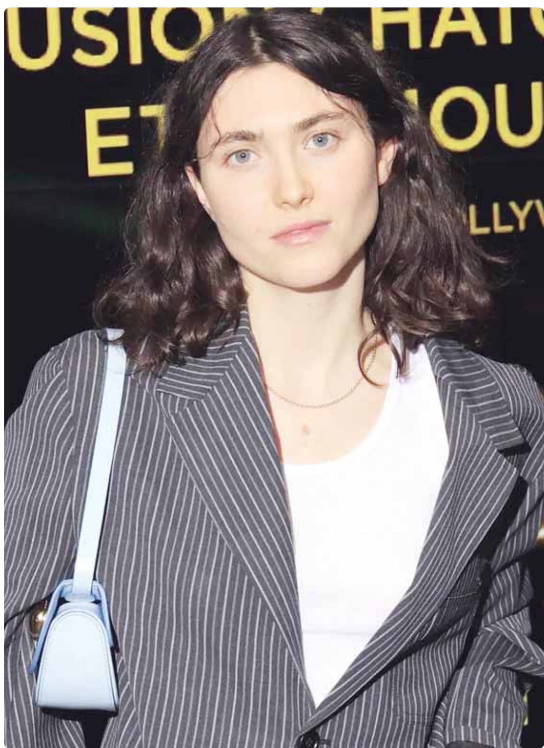
الممثلة الفرنسية سالومي روز شتاين خلال حضورها فيلم "المترجمون" في باريس

مستقبل سورية في يد هؤلاء سيكون قائماً بلا شك، لأنهم سيكونون أداة في يد تركيا، يأتهمون بأوامرها، وأسأل الله أن يحفظ الشعب السوري من كل مكروه.