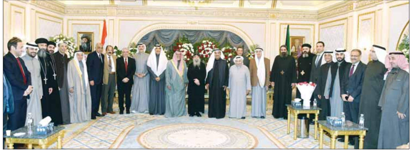
الشيخ علي الجراح والسفير المصري أسامة شلتوت والقمص بيجول يتوسطون المهنيين

بصوره، تقدم راعي الاقباط الكاثوليك بالكويت الاب يسع زكريا بالتهنئة الى سمو الامير بالعام الجديد والميلاد المجيد، مضيفا اننا نعيش اياما مباركة على ارض المحبة والسلام. وهنا ولي العهد سمو الشيخ صباح الخالد وسمو رئيس مجلس الوزراء الشيخ احمد العبدالله، والى الوزراء والشعب الكويتي بالتهاني بالعام الجديد وعيد الميلاد. واضاف يسع، نحن نعيش على هذه الارض بامان وسلام ومحبة، وان هذا ليس جديدا على الكويت او شعبها او حكومتها، بل هي عادات اصيلة تروى عليها وعاشوا بها وورثوها لاجيالهم ابناء شعب الكويت الحبيبة. وووجه تحية اجلال وتقدير للرئيس عبدالفتاح السيسي الذي دائما سباق بالتهنئة والذي جعل هذا اليوم يوم 7 يناير اجازة رسمية في كل انحاء مصر، سائلين الله ان يحفظ بلدنا المحبوبة والغالبة على قلوبنا مصر وبهنا صمام الأمن والأمان من كل مكروه.