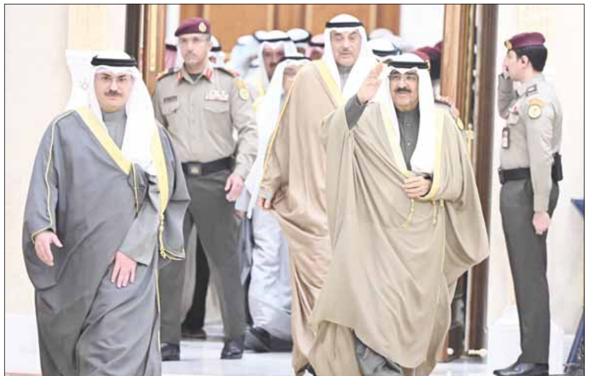
سمو أمير البلاد الشيخ مشعل الأحمد محيياً الحضور