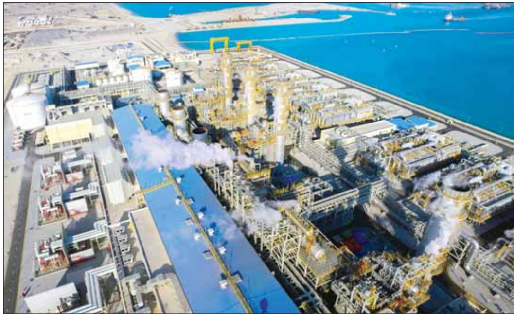
محطة الزور المرحلة الأولى

كشفت مصادر مطلعة في وزارة الكهرباء والماء والطاقة المتجددة عن إغلاق باب تقديم العطاءات لمشروع محطة الزور الشمالية لتوليد الطاقة الكهربائية وتحلية المياه المرحلة الثانية والثالثة الأسبوع الماضي.