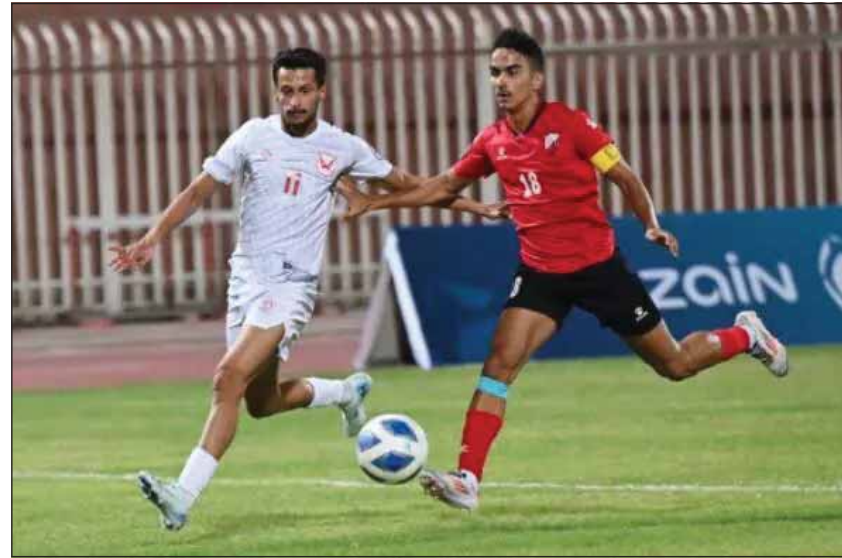
الفحيحيل يسعده لتأكيد تفوقه على خيطان

وتستكمل الجولة غداً بمواجهتين، حيث يلتقي التضامن واليرموك على استاد ناصر العصيمي، فيما ستكون الجماهير مع قمة مباريات الجولة العاشرة