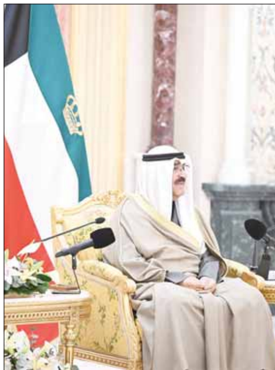
سمو أمير البلاد يلقي كلمته