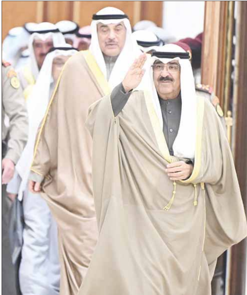
سموه أمير البلاد الشيخ مشعل الأحمد محبياً الحضور

➤ النجاح ثمرة تعاون وتألف الكويتيين شعباً ومسؤولين والعلاقات الأخوية والروح الرياضية أسمى فوز ➤ ندعم الاستمرار فيما تشهده كويتنا الغالية من نهضة تنموية في شتى المجالات لا سيما الرياضة