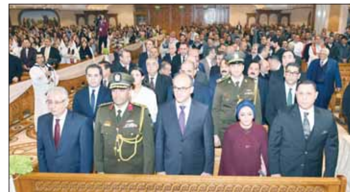
السفير شلتوت والملحق العسكري المصري يتقدمان الحضور

في أجواء مفعمة بالرومانية والفرح، امتلأت الكنيسة القبطية المصرية في الكويت بعيد الميلاد المجيد في كاتدرائية مارمرقس للأقباط الأرثوذكس. وتميزت الاحتفالات بتراتيل الميلاد التي أدخلت البهجة إلى قلوب الحاضرين، وسط تزيين الكاتدرائية بباقات ورد مضيئة تحمل أسماء أصحاب السمو والشخصيات المجتمعية الرفيعة، الذين قدموا تهانئهم القلبية بمشاعر ملوها المحبة والتأخي. من جهته، ألقى السفير المصري لدى الكويت، أسامة شلتوت، كلمة عبر فيها عن تهاني الرئيس عبدالفتاح السيسي لكمة وشعب الكنيسة القبطية، ونقل السفير رسالة الرئيس التي قال فيها: "يسعدني أن أبعث إليكم بأخلص التهاني القلبية وأصدق التمنيات بمناسبة الاحتفال بعيد الميلاد المجيد، مضيفا "أغتنم هذه المناسبة الطيبة، كي أعرب عن أمنياتي لكم بدوام