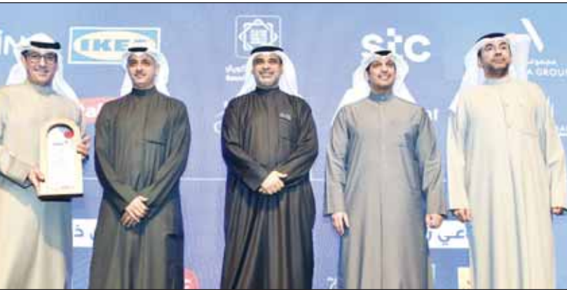
الغبريللي والمتنوق والصميط والخشني

مارس، سيقدّم مهرجان الكويت للتسوق "يا هلا" عروضاً ترويجية وتخفيضات وخصومات وهدايا من قبل الجهات المشاركة، التي تشمل المجمعات التجارية ومولات العزقة والجمعيات التعاونية والأسواق المركزية والشركات الكبرى ومولات التجارة الإلكترونية والأنشطة التجارية من جميع القطاعات.