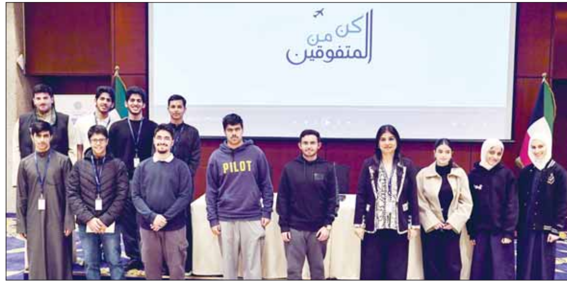
عدد من الطلاب والطالبات المشاركين في برنامج "كن من المتفوقين"

العياض: أكثر من 330 طالباً وطالبة شاركوا في رحلات البرنامج حتى الآن