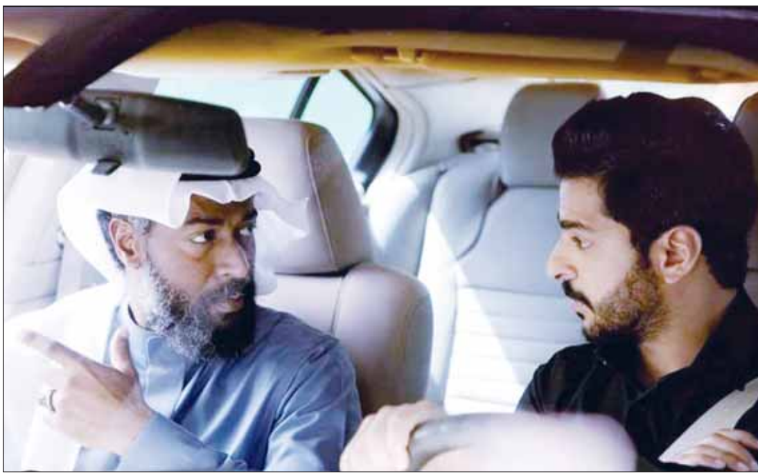
مشهد من مسلسل "عندما يكتمل القمر"