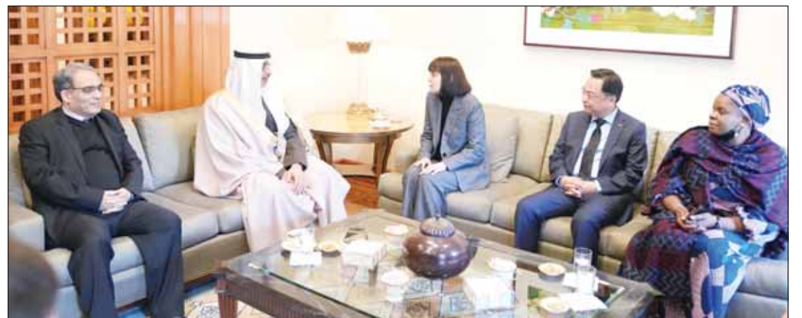
وزير الديوان الأميري الشيخ محمد العبدالله يقدم واجب العزاء في السفارة الأميركية

قام وزير شؤون الديوان الأميري الشيخ محمد العبدالله أمس بزيارة إلى سفارة الولايات المتحدة الأميركية لدى دولة الكويت، حيث نقل تعازي سمو أمير البلاد الشيخ مشعل الأحمد وسمو ولي