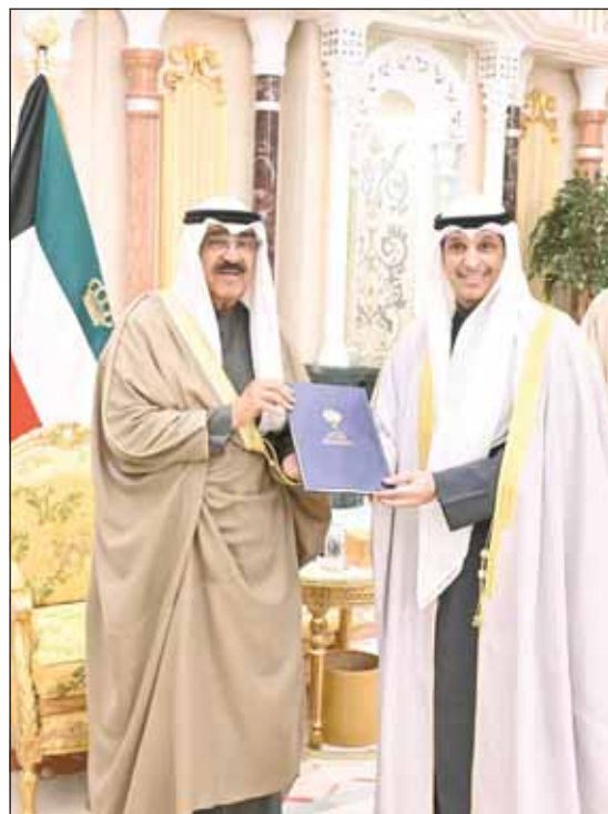
سمو أمير البلاد والوزير عبدالرحمن المطيري

ما زالت الفرحة تملأ القلوب والبهجة تعم الوجوه بنجاح وطننا العزيز في استضافة بطولة "كأس الخليج"