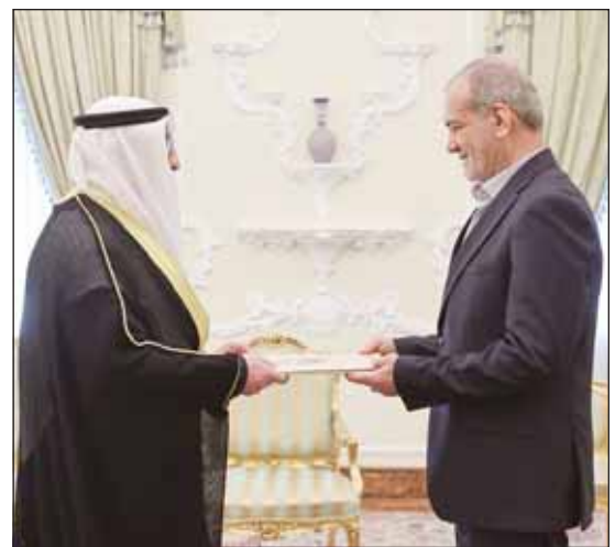
الرئيس الإيراني يتسلم أوراق اعتماد السفير د. مشعل المنصور ممحلا السفير المنصور تحياته لسمو أمير البلاد وتمنياته لسموه وافر الصحة ولشعب الكويت المزيد من التقدم والازدهار.

طهران - كونا، قدم السفير الدكتور مشعل المنصور أمس، أوراق اعتماده سفيرا لدولة الكويت لدى إيران إلى الرئيس الإيراني الدكتور مسعود بزشكيان. وقالت سفارة دولة الكويت في إيران في بيان إن "السفير مشعل المنصور نقل خلال اللقاء تحيات سمو أمير البلاد الشيخ مشعل الأحمد وسمو ولي العهد الشيخ صباح خالد وتمنياتها للرئيس الإيراني مسعود بزشكيان ولشعب إيران الصديق المزيد من التقدم والازدهار". وأشاد السفير بمستوى العلاقات بين البلدين معربا عن تطلع دولة الكويت إلى العمل على تعزيز وتطوير تلك العلاقات "المتميزة" لتشمل مختلف المجالات ومواصلة التشاور وتبادل الآراء حول القضايا والمواضيع ذات الاهتمام المشترك. وأكد السفير المنصور حرص دولة الكويت على الدفع بالعلاقات الثنائية مع إيران بما يليبي طموحات حكومتي وشعبي البلدين والارتقاء بها إلى آفاق أرحب. من جانبه أكد الرئيس الإيراني مسعود بزشكيان أهمية العلاقات الثنائية بين البلدين مرحبا بالسفير الكويتي وتمنيا له كل التوفيق في أداء مهام عمله. وأضاف أن ما "يجمع الكويت وإيران هو رابطة الدين والجوار"