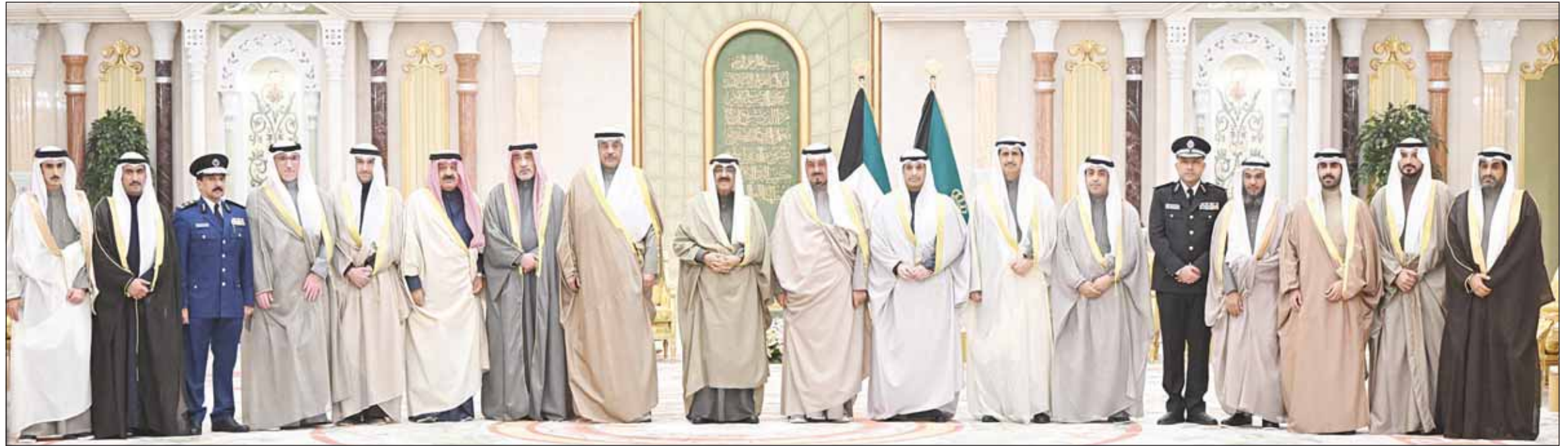
سمو أمير البلاد الشيخ مشعل الأحمد بنو سميح ولي العهد الشيخ صباح خالد وسمو الشيخ أحمد عبدالله والنائب الأول الشيخ فهد اليوسف ورئيس وأعضاء اللجنة العليا المنظمة لبطولة كأس الخليج العربي

سموه استقبل اللجنة العليا المنظمة لبطولة "خليجي 26" وشكر الشعب الكويتي وهنأ البحرين