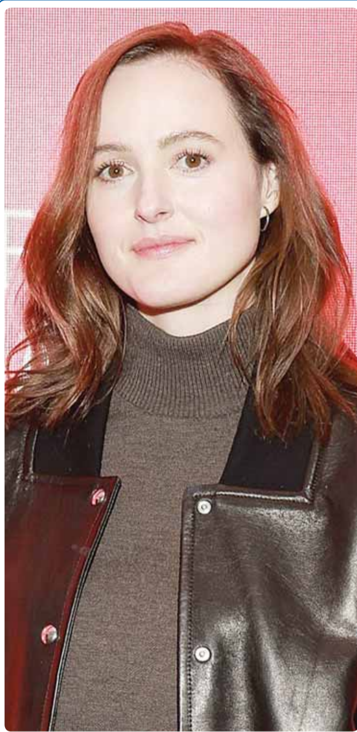
الممثلة النرويجية ريناتي رينسف خلال حضورها احتفالية "Armand" في نيويورك