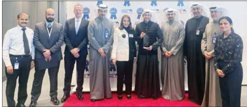
شيخة البحر والذرافعي والعبلاني والقطيفي ودايموند مع الفائزين من مجموعة العمليات والمعلومات