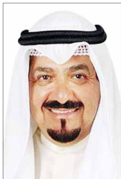
سمو الشيخ أحمد العبدالله

نشيد بما يشهده البلد الشقيق من إنجازات تنموية وحضارية بارزة شملت مختلف الميادين حرص دائم ومشترك على تعزيز العلاقات والارتقاء بأفق التعاون القائم على الأصعدة كافة ولي العهد: نتمنى لسلطنة عُمان وشعبها المزيد من التقدم والنماء في ظل قيادتها الحكيمة