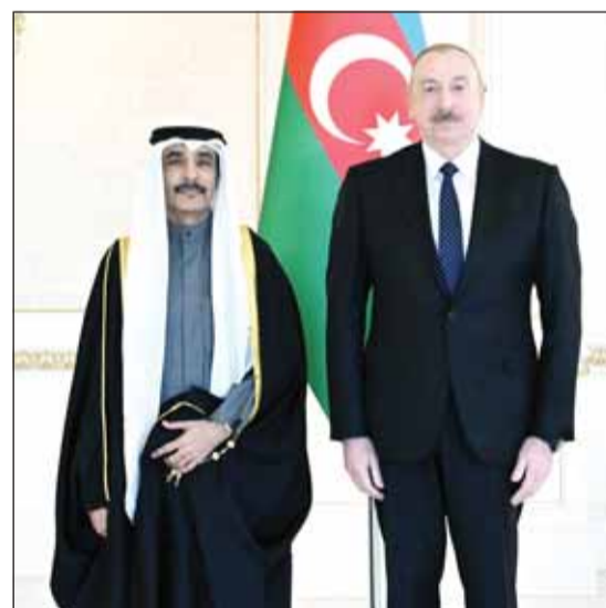
رئيس أذربيجان إلهام علييف والسفير محمد المطيري

المدججة على جدول أعمال هيئة الأمم المتحدة. كما هنا السفير المطيري الرئيس علييف بنجاح أذربيجان في استضافة القمة العالمية لتغير المناخ (كوب 29) وتنظيمها. من جانبه أشاد الرئيس علييف بحسب البيان بمستوى العلاقات السياسية بين البلدين وأصفا إياها بأنها متميزة. وأعرب عن تطلعه إلى تعزيز التعاون بين البلدين الصديقين في كل المجالات والأصعدة ثنائيا أو من خلال العمل متعدد الأطراف. كما أعرب عن تقدير جمهورية أذربيجان لمشاركة دولة الكويت في مؤتمر الأمم المتحدة لتغير المناخ ومستوى التمثيل العالي حيث ترأس الوفد الكويتي المشارك ممثل سمو أمير البلاد الشيخ مشعل الأحمد سمو ولي العهد الشيخ صباح الخالد ما يعكس حرص دولة الكويت واهتمامها بنجاح أذربيجان في تنظيم هذا المؤتمر المهم.