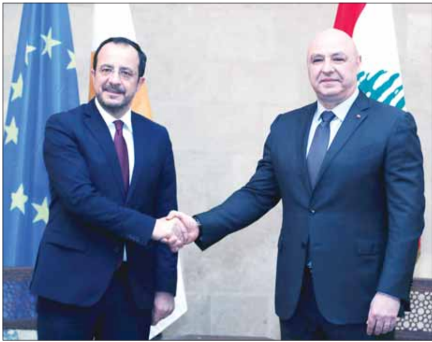
الرئيس اللبناني جوزاف عون مستقبلاً نظيره القبرصي نيكوس خريستودوليدس (أب)

على صعيد آخر، طلب الرئيس اللبناني جوزاف عون من رئيس حكومة تصريف الأعمال نجيب ميقاتي الاستمرار في تصريف الأعمال إلى حين تشكيل حكومة جديدة، معلناً أن المشاورات النيابية لتسمية الرئيس المكلف بتشكيل الحكومة الجديدة ستبدأ غدا الاثنين في القصر الجمهوري، وفقاً للدستور اللبناني في البند 2 من المادة 1/53، فيما قال ميقاتي "نحن أمام مرحلة جديدة تبدأ من جنوب لبنان وجنوب نهر الليطاني بالذات من أجل سحب السلاح وأن تكون الدولة موجودة على كل الأراضي اللبنانية ويكون الاستقرار بدءاً من الجنوب".