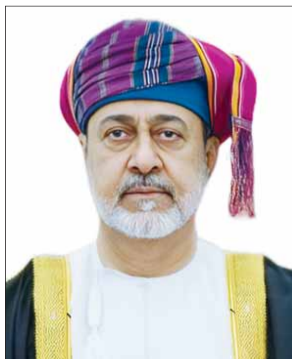
السلطان هيثم بن طارق