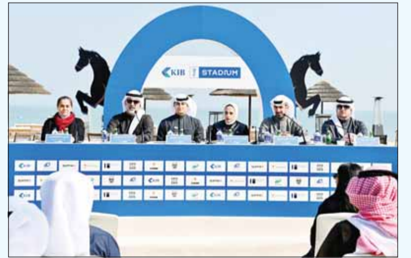
جانب من المؤتمر الصحافي

أعلن بنك الكويت الدولي (KIB) عن انطلاق فعاليات الموسم الثالث من بطولة KIB | The Stadium، في يوم الجمعة الموافق 12 يناير 2025 على شاطئ المارينا، والتي ستعظمها شركة سافكس، الشريك الاستراتيجي للبنك. وستنطلق فعاليات هذا الموسم من البطولة بمسابقة محلية لقفز الحواجز، تليها منافسات دولية من فئة نجمتين (CSI2x)، ثم الختام مع الجولة المؤهلة لكأس العالم للاتحاد الدولي للفروسية بقفز الحواجز، وهي منافسات من فئة 3 نجوم (CSI3x-W).