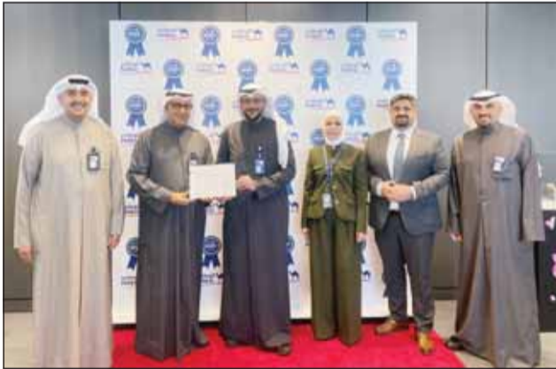
الفليجر والعثمان والعبلاني والدوسان يكرمون فائزي المصرفية الرقمية

ويبرهن البنك من خلال هذا التكريم على اهتمامه