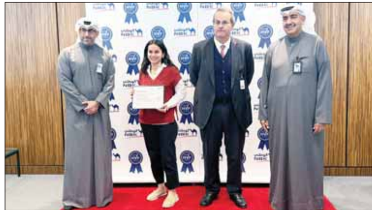
الحمد والعبلاني ومعروف يكرمون إحدى الفائزات من "الوطنية للثروات"