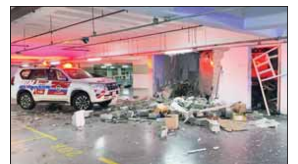
حائط الغرفة المنهار في مواقف المستشفى جراء انفجار سخان

سيطرت فرق الإطفاء ظهر أمس، على حريق اندلع بمنزل في منطقة الشعب واقتصرت أضراره على الماديات. ولققت قوة الإطفاء العام في بيان صحفي في ان بلاغا بالحريق ورد الى مركز العمليات وعلى الفور توجهت فرق الإطفاء من مركزي حولي و السالمية، الى الموقع وتمكنت من اخماد الحريق دون وقوع إصابات تذكر. وكانت "الإطفاء" ذكرت في بيان مساء اول من أمس، ان فرقة إطفاء مركز حولي تعاملت مع حادث انفجار سخان ماء (بيلر) أدى إلى انهيار حائط غرفة في مبنى لمواقف السيارات في إحدى المستشفيات الخاصة بمنطقة حولي ولم يسفر الحادث عن أي إصابات تذكر.