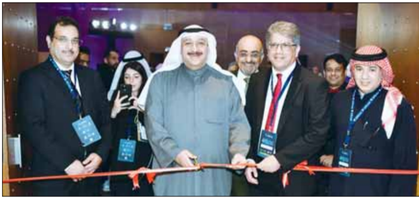
وزير الصحة د. أحمد العوضي ود. جمال محمد خلال قص شريط الافتتاح