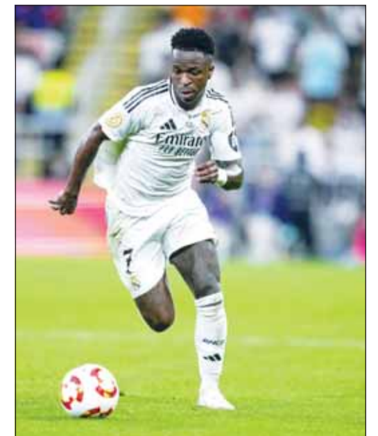
البرازيلي فينيسيوس جونيور

وساعدت تسجيلات الكاميرات داخل الملعب وشهادة أحد الشهود في التعرف على 3 من مشجعي برشلونة كمشتبه بهم في ترديد الهتافات العنصرية، أدهمهم قاصر، وستتم ملاحقته قضائيًا في إطار القضاء المختص بالقاتلين.