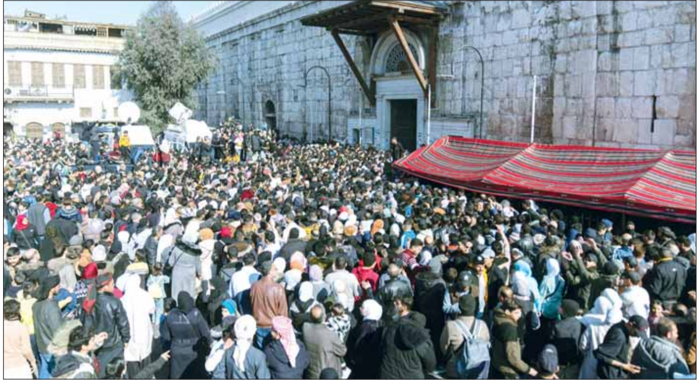
آلاف السوريين يستعدون لدخول المسجد الأموي في دمشق حيث أدم التدمير الذي حدث أثناء صلاة الجمعة لمقتل ثلاث نساء وإصابة خمسة أطفال

بمحيط للعمليات بمسافة نحو 15 كيلومترا داخل الأراضي السورية، لاحتفاظ جيش الاحتلال الإسرائيلي بوجود ضمان ألا يتمكن حلفاء النظام الجديد من إطلاق صواريخ صوب هضبة الجولان،