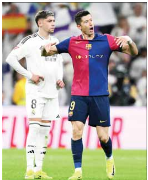
جماهير البرسا قلقة من مسوول ليفاندوفسكي

أصبح البولندي روبرت ليفاندوفسكي مهاجم برشلونة، محل شك خلال مباريات البلوغرانا الأخيرة، فبعدما كان ناقصًا تسرب القلق للجماهير بسبب إهداره الكثير من الفرص في المباريات الماضية. وتتجه الأنظار للبولندي خلال مواجهة الكلاسيكو بين برشلونة وغريمه التقليدي ريال مدريد، في نهائي كأس السوبر الإسباني، والمقرر لإقامته اليوم، على ملعب "الجوهرة" بمدينة جدة السعودية. وتلقى المهاجم البولندي سيلًا من الانتقادات دفعها جماهير برشلونة نحوه في الأسابيع الأخيرة، بسبب إهداره للفرص السهلة.