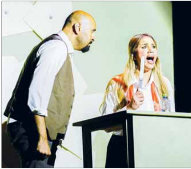
تحضير بيضة مسلوقة * الحائزة على جائزة أفضل عرض فيم النسخة الأولى

مجمعاً مستعيراً ماضياً وبادياً للفنون المسرحية المحلية والعربية والعالمية كعمر أساسي للتنمية والبناء الحضاري للإنسان. وأكملت، "ورسلنا، هي توفير منصة إبداعية للشباب في مجال المسرح، وملقى للأعمال المسرحية المبدعة بخلفيات ثقافية متنوعة تسهم في إثراء المناخ الثقافي في الكويت". وأردفت بالقول، "المهرجان يُعتبر فرصة هامة لتطوير الحركة المسرحية، وإثراء المشهد الثقافي في الكويت. نحن نسعى لتكون النسخة الثانية أكثر تأثيراً، إذ سنعتمد معايير محددة لقياس وتقييم التأثير وفقاً لأهداف المهرجان". وحول إمكانية التعاون مع المعهد العالي للفنون المسرحية، قالت، "هذا الأمر في قمة أولوياتنا، إذ نرى أن حضور طلبة المعهد العالي للمهرجان ضرورة لإثراء معرفتهم وخبرتهم. والنسخة الثانية ستتميز بالمزيد من العروض المشاركة، مع تنوع أكبر في الثقافات من آسيا وأوروبا وأميركا اللاتينية للعام المقبل، إلى جانب فعاليات وورش يومية ستقام على هامش المهرجان".