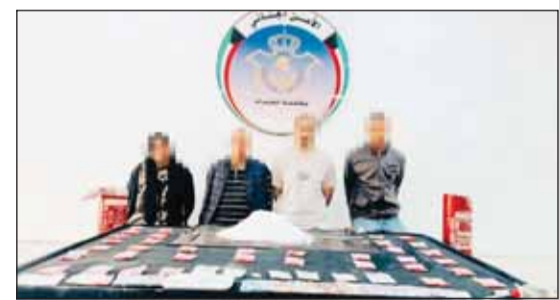
المتهمون وأمامهم المضبوطات

الذين يحاولون نشر هذه السموم، وأهابت بالجميع التعاون مع رجال الأمن والإبلاغ عن أي ظواهر سلبية على هاتف الطوارئ (112) والنظ السافن للإدارة العامة لمكافحة المخدرات (1884141). من جهته، أوضح مصدر أمني لـ "السياسة" أن مادة الشبو تعد من أخطر المواد المخدرة والاكثر فتكا بحياة المتعاطي، موضحة ان هذه المادة يتم خلطها ومجزتها وبيعها على المتعاطين وهي من المواد الخطرة جداً.