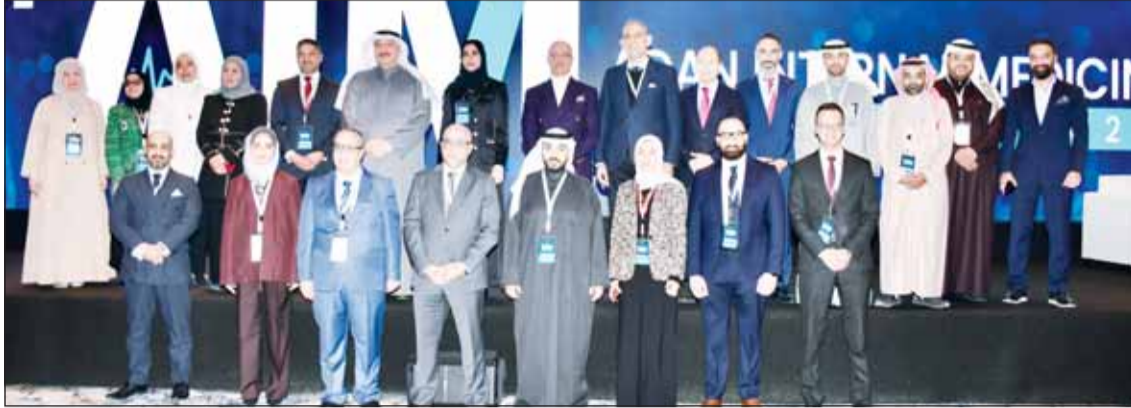
وزير الصحة د. أحمد العوضي ود. خليل الشويكر مع عدد من المشاركين في المؤتمر

ولفت إلى إعداد بروتوكول خاص للوقاية من الجلطات الوريدية، مما يعكس حرص القسم على مواكبة التوصيات العالمية، مؤكداً أن هذه الجهود تعكس التزام الوزارة بتوفير رعاية متكاملة وشاملة للمرضى.