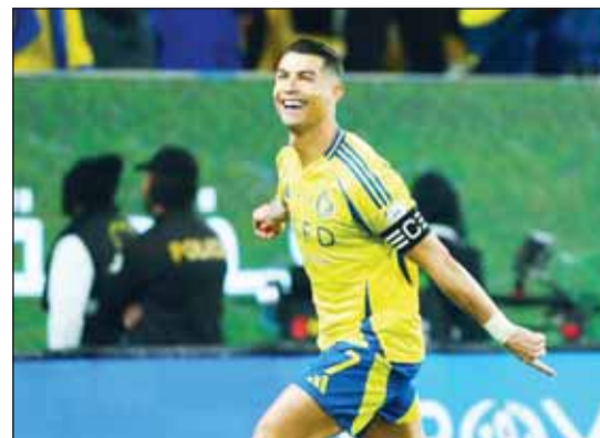
الدون الأعله أجراً فقه العالم

النجم الأرجنتيني ليونيل ميسي قائد إنتر مجاهي الأمريكي يراتب 124 مليون يورو سنوياً. فيها يتواجد "راقص السامبا" الاجتماعي، بعد أن أطلق قناة على اليوتيوب حطمت الرقم القياسي لأسرع قناة تصل إلى مليون مشترك. وفي المركز الثاني، يتواجد