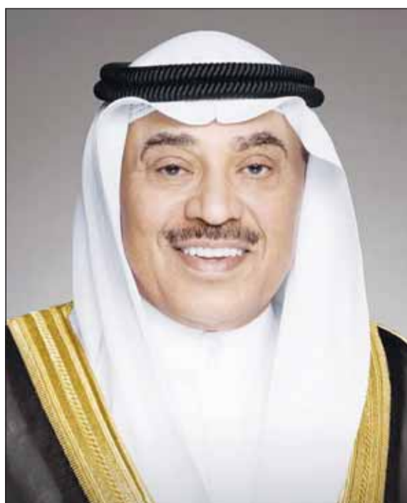
سمو ولي العهد الشيخ صباح الخالد