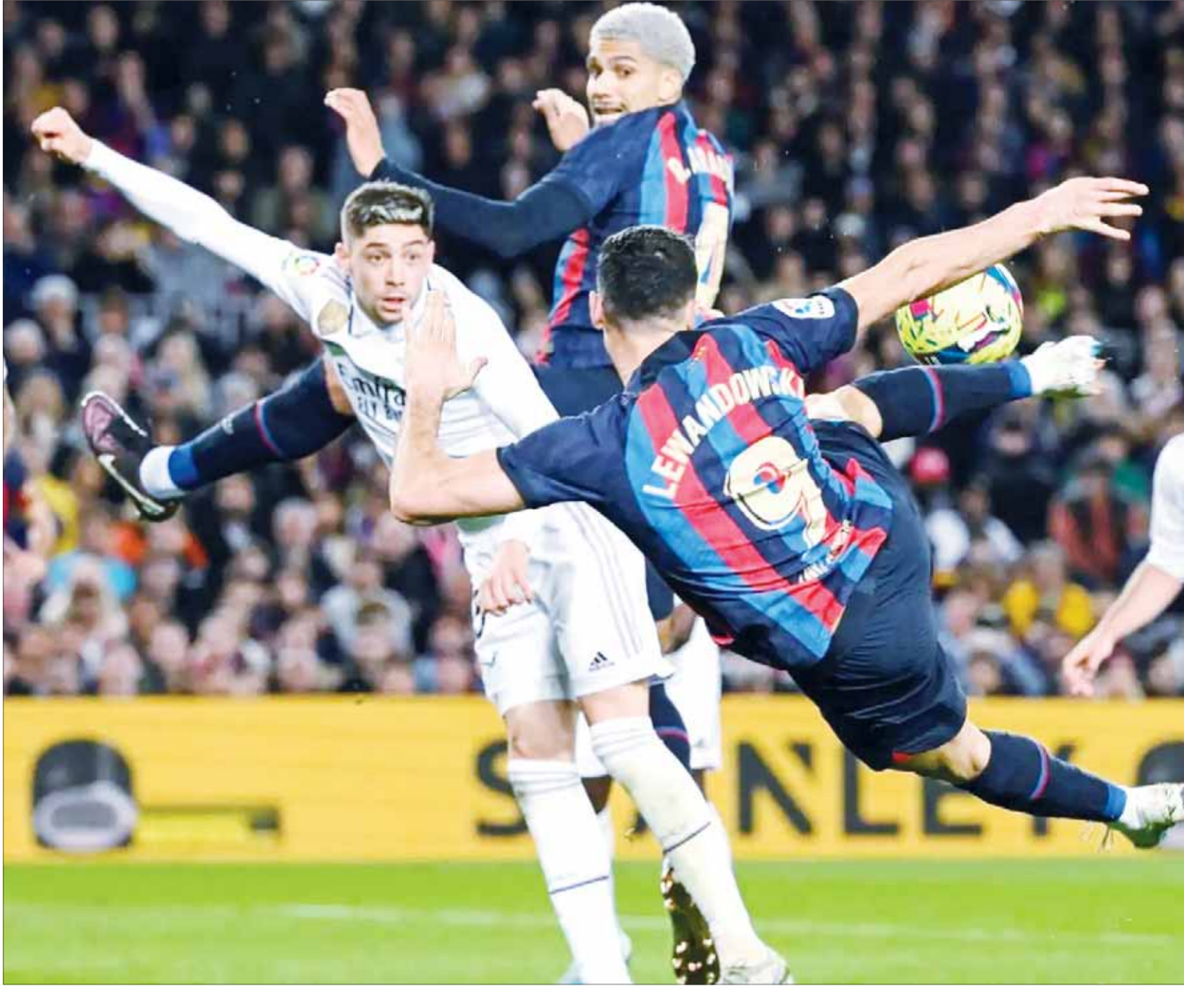
قمة السوبر بين الميرينغي والبلوغرانا

يتجدد العهد مع الكلاسيكو الإسباني هذا الموسم، لكن هذه المرة في الأراضي السعودية التي ستعتمد مباراة برشلونة وريال مدريد اليوم في نهائي كأس السوبر الإسباني على ملعب "الجوهرة" في مدينة الملك عبدالله الرياضية بجدة.