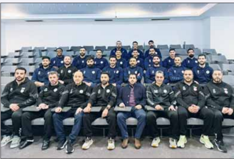
شهد الناصر وقائد العديان مع وفد أزرق اليد