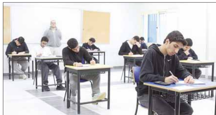
طلبة الثاني عشر يواصلون اختباراتهم

والميدان التربوي بدعم من منطقة حولي التعليمية ممثلة بمراقبة التعليم الثانوي ومرصمهم على جد واجتهاد الطلبة والمثابرة واستثمار كافة الأوقات المتاحة لهم لتحقيق غايتهم وتطلعاتهم العلمية بالمستقبل.