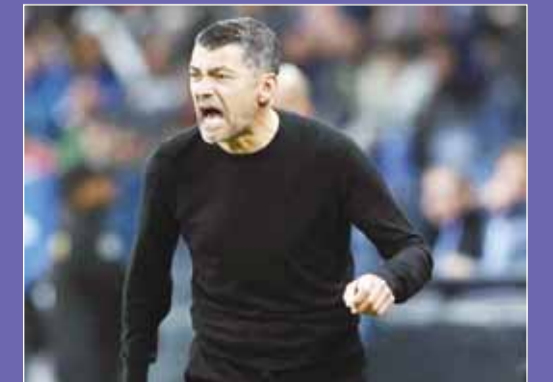
سيرجيو كونسيساو مدرب ميلان

شهدت مباريات الأسبوع 20 من الدوري الإيطالي والتي أقيمت أول من أمس، العديد من التعادلات، حيث تعادل ميلان وكالياري بهدف لكل منها، وبنات النتيجة تعادل تورينو مع يوفنتوس، فيما تعادل أودينيزي وإتالاندا دون أهداف فيما فاز ليتشي على إيمبولي 3-1. من جانبه، طالب سيرجيو كونسيساو مدرب ميلان مهاجميه بأن يكونوا أكثر انانية أمام المرمرى بعدما توقفت سلسلة انتصاراته منذ توليه المسؤولية عند مباراتين بعد التعادل المخيب للإمال 1-1 أمام ضيفه كالياري المتواضع.