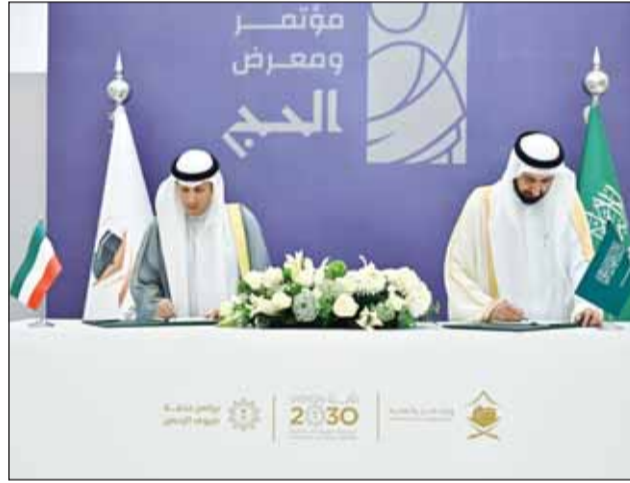
الوزيران د.الوسمي ود.الربيعية يوقعان الاتفاقية