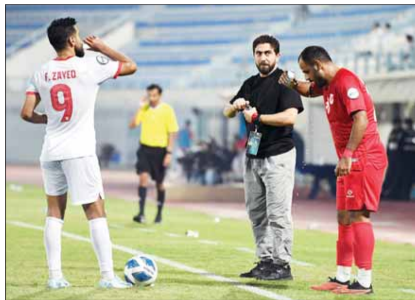
الكويت يتطلع لاستعادة طريق الفوز عبر الفحيحيل

رابع الترتيب برصيد 17 نقطة، إلى "ضرب أكثر من عصفور بحجر واحد" في لقاء اليوم، حيث يرغب في استغلال ظروف خصمه، ورد اعتباره من "الأبيض" بعد أن هزّمه في القسم الأول، والمضي قدماً في إصرار مركز مقدم، كما أن الفوز الليلة يمنحه تبوّؤ المركز الثالث، على أمل تعثر القادسية (19 نقطة) أمام اليرموك غداً.