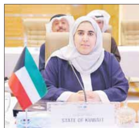
وكيلة وزارة المالية أسيل المنيفي خلال الملتقى

2- أهمية تحديث البنية التحتية وتطوير الكوادر البشرية التي تساهم في رفع الكفاءة المؤسسية، وتحسين الكفاءة التشغيلية وتعزيز الحوكمة المؤسسية. 3- زيادة القيمة المضافة على مشاريع البنك من خلال تطوير منتجات مبتكرة وتسريع عمليات الموافقة وخفض تكاليف التمويل وزيادة المرونة في