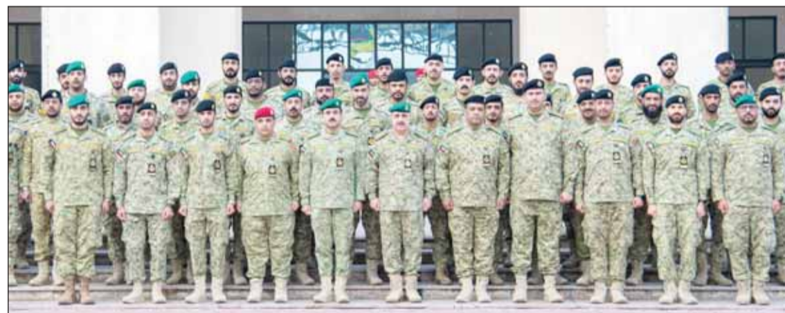
الفريق الركن هاشم الرفاعي متوسلاً منتسبي الحرس المشاركين في "خليجي 26"

كرم وكيل الحرس الوطني الفريق الركن هاشم الرفاعي، منتسبي الحرس الوطني المشاركين في تنظيم بطولة كأس الخليج العربي (خليجي زين 26) التي استضافتها الكويت مؤخراً تقديراً لجهودهم التي أسهمت في نجاح تنظيم البطولة وظهورهم بصورة مشرفة تليق برجال الحرس. ونقل الفريق الرفاعي إلى المكرمين إشادة وتقدير قيادة الحرس الوطني ممثلة في الشيخ مبارك الحمد ورئيس الحرس الوطني والشيخ فيصل الخواف نائب رئيس الحرس لما قاموا به من جهود كبيرة خلال البطولة تالت إشادة المسؤولين والجمهور. وشكر وكيل الحرس الوطني المنتسبين، ودعاهم إلى الاستعداد الدائم وتنمية الخبرات التي اكتسبوها من العمل الميداني لمد يد العون إلى أجهزة الدولة والمشاركة في إنجاز الفعاليات الكبرى التي تستضيفها البلاد. حضر التكريم معاون الإسناد الإداري اللواء مهندس عصام نايف عصام.