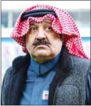
الشيخ أحمد اليوسف

وأعلن عن توجه لتشييد أكثر من ستاد جديد في مدينتي جابر الأحمّد وصباح الأحمّد، ولن تقل سعة كل ملعب عن 42 ألف متفرج، كاشفاً عن موعد افتتاح ستاد الفحيحيل في أبريل المقبل. وتابع اليوسف "سيتم ترميم جميع الستادات والملاعب، وتجهيز متكامل للمرافق الرياضية". على صعيد ذي صلة، قال اليوسف إن "الاتحاد يبذل جهوداً حثيثة، ويسعى إلى تجهيز الأزرق بشكل مميز ولافت قبل استئناف تصفيات كأس العالم 2026، وذلك من أجل التأهل إلى النهائيات"، موضحاً أن الهدف يكمن في تبوؤ أحد المركزين الثالث أو الرابع. وتابع "سيتم تطعيم الأزرق بشكل تدريجي بعناصر شابة، واستبعاد لاعبين من أصحاب الأعمار السنية الكبيرة". في سياق متصل، كشف اليوسف عن نادٍ تابع لشركة فاصّة سيارشرك