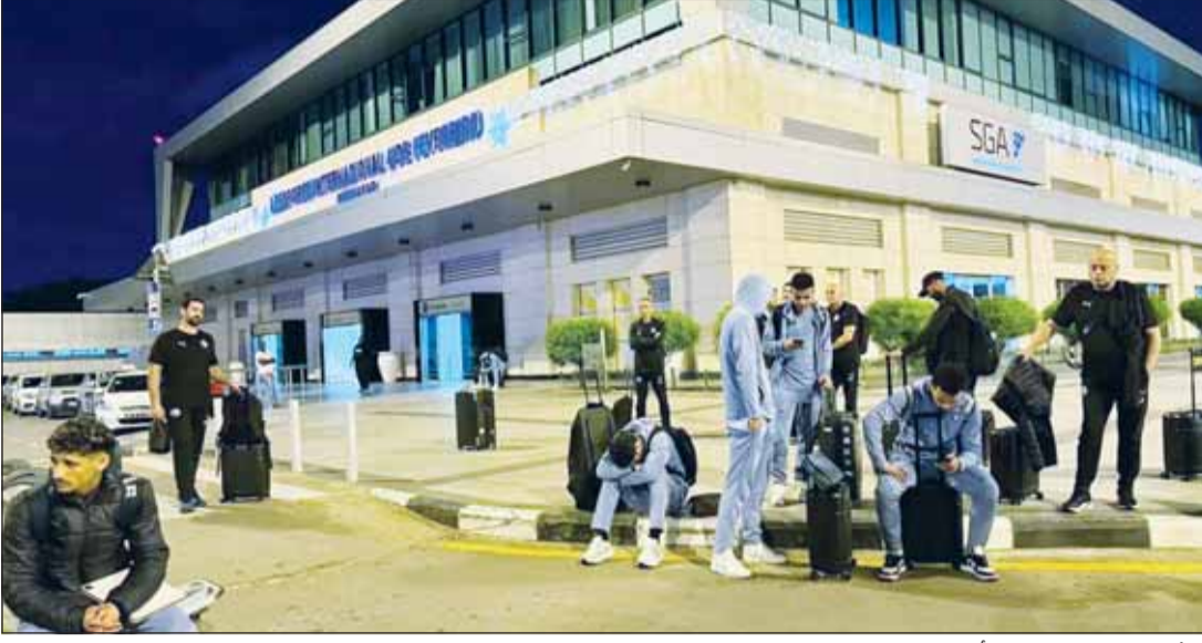
بعثة نادي بيراميدز بعد الأزمة الجوية التي تعرضوا لها

العاصمة الأنغولية لواندا بعد عودتها الاضطرارية، عقب سفر الطائرة الخاصة لنحو ساعتين قبل أن تتعرض الطائرة لمطبات جوية عنيفة، وهبط الضغط الجوي في الكابينة، ما أدى إلى تعرض بعض أفراد البعثة للإغماء". وتابع، "اضطرت الطائرة للعودة مرة أخرى إلى لواندا في أنغولا بسبب التعطلات الجوية والضغط القوي والمطبات الهوائية، ونجت البعثة من الموت، وذلك للاطمئنان على الطائرة وعلاج أفراد البعثة المصابين". وقدم البيان، "فشلت جميع محاولات سفر البعثة من أنغولا في ظل حاجة الطائرة للفحوصات ولحين استقرار الأمور الجوية، ما دفع البعثة للعودة مجدداً إلى فندق الإقامة في لواندا للمبيت إلى حين تحديد موعد آخر لرحلة العودة إلى القاهرة".