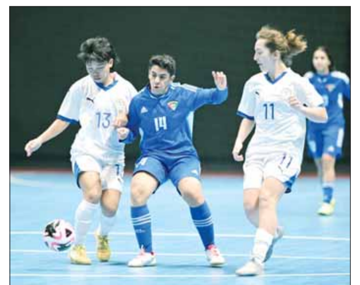
من لقاء الأزرق والفلبين

ومن المقرر أن يلتقي أزرق السيدات مع منتخب استراليا في الساعة الرابعة عصر اليوم ضمن الجولة الثانية. ومققت المنتخبات العربية للسيدات نتائج متعثرة في اليوم الافتتاحي، ففي المجموعة الأولى التي تقام منافساتها بمدينة نونتاهاوري التايلاندية، انتهت المواجهات العربية المباشرة بالتعادل 1-1 بين البحرين ولبنان، وبدأت النتيجة انتهت مباراة العراق ضد فلسطين. وتختتم منافسات التصفيات في 19 يناير الجاري، بتأهل 9 منتخبات إلى النهائيات، حيث يتأهل بطل البطولة والوصيف والثالث إلى النسخة الأولى من كأس العالم لكرة قدم الصالات للسيدات 2025 التي ستعقدتها الفلبين.