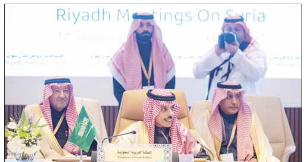
وزير الخارجية السعودي الأمير فيصل بن فرحان مترشاً الاجتماع الوزاري بشأن سورية في الرياض أمس

الرياض، دمشق، عواصم - وكالات، في خطوة من شأنها تعزيز الدعم العربي والدولي للشعب السوري بعد سقوط نظام الرئيس السابق بشار الأسد، أكدت رئاسة اجتماعات الرياض بشأن سورية، بحث ضغوط دعم الشعب السوري وتقديم كل العون والإسناد له في هذه المرحلة المهمة من تاريخه، ومساعدته في إعادة بناء سورية دولة عربية موحدة، مستقلة آمنة لكل مواطنيها، لا مكان فيها للإرهاب، ولا فرق لسيادتها أو اعتداء على وحدة أراضيها من أي جهة كانت.