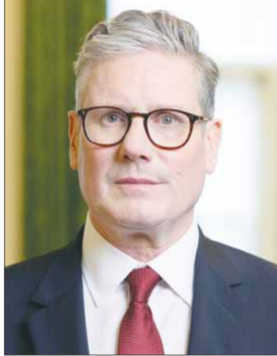
رئيس وزراء بريطانيا كير ستارمير

استقبل سمو أمير البلاد الشيخ مشعل الأحمد بقصر السيف أمس، سمو ولي العهد الشيخ صباح الخالد، كما استقبل سموه، سمو رئيس مجلس الوزراء الشيخ أحمد العبدالله، واستقبل سموه النائب الأول لرئيس مجلس الوزراء ووزير الدفاع وزير الداخلية الشيخ فهد اليوسف. من جهة أخرى، تلقى سمو أمير البلاد اتصالاً هاتفياً ظهر لبريطانيا العظمى وإيرلندا الشمالية الصديقة جرى خلاله استعراض العلاقات الثنائية الوطيدة والمتميزة بين دولة الكويت والمملكة المتحدة والتطلع المشترك على تعزيزها والارتقاء بها، متمنياً لسموه وأقر الصحة وتمام العافية ولدولة الكويت المزيد من التقدم والنمو والرفاء في ظل القيادة الحكيمة لسموه. وقد أعرب سمو أمير البلاد عن خالص شكره وتقديره على هذا التواصل الذي يجسد عمق العلاقات المتينة والراسخة بين البلدين والشعبين الصديقين، مؤكداً سموه على التطلع الدائم والمشارك لتعزيز أواصر هذه العلاقات التاريخية والارتقاء بأطر التعاون بينهما في مختلف المجالات وعلى كافة الأصعدة إلى أفق أرحب، متمنياً لسموه له موفقور الصحة والعافية وللمملكة المتحدة وشعبها الصديق كل الازدهار والرفق وللعلاقات الراسخة بين البلدين الصديقين المزيد من التطور والنماء.