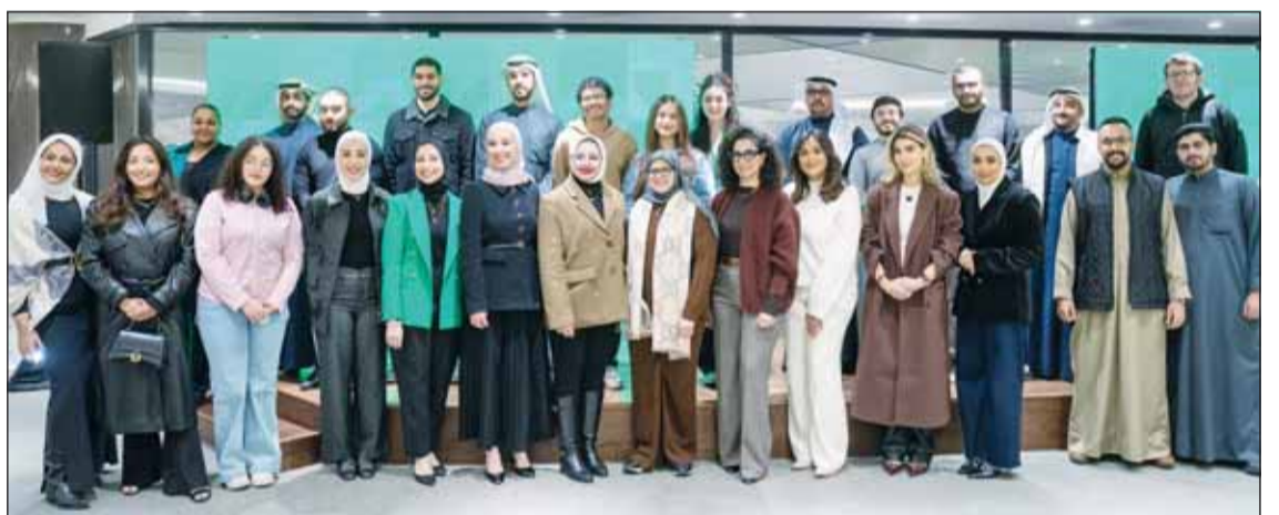
المشاركون في البرنامج

استمراراً في دعمها للطلبة والمبتدئين والمبتكرين، أعلنت زين عن كونها الشريك البلاتيني لمعرض التصميم الهندسي الـ 47 الذي نظمته كلية الهندسة والبتترول بجامعة الكويت بدعم من مؤسسة الكويت للتقدم العلمي في مدينة صباح السالم الجامعية - الشادية تحت رعاية وزير التعليم العالي والبحث العلمي د. نادر الجلال.