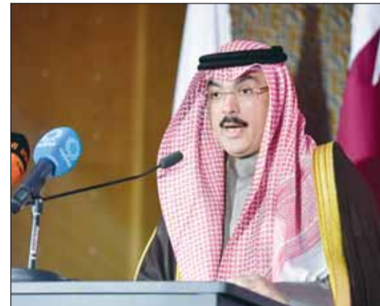
وزير التربية يلقي كلمة الافتتاح