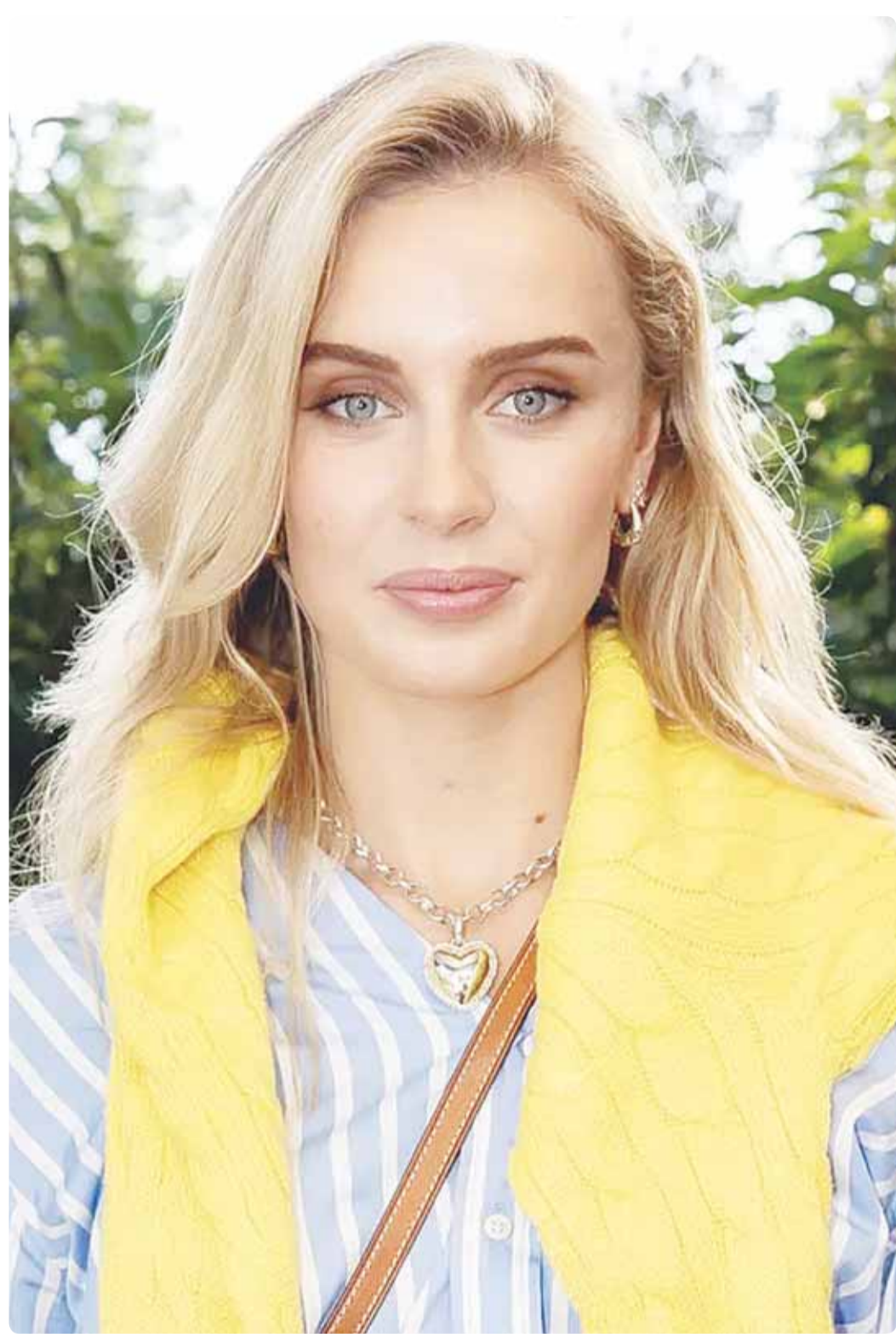
النجمة الكندية ميغ كاسبي خلال حضورها حفل "رالف لورين" في ميلبورن

نشقق على تلاميذ التعليم العام ومستقبلهم من انحرافات تعليمية، وقناعات غير تربوية من نافذة مناهج موجهة لأغراض دينية، وربما معدة بغرض تهميش المرأة، والتعمير ضدها، وتنشئة التلاميذ على مفاهيم ونصوص، وبيئة دراسية غير صحية، اجتماعياً، وقانونياً، ومدنياً، ودينياً. أتمنى أن تتلقت الجمعية الثقافية الاجتماعية النسائية فرصة التصدي لهذه العبث والتعريض ضد المرأة، من وزارة التربية، والتعليم العام تحديداً.