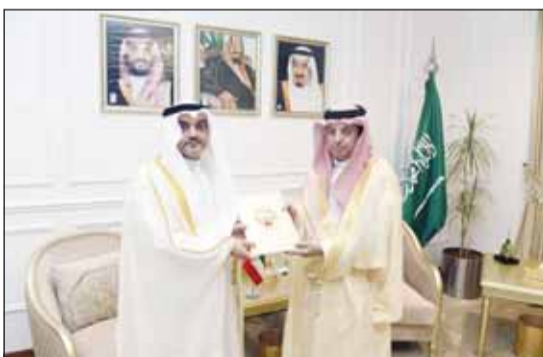
القنصل يوسف التنيب يقدم أوراق اعتماده

جدة - كونا، قدم القنصل العام لدولة الكويت لدى المملكة العربية السعودية يوسف التنيب أمس، أوراق اعتماده رسمياً لمدير فرع وزارة الخارجية السعودية بمنطقة مكة المكرمة فريد الشهري قنصلاً عاماً لدولة الكويت لدى جدة. وأكد التنيب في تصريح له "كونا" عقب تقديم أوراق اعتماده أهمية العلاقات الثنائية التي تجاوزت أبعاد العلاقات الرسمية بين الدول إلى مفهوم الأخوة والمصاهرة مشيراً إلى التعاون الوثيق الذي رسخته قيادات البلدين عبر الزمن ورويتهما الواعدة. وأشاد بمستوى العلاقات الثنائية التاريخية المشتركة ما بين الكويت والسعودية على المستويات والأصعدة كافة، معرباً عن تمنياته للمملكة قيادة وشعباً المزيد من التطور والازدهار، لافتاً إلى أن الجانبين بحثا سبل تطوير العلاقات الثنائية المتميزة.