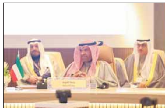
وزير الخارجية عبدالله اليحيا يترأس الوفد الكويتي خلال الاجتماع

الرياض - كونا، ترأس وزير الخارجية عبدالله اليحيا وفد دولة الكويت المشارك في أعمال اجتماع الرياض بشأن سورية والذي استضافته المملكة العربية السعودية أمس. وقالت وزارة الخارجية في بيان إن الاجتماع عقد بمشاركة عدد من وزراء خارجية الدول العربية والغربية وممثلي المنظمات الدولية لبحث التطورات التي شهدتها سورية وتوحيد المواقف لدعم وتحسين الظروف المعيشية والإنسانية للشعب السوري. وأفادت بأن الاجتماع بحث أيضاً تقديم الدعم الإغاثي والتنموي لتلبية احتياجات الشعب السوري الأساسية وتسهيل عودة المهجرين واللاجئين إلى ديارهم ودعم عودة الاستقرار السياسي والأمني والتعافي الاقتصادي ووضع الخطوات اللازمة لتحقيق ذلك كما تم مناقشة السبل الكفيلة بنمو ضمان سيادة سورية ووحدتها أراضيها.