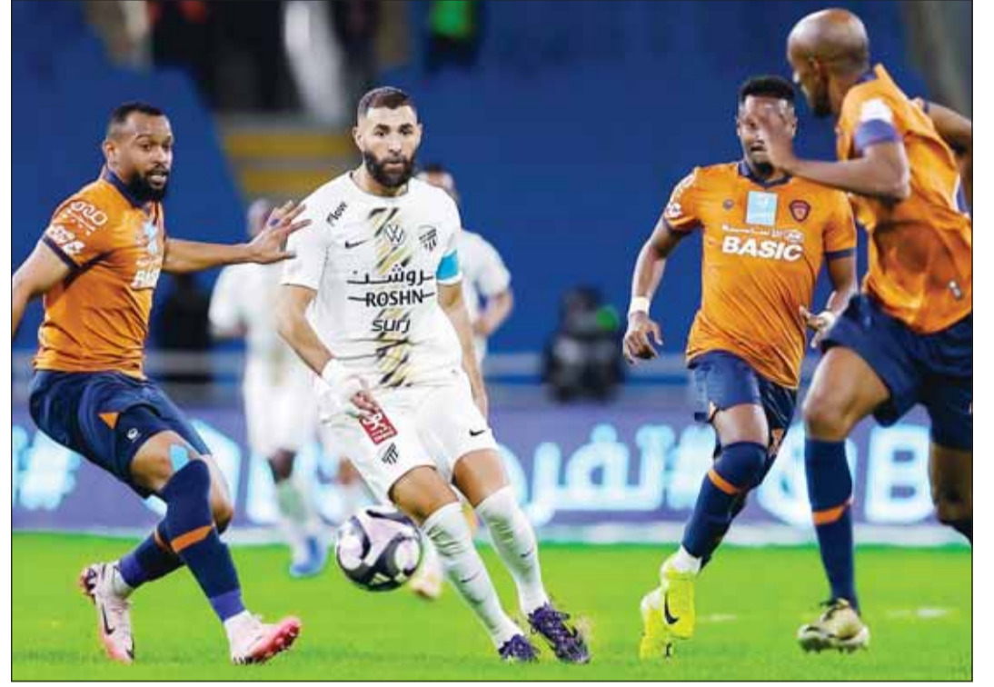
بنزيمًا خلال مباراة الفيحاء

قدم الاتحاد الإندونيسي لكرة القدم أمس الهولندي باتريك كلويفرت مدرباً جديداً لمنتخب بلاده إلى الجماهير. وأعلن اتحاد الكرة الإندونيسي الأرياء الماضي تعيين كلويفرت مدرباً للمنتخب الأول، بعد يومين من إقالة المدرب الكوري الجنوبي شين تاي بانغ. ووقع كلويفرت نجم أياكس أمستردام سابقاً، عقداً لتدريب إندونيسيا بين عامي 2025 و2027 مع إمكانية التمديد. وقال كلويفرت "هدفي الأول في أول عامين هو التأهل لكأس العالم، وحصد أربع نقاط من المباراتين التاليتين، فريقي وأنا ملتزمون للغاية لتحقيق هذا الهدف". ومع تبقي أربع مباريات على نهاية الدور الثالث من تصفيات آسيا المؤهلة لكأس العالم 2026، يحتل منتخب إندونيسيا المركز الثالث في مجموعته التي تضم ستة فرق، بفارق نقطة واحدة فقط خلف منتخب أستراليا صاحب المركز الثاني، ويتأهل أصحاب المركزين الأول والثاني مباشرة إلى البطولة، فيما يتأهل أصحاب المركزين الثالث والرابع إلى مرحلة الملحق في التصفيات الآسيوية. ويرى إريك توهير، رئيس الاتحاد الإندونيسي، أن كلويفرت سيكون مناسباً لهذا الفريق أكثر من شين الذي لا يتحدث سوى باللغة الكورية الجنوبية، بحيث يكون قادراً على التعامل مع اللاعبين.