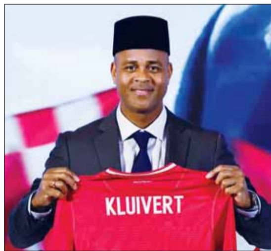
كلويفرت بالزي الوطني اندونيسي أمس

قدم الاتحاد الإندونيسي لكرة القدم أمس الهولندي باتريك كلويفرت مدرباً جديداً لمنتخب بلاده إلى الجماهير. وأعلن اتحاد الكرة الإندونيسي الأرياء الماضي تعيين كلويفرت مدرباً للمنتخب الأول، بعد يومين من إقالة المدرب الكوري الجنوبي شين تاي بانغ. ووقع كلويفرت نجم أياكس أمستردام سابقاً، عقداً لتدريب إندونيسيا بين عامي 2025 و2027 مع إمكانية التمديد. وقال كلويفرت "هدفي الأول في أول عامين هو التأهل لكأس العالم، وحصد أربع نقاط من المباراتين التاليتين، فريقي وأنا ملتزمون للغاية لتحقيق هذا الهدف". ومع تبقي أربع مباريات على نهاية الدور الثالث من تصفيات آسيا المؤهلة لكأس العالم 2026، يحتل منتخب إندونيسيا المركز الثالث في مجموعته التي تضم ستة فرق، بفارق نقطة واحدة فقط خلف منتخب أستراليا صاحب المركز الثاني، ويتأهل أصحاب المركزين الأول والثاني مباشرة إلى البطولة، فيما يتأهل أصحاب المركزين الثالث والرابع إلى مرحلة الملحق في التصفيات الآسيوية. ويرى إريك توهير، رئيس الاتحاد الإندونيسي، أن كلويفرت سيكون مناسباً لهذا الفريق أكثر من شين الذي لا يتحدث سوى باللغة الكورية الجنوبية، بحيث يكون قادراً على التعامل مع اللاعبين.