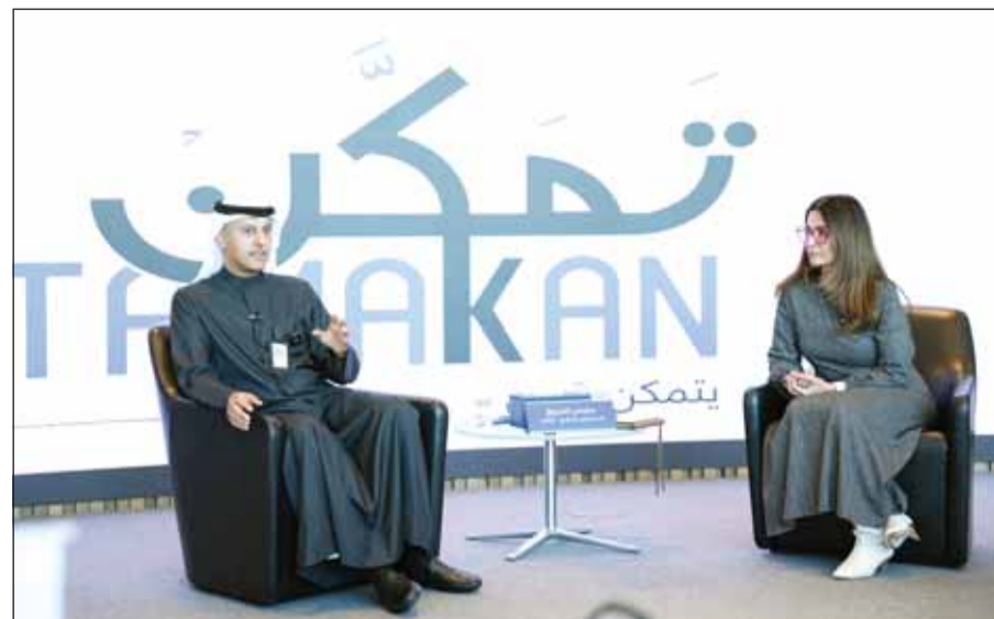
المرزوق خلال الجلسة النقاشية