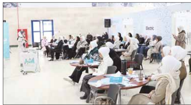
جانب من ورش العمل لبرنامج "متمكن"

أطلقت الهيئة العامة للشباب أمس، برنامج "متمكن" الهادف لإعداد قيادات تطوعية مجتمعية من الشباب اللواتي تتراوح أعمارهم بين 18 و26 عاماً وذلك بالشراكة مع وزارة الأوقاف والشؤون الإسلامية.