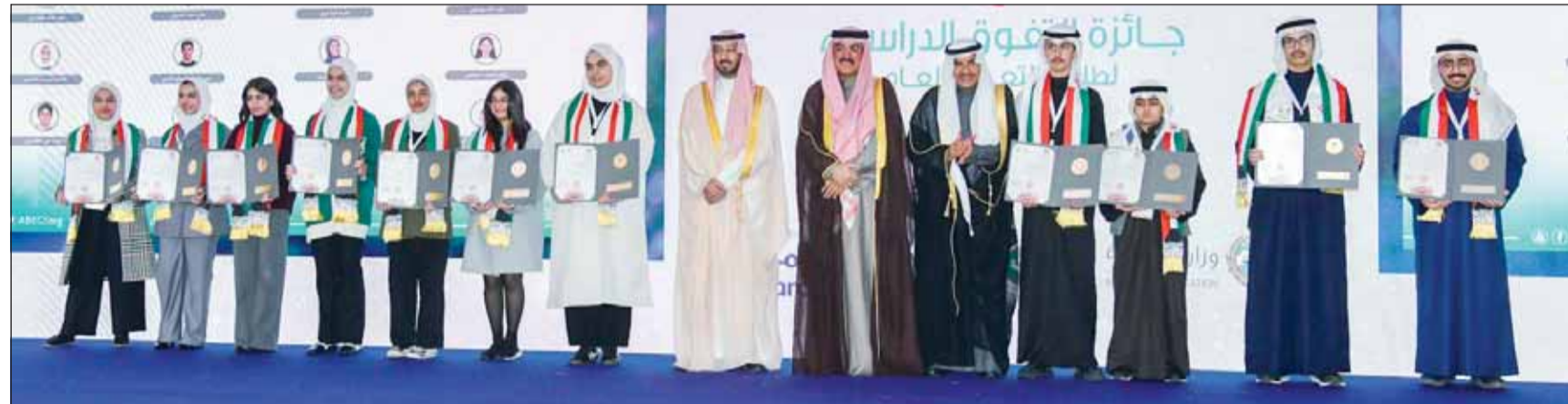
وزير التربية سيد جلال الطبطبائي مع طلبة الكويت المتفوقين

إقامة المزيد من المشاريع المشتركة لبناء جيل قادر على مواجهة التحديات المستقبلية