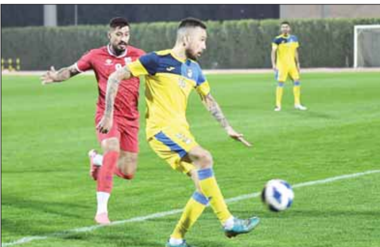
الساحل يتصدر دوري الأولى

تصدر الساحل دوري الدرجة الأولى برصيد أربع نقاط، بعد أن تعادل مع الشباب 1-1 أول من أمس في الجولة الثانية من البطولة، فيما حقق "أبناء الأحمدي" أول نقطة له في المسابقة، محتلًا المركز الرابع. وفي لقاء آخر، حقق برقان أول ثلاث نقاط في المسابقة، في أول ظهور له ليرتقي للمركز الثاني، بعد أن هزم الصليبيات بهدفين دون رد، وظل الأخير بالمركز الخامس والأخير دون أي نقطة. وغاب الجهور (3 نقاط) عن هذه الجولة.