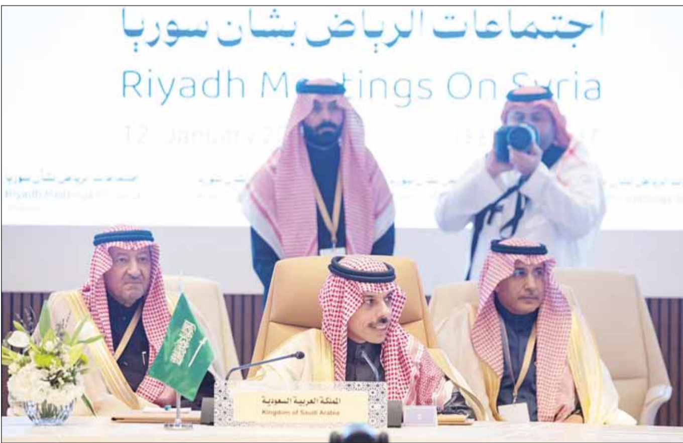
وزير الخارجية السعودي الأمير فيصل بن فرحان مترشسا الاجتماع الوزاري بشأن سورية في الرياض أمس

وانقسمت قمة الرياض إلى قسمين، الأول شارك فيه الوزراء العرب، بينما حضر القسم الثاني المسؤولون الغربيون.