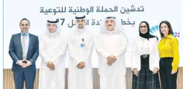
تدشين الحملة الوطنية للتوعية بخطورة 7