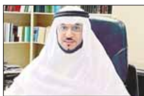
د. عادل الزامل

صدر أمس مرسوم أميري بتعيين الدكتور عادل محمد عبدالله الزامل وكيلاً لوزارة الكهرباء والماء والطاقة المتجددة. وجاء في المرسوم، بعد الإطلاع على الدستور، وعلى الأمر الأميري الصادر بتاريخ 2 من القعدة 1445 هـ الموافق 10 مايو 2024 م، وعلى المرسوم بالقانون التتمة 06