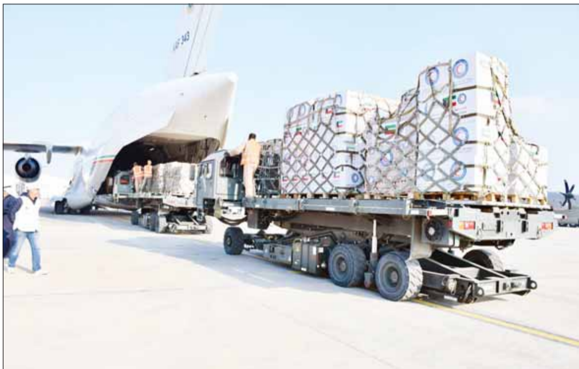
تحميل المساعدات على متن الطائرة الإغاثية الثانية

الموافقة على إمكانية تقديم الجهات الكويتية مساعدات لسورية براً أو جواً | السند: المبادرة تجسد الدور الإنساني الرائد للكويت في دعم الأشقاء