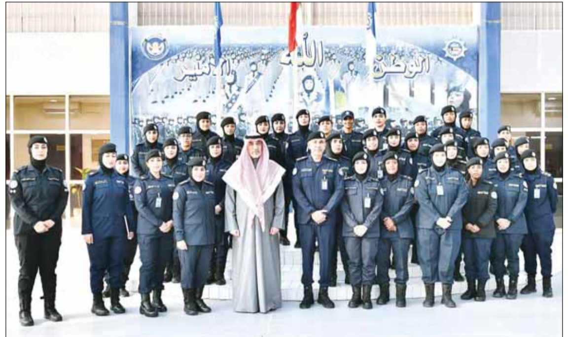
النائب الأول الوزير الشيخ فهد اليوسف مع قيادات ومنسوبات الشرطة النسائية