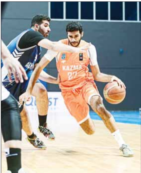
البرتغالي هزم اليرموك

يفخض فريق القادسية الاول لكرة السلة، مباراة مهمة في السادسة من مساء اليوم مع مستضيفه الاتحاد السعودي في مدينة جدة، ضمن القسم الثاني لمنافسات المجموعة الأولى في بطولة دوري غرب آسيا لمنطقة الخليج، كما يلعب اليوم في المجموعة ذاتها العربي القطري مع ضيفه المنامة البحريني.