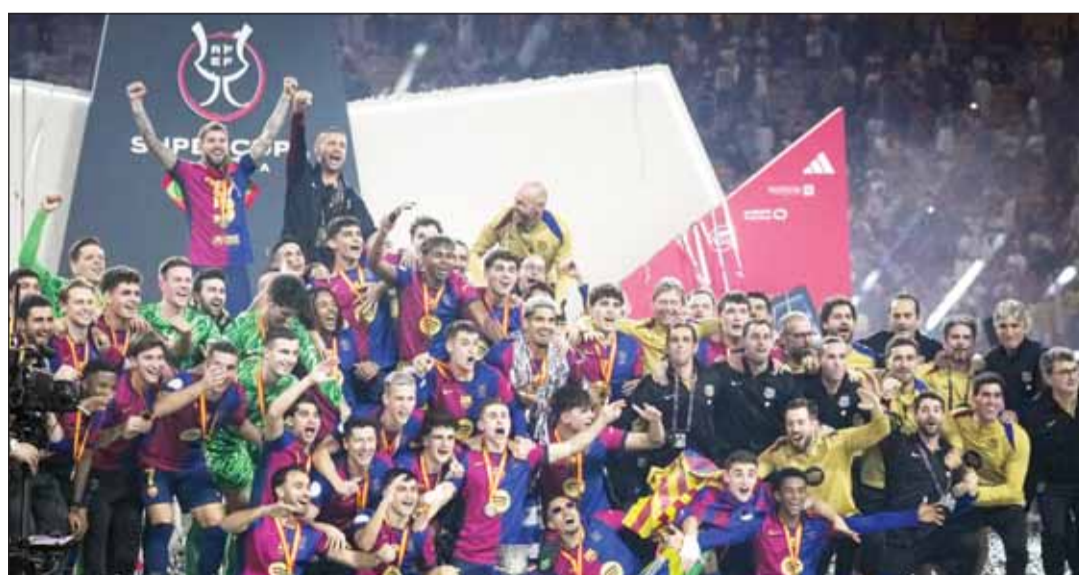
تتويج برشلونة باللقب الخامس عشر للسوبر الإسباني