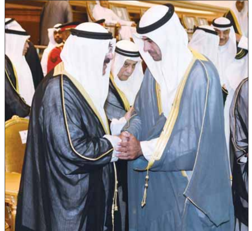
صاحب السمو أمير البلاد ويدر الخرافي خلال نهاره الكأس العالية

إحدى فعاليات البطولة التي هدفت للاستثمار بقرات ومهارات الفتيات الرقمية. ووقعت زين مذكرة تفاهم مع مؤسسة الكويت للتقدم العلمي بهدف تدشين برامج تدريبية لإعداد وتمكين الكوادر الوطنية من فئة الشباب، بالإضافة إلى مذكرة تفاهم مع المجلس الوطني للثقافة والفنون والآداب لإطلاق شراكة استراتيجية لقيادة تطوير الاقتصاد الإبداعي في دولة الكويت، إلى جانب مذكرة تفاهم مع جامعة الكويت بهدف المساهمة في تنمية اقتصاد المعرفة في البلاد.