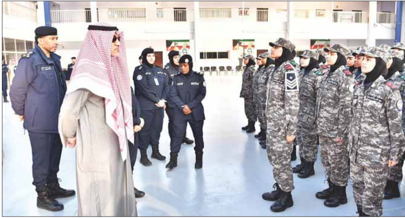
النائب الأول الشيخ فهد اليوسف خلال زيارته التفقدية إلى معهد الشرطة النسائية

أكد النائب الأول لرئيس مجلس الوزراء وزير الدفاع وزير الداخلية الشيخ فهد اليوسف أن المرأة الكويتية في السلك العسكري أثبتت قدرتها وجدارتها من خلال تحمل المسؤوليات العسكرية بكفاءة وإتقان في المجالات الميدانية أو الإدارية أو التقنية. وشدد في تصريح له عقب زيارة تفقدية لمعهد الشرطة النسائية، أمس، على ضرورة تطوير بيئة التعليم والتدريب في المؤسسة الأمنية بما يواكب التطورات التكنولوجية والرقمية للمساهمة في تعزيز مشاركتهم الفعالة في دعم الأمن الوطني وخدمة قضايا العمل الأمني، منوها بدور المرأة الكويتية المهم في مختلف قطاعات المؤسسة الأمنية.