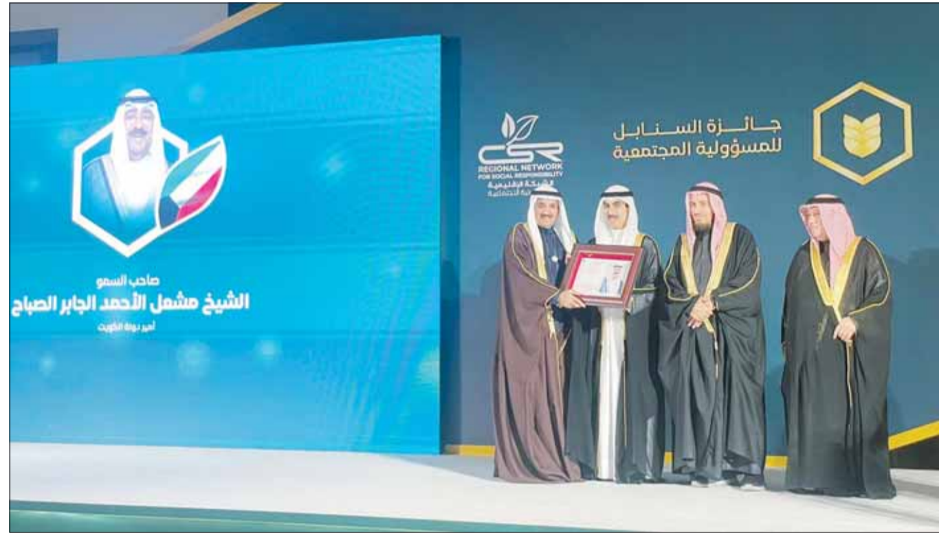
السفير الشيخ ثامر الجابر يتسلم جائزة سمو أمير البلاد

وتسلم الجائزة في نسختها الثالثة سفير دولة الكويت لدى مملكة البحرين الشيخ ثامر جابر الأحمد الصباح في حفل أقيم برعاية فخرية من ممثل الملك للأعمال الإنسانية وشؤون الشباب رئيس مجلس أمناء المؤسسة الملكية للأعمال الإنسانية الشيخ ناصر بن حمد آل خليفة وبإشراف الرئيس الفخري لجمعية "السنابل" لرعاية الأيتام الشيخ سلمان بن عبدالله بن