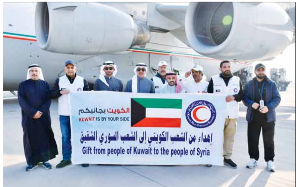
ممثلو الجهات الحكومية المشاركة في الجسر الجوي الكويتي لمساعدة الشعب السوري