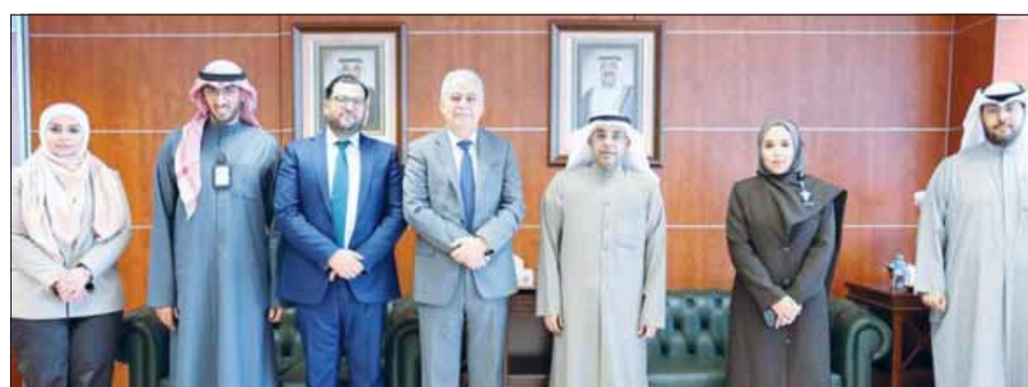
السفير المغربي في الهيئة العامة للقوى العاملة

وعلى البلدان المرسل لها كما تم خلال اللقاء بحث مجموعة من القضايا التي تخص العمالة المغربية في البلاد. وأضافت أن العتيبي أكد سعي الهيئة دائماً للقيام بدورها على الوجه الأكمل من خلال ممارسة الصلاحيات التي منحها لها القانون سعياً لتنظيم سوق العمل وتوفير الحماية القانونية لجميع العمالة الوطنية والعمالة الوافدة بمختلف جنسياتها. ونقلت "الهيئة" عن السفير المغربي إشاداته بالدعم الذي تتلقاه سفارة بلاده من قبل دولة الكويت، وشكره لتفاعل "الهيئة" واستجابتها لكل الأمور المتعلقة بشؤون العمالة المغربية.