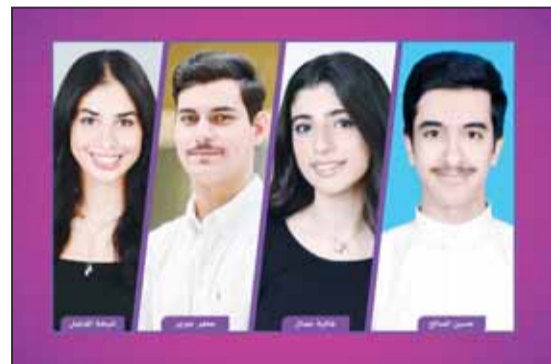
الكويتيون المشاركون في المعرض