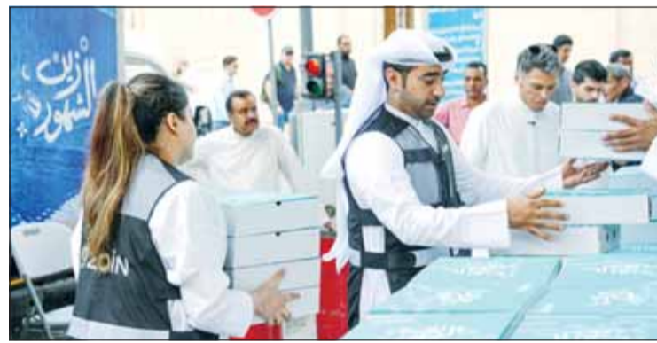
حملة زين الشهور جددت روح العطاء في الشهر الفضيل