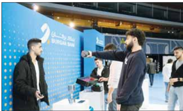
جناب البنك في الملحق

العديد من الأنشطة التفاعلية، بما في ذلك لعبة "Spin the Wheel" التي منحت الزوار فرصة للفوز بجوائز قيمة عديدة وأجهزة لياقة بدنية. كما قام البنك برعاية مسابقة "سين جيم" التي اختبرت معرفة الزوار بتاريخ الكويت في الإنجازات الرياضية، بالإضافة إلى معلومات عامة عن الصحة والعافية، حيث قُدِّمَ للزائرين بالمركز الأول جائزة نقدية. إلى جانب المسابقات التفاعلية التي نظّمها بنك برقان، تضمّن الملتقى مجموعة متنوعة من الجلسات الموجهة للشباب والمائلات، شملت حلقات نقاشية ورش عمل تعليمية، ودروس لياقة بدنية.