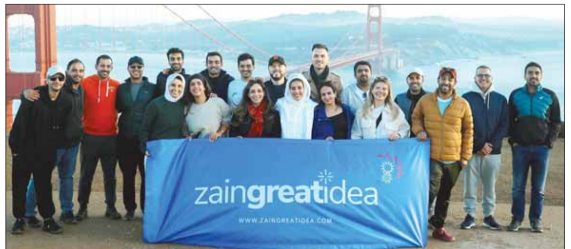
مبارو "Zain Great Idea" في سان فرانسيسكو