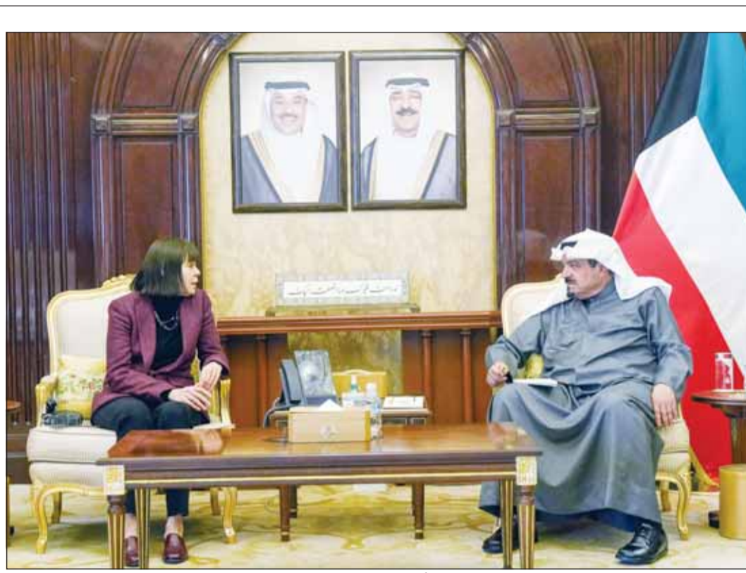
سمو رئيس مجلس الوزراء الشيخ أحمد عبدالله مستقبلاً السفيرة الأميركية كارين ساساهارا

وأشتمت يحيى تصريحه بالتأكيد على موقف الكويت المبدئي والثابت تجاه دعم الجهود الدولية المشتركة نحو تحقيق استخدام الأمن والاستقرار في سورية والمنطقة.