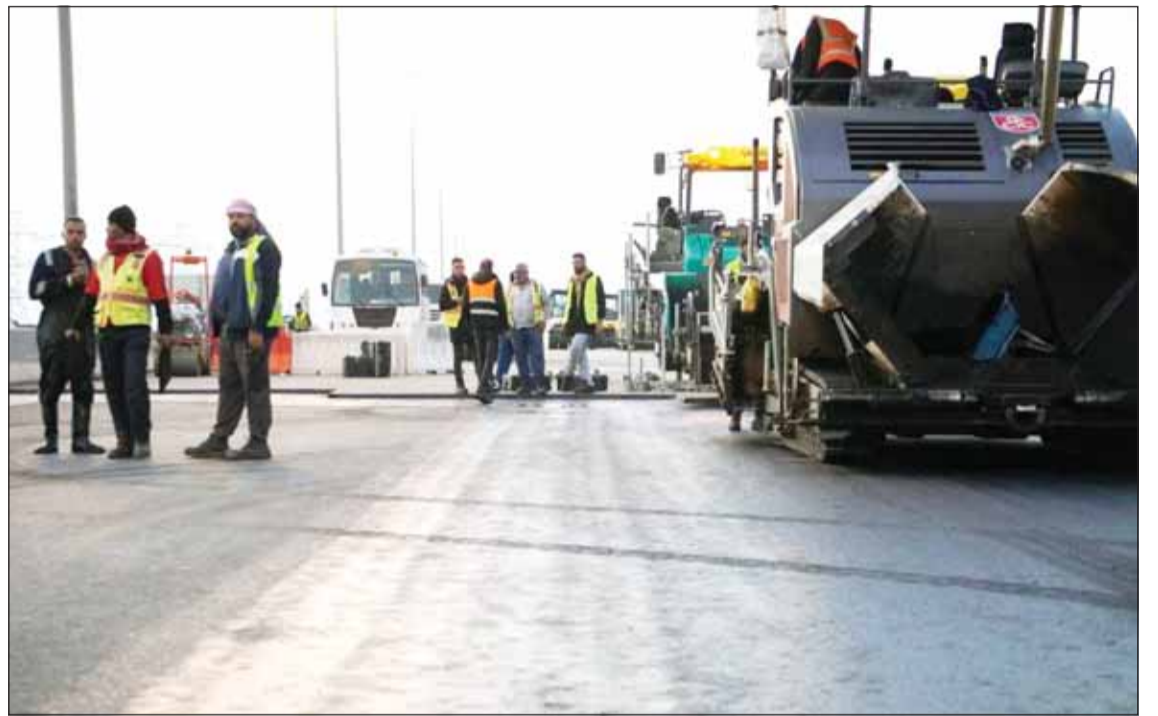
فريق العمل يباشر إصلاح الدائري السابع

المشعان: سرعة إنجاز الأعمال بالجودة والكفاءة المطلوبة