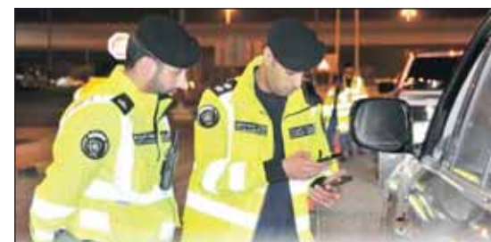
جانب من الحملات الأمنية لدوريات النجدة

وأكدت ادارة شرطة النجدة ان هذه الجهود تأتي في إطار خطة أمنية شاملة لتعزيز الاستقرار والحد من الجرائم والاتجاهات القانونية والتركيز على مكافحة المخدرات لحماية المجتمع من السلوكيات السلبية وتعزيز الالتزام بالقوانين.