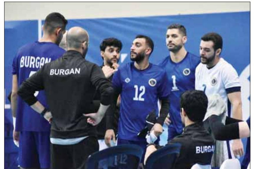
برقان يتوجه إلى الدوحة اليوم