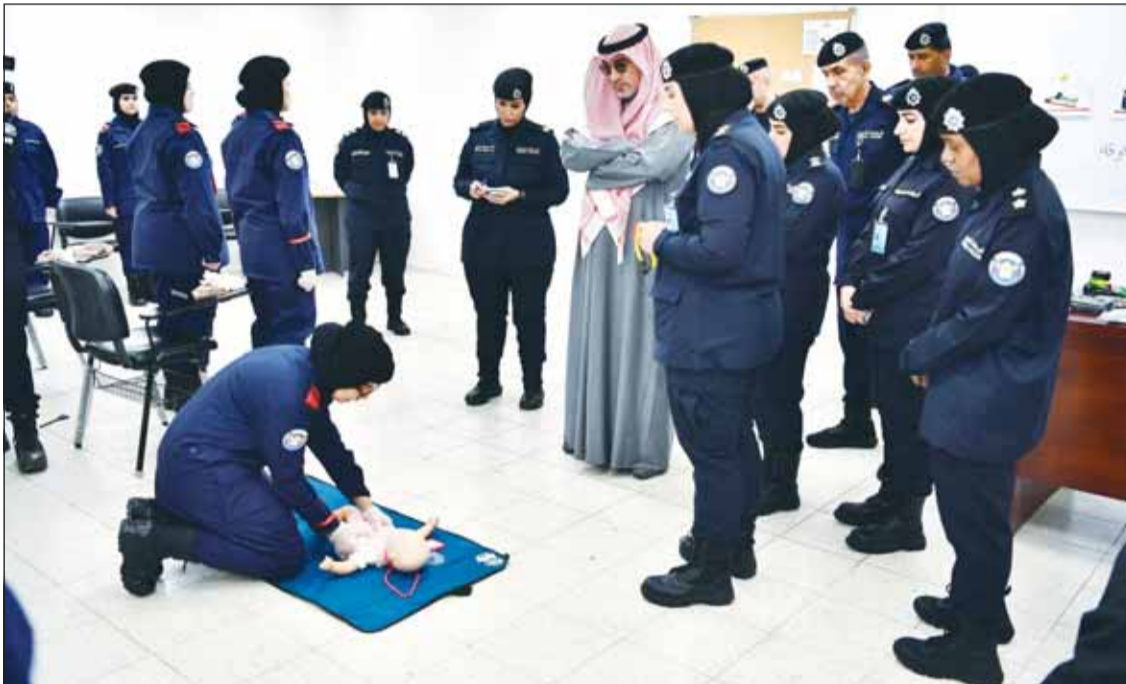
الشيخ فهد اليوسف يطلع على سير العملية التعليمية والتدريبية ويجري حواراً مع طالبات معهد الشرطة النسائية

الاستفادة من العلوم الحديثة لصقل مهارات خريجات المعهد وتعزيز مشاركتهن في دعم الأمن