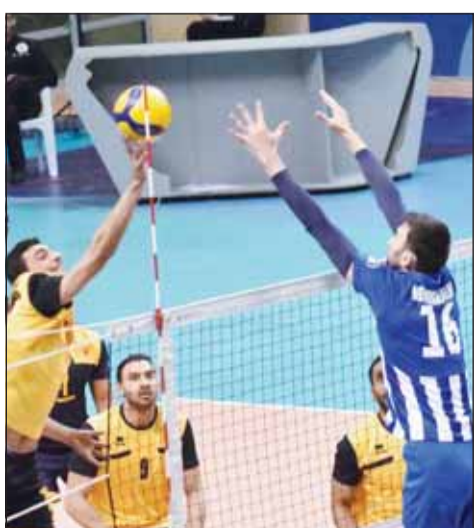
الشباب عبر القادسية بالدوري

وأصبح للكويت ثلاث نقاط، يشاركه بذات الرصيد كاظمة والقادسية والعربي والشباب، فيما اليرموك والساحل والصليبخات والنصر دون رصيد. وتقام البطولة بنظام الدوري من مرحلة واحدة "تمهيدي"، تتاهل الفرق الأربعة الأولى بختامه إلى الأدوار النهائية، حيث يلتقي الأول مع الرابع والثاني مع الثالث، ويبلغ الفائزان المباراة النهائية، فيما يلعب الخاسران على المركزين الثالث والرابع.