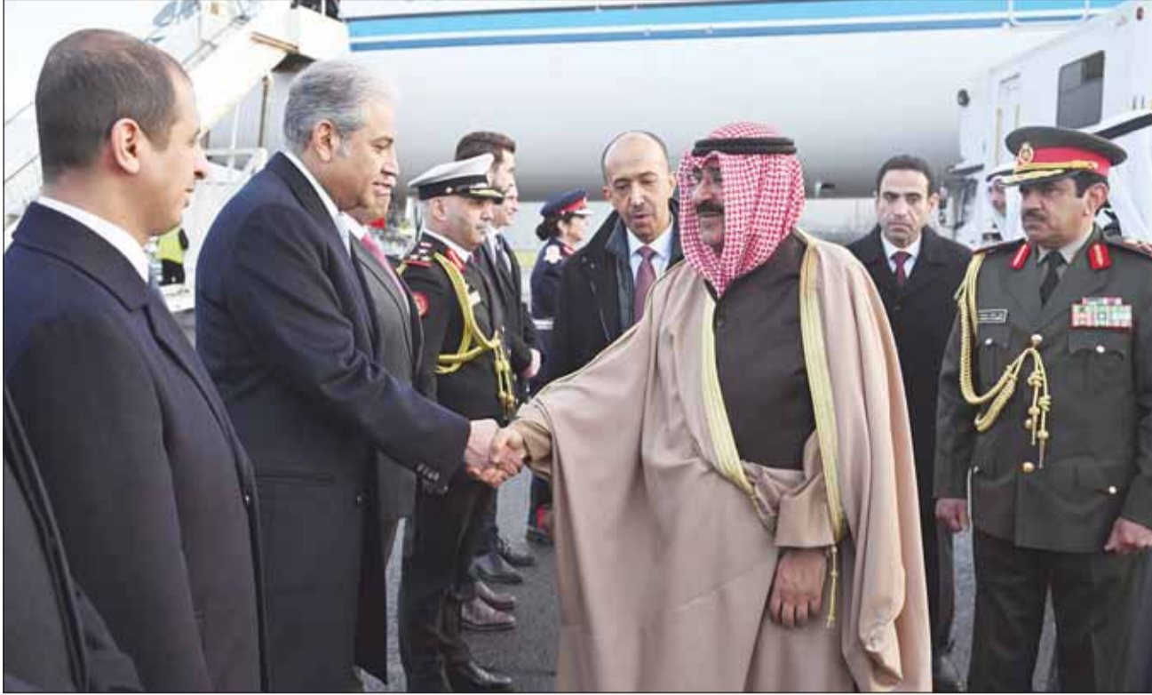
سمو أمير البلاد مصافحاً مستقبليه لدى وصوله إلى أسكتلندا