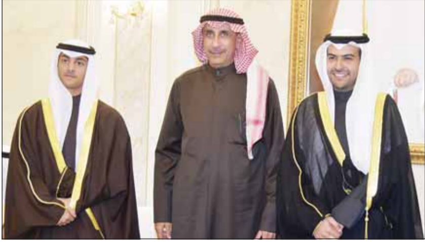
اللواء م. فيصل الجزاف يهنئ