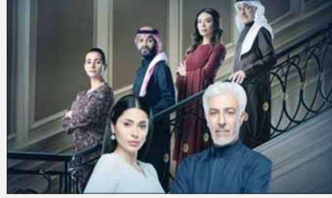
نجوم خريف القلب