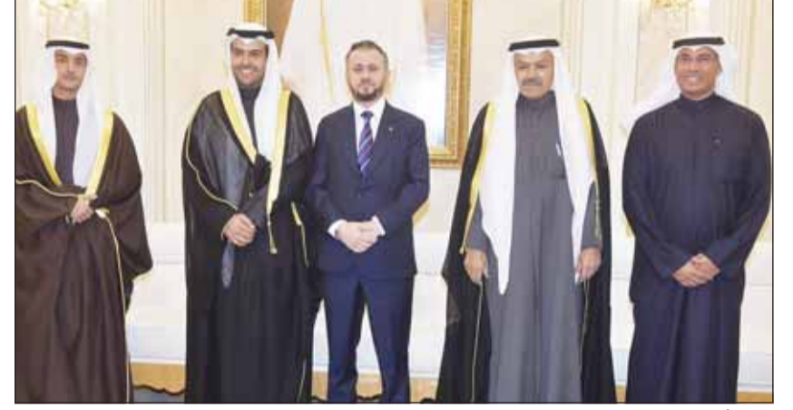
سفير ألبانيا البرهوسا يهنئ