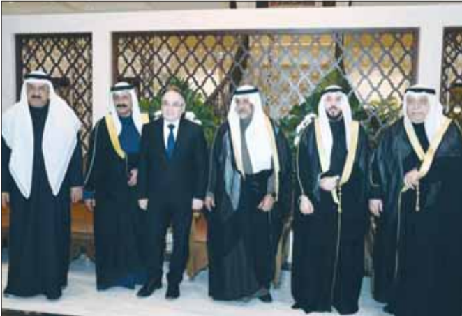
سفير بلغاريا ديميتار ديميتروف مهنتاً