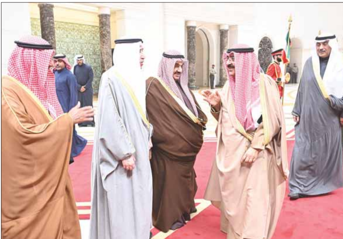
سمو أمير البلاد مودعاً سمو الشيخ ناصر المحمد والشيخ مبارك الحمد وسمو الشيخ د.محمد الصباح