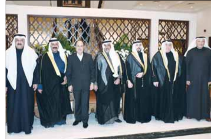
السفير محمد تقيي حسيني قدم التهاني