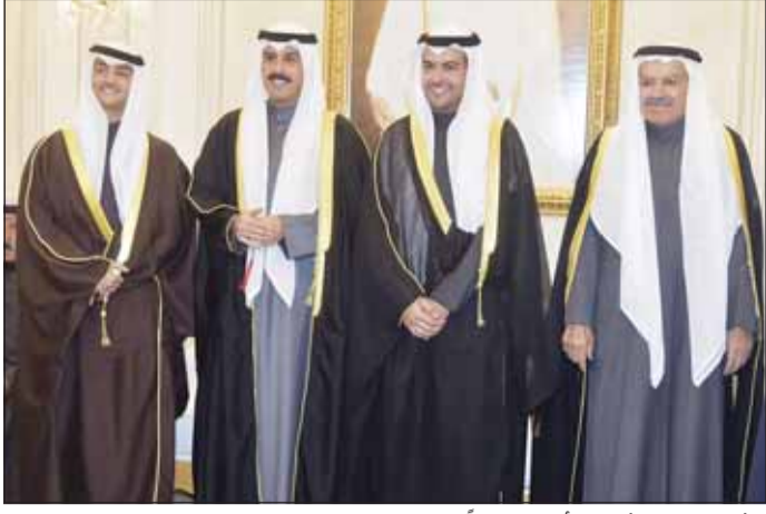
الشيخ طلال مشعل الأحمد مهنتاً