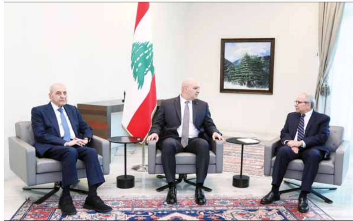
الرئيس اللبناني جوزاف عون متوسلاً رئيس الوزراء المكلف نواف سلام ورئيس البرلمان نبيه بري في القصر الرئاسي في عيدا أمس

المسار السياسي الإيجابي في لبنان بعد انتخاب رئيس البلاد. وقال المتحدث باسم الأمم المتحدة ستيفان دوجاريك إن الأمين العام أنطونيو غوتيريش سيجتوبه إلى لبنان في وقت لاحق هذا الأسبوع في زيارة تضامن مع لبنان وشعبه، موضحاً إن غوتيريش سيلتقي في بيروت القيادة السياسية وشخصيات أخرى كما من المتوقع أن يتوجه إلى جنوب لبنان لزيارة قوة الأمم المتحدة المؤقتة "يونيفيل" للإعراب عن دعمه وشكره لعمل أفرادها في ظل الظروف الصعبة للغاية.