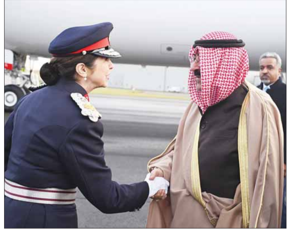
سمو أمير البلاد الشيخ مشعل الأحمد وفيه استقباله ممثل الملك تشارلز الثالث اللورد إيونا مكدونالدز