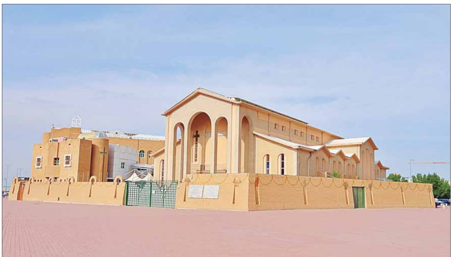
الكنيسة الكاثوليكية في الكويت

وقال: "إن دورنا ككنيسة هو مواصلة تعزيز السلام والمصالحة،