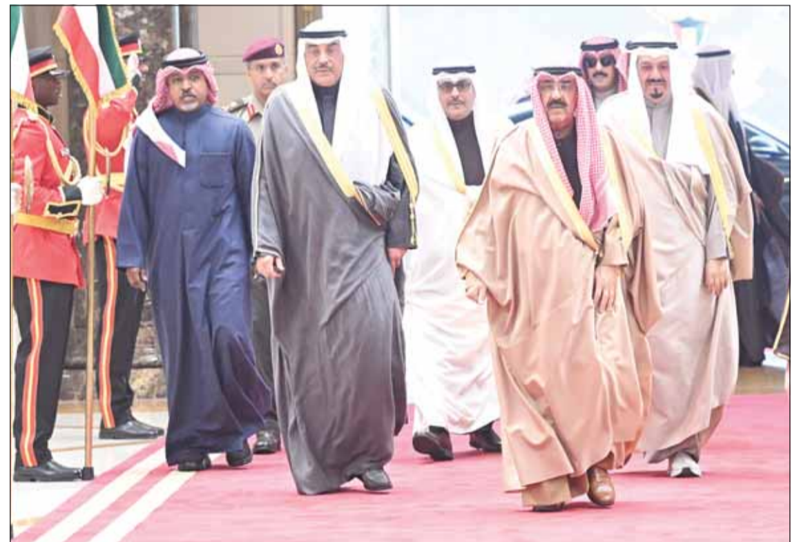
سمو أمير البلاد الشيخ مشعل الأحمد لدى مغادرته وفيه وداعه سمو نائب الأمير ولي العهد وسمو رئيس مجلس الوزراء