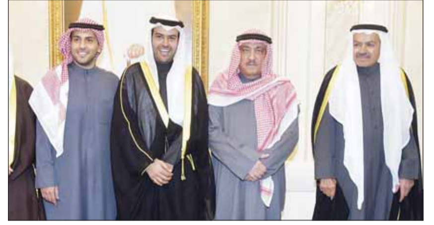
تهنئة من مسلم البراك