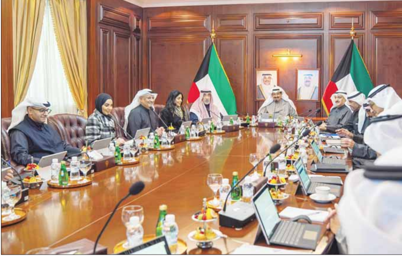
سمو الشيخ أحمد العبدالله مترئساً اجتماع مجلس الوزراء

اعتماد حالات فقد وسحب الجنسية من أشخاص حصلوا عليها عن طريق الغش والتزوير