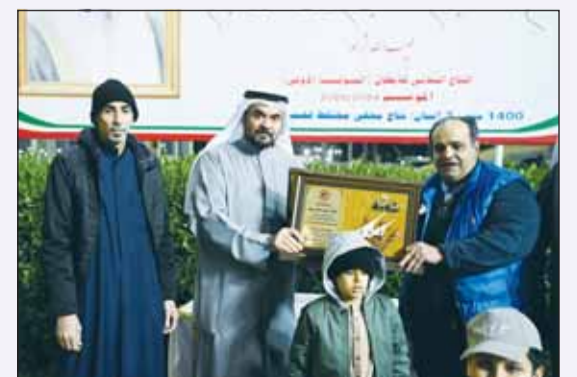
حمد البوس يتكرم الشيخ صباح الناصر

وقال الشيخ صباح الناصر في تصريح صحفي على هامش سباق الاجتماع الـ 11 للخيل بنادي الصيد والفروسية، "تتم عملية الاشتراك والتداعيل للسباق أون لاين حيث يستطيع كل مشارك اختيار الشوط الذي يريده والمسافة