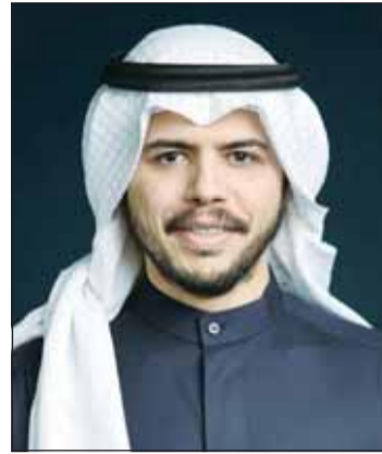
الشيخ صباح الصباح

المشاريع في 2023، فستعزز منصب نائب الرئيس التنفيذي للاستثمار في المجموعة، حيث سيدعم الرئيس التنفيذي