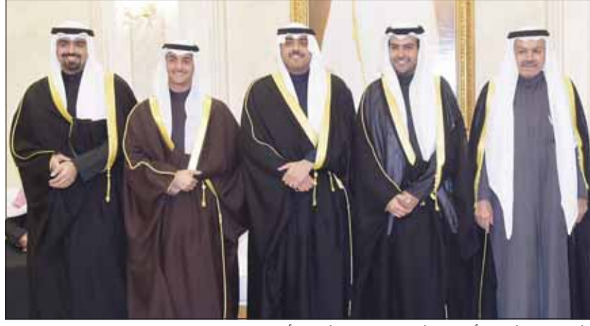
الشيخ جابر مشعل الأحمد والشيخ فهد جابر مشعل الأحمد بياركان