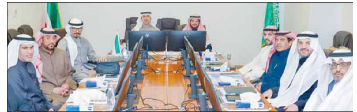
جانب من اجتماع اللجنة المشتركة للمنطقة المقسومة

وكذلك تطويرها المستمر وتقييمها لأجل الحصول على أفضل النتائج، مشيرة إلى أنه تم الاطلاع على جهود أعضاء اللجنة التشغيلية وتحقيق أهداف العمليات المشتركة وصياغة خطة عمل مشتركة تحقق المصالح الاستراتيجية للبلدين.