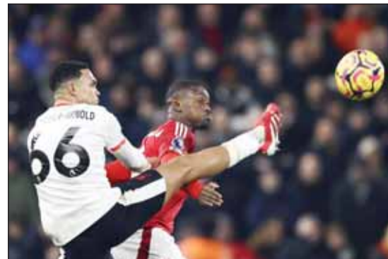
تعادل ليفربول مع نوتنغهام

شهدت مباريات الدوري الإنجليزي الممتاز لكرة القدم أول من أمس، ثلاثة تعادلات لكل من تشلسي ومانشستر سيتي وليفربول مع كل من بورنموث وبرنتفورد ونوتنغهام فورست على التوالي. وأخذ ريس جيمس قائد تشلسي فريقه من الخسارة أمام بورنموث بتسديدة من ركلة مرة في الدقيقة الخامسة من الوقت بدل الضائع، لينتهي اللقاء بين الفريقين بنتيجة 2-2. وأهدر مانشستر سيتي تقدمه بهدفين بعد أن سجل يواني ويسا وكريستيان نورغارد هدفين في وقت متأخر من المباراة ليمنحا برنتفورد تعادلا متفيرا 2-2 أمام ضيفه في الدوري الإنجليزي. وبعد تعرضه لسد هزائمه في الدوري في نوفمبر وديسمبر، استعاد سيتي عافيته بالتعادل مع ليفرتون والفوز على ليدستر سيتي ووست هام يونايتد لكن انهياره في وقت متأخر من مباراة الثلاثاء أوقف صحوته التي لم تدم طويلا وتوقفت فجأة. وبالنقطة التي حصل عليها من المباراة أصبح سيتي في المركز السادس في جدول الترتيب برصيد 35 نقطة بينما يحتل برنتفورد المركز العاشر برصيد 28 نقطة بعد تحقيقه عودة غير متوقعة. بدوره، تعادل ليفربول مع مضيفه نوتنغهام فورست بنتيجة 1-1 لكن ليفربول واصل نزيه النقاط بتعادل ثان على التوالي، وفشل أيضا من رد اعتباره أمام نوتنغهام فورست الذي أحمق به الخسارة الوحيدة في مباراة الفريقين بالدور الأول. كما أوقف هذا التعادل سلسلة من 6 انتصارات متتالية لفريق نوتنغهام ليقوى في المركز الثاني برصيد 41 نقطة بفارق ست نقاط عن ليفربول صاحب الصدارة.