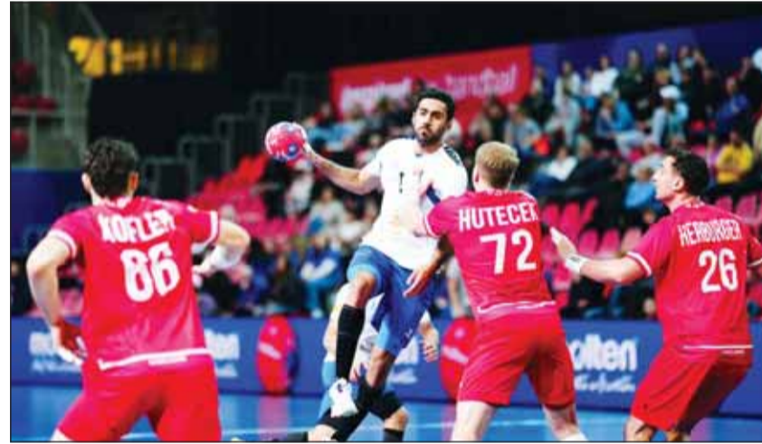
الخميس بمواجهة دفاعات النمسا

العالم بنسخته الـ29 هي التاسعة له منذ مشاركته الأولى في عام 1982 وجاء تأهل منتخبا الوطني الأول لمونديال 2025 بعد أن احتل المركز الرابع في ختام البطولة الآسيوية التي أقيمت قبل عام في مملكة البحرين.