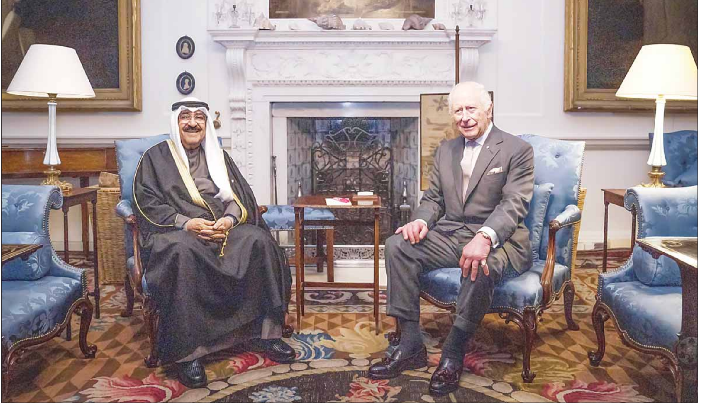
سمو أمير البلاد الشيخ مشعل الأحمد لأم لقاته الملك تشارلز الثالث

سموه زار العاهل البريطاني وتبادل معه أحاديث ودية عكست العلاقات الوطيدة بين البلدين