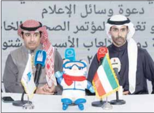
الشيخ جابر الصباح وفهيد العجمي