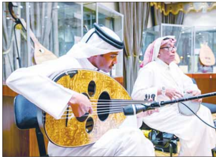
من فعالية العود العام الفاتت