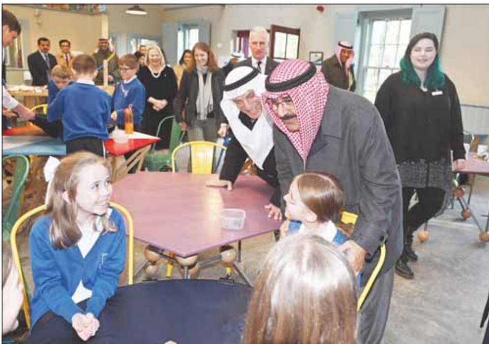
سمو الأمير يتحدث مع طلبة المركز التعليمي