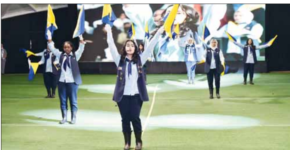
طابور العرض للمرشدات