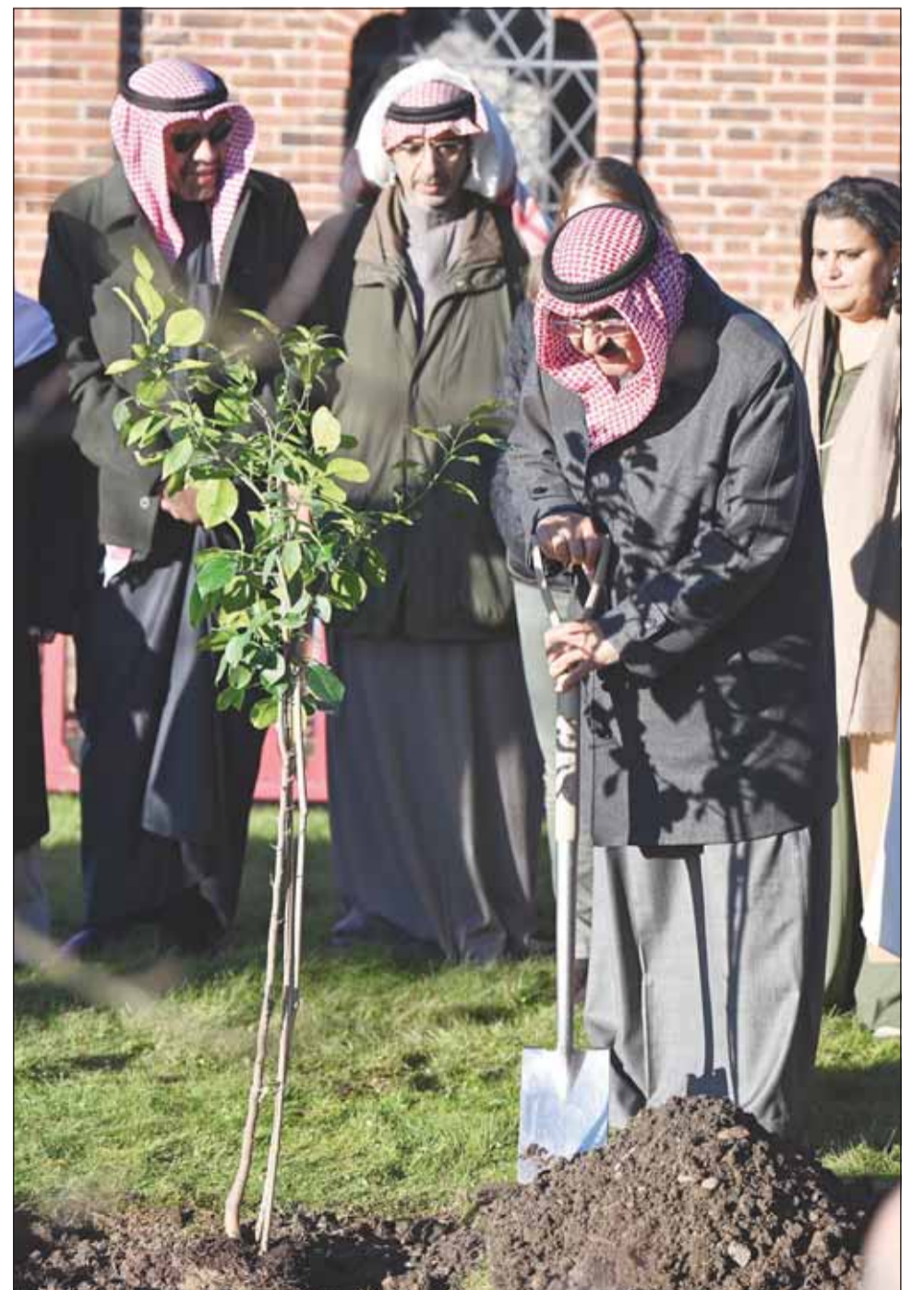
سمو الأمير ينفضل بزراعة شجرة في حديقة "دمفريس هاوس"

وظل "دمفريس هاوس" بيتاً عائلياً حتى 1993، وفي يوليو من عام 2007 نجحت مجموعة من الشركات يقودها الملك تشارلز في شراء البيت بهدف "إنقاذه" كونه يحوي أهم مجموعة من الأثاث الجورجي بالخشبة لبريطانيا. ومنذ عام 2018 عكفت "مؤسسة الأمير" آنذاك على تطوير البيت ومدايقه والمباني الخارجية التاريخية ليعاد استقلالها في توفير فرص تدريب الأطفال واليافعين على المهارات والحرف التقليدية وقد تم إدراجها في قائمة الوجيهات الاسكتلندية التراثية المهمة. وتحافظ "مؤسسة الملك" التي تتولى رعاية البيت على جعله وجهة سياحية ومقر ضيافة.