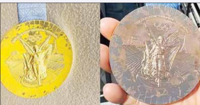
الصدا يأكل ميداليات الأولمبياد

وأوضحت أنه حتى الآن، أعيدت حوالي 100 ميدالية إلى "دار سك العملة"، التي ستقوم بتصنيع ميداليات جديدة للجنة الأولمبية بسبب "تغير شكلها". وقالت إن اللجنة الأولمبية الدولية، أعلنت أن الميداليات التي تم تصنيعها لدورة الألعاب الأولمبية 2024 في باريس من قبل دار سك العملة الباريسية، والتي تم اعتبارها "معيبة" بسبب مشكلات في الطلاء، سيتم استبدالها.