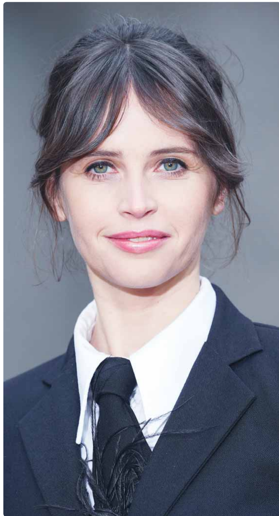
الممثلة الإنكليزية فيليسييتي جونز خلال حملة ترويج لفيلم "The Brutalist" في لندن