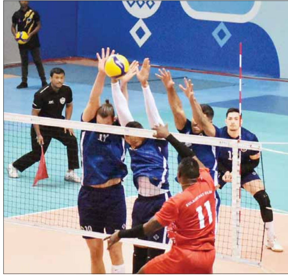
برقان يفتتح "عربية" بلقاء الجزيرة

كاظمة "ثلاث نقاط" مع الساحل "دون رصيد" في الخامسة على صالة الاتحاد بمجمع الشيخ سعد العبدالله، يعقدها في الساعة مساء لقاء القادسية "ثلاث نقاط" مع الصليبيخات "دون رصيد".