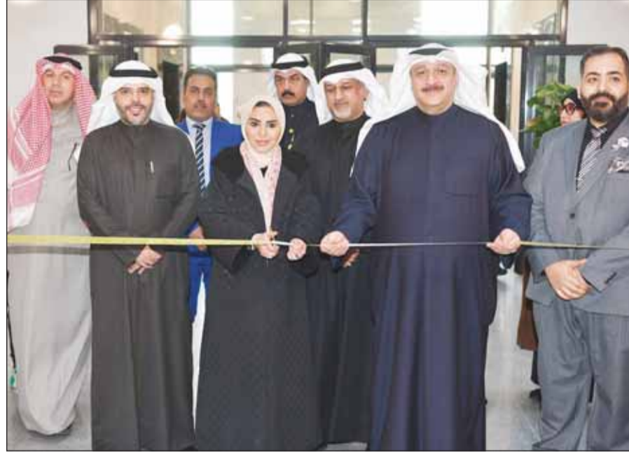
وزير الصحة د. أحمد العوضي ووزيرة الشؤون د. أمثال الحويلة خلال افتتاح المركز

وشؤون الأسرة والطفولة ووزارة الدولة لشؤون الشباب الدكتور أمثال الحويلة عن سعادته بالتواجد في مركز علاج الإدمان الذي جاء بتبرع من لجنة المشروعات التعاونية الوطنية، لتقديم خدمة وطنية مجتمعية لفئات مختلفة خصوصا الفئات التي تحتاج إلى علاج الإدمان. وأشارت إلى أن المركز يقدم برنامجا كاملا ومتكاملا لعلاج الإدمان بالتعاون مع وزارة الصحة حيث يتوافر