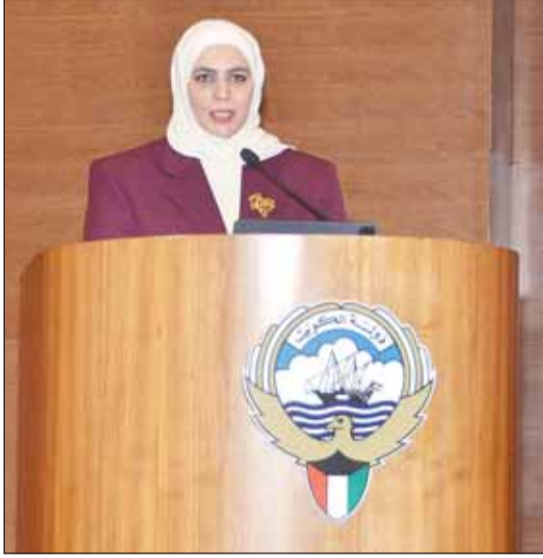
وزيرة المالية نورة الفصام خلال المؤتمر