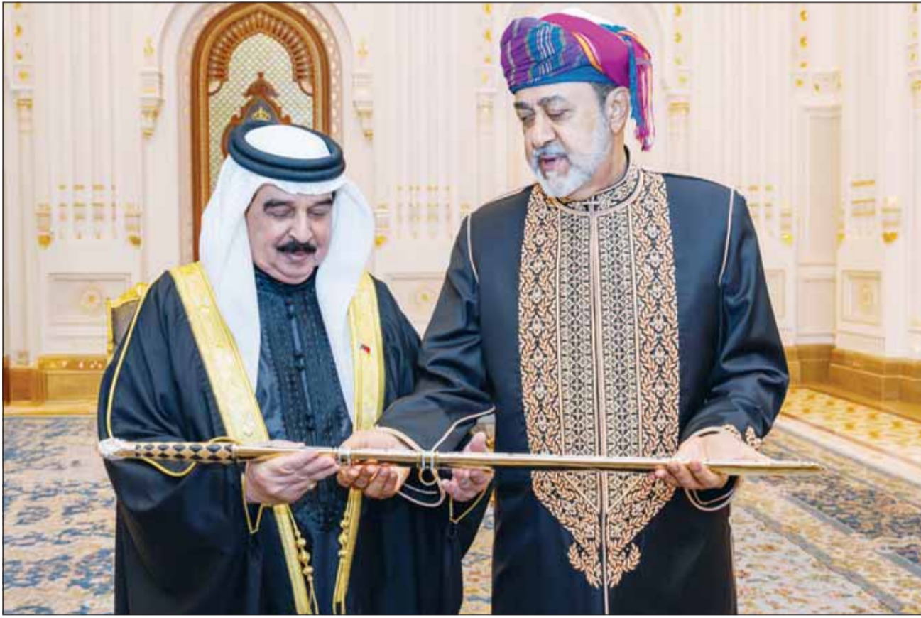
سلطان عُمان هيثم بن طارق والعهال البحريني الملك حمد بن عيسى يتبادلان الهدايا التذكارية في قصر العلم بالعاصمة العمانية "مسقط"

مسقط، المنامة، عواصم - وكالات، شدد العامل البحريني الملك حمد بن عيسى وسلطان عُمان هيثم بن طارق في مسقط، على ضرورة تعزيز العمل الخليجي المشترك في ظل التحديات التي تشهدها المنطقة وبما يحقق مصالح دول مجلس التعاون لدول الخليج العربية وشعوبها، ويسهم في تعزيز أمن واستقرار المنطقة، وأكدوا أهمية تضافر الجهود للمحافظة على الاستقرار الإقليمي وتجنب تبعات أزمات جديدة تهدد أمنها واستقرارها، إضافة إلى العمل على إيجاد مسار للسلام العادل والشامل والدائم الذي يقوم على أساس حل الدولتين ويضمن تحقيق الاستقرار والأمن للجميع، ويحث الزعيمين أهم التطورات المستجدة على الساحتين الإقليميتين والدولية، وفي مقدمتها الأوضاع في منطقة الشرق الأوسط، بالإضافة إلى عدد من القضايا التي تهم البلدين، وتبادل وجهات النظر بشأنها.