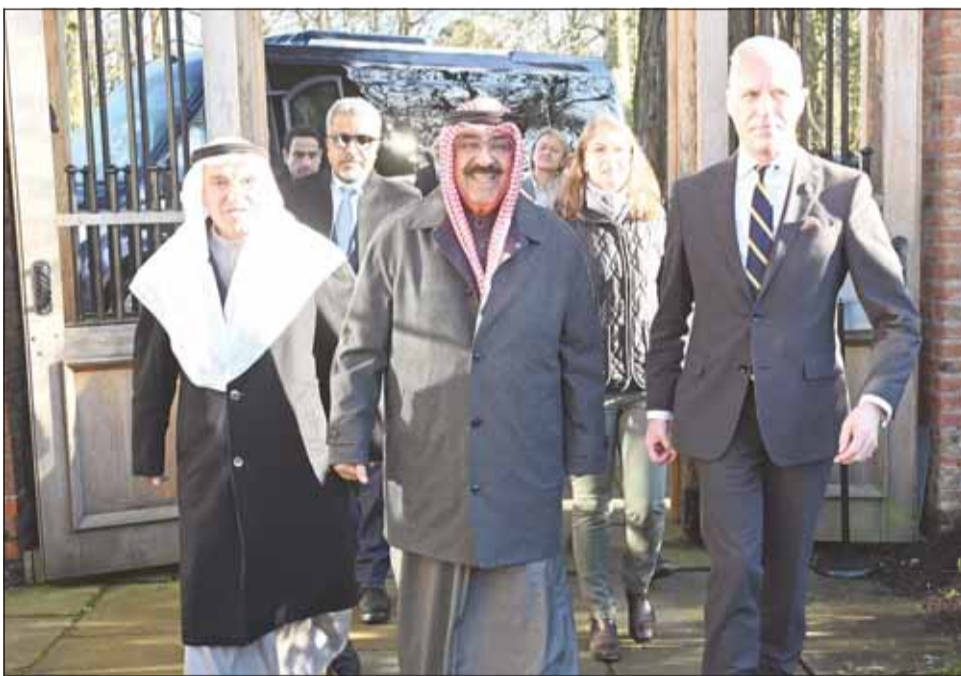
سمو أمير البلاد الشيخ مشعل الأحمد لأم وصوله إلى مقر مؤسسة الملك في "دمفريس هاوس"

لندن - "كونا": قام سمو أمير البلاد الشيخ مشعل الأحمد والوفد الرسمي المرافق لسموه، أمس، بزيارة صاحب الجلالة الملك تشارلز الثالث ملك المملكة المتحدة لبريطانيا العظمى وأيرلندا الشمالية الصديقة في "دمفريس هاوس" بمقاطعة أيرشاير الاسكتلندية في المملكة المتحدة، وذلك تلبية للدعوة الموجهة إلى سموه. وقد تم خلال اللقاء تبادل الأحاديث الودية التي عكست عمق العلاقات التاريخية