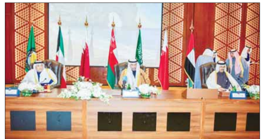
الوزير عبدالله اليحيا متوسطاً جاسم البديوي ود. محمد السادة