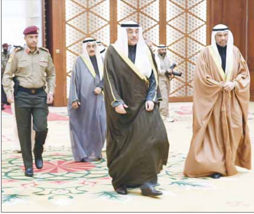
سمو ولي العهد لدى وصوله مقر إقامة الاجتماع الأول من الدورة الـ 28 للهيئة الاستشارية