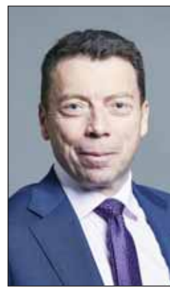
اللورد إيان ماكنيكول

وقالت السفارة البريطانية في الكويت بليندا لويس، ومديرة قسم الأعمال والتجارة في السفارة وناز ديمير: "تعد هذه الفترة بأنها مميزة في الشراكة الثنائية التي تجمع المملكة المتحدة ودولة الكويت في مجال التجارة والاستثمار، حيث وصلت التدفقات التجارية إلى 5.9 مليار جنيه إسترليني في الأشهر الأثني عشر حتى تاريخ 30 يونيو 2024، بزيادة قدرها 14.8٪ (ما يعادل 762 مليون جنيه إسترليني) عن العام السابق. وأضافنا "كما سنواصل إجراء المفاوضات بشأن اتفاقية التجارة المرة بين المملكة المتحدة ودول مجلس التعاون الخليجي، حيث لا تزال المملكة المتحدة وجهة جاذبة للمستثمرين الكويتيين من القطاع الخاص والمؤسسات"