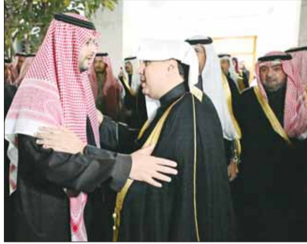
ممثل سمو الأمير وسمو ولي العهد معرزي