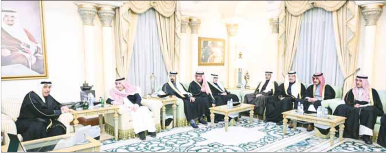
ممثل سمو الأمير وسمو ولي العهد والوفد الرسمي المرافق خلال تقديم واجب العزاء إلى أسرة المغفور له الأمير محمد بن فهد

بعث سمو أمير البلاد الشيخ مشعل الأحمد ببرقية تهنئة إلى الرئيس ألكسندر لوكاشينكو - رئيس جمهورية بيلاروسيا الصديقة، عبّر فيها سموه عن خالص تهنئته بمناسبة إعادة انتخابه رئيساً لجمهورية بيلاروسيا لولاية رئاسية ثانية، متمنياً سموه لجمهورية بيلاروسيا وشعبها الصديق المزيد من الرقي والازدهار وله كل التوفيق والسداد وموفق الصحة والعافية. على خط مواز، بعث سمو ولي العهد الشيخ صباح الخالد ببرقية تهنئة إلى رئيس جمهورية بيلاروسيا ألكسندر لوكاشينكو، ضمنها سموه خالص تهنئته بمناسبة إعادة انتخابه رئيساً لجمهورية بيلاروسيا لولاية رئاسية ثانية، متمنياً سموه لجمهورية بيلاروسيا وشعبها الصديق المزيد من الرقي والازدهار وله كل التوفيق والسداد وموفق الصحة والعافية. من جهته، بعث سمو رئيس مجلس الوزراء الشيخ أحمد عبدالله برفقية تهنئة إلى رئيس جمهورية بيلاروسيا ألكسندر لوكاشينكو ضمنها سموه خالص تهنئته بمناسبة إعادة انتخابه رئيساً لجمهورية بيلاروسيا.