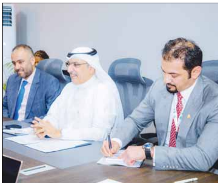
البحر خلال مشاركته في أحد الاجتماعات