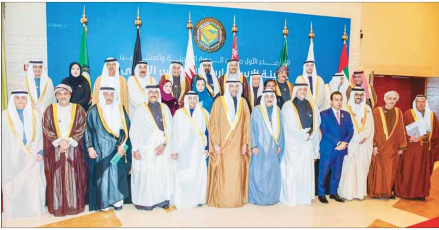
اليحيا والبيديوي وأعضاء الهيئة الاستشارية للدورة الـ 28

اليحيا: مجلس التعاون أثبت قدرته على الصمود والتكيف أمام التحديات