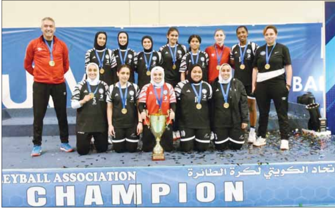
توزيع "طائرة سلوى" بكأس سوبر السيدات

سويسرا، وهو ما يوكد نجاح البطولة، وحرص الفرق المشاركة بها. وأضافت الأحمد، "مجلس إدارة نادي سلوى الصباح، يولي البطولة الاهتمام الكبير، من خلال لجان البطولة التي كانت عملت كخلفية النحل الفترة الماضية حتى انطلاق المنافسات اليوم، وتدليل كافة الصقات التي تواجهها من أجل الظهور المشرف للبطولة وللمعبة الكرة الطائرة النسائية".