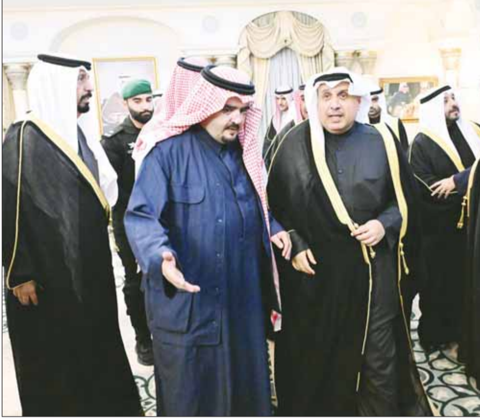
ممثل سمو الأمير وسمو ولي العهد الشيخ حمد جابر العلي لدم وصوله لتقديم واجب العزاء

الرياض - "كونا"، قام ممثل سمو أمير البلاد الشيخ مشعل الأحمد وسمو ولي العهد الشيخ صباح الخالد، الشيخ حمد جابر العلي، عصر أمس، بتقديم واجب العزاء إلى أسرة المغفور له بإذن الله تعالى صاحب السمو الملكي الأمير محمد بن فهد بن عبدالعزيز آل سعود، وطيب الله ثراه وجعل الجنة مثواه، وذلك بالعاصمة "الرياض". وكان ممثل سمو أمير البلاد وسمو ولي العهد غادر والوفد المرافق، أمس، متوجها إلى المملكة العربية السعودية الشقيقة، ويضم الوفد الرسمي كلا من الشيخ علي خالد الجابر والشيخ ثامر علي الصباح والشيخ الدكتور أحمد ناصر المحمد ووزير شؤون الديوان الأميري الشيخ محمد عبدالله والشيخ مشعل جابر عبدالله والشيخ عبدالله ناصر الصباح الأحمد ومحافظ الأحمد الشيخ حمود جابر الأحمد والشيخ فراس سعود الصباح والشيخ طلال مشعل الأحمد.