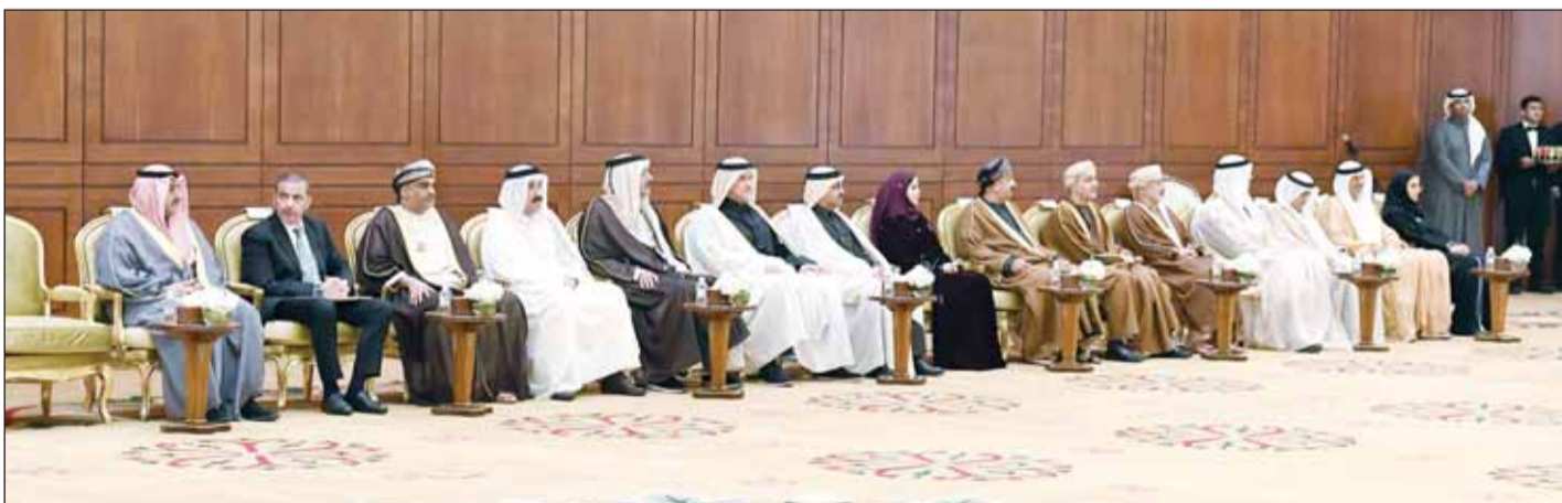
جانب من الحضور خلال زيارة سمو ولي العهد

من جهة أخرى، أكد وزير الخارجية عبدالله اليحيا أهمية التعاون المشترك لمواجهة التحولات السياسية والاقتصادية والأمنية في المنطقة