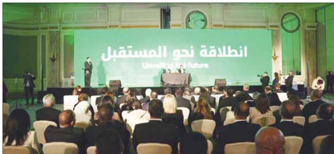
مفهوم جديد للصيرفة الإسلامية في السوق المصري