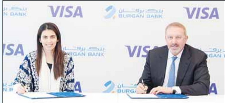
توقيع تجديد الشراكة بين "برقان" و"فيزا"

أعلن بنك برقان عن تجديد شراكته مع شركة فيزا الرائدة عالمياً في تقديم خدمات الدفع الرقمي، تأكيداً على التزامه بالتعاون مع أبرز مزودي الخدمات لتوفير أفضل تجربة مصرفية، لاسيما في عمليات الدفع الرقمي. ويأتي تجديد الشراكة أيضاً في إطار رسالة بنك برقان الهادفة إلى الريادة في الابتكار وتقديم تجربة عملاء استثنائية، وتماشياً مع استراتيجية الشاملة للتحول الرقمي.