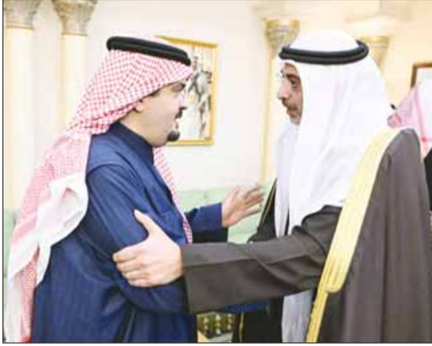
وزير الديوان الأميري الشيخ مبارك العبدالله معرزي