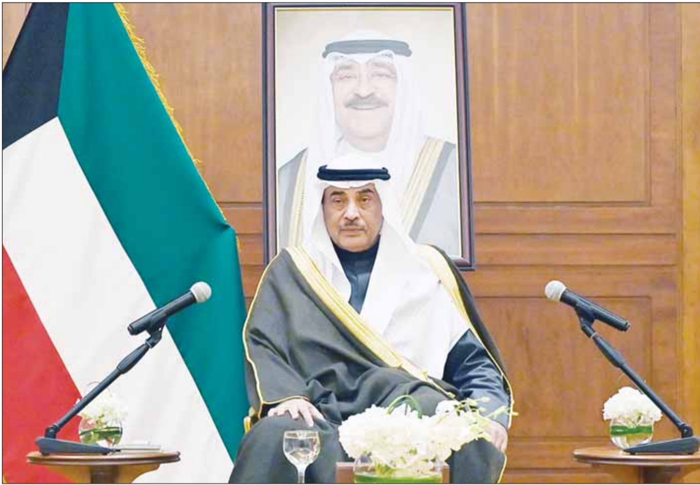
سموه ولي العهد الشيخ صباح الخالد متحدثاً لدى زيارته مقر الاجتماع الـ 28 لاستشارية المجلس الأعلى لدول "التعاون"

أكد سمو ولي العهد الشيخ صباح الخالد ضرورة تدعيم الروابط الأخوية بين دول مجلس التعاون الخليجي وتعزيز الجهود المشتركة في تحقيق طموحات دول المجلس وشعوبها للوصول إلى النهضة المنشودة على كل الأصعدة. جاء ذلك لدى زيارة سموه، ظهر أمس، مقر إقامة الاجتماع الأول من الدورة الثامنة والعشرين للهيئة الاستشارية للمجلس الأعلى لمجلس التعاون لدول الخليج العربية. ونقل سموه تحيات سمو أمير البلاد الشيخ مشعل الأحمد إلى أعضاء الوفود المشاركة في الاجتماع المقام في دولة الكويت. من جهته، أكد وزير الخارجية عبدالله اليحيى أهمية التعاون المشترك لمواجهة التحديات السياسية والاقتصادية والأمنية في المنطقة والعالم. وقال اليحيى في كلمة له خلال الاجتماع الأول للهيئة، إن "رئاسة الكويت للدورة الـ 44 للمجلس الأعلى لمجلس التعاون الخليجي تأتي في مرحلة دقيقة تتطلب تعزيز التكامل الخليجي ورسم رؤية موحدة لمواجهة التحديات الإقليمية والدولية". وأضاف أن "هذا الاجتماع يمثل محطة بارزة في مسيرة التعاون والتكامل بين دول الخليج ويعكس التزام الدول الأعضاء بالعمل المشترك لتحقيق تطورات شعوب المنطقة نحو المزيد من التقدم والازدهار، مشيراً إلى أن مجلس التعاون الخليجي أثبت طوال مسيرته الخيرة قدرته على الصمود والتكيف أمام هذه التحديات.