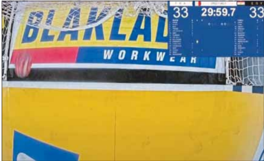
مصر لن تتساع الأجزاء الثلاث من الثانية بمونديال 2025

وذهب حكام اللقاء إلى تقنية الفيديو، للتأكد من دخول الكرة قبل نهاية وقت المباراة ليأتي القرار المولم بالنسبة للمصريين. الإعادة أظهرت أن الكرة تجاوزت خط المرمى، قبل 3 أجزاء من الثانية، من صافرة انتهاء المباراة. هذا السيناريو "الدرامي" أدى بالمنتخب المصري لتوديع المونديال من ربع النهائي، للمرة الرابعة على التوالي.