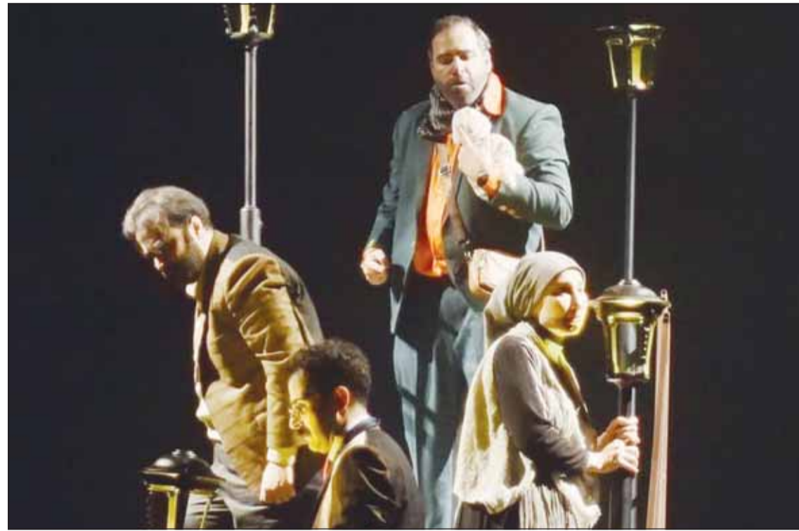
مسرحية غصة عبور

يدعم الأعمال المسرحية التي تنتجها الفرق الأهلية وتشارك بها في المهرجانات، لكن دعم الأنشطة الأخرى في الفرق حتى الآن لم يتم البت فيه لأن الأمر مرتبط بقوانين ومن الصعب تغييرها، ملهماً إلى أن الفرق الأهلية تحقق في الخطوات التي يقوم بها مساعد الزامل لأنه فنان ويعرف جيداً احتياجات الفرق الأهلية والمسارح.