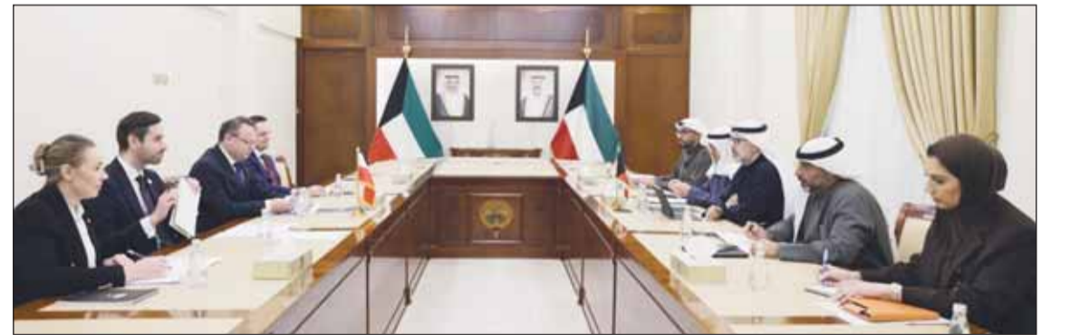
جانب من أعمال الجولة الرابعة من المشاورات السياسية بين وزارتي خارجية الكويت وبولندا

عقدت أمس، في مقر وزارة الخارجية أعمال الجولة الرابعة من المشاورات السياسية بين وزارتي خارجية دولة الكويت وجمهورية بولندا، حيث ترأس الجانب الكويتي نائب وزير الخارجية السفير الشيخ جراح الجابر في حين ترأس الجانب البولندي نائب وزير خارجية جمهورية بولندا أندريه شايخا. وتم خلال المشاورات بحث المواضيع المطروحة على جدول الأعمال والعلاقات الثنائية وسبل توطيدها في كافة المجالات بالإضافة إلى مستجدات الأوضاع على الساحتين الإقليمية والدولية. واتسمت المشاورات بين البلدين الصديقين بتقارب وجهات النظر مع التشديد على أهمية مواصلة العمل من أجل الارتقاء بالعلاقات الثنائية بما يحقق تطلعات قيادتي البلدين.