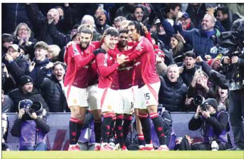
مانشستر يونايتد يطمح للفوز اليوم وضمان التأهل المباشر

مانشستر يونايتد، وتوتنهام، إف سي أس بي، ألكمار الهولندي، بودو غليمث النرويجي، أولمبيكوس اليوناني، رينجرز الاسكتلندي، سان جيلاوز البلجيكي وفيكيتوريا بلزن التشيكي مكاناً على الأقل في الدور الفاصل.