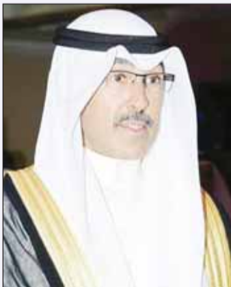
الشيخ فوزان الخالد

تحت رعاية الشيخ فوزان الخالد، تنطلق اليوم، بطولة "أثال" الأولى للخيل العربية الأصيلة، وتستمر لمدة يومين في مركز الجواد العربي "بيت العرب". من جانبه، عبر الشيخ فوزان الخالد، عن فخره واعتزازه برعاية هذا الحدث، مشيراً إلى المكانة السامية التي تحظى بها الخيل العربية الأصيلة في التراث العربي والإسلامي.