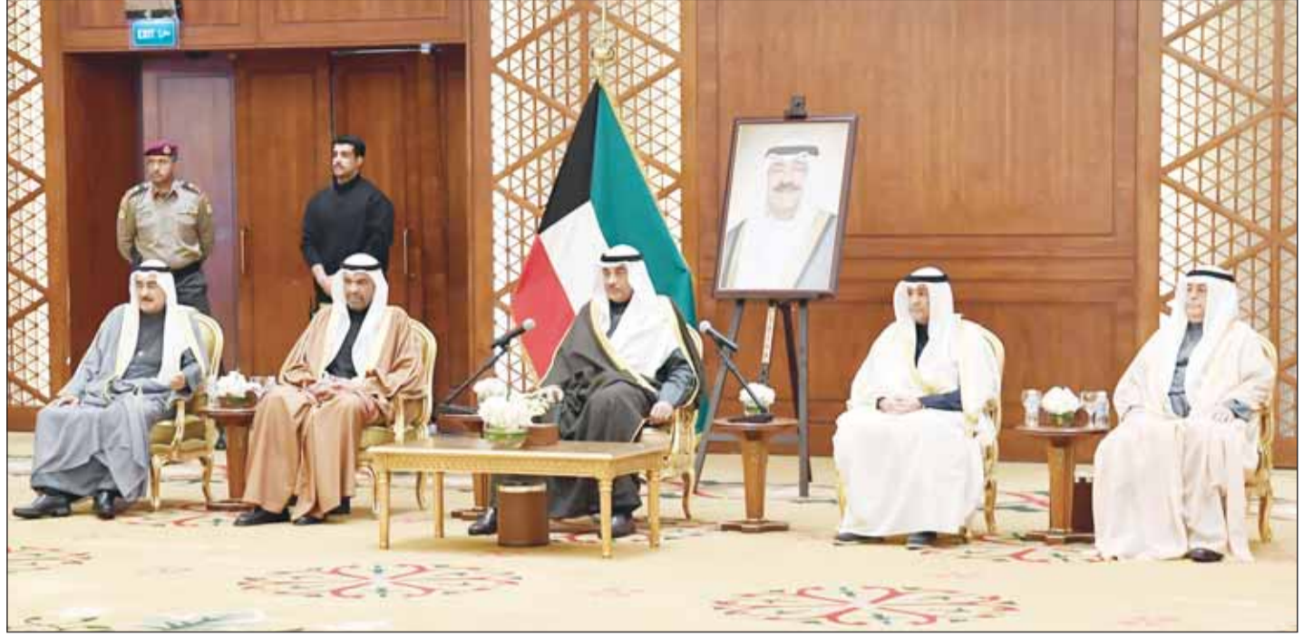
سمو ولي العهد الشيخ صباح الخالد خلال زيارته مقر إقامة اجتماع الهيئة الاستشارية للمجلس الأعلى لمجلس التعاون الخليجي

سموه زار مقر الاجتماع الـ 28 لاستشارية المجلس الأعلى لدول "التعاون" ونقل للحضور تحيات سمو الأمير