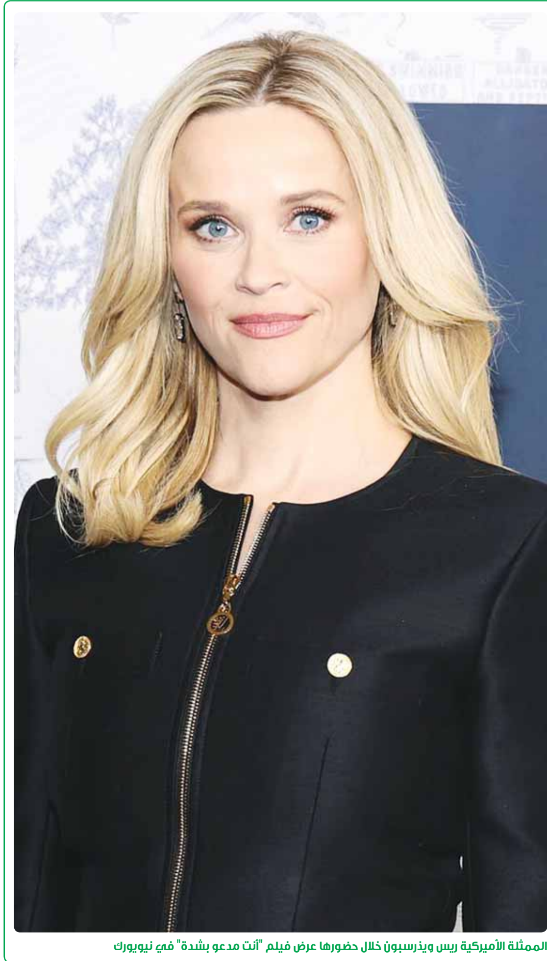
الممثلة الأميركية ريس وينزسبون خلال حضورها عرض فيلم "أنت مدعو بشدة" في نيويورك

وتتلخص تفاصيل الواقعة في أن بلاغا ورد إلى غرفة عمليات وزارة الداخلية أفاد بأن رضيعاً، يبلغ من العمر سنة ونصف السنة، في محافظة مبارك الكبير، نُقل إلى المستشفى فاقدًا للوعي، وبعد إجراء الفحص الأولي له تبين أنه في حالة غيبوبة، ورغم محاولة انعاشه فارق الحياة، وبالتحقيق مع ذويه أفادوا بأنهم سمعوا صراخ الطفل وبالتوجه إلى مصدر الصوت، تبين أن خادمته الغلبينية وضعت الطفل داخل الغسالة. وقد توافقت النيابة العامة ممثلة بعضو المكتب الفني للنائب العام د.وليد العازمي ووكالة نيابتي العاصمة ومكافحة الاتجار بالأشخاص وتهريب المهاجرين وسوق المال طيبة الأنصاري أمام المحكمة، وطالبت في مرافعتها بإعدام المتهمة جزاءً لما ارتكبت من إثم فضيع، كما أكدت أنه لا تعاون في تطبيق القانون، وأنها تتابع القضية باهتمام وحرص على تحقيق العدالة بكل حزم وحسم.