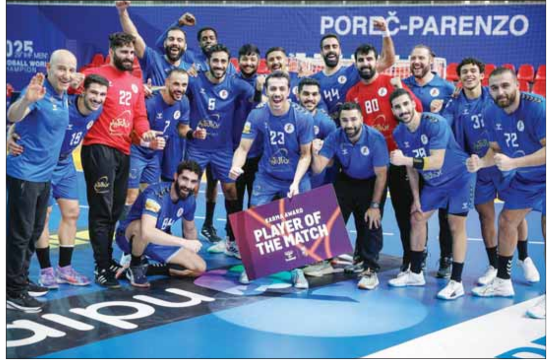
أزرق اليد وفرحة الفوز علمه اليابان ونيل سيف العدوانية لقب رجل المباراة