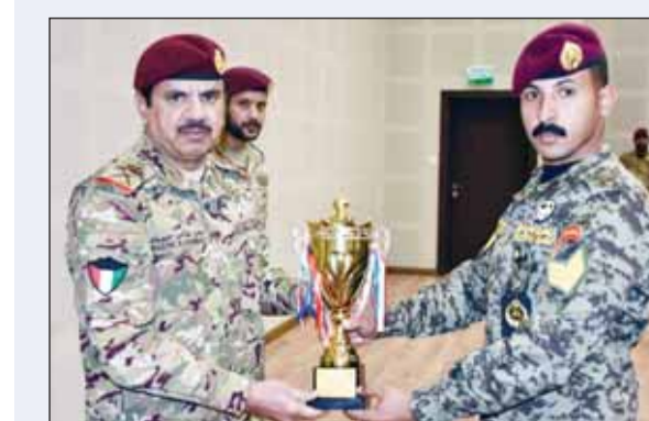
أمير الحرس الأميري اللواء الركن بدر السحلول أثناء تكريمه لخريجيه الدورة

عقدت أمس، في مقر وزارة الخارجية أعمال الجولة الرابعة من المشاورات السياسية بين وزارتي خارجية دولة الكويت وجمهورية بولندا، حيث ترأس الجانب الكويتي نائب وزير الخارجية السفير الشيخ جراح الجابر في حين ترأس الجانب البولندي نائب وزير خارجية جمهورية بولندا أندريه شايخا. وتم خلال المشاورات بحث المواضيع المطروحة على جدول الأعمال والعلاقات الثنائية وسبل توطيدها في كافة المجالات بالإضافة إلى مستجدات الأوضاع على الساحتين الإقليمية والدولية. واتسمت المشاورات بين البلدين الصديقين بتقارب وجهات النظر مع التشديد على أهمية مواصلة العمل من أجل الارتقاء بالعلاقات الثنائية بما يحقق تطلعات قيادتي البلدين.