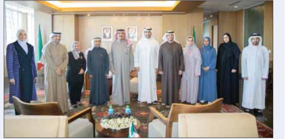
وزير التربية جلال الطبطبائي مع وفد وزارة التربية والتعليم الإماراتية

بحث وزير التربية سيد جلال الطبطبائي أمس مع وفد من وزارة التربية والتعليم بدولة الإمارات العربية المتحدة برئاسة وكيل الوزارة محمد القاسم والوكيل المساعد لقطاع المناهج والتقييم بالإنابة أمانة آل صالح سبل التطوير والتعاون بين البلدين وتبادل الخبرات حول القضايا التعليمية المشتركة. وذكرت وزارة التربية في بيان لها أنه حضر اللقاء الوكيل المساعد للتعليم العام بالتكليف منصور الظفيري والوكيل المساعد للبحوث التربوية والمناهج بالتكليف مريم العنزي والوكيل المساعد لقطاع المنشآت التربوية والتخطيط بالتكليف محمد الخالدي ومدير إدارة تطوير المناهج أنوار الحمدان.