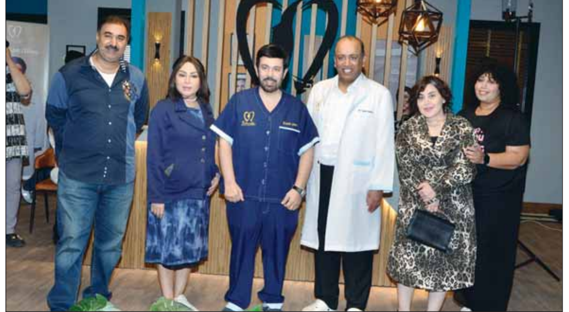
كواليس مسلسل "قبل وبعد"