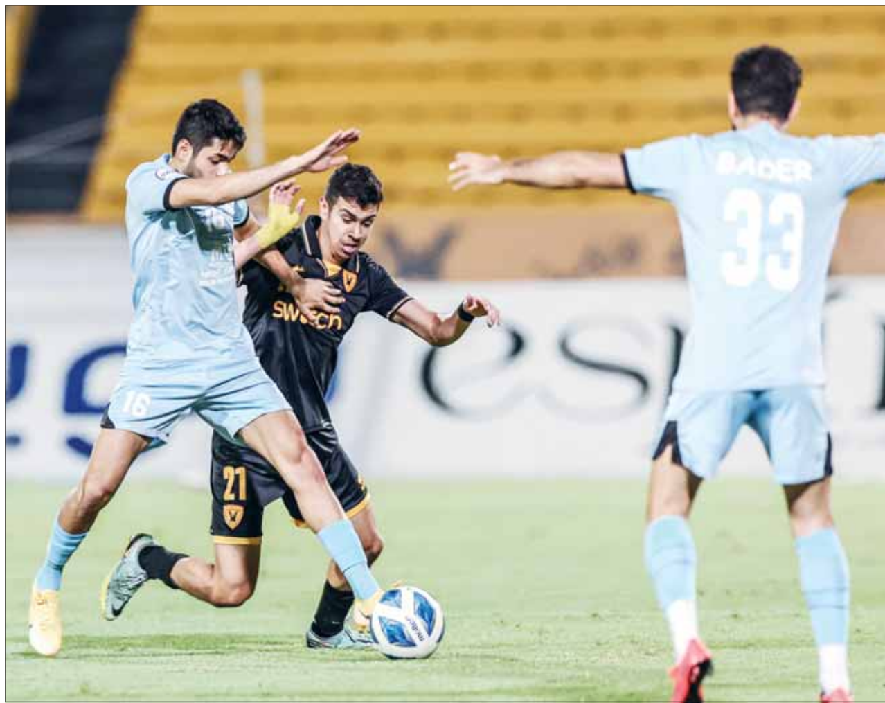
صراع بين القادسية والسالمية غداً على المركز الثالث

كما يرغب "الأصفر" في تحقيق انتصار يرفع به معنويات لاعبيه قبل استضافة العربي القطري يوم 5 فبراير المقبل في الجولة الخامسة من منافسات البطولة الخالصة للأندية، لاسيما أن الفوز على العربي سيمنحه بطاقة التأهل إلى