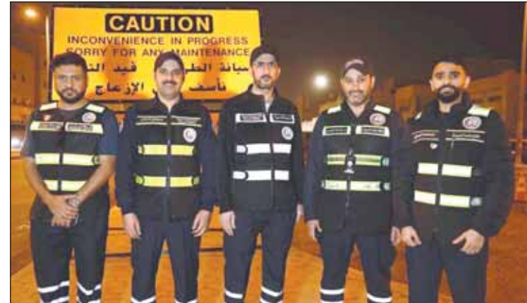
فريق مهندسي "الأشغال" لبدء العمل في منطقة جابر الأحمد

أعلنت وزيرة الأشغال العامة دنورة المشعان بدء أعمال الصيانة الجذرية في منطقة جابر الأحمد ضمن العقود الجديدة، مؤكدة استمرار الوزارة بتنفيذ مشاريع صيانة الطرق في كل المناطق مع الالتزام التام بضمان الجودة وتحقيق المواصفات العالمية لتطوير بنية تحتية متطورة.