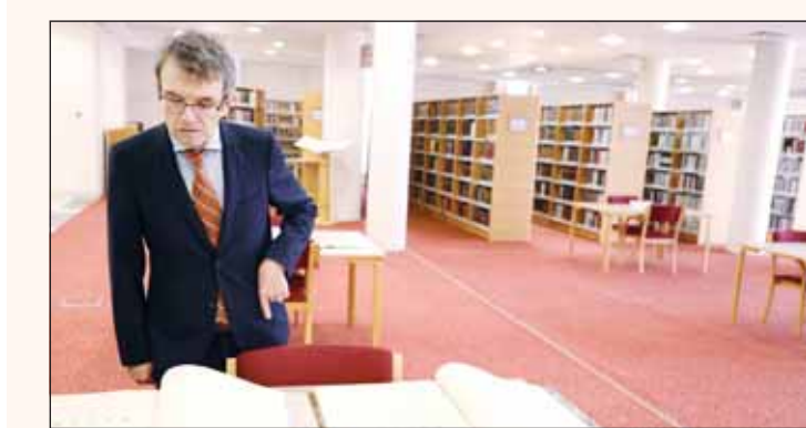
السفير الإسباني يطلع على مخطوطات مكتبة البابطين