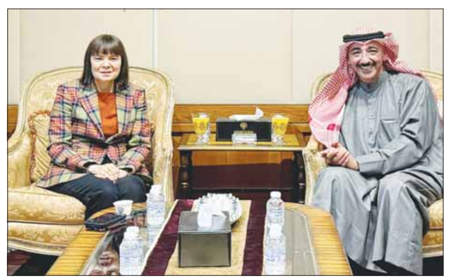
الوزير د.محمود بوشهري مستقبلاً السفيرة الأميركية كارين ساساهارا

من جانبه رحب الأمين العام بتوقيع دولة الكويت معاهدة الانضمام للتحالف معتبراً إياه حدثاً تاريخياً مهماً لما للكويت من مكانة دولية في مجالات الطاقة مع تطلع الى تعاون ثنائي أمثل بين الكويت والتحالف الدولي للطاقة الشمسية.