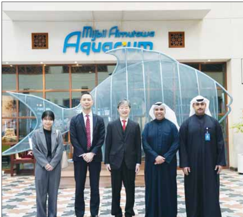
السفير الياباني مع مساعدا الياسين ومحمد السنحوسي خلال الزيارة

زار سفير اليابان لدى الكويت، كينيتشيرو موكاي المركز العلمي في أول زيارة رسمية له منذ توليه منصبه، لبحث تعزيز التعاون في المجالات العلمية والبحثية. وكان في استقباله المدير العام المهندس مسعود الياسين، ونائبه محمد السنحوسي، حيث ناقش الجانبان فرص تطوير الشراكات الدولية ودعم أهداف التنمية المستدامة، مشيداً بالتعاون السابق بين المركز والسفارة اليابانية، مثل مشروع حماية السلاحف البحرية. وتضمنت الزيارة جولة تعريفية، أطلع خلالها السفير على المعارض التفاعلية والبرامج التعليمية التي يقدمها المركز لتعزيز الابتكار ونشر الثقافة العلمية. وفي ختام الزيارة، أعرب السفير موكاي عن تقديره للجهود التي يبذلها المركز في تقديم برامج علمية مبتكرة، مؤكداً أهمية تعزيز التعاون المستقبلي بين المركز العلمي والمؤسسات اليابانية في مجالات التعليم المستدام، الابتكار، والتوعية البيئية. كما شدد الجانبان على أهمية استمرار الحوار والعمل المشترك لتحقيق الأهداف المشتركة، وتعزيز دور المركز العلمي كمؤسسة تفاعلية تدعم الابتكار والوعي البيئي.