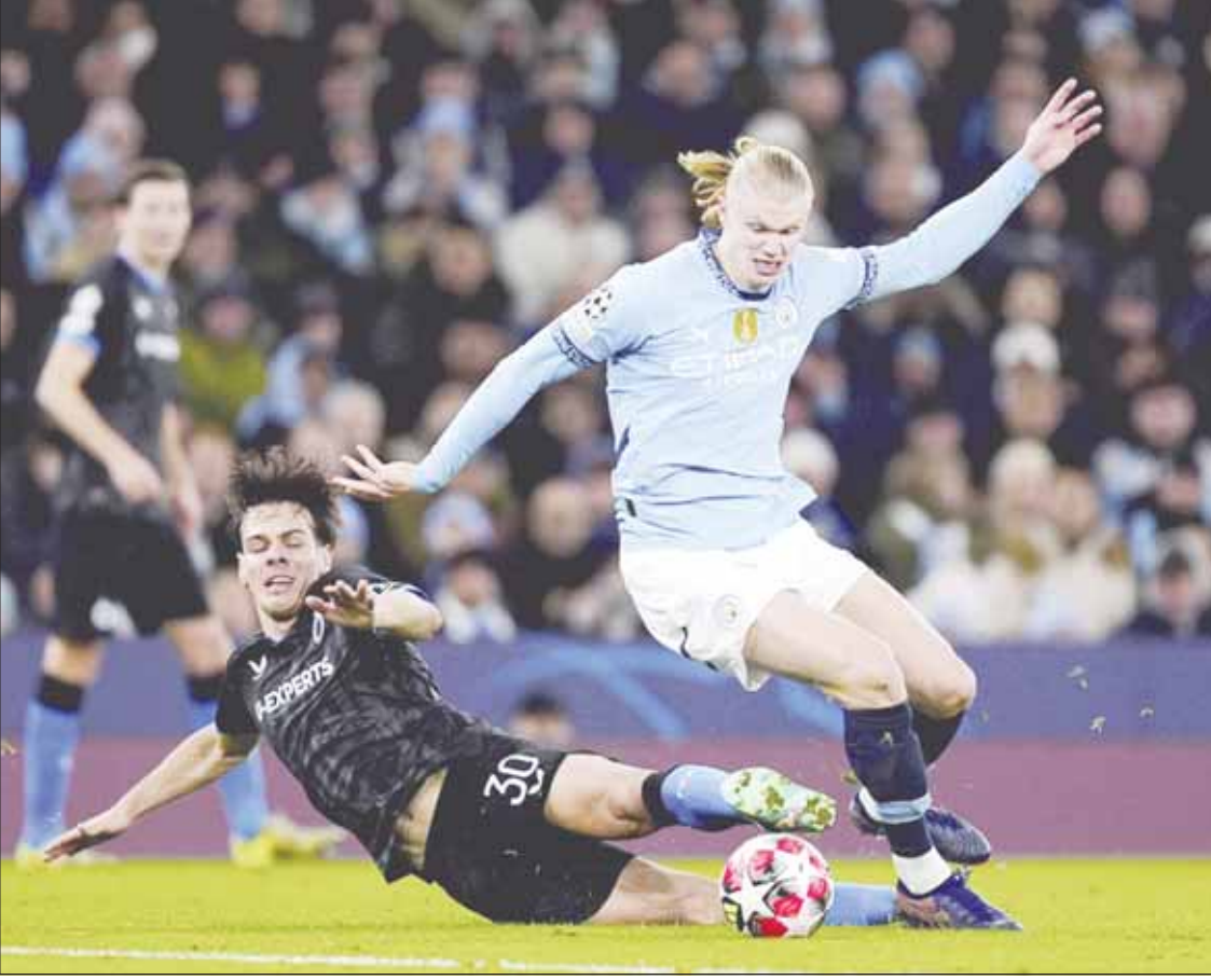
السياتين عبر كلوب بروغ بثلاثية