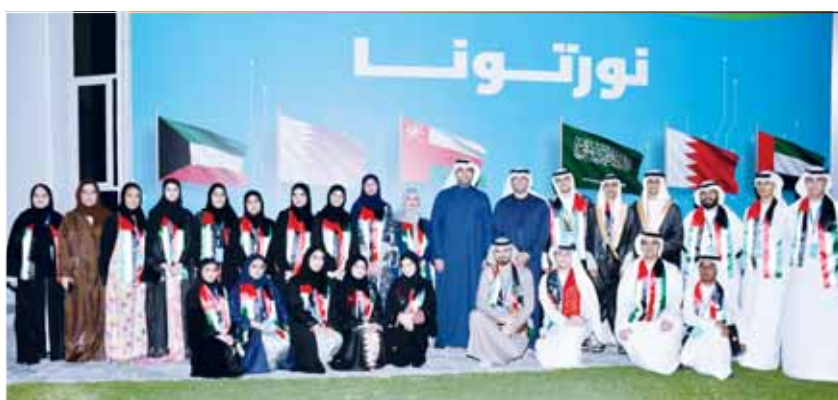
المستشار حمد المنصور مع طلاب وطالبات دولة الإمارات

اختتم مركز صباح الأحمد للموهبة والإبداع أعمال الملتقى الخليجي الثاني للطلبة الموهوبين الذي انطلق في السادس والعشرين من الشهر الجاري واستمر حتى يوم أمس، وذلك في احتفال أقيم على مسرح أكاديمية الموهبة المشتركة، برعاية وزير التربية السيد جلال الطبطبائي. استهل الحفل بالسلام الوطني ثم ألقى عريف الحفل أحمد الممود كلمة ترحيبية، وألقى الوزير الطبطبائي كلمة أكد فيها أن هذا الحدث يجمع نخبة من العقول الشابة الواعدة من دول مجلس التعاون الخليجي، في بيئة تحفّز على الإبداع وتعزز روح التعاون بين أبناء الخليج العربي، مشدداً على أهمية رعاية الموهبة والابتكار على جميع الأصعدة. وأشار