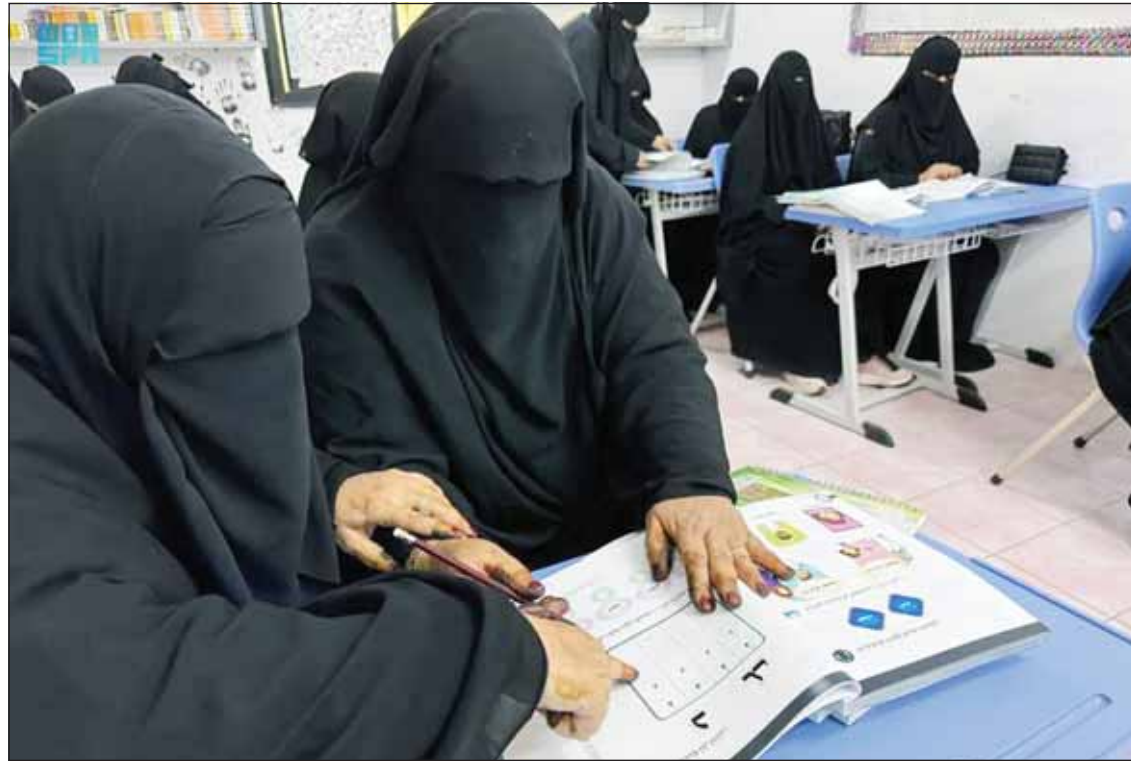
جهود متواصلة في تعليم الكبار

□ الأمية تزيد بين الذكور إلى 2,71% وتخفض بين الإناث إلى 1,90% | □ نسبة المتعلمين بين الكويتيين الذكور 99,83% والإناث 97,84%