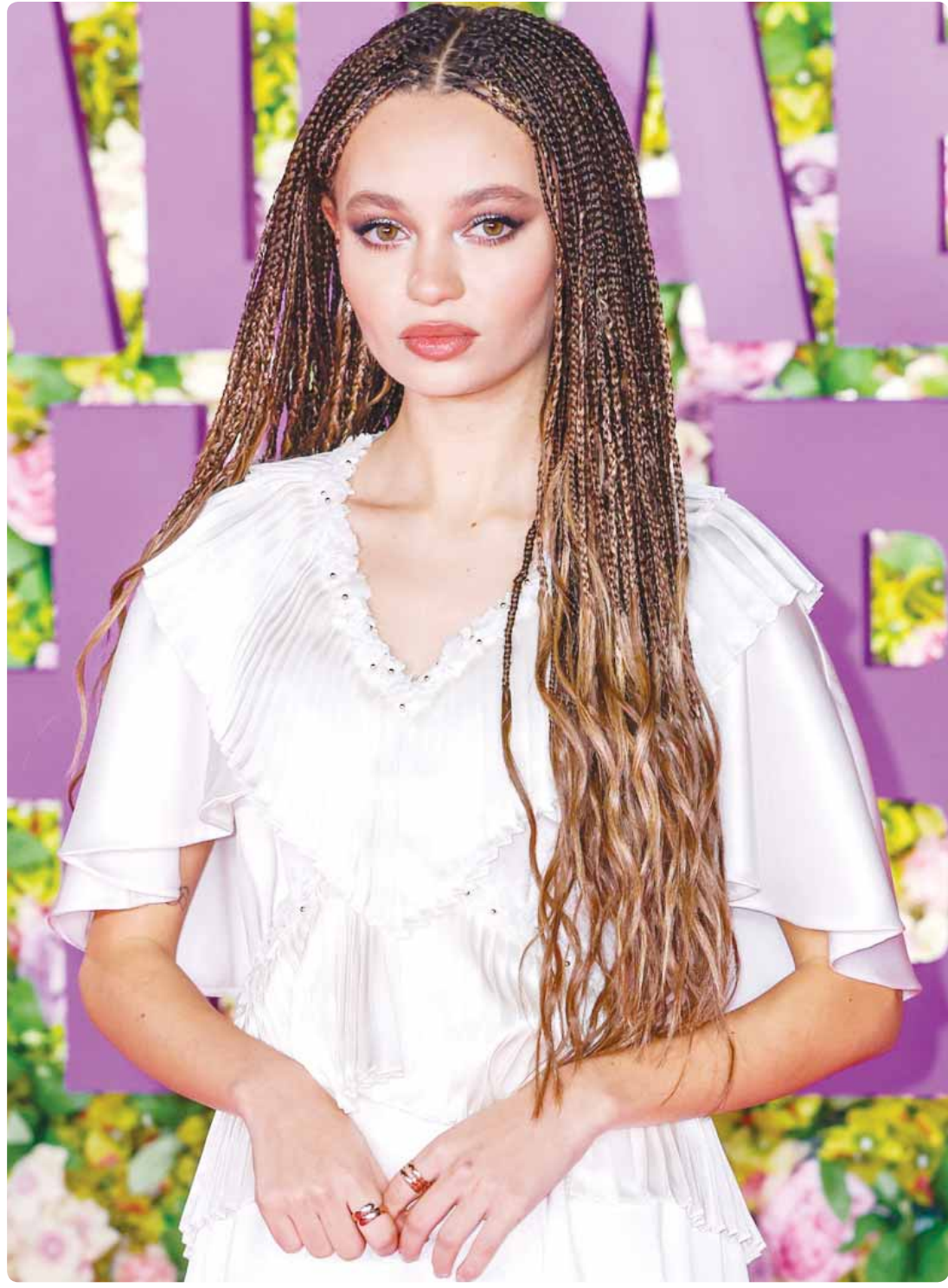
الممثلة البريطانية نيكو باركر خلال حضورها العرض الأول لفيلم "بريدجيت جونز: ماد أبوات ذا بوي" في لندن (ب)

تونس - وكالات، أعلنت السلطات الأمنية في تونس توقيف مغني راب شهير في حملة ضد عصابات متورطة في ترويج المخدرات. وأعلنت الإدارة العامة للحرس الوطني ان أجهزتها جمعت في إطامة المغني بعد تفكيك شبكة مروجية للمخدرات غرب العاصمة. وقد جرى التعرف على العنصر الرئيسي للشبكة، إذ تبين أنه مغني راب مشهور. وفيما نشرت وسائل إعلام محلية إن القضاء أصدر مذكرة توقيف ضد المغني سامح الرياحي المعروف بكنية "سامارا". وأفادت إدارة الحرس الوطني بأن عملية إيقافه كانت "بعد متاعبة دقيقة ورصد لتحركاته، حيث ألقى القبض عليه برفقة أمد أقرائه".