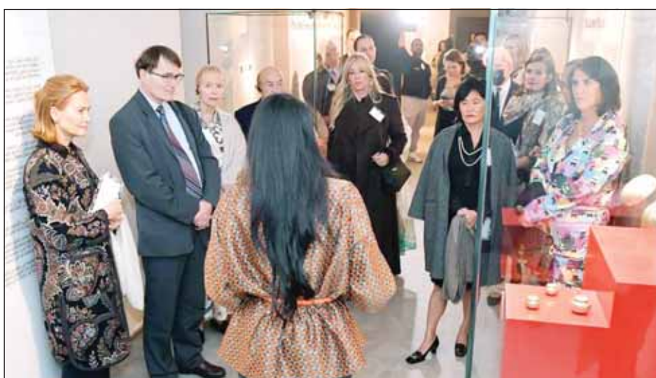
جولة في قاعة المقتنيات بالمركز الأميركاني

رحبية، تسعى للمحافظة على الآثار ولا غرض لها إلا هذا التراث الإنساني. وبعد أن يتم ترميم الأثر يتحرك لحكومات البلدان للتعاني به وصيانته، أما الجزء المشروع، وفي العراق أيضاً ترميم المتحف الذي دُمر في فترة معينة، وفي كل موقع من البلدان العربية لهم عمل، والآن في الدورة الجديدة تم إدراج غزة والمناطق التاريخية فيها التي تعرضت للدمار من مساجد، وكنائس، ومؤسسات أهلية، وستكون ضمن خطة الصندوق العالمي للآثار لترميمها" وختمت قولها "هي رسالة إنسانية لأن ما يجمعنا حب التراث والآثار والعمل من أجل عالم أجمل".