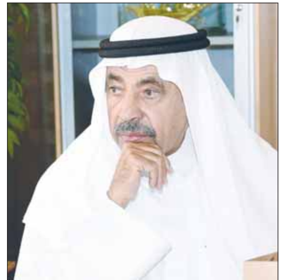
عبدالعزیز سعود البابطين

موسيقية للسفارة الكندية في مركز اليرموك الثقافي، بينما سيقام معرض القرين التشكيلي الشامل في متحف الفن الحديث، ومعرض الشباب التشكيلي سيقام في قاعة معجب الموسري بمركز عبدالعزيز حسين الثقافي في مشرف. إلى جانب زيارة ميدانية لـ"منطقة الصبية"، وملتقى ثقافي بعنوان "عالم المعرفة... منصة التصوير واستدامة الإبداع" سيستضيفه فندق سانت ريجيس، إضافة إلى حفل تكريم شخصية المهرجان المفكر السعودي الأستاذ الدكتور عبدالله الغذامي، ثم يعقبا جلسة حوارية تديرها أطف المظفر، وكل ذلك سيقام في فندق سانت ريجيس. في حين ستقام محاضرة بعنوان "نتائج مواسم التنقيب في موقع تل أبوصوان - جرش (الأردن)، تقديمها: د.ميسون عبدالغني في مركز اليرموك الثقافي. وتابعت المحمود بقولها إن المهرجان سيختتم فعالياته بعرض مسرحية "أنتم مدعوون إلى مسرح الدسمه". وفي ختام تصريحها دعت المحمود، الجمهور كافة لحضور فعاليات الدورة الـ30 من مهرجان القرين الثقافي، للاستفادة من فعالياته المقامة، والتي ستضم مجموعة متميزة من الأمسيات والمحاضرات والندوات، الثقافية والفنية.