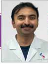
د . فيفيك . ب . س MBBS, DO, DNB طب العيون