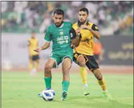
الظفيري من العربي إلى القادسية