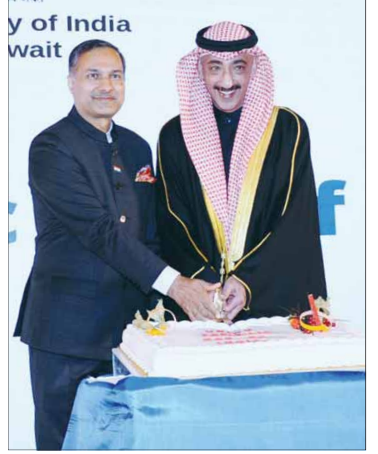
الوزير د.محمود بوشهري وسفير الهند د.أدرش سويكا يقطعان حلوى الاحتفال