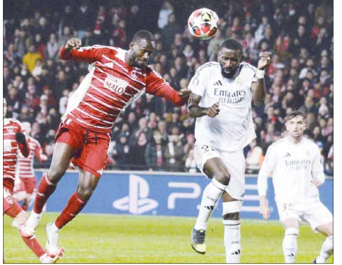
الميرينغية تغلب على بريست الفرنسي بـ"الأبطال"

تجمد رصيد بولونيا عند ست نقاط في المركز الثامن والعشرين وهو الذي تأكد خروجه من المنافسة.