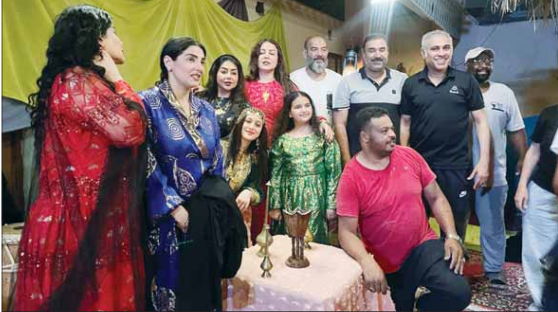
المشاركون في مسلسل "الدوامه"