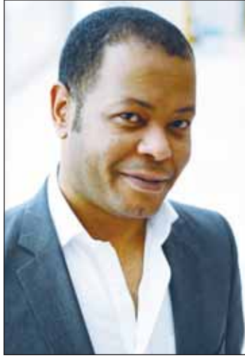
المخرج محمد دحام

الكويت خلال السنوات الماضية والمنتج المنفذ وهو ما جعل العديد من المنتجين يعتمدون عليه بشكل كبير ولم يخلقوا جسراً من العلاقات والتواصل مع القنوات الكبيرة، بل طريقة إنتاج بعض الأعمال كانت تجارية بحتة وهو ما جعل العديد من القنوات يفضل التعاون مع منتج كبير يقدم أعمالاً ذات جودة كبيرة، لكن هذه الأزمة ستكون أكبر بكثير خلال السنوات القادمة في ظل اهتمام الدراما السعودية بتطوير نفسها وتقديم موضوعات تواكب ما يحدث في المجتمع من متغيرات وفي ظل شغف العديد من المنتجين الذين قدموا أعمالاً فيها نوع من الجرأة والإبداع مثل مسلسل "رشاش - ثانوية النسيم" وغيرها وفي ظل الدعم الكبير التي تتلقاه من المؤسسات السعودية خصوصاً هيئة الترفيه والعديد من القنوات والمنصات السعودية جعلها تحقق نجاحاً تلو الآخر، لذلك بات على كل المهتمين في صناعة الدراما الكويتية البحث عن رؤية حقيقية لإعادتها الدراما إلى مكانها الطبيعي على الفضاء وهذا لن يحدث إلا من خلال إعادة الثقة في جودتها والعمل على تواجدها على المنصات الكويتية بشكل أو بآخر، والوصول إلى صيغة مقبولة مع القنوات الكويتية لأن هذه القنوات لا تمتلك سوقاً إعلانياً كبيراً، والأهم هو تكوين كيان تجاري يعمل على تسويقها ودعمها ويدعو المؤسسات الاقتصادية في الكويت مثل البنوك والشركات إلى حوار مفتوح ليكون هناك منافع وتعاون مشترك، لكن إذا استمرت هذه العشوائية سيكون الأمر أكثر تعقيداً في رمضان 2026.