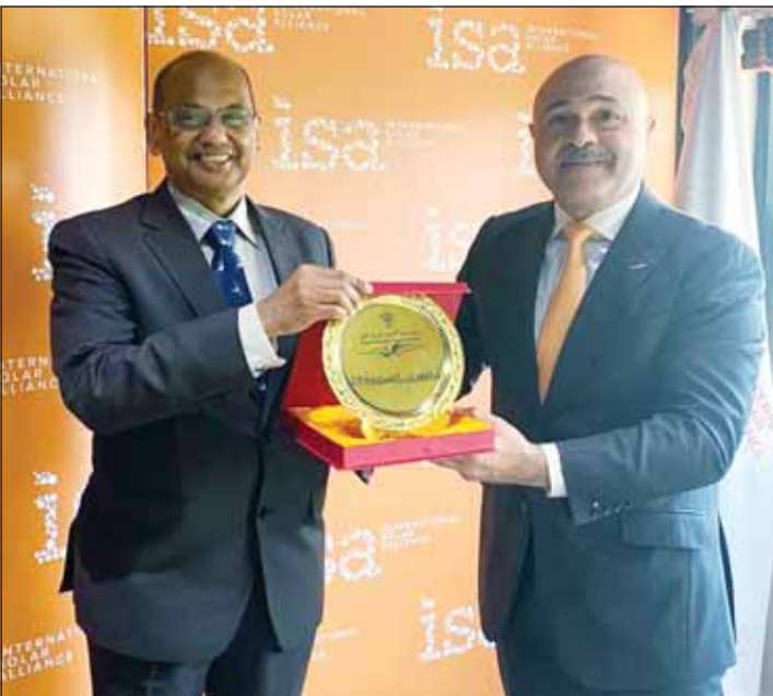
السفير مشعل الشمالي والأمين العام للتحالف الدولي للطاقة الشمسية أجاي ماثور

ماثور: انضمام الكويت للتحالف يعزز من مكانتها الدولية ونتطلع لتعاون أمثل