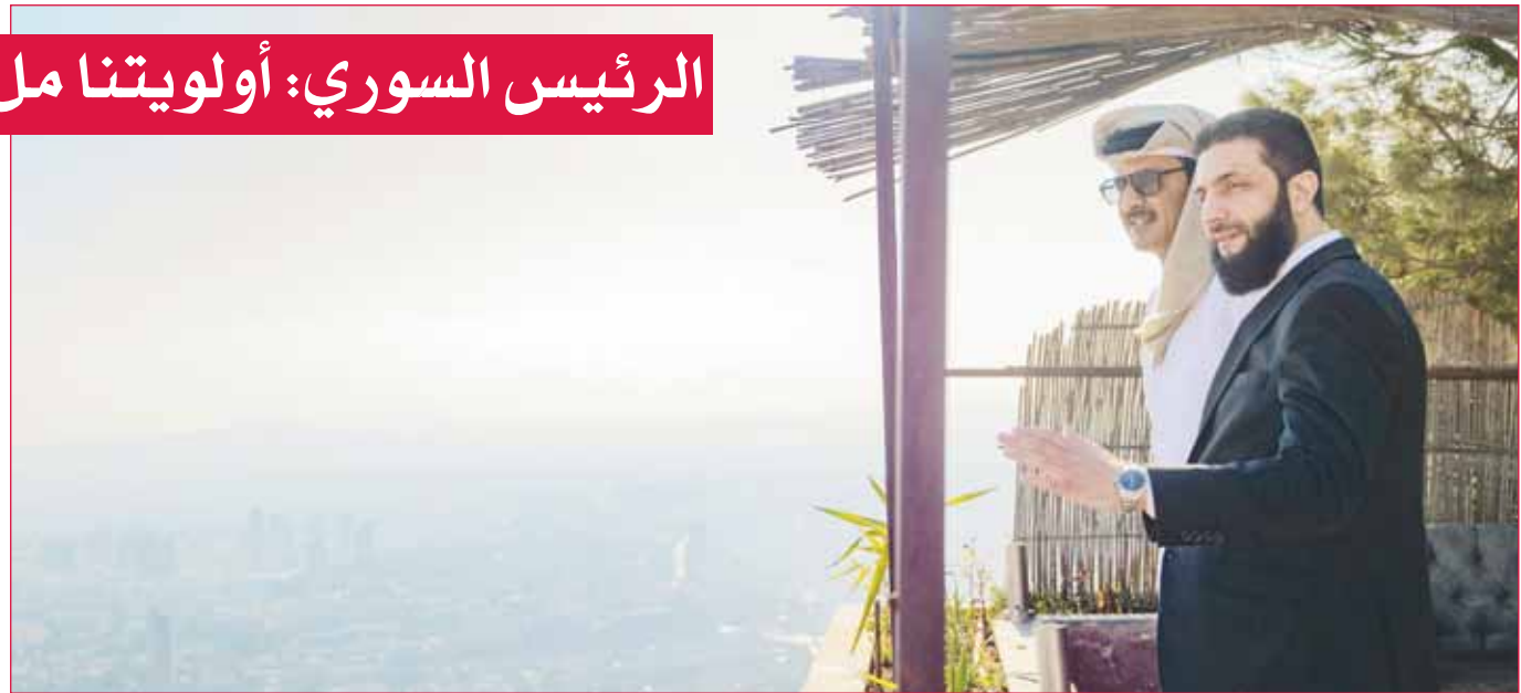
أمير قطر الشيخ تميم بن حمد والرئيس السوري أحمد الشرع في قصر الشعب

دمشق، الدوحة، عواصم - وكالات، في زيارة هي الأولى لرئيس عربي أو دولي إلى سورية عقب سقوط نظام الرئيس المخلوع بشار الأسد وتسلم أحمد الشرع رئاسة سورية لمرحلة انتقالية، شدد أمير قطر الشيخ تميم بن حمد على أن بلاده ستواصل وقوفها مع الشعب السوري لتحقيق أهدافه التي ناضل من أجلها وصولاً إلى دولة تسودها الوحدة والعدالة والحرية وينعم شعبها بالعيش الكريم". (راجع ص10) وأكد الشيخ تميم بن حمد خلال محادثات مع الشرع في قصر الشعب بدمشق، الحاجة الماسة إلى تشكيل حكومة تمثل جميع أطراف الشعب السوري لتوطيد الاستقرار والمضي قدماً في مشاريع إعادة الإعمار والتنمية والازدهار. وقال الديوان الأميري القطري إن الشيخ تميم هنا الشرع بانتصار الثورة السورية واختياره رئيساً النتيجة 02