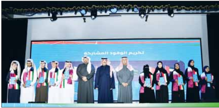
الوزير الطبطبائي والمضيبي والديحاني يكرمون طلبة دولة قطر