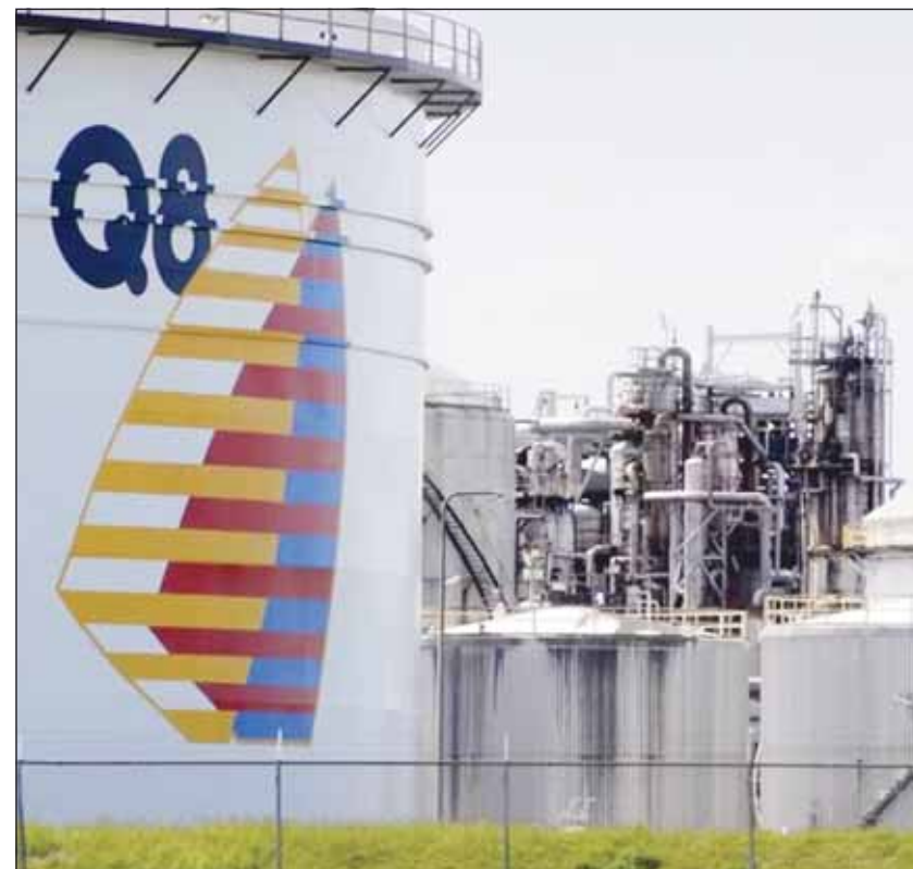
خزانات شركة البترول العالمية في القارة الأوروبية

واستشهد على ذلك بأن اليابان المصنعة لمعظم السيارات في العالم تستهدف طرح أكثر من 800 ألف سيارة تعمل بالهيدروجين على طرقاتها بحلول عام 2030 فضلاً عن أن ألمانيا واليابان وكوريا الجنوبية تعد من أهم أسواق السيارات العاملة بخلايا وقود الهيدروجين في العالم.