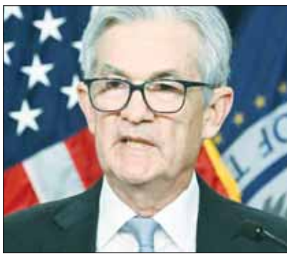
رئيس مجلس الاحتياطي الفيدرالي جيروم باول

ولم يعط سوى القليل من الإشارات بشأن التخفيضات التالية في تكاليف الاقتراض وسط تراجع معدل البطالة واستمرار النمو الاقتصادي وارتفاع التضخم بوتيرة أعلى من المعدل المستهدف بنحو نصف نقطة مئوية أو أكثر.