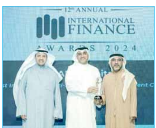
"ABK Capital" تحصد جائزة "الأكثر ابتكاراً في إدارة الصناديق متعددة الأصول"

الحكومة أنفقت 13,7 مليار دولار في 2022 لتوفير الكهرباء بما يعادل 3200 دولار لكل فرد