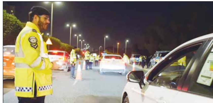
جانب من الحملة الأمنية

نفذت قطاعات الإدارة العامة للمرور ودوريات النجدة والامن الخاص حملة أمنية في منطقة صباح السالم، أسفرت عن حجز 19 مركبة وتحرير 2315 مخالفة مرورية وضبط 8 مخالفين لقانون الإقامة. جاءت الحملة بناء على توجيهات وتعليمات النائب الأول لرئيس مجلس الوزراء وزير الدفاع ووزير الداخلية الشيخ فهد اليوسف، واستمراراً للحملة الأمنية المتواصلة، وأسفرت أيضاً عن إحالة عدد من ضباط الأحدث لقيامته مركبة دون رخصة، فضلاً عن إلقاء القبض على 6 أشخاص.