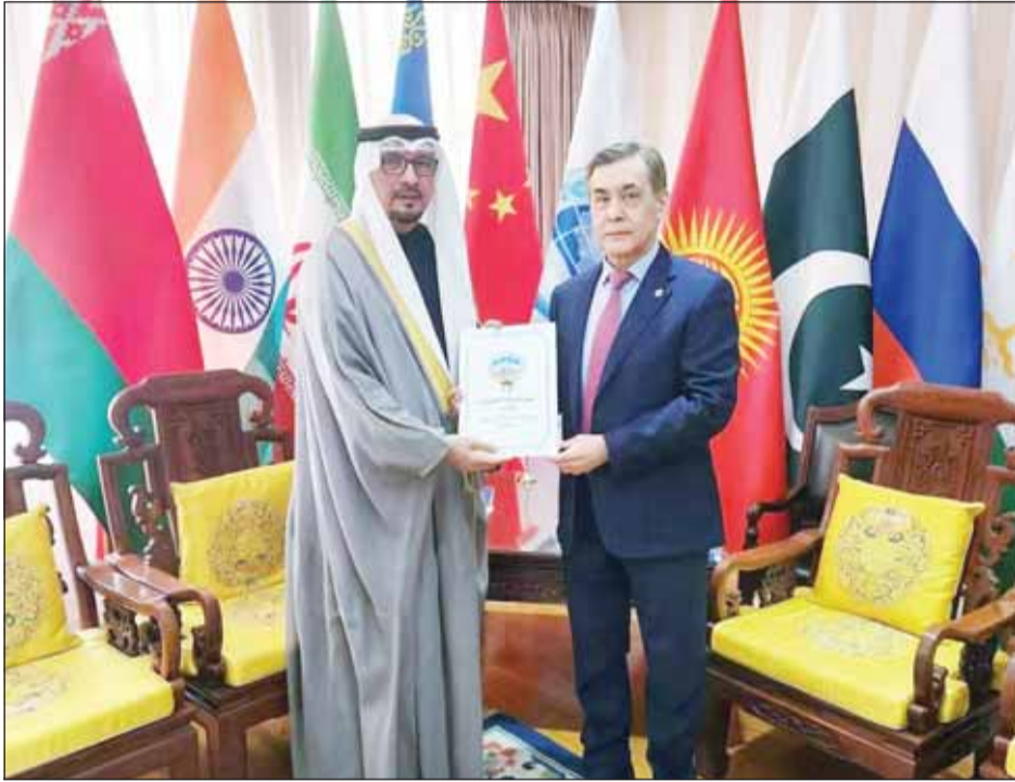
الوزير جاسم الناجم يسلم رسالة وزير الخارجية إلى أمين منظمة شنغهاي

يرميكيبايف: نقدير الكويت ودورها الفاعل إقليمياً ودولياً ونأمل مزيداً من التعاون المثمر