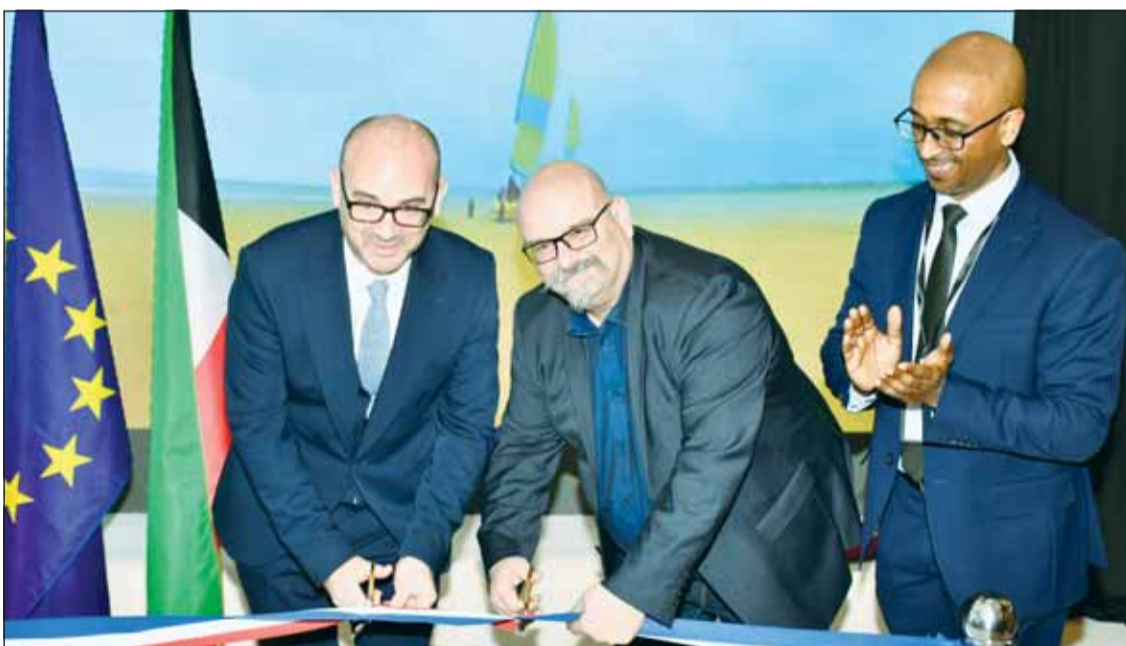
السفير غوفان يفتتح مركز كاباغو للتأشيرات بعد تجديده

□ ندرس 150 طلباً للتأشيرات يومياً والعدد يتضاعف إلى 300 طلب في الصيف □ السفارة الفرنسية الوجهة الأولى لراغبي الحصول على تأشيرة "شنغن" من الكويت □ 99.5% من طلبات الكويتيين للحصول على التأشيرات في 2024 تمت الموافقة عليها