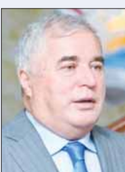
السفير د.زبيدالله زبيدوف

بنود اللجنة، موضحاً أن العلاقات السياسية بين البلدين ممتازة، وأن هناك تنسيقاً بينهما في المحافل الدولية والإقليمية إلا أن العلاقات التجارية والاقتصادية بينهما لا ترتقي للمستوى المطلوب، فهناك رغبة مشتركة لدى الجانبين لتطويرها ولفت إلى أن الزيارة التي قام بها الرئيس إمام علي رحمان إلى الكويت نوفمبر الماضي ناقشت إمكانية تطوير التعاون الاقتصادي والتجاري بين البلدين.