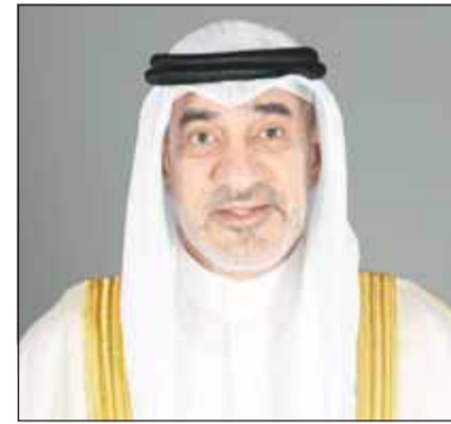
الشيخ فهد الجوسف

غادر النائب الأول لرئيس مجلس الوزراء ووزير الدفاع والشيخ فهد الجوسف، الجلاء، أمس، والوفد الرسمي المرافق له، متوجهاً إلى جمهورية مصر العربية الشقيقة في مستهل جولة تشمل كلا من المملكة الأردنية الهاشمية الشقيقة وسلطنة عمان الشقيقة.