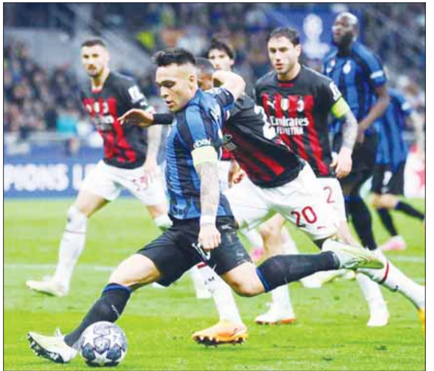
ديربي ميلانو بين الروسونيري والنيراتوري

يعتقد خافيير تيباس رئيس رابطة الدوري الإسباني لكرة القدم أن ريال مدريد يريد تدمير كرة القدم بسبب رغبة النادي في استكمال مشروع دوري السوبر الأوروبي، مضيفاً أنه نادى على موافقته بشأن تغيير نظام دوري أبطال أوروبا.