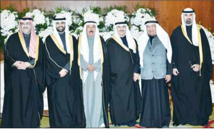
الشيخ مبارك الجابر والشيخ حمد مبارك الجابر وقتيبة الغانم يهنئون

أفراح الصباح بحضور ومباركة سمو ولي العهد الشيخ صباح الخالد، وسمو الشيخ ناصر المحمد، وسمو رئيس مجلس الوزراء الشيخ أحمد العبدالله، امتقل الشيخ خالد العبدالله الصباح بزفاف نجله الشيخ عبدالله علي كريمة الشيخ عبدالله سالم العلي في فندق الجميرا، بحضور عدد من الشخصيات الرسمية والديبلوماسية، وجمع من الأهل والأصدقاء الذين قدموا التهاني للمعرس، متمنين له حياة سعيدة... بالمبارك.