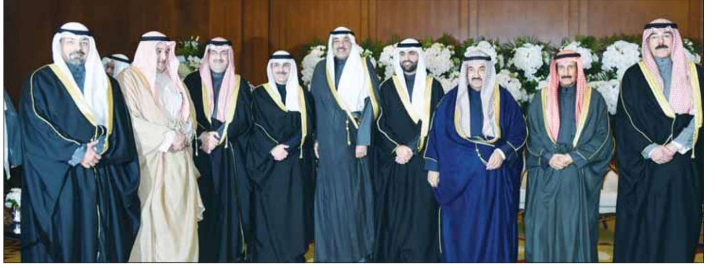
سمو ولي العهد الشيخ صباح الخالد وسمو الشيخ ناصر المحمد والشيخوخ د. إبراهيم العيج ومحمد الخالد ودعيج جابر العلي و يوسف العبدالله وخالد العبدالله وعبدالله سالم العلي