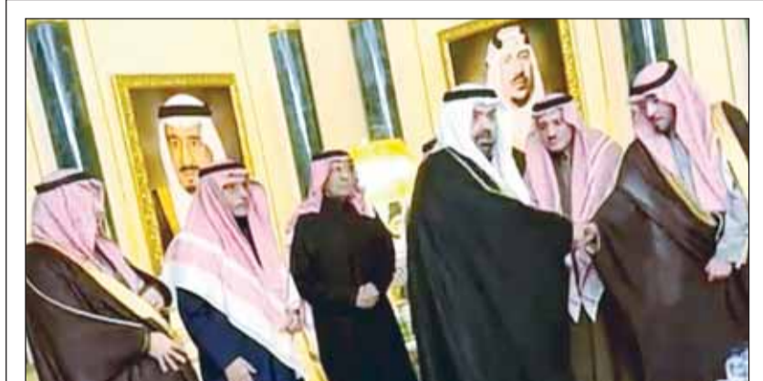
خالد البدر معزياً بالأمير محمد بن فهد: وداعاً حبيب الكويتيين