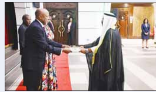
السفير سالم الشبلي يقدم أوراق اعتماده إلى رئيس ناميبيا

قدم سفير دولة الكويت لدى جنوب إفريقيا سالم الشبلي أوراق اعتماده سفيراً فوق العادة ومفوضاً لدولة الكويت غير مقيم لدى جمهورية ناميبيا إلى رئيس البلاد نانغولو مجومبا.