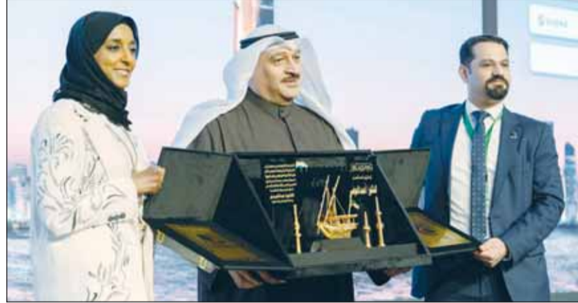
رابطة الجهاز الهضمي تكرم وزير الصحة د. أحمد العوضي

أكد وزير الصحة د. أحمد العوضي أن الكويت حققت خلال السنوات الماضية قفزات نوعية في مجال الجهاز الهضمي والكبد بفضل الجهود المخلصة للكوادر الوطنية والتعاون المثمر مع المؤسسات العالمية، التي أثمرت عن إجراء وحدة زراعة الكبد في مستشفى جابر الأحمَد أكثر من 123 عملية زراعة كبد لمرضى كويتيين خلال الأعوام القليلة الماضية بالتنسيق مع مستشفيات عالمية. وأشاد العوضي - في كلمته خلال افتتاح المؤتمر الثالث لرابطة الجهاز الهضمي والكبد أول من أمس - بإنجازات مستشفيات ومراكز وزارة الصحة المتخصصة في هذا المجال، لافتاً إلى تميز قسم الجهاز الهضمي بمستشفى الجبراء في إجراء عمليات دقيقة لإزالة أورام القولون بالمنظار دون الحاجة إلى تدخل جراحي، ونجاحه في إجراء نحو 2000 عملية منظار السونار دقيقة و 1200 حالة باستخدام منظار السونار خلال عام 2024. وأشار إلى إنجازات مركز هيا الحبيب للجهاز الهضمي بمستشفى مبارك الكبير الذي أصبح مركزاً للبحوث والدراسات حيث أجرى أكثر من 30 بحثاً علمياً خلال السنوات الخمس الماضية تم نشرها في مؤتمرات ومجلات علمية مرموقة، وكذلك مركز ثنيان الغانم للجهاز الهضمي بمستشفى الأميري الذي حصل على اعتماد دولي كأول مركز تدريبي في الشرق الأوسط من المنظمة العالمية لسونار الأمعاء (IBUS)