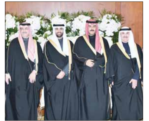
الشيخ طلال مشعل الأحمد يبارك