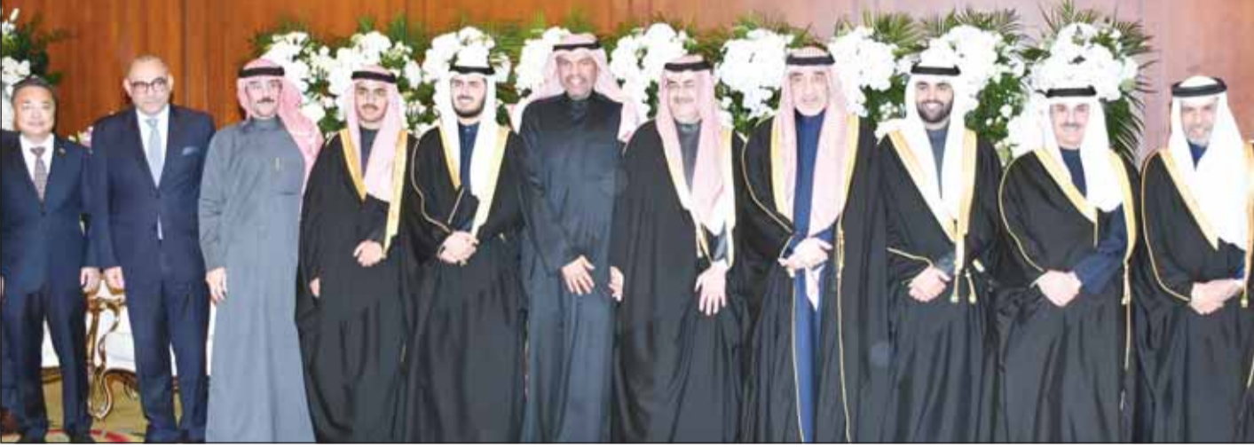
الشيخ فهد اليوسف والوزير عبدالله الجيا وسفراء قطر علي آل محمود والعراق المنهل الصافي والصين تشانغ جيانوي ومبارك الجسار يهنئون