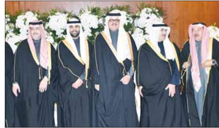
الشيخ د. سالم الجابر والسفير السعودي الأمير سلطان بن سعد يقدمان التهاني