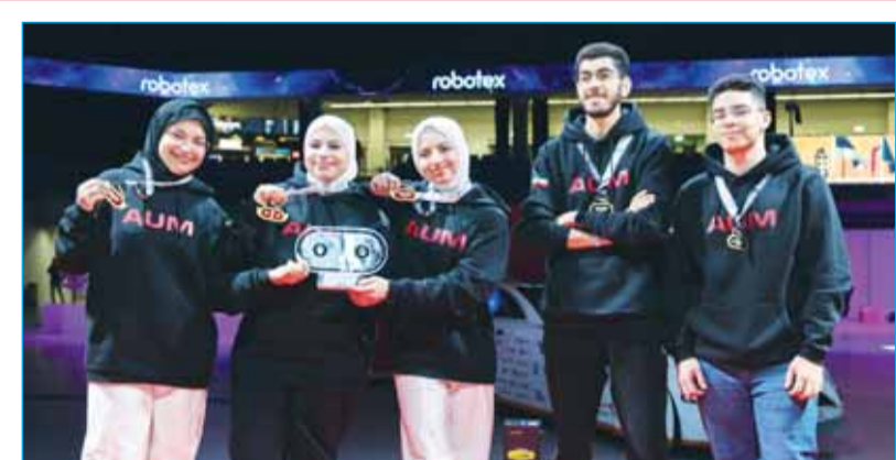
طلبة AUM يحرزون المركز الأول في مسابقة روبوتكس العالمية في إستونيا