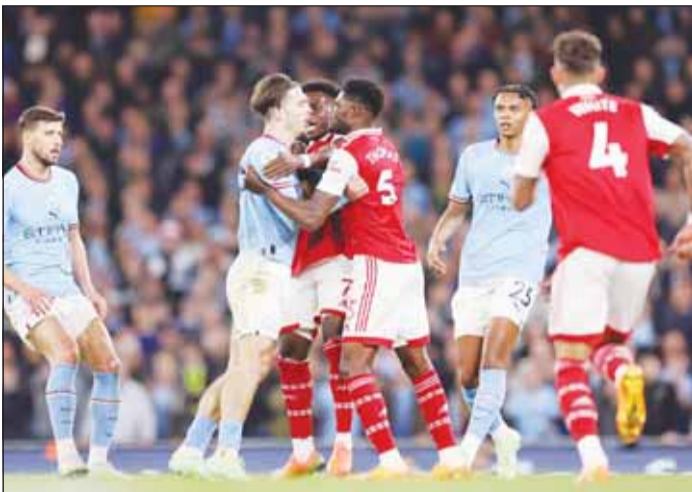
مواجهات صعبة بين الأرسنال ومانشستر سيتي

على ملعبه، مما يزيد من صعوبة المهمة بالنسبة لسيتي. يسمى فريق المدرب ميكيل أرتيتا للحفاظ على آماله في المنافسة للقب، حيث لا يمكنه تحمل إهمار من جانبه، لم يتعرض أرسنال للهزيمة على أرضه في آخر 14 مباراة بالدوري، وكان آخر سقوط له في أبريل الماضي أمام أستون فيلا بنتيجة 2-0. هذه الإحصائيات تعكس قوة أرسنال ضد إيفرتون.