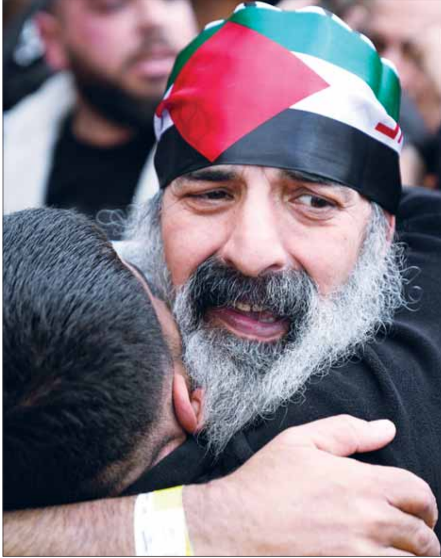
أسير فلسطيني محرر يعصب رأسه بعلم فلسطين في مدينة رام الله بالضفة الغربية

وأكد السيسي أهمية التوصل إلى سلام دائم في المنطقة، مشيراً إلى أن المجتمع الدولي يعول على قدرة ترامب على التوصل إلى اتفاق سلام تاريخي ينهي حالة الصراع القائمة منذ عقود، مشدداً على ضرورة توشين عملية سلام تفضي إلى حل دائم، وتبادل الزعيمات الدعوات، حيث وجه السيسي دعوة لترامب لزيارة مصر، كما دعا ترامب السيسي لزيارة واشنطن ولقائه في البيت الأبيض، واتفقا على أهمية استمرار التواصل والتسيق والتعاون بين البلدين، وتكثيف الاجتماعات بين المسؤولين من الجانبين لمواصلة دفع العلاقات الثنائية ودراسة سبل المضي قدماً في معالجة الموضوعات المختلفة، مما يعكس قوة وعمق العلاقات الاستراتيجية.