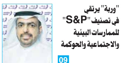
"وربة" يرتقي في تصنيف "S&P" للممارسات البيئية والاجتماعية والحوكمة