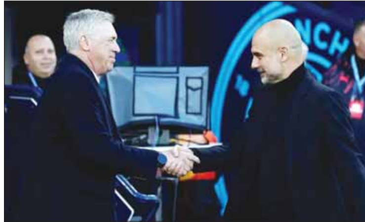
غوارديولا وانشيلوته يتواجهان مجدداً في "الأبطال"

لشبكة البرتغالي ضد بروسيَا دورتموند الألماني، وستلعب الإسكتلندي ضد بايرن ميونخ الألماني، ويوفنتوس الإيطالي ضد آيندهوفن الهولندي، وفينورد الهولندي ضد ميلان الإيطالي، وبريست الفرنسي ضد باريس سان جيرمان الفرنسي، وموناكو الفرنسي ضد بنفيكا البرتغالي.