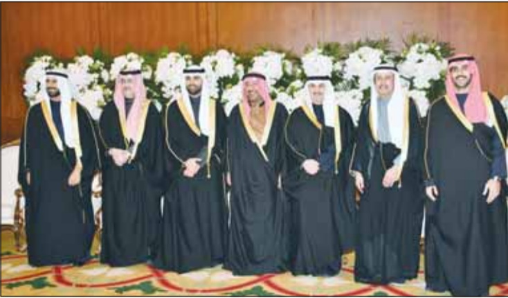
السفير الشيخ عزام الصباح والشيخ فهد الجابر والشيخ مبارك والشيخ ناصر فهد الجابر يهنئون