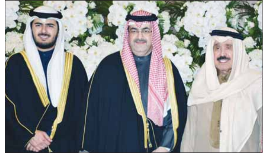
رئيس التحرير العميد أحمد الجارالله قدم التهاني