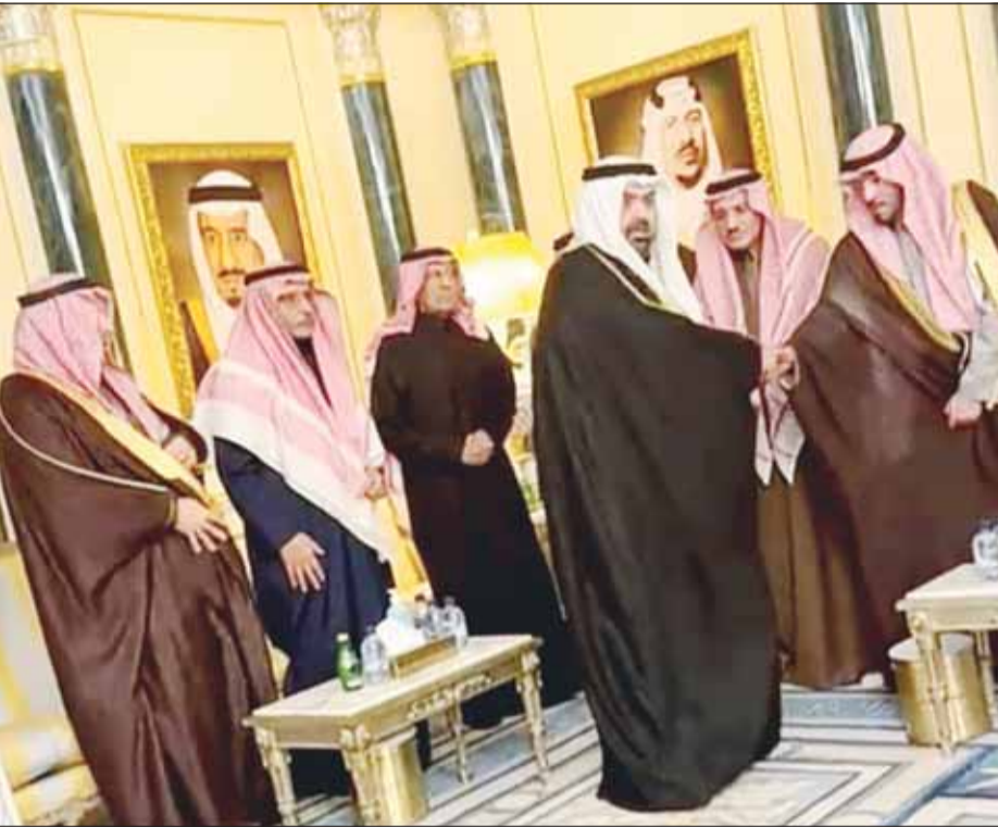
الشيخ خالد البدر يقدم واجب العزاء بوفاته الأمير محمد بن فهد

زار الشيخ خالد البدر المحمد الأحمدي الصباح، رئيس الاتحاديين الكويتي والأسوي للألعاب المائية، المملكة العربية السعودية لتقديم واجب العزاء بوفاته المغفور له بإذن الله الأمير محمد بن فهد بن عبدالعزيز آل سعود. وأعرب البدر عن بالغ حزنه لرحيل الأمير محمد بن فهد، مشيراً إلى أن المملكة فقدت ابناً باراً من أبنائها، ورجلاً من أصحاب المواقف المشرفة، ورمزاً عربياً وإسلامياً بارزاً.