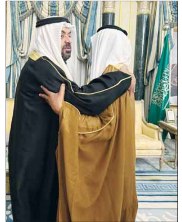
الشيخ خالد البدر معزياً

واختتم البدر حديثه قائلاً: "في بعض الأيمان تضيع الكلمات التي يمكن أن تعبر بها عن مشاعر الزمن لفقدان شخص عزيز وفي مخلص لوطنه وأمتة، كصاحب السمو الملكي الأمير محمد بن فهد بن عبدالعزيز آل سعود، لكن لا يتبقى لنا سوى الدعاء والتضرع إلى الله سبحانه وتعالى أن يتفمه بواسع رحمته، ويسكنه فسيح جناته، ويولم أهله وذويه الصبر والسلوان".