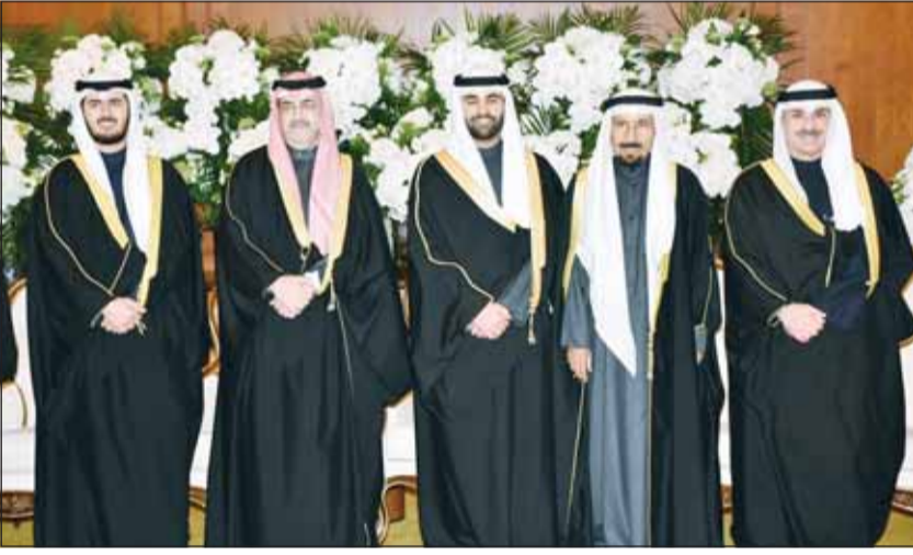
الشيخ علي الجارم المعرس ووالده ووالد العروس