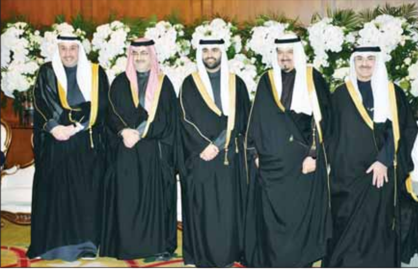
سمو الشيخ أحمد عبدالله والشيخ فيصل الحمود يقدمان التهاني