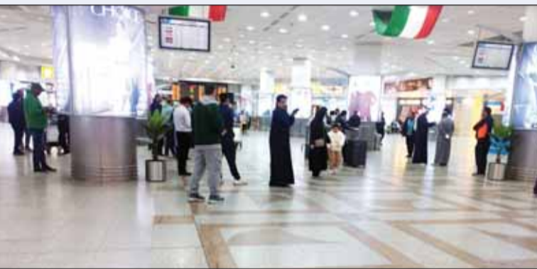
سهولة ويسر في حركة وصول المسافرين