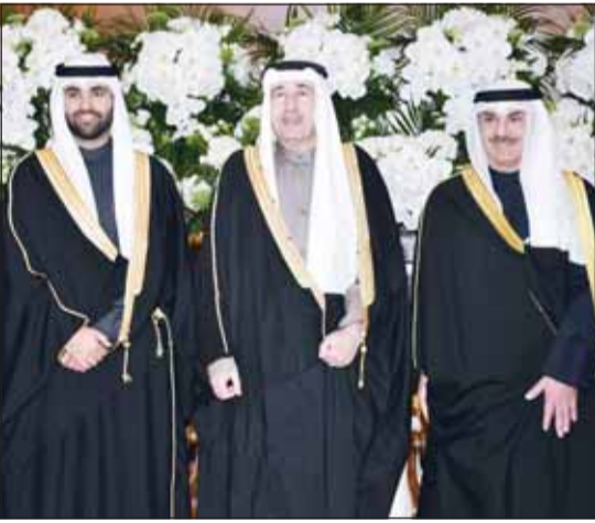
تهنئة من الشيخ مبارك الحمود