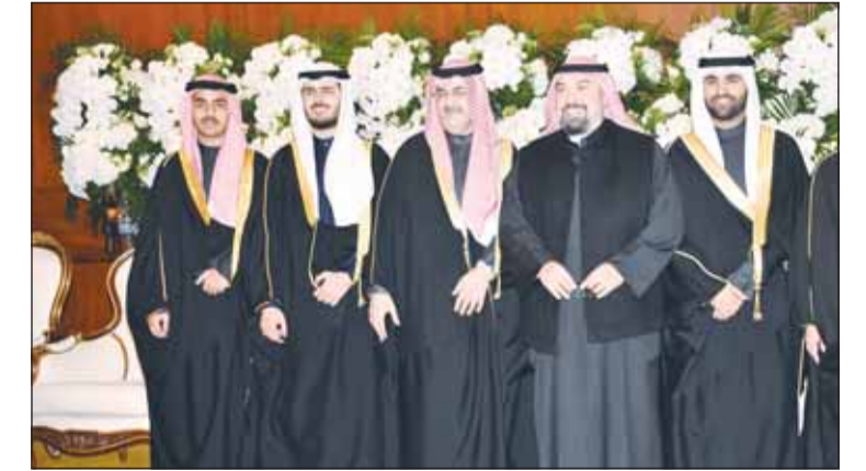
الشيخ طلال الفهد يهنئ