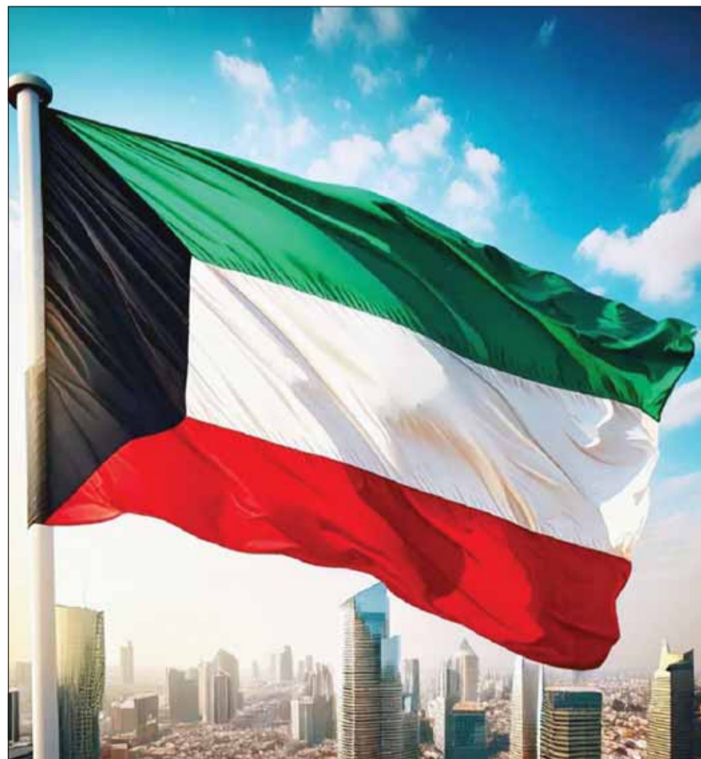
الكويت تحتفل اليوم بمراسم رفع العلم

العهد الشيخ صباح الخالد، وعلم الكويت في مشاهد تعكس البهجة والفخر بهاتين المناسبتين. وتستحضر دولة الكويت في هذه المناسبات إنجازات البلاد في كل المجالات وعلى الصعيد المحلي والإقليمية والدولية التي أعلت مكانتها بين الدول الشقيقة والصديقة بحكمة قيادتها الرشيدة. وفي هذه الأجواء الوطنية تستذكر الكويت عيدها الوطني وهو اليوم الذي استقلت فيه ومضت بخطى ثابتة لتضع بصمتها في المحافل الدولية وتقيم العلاقات الوثيقة مع الدول العربية والصديقة وتسعى إلى تحقيق الأمن والسلام بفضل سياستها الرائدة في التعامل مع مختلف القضايا الإقليمية والدولية. كما تستذكر الكويت في ذكرى تحريرها الـ 34 يوم التحرير المجيد الذي تحررت فيه من براثن العدوان الغاشم كما تستذكر شهداءها الأبرار الذين ضربوا أروع الأمثلة في الجدل والفداء وسطوا تضحياتهم في سبيل تحرير البلاد من الغزاة المعتمدين.