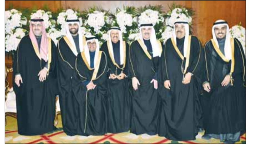
الشيخ دعيج الخليفة والشيخ فيصل المالك يهنئان

أفراح الصباح بحضور ومباركة سمو ولي العهد الشيخ صباح الخالد، وسمو الشيخ ناصر المحمد، وسمو رئيس مجلس الوزراء الشيخ أحمد العبدالله، امتقل الشيخ خالد العبدالله الصباح بزفاف نجله الشيخ عبدالله علي كريمة الشيخ عبدالله سالم العلي في فندق الجميرا، بحضور عدد من الشخصيات الرسمية والديبلوماسية، وجمع من الأهل والأصدقاء الذين قدموا التهاني للمعرس، متمنين له حياة سعيدة... بالمبارك.