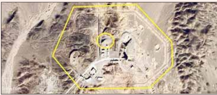
صورة نشرتها المقاومة الإيرانية لمنشأة نووية سرية تحت الأرض (مجاهدي خلق)