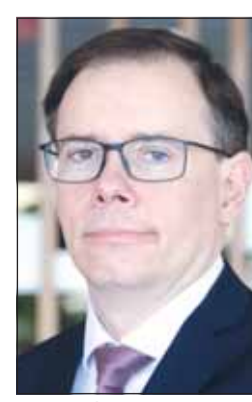
السفير رودريغو غابيش

الغربية الكويتية وغرفة تجارة وصناعة الكويت على شراكتها مع السفارة في تنظيم البعثة، وأكد ثقته أن الزيارة ستسهم في زيادة وتنوع التجارة والاستثمار بين البرازيل والكويت، بما يعود بالنفع على البلدين. وذكر أن غرفة التجارة العربية البرازيلية التي يقع مقرها في ساو باولو بالبرازيل، تعمل منذ أكثر من 72 عاما بهدف ربط البرازيليين بالعرب لتعزيز التنمية الاقتصادية والاجتماعية والثقافية، ولعبت على مر السنين دورا أساسيا في تعزيز العلاقة بين هذين الشعبين، وهي عضو في اتحاد الغرف العربية. وأشار إلى إجمالي التجارة الثنائية بين الكويت والبرازيل بلغ 985 مليون دولار في عام 2024، موضحاً أن صادرات البرازيل التي بلغت قيمتها أكثر من 404 ملايين دولار شملت الدواجن، الأنابيب المعدنية، الحزة، اللحوم الباردة، والقهوة، بينما شملت صادرات الكويت التي تجاوزت قيمتها 580 مليون دولار المنتجات النفطية والكبريت.