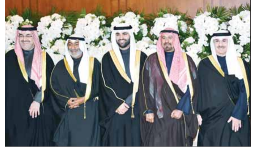
سمو الشيخ د. محمد الصباح والشيخ عبدالله سالم الصباح يباركان