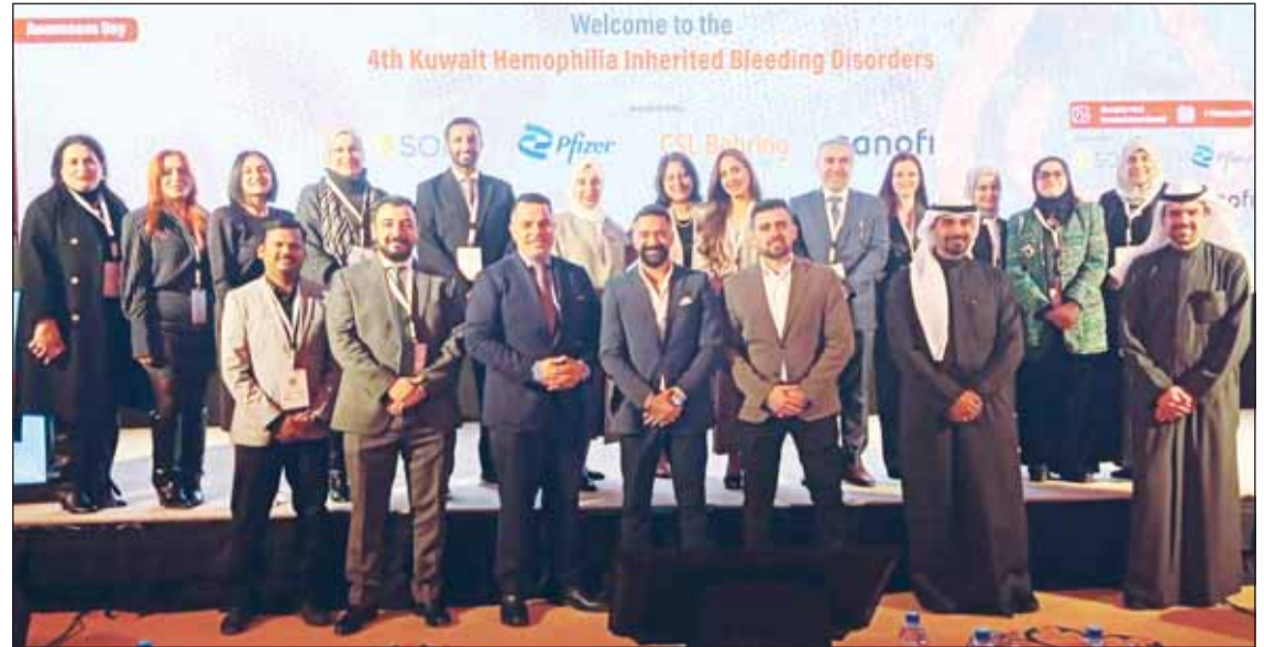
المشاركون في فعاليات اليوم التوعوي الرابع للتوعية بالهيموفيليا وأمراض النزف