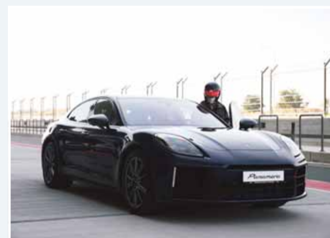
سيارة تاكاميرا الجديدة داخل الحلبة