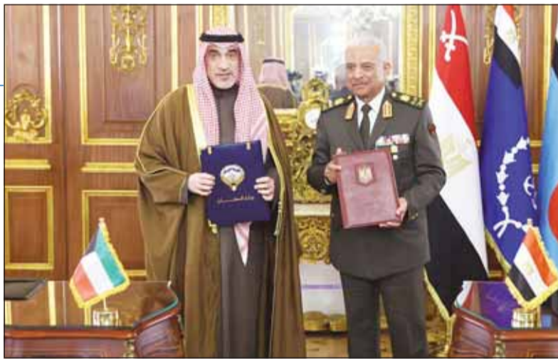
الشيخ فهد اليوسف ونظيره المصري يتبادلان نسخ الاتفاقية

□ تطوير القدرات الدفاعية وآليات تبادل المعلومات لتحسين الأمن الوطني والاستقرار بالمنطقة