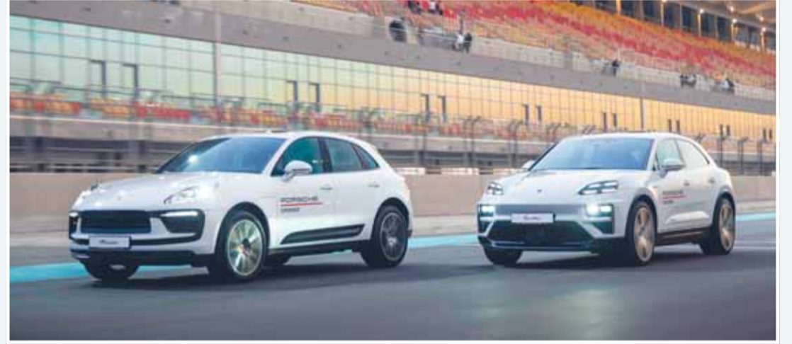
انسيابية في أداء سيارات بورشه