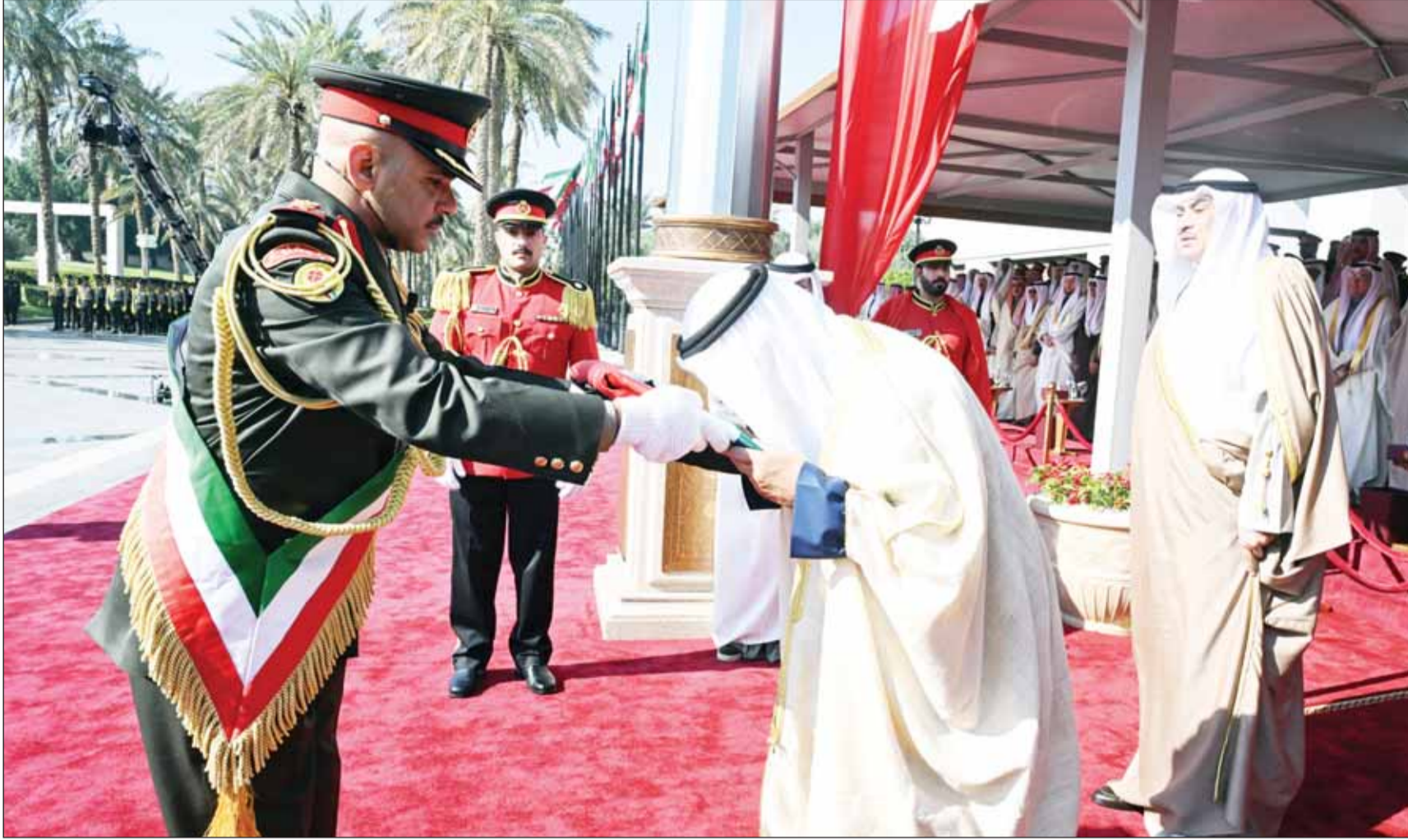
سمو أمير البلاد الشيخ مشعل الأحمد يطبع قبلة علم علم البلاد