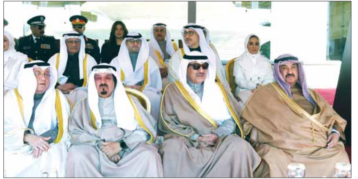
سمو ولي العهد الشيخ صباح الخالد متوسلاً سمو الشيخ ناصر المحمد وسمو الشيخ أحمد العبدالله والمستشار د. عادل بورسلي

بِسْمِ اللَّهِ الرَّحْمَنِ الرَّحِيمِ يَا أَيُّهَا النَّاسُ اتَّقُوا اللَّهَ لَعَلَّكُمْ تُرْحَمُونَ صَدَقَ اللَّهُ الْعَطَاءُ