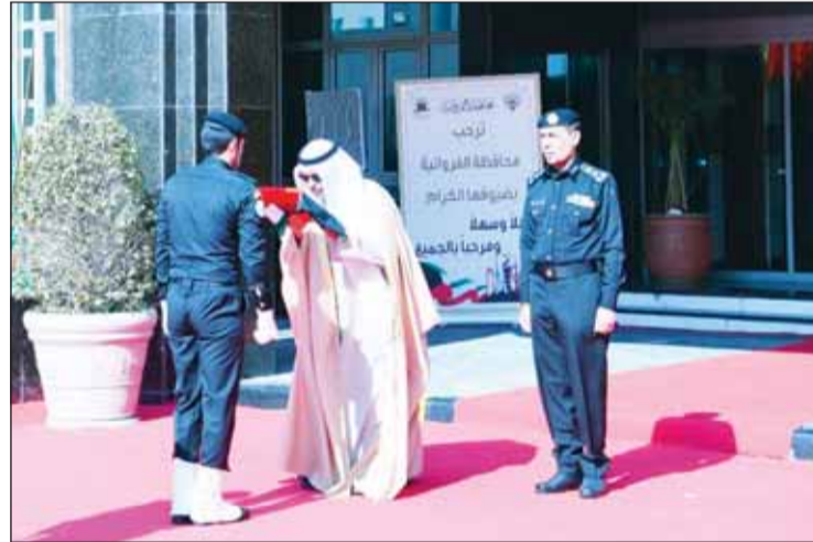
محافظ الفروانية الشيخ عذبة الناصر يقبل العلم

□ محافظ الأحمدية: تجديد الولاء والانتماء للقيادة والوطن