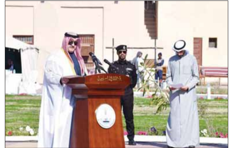
محافظ العاصمة الشيخ عبدالله العليبي يقبل كلمته

□ عذبة الناصر: المناسبة تعكس تاريخ دولة الكويت العظيم