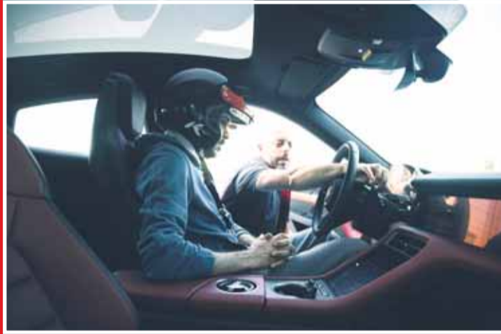
مدرب معتمد من بورشه يمدد شرح ميزات السيارة للمشاركين

طرحت "مكان" الكهربائية تجربة مستقبلية لسيارات الدفع الرباعي مع ميزات شملت: ● مدى طويل: بطاريات متطورة تتيح التنقل لمسافات طويلة بسهولة. ● أداء رياضي: عزم فوري وتحكم استثنائي يوقع باسم بورشه. ● شحن سريع: يقلل من وقت التوقف مع حلول مبتكرة مما يعزز الراحة لعملاء بورشه.