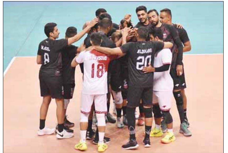
طائرة نادي النصر تحسركم في البحرين ابتداء من الغد