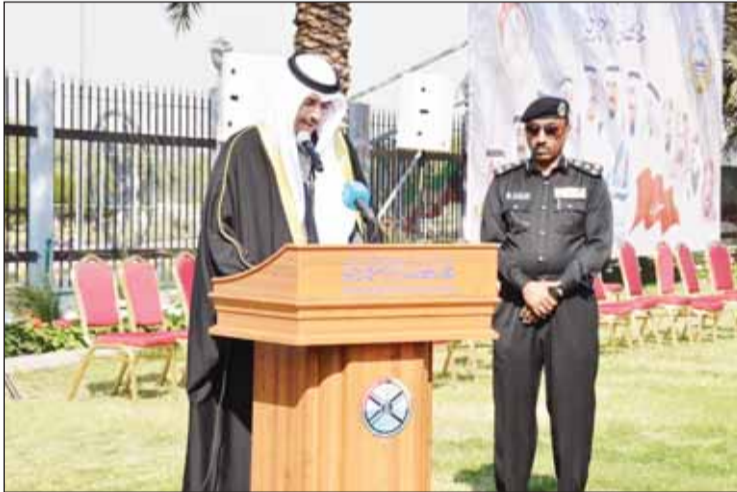
محافظ الأحمدية الشيخ حمود الجابر

□ محافظ الأحمدية: تجديد الولاء والانتماء للقيادة والوطن