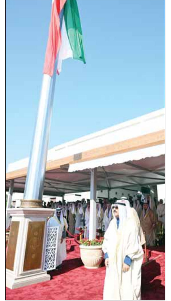
سمو أمير البلاد خلال رفع العلم