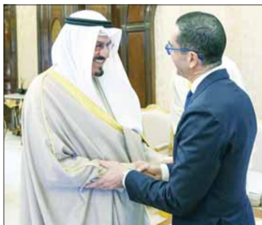
سمو رئيس الوزراء مسبقاً وزير "الاستثمار" المصري

استقبل سمو رئيس مجلس الوزراء الشيخ أحمد عبدالله وبحضور وزير التجارة والصناعة خليفة العجيل في قصر بيان أمس، وزير الاستثمار والتجارة الخارجية بجمهورية مصر العربية الشقيقة حسن الخطيب والوفد المرافق له وذلك بمناسبة زيارته للبلاد. وجرى خلال اللقاء استعراض العلاقات الثنائية الوطيدة وسبل تعزيز التعاون التجاري والصناعي الوثيق بما يخدم مصالح البلدين والشعبين الشقيقين. حضر المقابلة رئيس ديوان رئيس مجلس الوزراء عبدالعزیز الدخيل وسفير جمهورية مصر العربية لدى دولة الكويت أسامة شلتوت والرئيس التنفيذي للهيئة العامة للاستثمار والمناطق الحرة بجمهورية مصر العربية حسام هنية.