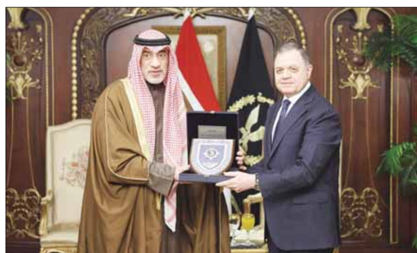
الشيخ فهد اليوسف مع نظيره وزير الداخلية المصري اللواء محمود قنديل

وأشار إلى أن التعاون الأمني بين البلدين يعد نموذجا ناجما للعلاقات العربية في المجال الأمني، مؤكدا ضرورة استمرار التنسيق بين الأجهزة المختصة لمواجهة التحديات المستجدة والتصدي للتهديدات كافة التي تستهدف الأمن العربي والإقليمي.