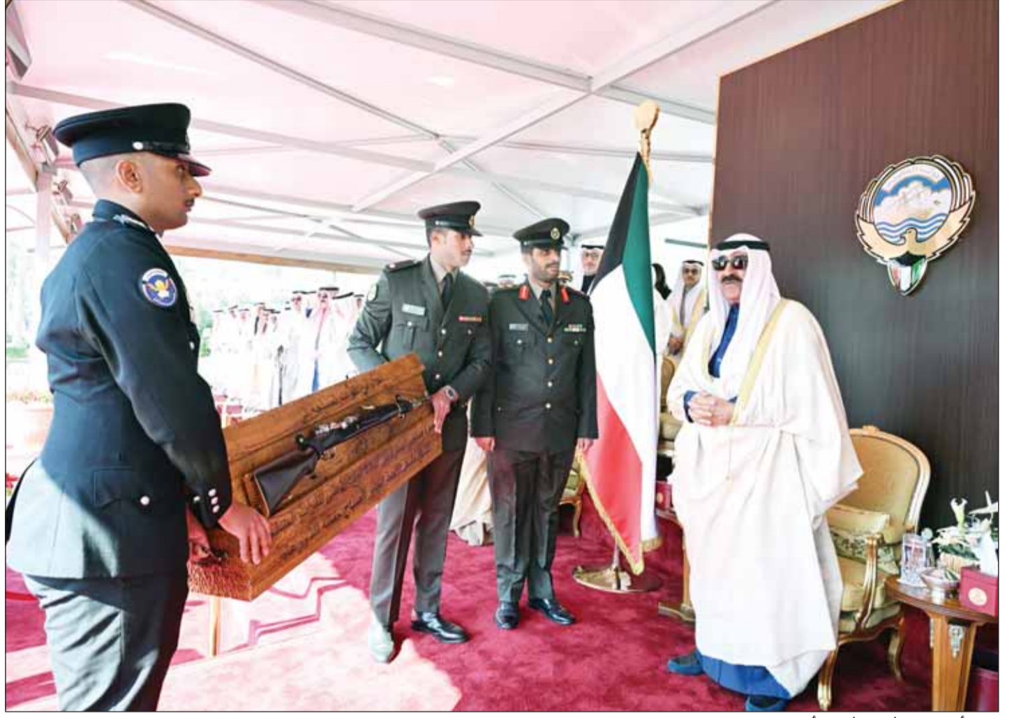
سمو أمير البلاد الشيخ مشعل الأحمد يتسلم هدية تذكارية