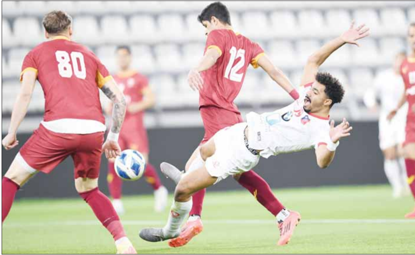
العديد يقسو على النصر ويهزمه بستة أهداف ضمن دوري زين