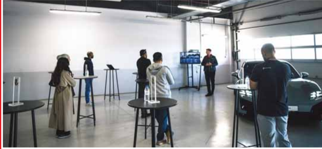
جانب من الحضور في جلسة الإعداد

في عرض استثنائي يجمع بين الفخامة، الأداء، والابتكار، نظم مركز بورشه الكويت - شركة بهباني للسيارات - فعالية مميزة امتدت على مدار يومين، من 30 إلى 31 يناير، في مدينة الكويت لرياضة المحركات، استقطبت الفعالية عشاق بورشه وهواة السيارات الرياضية، بالإضافة إلى نخبة من قيادات المؤسسات الرائدة في الكويت، مقدمة تجربة غنية بالإنارة والتشويق، تبرز براعة بورشه في الجمع بين الأداء القوي والابتكار المستدام، سواء في سياراتها الرياضية أو متعددة الاستخدامات. واستمتع الحضور باستكشاف طرازات أيقونية وإصدارات حصرية من سيارات بورشه، أبرزها سيارة "تاكان" الجديدة كلياً و"مكان" الجديدة والكهربائية كلياً، وقد عكست هذه النماذج زيادة بورشه في قطاع السيارات الكهربائية، مع التزام واضح بالاستدامة دون التنازل عن الأداء العالي الذي يميز العلامة التجارية. وركزت الفعالية على تقديم تجربة قيادة للجمهور لمقارنة أداء المحركات الكهربائية مع محركات الاحتراق الداخلي. أتاحت لهم تجربة القيادة على الحلبة الجنوبية، تحت إشراف سائقين محترفين ومعتمدين، ما ساعدهم على فهم أعمق للفروقات بين التقنيتين، واستكشاف الميزات التي تلبى احتياجاتهم الشخصية.