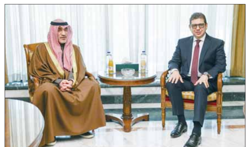
الشيخ فهد اليوسف خلال اجتماعه مع رئيس المخابرات العامة المصرية اللواء حسن رشاد

أكد رئيس المخابرات العامة المصرية اللواء حسن رشاد عمق العلاقات بين البلدين الشقيقين، لافتا إلى أهمية تعزيز قنوات التواصل والتنسيق المستمر لمواجهة المخاطر التي تهدد أمن البلدين. وأشاد بدور دولة الكويت الفاعل في دعم الجهود الأمنية العربية ومرصها الدائم على العمل المشترك لتعزيز الأمن والاستقرار.