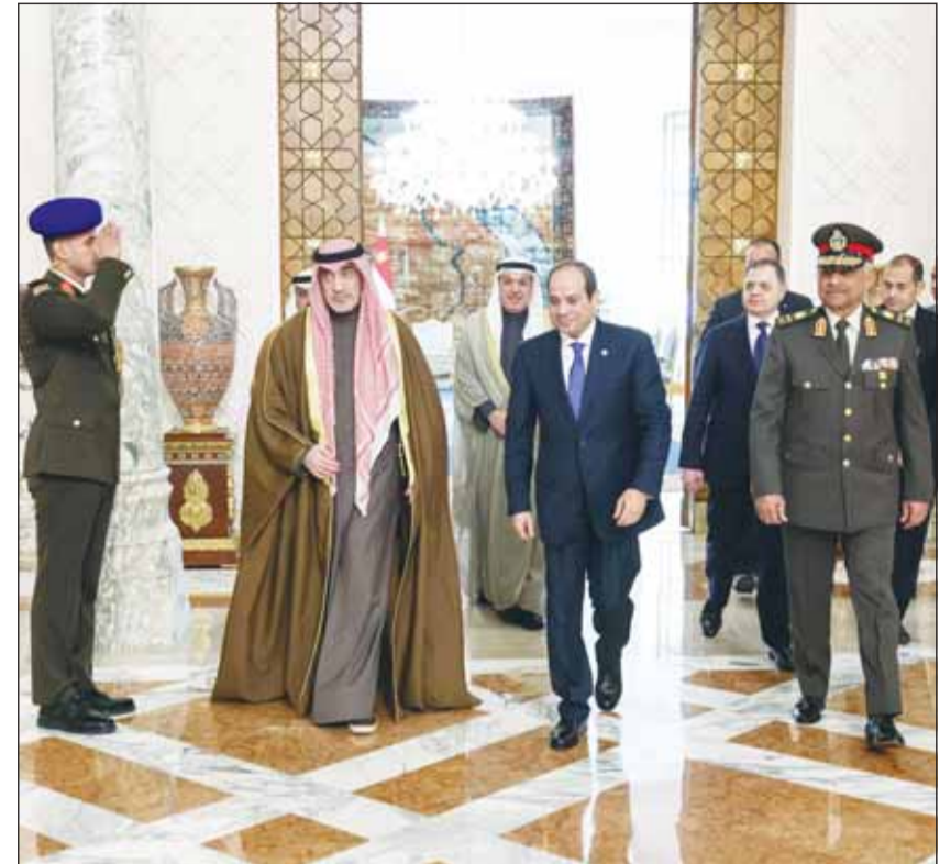
الرئيس المصري عبدالفتاح السيسي، لدى استقباله النائب الأول الوزير الشيخ فهد اليوسف