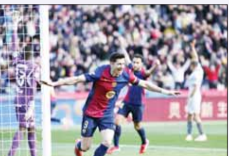
بلدة ليفاندوفسكي، انتصر البرشا

قاد البولندي روبرت ليفاندوفسكي مهاجم برشلونة، فريقه للانتصار بنتيجة (0-1) خلال مواجهة ديورتييفو ألافيس، مساء أمس، ضمن منافسات الجولة الـ 22 من الليغا، في معقل "البوغرانا". وسجل ليفاندوفسكي هدف برشلونة في الدقيقة 62.