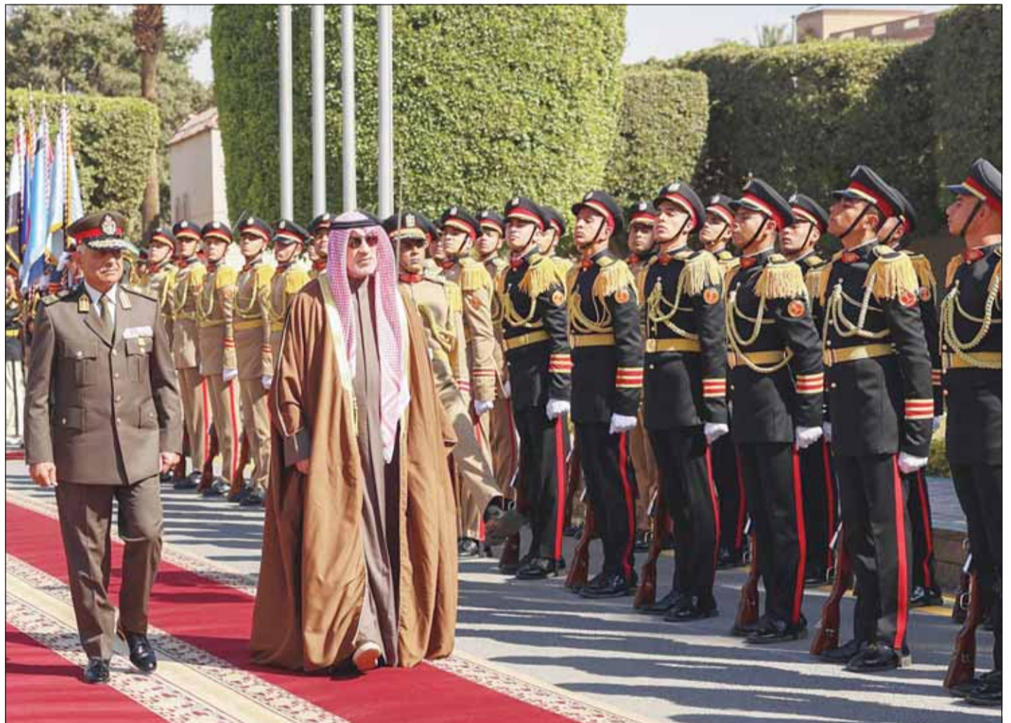
مراسم الاستقبال الرسمية للنائب الأول الشيخ فهد اليوسف

أكدت وزارة الدفاع في بيانها أن الشيخ فهد اليوسف وقع مع نظيره المصري اتفاقية تعاون عسكري خلال حفل أقيم في دار هيئة الشؤون المالية (الماسة) بالقاهرة وذلك بهدف توحيد الجهود وتعزيز التنسيق بين القوات المسلحة في البلدين. وأوضحت أن هذه الاتفاقية تأتي ضمن جهود تعزيز التعاون في مختلف المجالات العسكرية