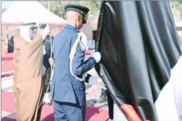
محافظ حمد الحبشي يرفع العلم في القصر الأحمر

□ محافظ العاصمة: الأوطان تبني بسواعد أبنائها الأوفياء