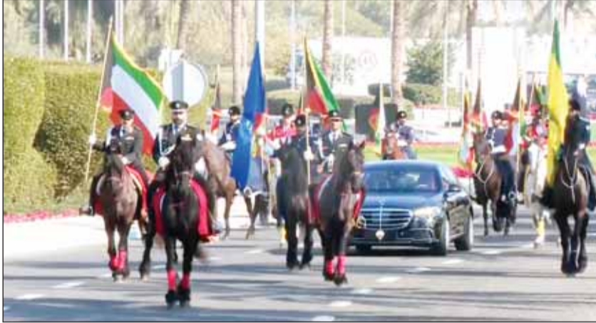
موكب سمو الأمير ترافقه فرقة الخيالة