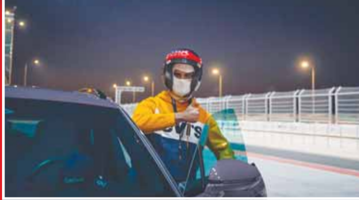
أحد المشاركين في الفعالية

في عرض استثنائي يجمع بين الفخامة، الأداء، والابتكار، نظم مركز بورشه الكويت - شركة بهباني للسيارات - فعالية مميزة امتدت على مدار يومين، من 30 إلى 31 يناير، في مدينة الكويت لرياضة المحركات، استقطبت الفعالية عشاق بورشه وهواة السيارات الرياضية، بالإضافة إلى نخبة من قيادات المؤسسات الرائدة في الكويت، مقدمة تجربة غنية بالإنارة والتشويق، تبرز براعة بورشه في الجمع بين الأداء القوي والابتكار المستدام، سواء في سياراتها الرياضية أو متعددة الاستخدامات. واستمتع الحضور باستكشاف طرازات أيقونية وإصدارات حصرية من سيارات بورشه، أبرزها سيارة "تاكان" الجديدة كلياً و"مكان" الجديدة والكهربائية كلياً، وقد عكست هذه النماذج زيادة بورشه في قطاع السيارات الكهربائية، مع التزام واضح بالاستدامة دون التنازل عن الأداء العالي الذي يميز العلامة التجارية. وركزت الفعالية على تقديم تجربة قيادة للجمهور لمقارنة أداء المحركات الكهربائية مع محركات الاحتراق الداخلي. أتاحت لهم تجربة القيادة على الحلبة الجنوبية، تحت إشراف سائقين محترفين ومعتمدين، ما ساعدهم على فهم أعمق للفروقات بين التقنيتين، واستكشاف الميزات التي تلبى احتياجاتهم الشخصية.