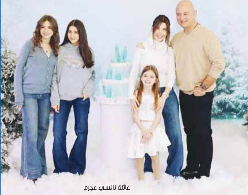
عائلة نانسي عجرم

وأرفقت نانسي الصور العائلية من عيد الميلاد بتعليق كتبت فيه، "عيد ميلاد سعيد لأهليتي الجميلة ليا، محظوظين جداً برويتك تكبرين، تذكرني سنكون دائماً معك والدك بطنا وأخوتك وأنا بجانبك، حيناً غير قابل للكسر ولن يغير ذلك أي شيء، أتمنى لك حياة سعيدة يا حبيبتي"، وكانت النجمة نانسي عجرم قد أوضحت في تصريحات إعلامية أن العبارة التي تسببت بانطلاق تكهنات الانفصال، مرتبطة بفيديو كليب أغنتها الجديدة "طول عمري نجمة"، والذي يروي قصة درامية تبدأ بتوقيع الفنانة اللبنانية على أوراق الطلاق، وقالت نانسي، "هذه ليست حياتي وإن شاء الله ما رح تكون، هيدا الكليب موقف وهيدي فكرة المخرج وهو قرر يتناول كل الأخبار التي يتم تداولها وأخذنا هيدا الهم ومؤلفنا إلى قصة، بمثل بالكليب إني منغصلة". وأضافت، "الفكرة تنتهي بحرية المرأة يلي تختل عن كل شيء مقابل حريتها والمرأة لا يمكن لأحد كسرهما... وإن شاء الله الناس تحب الفيديو".