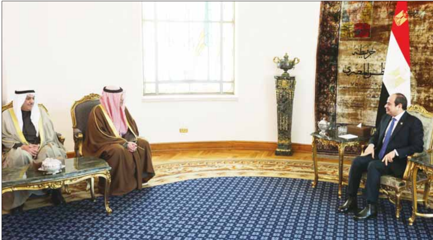
الرئيس عبدالفتاح السيسي، مستقبلاً النائب الأول الوزير الشيخ فهد اليوسف