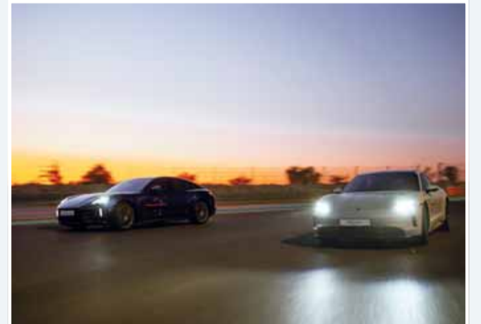
إطلالة مسائية لسيارات بورشه