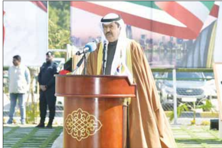
محافظ حولي علي الأصغر يتحدث خلال مراسم رفع العلم

□ حمد الحبشي: تعبير صادق لمحبة الكويتيين لوطنهم