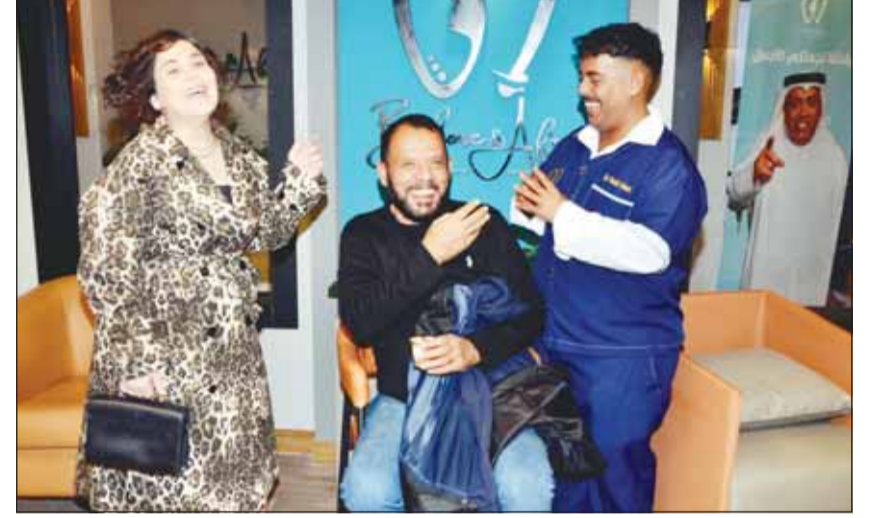
في كواليس مسلسل "قبل وبعد"