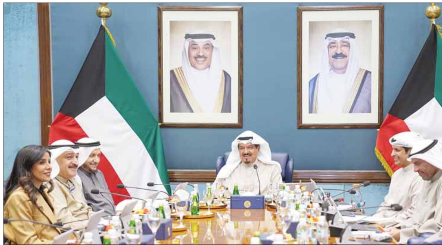
سمو الشيخ أحمد عبدالله مترشاً اجتماع مجلس الوزراء

□ 18,2 مليار دينار الإيرادات و24,5 مليار المصروفات □ لتظل راية الكويت عالية خفاقة في سماء المجد والعلو