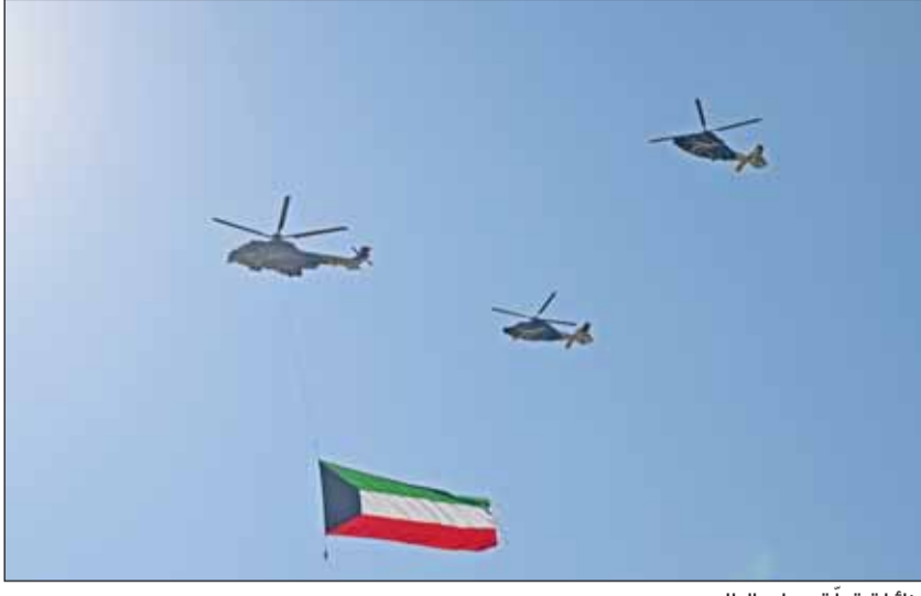
طائرات تحلق بعلم البلاد