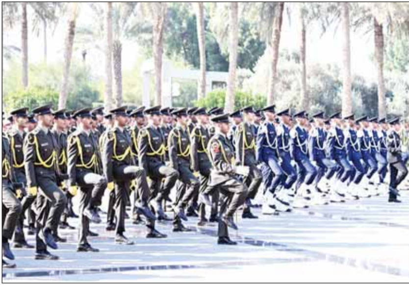
طابور العرض العسكري