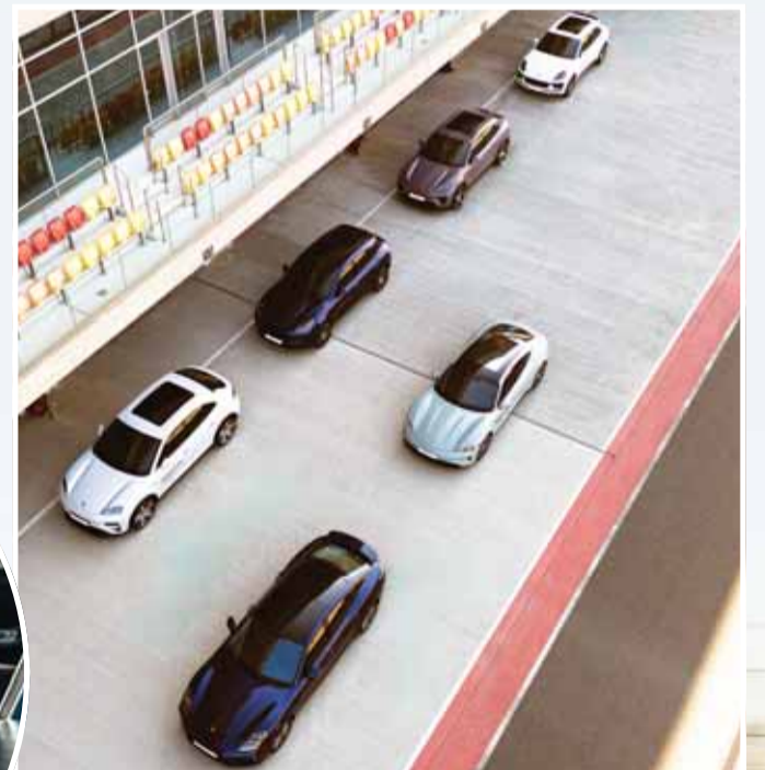
أسطول السيارات خلال الفعالية