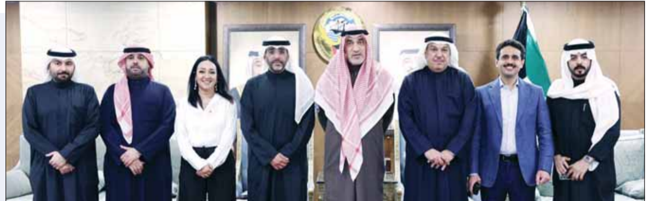
الشيخ فهد اليوسف متوسلاً السفير غانم الغانم وأعضاء السفارة الكويتية

القاهرة - "كونا"، التقى النائب الأول لرئيس مجلس الوزراء ووزير الدفاع ووزير الداخلية الشيخ فهد اليوسف أول من أمس الأحد سفير الكويت لدى مصر غانم الغانم وأعضاء السفارة. وأشاد اليوسف - وفق بيان صادر عن وزارة الدفاع - بجهود البعثة الدبلوماسية الكويتية في تعزيز العلاقات الثنائية بين البلدين. كما التقى الشيخ فهد اليوسف بالضباط الكويتيين الدارسين في الكليات العسكرية المصرية، مشيدا بجدتهم واجتهادهم في تحصيل العلوم العسكرية والأكاديمية التي تسهم في تأهيلهم لخدمة وطنهم.