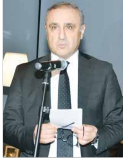
السفير محمد كريم البودالي يلقى كلمته