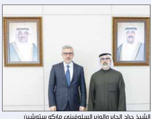
الشيخ جراح الجابر والوزير السلوفيني ماركو ستوشين

عقدت أمس الجولة الأولى من المشاورات السياسية بين وزارتي خارجية الكويت وسلوفينيا، ترأس الجانب الكويتي فيها نائب وزير الخارجية السفير الشيخ جراح الجابر، في حين ترأس الجانب السلوفيني وزير الدولة والشؤون الأوروبية ماركو ستوشين. جرى خلال المشاورات بحث الموضوعات المطروحة على جدول الأعمال وسبل توطيد وتنمية العلاقات الثنائية في مختلف المجالات.