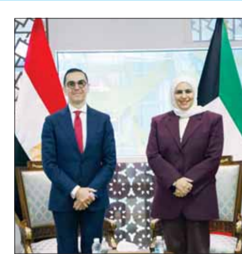
الفصام مستقبلة وزير الاستثمار المصري حسن الخطيب