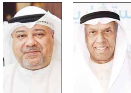
بدر السلطان د. خالد مهدي

□ السلطان: مساعدة القطاع الخاص للقيام بدور فعال في خطط التنمية