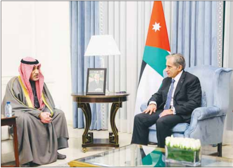
رئيس الوزراء الأردني خلال استقباله للنائب الأول الشيخ فهد اليوسف

□ النائب الأول: التعاون الأمني بين الكويت والأردن ركيزة أساسية لاستقرار المنطقة □ نتطلع إلى مزيد من التنسيق المشترك لتعزيز الأمن الوطني بما يخدم مصالح البلدين □ تعزيز التعاون القائم في مكافحة الجريمة والاستفادة من الخبرات في مجال الأدلة الجنائية