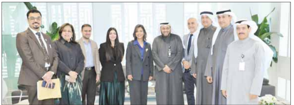
مديرة جامعة الكويت د.دينا الميلم تتوسط المهنيين