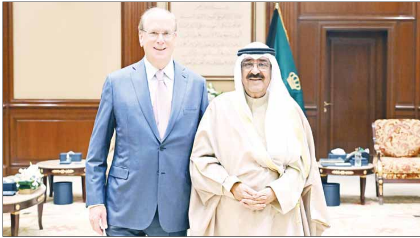
سمو الأمير الشيخ مشعل الأحمد لدم استقبله رئيس مجلس الإدارة والرئيس التنفيذي لشركة "بلاك روك" لاري فينك

دعم الفرص الاستثمارية والاقتصادية وتوطين المعرفة واستقطاب رؤوس الأموال