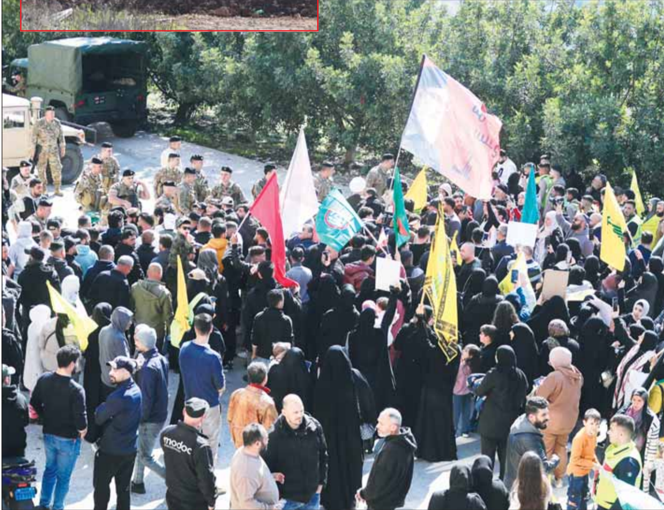
تجمع لنازحين عائلتيهم قراهم وفيه الإطار جنود إسرائيليين يقطعون طريقاً مؤدية إلى قرية كفر كلا بجنوب لبنان

بيروت، عواصم - وكالات، فيما توقع النائب اللبناني مروان حمادة ولادتها خلال ساعات، كاشفاً عن حسم اختيار ياسين جابر وزيراً للمالية، واصفاً ما يُسوّق عن حبب المساعدات أو الدعم الدولي عن لبنان في حال تسلّم جابر وزارة المالية بأنه عار من الصحة، ساد التقرب المشهد السياسي اللبناني بشأن تشكيل الحكومة الجديدة، خاصة مع تزايد الحديث في الأوساط السياسية عن احتمال إعلانها هذا الأسبوع، وارتفع منسوب التفاؤل بقرب الإعلان عن أسماء الوزراء وتوزيع الكفّ والثباتي الشعبي خلال اليومين الماضيين، حيث قدم الثنائي أسماء مرشحيه والمقائب المقترحة لهم، تاركاً لرئيس الجمهورية صلاحية تسمية المرشح للحقيبة الخامسة بالتشاور مع رئيس مجلس النواب، نبيه بري، وفي المقابل، استغرقت قوى سنية سياسية حسم أسماء الوزراء السنة منذ البداية، في حين لا تزال بقية الأسماء موضع نقاش ومفاوضات. وفي سياق ردود الفعل على مسار التشكيل، تعرّض بعض الكتل السياسية المسيحية على توزيع المقاب، خاصة حزب القوات اللبنانية، الذي يمتسك بحقيبة الخارجية السيادية والتي يعتبرها الرئيس جوزاف عون من صصته ويمتصق بحق تسمية وزيرها، وأصدر حزب القوات بياناً، انتقد فيه عدم اعتماد الرئيس المكلف معايير موحدة في التشكيل، مطالباً باعتماد مبدأ المعاملة بالمثل، بينما كشف النائب مروان حمادة عن اختيار ناجي أبو عاصي لوزارة الخارجية والقاضي أحمد الحجّار للداخلية وتماراً الزّين للبيئة، وتحدث عن وزيرين لكلفة اللّقاء الديموقراطي في الحكومة الجديدة هما فايز رسامني للأشغال ومدير محمية أرز اللّشوف نزار هاني للزراعة، وكشفت أنه لا ثلث معطل في الحكومة المقبلة، لذلك فإن الوزير الشيعي الخامس