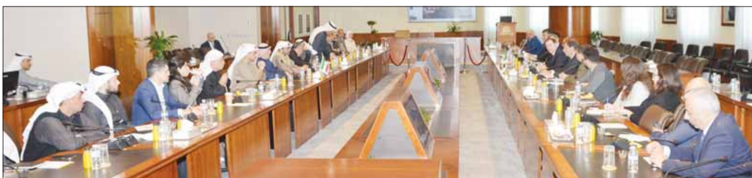
جانب من اجتماع الوفد البرازيلي مع مجتمع الأعمال الكويتي في الغرفة

أكدت أن الشراكة الاقتصادية بين البلدين ذات أبعاد متكاملة "الغرفة": الكويت ساهمت في تعزيز أمن الطاقة في البرازيل... علاقة استراتيجية مستدامة