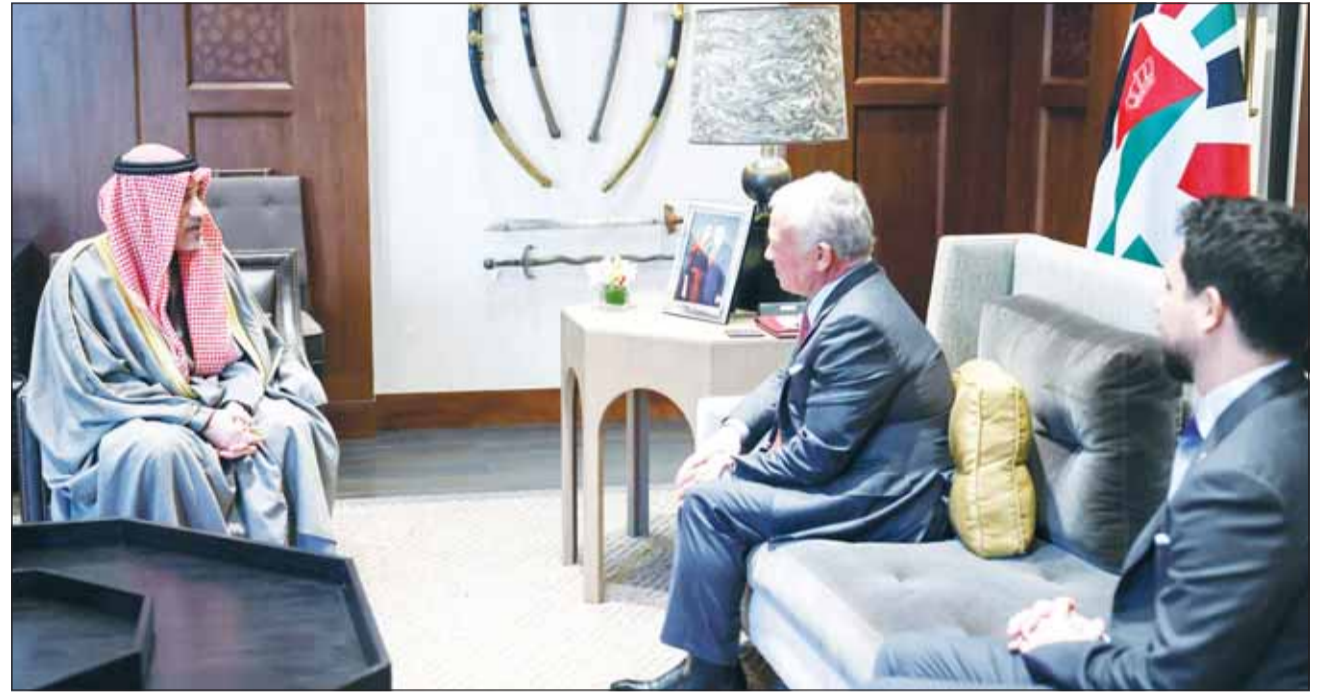
الملك عبدالله الثاني خلال لقائه النائب الأول الوزير الشيخ فهد اليوسف