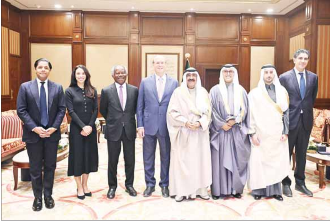
سمو أمير البلاد الشيخ مشعل الأحمد ورئيس شركة بلاك روك لاريفينك والوفد المرافق