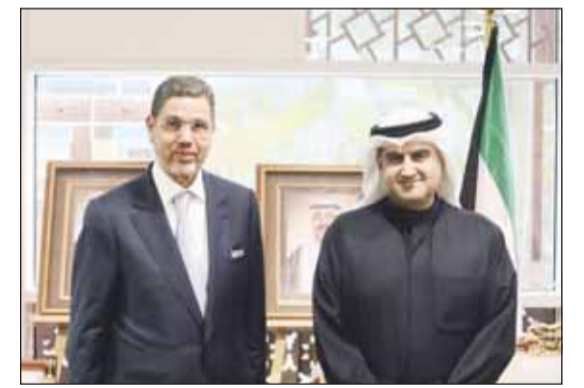
وزير العدل والرئيس الأول لمحكمة النقض بالمملكة المغربية

ومنصب قضائي من الدرجة الممتازة ورئيس ديوان الرئيس المنتخب للمجلس الأعلى للسلطة القضائية بالمملكة المغربية قدور الحياجي، على خط مواز، بحث وزير العدل ناصر السميطة مع الرئيس الأول لمحكمة النقض بالمملكة المغربية الرئيس المنتخب للمجلس الأعلى للسلطة القضائية المستشار محمد عبد النباوي أوجه التعاون المشترك. وذكرت وزارة العدل في بيان صحافي أنه تم استعراض العلاقات الثنائية المعنية التي تربط الكويت بالمملكة المغربية في مجالات القانون والقضاء وأوجه تطوير وإثراء التعاون بين المؤسسات القضائية في البلدين وانعكاسها على عمل المحاكم وتأثيرها في الأحكام لاسيما أحكام المحاكم العليا. وأضافت أنه تم خلال اللقاء أيضا طرح فكرة توقيع مذكرة تفاهم لاستمرار التنسيق والتعاون وتبادل الخبرات والمهارات القضائية بين الجانبين. وحضر اللقاء رئيس قطب الشؤون القانونية والدراسات بالمجلس الأعلى للسلطة القضائية بالمملكة المغربية القاضي شكري فتوح الكويت علي ابن عيسى.