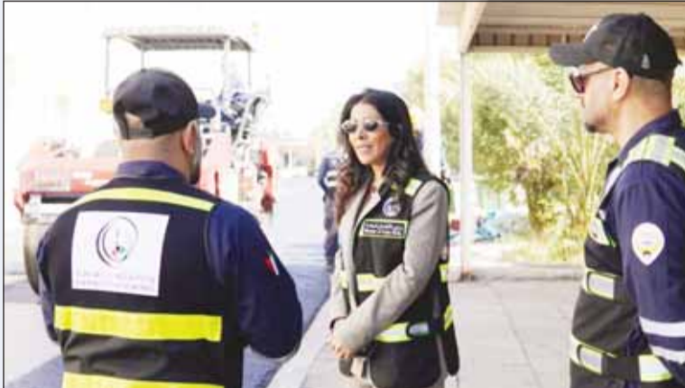
وزير الأشغال العامة دنورة المشعان خلال الجولة

الجودة والمواصفات الفنية المعتمدة عالمياً لضمان تحقيق أعلى مستويات الأداء والمتانة للطرق. ونكرت أن توجيهاتها بسرعة إنجاز أعمال الصيانة جاءت بناءً على توصيات سمو رئيس مجلس الوزراء الشيخ أحمد عبدالله وفي إطار حرص الحكومة على صيانة وإصلاح البنية التحتية في البلاد، مؤكدة أن البنية التحتية لأي بلد هي الركيزة الأساسية لأي رؤية اقتصادية. وأضافت المشعان: إن ملف صيانة وإصلاح الطرق من أولويات القيادة السياسية في البلاد، مشيدة بتوجيهات سمو أمير البلاد الشيخ مشعل الأحمد وسمو ولي العهد الشيخ صباح الخالد ودعمهما لمشاريع صيانة الطرق التي ستكون ركيزة بنية تحتية متطورة ضمن خطة (كويت جديدة 2035).