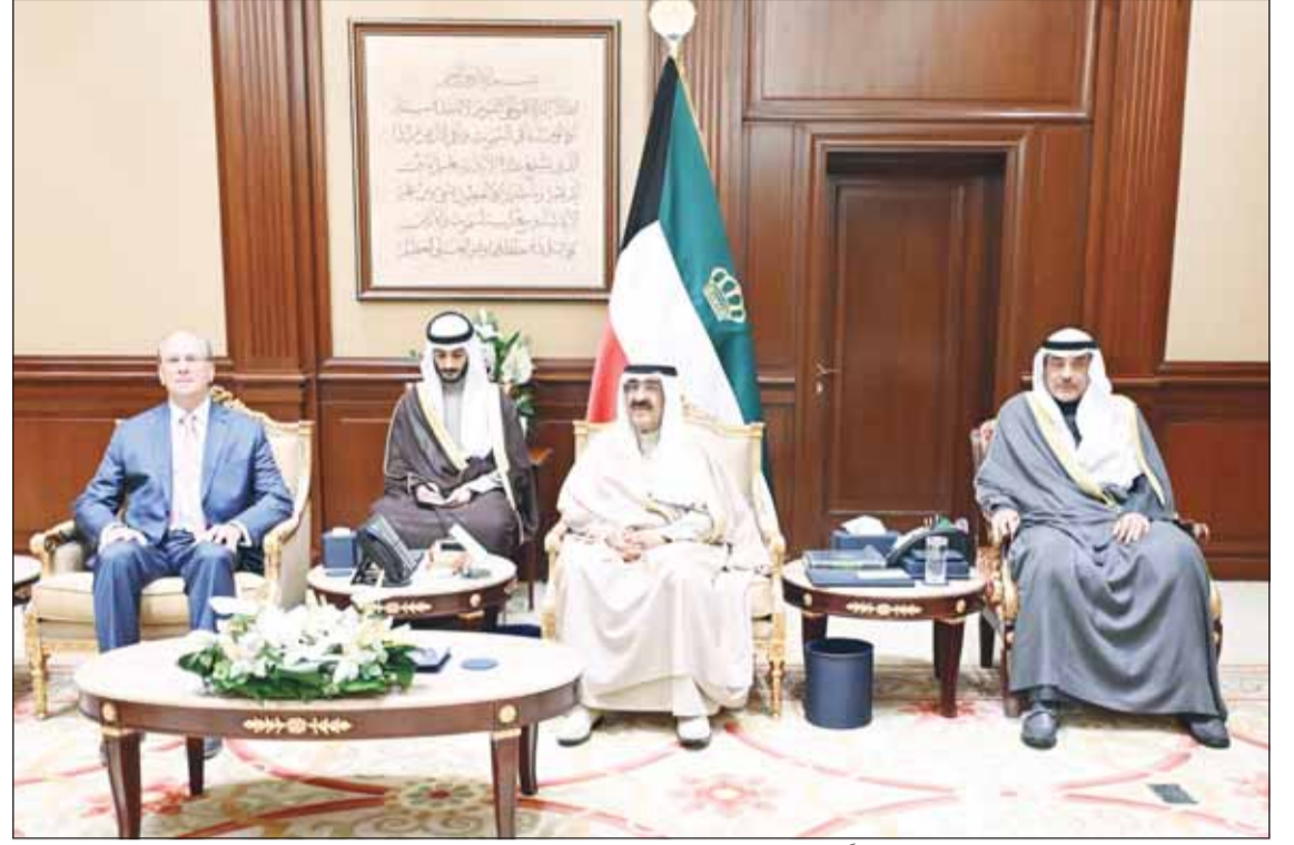
سمو أمير البلاد الشيخ مشعل الأحمد مستقبلاً بحضور سمو ولي العهد رئيس مجلس الإدارة والرئيس التنفيذي لشركة بلاك روك