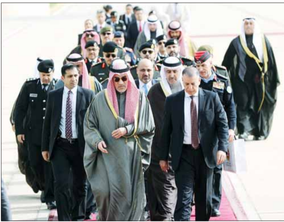
النائب الأول الوزير الشيخ فهد اليوسف لدى وصوله إلى عمان وفيه استقباله وزير الداخلية الأردني و كبار المسؤولين

عمان - "كونا"، استقبل العاهل الأردني الملك عبدالله الثاني بن الحسين - بحضور ولي العهد الأردني الأمير الحسين بن عبدالله - أمس، النائب الأول لمجلس الوزراء ووزير الدفاع ووزير الداخلية الشيخ فهد اليوسف المرافق له بمناسبة زيارته الرسمية للمملكة الأردنية الهاشمية. وقالت وزارة الدفاع - في بيان صحفي - إن النائب الأول الشيخ فهد اليوسف نقل خلال اللقاء تحيات سمو أمير البلاد القائد الأعلى للقوات المسلحة الشيخ مشعل الأحمد وسمو ولي العهد الشيخ صباح خالد إلى أخيهما الملك عبدالله الثاني بن الحسين وتمنيات سموهما له بموفقو الصحة والعافية وللمملكة الأردنية الهاشمية وشعبها دوام الرفعة والازدهار. وجرى خلال اللقاء استعراض العلاقات الأخوية الراسخة بين الكويت والأردن وسبل تعزيز التعاون المشترك في مختلف المجالات بما يخدم مصالح البلدين والشعبين إضافة إلى مناقشة عدد من القضايا ذات الاهتمام المشترك. حضر اللقاء عدد من كبار المسؤولين من الجانبين. من جهة أخرى، بحث النائب الأول الوزير الشيخ فهد اليوسف مع رئيس الوزراء ووزير الدفاع الأردني د.جعفر حسان سبل تعزيز التعاون العسكري المشترك. وقالت وزارة الدفاع - في بيان - إن ذلك جاء خلال لقاء رئيس الوزراء الأردني مع النائب الأول الشيخ فهد اليوسف والوفد المرافق له. وذكر البيان أن الجانبين بحثا تبادل الخبرات والتدريب والتعريب الميدانية بما يسهم في رفع مستوى الجاهزية وتعزيز القدرات الدفاعية للقوات المسلحة في البلدين الشقيقين. وبحسب البيان أكد اليوسف على العلاقات الأخوية المتميزة التي تجمع البلدين الشقيقين، مشددا على الحرص المشترك على توسيع آفاق التعاون في مختلف المجالات لا سيما في تبادل الخبرات وتعزيز أوجه التعاون العسكري بين القوات المسلحة في البلدين.