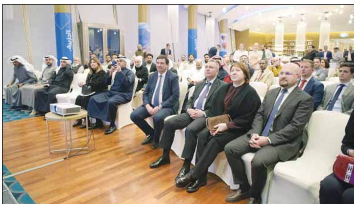
السفير الروسي فلاديمير جيلتوف في مقدمة الحضور

وكشف عن تسيير الخطوط الجوية الكويتية أولى رحلاتها إلى العاصمة موسكو في بداية شهر مايو المقبل مضيقاً أن العلاقات الروسية - الكويتية تستمر في التطور في مختلف المجالات وأن السياحة تعتبر الأسرع نمواً بينها، مشيراً إلى أنه من حيث معدل نمو عدد السياح الوافدين إلى روسيا، وتعد الكويت واحدة من الدول الرائدة في دول مجلس التعاون الخليجي، مقارنة بعام 2023 عندما تم إطلاق رحلات الجزيرة الجوية المباشرة بين موسكو والكويت، والتي تصل إلى 9 رحلات أسبوعياً.