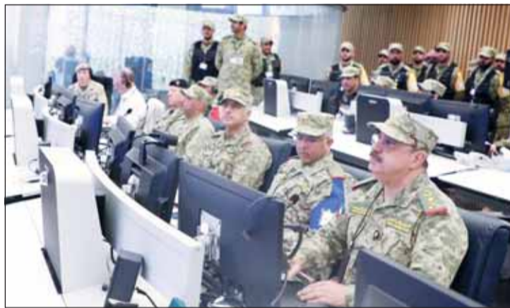
الفريق الركن هاشم الرفاعي وكبار القادة يتابعون مجريات التمرين

تحت رعاية رئيس الحرس الوطني الشيخ مبارك الحمود وبحضور وكيل الحرس الوطني الفريق الركن مهندس هاشم عبدالرزاق الرفاعي وكبار القادة، انطلقت فعاليات تمرين مراكز قيادة الحرس الوطني CPX (نصر 20)، في مركز العمليات بالقيادة العامة للحرس الوطني بمشاركة مملكة البحرين ودولة الإمارات العربية المتحدة والمملكة المتحدة وعدد من جهات الدولة.