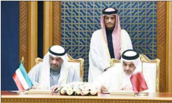
البحيا يوقع إحدى الاتفاقيات بحضور رئيس الوزراء وزير الخارجية القطري

قطر في دورتها السادسة بالدوحة، مشيرا إلى وجود عدد من مذكرات التفاهم التي تم التوقيع عليها لتعزيز التعاون المشترك. وأكّد السفير المطيري في تصريح إلى "كونا" أهمية اللجنة العليا المشتركة في تعزيز العلاقات الثنائية وزيادة مستوى التنسيق المتبادل بشأن القضايا الثنائية والعربية والإقليمية ما يعكس مستوى التطور في العلاقات الأخوية بين البلدين الشقيقين.