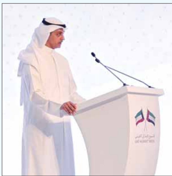
وكيل وزارة التجارة الكويتية زياد الناجم خلال الكلمة الافتتاحية

الزيودي: 13,5 مليار دولار قيمة التجارة البينية بين البلدين العام الماضي بنمو 9% عن سابقه