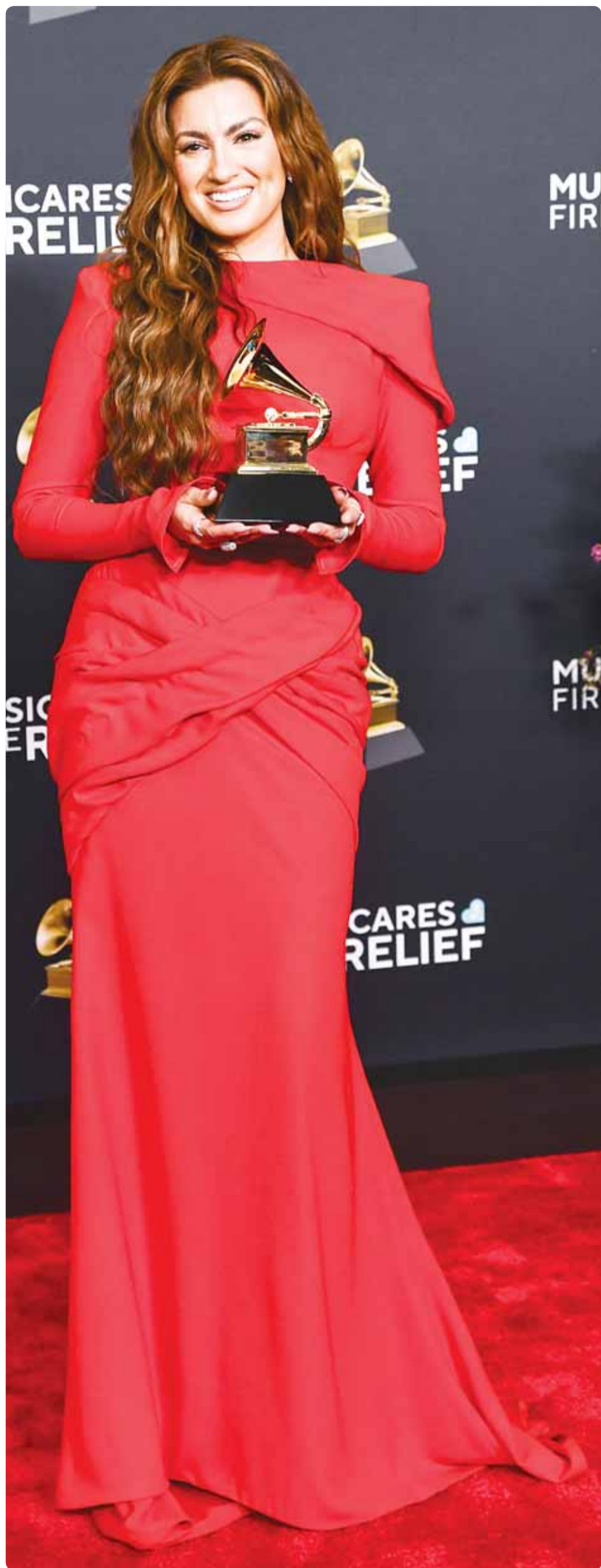
المغنية الأمريكية توري كيلبي خلال حفل توزيع جوائز "غرامي" في لوس أنجلوس.

مريد - وكالات، تسبب فيديو متداول ظهر فيه السفير الإسباني لدى بلجيكا ألبرتو أنطون في غفوة قصيرة خلال خطاب وزير الخارجية الإسباني خوسيه مانويل باريس، في فناءه منصبه. ونشرت وسائل الإعلام المحلية أن هذه الواقعة حدثت الشهر الماضي خلال المؤتمر السنوي الذي ضم سفراء إسبانيا، إذ غلب النعاس السفير الإسباني لدى بلجيكا ألبرتو أنطون تحديداً أثناء استماعه لخطاب وزير الخارجية خوسيه مانويل باريس، أصدر الوزير الإسباني قراراً بإقالة السفير على الفور بعد علمه بالحادثة. ورغم أن وزارة الخارجية الإسبانية لم تؤكد خبر إقالة أنطون رسمياً، إلا أن وسائل الإعلام المحلية أشارت إلى أن قرار فصل السفير قد تم اتخاذه بشكل نهائي، وسيتم الإعلان عنه بعد الحصول على موافقة السلطات البلجيكية.