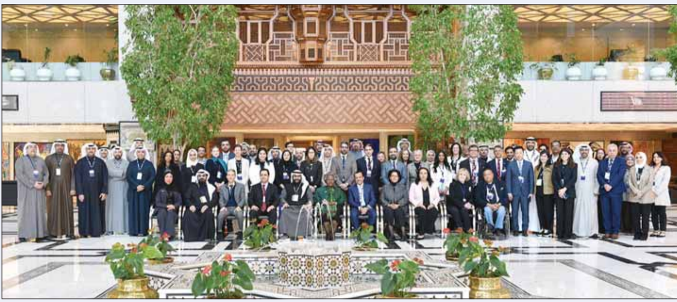
المشاركون في الورشة

وأشارت الى ان الورشة تعد خطوة مهمة نحو تعزيز شراكة استراتيجية بين الجانبين في مجال الطب الدقيق معرفة عن تطورها إلى استثمار نتائج هذا التعاون في تطوير حلول مبتكرة لمواجهة الأمراض المزمنة وتحسين جودة الرعاية الصحية في الكويت وقارها. وقالت المؤسسة إن الورشة نظمت تحت إشراف لجنة تضم أعضاء من الكويت والولايات المتحدة، بمشاركة خبراء بارزين في مجالات الطب والذكاء الاصطناعي على المستويات الوطنية والإقليمية والدولية. من جانبهم أكد المشاركون في الورشة على أهمية التعاون الدولي في مواجهة التحديات الصحية العالمية، مشجدين جهود مؤسسة الكويت للتقدم العلمي في بناء جسور التواصل بين الباحثين والخبراء من مختلف الدول. وتعد الورشة بداية لسلسلة من الفعاليات التي تهدف إلى تعزيز التعاون العلمي بين الكويت والولايات المتحدة، مع التركيز على التحديات الصحية ذات الأولوية المشتركة.