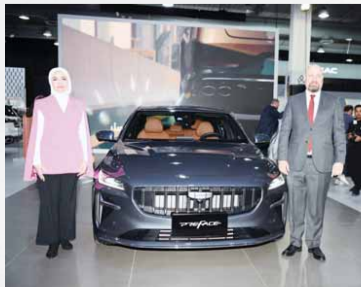
جناح سيارة جيلي في المعرض