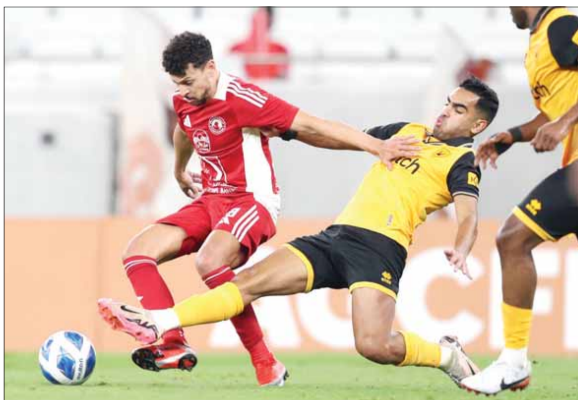
القادسية يحتاج إلى الفوز اليوم للمحافظة على حضور التأهل