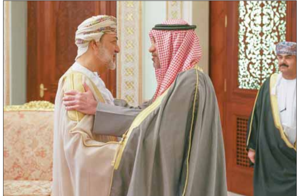
سلطان عمان هيثم بن طارق مرحباً بالنائب الأول الوزير الشيخ فهد اليوسف