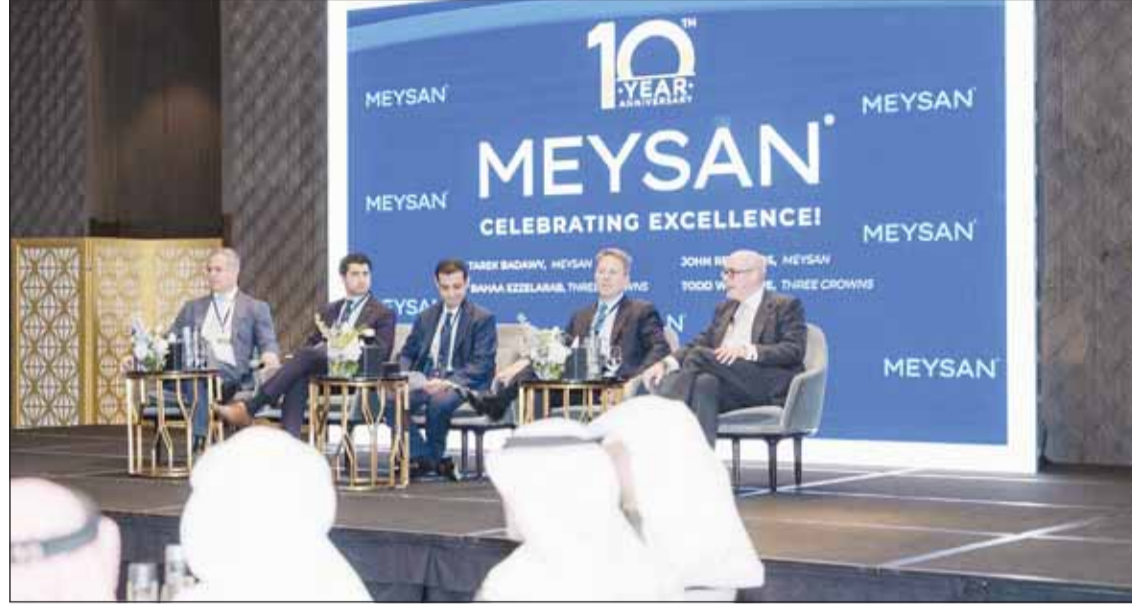
جانب من الندوة التي أقيمت على هامش الاحتفالية

نمتلك رؤية وخطة عشرية للتوسع المحسوب واستقطاب أفضل الكفاءات