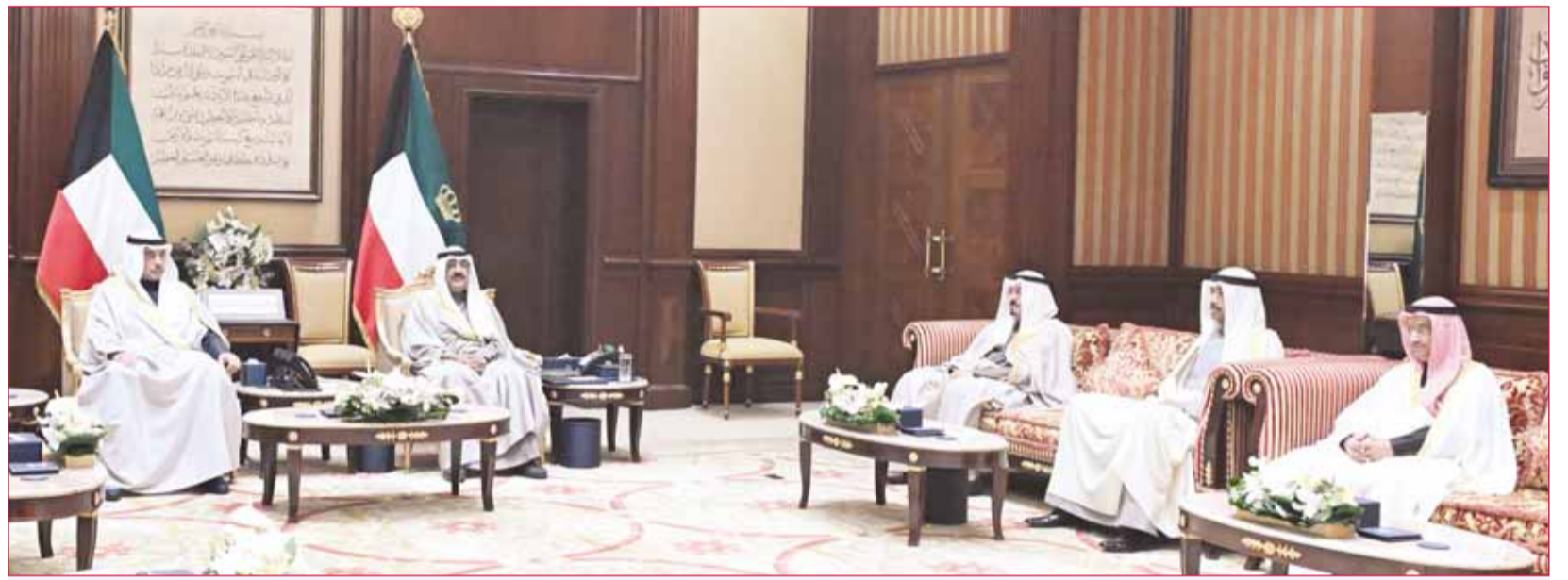
الأمير شهد أداء العبدالله اليمين الدستورية وزيراً للدفاع وتلقى دعوة لزيارة فرنسا 03

اسم QRcode لزيارة الموقع الإلكتروني: aljarallah.com @Ahmedaljarallah Ahmed aljarallah