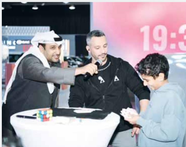
فعاليات في جناح سيارة جيلي

وتُكرى تكنولوجيا القيادة الكهربائية الذكية تجربة القيادة، فتُفتح أربعة أنماط قيادة مختلفة تلبي مختلف امتياجات السائقين، وهي ECO وSport وComfort قيادة