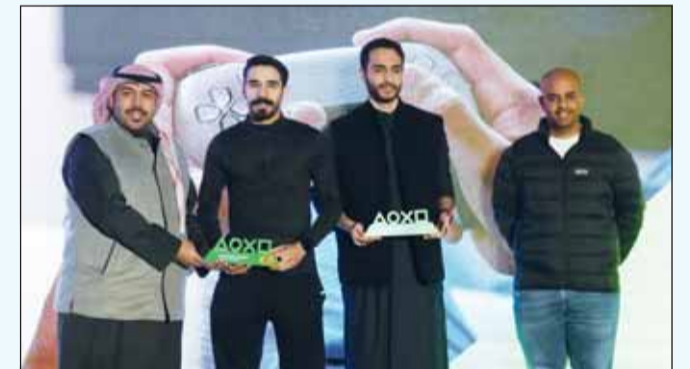
تكريم الفريق الفائز بالمركز الأول

خلال تنظيم باقة من الفعاليات المتميزة والمكافآت الجديدة والعملاء المتنوعة التي تتوافق مع طلباتهم، وتعزز مستوى الرضا لديهم. كما تعد هذه البطولة إضافة متميزة للأنشطة والفعاليات والمسابقات التي يقدمها بيت التمويل الكويتي لعملاء "حسابي" في إطار استراتيجيته للمسؤولية المجتمعية والاهتمام بالشباب. ومن أهم المزايا التي يتم تقديمها ضمن برنامج "حسابي" للشباب من عمر 15 إلى 25 سنة، التسجيل التلقائي في برنامج مكافآت "بيتك"، أحد أفضل برامج المكافآت في الكويت، وخدمات مصرفية على مدار الساعة، وعروض حصرية وخصومات من مختلف المتاجر، وبطاقة حسابي مسيقة الدفع مجاناً، وخدمات مجانية عبر الإنترنت، وإمكانية فتح حساب الحصاد الذي يتيح المشاركة في سحب الجوائز السنوي للفوز بأكثر من 400 جائزة، وإمكانية فتح حساب الرابع والاستمتاع بمجموعة واسعة من الفوائد.