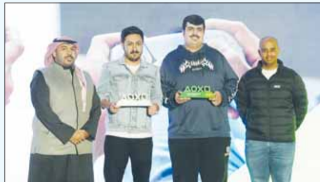
تكريم الفريق الفائز بالمركز الثاني