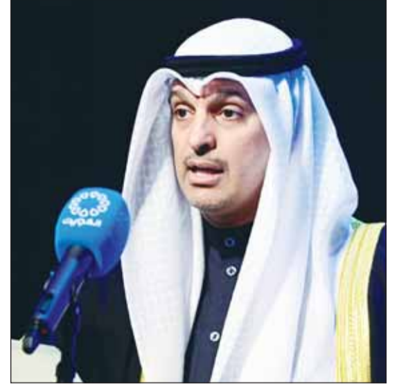
عبد الرحمن المطيري يلقي كلمته