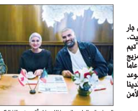
السفيرة عالية مواني خلال حفل "تيم هورتنز الكويت"

كشفت السفارة الكندية لدى الكويت عاليا مواني أن العمل جارٍ لتحديد موعد للجولة المقبلة من الحوار الاستراتيجي مع الكويت. وقالت مواني - في تصريح صحافي خلال حفل تظلمته "تيم هورتنز الكويت" للاعلان عن الاطلاق المسبق لمشروع "مزيج الصداقة"، الذي طور خصيصاً للاحتفال بذكرى مرور 60 عاماً على العلاقات الدبلوماسية بين البلدين - "ليس لدينا موعد حتى الآن، نحن نعمل على ذلك، ولكن في كل مرة يكون لدينا زيارة وزارية، أو اجتماع كبير، على غرار مؤتمر ميونيخ للأمن على سبيل المثال، نتأكد من وجود مشاورات بيننا".