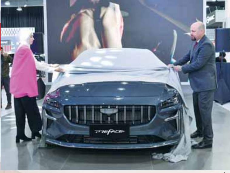
كشف النقاب عن السيارة