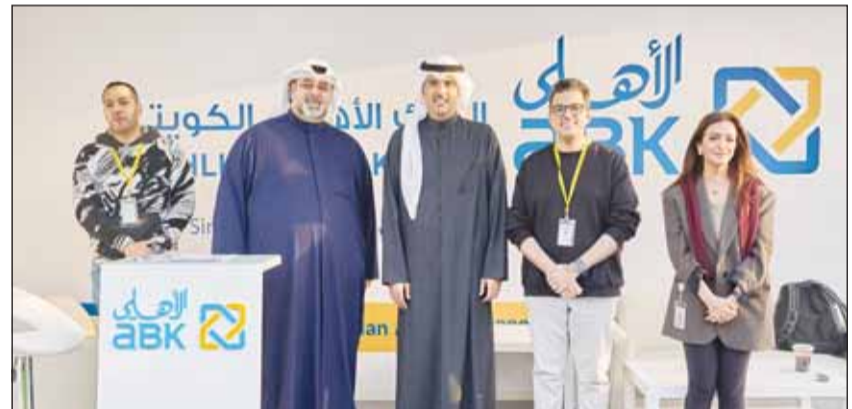
محافظ الأحمد مع الشيخ حمود جابر الأحمد الصباح في جناح البنك

أعلن البنك الأهلي الكويتي دعمه لمهرجان نادي بورشه الكويت 2025 للعام الرابع على التوالي، ما يؤكد التزامه بالمسؤولية الاجتماعية والمشاركة في الفعاليات الرياضية والترفيهية. وتتوافق هذه الرعاية مع الأهداف الاستراتيجية للبنك الأهلي الكويتي للتفاعل مع قاعدة عملاء متنوعة، وتسليط الضوء على مجموعة المنتجات والخدمات والحلول المصرفية المتنوعة التي يقدمها. وشهد المهرجان الذي أقيم في مدينة الكويت لرياضة السيارات، حضوراً رفيع المستوى، بما في ذلك السفير الألماني لدى الكويت، هانز كريستيان فراير فون راينيتز، والمسؤولين التنفيذيين في بورشه، وأعضاء نادي بورشه الكويت، إلى جانب سائقين لسيارات العلامة من دول عربية أخرى. وامتثلت هذه الفعالية بمرور 71 عاماً من التعاون بين "بورشه الكويت" وبورشه العالمية، وتضمنت سباقات مثيرة، وعرضاً لسيارات "بورشه" النادرة، وأنشطة للمعاليات وعشاق السيارات على حد سواء. وبهذه المناسبة، أكد صقر آل بن علي رئيس وحدة الاتصالات والعلاقات الخارجية في البنك الأهلي الكويتي، التزام البنك بالمبادرات المجتمعية التي تتوافق مع برنامج المسؤولية الاجتماعية لديه. وأشار إلى أن أجندة المهرجان لعشاق السيارات توفر للبنك الأهلي الكويتي فرصة فريدة لتقديم حلوله المصرفية المصممة للقطاعات المميزة في السوق.