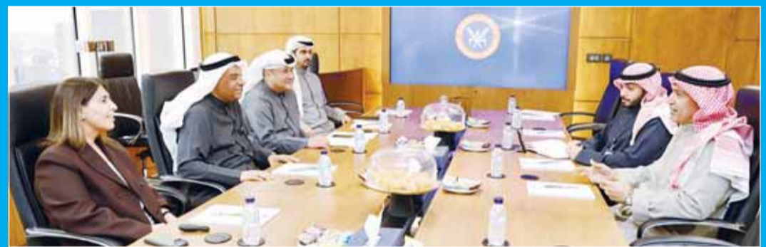
صورة جماعية خلال اللقاء

الزيد دعا مسؤولي الخطوط الكويتية و"الروضتين" في مقر الشركة لبحث سبل دعم وتشجيع الشركات الوطنية تحت مظلة "المطاحن" بجناحها في معرض الفداء الرمضاني. واستكمالاً لجهود إبراز دور الشركات الحكومية ستقوم المطاحن بتصميم خاص في جناحها بالمعرض الرمضاني على شكل طائرة ليعيش زوار المعرض أجواء السفر الحية عبر الناقل الوطني، فيما ستقدم شركة كاسكو وجبات تورد المطاحن غالبية منتجاتها، سواء من الطحين أو المعكرونة أو البسكويت أو الزيوت وغيرها.