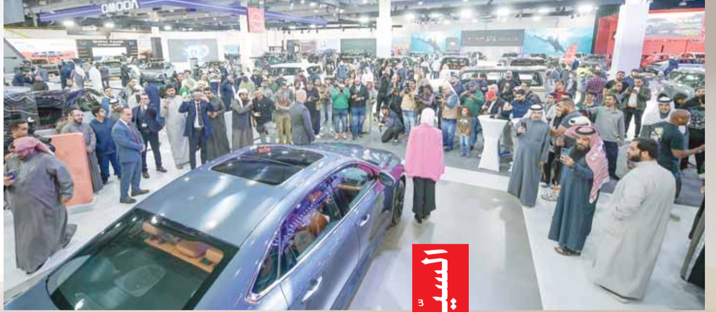
السيارة "جيلي بريفييس" في المعرض