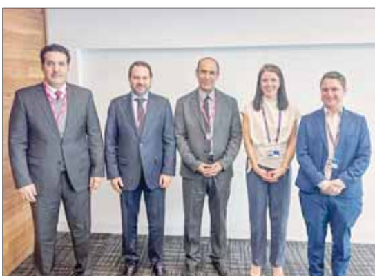
لقطة جماعية تضم العمود والفقاعان

بتقديم طول وخيارات متعددة لمسافريها ، بالإضافة إلى توسيع نطاق خدماتها وتحسين تجربة السفر لعملائها، كما تعتبر زيادة الرحلات من وإلى لندن إنجازاً بارزاً للناقل الوطني لدولة الكويت، وللطلب المتنامي على الرحلات بين الكويت ولندن. وذكر الفقاعان قائلاً، إن "الكويتية" تدرك مدى أهمية هذه الوجهة لدى مسافري الشركة سواء لرجال الأعمال الذين يعتمدون عليها في تسير أعمالهم، أو الطلبة ممن يتابعون دراستهم في المملكة المتحدة، أو حتى السياح الذين يقصودون لندن كوجهة مفضلة، وأخيراً للمواطنين البريطانيين المقيمين في دولة الكويت لاسيما ممن يبحثون عن خيارات سفر مرحة وموثوقة، حيث ستتمكن الشركة من توفير المزيد من الخيارات والمرونة للمسافرين.