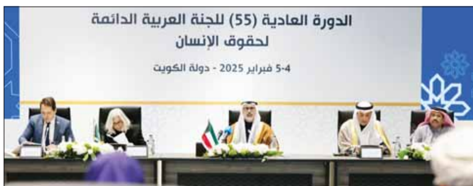
الشيخ جراح الجابر يلقي كلمته في افتتاح الدورة الـ55 للجنة العربية الدائمة لحقوق الإنسان

أكد نائب وزير الخارجية السفير الشيخ جراح جابر الأحمد أمس حرص الكويت على تعزيز وحماية حقوق الإنسان والارتقاء بها إيماناً بأهمية احترامها وارتباطها الوثيق بالتنمية المستدامة والتزامها بتقديم تقاريرها الوطنية إلى الهيئات الإقليمية والدولية ذات الصلة.