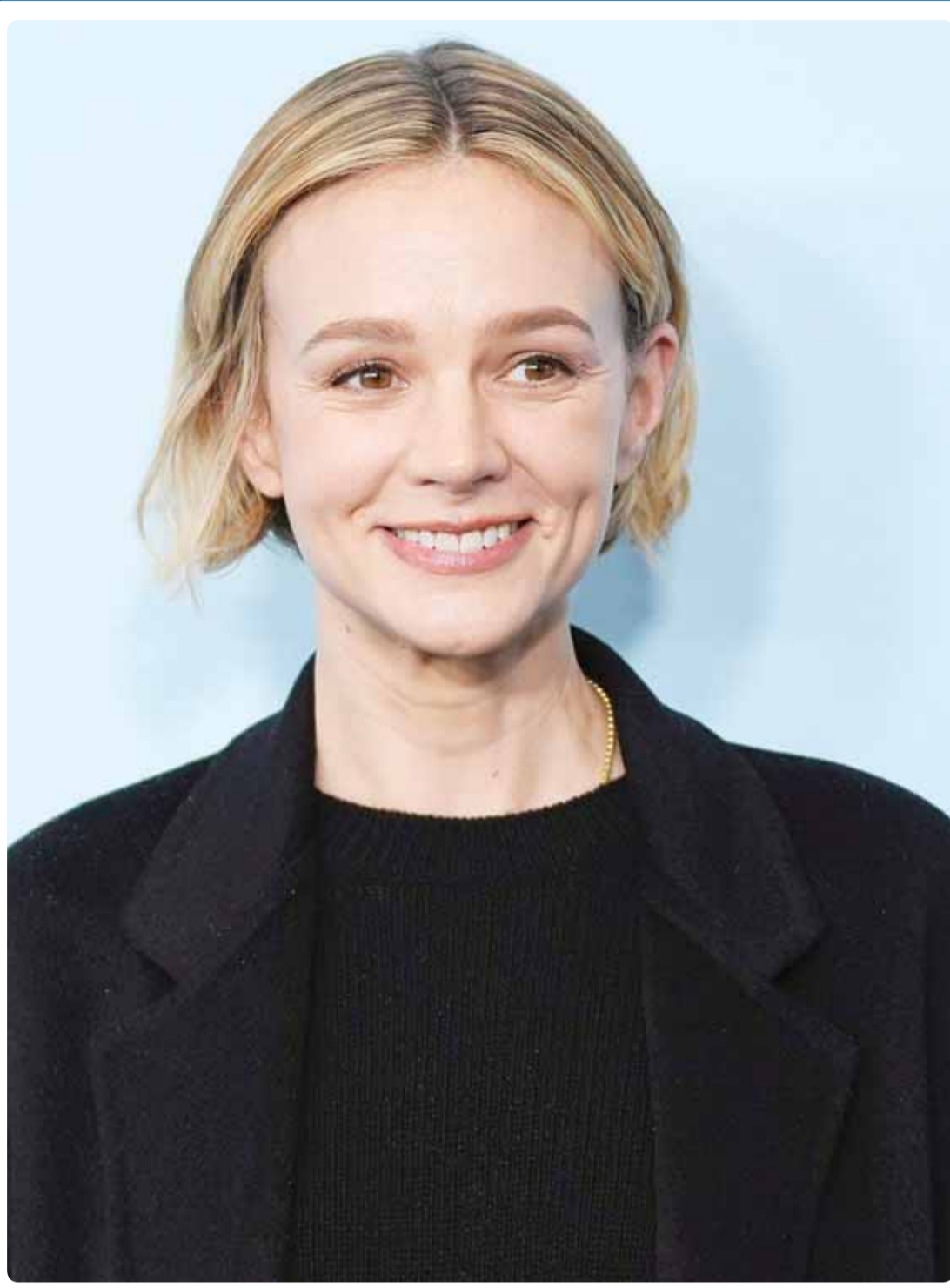
الممثلة البريطانية كاري موليفان خلال حضورها لفيلم "The Ballad of Wallis Island" في مهرجان صندانس (إب)

برلين- وكالات، رغم أن الرجال أقل إصابة بسرطان الثدي مقارنة بالنساء، فإنهم أكثر عرضة للوفاة بسبب هذا المرض، وفقاً لتقييم حديث نشر في ألمانيا. وأعلن مكتب ولاية بافاريا الألمانية للصحة وسلامة الأغذية أن نسبة النساء اللاتي يعشن بعد خمس سنوات من التشخيص بالمرض تبلغ 80 في المئة، بينما تبلغ هذه النسبة بين الرجال 60 في المئة. ولإعداد هذا التحليل، حلل خبراء المكتب بيانات سجل الإصابة بسرطان لحوالي 2500 رجل، ونحو 307 آلاف امرأة من جميع أنحاء ألمانيا، حيث تم تشخيص إصابة هؤلاء الأشخاص بهذا المرض بين مطلع يناير عام 2000 وأخر ديسمبر عام 2018. ووفقاً لمعهد "روبرت كوخ"، وصلت أعداد الإصابة الجديدة بسرطان الثدي في ألمانيا في عام 2020 إلى 70 ألف امرأة و7400 رجل، وبالتالي، فإن احتمال إصابة النساء بسرطان الثدي خلال حياتهن تبلغ 2.13 في المئة، بينما لا تزيد هذه النسبة بين الرجال عن 1.0 في المئة.