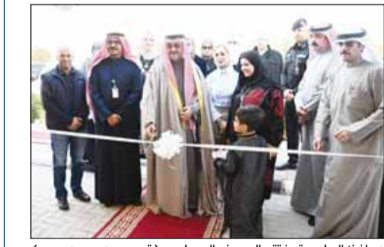
محافظ العاصمة يقترع المعرض المتاحف (تصوير - محمد مرسي)

محافظة العاصمة يقترع المعرض المتاحف (تصوير - محمد مرسي) قوقفة سنويا للمواطنين تتكفل بهم الوزارة بينما تتكفل اللجان الخيرية والقطاع الخاص بغير الكويتيين. وأضافت: إن الهدف من الفعالية هو التوعية بأهمية هذا اليوم والقضايا التي يسبب عليها الضوء وأهمها المشاكل السمعية وأهمها معالجتها في أسرع وقت. من جانبها، قالت الشبيخة أورد الجابر: إن اليوم العالمي للسمع فرصة طيبة لبذل المزيد من الجهود والتركيز على أهمية الاستماع المأمون باعتباره وسيلة للحفاظ على سمع جيد تأكيداً للمساعي الرامية إلى سبل الوقاية من حالات فقدان السمع والتي يمكن الوقاية منها في حال تجنب المسببات وتشخيص الأعراض مبكراً.