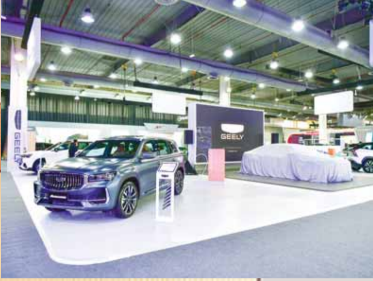
أناقة في السيارة الجديدة