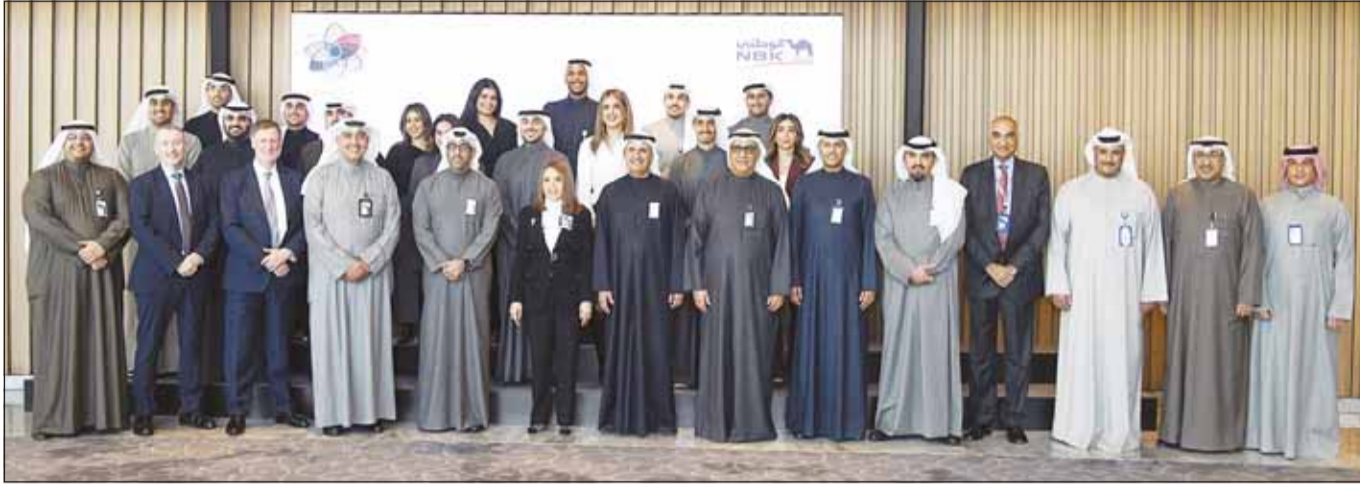
الإدارة التنفيذية للبنك خلال حفل ختام برنامج متدربي شهادات أئتمان موديز

ومهارات المتدربين". وأشارت، "تؤمن إيماناً راسخاً بأن الاستثمار في موظفينا يشكل أحد أهم الركائز الاستراتيجية لتحقيق النمو المستدام وضمان تفوق البنك وترسيخ ريادته، ولذلك نعمل باستمرار على توفير أفضل برامج التدريب والتطوير بالتعاون مع أعرق المؤسسات العالمية، لضمان بناء قوة عمل مرنة وديناميكية قادرة على مواكبة التحديات في المستقبل والشهد المتطور للقطاع المصرفي". وتابع، "لدينا خطة شاملة تهدف إلى تعزيز كفاءة كوادرنا البشرية، ونعمل باستمرار على إعدادهم لمواجهة التحديات التي يفرضها المشهد الديناميكي المتغير ومتطلبات القطاع المصرفي دائمة التطور من خلال تزويدهم بالأدوات والمعرفة اللازمة لتحقيق النجاح المتواصل وضمان تفوق البنك وتواجده في طليعة الابتكار والقدرة التنافسية".