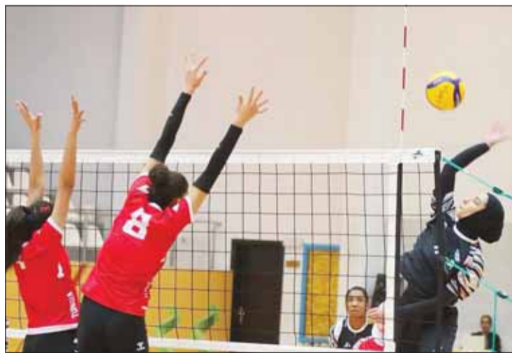
جانب من لقاء نادي سلوى ومنتخب تونس أمس