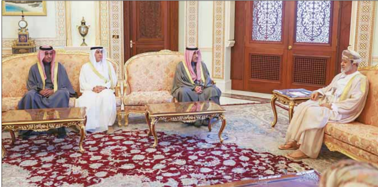
السلطان هيثم بن طارق لدم استقبله النائب الأول الوزير الشيخ فهد اليوسف والوفد المرافق