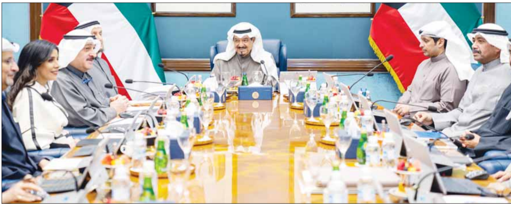
سمو الشيخ أحمد العبدالله متحدثاً أمام اجتماع مجلس الوزراء

تكليف الفصام بتقديم تقرير كل ثلاثة أشهر يبين الخطوات المتخذة بشأن التوازن المالي