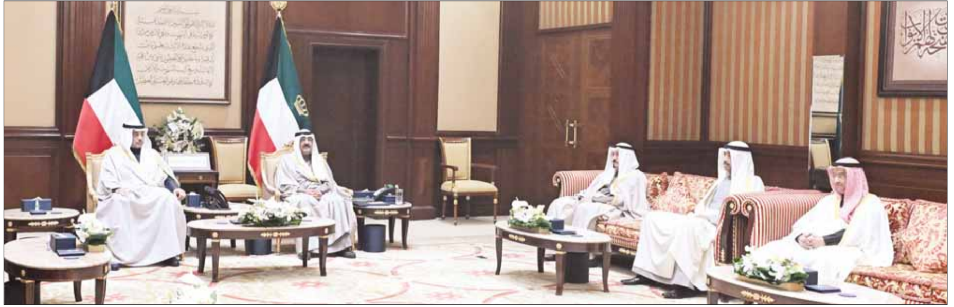
سمو أمير البلاد الشيخ مشعل الأحمد لاء استقباله بحضور سمو ولي العهد الشيخ صباح خالد سمو رئيس الوزراء الشيخ أحمد عبدالله ووزير الدفاع الشيخ عبدالله العلي