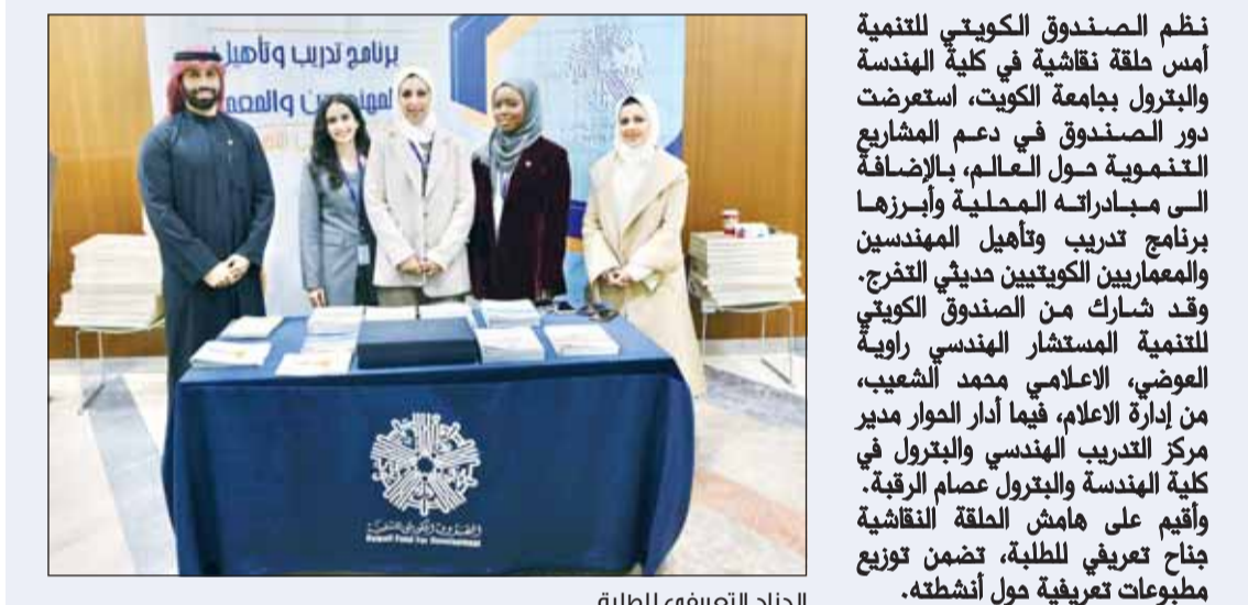
الجناب التعريف للطلبة

□ الشعب: دربنا 1000 مهندس ومهندسة حديثي التخرج