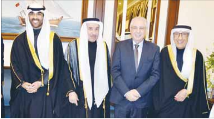
سفير مصر أسامة شلتوت مع المعرس وعمه والسفير عبدالعزيز الشارخ