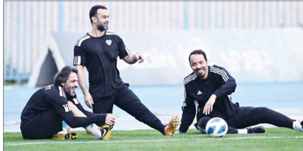
من تدريبات قدامى الأزرق