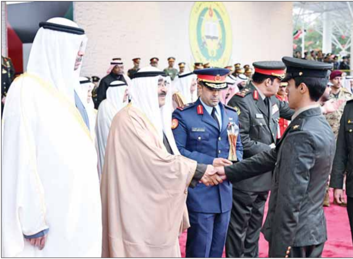
سمو الأمير لدم تكريمه أحد الخريجين