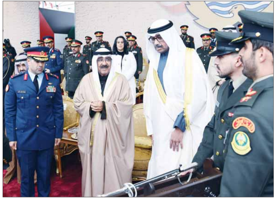
سمو أمير البلاد يتسلم هدية تذكارية

بحضور ولي العهد واليوسف ورئيس المجلس الأعلى للقضاء وكبار المسؤولين بالدولة