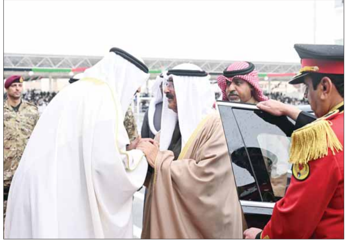
سمو أمير البلاد الشيخ مشعل الأحمد مصافحاً وزير الدفاع الشيخ عبدالله العليم لدم وصوله إلى الكلية