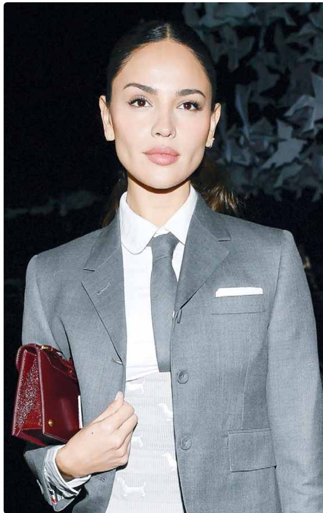
الممثلة المكسيكية إيرا غونزاليس خلال حضورها عروض اسبوع نيويورك للموضة

توصل باحثون إلى أن تفكيك تجمعات خلايا السرطان المنتشرة، قد يسهم في الحد من قدرة الأورام على الانتقال إلى أجزاء أخرى من الجسم، وهو ما يعد خطوة مهمة في محاربة المرض، وفق دراسة نشرت في مجلة "لايف ساينس" العلمية. وتعد ظاهرة الانتقال، أو ما يعرف بالانبثاث، واحدة من أكبر التحديات في علاج السرطان، خصوصاً سرطان الثدي الذي يشكل تهديداً كبيراً لحياة المرضى بسبب قدرته على الانتشار إلى أعضاء حيوية، مثل الرئتين والدماع. وأظهرت التجارب أن دواء القلب القديم "ديجوكسين" (Digoxin) قد يساعد في وقف انتشار الأورام السرطانية إلى أجزاء أخرى من الجسم من خلال تفكيك تجمعات خلايا السرطان. ومع ذلك، فإن البحث في مراحله الأولية، لذا من المبكر تحديد ما إذا كان هذا مفيداً في علاج أنواع السرطان المختلفة مثل سرطان الثدي، الذي يملك القدرة على الانتشار أو التكيس إلى أجزاء أخرى من الجسم.