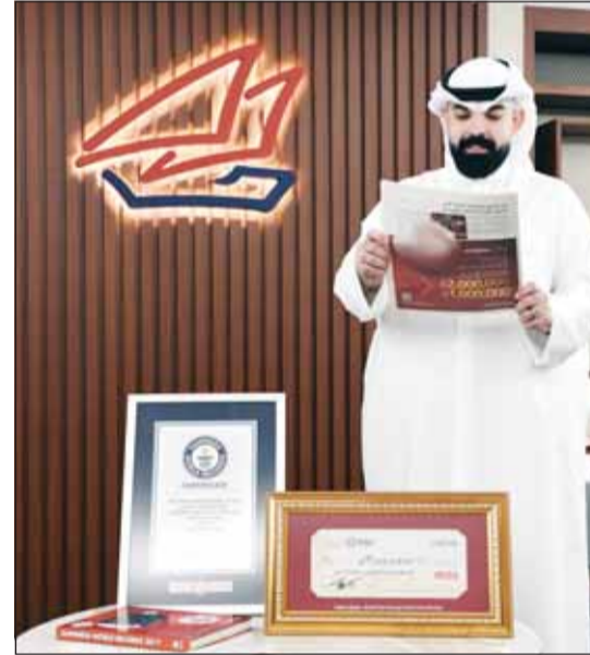
أكبر جائزة في العالم وفقاً لتصنيف موسوعة غينس

وعلى الرغم من أن الموعد النهائي للإيداع والمشاركة في السحب السنوي الكبير لحساب مليونير الدانة، الموصل للفوز بجائزة قيمتها 2 مليون دينار قد انتهى في 30 نوفمبر 2024، فإن قطر السحوبات والجوائز النقدية مع بنك الخليج لا ينتهي. ويتضمن جدول السحوبات لحساب مليونير الدانة في 2025 العديد من الجوائز، فإلى جانب الجائزة الكبرى البالغ قيمتها 2 مليون دينار، تبلغ قيمة الجائزة في السحب نصف السنوي مليون دينار، وذلك إلى جانب السحب ربع سنوي الذي يقام مرتين سنوياً بقيمة 100 ألف دينار لكل منهما، توزع على 100 فائز في كل مرة، فضلاً عن السحب الشهري الذي يوزع جوائز على 10 عملاء شهرياً بجائزة 1000 دينار لكل دينار لكل منهم، ليبلغ عدد الراغبين من عملاء حساب مليونير الدانة 322 فائزاً خلال العام الجاري. ويعد حساب مليونير الدانة من أفضل حسابات الادخار في الكويت، بسحوباته الدورية التي تجعل جوائز قيمة ويميزاته الكثيرة لحاملي الحساب، وكان بنك الخليج قد اتخذ قراراً بزيادة قيمة الجائزة الكبرى من 1,5 إلى 2 مليون دينار لتدخل موسوعة غينيس كأكبر جائزة نقدية مرتبطة بحساب مصرفي في العالم للمرة الثانية، كما قرر توزيع قيمة الجائزة ربع السنوية التي تنظم مرتين سنوياً على 100 فائز، بجائزة ألف دينار لكل منهم، بدلا من فائز واحد يحصل على قيمة الجائزة بالكامل بقيمة 100 ألف دينار في كل مرة.