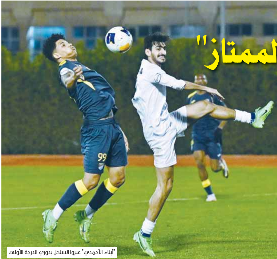
أبناء الأحمدي عبروا الساحل بدوري الدرجة الأولى

في دوري زين الدرجة الأولى، نجح الشباب في التربع وحيداً على المسابقة بعد أن تجاوز عقبة الساحل وهزمه 2-1 في المباراة التي جمعتهما أول من أمس على ملعب الأخير ضمن منافسات الجولة السابعة، كما نجح برقان في تحقيق انتصار صعب قوامه هدفاً وحيداً في المباراة التي أقيمت على ملعب الشباب. ورفع الشباب رصيده إلى 11 نقطة، مبتعداً بفارق 3 نقاط عن الجهراء ثاني الترتيب الذي لعب مباراة أقل، وظل الساحل بالمركز الثالث، وعلى رصيده السابق برصيد 7 نقاط، متساوياً مع برقان الرابع، فيما تسببت الهزيمة بتراجع الصليبخات إلى المركز الخامس والأخير برصيد 5 نقاط.