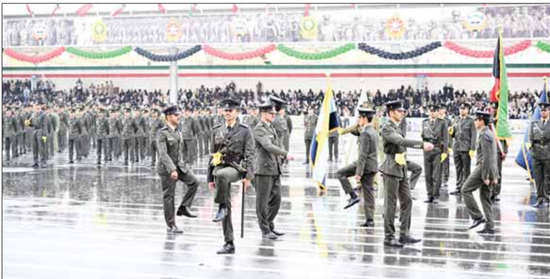
الانطلاق طابور عرض الخريجين

شكر أمير الكلية القيادة العسكرية الذين كان لهم الفضل في تحقيق نهضة جيشنا، ساهرين على تدليل العقبات وبناء الروح الوطنية في القوات المسلحة ولمنتسبي كلية علي الصباح العسكرية من ضباط وضباط صف وأفراد.