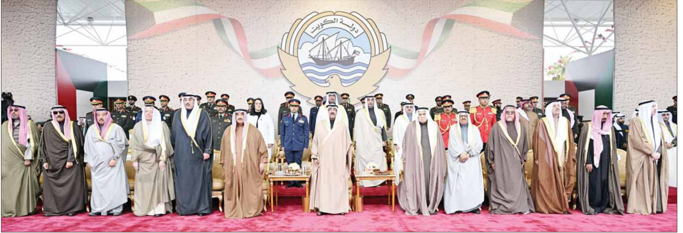
لسمو أمير البلاد الشيخ مشعل الأحمد وسمو وليه العهد الشيخ صباح خالد وكبار الشيوخ والمسؤولين بالدولة خلال عزف السلام الوطني