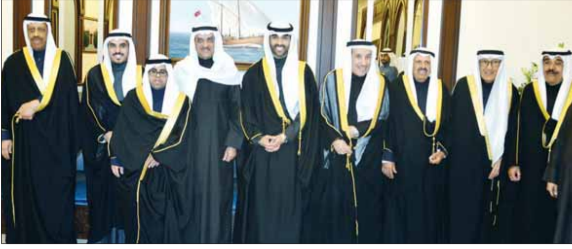
الشيخ دعيج الخليفة والشيخ فيصل المالك ود إبراهيم المليفي يباركون