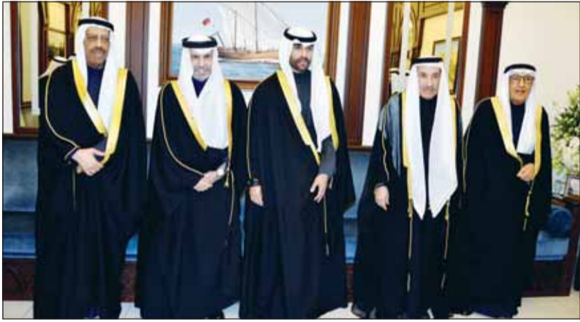
سفير قطر علي آل محمود بيارك