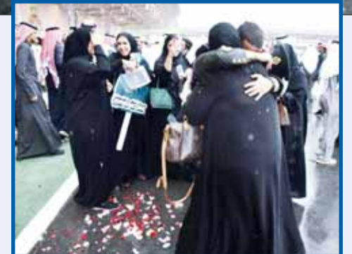
زهور وفرحة (تصوير - رزق توفيق) أحد الخريجين محملاً على الأكتاف

وجه أمر كلية علي الصباح العسكرية كلمة إلى أولياء أمور الخريجين جاء فيها: "اليوم هو يومكم قبل أن يكون يوم أبنائكم يوم تجنون فيه ثمار ما زرعتهم من جهد وكفاح طوال عشرين عاماً، أنتم الذين بذلتم غالي وقتكم ونفيس جهدكم، وما أنتم اليوم تشهدون حصاد ذلك العطاء اللامحدود، لم تترددوا لحظة في أن تقدموا فئات أكبادكم فداء للوطن، واليوم وهم يتخرون أمامكم تزدادون فخراً بهم وهم يقفون في صفوف الشرف والعزة، نسال الله سبحانه وتعالى أن يحفظهم ذفراً للوطن العزيز وأن يوفقهم في أداء رسالتهم السامية وأن يبارك فيكم فأنتم بحق من يستحق الشكر والامتنان.