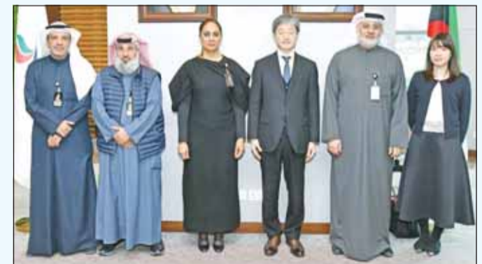
صورة جماعية خلال اللقاء

ولفت الفالج إلى دور صندوق الاستثمارات العامة، قائلاً: "رأينا الرئيس