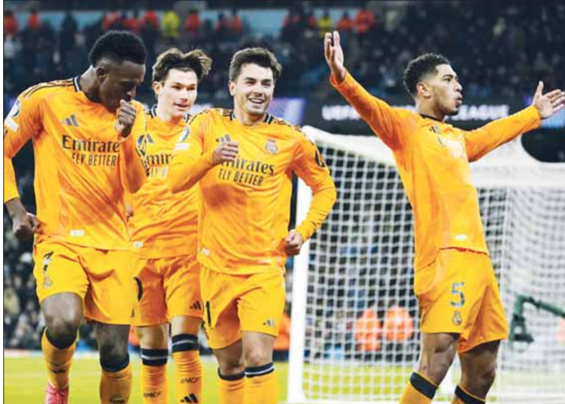
جور بيلينغهام يحتفل مع زملائه بالفوز في ملعب الاتحاد

وكشفت وسائل إعلامية مختلفة رفض فينيسيوس العرض الأول المقدم من ناديه الحالي إذ يرغب بالحصول على راتب أعلى وذلك مع بقاء قرابة عامين على نهاية عقده الحالي مع بطل إسبانيا وأوروبا. وكشف الصحفي ساشا تافاليوري من شبكة "سكاي" أن مسؤولي باريس سان جيرمان اجتمعوا مع مقررين من فينيسيوس جونيور في الأيام الماضية لبحث فكرة انتقاله إلى العاصمة الفرنسية في المستقبل.