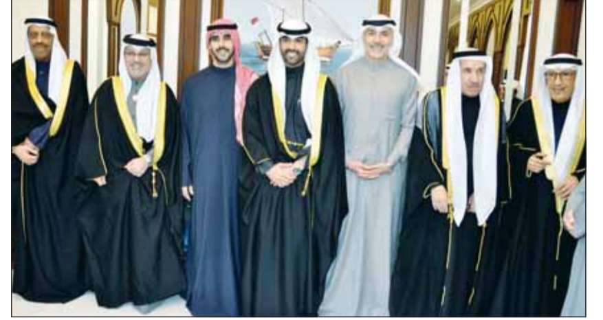
الشيخ فهد جابر الأحمد وسفير البحرين صلاح المالكي بهنتان