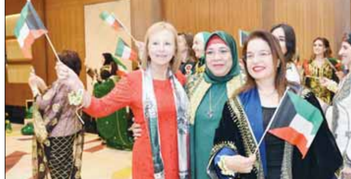
سفيرة إندونيسيا لينا ماريانا ود. أميرة الحسن