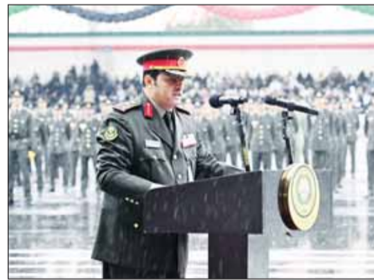
العميد الركن فواز المسلمم

أسأل الله العليّ القدير أن يوفقكم لما فيه الخير والصلاح وأن يثبت خطواتكم على درب العزة والكرامة، وأدعو الله أن يحفظ الكويت وأهلها من كل مكروه وأن يديم نعمة الأمن والسلام في ربوع هذا الوطن المعطاء.