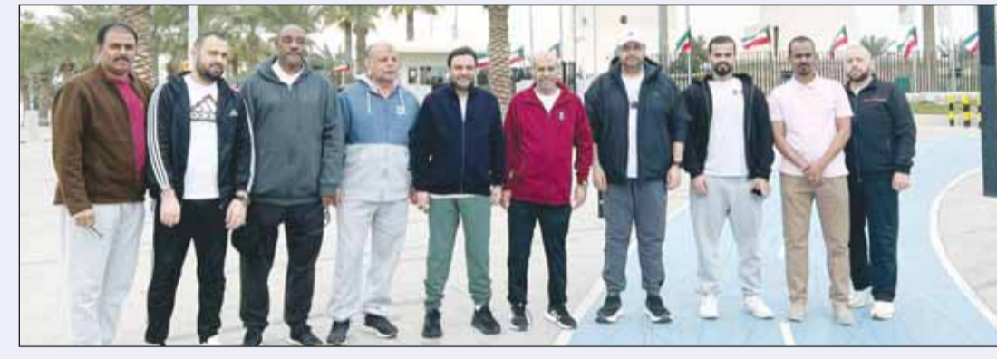
سفير قطر علي آل محمود مع عدد من المشاركين

نظمت سفارة قطر لدى الكويت، الثلاثاء الماضي، فعاليات رياضية متنوعة احتفاءً بـ "اليوم الرياضي للدولة"، الذي يوافق سنوياً يوم الثلاثاء من الأسبوع الثاني من شهر فبراير، وذلك في إطار حرص قطر على تبادل التجارب مع الدول الشقيقة والصديقة، وتعزيز الوعي بأهمية الرياضة كأسلوب حياة صحي. ويعد اليوم الرياضي للدولة مناسبة وطنية تحملي بها قطر سنوياً، حيث كانت أول دولة خليجية تخصص يوماً رياضياً رسمياً بقرار أميري صدر في 2011. ويعد هذا اليوم عطلة رسمية تتحول خلالها الدولة ساحة كبرى لممارسة الرياضة، وبمشاركة جميع فئات المجتمع في الفعاليات التي تنظمها الجهات الحكومية والخاصة، إلى جانب المؤسسات السياحية، بهدف تعزيز اللياقة البدنية والصحة العامة. ويعكس اليوم الرياضي الأهمية الكبيرة التي توليها دولة قطر للرياضة، باعتبارها عنصراً أساسياً في حياة الأفراد والمجتمعات، وتسعى من خلال هذه المناسبة إلى تعزيز وعي المواطنين والمقيمين بأهمية النشاط البدني، وتشجيعهم على تبني أنماط حياة صحية، إضافة إلى ترسيخ مفهوم الثقافة الرياضية المجتمعية وتعزيز الروابط الاجتماعية بين أفراد المجتمع.