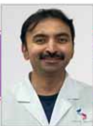
د. فيفيك . ب . س MBBS, DO, DNB طب العيون