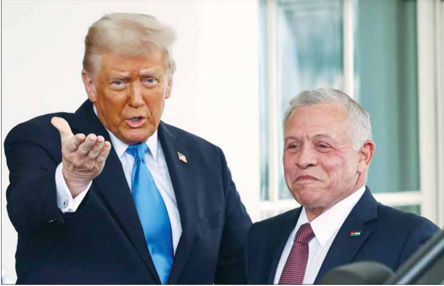
الرئيس الأمريكي دونالد ترامب مستقبلاً العاهل الأردني الملك عبدالله الثاني في البيت الأبيض ليل أول من أمس

غزة، عواصم - وكالات، وصولاً لتصور يقضي إلى أن قمة القاهرة العربية الطارئة المرتقبة في 27 الجاري ستكون حاسمة في بناء موقف عربي موحد، تسارعت التطورات بشأن قطاع غزة بشكل دراماتيكي على مدى الساعات الماضية، في ظل اتفاق وقف لإطلاق النار على وشك الانهيار في أية لحظة، وإصرار أميركي وإسرائيلي على تسليم "حماس" جميع الأسرى السبت ورفض قاطع من الحركة، وضغط متواصل من الرئيس الأمريكي دونالد ترامب وإصرار على تنفيذ خطته التي تعتمد على تهجير أهل القطاع، وسط رفض وتأييد عربي وعالمي بالفكرة من أساسها، ومطالبية بالبدء في تنفيذ حل الدولتين.