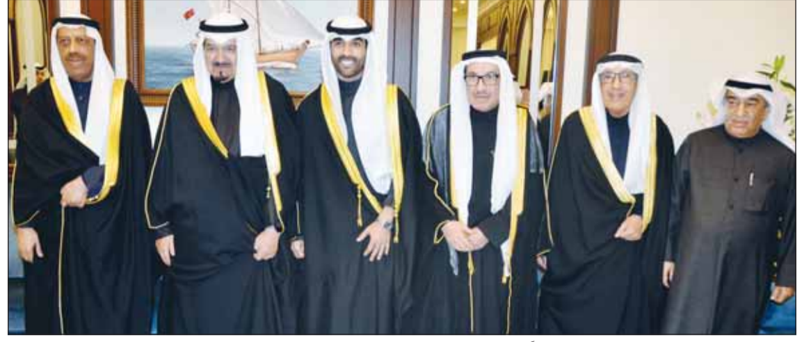
سمو رئيس الوزراء الشيخ أحمد عبدالله مهنتاً