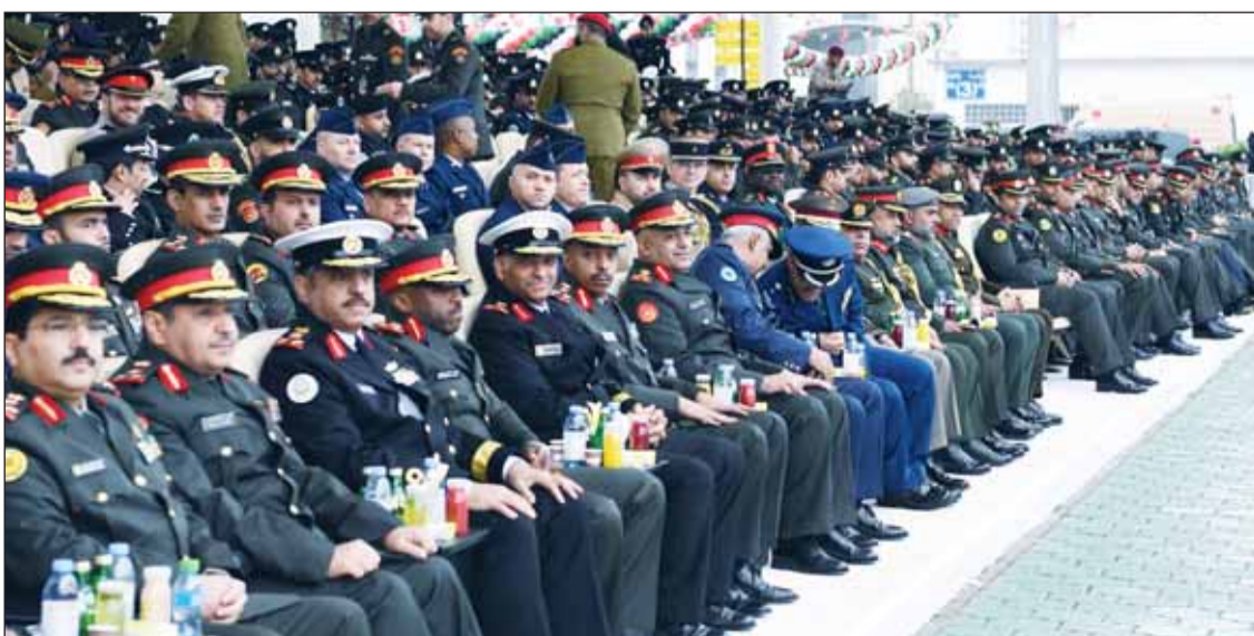
كبار القيادات العسكرية خلال الحفل