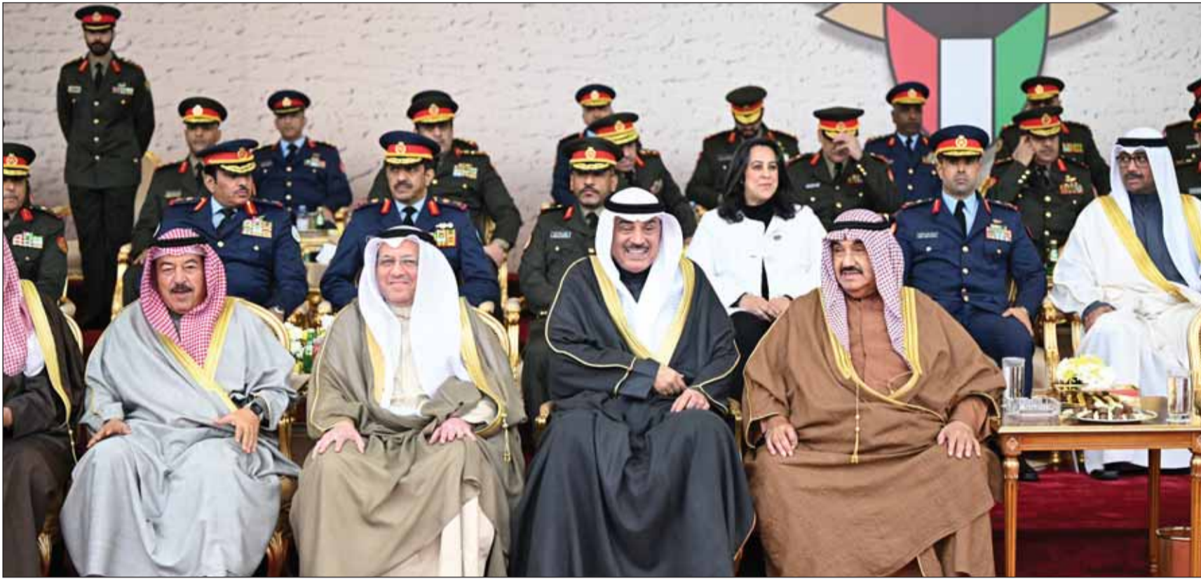
لسمو وليه العهد متوسماً سمو الشيخ ناصر المحمد والمستشار د. عادل بورسلي والشيخ د. سالم الجابر