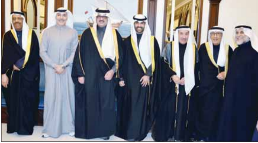
السفير السعودي الأمير سلطان بن سعد بيارك