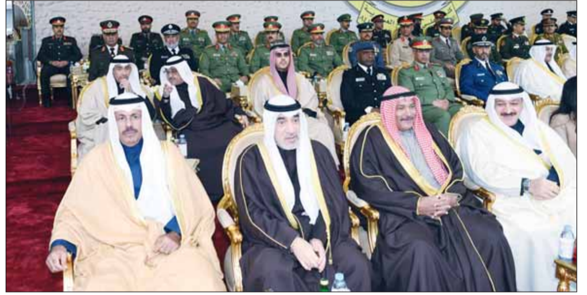
لسمو الشيخ أحمد النواف والشيخ فهد اليوسف والشيخ فهد سعد العبدالله وداحمد العوضي

تضم دفعة الخريجين 375 من الجيش الكويتي، و25 من الحرس الوطني، و5 من البحريين، و4 من اليمن، وقد حصل على تقدير امتياز 11 طالب ضابط، وتقدير جيد 334 طالب ضابط، وتقدير جيد 63 طالب ضابط وتقدير مقبول 1.