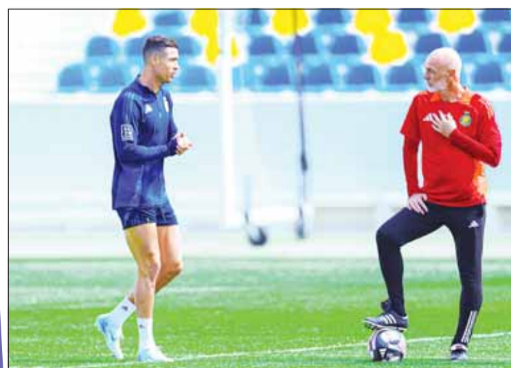
الدون جاهر لموقعه الجوهرة قبل بدء المباراة

يستعد الأهلي لمواجهة ضيفه النصر في كلاسيكو يشمل منافسات الجولة 20 من دوري روشن للمحترفين اليوم، على ملعب الإنماء بمدينة الملك عبد الله الرياضية بجدة. ويحتل الأهلي المركز الخامس برصيد 38 نقطة، خلف النصر الثالث والقادسية الرابع بـ44 نقطة لكل منهما، علماً بأن مواجهة الذهاب بين الفريقين انتهت بالتعادل (1-1). ويسعى الأهلي لتحقيق الفوز، على أمل الاقتراب من فرق المقدمة، بينما يسعى النصر لمطاردة ثنائي المقدمة "الهلال" (47) والاتحاد (49).