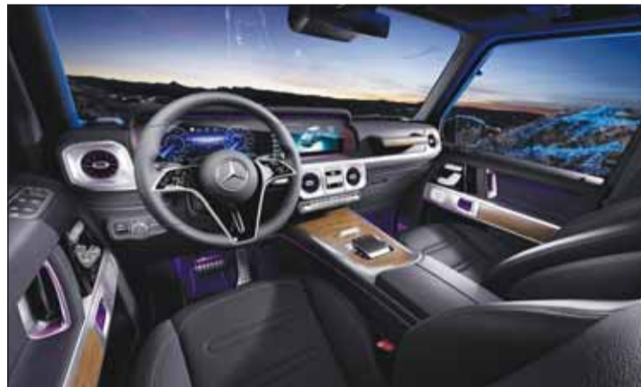
القيادة على الطرق الوعرة

الإجمالي هو 1.164 نيوتن متر. وبفضل مفهوم القيادة المبكر، تتسارع سيارة مرسيدس-بنز G 580 مع EQ Technology الجديدة كلياً من 0 إلى 100 كم/ساعة خلال 4,7 ثانية. السرعة القصوى ممددة إلكترونياً بـ 180 كم/ساعة. وبفضل قدرة المحركات الكهربائية على توفير أقصى عزم دوران من حالة التوقف التام، فإن سيارة الطرق الوعرة الكهربائية بالكامل تتفوق بقوة سحب هائلة وإمكانية تحكّم استثنائية. وهذا يثبت تميّزها سواء على المنحدرات الحادة أو الأسطح غير الممهدة.