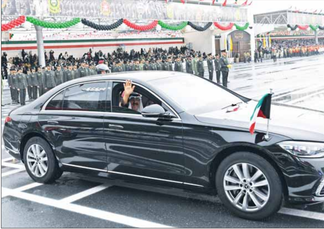
سمو الأمير الشيخ مشعل الأحمد محبياً مستقبليه