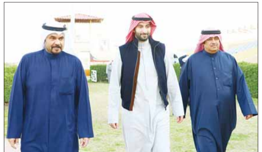
الفهد حاضراً للسباق

وكان موسم سباق الخيل لعام قد بدأ بطولته يوم 4 نوفمبر الماضي وتواصلت فعالياته حتى وصلت إلى سباق الشيخ عبدالله المبارك، وهي الجائزة السنوية التي أقامها ورثة عبدالله المبارك منذ سنوات طوال، إحياء لذكراه.