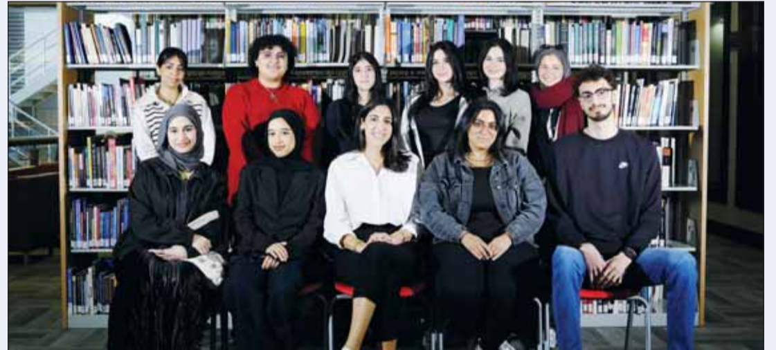
الطلبة الحاصلون على المنح