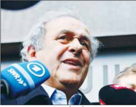
بلايني يصدد مقاضاة "فيفا"

هدد الفرنسي ميشيل بلايني الرئيس السابق للاتحاد الأوروبي لكرة القدم "يوفيفا" باتخاذ إجراءات قانونية ضد الاتحاد الدولي لكرة القدم "فيفا" بعد براءته من الاتهام بالفساد والتلاعب بأموال "فيفا" بعد صدور حكم قضائي جديد لصالحه من محكمة سويسرية.