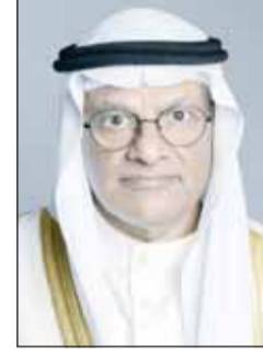
د. نادر الجلال

اعتمد وزير التعليم العالي والبحث العلمي د. نادر الجلال توصية لجنة توحيد سلم التقدير اللفظي والمعدل العلمي للمؤهلات الصادرة من دول الابعثات الأوروبية، التي شكلت بموجب القرار الوزاري رقم (249) بتاريخ 12 أغسطس 2024، برئاسة وكيل وزارة التعليم العالي بالإنابة.