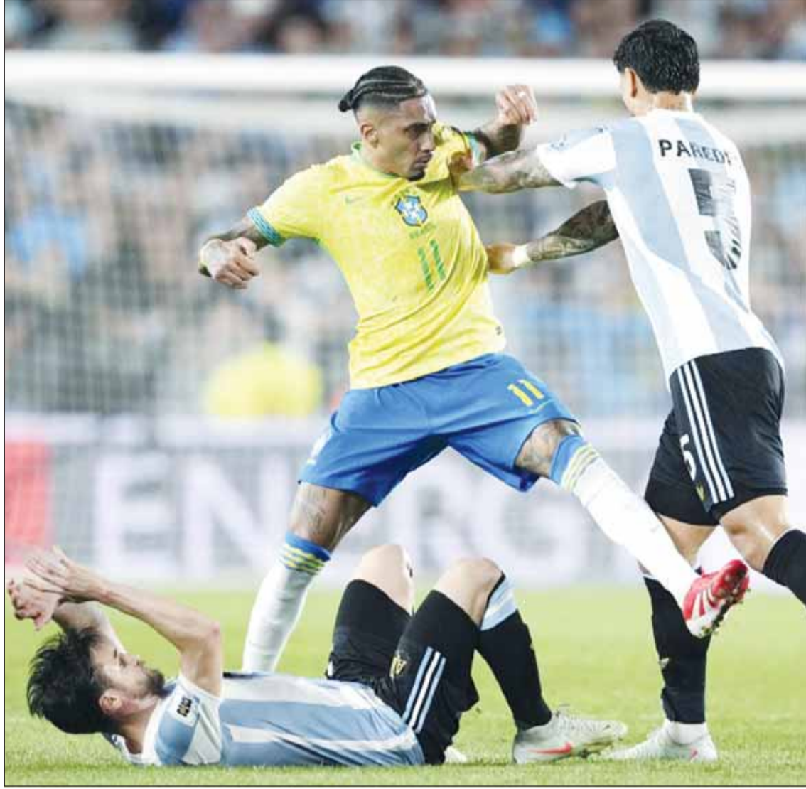
التانغو عزف عنه جراح السامبا

استغزت هذه التصريحات نجوم الأرجنتين، وهو ما أكده لاعب الوسط لياندرو بارديس، الذي قال بعد الانتصار العريض: "لا يجب عليك التحديث مسبقاً، خاصة عندما لا يمكنك إثبات ذلك في الملعب لاحقاً". وأضاف: "بمجرد قول رافينيا ذلك، أرسلنا تصريحاته إلى مجموعة واتساب الخاصة بنا.. نتحدث في الملعب دائماً"، في إشارة للرد العملي بالفوز الرباعي.