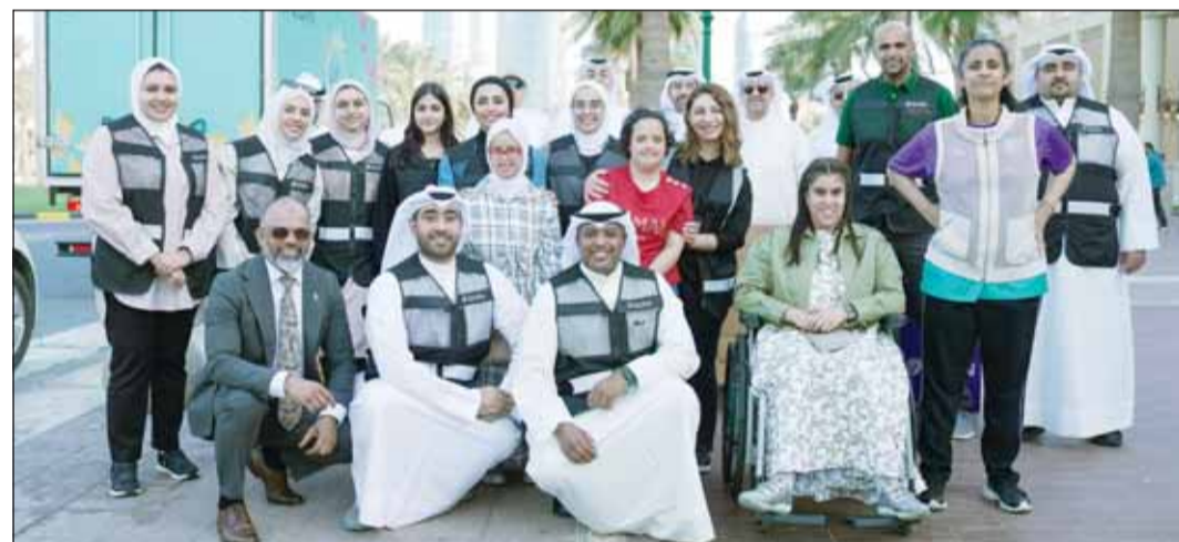
الخشتية والأصابع مع فريق "زين الشهور" التطوع وأبناء مركز الخرافي

القطاعات والإدارات، في خطوة تؤكد اهتمام أفراد عائلة زين بتحقيق المشاركة المجتمعية الفاعلة. ودايمًا ما تأتي حملة "زين الشهور" بشكل متجدد وتتوسع في برامجها ومبادراتها مع مرور كل عام، وتقوم الشركة من خلالها بمد جسور التعاون مع مختلف الجهات في الدولة لتجسد روح العطاء التي يتميز بها الشهر الفضيل عن غيره من الشهور.