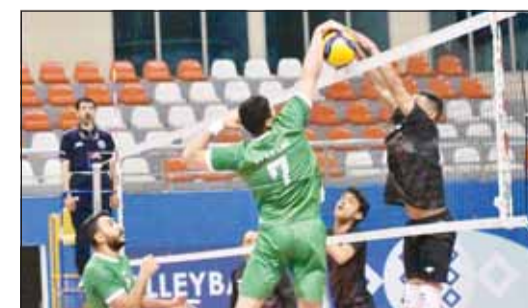
الأحضر حقق النصر بـ "الطائرة"

يختتم الدور التمهيدي من بطولة الدوري العام لكرة الطائرة اليوم، بإقامة مباراة واحدة تجمع بين كاظمة والقادسية بالجولة الأخيرة في التاسعة مساءً على اتحاد الكرة الطائرة بمجمع صالات الشيخ سعد العبدالله بضاحية صباح السالم. وكانت مباراة أول من أمس، قد شهدت فوز العربي على النصر بثلاثية نظيفة "17-25، 25-8، 25-16". وقبل لقاء اليوم، يتصدر الكويت ترتيب الفرق برصيد 28 نقطة يليه كاظمة 24 الشباب 24 القادسية 22 العربي 18 برقان 16 النصر 11 الصليبخات 9 الهرموك 5 التضامن 3 نقاط والساحل نقطتين. وتأهلت الفرق الستة الأوائل (الكويت) وكاظمة والشباب والقادسية والعربي وبرقان) إلى الدوري الممتاز الذي ينطلق 13 أبريل المقبل، ويقام بنظام "الذهاب والإياب" يعقبه "المرجع الذهبي" بين الأربعة الأوائل بالممتاز، بحيث يلتقي الأول مع الرابع والثاني مع الثالث. بينما تلعب فرق النصر والصليبخات والهرموك والتضامن والساحل، دوري الدرجة الأولى من ثلاث مراحل.