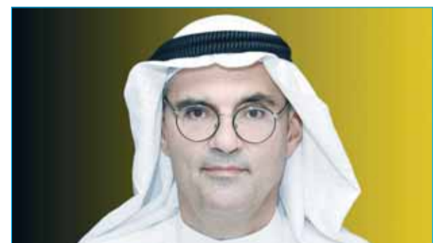
"أجيليتي جلوبال بي أل سي" تحقق 128 مليون دولار أرباحاً في 2024