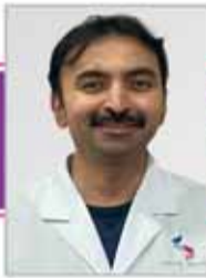
د . فيفيك . ب . س MBBS, DO, DNB طب العيون