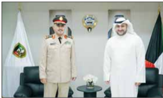
الشيخ د.عبدالله الصباح مع الملحق العسكري السعودي العميد الركن فرحان الشثري

بحث وكيل وزارة الدفاع الشيخ الدكتور عبدالله مشعل الصباح مع الملحق العسكري بسفارة المملكة العربية السعودية لدى دولة الكويت العميد الركن فرحان الشثري موضوعات عسكرية ودفاعية مشتركة.