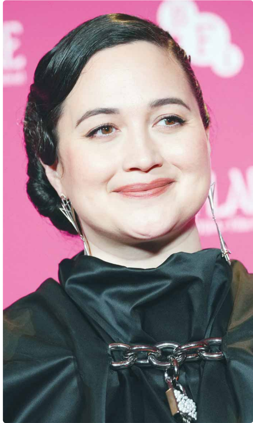
الممثلة الاميركية ليلي غلاستون خلال حضورها فيلم "حفل زفاف" في لندن

نسأل الله ان يحفظ الكويت وشعبها تحت قيادة سيدي سمو الأمير وسمو ولي عهده حفظهما الله ورعاهما... وكل عام وأنتم بخير اللهم ارحم شهداءنا الأبرار.