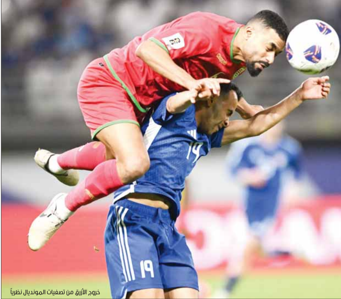
خروج الأزرق من تصفيات المونديال نظراً