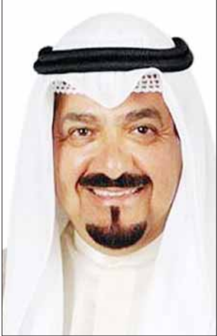
سمو الشيخ أحمد العبدالله