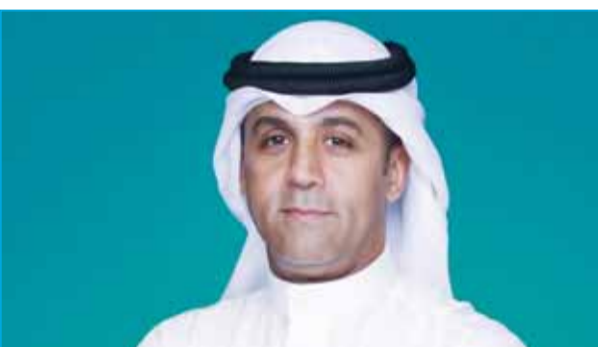
الشمالن: القوانين الاقتصادية الإيجابية تعزز تنفيذ مشاريع تنموية كبرى