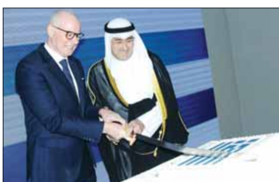
السفيران صادق معرفي ويونيس بلوتاس يقطنان حلوة الاحتفال

وأشار إلى وجود إمكانات كبيرة للشركات اليونانية للمشاركة بفعالية في مشروع الكويت الضخم "رؤية 2035"، لافتا إلى أن هذه المبادرة الطموحة فرصة فريدة لتعزيز تعاوننا، وقد تستفيد الكويت من خبرة اليونان في مجال البناء والطاقة المتجددة والتنمية الحضرية.