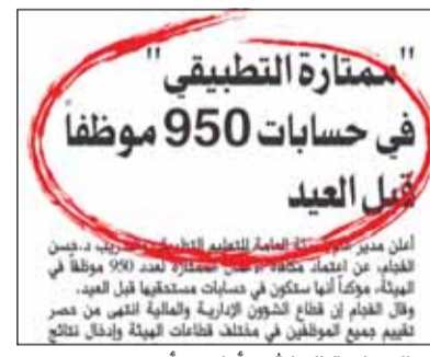
خبر السياسة المنشور أول من أمس

دقيقة لضمان استحقاق المستفيدين وفقاً للوائح المعمدة، مؤكدة حرص الهيئة على تمييز موظفيها وتقدير جهودهم، بما ينعكس إيجاباً على جودة الأداء داخل بيئة العمل.