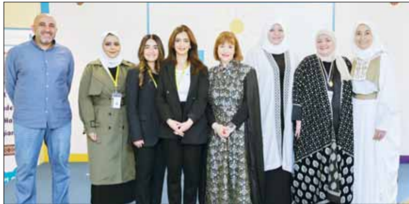
لقطة جماعية خلال الحفل