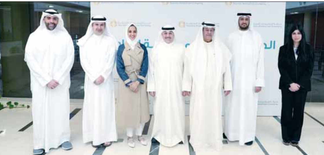
صورة جماعية لقيادات الشركة

عبر مزايادة علنية شملت "منتجع الهيلتون" و"نادي رأس الأرض" و"شاطئي العقيلة" و"المسيلة"