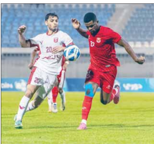
من لقاء النصر والفحيحيل في القسم الأول

دوري "البطولة" من دور واحد، فيما ستخوض الفرق الاربعة منافسات دوري "تفادي الهبوط"، من دور واحد أيضاً، يتحدد من خلاله هبوط فريقين لدوري الدرجة الأولى. وتوقفت المسابقة منذ 28 فبراير الماضي، لمشاركة فريقي العربي في كأس التحدي الآسيوي والقادسية في دوري أبطال الخليج، إضافة إلى مشاركة الأزرق في التصفيات المؤهلة إلى نهائيات كأس العالم 2026. وتوسع الأندية من خلال هذا الجولة إلى "تجميع النقاط"، وتحسين وضعها قبل انطلاق المرحلة الأخيرة من المسابقة. وفي لقاء اليوم، يسعى النصر إلى رد اعتباره من الفحيحيل الذي هزمه في القسم الأول 1-3، كما يرغب في انتصار يرفع معنوياته قبل خوض منافسات دوري تفادي الهبوط، فيما يطمح الفحيحيل إلى تحقيق الفوز والمنافسة على مركز متقدم.