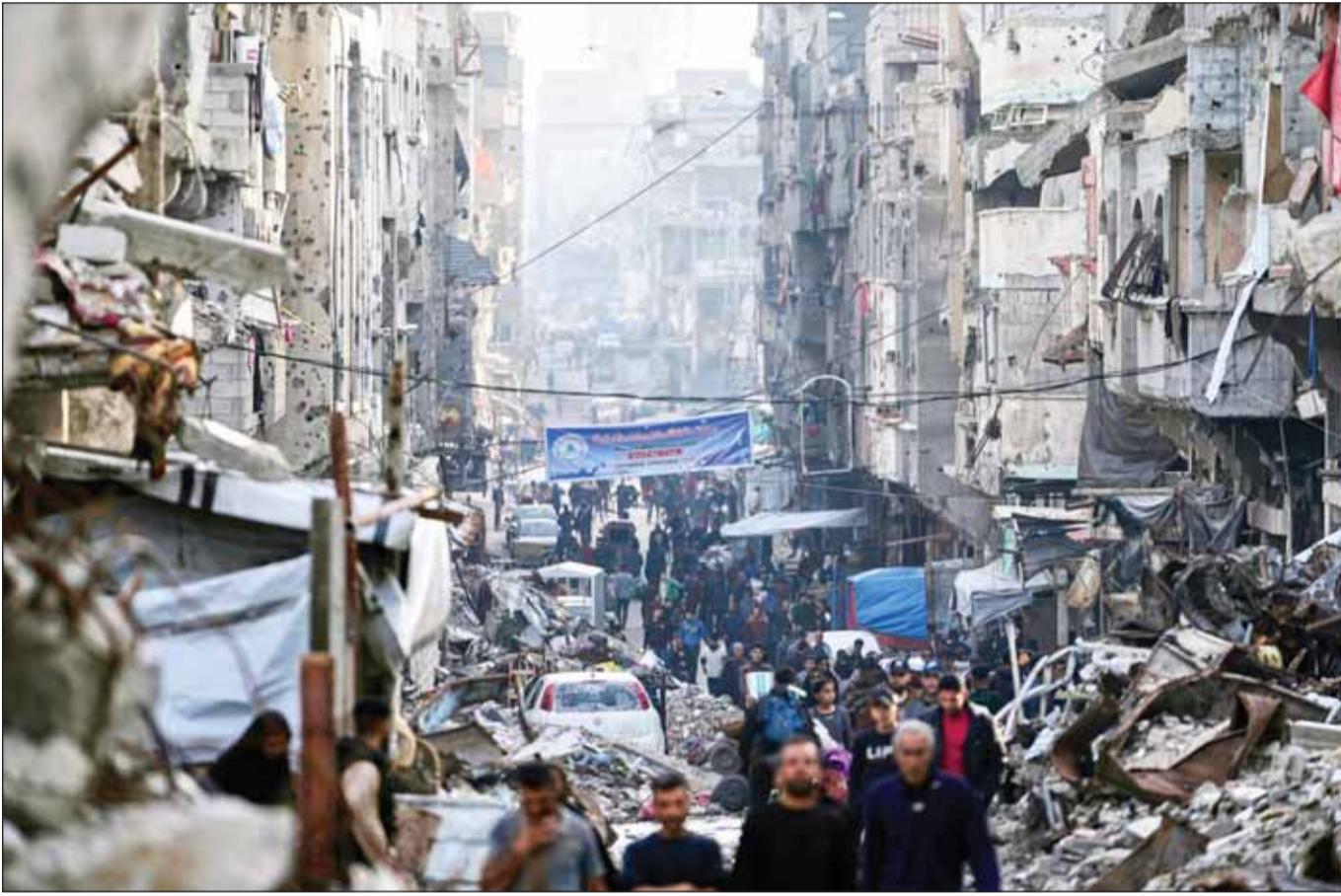
فلسطينيون يسحبون وسط الدمار الذي خلفته الغارات الجوية والأرضية الإسرائيلية على مخيم الشاطئ في مدينة غزة

إلى ذلك، أكدت الهيئة العامة للاستعلامات المصرية عدم صحة المزاعم التي تداولتها بعض المواقع الإخبارية ووسائل التواصل الاجتماعي بشأن تقديم مصر مساعدات عسكرية لإسرائيل، قائله إن الادعاءات تأتي ضمن حملة لنشر الأكاذيب حول المواقف المصرية، مضيفة أن الموقف المصري من العدوان على غزة ثابت وواضح، مشددة على أن مصر التي تقود الجهود الدبلوماسية لإنهاء الحرب وتدعم إقامة الدولة الفلسطينية المستقلة، تظل ملتزمة بمبادئها الثابتة في دعم الحق الفلسطيني ورفض الاحتلال والعدوان.