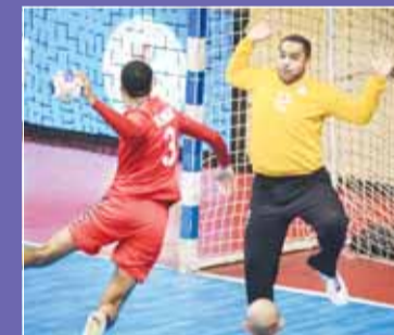
الصليبخات ضمن مقعداً بـ "الممتاز"