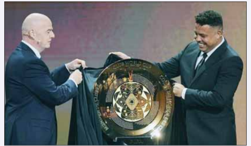
الفائز بـ "الظاهرة" يكشفاً عن درج البطولة

وقال رئيس الاتحاد الدولي لألعاب القوى سيباستيان كو، إن القرار الذي اتخذ كان دليلاً إضافياً على أن منظمته ستحمي فئة السيدات بقوة، ويأتي بعد ضغوط متزايدة من الرئيس الأميركي دونالد ترامب بمنع المتحولين جنسياً من المنافسة في الرياضة النسائية. ولم يتم تحديد جدول زمني لتطبيق اختبارات الموافقة المسبقة، لكن وكالة "ب" أفادت بأن نية اتحاد القوى هي إجراء الاختبارات للرياضيين الراغبين بالمنافسة في فئة السيدات ببطولة العالم (طوكيو - سبتمبر