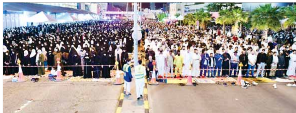
الشوارع المحيطة بالمسجد الكبير امتألت بالمصلين

على خط مواز، امتشد المصلون في مسجد عيد العزيز الراشد في منطقة السلام، فيما امتألت أرجاء مسجد عقلا الظفيري في منطقة الجبراء عن بكرة أبيها بالمصلين الذين توافدوا طلباً للفوز بالرحمة والمغفرة.