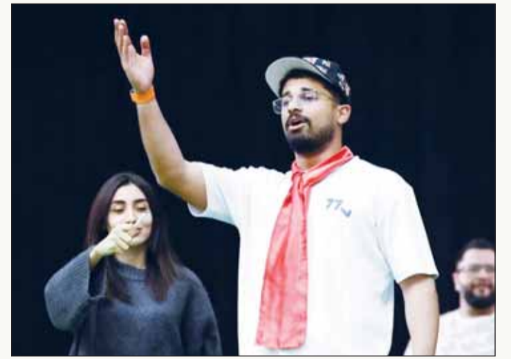
مشهد من مسرحية "الكرة بملعبكم"