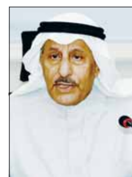
السفير خالد الغماس

أعلنت جمعية الهلال الأحمر الكويتي عن تقديم تبرع إلى وزارة الشؤون الاجتماعية بمليون دينار كويتي لصالح الحملة الوطنية الثالثة لسداد ديون الغارمين وذلك انطلاقاً من حرصها على تخفيف معاناة المواطنين الغارمين وذويهم. وقال رئيس مجلس إدارة الجمعية السفير خالد الغماس في تصريح لـ (كونا) أمس، إن هذا التبرع جاء تنفيذاً لتوجيهات القيادة السياسية في البلاد بضرورة تعزيز التكافل الاجتماعي ودعم المواطنين المتعثرين ماليًا.