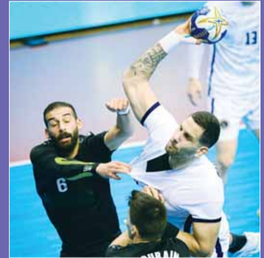
يد برقان تغلب على القرنين

أعلن الاتحاد العربي لكرة اليد، مشاركة الإمارات في بطولة كأس العرب وبسنغها 10أ لمنتخبات الرجال، والتي تستضيفها الكويت للفترة من 4 إلى 12 مايو المقبل، بالتزامن مع أسبوع الاتحاد الدولي لكرة اليد. وبذلك يصبح "الإمارات" تاسع المنتخبات التي أعلنت المشاركة في البطولة، بعد الكويت "المستضيف" والسعودية وقطر والبحرين والعراق والمغرب وتونس ومصر. وتقام بطولة "كأس العرب" لكرة اليد، بعد انقطاع طويل حيث كانت آخر بطولة نظمت عام 2002، وأقيمت بطولة كأس العرب لليد تسع مرات سابقاً، حققت مصر اللقب في أول نسختين 1975 و1977 والكويت 1979 و1988 وتونس 1986 و1993 السعودية 1998 الجزائر 2000 وأخر بطولة أقيمت عام 2002 حقق لقبها