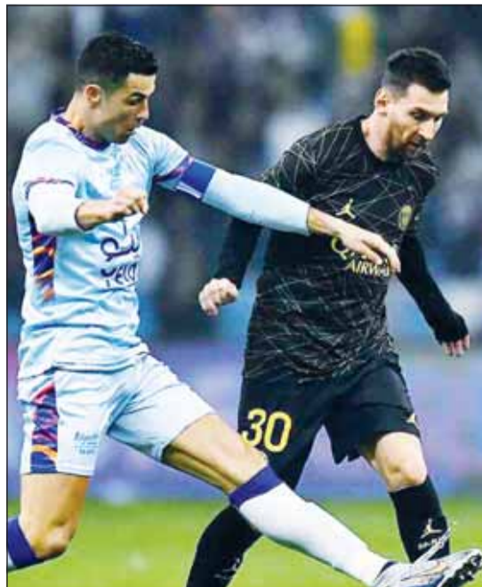
ميامي يسعده لجمع الدون والبرغوث بفريق واحد

كشفت تقارير إعلامية عن مفاجأة مدوية بشأن صفقات فترة الانتقالات الصيفية المقبلة قبل انطلاق مونديال الأندية. وأوضحت صحيفة talkSPORT أن الأسطورتين كريستيانو رونالدو وليونيل ميسي قد يجتمعان في فريق واحد خلال كأس العالم للأندية 2025.