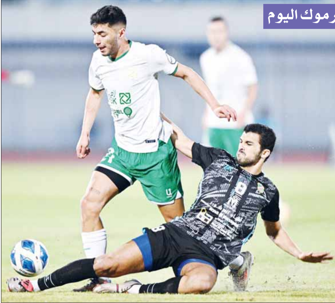
العربي يسعده لتجاوز السالمة غداً