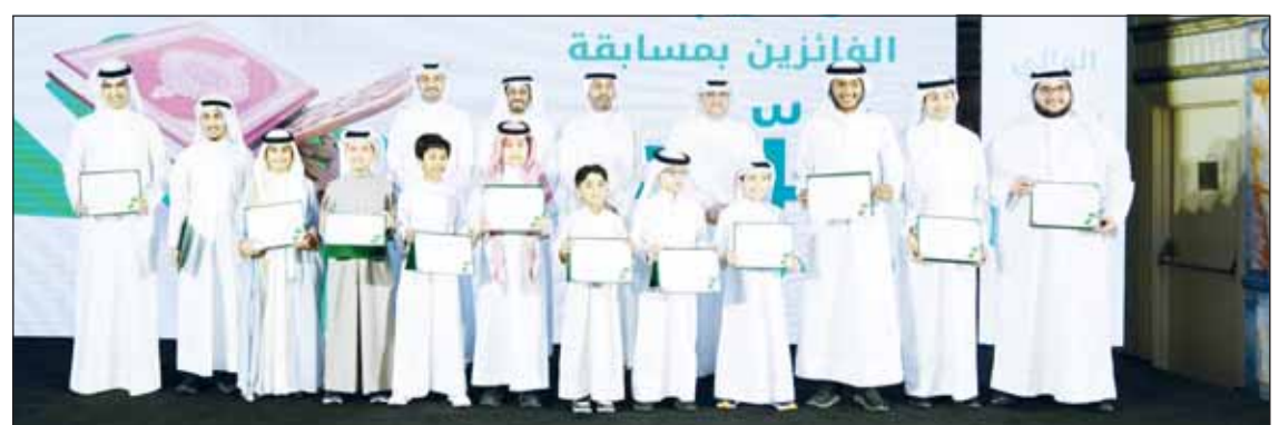
حفل تكريم الفائزين بمسابقة قراء الأطفال بحضور الرئيس التنفيذي خالد الشعلان ورئيس هيئة الفتوى والرقابة الشرعية سيد محمد الطبطبائي