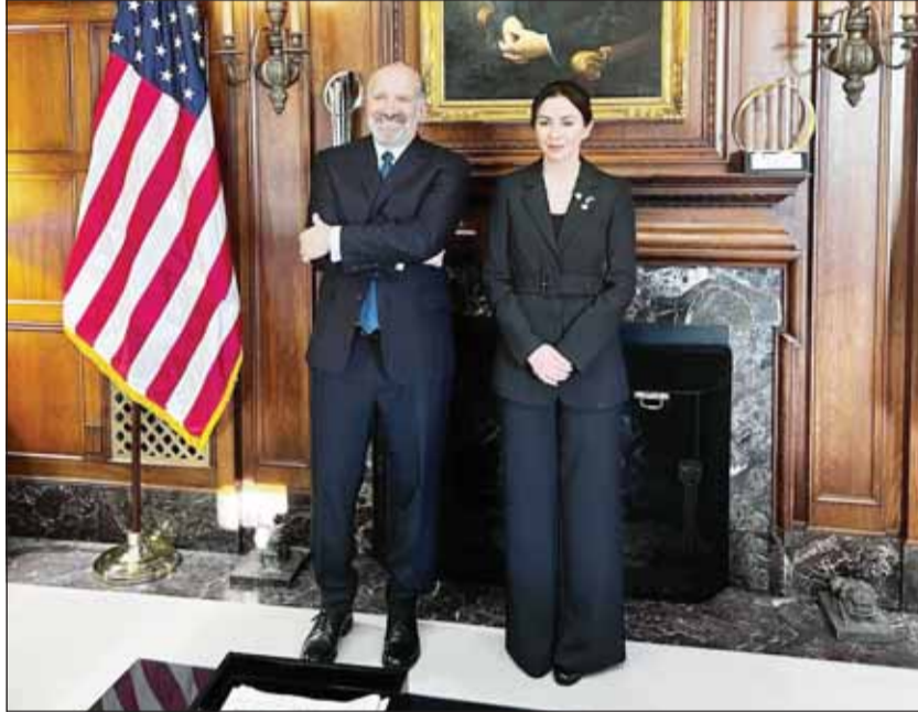
السفيرة الشیخة الزین الصباح مع وزیر التجارة الأميركي هوار لوتنيك

المنتجات الأميركية المستوردة لغايات العمليات العسكرية معفاة بموجب القوانين