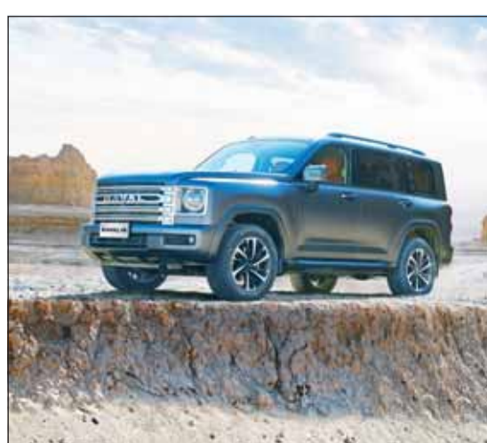
سيارة هافال H9