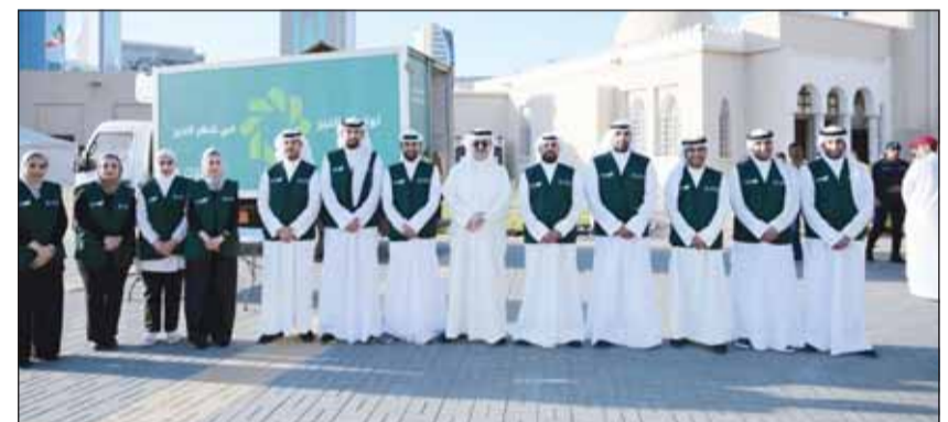
محافظة العاصمة الشيخ عبدالله سالم العلي الصباح مع فريق بيت التمويل الكويتي التطوعي