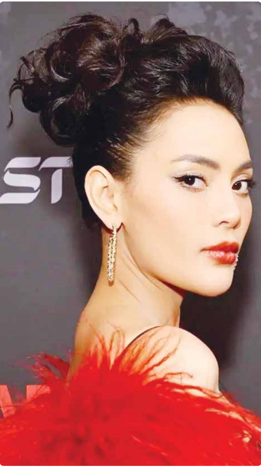
الممثلة الاندونيسية إريكا كارلينا خلال حضورها فيلم "Pabrik Gula" فيمى لوس أنجلوس

القاهرة - وكالات، أقدم أب على تعذيب ابنائه الثلاثة في قرية العتوة البحرية في محافظة الغربية المصرية، مما أسفر عن وفاة اثنين منهم، وإصابة الثالث بجروح خطيرة. ووفقا لما ورد في التحقيقات فقد حاول الجيران التدخل بعد سماعهم صراخ الأطفال، لكنهم وجدوا بوابة المنزل مغلقة بإحكام.