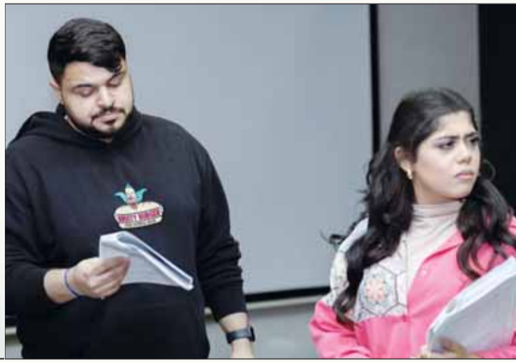
هبة مسرحية Be Happy