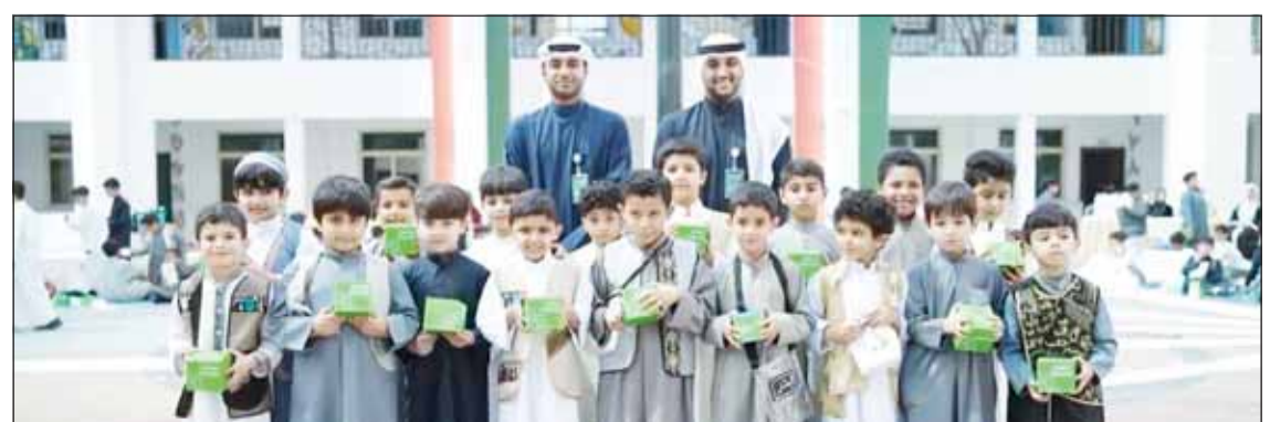
فعالية القرقيعان في المدارس