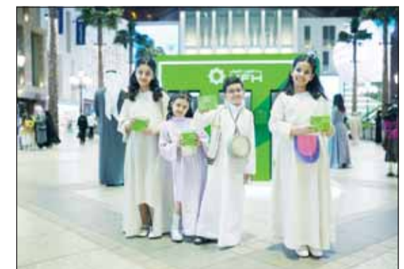
فردية الأطفال بالقرقيعان