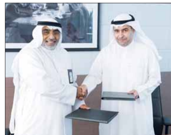
جانب من مراسم توقيع الاتفاقية

ليتم استرجاع البيانات عن طريق رقم العضوية الخاصة بالشركة أو المورد المسجلة في الفرقة، وإنشاء شهادة السجل التجاري بصورة آلية مع إرفاقها في ملف الشركة. ولفت إلى أن هذه الخطوة تعكس التوجه الحكومي نحو التحول الرقمي في الخدمات المالية، بما يحقق المزيد من السهولة والسرعة في إنجاز المعاملات، ويدعم رؤية الكويت 2035 في تطوير البنية التحتية الرقمية وتعزيز التكامل بين المؤسسات الوطنية.