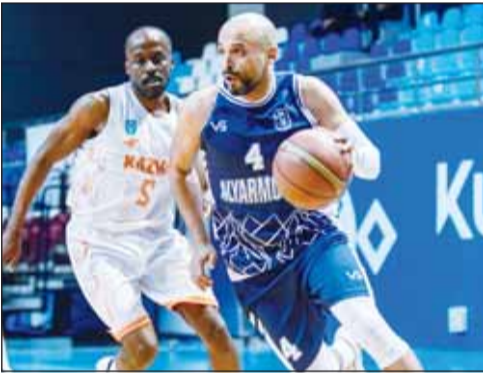
كازمة قسا على اليرموك