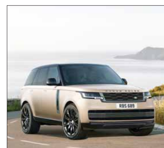
سيارة رينج روفر