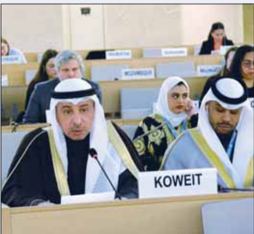
السفير ناصر الهين

كما أكد السفير الهين موقف دولة الكويت الثابت في دعم الشعب الفلسطيني داعياً إلى مواصلة الجهود الدبلوماسية والاقتصادية والإنسانية ومساندة جهود الرامية إلى إعمال حقوقه غير القابلة للتصرف بما في ذلك تقرير المصير وإقامة دولته المستقلة ذات السيادة وعاصمتها القدس الشرقية على حدود الرابع من يونيو 1967 وفقاً لقرارات الشرعية الدولية ومبادرة السلام العربية.