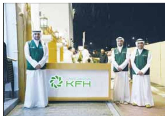
فريق البنك التطوعي يقدم خدمة ضيافة المصلين في المساجد