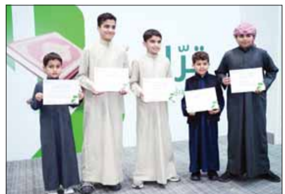
مسابقة قراء بيت التمويل الكويتي

وأضاف «بتعاون مشترك بين بيت التمويل الكويتي ومحافظة العاصمة والفروانية، شارك كل من محافظ العاصمة الشيخ عبدالله سالم العلي الصباح، ومحافظ الفروانية الشيخ عذبة ناصر العذبي الصباح بتوزيع وجبات إفطار الصائم في محافظتي العاصمة والفروانية إلى جانب فريق بيت التمويل الكويتي التطوعي، وأشادوا بدورهما على دور البنك في تنفيذ مثل هذه