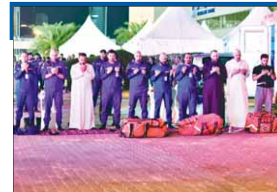
تقبل الله طاعتكم... عساكم عاقبة"

أحيا المصلون صلاة القيام ليلة السابع والعشرين من شهر رمضان المبارك، وسط إجراءات تنظيمية من قبل وزارة الداخلية وجهات الدولة الأخرى المعنية، كما تواجدت فرق الطوارئ الطبية وشارك في تقديم الخدمات للمصلين عشرات المتطوعين والمتطوعات الذين استحقوا الشكر والتقدير.