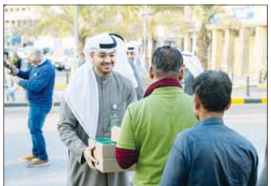
توزيع وجبات إفطار الصائم