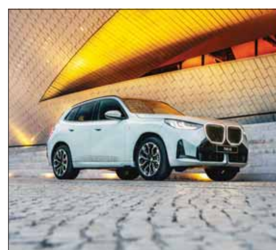
بي إم دبليو اكس 3