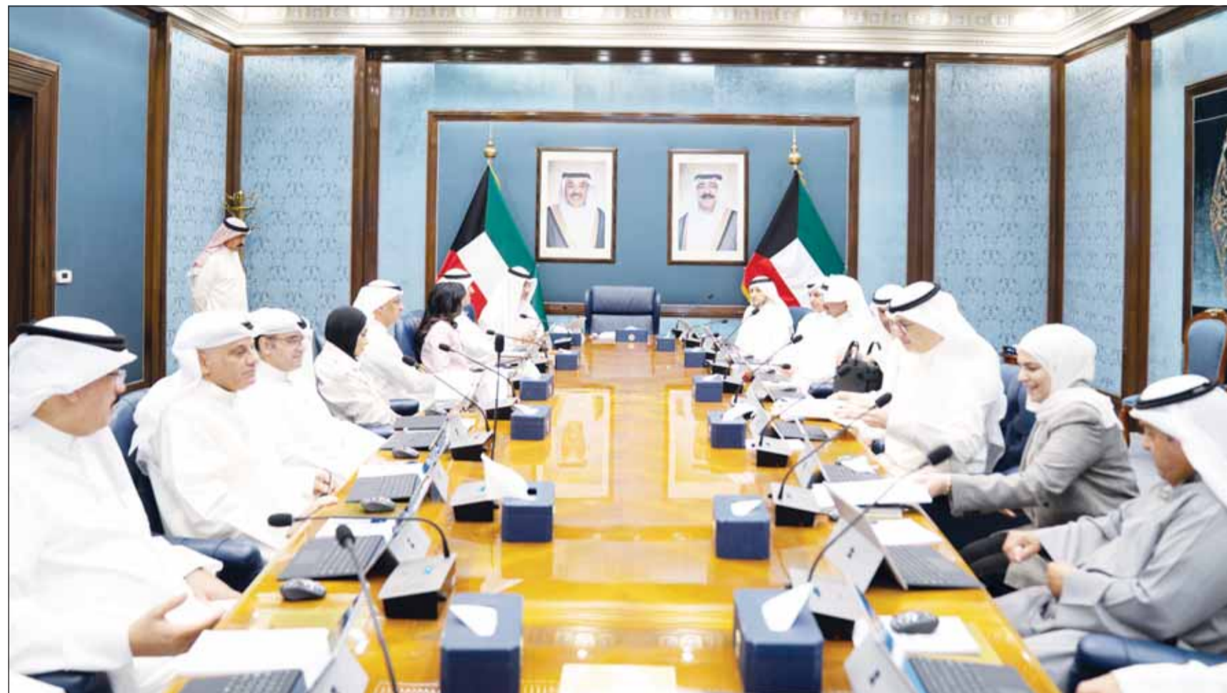
جانب من اجتماع مجلس الوزراء برئاسة رئيس المجلس بالإنابة الشيخ فهد اليوسف

العجيل: "التجارة" لا يمكنها التهاون مع أي تجاوزات قد تمس بثقة المستهلك