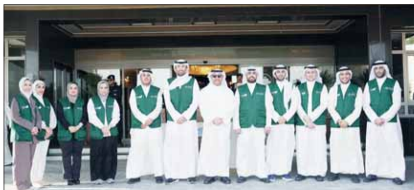
محافظة الفروانية الشيخ عذبة ناصر الصباح مع فريق بيت التمويل الكويتي التطوعي