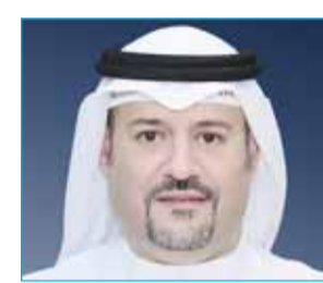
"أولاد علي الغانم للسيارات" تحقق 31,13 مليون دينار أرباحاً صافية في 2025 بنمو 6,42% 09