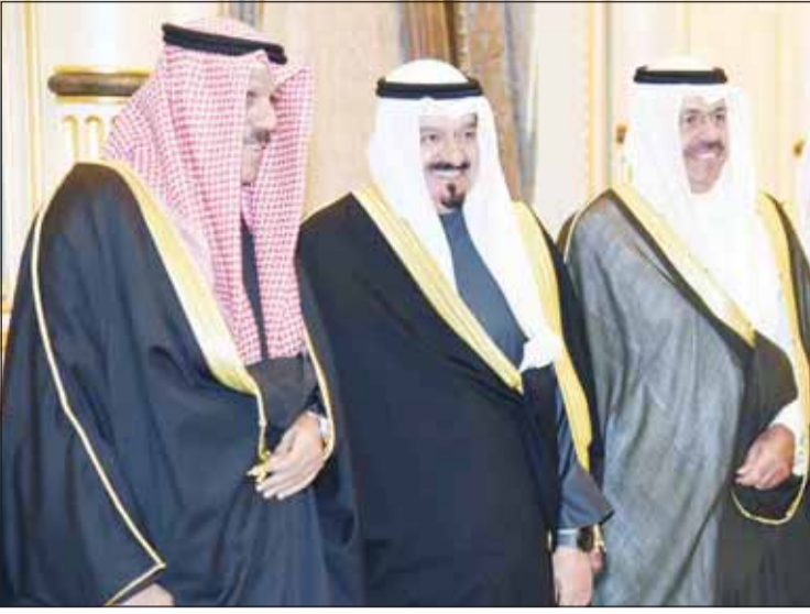
سمو رئيس مجلس الوزراء الشيخ أحمد عبدالله مع سمو الشيخ أحمد والشيخ فيصل النواف