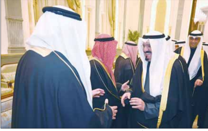
سمو رئيس مجلس الوزراء الشيخ أحمد عبداللّه يهنئ