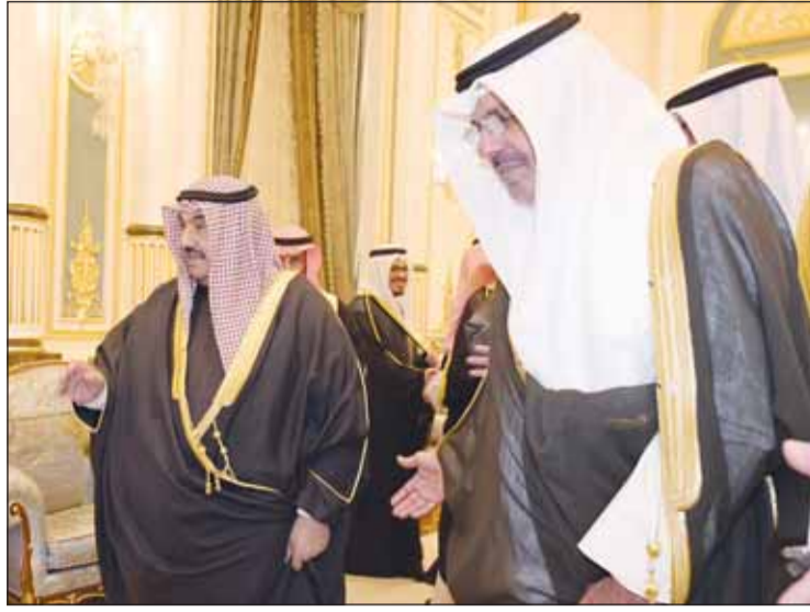
سمو الشيخ ناصر المحمد وفيه استقبله سمو الشيخ أحمد النواف