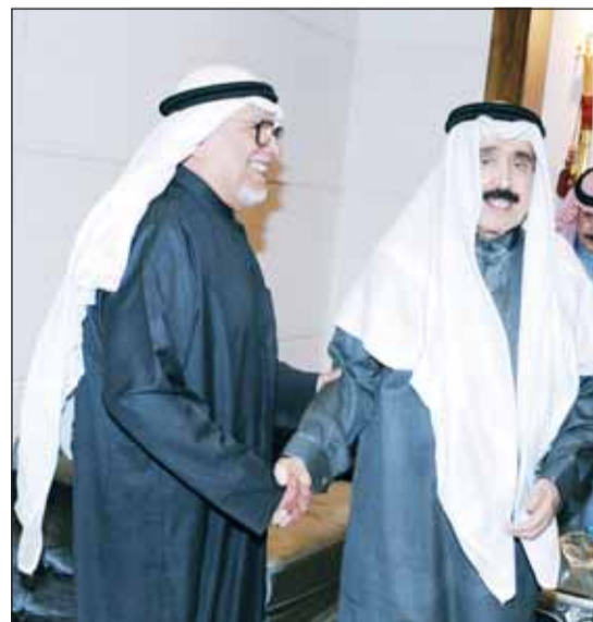
العميد رئيس التحرير أحمد الجارالله مهنتاً الشيخ علي الجراح