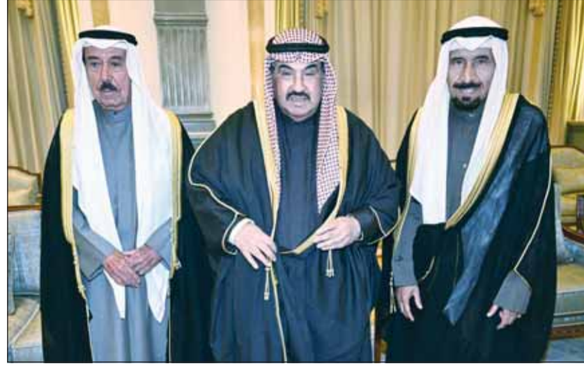
سمو الشيخ ناصر المحمد والشيخ مبارك الجابر والشيخ علي الجابر