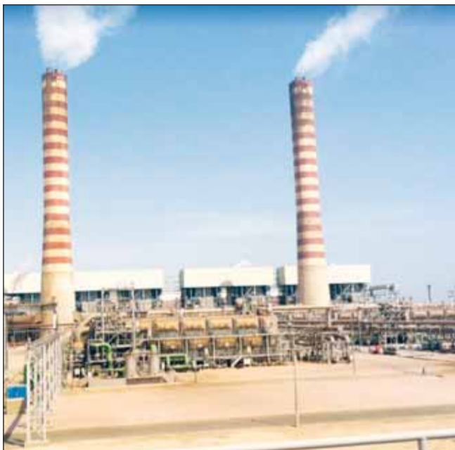
محطة الزور الجنوبية

وذكرت ان الوزارة تضع ضمن أولوياتها المحافظة على مستويات المخزون الاستراتيجي من المياه، واتخاذ الإجراءات التشغيلية اللازمة لضمان عدم انخفاضه خلال فترة الصيانة، وذلك عبر إدارة الأعمال المائية وتوزيع الإنتاج بين محطات التحلية المختلفة بما يحقق التوازن المطلوب وفق معدلات الاستهلاك للمياه العذبة خلال تلك الفترة.