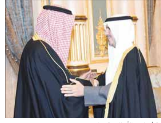
... والشيخ عبدالله ناصر الصباح