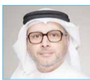
بورصة الكويت تنمو بأرباحها الصافية 55% إلى 28,18 مليون دينار 10