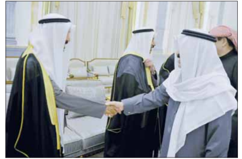
العميد رئيس التحرير أحمد الجارالله يقدم التهاني