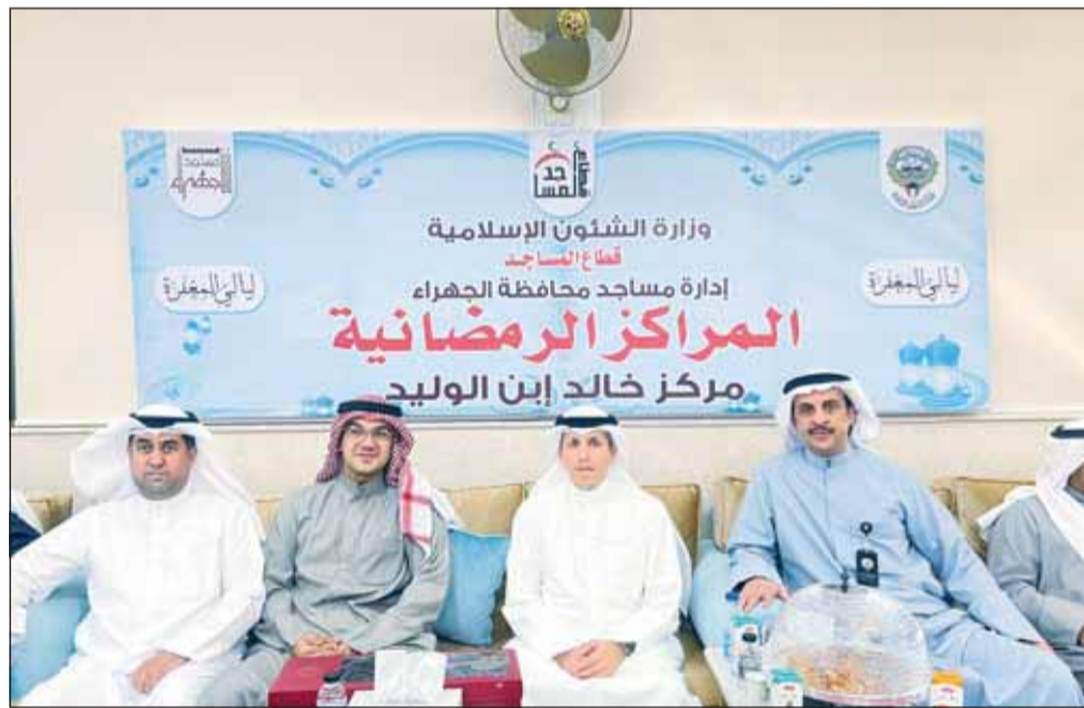
وزير الأوقاف محمد السوسني لادع زيارته مركز خالد بن الوليد الرمضاني في «المطلاع»

قام وزير الأوقاف والشؤون الإسلامية د.محمد السوسني أمس بزيارة تفقدية إلى المركز الرمضاني (خالد بن الوليد) بمدينة المطلاع واطلع على سير الأعمال والجهود المبذولة في تطوير الخدمات المقدمة للمركز ورواده.