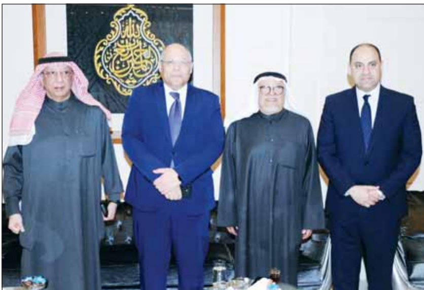
السفير المصري محمد أبو الوفا والقنصل محمد مطاوع يهثان