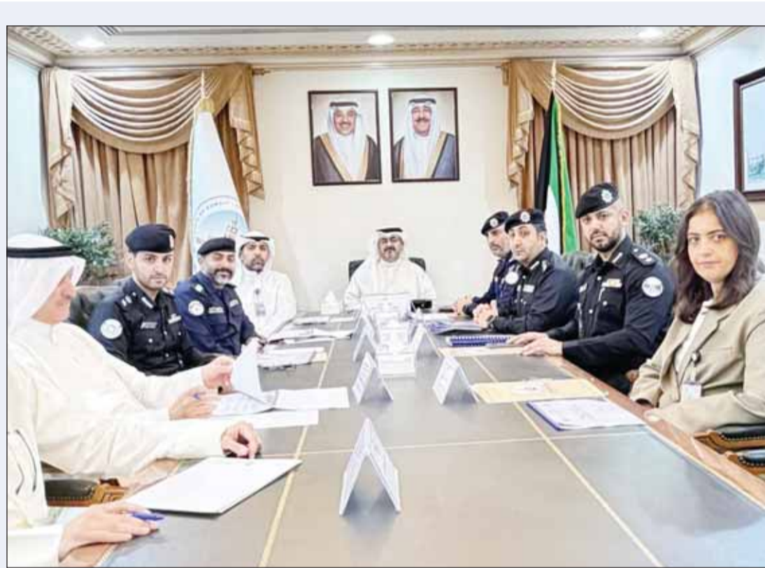
محافظ العاصمة الشيخ عبدالله السالم مترأساً الاجتماع

أزمر وزير الصحة د. أحمد العوضي جميع المنشآت الخاضعة لرقابة الصحة العامة بضرورة تحصيل الرسوم المقررة مقابل الخدمات المقدمة عبر القنوات المصرفية والدفع الإلكتروني فقط، مشدداً على الامتناع التام عن التحصيل النقدي، وذلك في إطار دعم توجه الدولة نحو التحول الرقمي وتعزيز الشفافية في الخدمات الصحية. وأكد العوضي في خطاب رسمي إلى وكيل وزارة الصحة المساعد لشؤون الصحة العامة د. المنذر الحساوي،