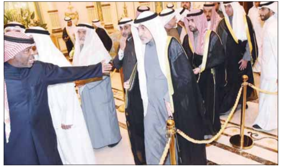
النائب الأول الشيخ فهد اليوسف قدم التهانيم

استقبل أبناء المغفور له الأمير الراحل الشيخ نواف الأحمد الجابر الصباح، في "دار يمامة" بضاحية الصديق مساء أول من أمس، المهنيين بشهر رمضان المبارك. وتقدم الحضور سمو ولي العهد الشيخ صباح خالد، وسمو الشيخ ناصر المحمد وسمو رئيس مجلس الوزراء الشيخ أحمد عبدالله، إلى جانب عدد من الشيوخ وكبار المسؤولين والدبلوماسيين والشخصيات العامة، وحشد كبير من المواطنين، الذين غصت بهم "دار يمامة"، في مشهد عكس روح التضام الوطني والمكانة التي يحظى بها آل الصباح في قلوب الكويتيين ونفوسهم. وأكد الحاضرون إن هذه اللقاءات الرمضانية تمثل تقليداً راسخاً يميز قيم التراحم والتكاتف، ويجسد روح الأسرة الواحدة التي تتميز بها الكويت، في صورة متجددة من صور الوحدة المجتمعية، التي تجلج بأبهى مظاهرها في المناسبات الوطنية والدينية.