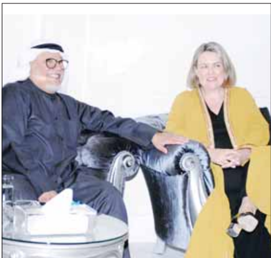
السفيرة الأسترالية ميليسا كيلبي مهنتاً