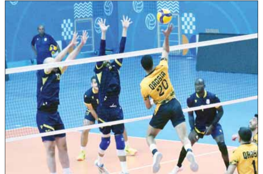
المسابقات تغلب الطاولة علم اليرموك