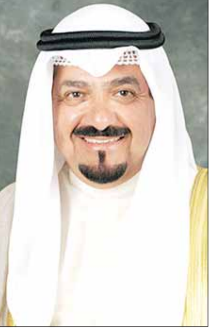
سمو الشيخ أحمد العبدالله

سلطان بروناي دار السلام الصديقة بمناسبة ذكرى العيد الوطني لبلادها. وبعث ببرقية تهنئة إلى الرئيس الدكتور محمد عرفان علي رئيس جمهورية غيانا التعاونية الصديقة بمناسبة ذكرى يوم الجمهورية لبلادها.