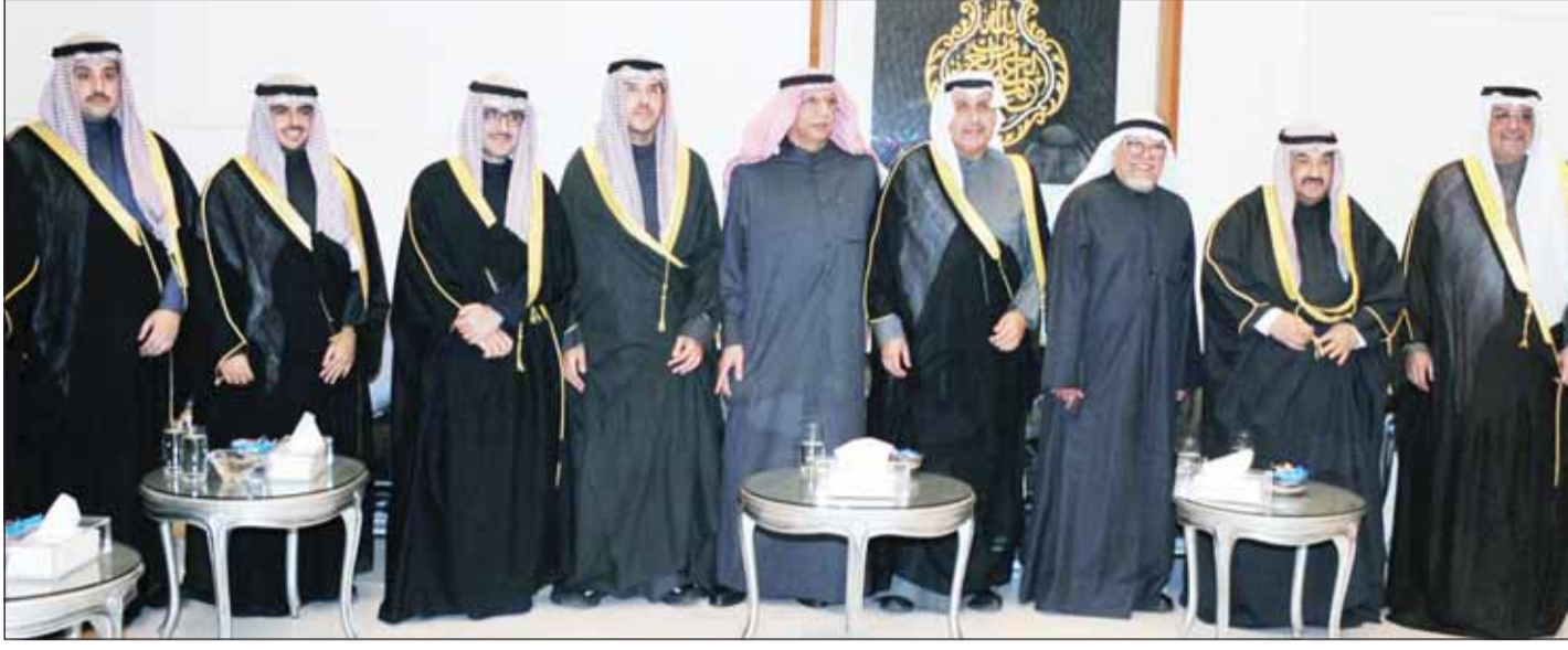
سمو الشيخ ناصر المحمد والشيخ حمد جابر العلي والشيخ حمد السالم وصباح الناصر و.أحمد الناصر ومحمد أحمد الناصر ويدر صباح الناصر