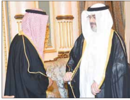
تهنئة من الشيخ عبدالله سالم العلي