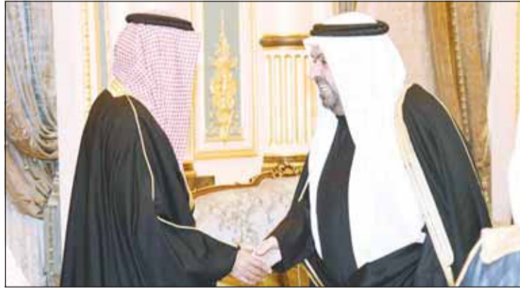
الشيخ خالد البدر مهنتا