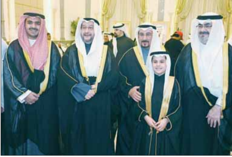
الشيخ عبدالله السالم والشيخ فهد جابر العليّ والشيخ د. صباح جابر العليّ