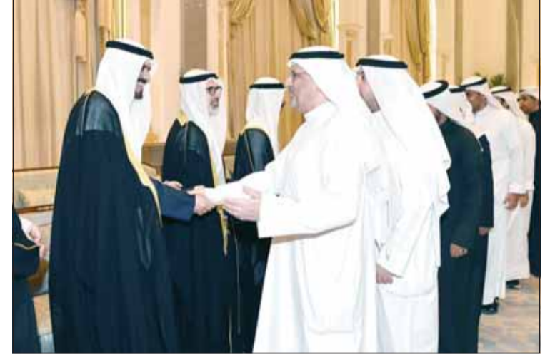
الوزير عمر العمر مهنتاً