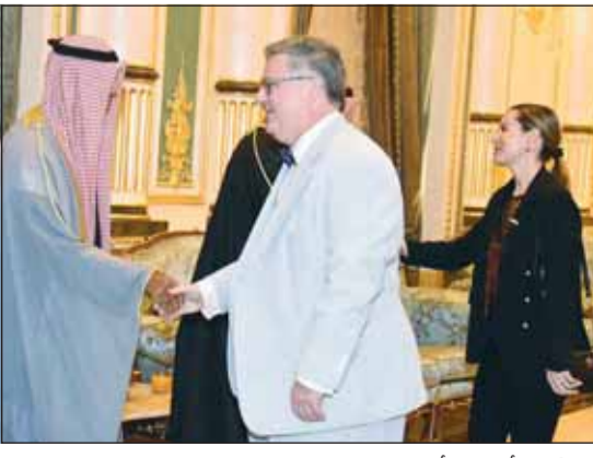
القائم بالأعمال الأميركي يقدم التهانيم