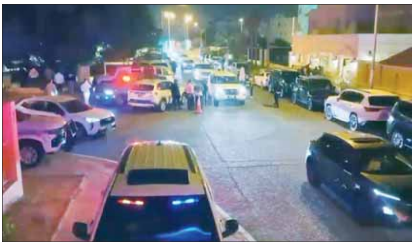
جانب من الحملة