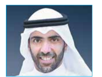
"أولاد علي الغانم للسيارات" تحقق 31,13 مليون دينار أرباحاً صافية في 2025 بنمو 6,42% 09