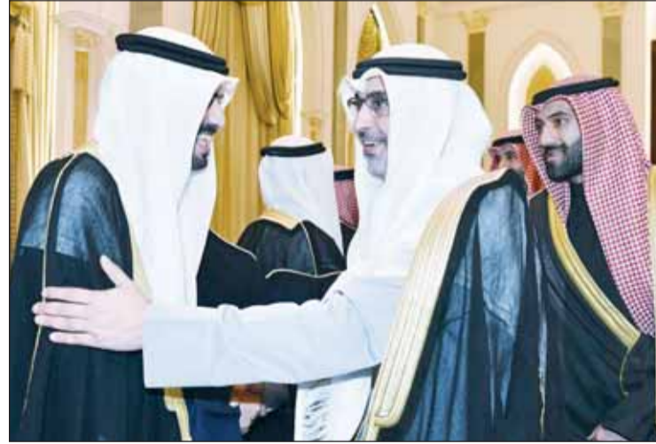
الشيخ محمد العبدالله والشيخ فهد خالد الفهد