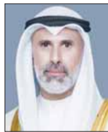
الشيخ جراح الجابر

تلقى وزير الخارجية الشيخ جراح الجابر، أمس، اتصالا هاتفيا من وزير الخارجية والهجرة وشؤون المصريين بالخارج في جمهورية مصر العربية الشقيقة الدكتور بدر عبدالعاطي، جرى خلاله مناقشة أقر المستجدات على الساحتين الإقليمية والدولية.