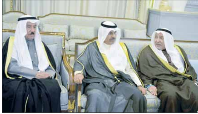
سمو الشيخ أحمد النوا و والشيخ مبارك الفهد والشيخ مبارك الجابر

استقبل أبناء وأحفاد الأمير الراحل الشيخ جابر الأحمد الجابر الصباح، طيب الله ثراه، مساء أول من أمس، المهنيين بحلول شهر رمضان المبارك في ديوان "دار جابر" بمنطقة الزهراء. وتقدّم المهنيين سمو ولي العهد الشيخ صباح الخالد، وفي معيته ثلة من شيوخ الأسرة، إضافة عدد من المسؤولين ورجال الأعمال والإعلاميين والشخصيات العامة، وحشد من المواطنين، فيما كان في استقبالهم الشيخ مبارك الجابر والشيخ علي الجابر وإخواتهما من أبناء الأمير الراحل وأنجالهم. وفي أجواء إيمانية عكست طبيعة المناسبة، تبادل الحضور التهاني والتبريكات بالشهر الفضيل، مجسدين تقليداً أصيلاً تميّز به المجتمع الكويتي، وتناقشته أجياله عبر السنين، ومرسّخين صورة فريدة من التراحم والتكافل وصلة الأرحام، التي تؤكد، في كل مناسبة، أن ما يجمع الكويتيين رويط اجتماعية وثيقة، وصلات تاريخية عميقة، وأنهم جميعاً كانوا وسيبقون أسرة واحدة، وانتماءهم إلى الوطن وولاؤهم لقادته.