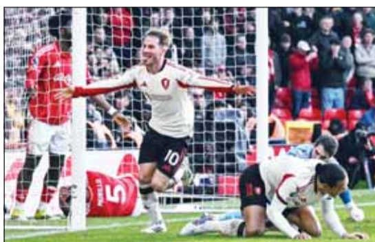
ماك أليستر سعيداً بصدارة برمنجهام نوتنغهام

انتصاره الأول على منافسه منذ الثاني من مارس 2024، حينما انتصر على ذات الملعب بالنتيجة نفسها. ورفع ليفربول رصيده إلى 45 نقطة في المركز السادس، بفارق الأهداف خلف تشيلسي ومانشستر يونايتد، صاحب المركزين الرابع والخامس على الترتيب، في المقابل توقف رصيده نوتنغهام عند 27 نقطة في المركز 17.