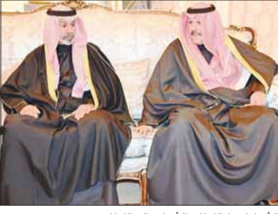
الشيخ فيصل النواف والشيخ سالم النواف