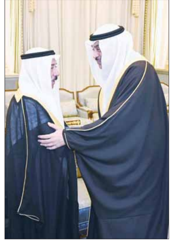
سمو ولي العهد الشيخ صباح خالد مهنتاً الشيخ مبارك

تقدّمهم سمو ولي العهد... وكان في استقبالهم أبناء الأمير الراحل وأحفاده