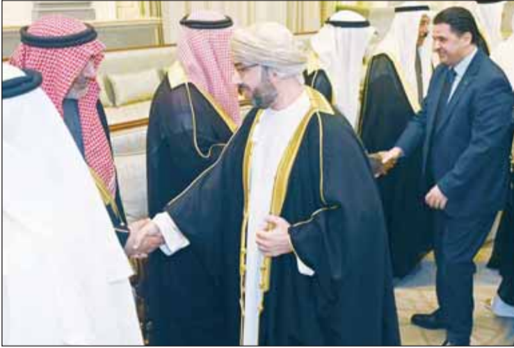
سفيرا الأردن وعمان يقدمان التهاني