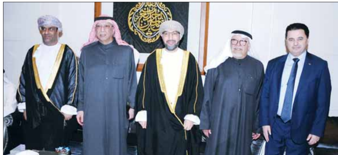
السفير الأردني سنان المجالي والسفير العماني د.صالح الخوصمي والسكرتير أول يحيى الرحيبي