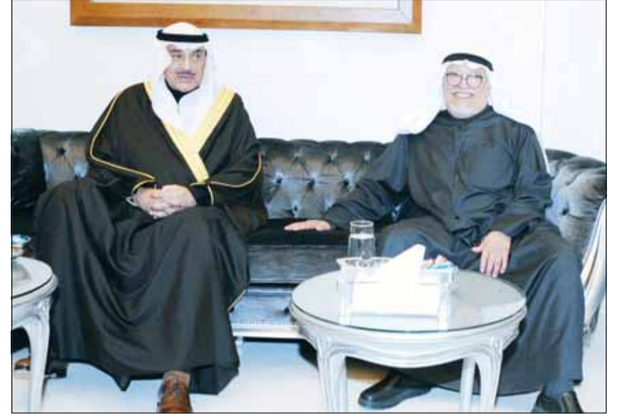
سمو وليه العهد الشيخ صباح الخالد والشيخ علي الجراح