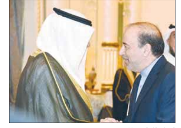
السفير الإيراني بيارك