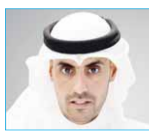
"أولاد علي الغانم للسيارات" تحقق 31,13 مليون دينار أرباحاً صافية في 2025 بنمو 6,42% 09