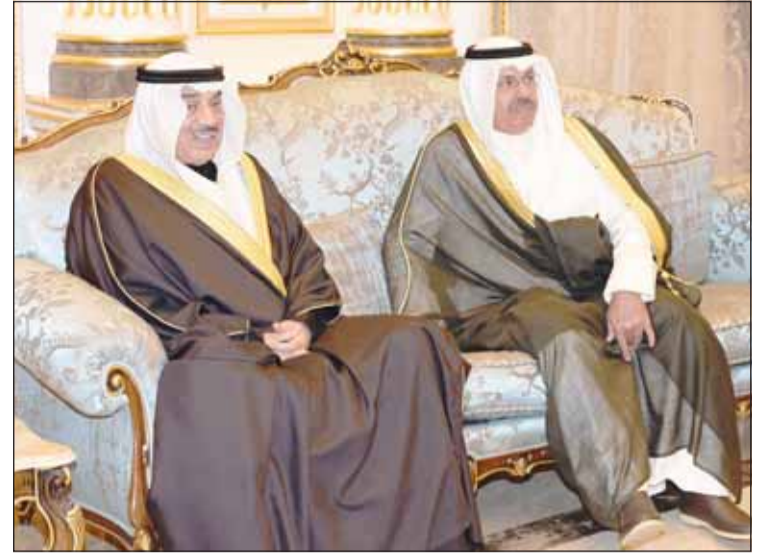
سمو ولي العهد الشيخ صباح خالد وسمو الشيخ أحمد النواف