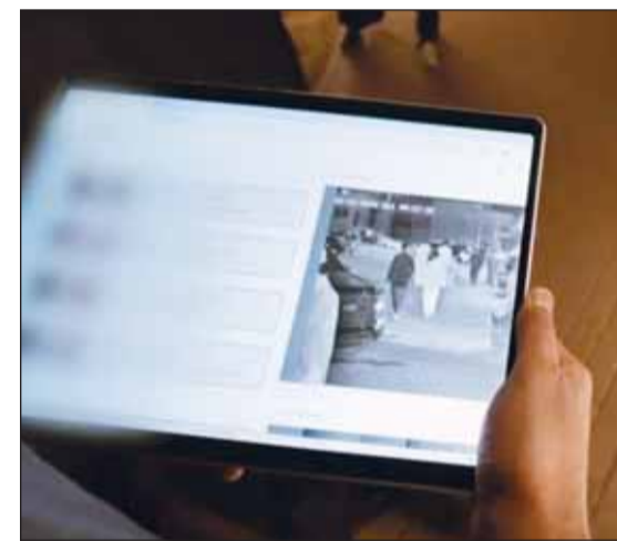
التعرف على الأشخاص بواسطة أحدث التقنيات فيم الدوريات الذكية