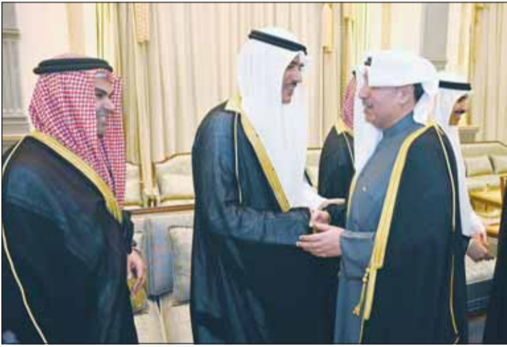
الشيخ حمد جابر العليّ قدم التهاني للشيخ حمود والشيخ صباح

استقبل أبناء وأحفاد الأمير الراحل الشيخ جابر الأحمد الجابر الصباح، طيب الله ثراه، مساء أول من أمس، المهنيين بحلول شهر رمضان المبارك في ديوان "دار جابر" بمنطقة الزهراء. وتقدّم المهنيين سمو ولي العهد الشيخ صباح الخالد، وفي معيته ثلة من شيوخ الأسرة، إضافة عدد من المسؤولين ورجال الأعمال والإعلاميين والشخصيات العامة، وحشد من المواطنين، فيما كان في استقبالهم الشيخ مبارك الجابر والشيخ علي الجابر وإخواتهما من أبناء الأمير الراحل وأنجالهم. وفي أجواء إيمانية عكست طبيعة المناسبة، تبادل الحضور التهاني والتبريكات بالشهر الفضيل، مجسدين تقليداً أصيلاً تميّز به المجتمع الكويتي، وتناقشته أجياله عبر السنين، ومرسّخين صورة فريدة من التراحم والتكافل وصلة الأرحام، التي تؤكد، في كل مناسبة، أن ما يجمع الكويتيين رويط اجتماعية وثيقة، وصلات تاريخية عميقة، وأنهم جميعاً كانوا وسيبقون أسرة واحدة، وانتماءهم إلى الوطن وولاؤهم لقادته.