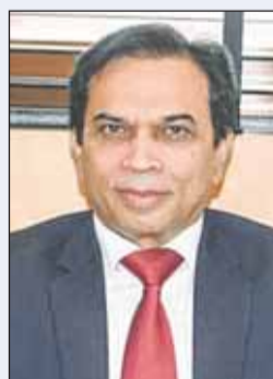
سفير باكستان د. ظفر إقبال

وأضاف أن الكويت، في ظل القيادة الحكيمة لسمو الأمير الشيخ مشعل الأحمد، لا تزال نموذجاً للاستقرار والكرم والتقدم المتوازن في المنطقة، لافتاً إلى أن بُعد نظر قيادتها وروح شعبها المتبايرة يشكلان الركيزة الحقيقية لنجاحها.