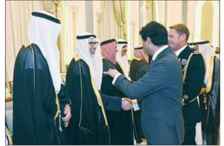
السفير البريطاني والملحق العسكري يهنئان الوزير الشيخ جراح الجابر