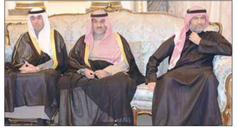
الشيخ أحمد والشيخ تركي جابر الدعيج والشيخ نواف أحمد النواف