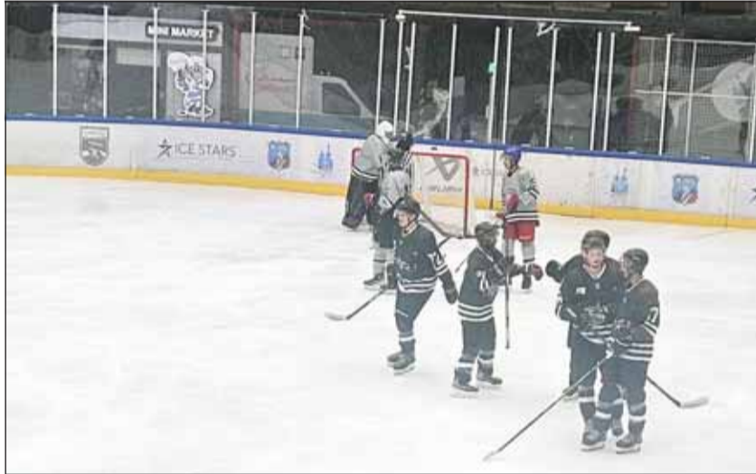
سنارز جدد فوزه علم كاميلز

وشهد الشوط الثالث تفوقاً واضحاً لـ (سنارز) وهو متصدر الدور التمهيدي للبطولة بفضل خبرات لاعبيه الكبيرة ليتصدر المباراة بفارق 6 أهداف ليحسم تأهله على حساب رابع الترتيب دون الحاجة للعب المباراة الثالثة بينهما. وسيلتقي (سنارز) مع المتاهل من المواجهة الثانية التي تجمع ثاني الترتيب نادي (ووريز) مع نظيره (ايس ستارز) ثالث الترتيب إذ ستقام المباراة الثانية مساء اليوم الثلاثاء ضمن سلسلة الدور نصف النهائي علماً ان الأول يتقدم بفارق فوز واحد مقابل لاشئ.