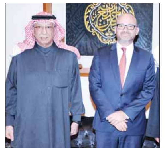
سفير فرنسا أوليفييه غوفان مهنتاً