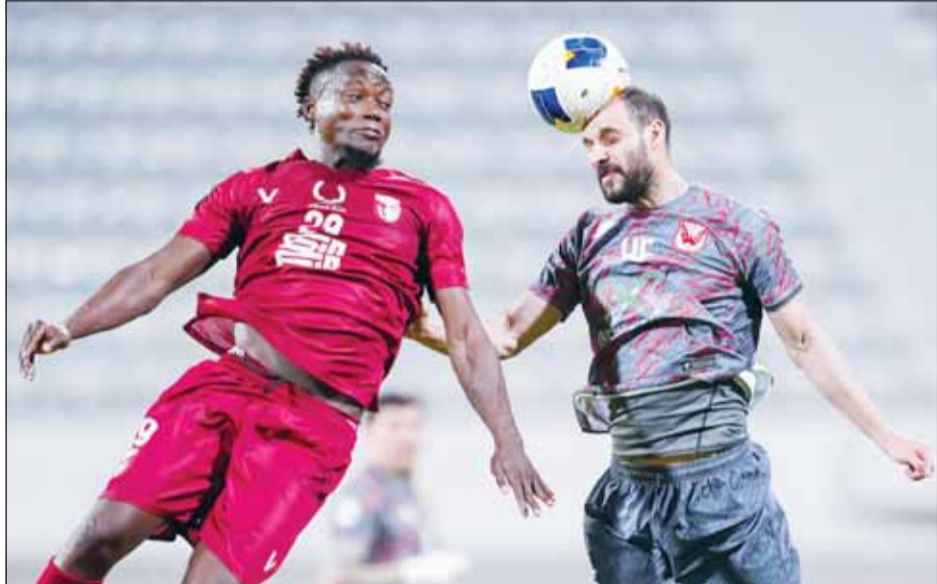
من لقاء النصر والفحيحيل في الدوري

ويستعد الفريقان إلى الاعتماد على منطقة الخطر، وقاع الترتيب، حيث يتعدّل الجهراء الترتيب برصيد 7 نقاط، فيما يحتل التضامن المركز التاسع برصيد 8 نقاط. ويعيش الجهراء حالة من تراجع النتائج، حيث الذي لم يحقق أي نقطة في الجولات السبع الأخيرة، بعد أن تكبد 7 هزائم، في حيث استعاد التضامن توازنه بعد أن حقق انتصاراً ثميناً على كاظمة بهدف وحيد الثلاثاء الماضي، في مباراة موهلة من الجولة الحادية عشرة، كما تأهل إلى ربع نهائي كأس الأمير بعد أن أقصى الجهراء بالذات.