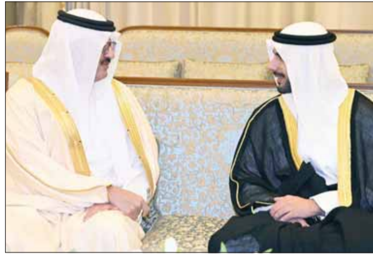
سفير السعودية الأمير سلطان بن سعد والشيخ مبارك فهد الجابر