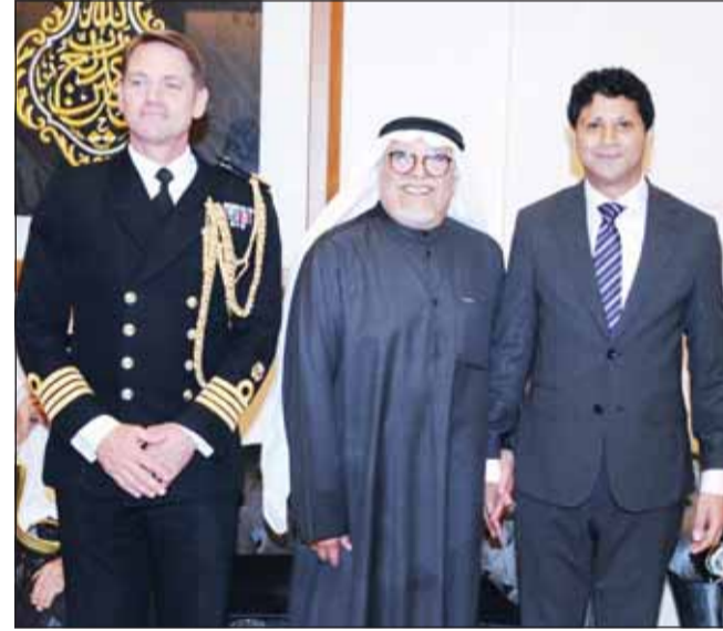
السفير البريطاني قدسي رشيد والملحق العسكري العقيد نيل ماروت