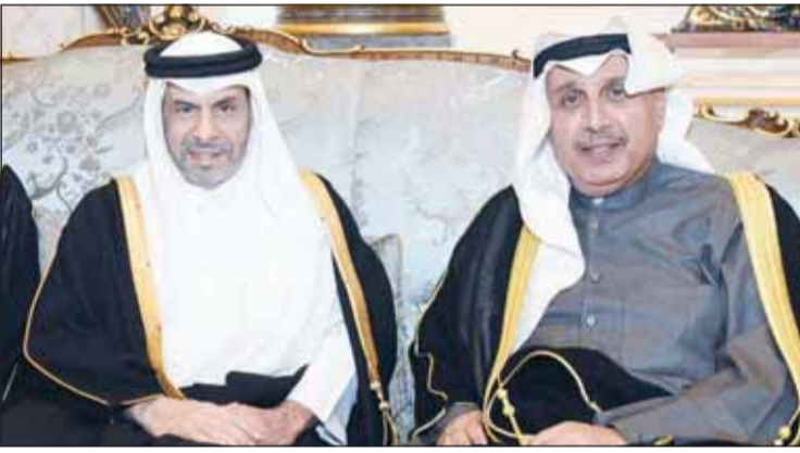
الشيخ حمد جابر العلي وسفير قطر علي آل محمود