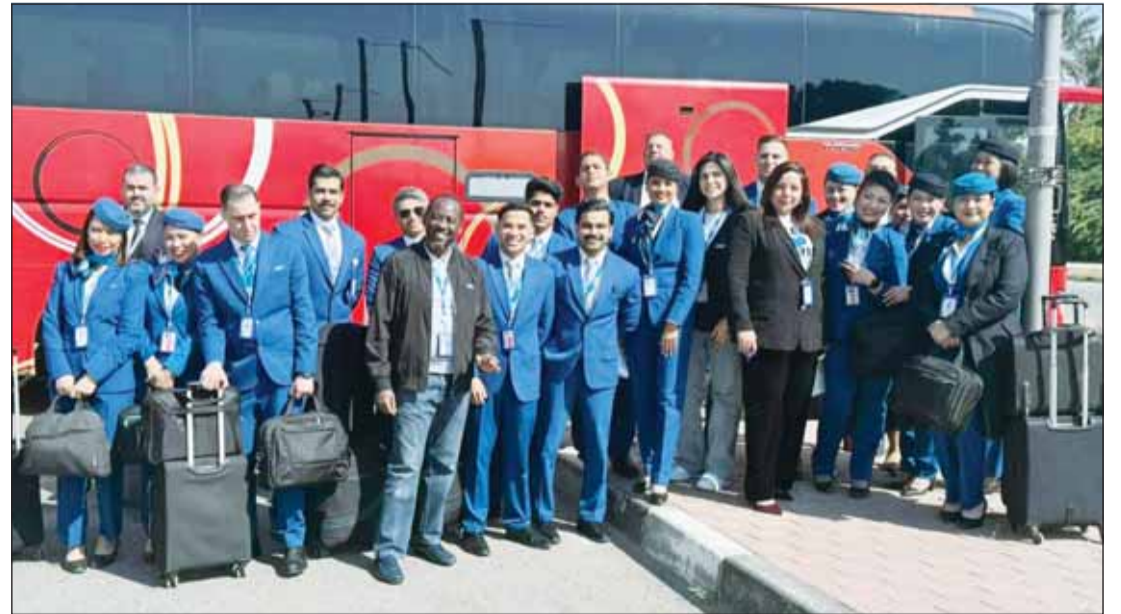
طيران الجزيرة يصل إلى إسطنبول

الكويت رغم الظروف التشغيلية الحالية. ومنذ 11 مارس، قمنا بنقل أكثر من 6,000 مسافر.