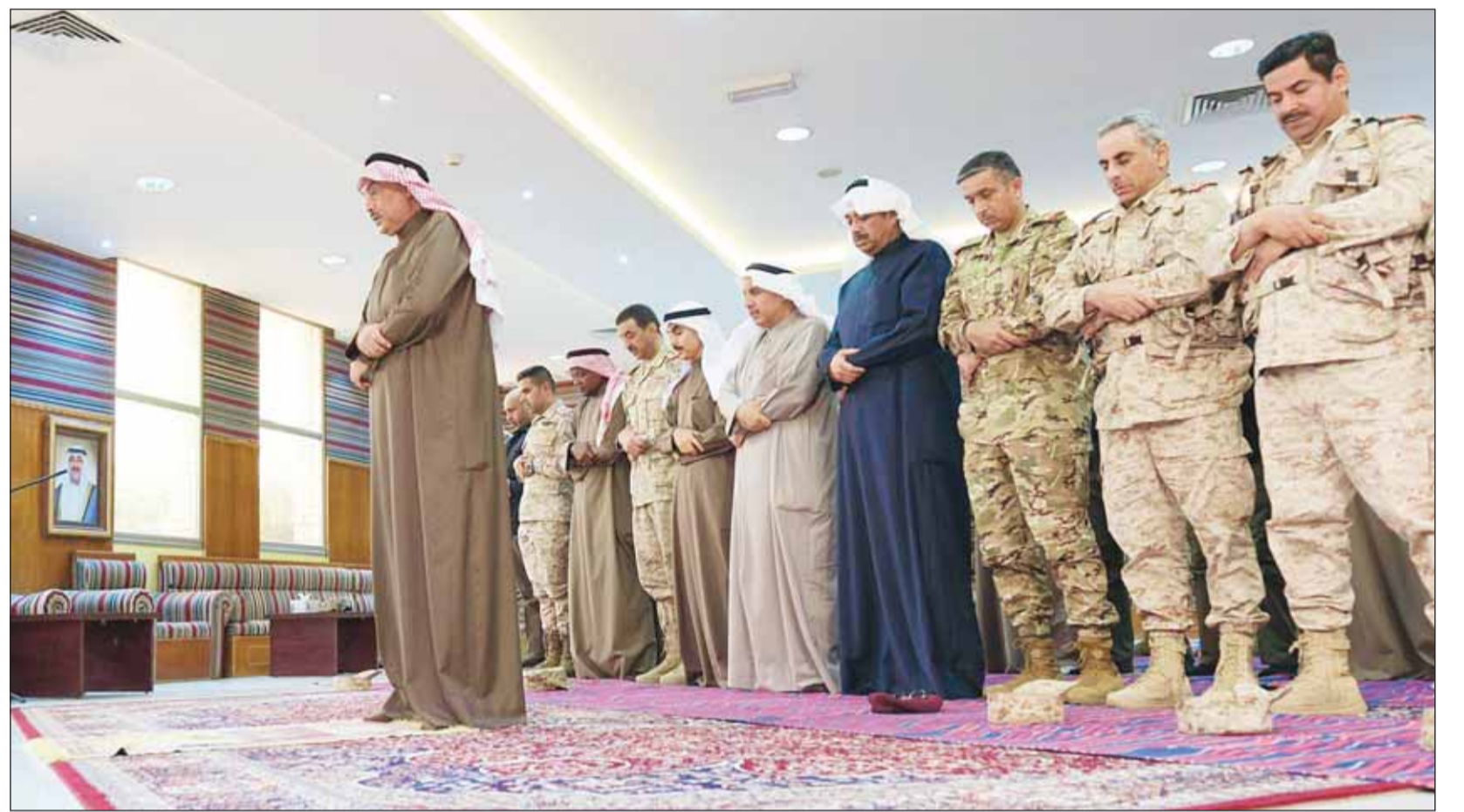
سموه ولي العهد الشيخ صباح الخالد يوم أبناءه حماة الوطن أثناء صلاة المغرب

ولي العهد: أخذ التهديدات على محمل الجد والاحتفاظ بأقصى درجات الجاهزية