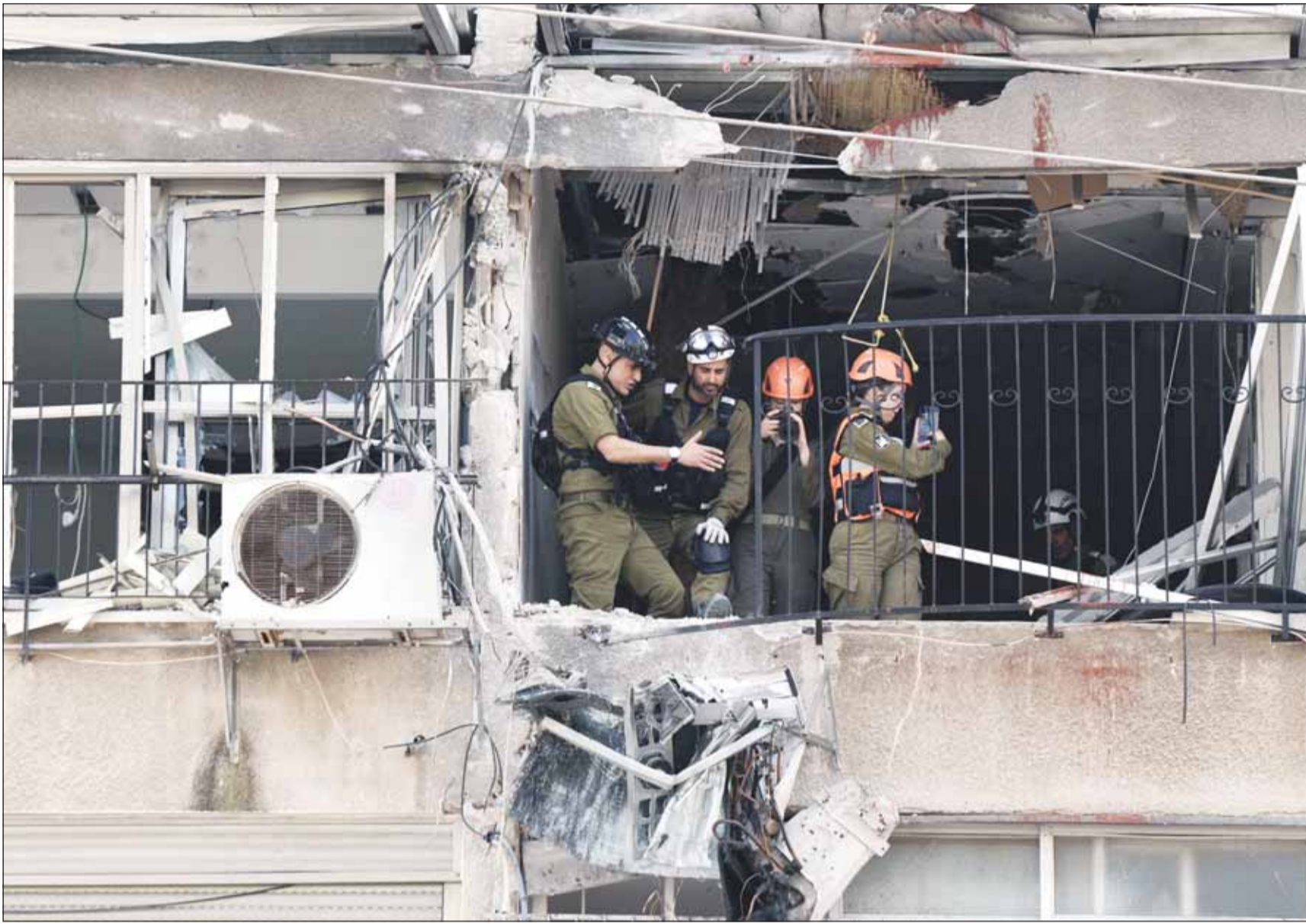
ضباط من قيادة الجبهة الداخلية في شقة دمرها صاروخ إيراني في مبنى براك بإسرائيل