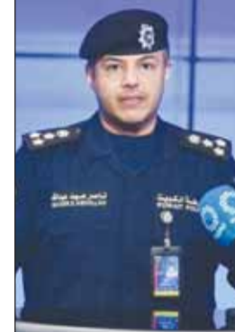
العقيد ناصر بوصليب