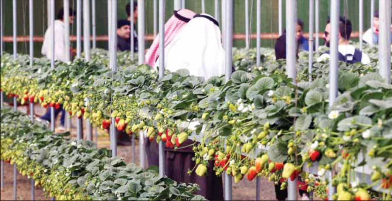
الزراعة في الكويت... آفاق مباشرة

وطالب بضرورة إشراك القطاع الخاص الكويتي والأجنبي للتوسع في الزراعة المحلية لاسيما وأن القطاع الخاص لديه رؤوس أموال ضخمة ويمكن أن يجلب الخبرات، ولذلك يجب تعزيز ستراتيجية الأمن الغذائي في الكويت من خلال القطاع الخاص لاسيما وأن هذا القطاع يدير مشاريع عملاقة خارج الكويت في الأنشطة الزراعية والصناعية وغيرها.