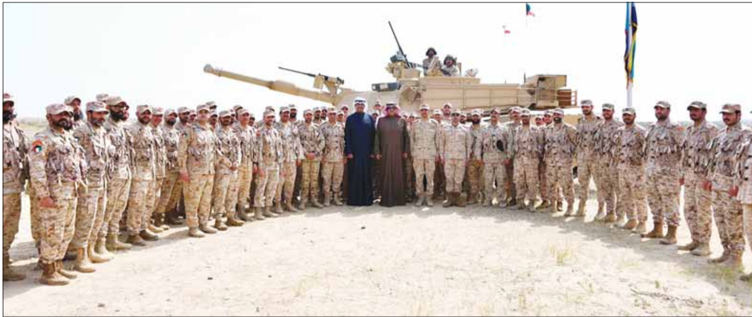
...وقادة وحدة أخرى

□ دور بطولي وأداء استثنائي من القوات المسلحة البوأسل وقوات الدفاع الجوي