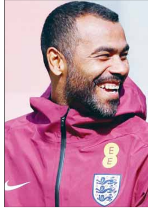
كول مرشح للتدريب في إيطاليا

يقرب نادي تشيزينا، المنافس في دوري الدرجة الثانية الإيطالي، من تعيين مدافع أرسنال وتشيلسي السابق أشلي كول مدرباً جديداً للفريق.