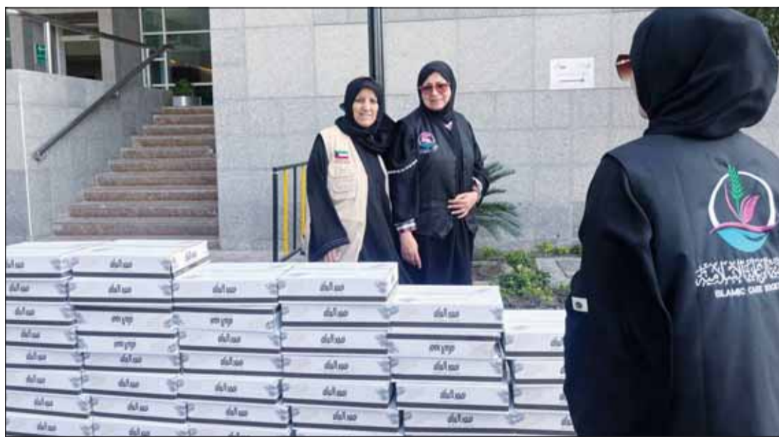
جمعية الرعاية الإسلامية تسلم 150 كرتوناً من التمور إلى ملجأ "التطبيقي"

السالم، ودعم ملجأ المجلس البلدي بـ 32 كرتون مياه، إضافة إلى توفير 100 كرتون مياه لملجأ الجهاز المركزي لمعالجة أوضاع المقيمين بصورة غير قانونية.