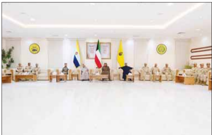
...وسموه متحدثاً للقادة العسكريين

قال سمو ولي العهد لدى تفقده عدداً من القواعد العسكرية: "لمثل هذا اليوم تستثمر الكويت في أبنائها لتجهيزهم وتحضيرهم للتعامل مع مثل هذه الظروف التي نمر فيها". وأضاف في فيديو: "رجالنا وأبطالنا الذين أنيطت بهم المهمة والذين استثمرت بهم بلدنا في التحضير جيهتنا الداخلية متماسكة، ثقة المواطنين والمقيمين بقدرة الكويت ببذل كل ما هو مطلوب لحمايتهم نحن سنكون مسؤولين للتعامل مع أي خطر يواجه الكويت بأي شكل من الأشكال".