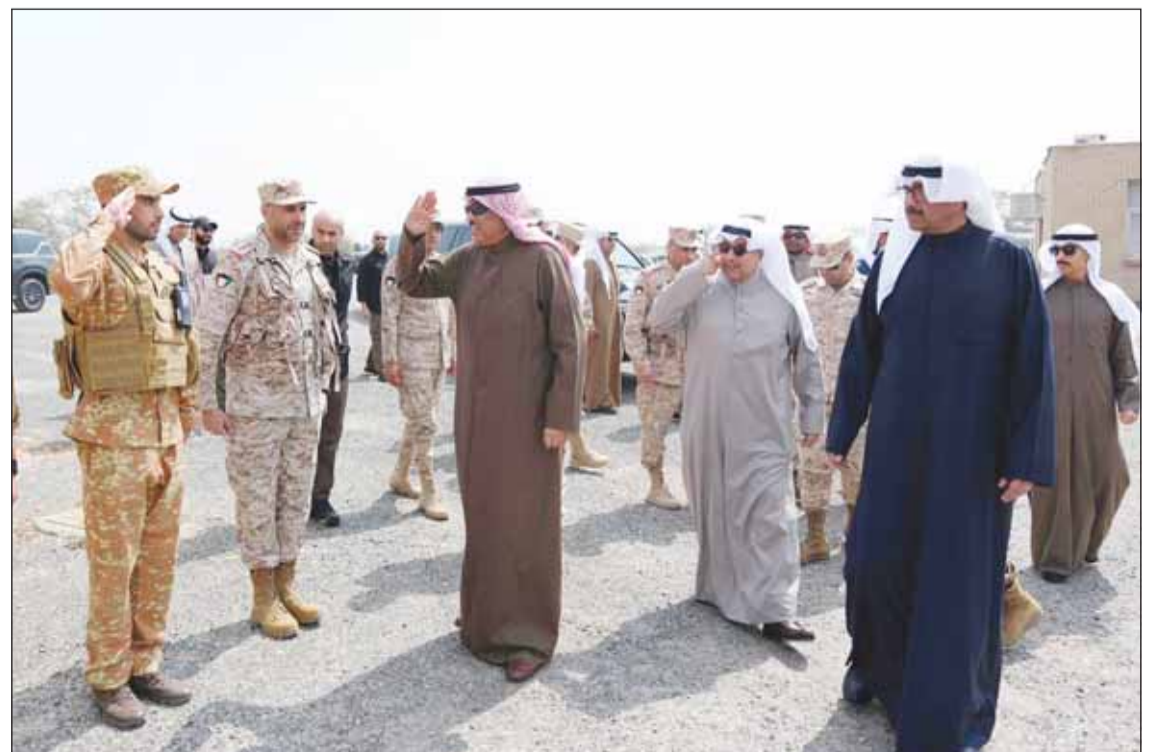
سمو ولي العهد الشيخ صباح الخالد محيياً مستقبليهم