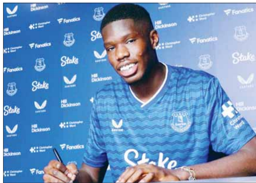
باريس ادعى أن اصداقاه تعرضوا للاعتداء أثناء المباراة

وضاعف تشيلسي من ضغطه في الشوط الثاني لكن أقرب فرصة له للتسجيل كانت في الدقيقة 93 عندما سد القائد ريس جيمس الكرة في القائم من ركلة حرة. وظل تشيلسي في المركز الخامس في حين يلعب منافسوه الرئيسيون على المقاعد الموهلة لدوري أبطال أوروبا الموسم المقبل، مانشستر يونايتد وأستون فيلا وليفربول الأحد، بينما قفز نيوكاسل إلى المركز التاسع.