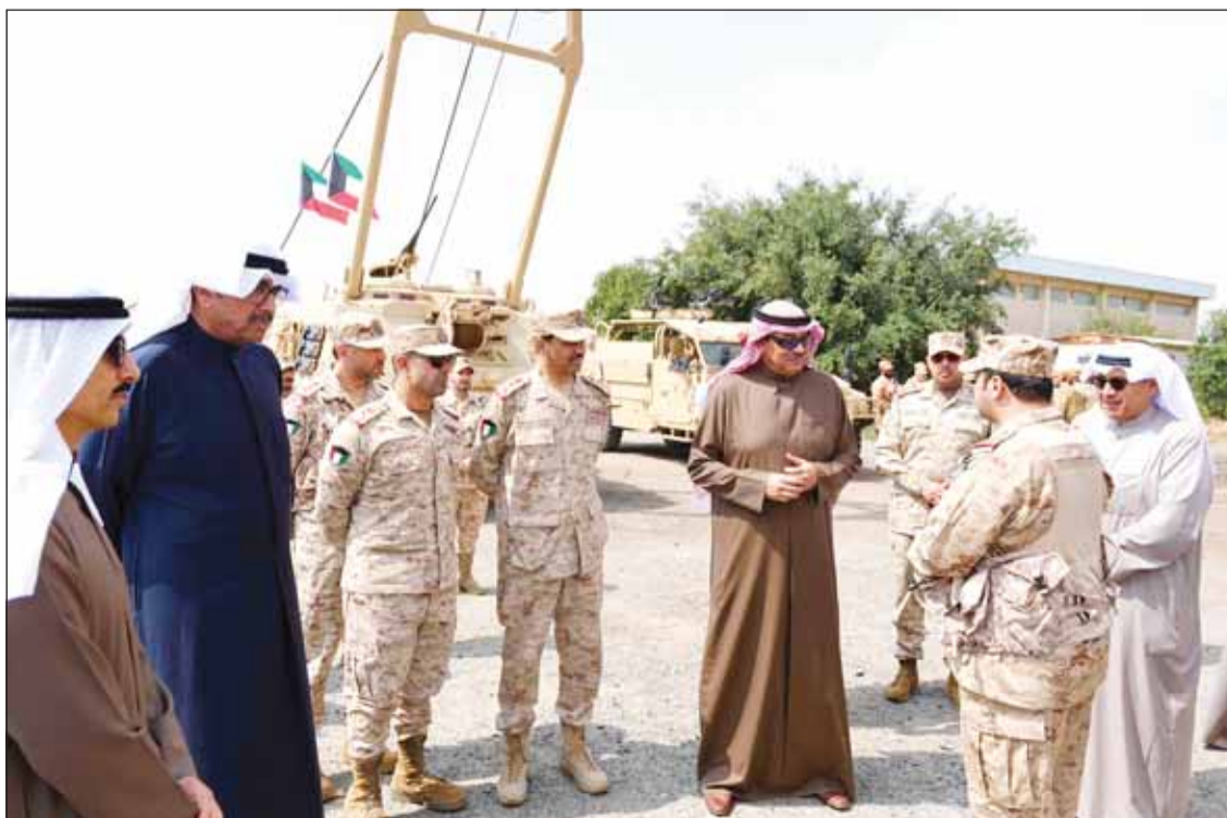
سموه يستمع لشرح حول جاهزية القوات المسلحة