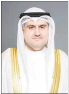
وزير العدل المستشار ناصر السميح

في إطار التزام الدولة الدستوري والاجتماعي بحماية كيان الأسرة وتعزيز استقرارها بوصفها اللبنة الأساسية للمجتمع، صدر في الجريدة الرسمية أمس المرسوم بقانون رقم (11) لسنة 2026 في شأن الحماية من العنف الأسري. وأكدت المحكمة الإيضاحية أن القانون نقلة نوعية بتأسيس نظام متكامل يهدف إلى الوقاية من العنف الأسري؟