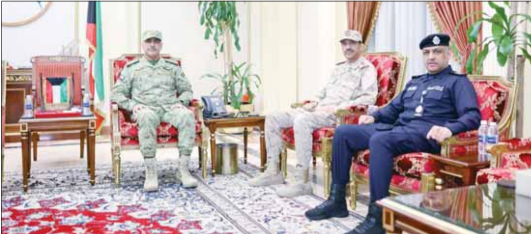
الفريق الركن حمد البرجس مستقبلاً الفريق الركن خالد الشريعان و اللواء عبدالوهاب الوهيب

أكد وكيل الحرس الوطني الفريق الركن حمد البرجس أهمية توحيد الجهود وتكامل الأدوار بين مختلف الجهات العسكرية والأمنية بما يعزز مستوى الجاهزية والاستعداد للتعامل مع مختلف المهام والتحديات، ويضمن حماية الوطن وصون أمنه واستقراره.