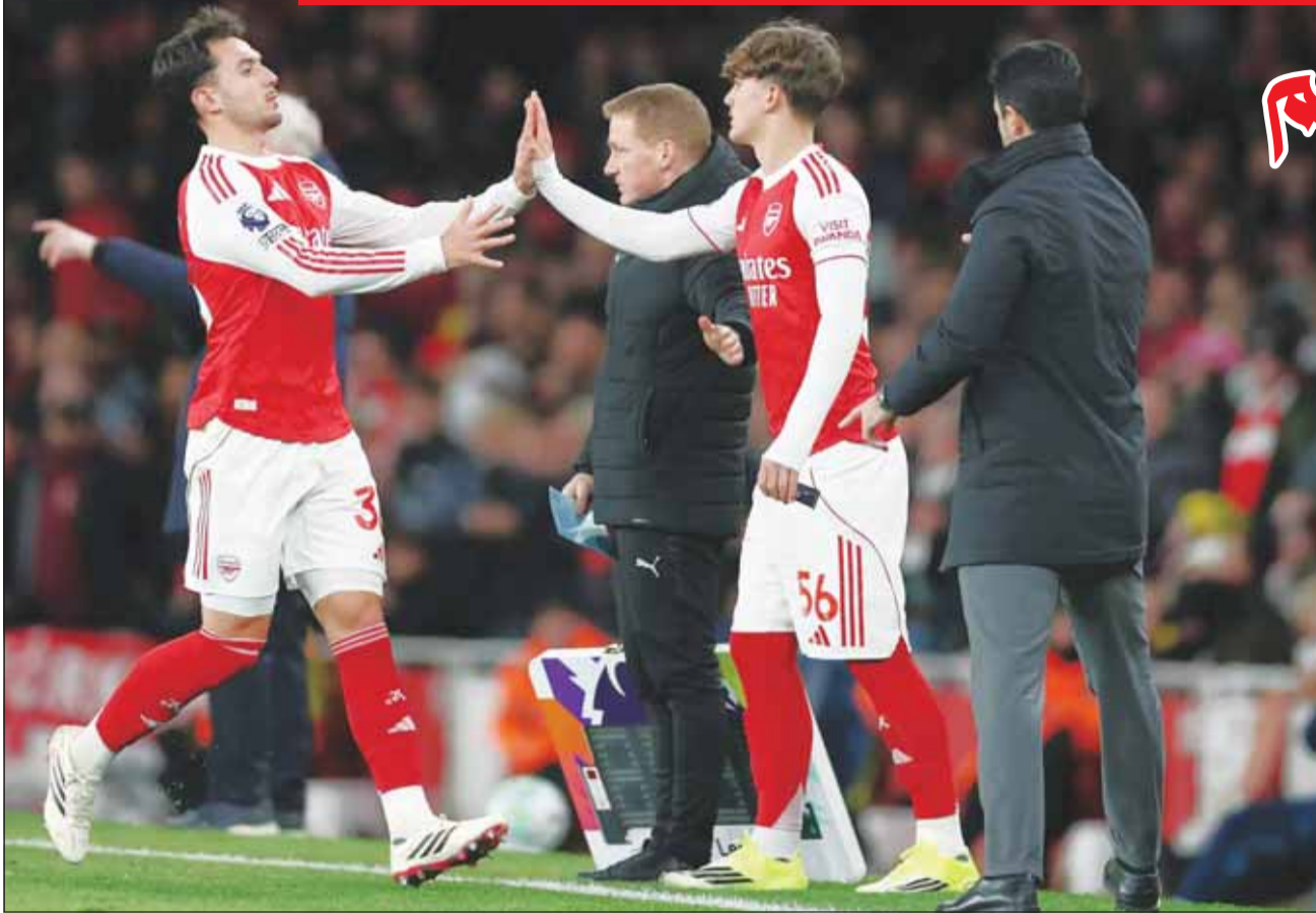
داومان 'يدخل' تاريخ أرسنال