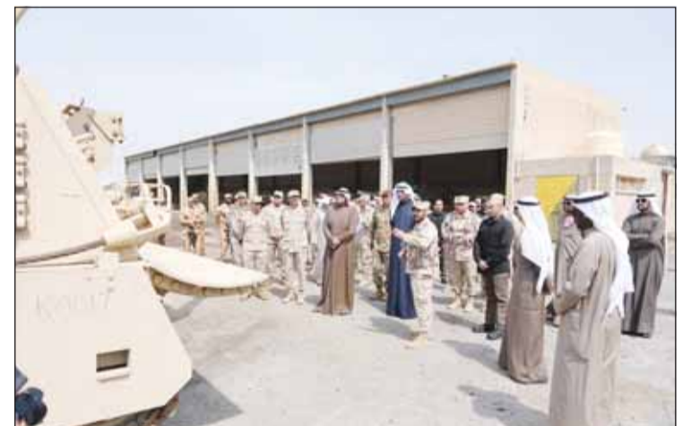
سمو ولي العهد الشيخ صباح الخالد لدى زيارته إحداه الوحدات