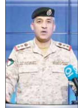
العقيد ركن سعود العظوان

أعلن المتحدث باسم وزارة الدفاع العقيد ركن سعود العظوان أن مسيرتين معاديتين استهدفتا قاعدة أحمد الجابر الجوية مساء أول من أمس "السبت"، ما أدى إلى وقوع أضرار مادية محدودة في محيط القاعدة، مؤكداً أن القوات المسلحة تعاملت مع الهجوم وفق الإجراءات العسكرية المعتادة.