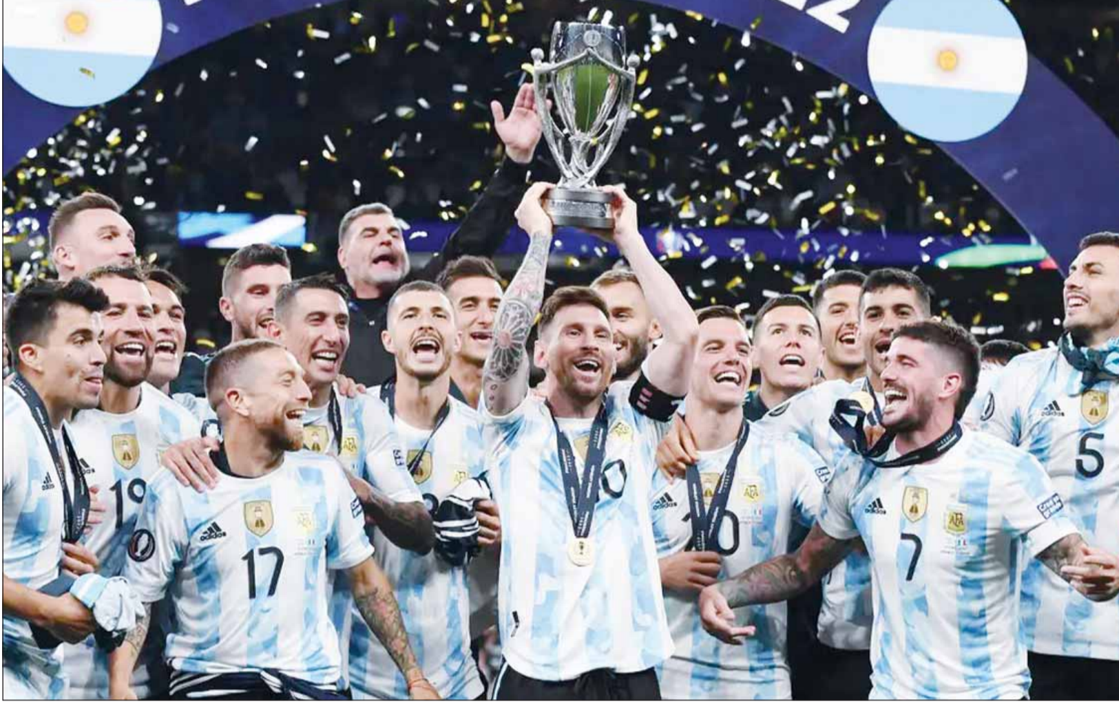
الأرجنتين اقترحت خوض اللقاء في إيطاليا

مازال القموض يسيطر على مصير مباراة إسبانيا والأرجنتين، بطي أوروبا وأميركا الجنوبية، في نهائي "فيناليسيمبا"، التي من المقرر أن تستضيفها قطر، في ظل الأوضاع الأمنية غير المستقرة، بسبب الحرب الدائرة في منطقة الشرق الأوسط.