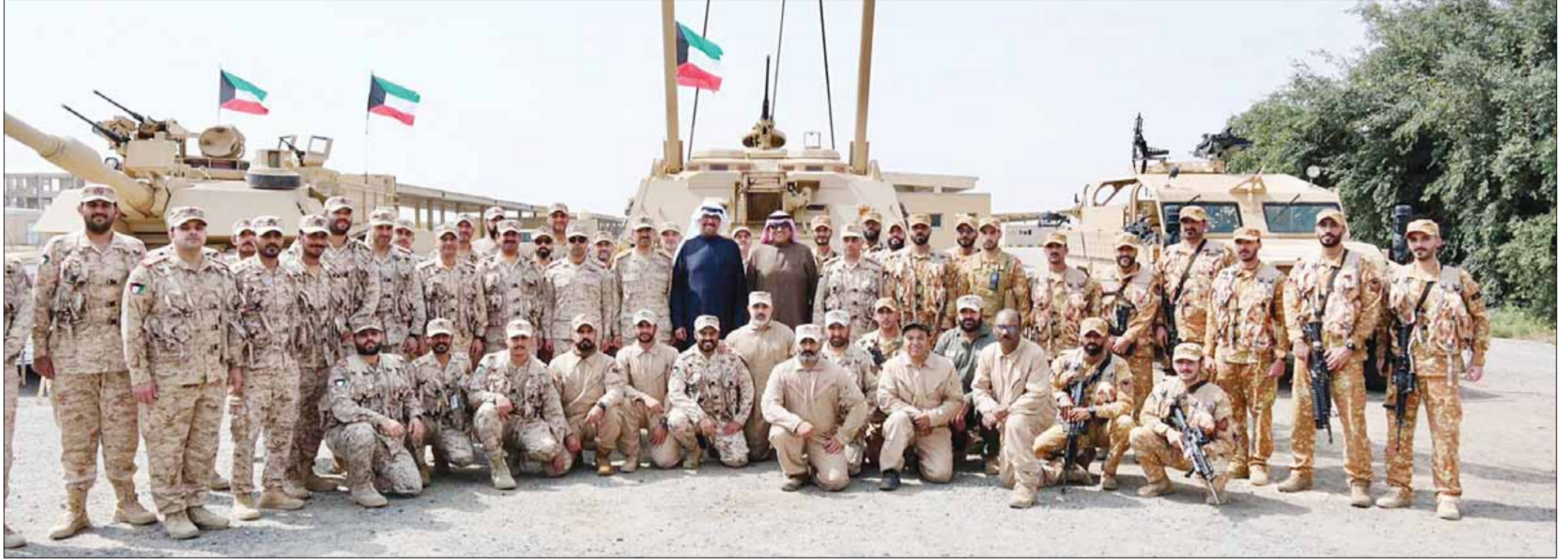
سمو ولي العهد الشيخ صباح الخالد وزير الدفاع الشيخ علي بن عبد الله بن سلطان قائد إحداه الوحدات

أكدت وزارة الخارجية إدانته دولة الكويت واستنكارها الشديد للهجوم الجديد الذي استهدف القنصلية العامة لدولة الإمارات العربية المتحدة الشقيقة في إقليم كردستان العراق للمرة الثانية خلال أسبوع الذي أدى إلى إصابة عدد من عناصر الأمن والمق أضرارا بالمبنى. وأكدت "الخارجية" في بيان لها أول من أمس، أن استهداف البعثات والمقار الدبلوماسية يعد انتهاكا صارخا للقانون الدولي والأعراف الدبلوماسية لاسيما اتفاقية فيينا للعلاقات الدبلوماسية لعام 1961 واتفاقية فيينا للعلاقات القنصلية لعام 1963. وكررت رفض دولة الكويت لتلك الاعتداءات المستمرة، معربة عن تضامنها الكامل مع دولة الإمارات العربية المتحدة الشقيقة ودعمها لكل ما من شأنه تعزيز أمن بعثاتها الدبلوماسية وسلامة العاملين فيها.