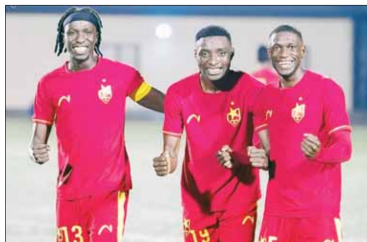
المريخ السوداني يطلق مبادرة جديدة تحت اسم "دولار المريخ"

وناديه، مشيراً إلى أنه ساهم في دعم الفريق عام 1986 وما زال يحتفظ بإيصال تلك المساهمة حتى اليوم، معتبراً ذلك دليلاً على الاعتزاز بالانتماء للنادي. وأكد أن المبادرة لا تفرض قيمة محددة