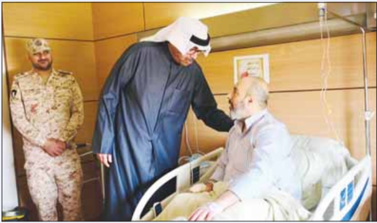
وزير الدفاع الشيخ عبدالله العلي، لدى زيارته أحد المصابين

قام وزير الدفاع الشيخ عبدالله العلي، أمس، بزيارة إلى مستشفى جابر الأحمد للقوات المسلحة، وذلك للاطمئنان على صحة أحد المصابين جراء استهداف بطائرات مسيرة معادية، فيما تماثل مصابان آخران للشفاء. وخلال الزيارة استمع الوزير العلي إلى شرح من الفريق الطبي حول الحالة الصحية للمصاب، حيث اطمأن على وضعه الصحي، متمنياً له الشفاء العاجل ودوام الصحة والعافية.