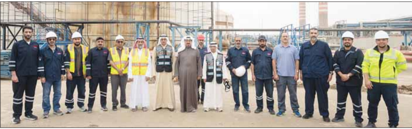
سمو رئيس مجلس الوزراء خلال جولته التفتحية في محطة الصبية

تفقد سمو رئيس مجلس الوزراء الشيخ أحمد عبدالله محطة الصبية لتوليد القوى الكهربائية وتقطير المياه برفقة وزير الكهرباء والماء والطاقة المتجددة د. صبيح المخيزم ووكيل الوزارة د. عادل محمد الزامل. واستمع سمو رئيس مجلس الوزراء إلى شرح من المسؤولين حول آليات تشغيل وحدات التوليد بالمبنى الرئيسي للمحطة والتدابير والخطط المعتمدة لضمان استمرارية إنتاج الكهرباء