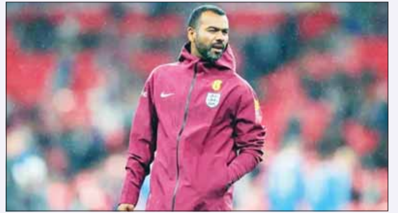
أشلي كول مدرباً لتشيبيزيا الإيطالي

أعلن نادي تشيبيزيا، المنافس في دوري الدرجة الثانية الإيطالي، تعيين أشلي كول مدرباً للفريق، حيث يخوض نجم إنكلترا وتشيلسي وأرسنال السابق أولى تجاربه التدريبية على مستوى الفريق الأول.