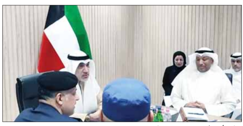
النائب الأول الشيخ فهد اليوسف مترئسا للاجتماع

تحديث بيانات الخطط وتكثيف التنسيق بين غرف العمليات المشتركة نثق في قدرة الكوادر الوطنية على التعامل مع الأزمات بكفاءة واقتدار