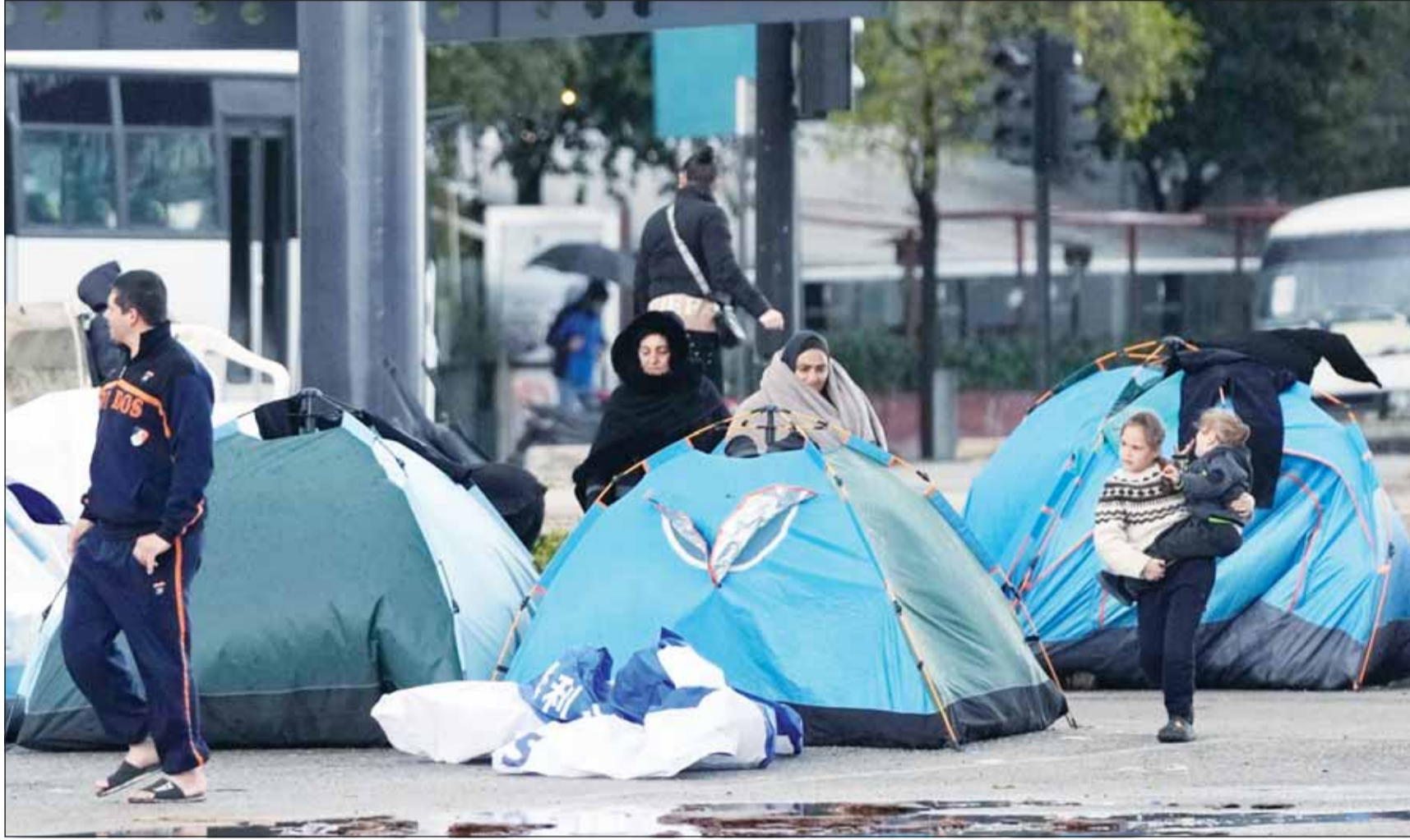
لبنانيون فارون من جحيم الحرب في خيام تؤولهم أسرهم حيث أقام النازجون جراء الغارات الإسرائيلية خيامهم على طول واجهة بيروت البحرية في بيروت (أب)

أعضاء بلدية الريحان سكان البلدة بالإخلاء الفوري، من جانبها، أعلنت قوة الأمم المتحدة الموقّعة في لبنان "يونيفيل" تعرض قوات لحفظ السلام تابعة لها لإطلاق نار يربح أنه من قبل مجموعات مسلحة غير تابعة للدولة، قائلّة إن التعرض لإطلاق النار حصل في ثلاث حوادث منفصلة أثناء قيام قوات حفظ السلام التابعة لها بدوريات حول مواقعها في بلدات باطر وديريكيا وقلاوية، مشيرة إلى أن دوريتين تابعتين لها قامتا بالرد بإطلاق النار دفاعاً عن النفس وبعد تبادل قصير لإطلاق النار استأنفت الدوريات أنشطتها المخططة ولم يصب أي من أفراد قوات حفظ السلام، معتبرة وجود أسلحة خارج سيطرة الدولة ضمن منطقة عملياتها يشكل انتهاكاً لقرار مجلس الأمن الدولي رقم 1701، مؤكدة أن أي هجوم على قوات حفظ السلام يشكل انتهاكاً خطيراً للقانون الدولي الإنساني وللمقرر 1701 وقد يرقى إلى جريمة حرب.