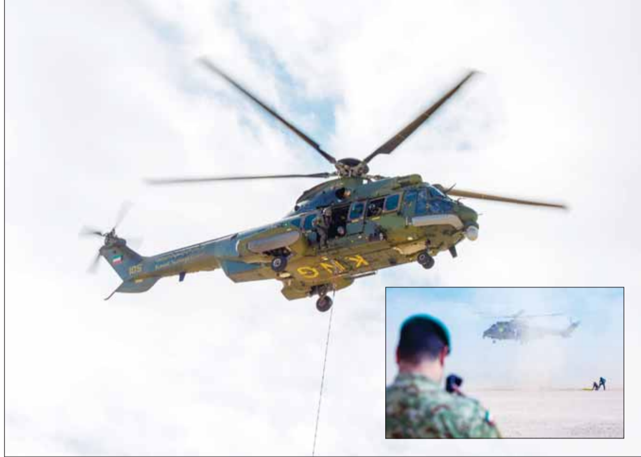
جوهرة عالية للطيران العمودي وفعلي الإطارات من عمليات الإخلاء

تطوير قدراته البشرية والتقنية بما يواكب أحدث المعايير العالمية ويعزز من دوره في حماية الوطن ودعم مؤسسات الدولة وقدمه المجتمع.