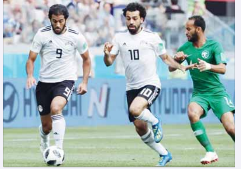
لقاء سابق بين الفرانقة والأخضر السعودي

تتمتع جدة مباراة السعودية ومصر الودية يوم 27 من الشهر الجاري استعداداً للمشاركة في كأس العالم القادمة التي تحتضنها الولايات المتحدة وكندا والمكسيك منتصف العام الحالي وذلك وفقاً لما أعلنه الاتحادان أول من أمس. وكان من المقرر أن تخوض مصر مباراتين وديتين أمام السعودية وإسبانيا في قطر هذا الشهر، على هامش مهرجان كروي كان سيشهد إقامة مباراة "فيناليسيمو" بين بطل أوروبا وأميركا الجنوبية، إسبانيا والأرجنتين، قبل أن يتم إلغاء المهرجان بسبب التطورات الإقليمية. وتلعب السعودية في كأس العالم المقبلة إلى جانب إسبانيا، أوروغواي والرأس الأخضر، بينما وقعت مصر في مجموعة بلجيكا، إيران ونيوزيلندا.