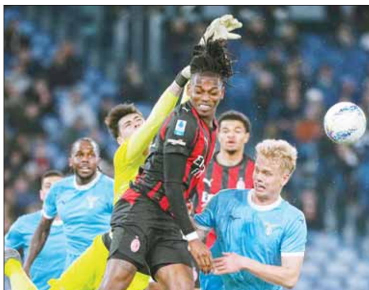
لاتسيو منح الروسونيري اقتراب من الصدارة

ووفقاً لما أورده مراسلو DAZN على جانب الملعب، قال ليو ألييجري، "سبيدي، دعني أبقى، لم يتبق سوى 20 دقيقة". ويمجرد وصوله إلى مقاعد البدلاء، كما أفاد مراسلو DAZN الموجودون على جانب