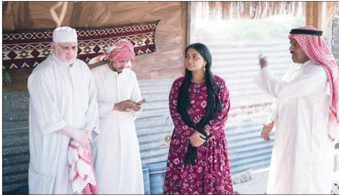
مشهد من مسلسل "سموم الغيب"

إن كثيرا من المهتمين في إنتاج الدراما يملكون طاقات جبارة لكنهم في النهاية عاجزون تماما عن تحقيق شيء، والسبب الحقيقي هو منافذ العرض وطريقة تسويق الأعمال والتي تنعكس بالتبعية بعد ذلك على مستوى الدراما المستقبلية بشكل عام، فالاعتماد على تلفزيون الكويت وحده في عرض الأعمال الدرامية الكويتية لن يكون هو الحل، بل أننا مع زيادة دعم التلفزيون لها، لكن الفضاء الآن أصبح فيه تنافس كبير وفرص متعددة، فضلا عن ان التلفزيون لن يستطيع عرض كل الأعمال وتلبية كل الطموحات، ولذلك نحن بحاجة الى البحث عن آلية مختلف لتسويق الدراما ولكن قبل ذلك لا بد من حضور حقيقي للمؤسسات الاقتصادية للمساهمة في صناعة الدراما، بمعنى ان الكويت تحتاج منصة عرض بطموحات خليجية عربية تجعل الكويت واجهة للإنتاج الدرامي طوال العام لتقديم تجارب متنوعة، لذا مطلوب من البنوك والشركات الكبرى في الكويت دعم الدراما وتطوير هذه المنصة والمساهمة في الإنتاج كما يحدث في العديد من الدول الخليجية والعربية، حيث بات واضحا ان المؤسسات الاقتصادية قد لعبت دورا بارزا في دعم وتطوير الإنتاج الفني على كافة المستويات، كما ان هذه المؤسسات والبنوك قد استفادت بشكل كبير سواء في تسويق منتجاتها ورفع اسهمها أو في دعم هذه الصناعة بشكل واضح، لذلك لا بد من التنسيق بين المنتجين والمؤسسات الاقتصادية ووضع رؤية حقيقية تعيد من جديد بريق الدراما الكويتية وتسمح في دفع عجلة الإنتاج الدرامي من جديد وخلق منافذ عرض وتسويق الأعمال بشكل أفضل مما هو عليه الآن.