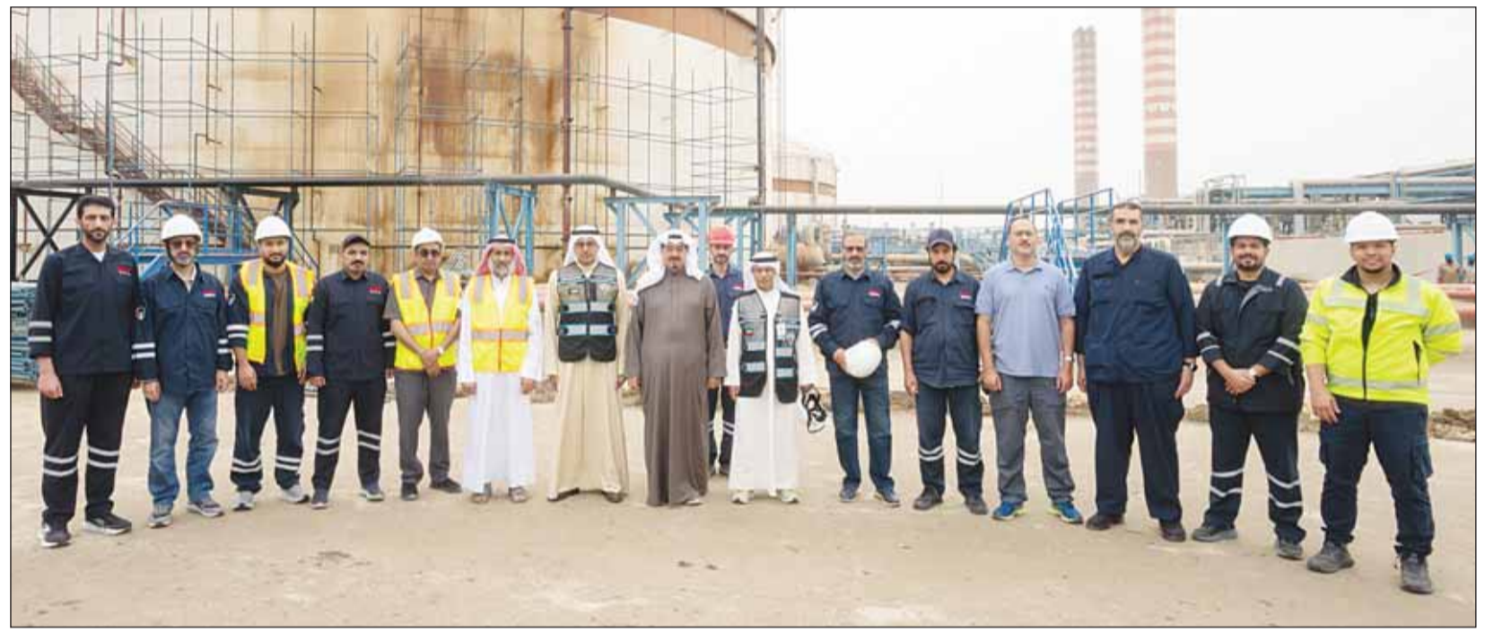
سمو رئيس مجلس الوزراء الشيخ أحمد العبد الله خلال جولته التفقدية في محطة الصبية لتوليد القوم الكهربائية وتقطير المياه

العبد الله: مواصلة العمل لتوافر مخزون ستراتيجي من الدم واستدامة الخدمات النائب الأول: التكامل بين الجهات العسكرية والمدنية لاستمرارية الخدمات الحيوية