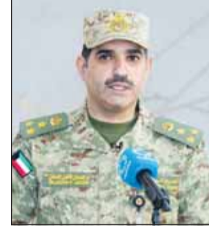
العميد جدعان فاضل

وأوضح العميد جدعان أن هذه الجاهزية تأتي في إطار توجيهات قيادته إلى تطوير القدرات ورفع مستوى الاستعداد والجاهزية بما يواكب متطلبات المرحلة ويعزز دوره في منظومة الأمن الشامل وخدمة المجتمع. وأشار إلى أن إنشاء جناح الطيران العمودي يمثل إضافة نوعية لقدرات الحرس الوطني حيث يضطلع الجناح بتنفيذ مهام نقل القوات والبحوث والإنقاذ والإخلاء الطبي السريع إلى جانب تقديم الإسناد اللازم لمؤسسات الدولة خلال حالات الطوارئ والأزمات. وفي سياق بناء وتأهيل الكوادر الوطنية بين العميد جدعان فاضل أنه تم في عام 2018 إلحاق اثني عشر ضابطاً ببرامج التدريب المتخصصة في أكاديمية الطيران الدولية (هوايريزن) بدولة الإمارات العربية المتحدة الشقيقة، والتي تُعد من الأكاديميات المتميزة عالمياً في مجال الطيران حيث تقدم