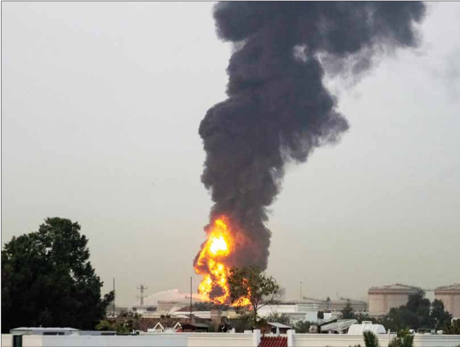
أسلحة النيران وأعمدة الدخان تتصاعد بعد أن اصطدمت طائرة مسيرة بخزان وقود مما تسبب في تعليق الرحلات الجوية في مطار دبي الدولي مؤقتاً

الدوحة، طهران، عواصم - وكالات، أعلنت قطر أمس، أن هناك اتصالات جارية مع مختلف الأطراف لضمان بقاء مضيق هرمز مفتوحاً، مشددة على ضرورة وقف اعتداءات إيران فوراً، وفي مؤتمر صحافي بالدوحة، مع استمرار هجمات طهران على الدوحة ودول عربية منذ 28 فبراير، أكد المتحدث باسم الخارجية القطرية ماجد الأنصاري أهمية مضيق هرمز لشركة البضائع والطاقة، مؤكداً أن غلقه يهدد الجميع، مبيناً أن الدوحة ترفض المساس بأمن الطاقة، مشيراً إلى أن الاتصالات لا تزال جارية مع مختلف الأطراف لضمان بقاء مضيق هرمز مفتوحاً، رافضاً تصريحات وزير الخارجية الإيراني عباس عراقجي بشأن استعداد بلاده للجلوس مع دول المنطقة لتشكيل لجنة تحقيق مشتركة لتحديد طبيعة الأهداف التي تعرّضت للهجمات الأخيرة، وما إذا كانت أميركية أم لا، قائلًا إن الأمر ليس بحاجة للجنة تحقيق، ولكن المطلوب قراراً بوقف الاعتداءات الإيرانية على الدوحة ودول عربية فوراً، مشدداً على رفض قبول تلك الهجمات، مؤكداً أن التنسيق العربي مستمر بشكل يومي في هذه المرحلة لاحتمال التصعيد.