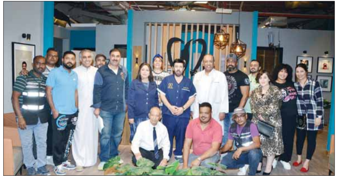
كواليس مسلسل "قبل وبعد"