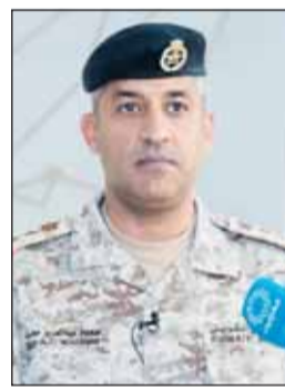
العقيد سعود العطوان

وأوضح العقيد الركن العطوان أن (قوة واجب) من الحرس الوطني تمكنت من التعامل مع خمس مسيرات معادية وتدميرها ضمن إطار التكامل والتعاون بين الجهات العسكرية، مشيراً إلى أن وحدة التفكيش والتخلص من المتفجرات التابعة لهيئة القوة البرية قامت بالتعامل مع سبعة بلاغات، حيث تم التعامل معها والتخلص منها وفق الإجراءات المتبعة.. وأكد العقيد الركن العطوان أن ما يقوم به منتسبو القوات المسلحة من مهام وواجبات إلى جانب مختلف الجهات العسكرية بالبلاد يأتي ترجمة