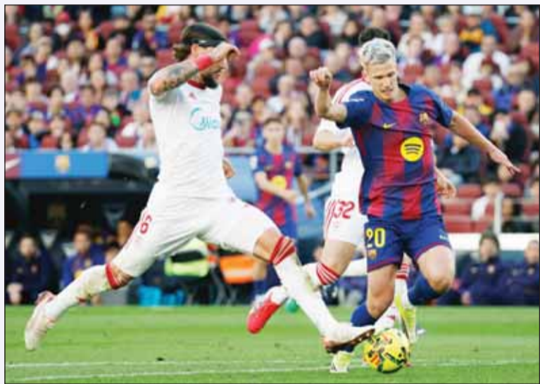
البرشا سحق إشبيلية بخماسة

حافظ برشلونة المتصدر على فارق النقاط الأربع مع ملاحقه ريال مدريد، بعد فوزه العريض بقيادة نجمه البرازيلي رافينيا على ضيفه إشبيلية 5-2 اول من امس في المرحلة 28 من الدوري الإسباني لكرة القدم. ورفع الفريق الكتالوني رصيده إلى 70 نقطة بفوزه الرابع تواليًا في الدوري متقدماً بفارق أربع نقاط عن ريال مدريد. وحسم برشلونة النتيجة في شوطها الأول بفضل رافينيا (9 و21 من ركلتي جزاء) وداني أولمو (38)، قبل أن يوقع رافينيا على الهاتريك (51) ويضيف البرتغالي كانسيلو الخامس، مقابل هدفين عبر أوسو (3+45) والوسوري جيريل سو (2+90). وانتقم برشلونة لخسارته أمام إشبيلية 1-4 في لقاءهما الأخير في أكتوبر الماضي. وبهذه النتيجة تجمد رصيد إشبيلية عند 31 نقطة متقدماً بخمس نقاط فقط عن إلتشي صاحب المركز 18 المؤدي إلى الهبوط. وتحصل برشلونة على ركلتي جزاء خلال اللقاء، ونفذهما اللاعب البرازيلي رافينيا بنجاح. وقال صواب "أرشيفو فار"، على منصة إكس، والمختص بالمحالات التحكيمية، إن ركلة الجزاء الأولى للبارسا كانت صحيحة. وتابع "لاعب إشبيلية اعترض طريق ظهير برشلونة من الخلف، مما تسبب في تعثره بعد أن ضربت ركبته، قدمه اليميني". ونوه "في ركلة الجزاء الثانية، اضطر حكم تقنية الفيديو، إلى تصحيح قرار حكم الساحة مارفينيز مونويرا". وأوضح "كارمونا، الذي كان ساقطاً على الأرض وذراعه مضمومة، قام بفتحها ومدها بعد مراوغة كانسيلو، ولذلك فهي ركلة جزاء".