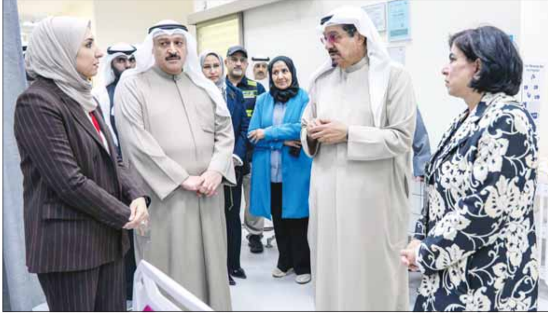
سمو رئيس الوزراء الشيخ أحمد عبدالله لدم تفقده بنك الدم المركزي

قام وزير الدولة لشؤون الشباب والرياضة د. طارق الجلاهية بزيارة ميدانية إلى مركز شباب منطقة جليب الشيوخ للوقوف على جاهزية هذه المرافق والتأكد من استعدادها في ظل الظروف الراهنة. وقال مدير الهيئة العامة للشباب بالتكليف ناصر الشيخ في تصريح صحفي، إن الهيئة قامت بالتنسيق مع الجهات الحكومية المتخصصة إلى جانب متطوعين لضمان جاهزية مرافق مراكز الشباب واستعدادها الكامل لتقديم الدعم والمساندة عند الحاجة. وأضاف الشيخ: إن الوزير يحرص من خلال هذه الجولات الميدانية على التأكد من أن جميع المرافق التابعة للهيئة على أهبة الاستعداد، لافتاً إلى أن مراكز الشباب مجهزة وقادرة على مساندة أجهزة الدولة في حال تطبقت الظروف ذلك.