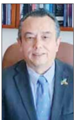
السفير داروانو بارترسيو

رفع سفير سلطنة عمان د. صالح الخروصي أسمى آيات التهاني إلى سمو أمير البلاد الشيخ مشعل الأحمد وإلى سمو ولي العهد الشيخ صباح خالد وإلى الشعب الكويتي بمناسبة قرب حلول عيد الفطر السعيد، داعياً المولى - سبحانه - أن يعيد المناسحة الجليلة ومخيلاتنا على دولة الكويت - قيادة وحكومة وشعباً - بمزيد من التقدم والازدهار، ودوام نعمة الاستقرار والأمن والأمان، وأن تواصل الكويت مسيرتها نحو كل ما يطمح إليه شعبها الشقيق من رضاء في ظل قيادته الحكيمه. بدوره، قال سفير المكسيك اوداردو باتريسيو بينيا هالر، "بالنيابة عن شعب وحكومة المكسيك يطيب لي أن أرفع إلى مقام سمو أمير البلاد الشيخ مشعل الأحمد، وإلى