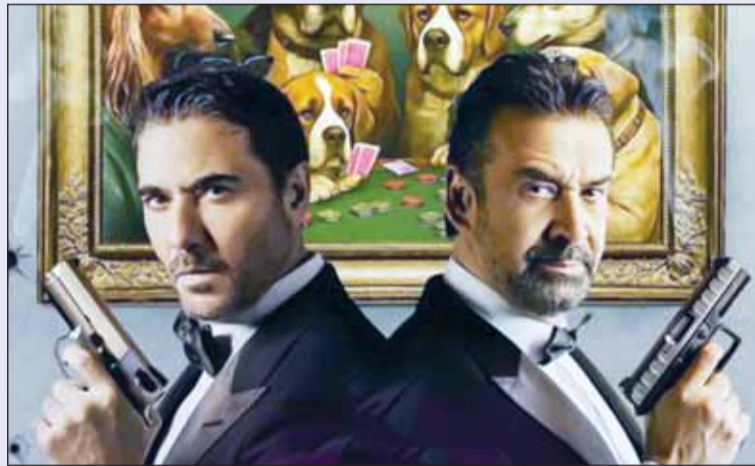
كريم عبدالعزيز وأحمد عز