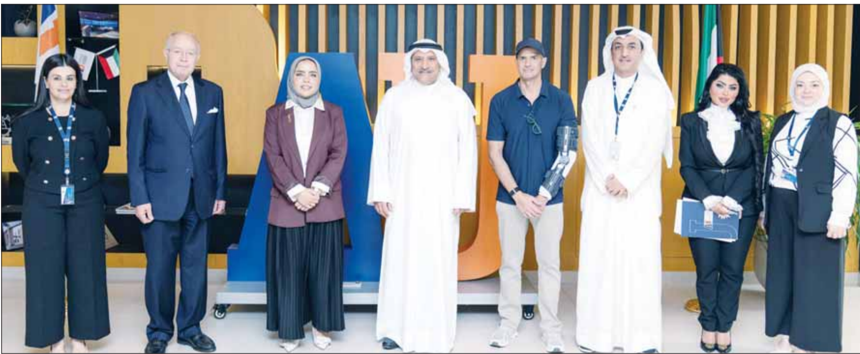
الأمين العام لمجلس الجامعات الخاصة د.جاسم العلي متوسلاً فريق الجامعة الأسترالية خلال الزيارة

استقبلت الجامعة الأسترالية الأمين العام للأمانة العامة لمجلس الجامعات الخاصة د.جاسم العلي، في زيارة رسمية إلى الحرم الجامعي، وذلك في إطار الجولات الميدانية التي تنفذها الأمانة العامة للاطلاع على جاهزية المؤسسات التعليمية الخاصة ومتابعة تطبيق إجراءات السلامة وخطط الطوارئ المعتمدة.