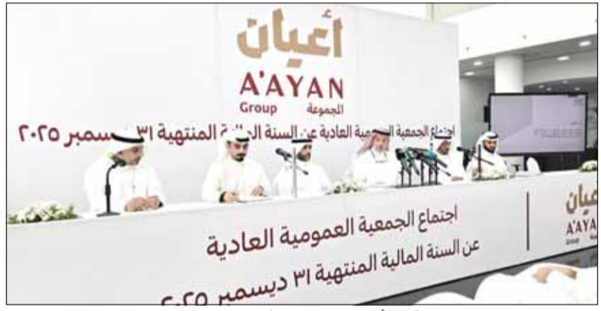
جانب من الجمعية العمومية لشركة أعيان للإجارة والاستثمار

وأوضحت الوزارة أن الإخلال بالالتزامات المتعلقة بالضوابط والقرارات والتعليمات والتعاميم الصادرة من وزارة التجارة والصناعة يعد من الانتهاكات منخفضة الخطورة ويترتب عليه إندار كتابي مع إصدار