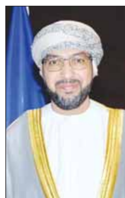
السفير د. صالح الخروصي

ومقام سمو ولي العهد الشيخ صباح خالد، ومقام سمو رئيس مجلس الوزراء الشيخ أحمد عبدالله وحكومة الكويت والشعب الكويتي الكريم بأمر التهاني والتبريكات وأطيب الأمنيات بمناسبة حلول عيد الفطر السعيد". وأضاف، يهل علينا عيد الفطر السعيد تتويجا لشهر رمضان الفضيل، شهر الرحمة والتسامح والتكافل، وهو مناسبة تعكس أسمى معاني التضامن والوعدة والقيم الإنسانية النبيلة، وإذ نشارككم الاحتفال بهذه المناسبة المباركة، نتمنى الدولة الكويت الصديقة دوام التقدم والازدهار في ظل قيادتها الرشيدة، وأعرب عن تطلعه إلى مواصلة تعزيز أواصر الصداقة والتعاون بين المكسيك والكويت.