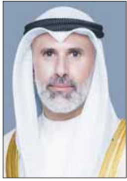
الشيخ جابر الجابر

أجرى وزير الخارجية الشيخ جراح الجابر أول من أمس الاتصال مع وزير الخارجية السعودي فيصل بن فرحان. وذكرت وزارة الخارجية - في بيان صحفي - أنه تم خلال الاتصال مناقشة ما تشهده المنطقة من تصعيد عسكري متزايد نتيجة للعدوان الإيراني الآثم على دول المنطقة وما يترتب عليه من انعكاسات خطيرة وتداعيات مقلقة على الأمن والاستقرار على المستويين الإقليمي والدولي. وكان وزير الخارجية الشيخ جراح الجابر قد تلقى اتصالاً هاتفياً أمس من نائب رئيس الوزراء وزير الخارجية وشؤون المغتربين في الأردن أيمن الصفدي، جرت خلاله مناقشة ما تشهده المنطقة من تصعيد عسكري متزايد نتيجة للعدوان الإيراني الآثم على دول المنطقة وما يترتب عليه من انعكاسات خطيرة وتداعيات مقلقة على الأمن والاستقرار على المستويين الإقليمي والدولي.