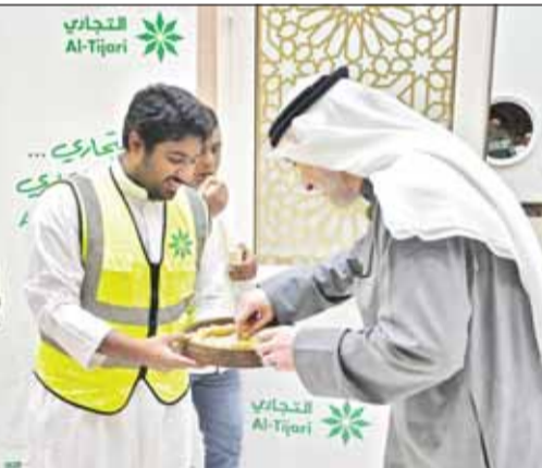
موظفو البنك التجاري يقدمون الخدمة للمصلين

لهم خلال توافدهم على المساجد لأداء صلاة القيام في العشر الأواخر من الشهر الكريم وكذلك عند مغادرتهم المساجد بعد الصلاة. وأشارت إلى أن البنك التجاري مستمر في إطلاق وتنفيذ مبادرات مجتمعية متنوعة على مدار العام، بما يعكس التزامه بدوره المجتمعي وحرصه على تعزيز الشراكة مع مختلف شرائح المجتمع في دولة الكويت.