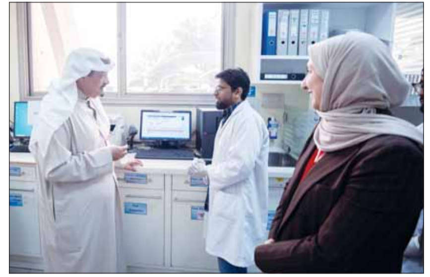
... ويستمر شرح عن العمل

تشغيل الملجأ في حالات الطوارئ والإمكانات المتوفرة ومنظومة السلامة إضافة إلى الاستعدادات اللوجستية والخدمية في الظروف الاستثنائية. وأعرب سمو رئيس مجلس الوزراء عن شكره وتقديره للكوادر الوطنية العاملة في مختلف محطات القوى الكهربائية وتقطير المياه لما يبذلونه من جهد وعمل متفان في أداء مسؤولياتهم الوطنية، مؤكدا سموه أهمية مواصلة العمل الدؤوب بما يضمن استدامة تقديم هذه الخدمات الأساسية.