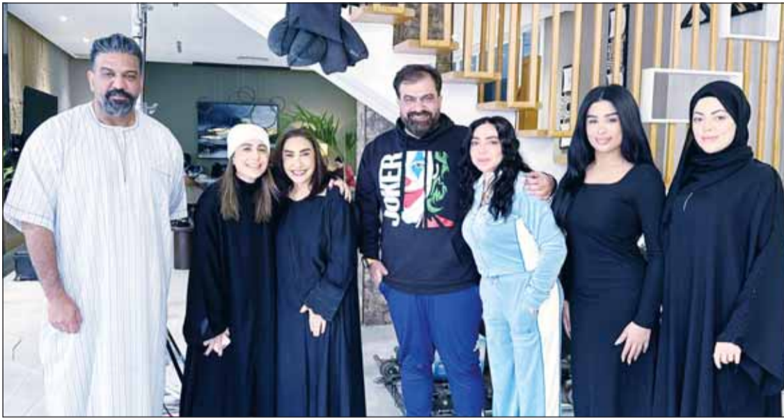
نجوم مسلسل "دراما كوين"