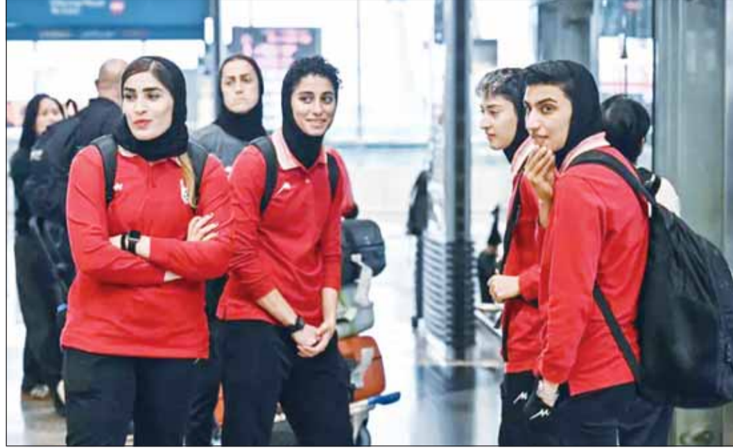
لاعبات المنتخب الإيراني للسيدات خلال مغادرة الفندق في ماليزيا

وأضاف أن الاعبات "سيتمكن على الأرجح في عُمان إلى أن يجدن رحلات إلى وجهتهم التالية". لكن مصدراً موثقاً رجح لـ "فرانس برس" سفر الفريق من عُمان إلى إسطنبول، قبل التوجه إلى مدينة فان شرق تركيا ثم الدخول إلى إيران. وقالت لاعبة سابقة وقناة تلفزيونية ناطقة بالفرنسية من خارج إيران إن الاعبات تعرّض لضغوط لإجبارهن على التراجع عن طلب اللجوء إلى أستراليا، حيث خاض المنتخب نهائيات كأس آسيا للسيدات، من خلال تهميدات طالبت عائلاتهن في الداخل. لكن السلطات الإيرانية اتهمت في المقابل أستراليا بممارسة ضغوط على الاعبات للبقاء.