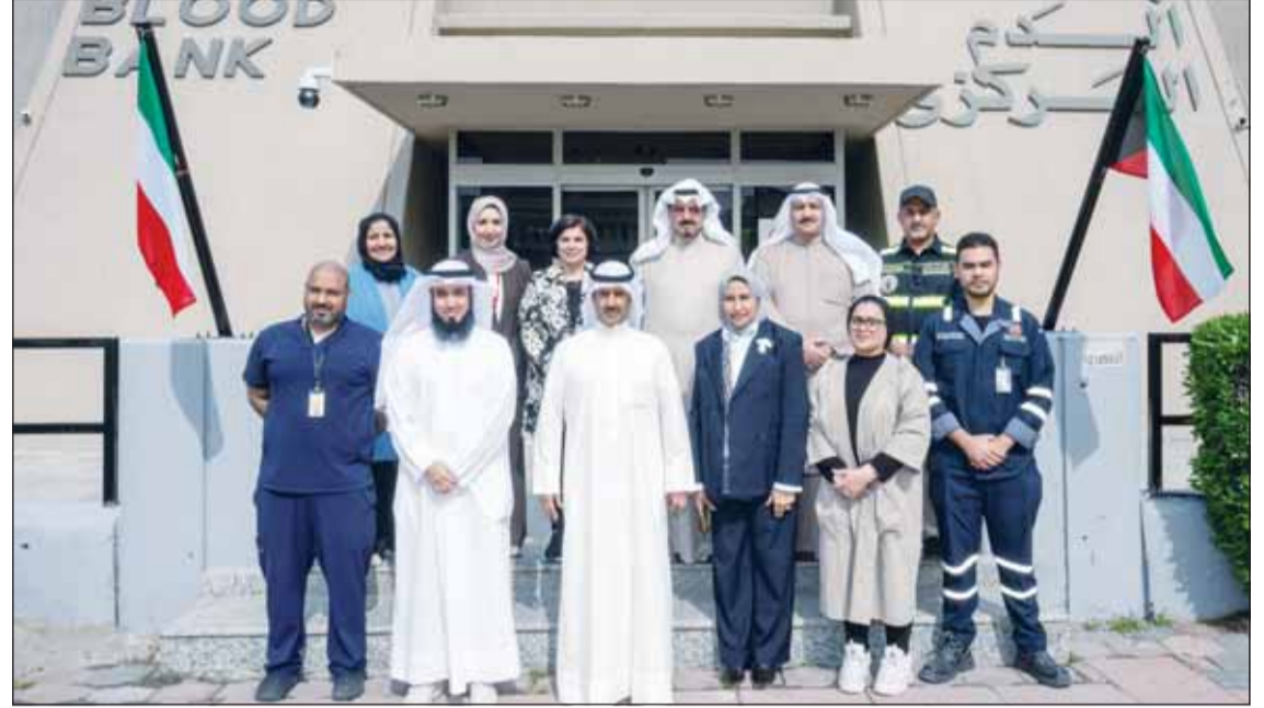
سمو رئيس الوزراء الشيخ أحمد عبدالله متوسماً وزير الصحة د. أحمد العوضي وقياديه بنك الدم

سموه تفقد البنك واستمع إلى شرح من المسؤولين حول آليات عمله