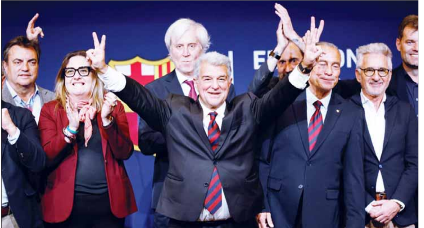
فردة لابورتا فيم الفوز بانتخابات رئاسة نادي برشلونة

من العمر 63 عاماً بـ"نتيجة مدوية تمنحنا قوة كبيرة". وأضاف لابورتا، هذا يجعلنا لا يقهر. لن يوقفنا أحد. أعوام مثيرة تنتظرنا. ستكون الأفضل في حياتنا. وواجه برشلونة مشاكل مالية في الأعوام القليلة الماضية، ولكنه فاز باللقب الدوري وكأس ملك إسبانيا وكأس السوبر الإسباني في الموسم الماضي ، ووصل للدور قبل النهائي بدوري أبطال أوروبا. ويتصدر فريق برشلونة جدول ترتيب الدوري الإسباني بفارق أربع نقاط أمام الغريم التقليدي ريال مدريد، كما أنه يتواجد في دور الـ 16 بدوري