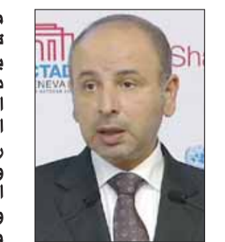
السفير ناصر الهين

مقومات الأمن والتنمية لشعوبها، محذراً من تداعيات كارثية قد تتجاوز الإقليم، منوهاً بحكمة القيادة السياسية الكويتية ونظيراتها في دول مجلس التعاون الخليجي، ومشيداً بنهجها المتزن القائم على ضبط النفس وتغليب لغة العقل، والدعوة إلى التهدئة والحلول السياسية رغم حجم التحديات والاستفزازات. وحذر السفير الهين من أن استمرار هذا السلوك الإيراني يمثل إستخفاً خطيراً بالمجتمع الدولي وانتهاكاً صارخاً للقوانين والمواثيق الدولية، مؤكداً أن هذه الانتهاكات بلغت مستوى غير مسبوق من الخطورة، بما لا يدع مجالاً للصمت أو التردد.