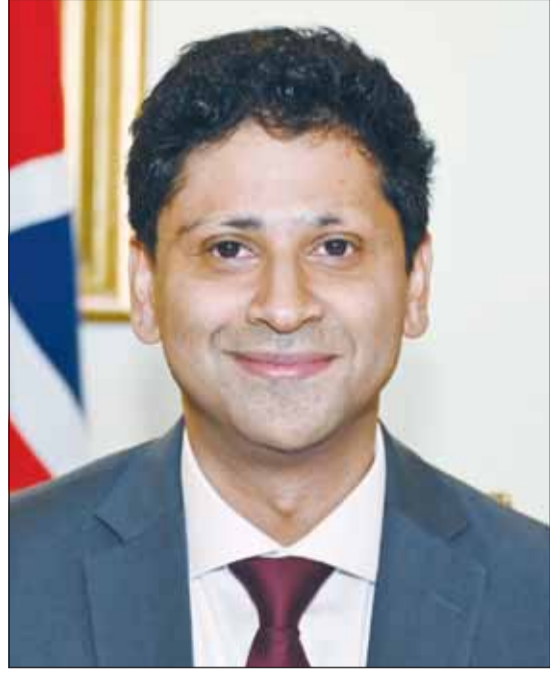
السفير البريطاني قُدس بن رشيد

عسكرياً ودبلوماسياً، وحماية المصالح في المنطقة. وأشار إلى استمرار التنسيق بين المسؤولين في البلدين، لافتاً إلى الاتصالات جرت بين سمو ولي العهد الشيخ صباح الخالد ورئيس الوزراء البريطاني، إضافة إلى تواصل وزراء الخارجية والدفاع في البلدين، ضمن جهود مشتركة لدعم الكويت والعمل على حل الأزمة.