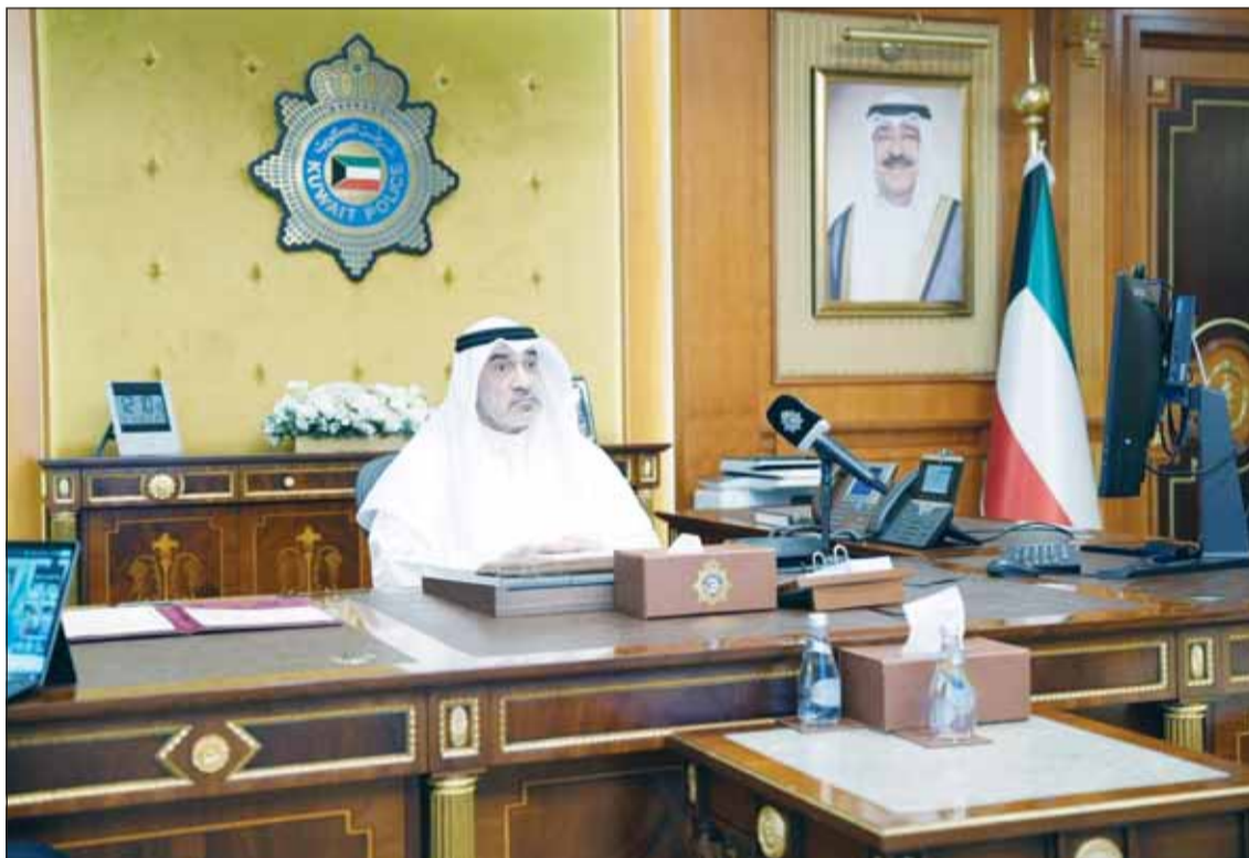
النائب الأول وزير الداخلية الشيخ فهد اليوسف مترأساً الدورة الـ 43 لمجلس وزراء العرب

□ تكثيف الجهود لمنع حصول الميليشيات والتنظيمات الإرهابية على المسيرات □ نحذر من استغلال الفضاء الإلكتروني في التجنيد الإرهابي... وخطورة آفة المخدرات □ وزير الداخلية السعودي: يجب العمل على تعزيز التعاون الأمني العربي المشترك