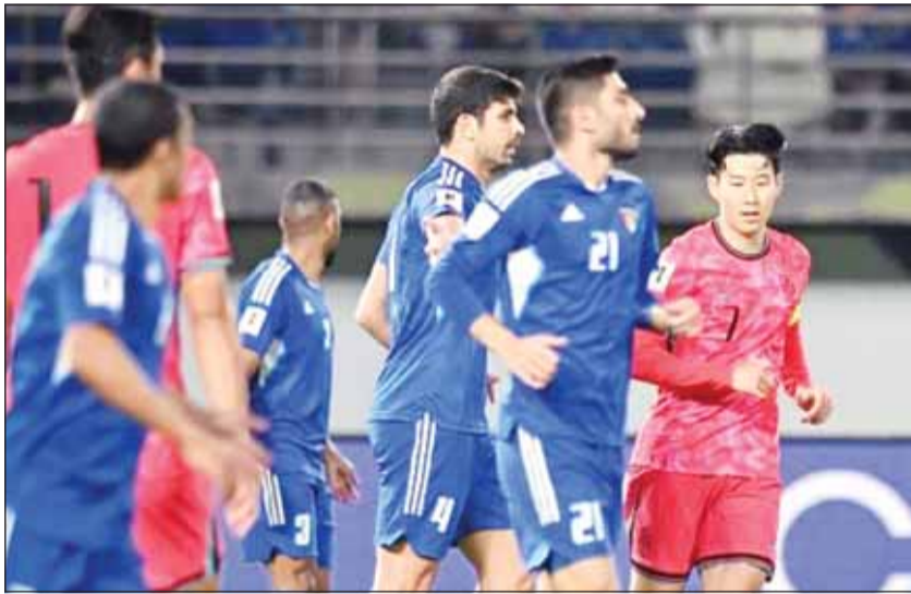
الأزرق يتقدم مركزاً في تصنيف فيفا

صعد منتخبنا الوطني الأول لكرة القدم مركزاً واحداً في التصنيف العالمي للمنتخبات الصادر اليوم عن الاتحاد الدولي لكرة القدم، حيث جاء في المركز 134، بعد أن كان في المركز 135 في شهر فبراير الماضي. ورغم أن "الأزرق" كان سيشارك في بطولة "سلسلة فيفا" التي أقيمت في كازاخستان خلال الفترة من 23 حتى 31 مارس الماضي، بمشاركة البلد المضيف وناميبيا وجزر القمر، بيد أن الأوضاع الراهنة التي تمر بها المنطقة منذ نهاية فبراير الماضي قادت إلى إلغاء المشاركة في البطولة. من جانبه، تصدر المنتخب الفرنسي التصنيف العالمي للمنتخبات للاتحاد الدولي لكرة القدم (فيفا) للمرة الأولى منذ تتويجه بأمم أوروبا روسيا 2018، بفضل فوزه في وديته نقطة بخارق نقطة عن إسبانيا، بطلا أوروبا، التي اكتفت بالتعادل السلبي مع مصر أول من أمس، بعد الفوز وكان رجال المدرب ديدييه ديشان ألحقوا خسارة مهمة