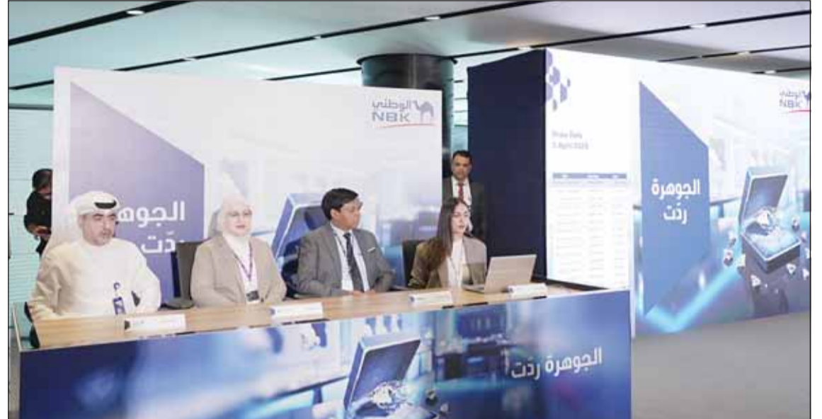
ممثلو شركتكم جرانت ثورنتون وديلويت يشرفون على عملية السحوبات