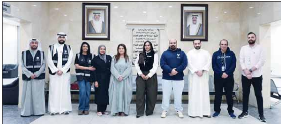
حملة التبرع بالدم