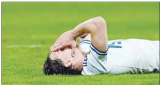
حسرة إيطالية بعد الخسارة من البوسنة والخروج من كأس العالم

فشلت إيطاليا في تجنب ما يعتبر كارثة بالنسبة لبلد يتنافس كرة القدم، وأفقدت في التأهل إلى النهائيات للمرة الثالثة توالي بسقوطها بركلات الترجيح أمام مضيفتها البوسنة والهرسك، التي تأهلت بصحبة السويد وتركيا وتشيكيا في الملحق الأوروبي لمونديال 2026، الثلاثاء.