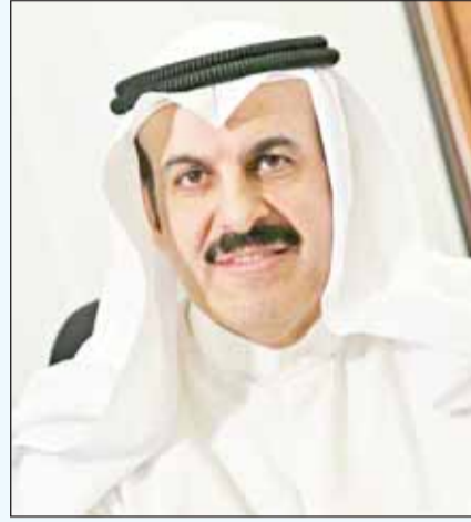
وزير المالية أديعقوب الرفاعي