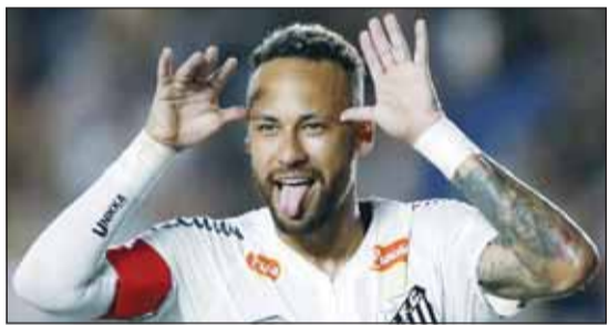
المحكمة تبرأ نيمار جونيور

ذكرت تقارير إعلامية أن القضاء في ولاية ريو دي جانيرو أسدل الستار على قضية أثارت جدلاً واسعاً، بعدما قرر إلغاء غرامات مالية ضخمة كانت مفروضة على نيمار، على خلفية أعمال إنشاء بحيرة اصطناعية داخل قصره في مدينة مانفاراتيبا الساحلية.