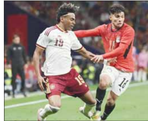
يامال لم يفعل شيئاً أمام الفراغة فيم الودية

القدم الدولية بين إسبانيا ومصر في برشلونة. في التصايل، قوبل التشيد الوطني المصري بصيحات استهجان قبل انطلاق المباراة الودية التي انتهت بالتعادل السلبي 0-0 في برشلونة، ضمن استعدادات كأس العالم، وناشئت إدارة ملعب آر سي دي إي للجماهير أكثر من مرة عبر مكبرات الصوت العامة الامتناع عن الإدلاء بتعليقات مسيئة. وبعد هذا الحادث الأخير في سلسلة من الحوادث المماثلة التي ألقت بظلالها على كرة القدم الإسبانية في السنوات الأخيرة.