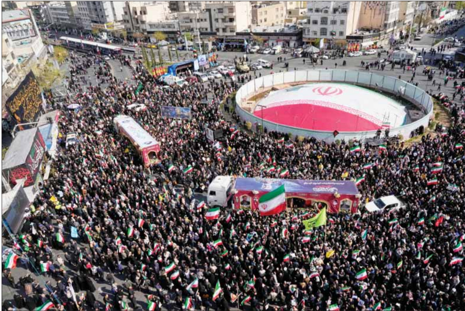
آلاف الإيرانيين يشاركون في طهران أمس في تشييع قائد القوات البحرية التابعة للدراس الثورية الإيرانية علي رضا تكسيري ومقتله غارات إسرائيلية - أميركية