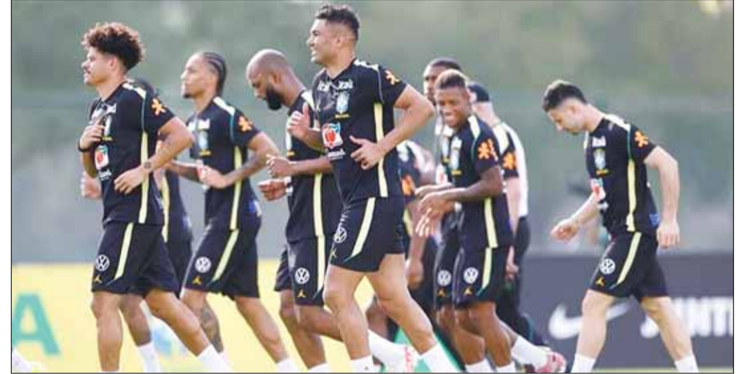
مكافآت كبيرة تنتظر لاعبي البرازيل إذا حققوا كأس العالم

لتحقيق النجاح في البطولة المقبلة، وتعكس استراتيجية الاتحاد لتعزيز الروح التنافسية وضمان مشاركة اللاعبين بأقصى درجات التركيز والجدية في جميع المباريات. يذكر أن قرعة كأس العالم 2026 أوقعت منتخب البرازيل في المجموعة الثالثة التي تضم إلى جانبه المغرب، هايتي، وأستراليا.