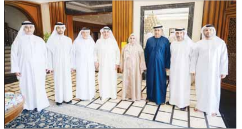
الشيخ حمد جابر العلي خلال استقباله السفير الإماراتي وعادل الحمادي

وأكد الوزير تقديره للمشاعر الأخرى التي عيّر عنها الحمادي تجاه الكويت، مشيداً بعمق العلاقات التاريخية والروابط الوثيقة بين البلدين، وما يجمعهما من قيم خليجية مشتركة. كما شدد على حرص القيادة الكويتية على تعزيز التماسك الوطني ورفع الجاهزية في مواجهة التحديات، بما يضمن أمن واستقرار البلاد.