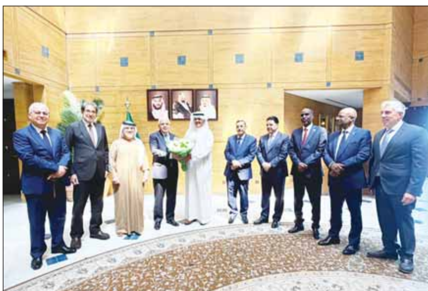
السفير رامي طهوب مقدماً باقة من الزهور باسم الأسرة الدبلوماسية إلى السفير السعودي

قام رامي طهوب سفير دولة فلسطين وعميد السلك الدبلوماسي العربي لدى دولة الكويت، برفقة عدد من سفراء الدول العربية، بزيارة ودية إلى سفير المملكة العربية السعودية لدى الكويت الأمير سلطان بن سعد، حيث أعرب عن شكر السفير وتقديرهم للجهود التي بذلتها السفارة السعودية في تسهيل حركة المقيمين غير منح تأشيرات المرور، في ظل توقف حركة الطيران نتيجة الأوضاع الراهنة. وأشاد الحضور بالدور الذي قامت به حكومة المملكة العربية السعودية في تذييل العيقات وتوفير التسهيلات، مؤكداً مكانتها ودورها المحوري في خدمة القضايا العربية والإسلامية. من جانبه، أكد سفير مملكة البحرين لدى الكويت صلاح المالكي أن السفارة السعودية، بقيادة السفير وطاقمها، قدمت نموذجاً متميزاً في سرعة الاستجابة والتعاون منذ بداية الأزمة،