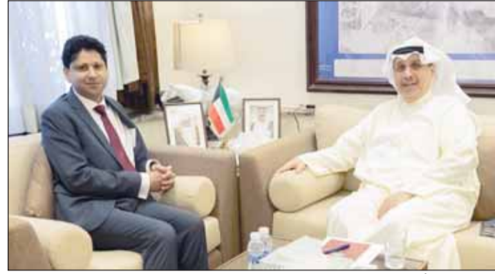
وزير الديوان الأميري الشيخ حمد جابر العلي مستقبلاً السفير البريطاني قديسي رشيد

تلقي سمو أمير البلاد الشيخ مشعل الأحمد، أمس، رسالة خطية من ملك المملكة المتحدة لبريطانيا العظمى وأيرلندا الشمالية تشارلز الثالث، تضمنت التأكيد على دعم المملكة المتحدة لدولة الكويت في ظل الأوضاع الراهنة الناجمة عن الاعتداءات الإيرانية الآثمة وحرصها على أمن الكويت وسلامتها ووقوفها إلى جانبها في مواجهة أي اعتداءات تستهدف سيادتها وأمنها واستقرارها. قام بتسليم الرسالة لوزير شؤون الديوان الأميري الشيخ حمد جابر العلي سفير المملكة المتحدة لبريطانيا العظمى وأيرلندا الشمالية لدى دولة الكويت قديسي رشيد.