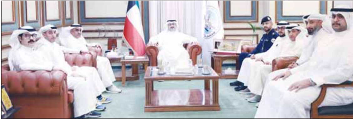
محافظ العاصمة الشيخ عبدالله سالم العلي مستقبلاً وفد الرقابة التجارية

بمرونة مع أي مستجدات قد تؤثر على حركة الأسواق ورفع كفاءة العمل الرقابي والحد من الغش التجاري بما يسهم في تحقيق أعلى مستويات الحماية للمستهلك. كما أشار المحافظ إلى أهمية استمرار التنسيق المشترك وتعزيز التعاون البناء بين كافة الجهات ذات الصلة ودعم الجهود الحكومية لخدمة الوطن وتعزيز جودة الخدمات المقدمة للمواطنين. وأشاد المحافظ بالدور الحيوي الذي تضطلع به إدارة الرقابة التجارية ومهامها المهمة في تعزيز الثقة في الأسواق المحلية ودعم الاستقرار التجاري بما يسهم في تلبية احتياجات المواطنين ومواجهة التحديات الإقليمية الراهنة.