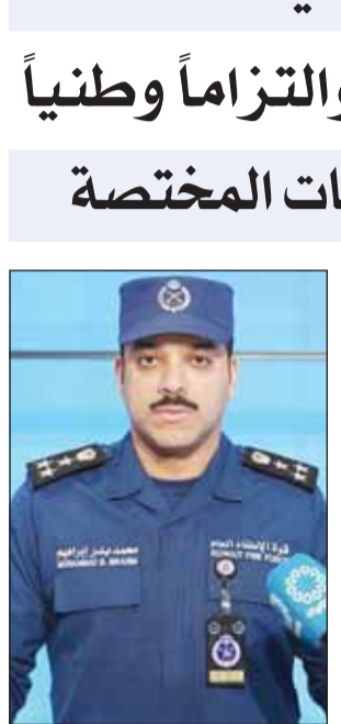
العقيد محمد الفرج

"الدفاع": وحدات الجيش تنفذ مهامها وواجباتها الوطنية بكفاءة عالية