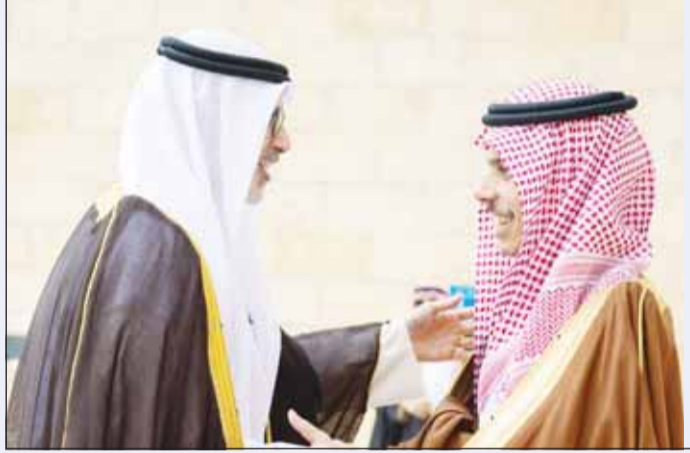
وزير الخارجية السعودي الأمير فيصل بن فرحان مرحباً بنظيره الشيخ جراح الجابر

مختلف المجالات وعلى المستويات كافة تنفيذاً لروى وتطلعات قيادتي البلدين المكيمة.