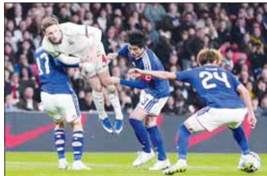
الفوز الأول لليابان علمه انكلترا

حققت اليابان انتصارها الأول على إنكلترا، بفوزها 1-0 في مباراة ودية أقيمت على ملعب ويمبلي أول من أمس، مما منح المدرب هاجيمي مورياسو الثقة بأن فريقه قادر على هزيمة أي منافس في كأس العالم لكرة القدم.