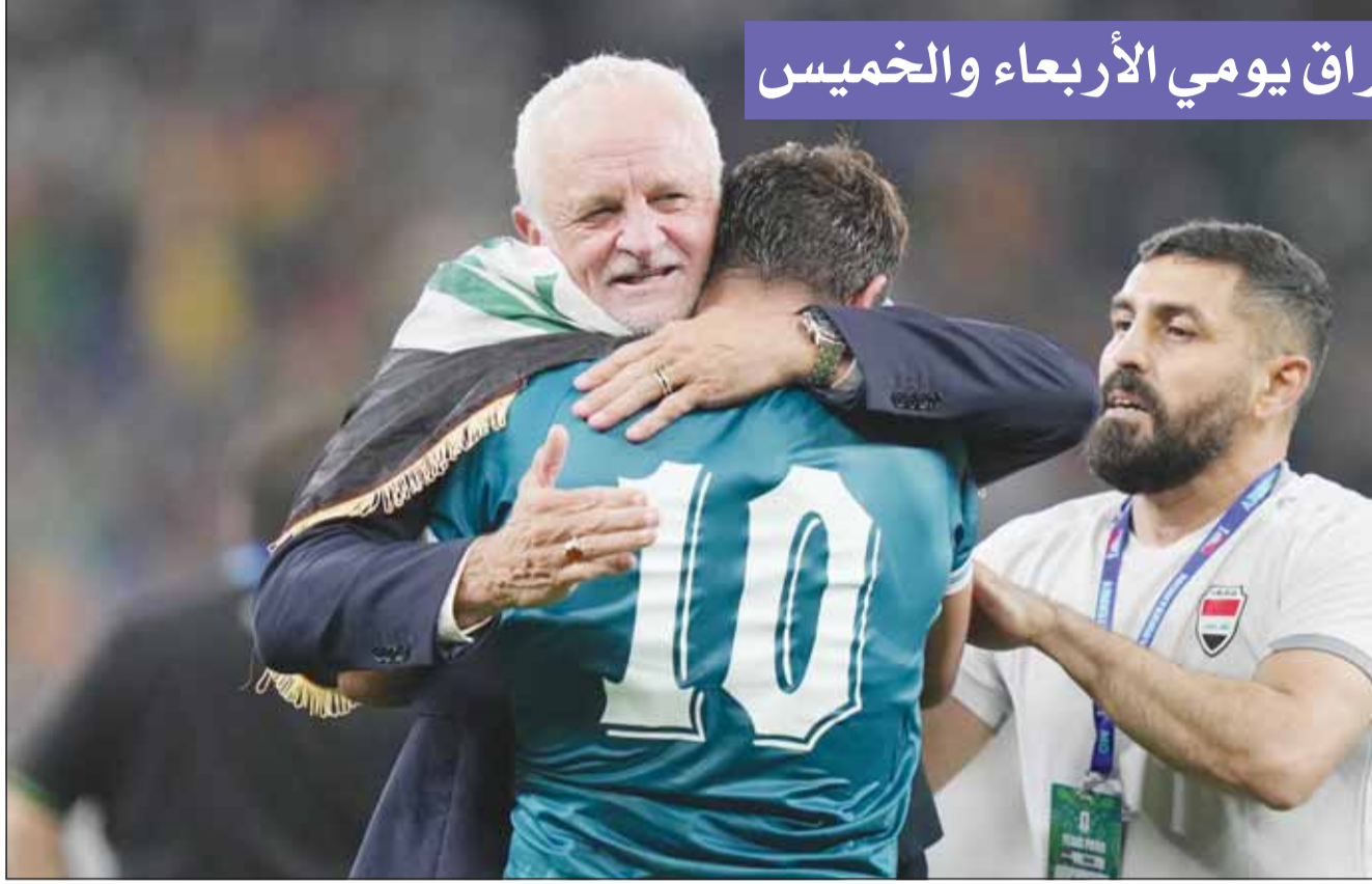
مدرسة مدرب العراق غراهام آرنبولد بتأهل أسود الرفادين إلى كأس العالم