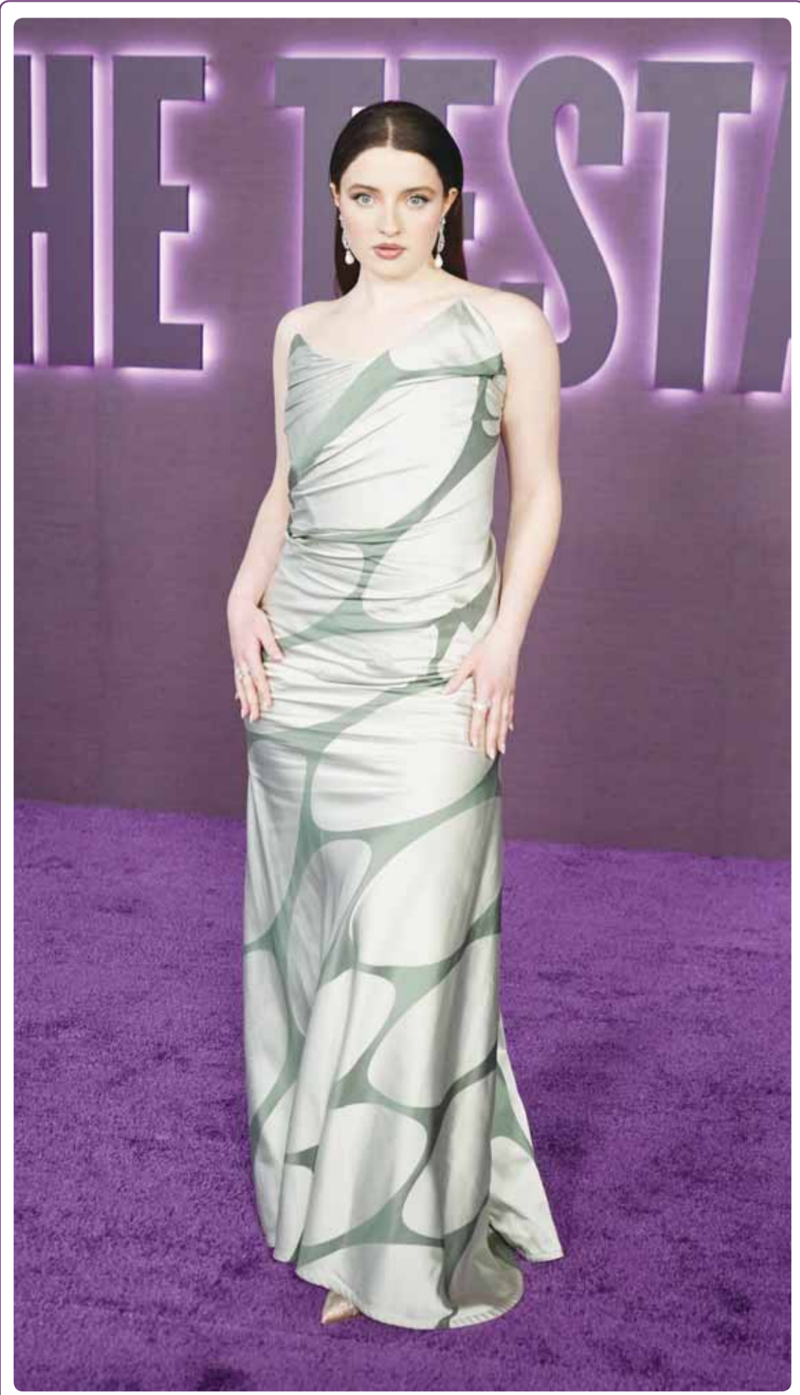
الممثلة الأميركية لوسي هاليداي خلال حضورها العرض الأول للمسلسل "الوصايا" في لوس أنجلوس

سيدني - وكالات، تؤكد دراسة جديدة نشرت في مجلة "إيمتس البيئية" المتخصصة، أن البشر استنزفوا موارد كوكب الأرض بشكل يفوق طاقته بكثير، فمنذ منتصف القرن العشرين، تغيرت ديناميكيات السكان بشكل كبير. وقال البروفيسور كوري برادشو من جامعة "فلنדרز" الاسترالية الباحث الرئيسي في الدراسة: "إن الأرض لا تستطيع مواكبة طريقة استخدامنا للموارد، حتى مع الطلب الحالي، فالبحر يضغط على الكوكب أكثر مما يحتمل". وحلل الباحثون بيانات سكانية لأكثر من 200 عام، وتتبعوا كيف تغير حجم السكان، ومعدلات النمو، واكتشفوا أن النمو السكاني كان يتسارع قبل خمسينيات القرن الماضي، إذ كان المزيد من الناس يعني المزيد من الابتكار والطاقة، لكن هذا النمط انهار في أوائل الستينيات، عندما بدأ معدل النمو في الانخفاض رغم استمرار ازدياد عدد السكان.