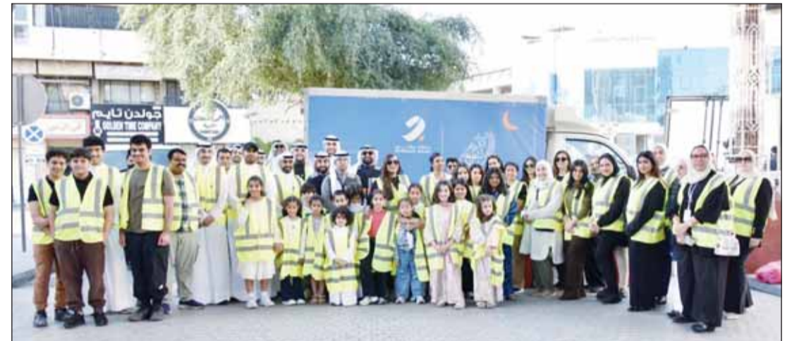
خلال توزيع وجبات الصائمين

التواصل الاجتماعي، ركزت على إرشادات السلامة المرتبطة بمخاطر الأعمال الكهربائية والحوادث المنزلية، بما في ذلك التعامل مع الحلات الطارئة وسبل الوقاية، في تأكيد على أهمية تكامل الجهود بين القطاعين الخاص والحكومي لخدمة المجتمع وتعزيز ثقافة الوقاية.