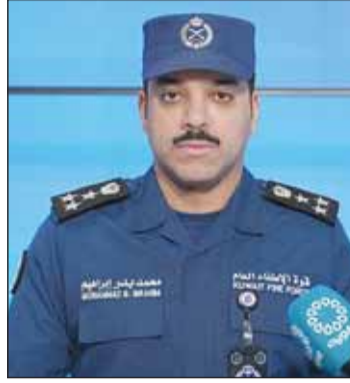
العميد محمد الغريب

وأشاد بوصليب "بثبات المواطنين والمقيمين، وما أظهروه من تماسك وثقة عالية بالأجهزة الأمنية، معتبراً أن ذلك يعكس القيم الراسخة للمجتمع الكويتي في مواجهة التحديات"، مؤكداً أن