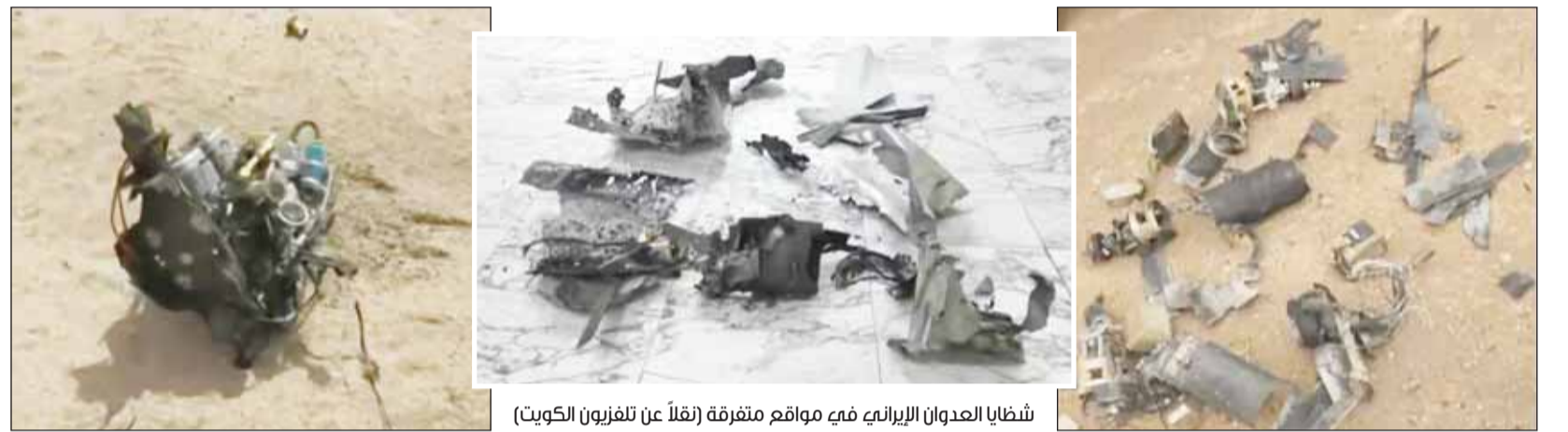
شظايا العدوان الإيراني في مواقع متفرقة (تقلاً عن تلفزيون الكويت)

النائب الأول استقبل ذوي شهدي القوة البحرية: تضحياتهما ستظل محفورة في وجدان الوطن