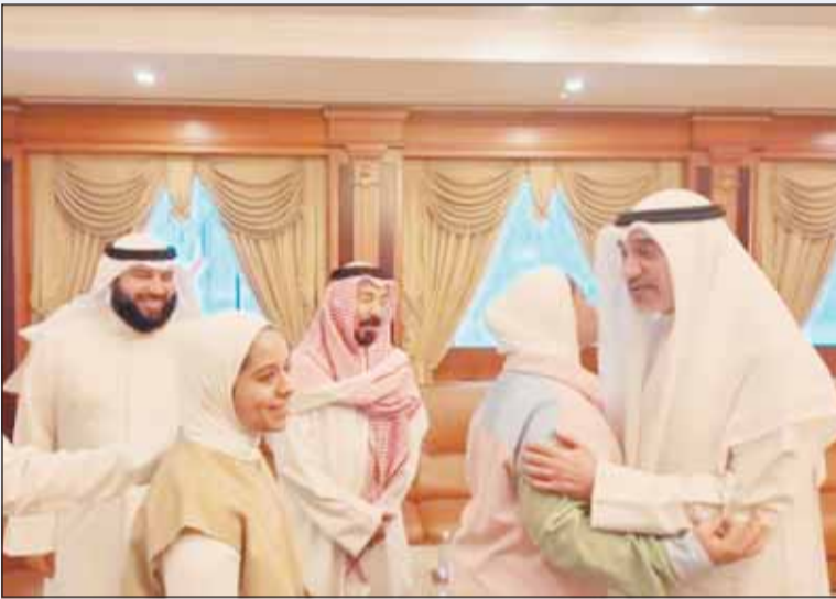
النائب الأول الشيخ فهد اليوسف مستقبلاً أسرته وذوي شهيد الوهاب

استقبل النائب الأول لرئيس مجلس الوزراء وزير الداخلية الشيخ فهد اليوسف أمس ذوي شهدي الوهاب الرقيب وليد مجيد سليمان والرقيب عبد العزيز عبد المحسن ناصر، من منتسبي القوة البحرية بالجيش، وذلك في إطار الحرص المستمر على التواصل مع أبناء الوطن الذين قدموا أرواحهم فداءً لثرايه وحفاظاً على أمنه واستقراره.