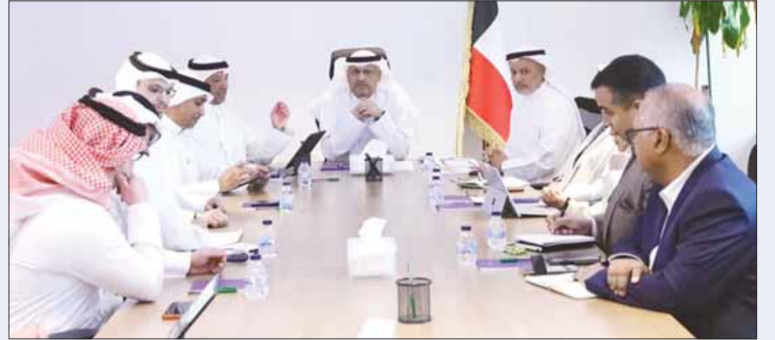
وزير الاتصالات والإعلام بالوكالة عمر العمر منترأساً الاجتماع التنسيقي

وفي ضوء الجهود المتواصلة لتفعيل خطط الطوارئ ورفع درجة التنسيق بين الأطراف المعنية بما يضمن الحفاظ على استقرار الشبكات واستيعاب أي زيادة محتملة في الضغط على الخدمات. وأضاف أن الاجتماع جاء أيضاً استعداداً لما تم التأكيد عليه في الاجتماعات السابقة بشأن تفعيل كامل القطاعات التشغيلية ورفع جاهزية إلى أعلى مستوياتها لضمان استمرار خدمات الاتصالات والإنترنت بكامل طاقتها في إطار منظومة متكاملة تعمل على مدار الساعة لخدمة المواطن والمقيم. وأشاد الوزير العمر بالتعاون الوثيق من قبل شركات الاتصالات ودورها المحوري في دعم استقرار المنظومة الرقمية " وهذا التكامل يعكس نموذجاً وطنياً متقدماً في إدارة الأزمات وضمان استمرارية الخدمات الحيوية".