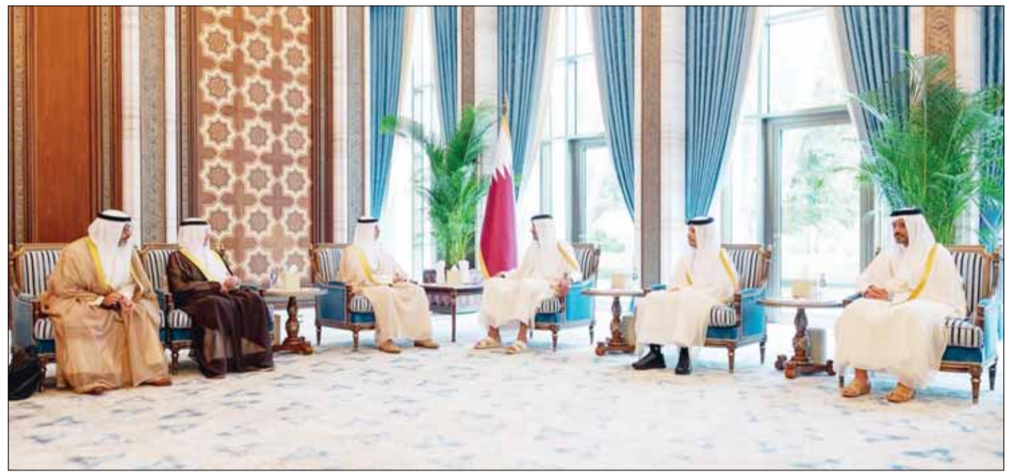
جانب من المباحثات بين أمير قطر ووزير الخارجية الشيخ جراح الجابر