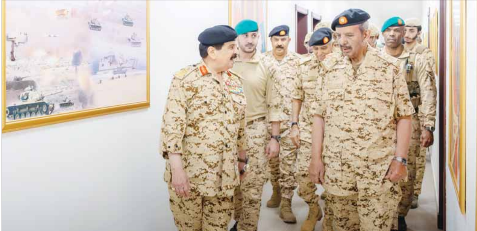
العاهل البحريني الملك حمد بن عيسى يستلم علم شرح من القائد العام لقوة دفاع البحرين الشيخ خليفة بن أحمد خلال زيارته القوة وبقائه منتسبها أمس

برنامج دفاع جوي مشترك بين فرنسا وإيطاليا قادر على تمييز الصديق والعدو