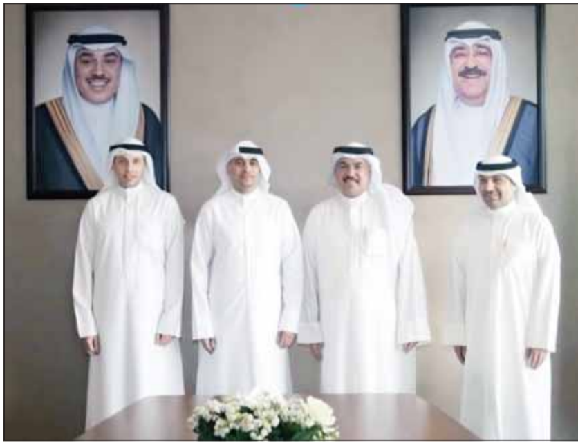
وزير التربية سيد جلال الطيباني مستقبلاً وزير الشباب طارق الجلاهمة

توسيع التعاون في اكتشاف الموهوبين ورعايتهم بمختلف المراحل التعليمية