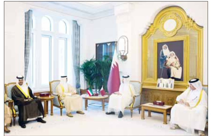
وزير الخارجية الشيخ جراح الجابر ونظيره القطري الشيخ محمد بن عبد الرحمن خلال المباحثات