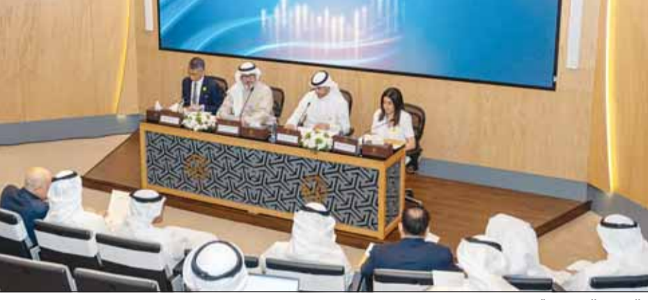
جانب من العمومية