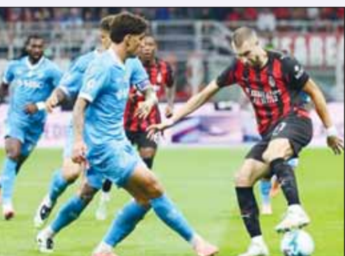
قمة مثيرة تجمع ميلان ونابولي لليلة

أبطال أوروبا وسباق اللقب الذي لا يزال مفتوحاً على كل الاحتمالات، حيث يحتل ميلان المركز الثاني في جدول الترتيب برصيد 63 نقطة من 30 مباراة بواقع 18 فوزاً و9 تعادلات و3 هزائم فقط، بينما يتربع نابولي في المركز الثالث بنقطة 62 نقطة محققاً 19 فوزاً و5 تعادلات و6 هزائم. وفرق النقطة الواحدة يجعل كل لقاء مباشر بين الفريقين بمثابة نهائي مصغر قد يعيد رسم خريطة الترتيب بالكامل. وفي مباراة أخرى، يستضيف يوفنتوس نظيره جنوى، في الساعة 07:00 مساءً على ملعب "اليانز ستاديووم". ويدخل يوفنتوس اللقاء رافقاً شعار لا بديل عن الفوز، حيث يحتل المركز الخامس برصيد 54، والنقاط الثلاث تجعله يتنافس بقوة على التواجد في المربع الذهبي وحجز مقعد موهل لدوري أبطال أوروبا في الموسم المقبل. في المقابل، يأتي جنوى في المركز الثالث عشر برصيد 33 نقطة ويحتاج أيضاً إلى تحقيق نتيجة إيجابية من أجل التقدم في جدول الترتيب، والابتعاد عن شبح الهبوط.