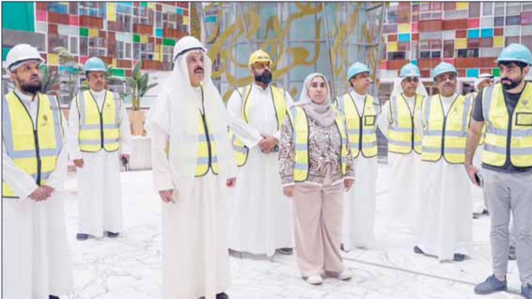
الوزير الرفاعي يطلع على الأضرار الناجمة عن الاستهداف

المنيفي: دعم ومتابعة لجهود احتواء آثار الحادث وضمان استمرار العمل بكفاءة