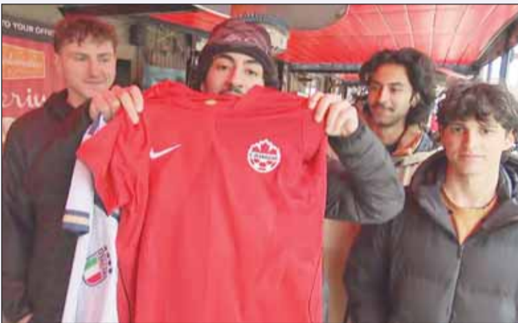
مشجعو منتخب كندا في المونديال

استبدلوا قميص منتخب إيطاليا "سكودرا أورورا" بقميص منتخب كندا "كانكس"، هذا ما اقترحه الاتحاد الكندي لكرة القدم للجماهير الكندية من أصول إيطالية في تورنتو، أول من أمس، لـ "دعم المنتخب الوطني" في كأس العالم 2026.