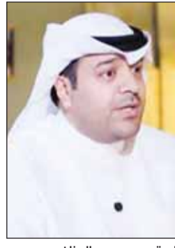
المقدم سعود الوزان

ولفت إلى أن وزارة الداخلية نشرت التحذيرات والتنبهات عبر منصات التواصل وبمختلف اللغات للوعية بخطورة التصوير والنشر خلال الأزمات داعية الجميع إلى الالتزام بالتعليمات حفاظاً على أمن البلاد واستقراره.