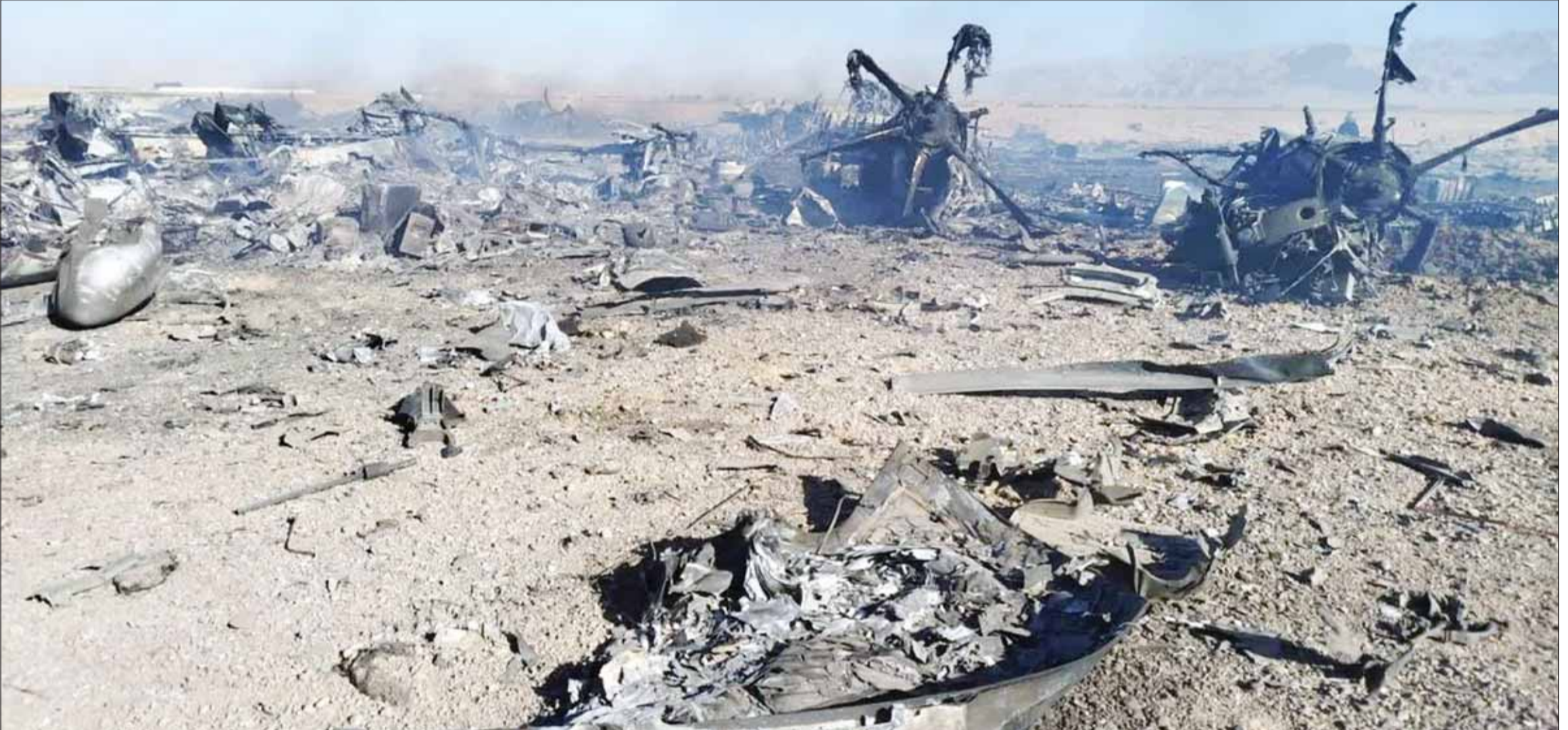
صورة نشرها موقع "سباه نيوز" الموقع الرسمي للحرس الثوري الإيراني تظهر حطام طائرة نقل أميركية سقطت ومروحيتين كانتا تشاركان في عملية إنقاذ الطيار الأميركي حسب زعم التلفزيون الإيراني الرسمي.

الدين قادوا البلاد بطريقة سيئة وغير حكيمه إلى جانب الكثير غيرهم جراء الضربة الهائلة في طهران"، ونشر مقطع فيديو لضربات جوية على العاصمة طهران. في المقابل، ردت إيران بالتلويح بإغلاق مضيق باب المندب إلى جانب مضيق هرمز، في حال أقدم الرئيس الأميركي على تنفيذ تهديداته بمهاجمة البنية التحتية للطاقة في البلاد، وقال مستشار المرشد الإيراني علي أكبر ولايتي على منصة "إكس" إن غرفة القيادة الموحدة لجبهة المقاومة تنظر إلى باب المندب كما تنظر إلى مضيق هرمز، مضيفا أن البيت الأبيض سيدرك قريبا أن تدفق الطاقة والتجارة العالمية يمكن تعطيله بإشارة واحدة إذا فكر في تكرار "أخطائه الغبية"، بينما قال النائب الأول للرئيس الإيراني محمد رضا عارف إن الرئيس الأميركي دونالد ترامب يحاول تحرير عجزه عن توفير خدمات دور الحضانه والرعاية الصحية لشعبه بديعة الحرب، مضيفا ردا على تهديدات ترامب بإعادة إيران إلى العصر الحجري، بالقول إن "من يرضى برفاه شعبه من أجل تهديد الآخرين لا يزال يعيش في العصر الحجري"، مضيفا أن إيران أخطرت طريقا مغلطا، في تواصل البناء حتى تحت الضغط، في حين حذر رئيس مجلس الشورى الإيراني محمد باقر القالبياف، ترامب، من أن المنطقة بأكملها ستعترق بسبب تحركاته المتهورة، قائلا في منشور باللغة الإنجليزية على منصة "إكس" إن "تحركاته المتهورة تجر الولايات المتحدة إلى جحيم لكل عائلة، والمنطقة بأكملها ستعترق لأنك تصر على اتباع أوامر رئيس وزراء الاحتلال الإسرائيلي بنيامين نتانياهو"، مضيفا أن الحل الحقيقي الوحيد هو احترام حقوق الشعب الإيراني وإنهاء هذه اللعبة الخطيرة، وفق تعبيره.