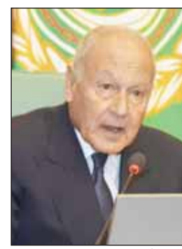
أحمد أبو الفيث

القاهرة - "كونا"، دان الأمين العام لجامعة الدول العربية أحمد أبو الفيث مجدداً، أمس، استمرار العدوان الإيراني الغاشم الذي استهدف منشآت حيوية مدنية في دولة الكويت وأدى إلى وقوع أضرار مادية جسيمة. وندد أبو الفيث في بيان بالاعتداءات التي طالت مصطفيين لتوليد الكهراء وتحلية المياه، إلى جانب مبنى مجمع الوزارات ومجمع القطاع النفطي، ومرافق تابعة لشركة البترول الوطنية الكويتية وشركة صناعة الكيماويات البترولية.