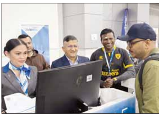
طيران الجزيرة في أول رحلة إلى كاتماندو

الشنكات الأساسية. ومنذ إطلاق عملياتها عبر نموذج المطارين، أعادت طيران الجزيرة بناء شبكتها تدريجياً لتخدم حالياً 36 مدينة في 10 دول وذلك بأكثر من 1.500 رحلة وبنما يزيد عن 450.000 مقعد حتى 15 مايو. ويأتي إطلاق خط رحلات إلى كاتماندو لتعزيز هذا العمر المتنامي وتأكيداً على دور الشركة في الحفاظ على الربط الحيوي بين الكويت والعالم.