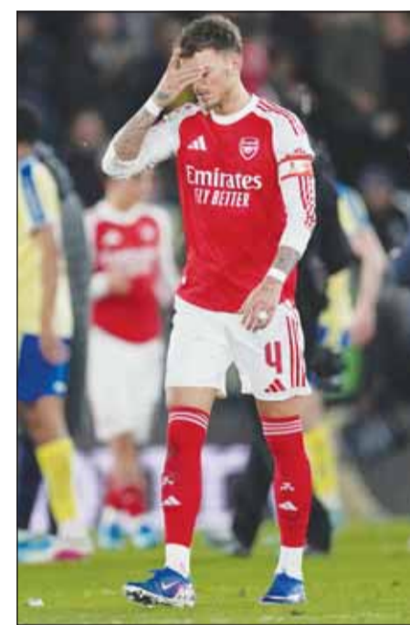
خليفة أمل المدفعية بالخروج من كأس الاتحاد

عاد الجدل بقوة بشأن قدرة أرسنال على تحقيق الألقاب، وخاصة حسم لقب الدوري الإنجليزي الممتاز، بعد خروجه الصادم من بطولة كأس الاتحاد الإنجليزي أول من أمس. وودع أرسنال كأس الاتحاد الإنجليزي، بعد خسارته أمام نادي ساوثهامبتون، الذي يناهس في الدرجة الأولى، بنتيجة 2-1. وهذه هي البطولة الثانية التي يفقدها أرسنال خلال أسابيع قليلة، بعد خسارته نهائي كأس الرابطة الإنجليزية للمحترفين أمام مانشستر سيتي، وقبل شهر فقط، كان حلم "الرباعية" يراود جمهور أرسنال، وهو المصطلح الذي يطلق على الفريق الذي يحقق دوري أبطال أوروبا والدوري الإنجليزي وكأس الاتحاد وكأس الرابطة. وخلال أسبوعين، أصبح أمام الفريق بطولتين فقط.