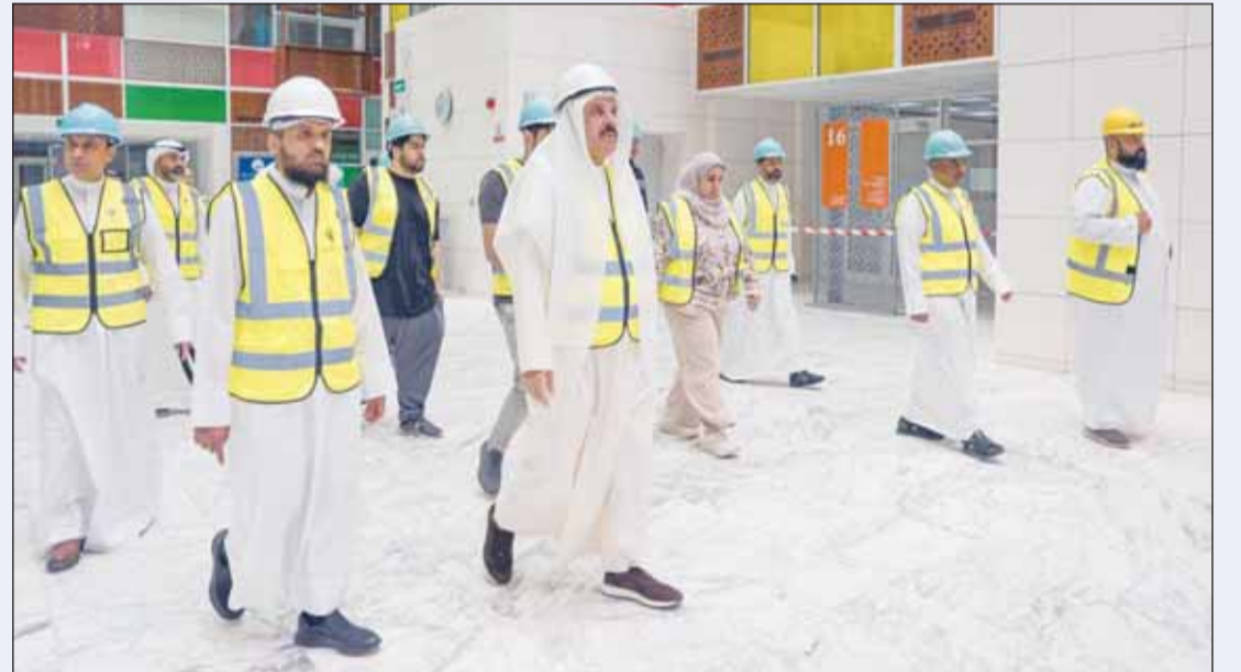
وزير المالية د. يعقوب الرفاعي وهكيل الوزارة أسيل المنيفي خلال الجولة التفتيشية لمبنى مجمع الوزارات عقب الاستهداف

وقت ممكن، داعياً المولى . سبطانه . أن يحفظ الكويت وشعبها من كل مكروه. رافق الوزير في الجولة وكيل وزارة المالية أسيل المنيفي، التي أكدت بدورها على دعم ومتابعة قيادات الوزارة لكل الجهود الرامية إلى احتواء آثار الحادث وضمان استمرارية العمل بكفاءة.