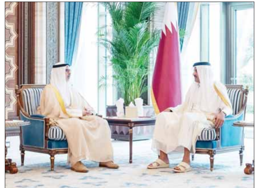
الشيخ تميم بن حمد مستقبلاً الوزير الشيخ جراح الجابر

وأكد الجانبان مواصلة التنسيق الكويتي - القطري على مختلف الصعد في ظل هذه الظروف الدقيقة التي تمر بها المنطقة انطلاقاً من وحدة المصير والتاريخ المشترك وتعزيزاً للجهود في مواجهة التحديات الراهنة.