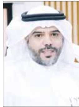
د. خالد العجمي

أكد وكيل وزارة الشؤون الاجتماعية د. خالد العجمي أن العمل في الوزارة يسير وفق منظومة تشغيلية متكاملة تجمع بين الحضور الميداني في المراكز الحيوية المعتمدة مسبقاً والعمل عن بُعد لبقية الكوادر، تنفيذاً لقرار مجلس الوزراء، وبما يضمن استمرارية تقديم الخدمات بكفاءة عالية في مختلف الظروف. وأوضح العجمي - في تصريح صحفي - أن الوزارة وبناؤه على توجيهات القيادة السياسية ومجلس الوزراء، وبتعليمات مباشرة من وزير الشؤون الاجتماعية وشؤون الأسرة والطفولة د.أمثال الهويلة، سارعت إلى تفعيل خطة الطوارئ المعتمدة فور وقوع الاعتداءات الإيرانية الأتمة التي طالت مجمع الوزارات، مؤكداً أن الجاهزية المسبقة أسهمت في انتقال سلس ومنظم لمواقع العمل البديلة دون أي تأثير يذكر على الخدمات المقدمة. وبيّن أن الخطة ارتكزت على تشغيل مراكز حيوية موزعة على مختلف محافظات البلاد، تم تجهيزها مسبقاً لمباشرة الأعمال ضرورياً، بما يضمن استمرارية الخدمة الميدانية، بالتوازي مع تفعيل أنظمة العمل عن بُعد للموظفين، بما يعزز مرونة الأداء ويحافظ على سلامة الكوادر الوطنية.