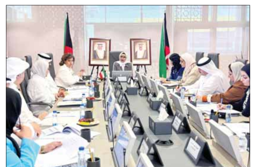
وزيرة الشؤون* أمثال الحويلة خلال تفقدها مركز الإيواء بالصباحية

وآليات متابعة دقيقة، مؤكدة التزام الجهات المعنية بتنفيذ البنود وفق اختصاصاتها بما يعزز مستوى الامتثال ويسهم في دمج ذوي الإعاقة في المجتمع. وأوضحت أن الاجتماع استعرض خطط الطوارئ لدى عدد من الجهات الحكومية في ظل الظروف الراهنة والوقوف على مستوى الجاهزية والتدابير المتخذة لضمان استمرارية الخدمات للقطاعات المشمولة بالرعاية. وشددت على أن المرحلة الحالية تتطلب تكثيف العمل المشترك وتبادل الخبرات بين الجهات المعنية بما يعزز كفاءة الأداء ويحقق نتائج ملموسة تنعكس إيجاباً على جودة حياة الأشخاص ذوي الإعاقة. وأكدت استمرار اللجنة في أداء دورها التنسيقي والرقابي ومتابعة تنفيذ الخطط والتوصيات بما يجسد حرص دولة الكويت على ترسيخ مبادئ العدالة والمساواة وتكافؤ الفرص لجميع فئات المجتمع.