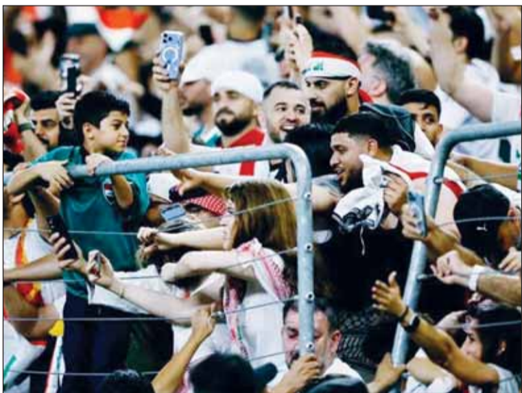
مناشدات من جماهير العراق حول أزمة تذاكر

نشر حساب "معرض الكرة العراقية المصور" أمس، تفاصيل عريضة مناشدة رسمية أطلقتها الجالية العراقية في أميركا الشمالية، تزامناً مع الإنجاز التاريخي بتأهل المنتخب الوطني إلى نهائيات كأس العالم 2026. وتأتي هذه التحركات وسط مخاوف الجماهير من الغياب عن المدرجات نتيجة صعوبات بالغة في الحصول على تذاكر المباريات. وتتمحور معاناة المشجعين العراقيين في الولايات المتحدة وكندا حول عدة نقاط أساسية، أبرزها الإغلاق المبكر للمرحلة الرابعة من مبيعات "فيفا" بعد طرح كميات محدودة جداً لا تتناسب مع الحجم الضخم للجالية. وينتد على ذلك، طالبت الجالية الاتحاد العراقي لكرة القدم بالتدخل السريع لدى "فيفا" لتفعيل كود المشجعين الخاص بالاتحادات المشاركة (PMA) لضمان حصص عادلة من المقاعد، خاصة مع الارتفاع الجنوني في أسعار التذاكر عبر منصات إعادة البيع. ومن المقرر أن يستهل المنتخب العراقي مشواره في المجموعة التاسعة لمواجهة منتخب النرويج في 17 يونيو 2026 على ملعب "جيلويت" في ماساتشوستس. تليها الموقعة المنتظرة أمام فرنسا في 23 يونيو على ملعب "لينكولن فاينانشال فيلد" في بنسلفانيا، قبل أن يختم دور المجموعات بقاء السنغال في 26 يونيو على ملعب "BMO" في مدينة تورونتو الكندية. يُذكر أن "أسود الرافدين" قد حجزوا مقعدهم الموندنالي للمرة الثانية في تاريخهم بعد لحملة كروية في الملحق العالمي، انتهت بالفوز على منتخب بوليفيا (2-1) في المباراة النهائية التي أقيمت في مدينة مونتييري المكسيكية.