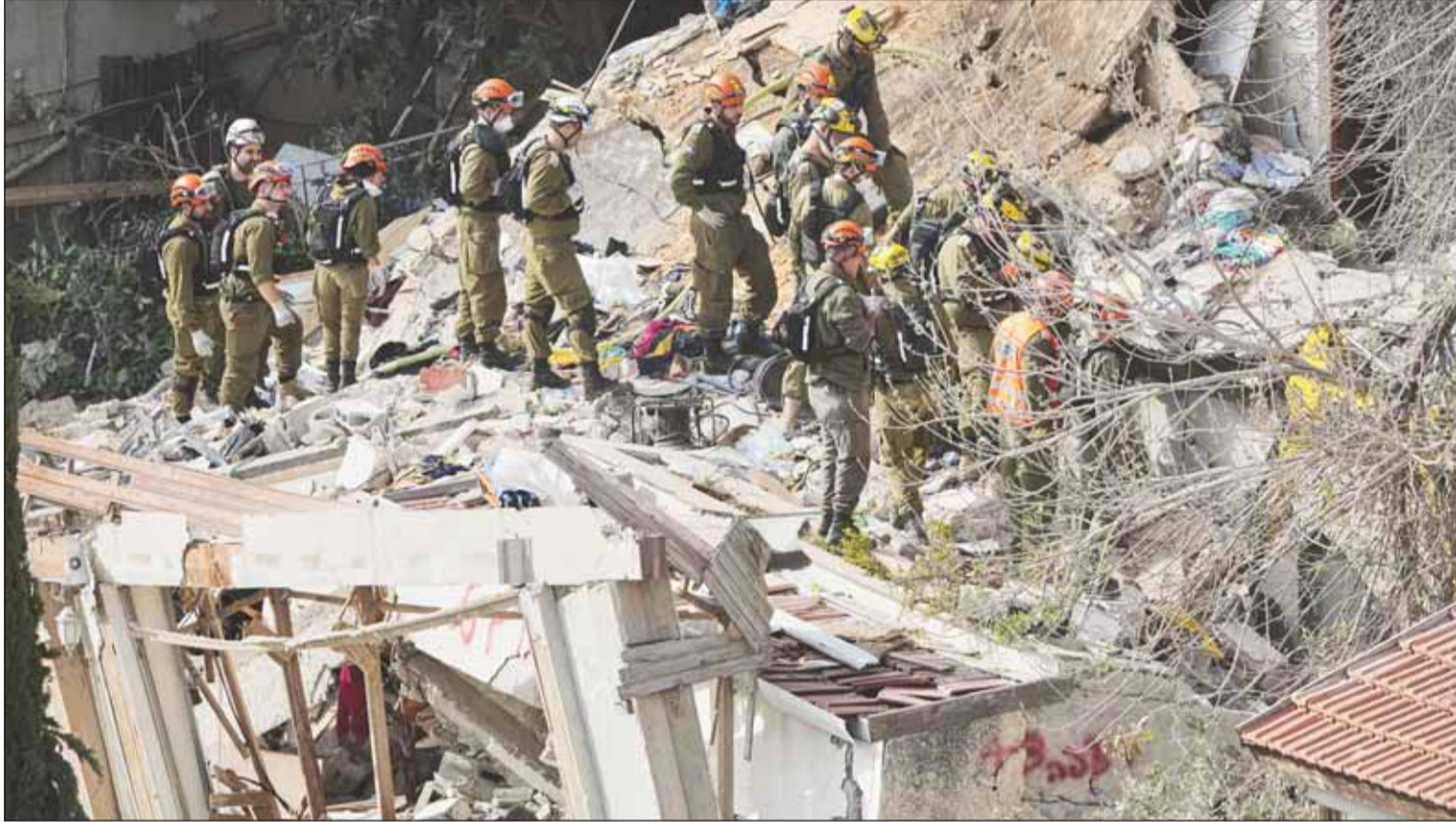
فرق الإنقاذ الإسرائيلية تبحث عن مفقودين بين أنقاض مبنية سكنية دمره صاروخ إيراني في حيفا أمس

الحرب، علينا ألا نشهد حرباً أخرى". وكانت تقارير أكت صباح أمس أن الولايات المتحدة وإيران، وبوساطة باكستان وعدد من الوسطاء الإقليميين، تجريان محادثات