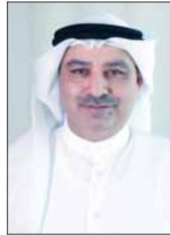
د. بدر البصيري

أكد وكيل وزارة التعليم العالي د. بدر البصيري أن الوزارة تعاملت مع دعايات الأزمة الراهنة منذ لحظاتها الأولى بمنهجية اعترافية قائمة على سرعة الاستجابة ودقة المتابعة، عبر تسخير كوادرها الوطنية لخصر أعداد الطلبة الكويتيين الدارسين في الخارج وداخل البلاد، وتحديد مواقعهم وظروفهم الأكاديمية خلال فترة وجيزة، بما يمكن من بناء قاعدة بيانات دقيقة شكلت أساساً للحرك الفوري ومعالجة التحديات. وأوضح البصيري - في تصريح إلى تلفزيون الكويت أمس - أن اختلاف التقييمات والأنظمة الدراسية بين دول الابعات شكل أحد أبرز التحديات، إذ تتباين مواعيد بدء الفصول الدراسية ومتطلبات الحضور من دولة إلى أخرى، إلا أن الوزارة تتعاون مع الملائق الثقافية، في إدارة هذا التباين بمرونة عالية، من خلال توزيع الجهود بحسب الأقاليم والدول، والتعامل المباشر مع الجامعات عبر قنوات رسمية، لضمان استمرار الطلبة في دراستهم دون انقطاع. وأشار إلى أن الملائق الثقافية لعبت دوراً محورياً في هذه المرحلة، ليس فقط في متابعة الجوانب الأكاديمية، بل أيضاً في نقل الصورة الكاملة عن أوضاع الطلبة للوزارة، والتنسيق مع الجامعات للحصول على استثناءات تتناسب مع الظروف الطارئة، لافتاً إلى أن كثيراً من