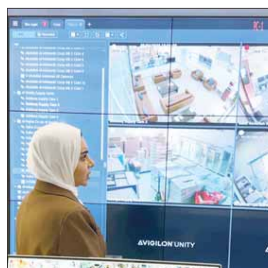
... وخلال تفقدها مركز التحكم لمتابعة جاهزية التعاونيات