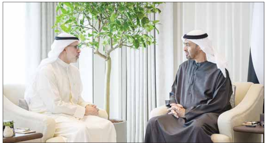
الشيخ محمد بن زايد مستقبلاً وزير الخارجية الشيخ جراح الجابر

بحث رئيس دولة الإمارات العربية المتحدة الشيخ محمد بن زايد آل نهيان، أمس، مع وزير الخارجية الكويتي الشيخ جراح الجابر آخر التطورات التي تشهدها المنطقة في ظل التصعيد العسكري الناتج عن العدوان الإيراني الآثم، وانعكاساته الخطيرة على الأمن والاستقرار إقليمياً ودولياً. وذكرت وزارة الخارجية الكويتية في بيان لها أن ذلك جاء خلال استقبال الشيخ محمد بن زايد آل نهيان للشيخ جراح الصباح بمناسبة زيارته الرسمية إلى دولة الإمارات العربية المتحدة الشقيقة وذلك بحضور نائب رئيس الدولة نائب رئيس مجلس