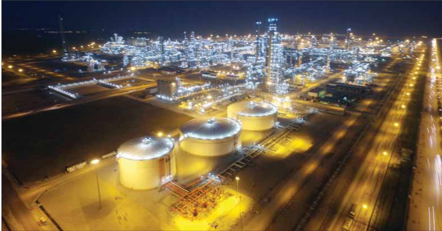
مصفاة نفي سون

وتذكرت التقارير أن مصفاة "نفي سون" استقبلت خلال عام 2025 نحو 45 شحنة من النفط الخام وقامت بجمعها، مشيرة