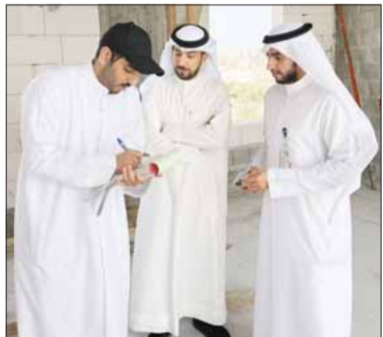
تدقيق البيانات والتأكد من استيفاء الشروط والضوابط

أعلنت بلدية الكويت أمس عن إطلاق حملات تفتيش ميدانية للكشف على أعمال البناء والتشييد في المحافظات الست لتطبيق لائحة البناء والتأكد من مدى الالتزام بأشراطها وضوابطها في كل الاستخدامات السكن الخاص والصناعي والتجاري والزراعي والاستثماري والحرفي. وأكدت البلدية - في بيان صحفي - استمرار العمل الميداني للفرق الرقابية طوال الشهر الجاري بجهود كوادرنا الوطنية، موضحة أن أول حملة قامت بها إدارة التدقيق والمتابعة الهندسية بمحافظة الاممدي أمس أسفرت عن تحرير 3 مغلقات وتوجيه 15 إنذاراً للسكن الخاص لانظمة البناء واستغلال مساحة بمنطقة الرقة. وأشارت إلى أن الفريق الرقابي المختص قام بالكشف الميداني على عدد من المناطق وأماكن المخالفات المرصودة واتخاذ الإجراءات اللازمة، مشددة على أن الحملة الأولى ستتبعها عدت جولات ميدانية في جميع المحافظات حسب جدول زمني متضمناً مواعيد الحملات الميدانية الذي أعد من قبل فريق إدارة العلاقات العامة بالتنسيق مع الإدارات المعنية لتنفيذ هذه الحملات طوال الاسابيع المقبلة.