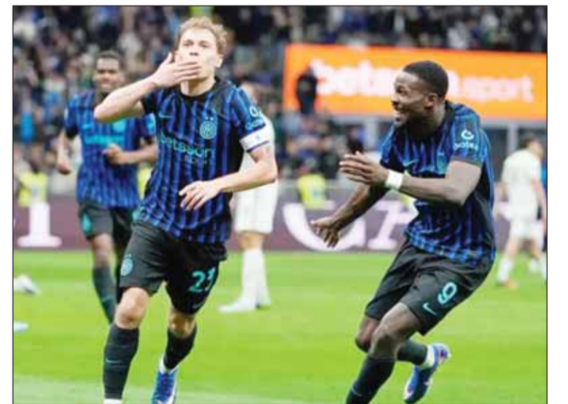
الإنتر يقسو على روما بخماسية في الكالتشيو

اكتسح إنتر ميلان ضيفه روما 2-5، أول من أمس، ضمن منافسات الجولة 31 من الدوري الإيطالي لكرة القدم، ليتقدم خطوة جديدة من الفوز باللقب. ورفع إنتر ميلان رصيده إلى 72 نقطة في المركز الأول، بفارق تسع نقاط عن ميلان صاحب المركز الثاني، والذي لعب مع نابولي، صاحب المركز الثالث أمس، فيما تجدد رصيد روما عند 54 نقطة في المركز السادس. وتقدم إنتر ميلان منذ الدقيقة الأولى عن طريق لواترو مارتينيز، ثم أدرك روما التعادل في الدقيقة 40 عن طريق جيانلوكا مانسيني. وفي الدقيقة الثانية من الوقت بدل الضائع للشوط الأول، سجل هاكان شالهان أوغلو الهدف الثاني لفريق إنتر ميلان من تسديدة قوية من مسافة بعيدة، ثم عاد لواترو مارتينيز ليسجل الهدف الثالث لإنتر ميلان في الدقيقة 52. وبعد ذلك بثلاث دقائق سجل ماركوس تورام الهدف الرابع، ثم افتتح نيكولو باربلا الخماسية في الدقيقة 63، بينما سجل لورينزو بيلغريني الهدف الثاني لروما في الدقيقة 70. وجاء هدف التركي هاكان تشارهانوغلو نجم وسط إنتر ميلان، صاروخياً في شبك روما، على ملعب جوزيبي مياتزا. وشارك تشارهانوغلو في فوز "النيرازوري" العريض أمام روما (2-5)، يتسجله الهدف الثاني، وصناعة الهدف الرابع لزميله ماركوس تورام، قبل أن يتم استبداله في الدقيقة 67 لصالح بيتار سوسيتش. وجاء هدف النجم التركي من مسافة بعيدة جداً، حيث أطلق صاروخاً لا يصد ولا يرد، فشل ميل سيفلار حارس روما في التعامل معه، لتسكن الكرة الشباك. وانضم تشارهانوغلو لصفوف إنتر ميلان عام 2021 قادماً من الغريم ميلان، وشارك في 208 مباريات، وأمرز 47 هدفاً مع 36 تمريرة حاسمة.