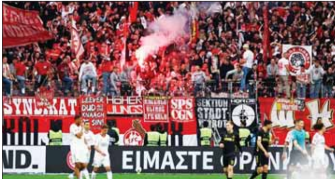
أعمال الشغب بالدرجة الثانية للدوري الألماني

وقالت الشرطة، دخل الضباط الميدانيون بعد ذلك إلى المنطقة الداخلية للملعب وفضلوا بين المجموعتين وتم تأمين الملعب لاحقا من قبل الشرطة. واضطرت المباراة للتوقف لمدة 20 دقيقة تقريبا.