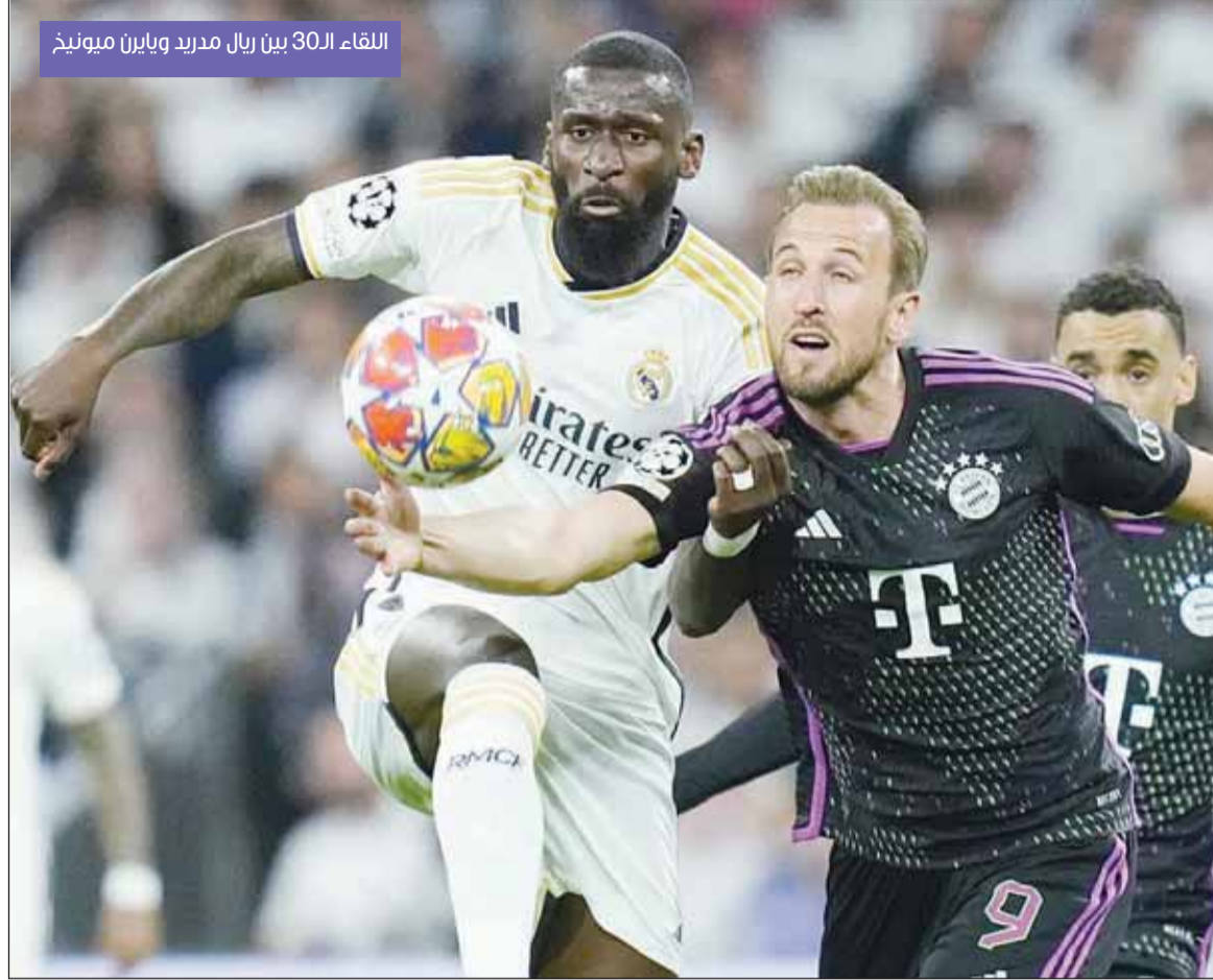
اللقاء الـ 30 بين ريال مدريد وبايرن ميونخ

يستعد ملعب سانتياغو برنابيو اليوم، لاستقبال قمة مرتقبة تجمع بين ريال مدريد وبايرن ميونخ، في ذهاب ربع نهائي دوري أبطال أوروبا لموسم 2025-2026. ويلتقي اليوم أيضا أرسنال مع لشبونة. وصل بايرن ميونخ إلى هذا الدور بعد أن أطاح بفريق أتالنتا في ثمن النهائي، بينما تأهل ريال مدريد عقب فوزه على مانشستر سيتي في الدور ذاته. وتعد هذه المواجهة رقم 29 في تاريخ لقاءات الفريقين، وهو الرقم الأعلى لأي مواجهة ثنائية في تاريخ المسابقة القارية، حيث يطلق عليها المتابعون لقب "كلاسيكو أوروبا" نظراً للتاريخ الحافل والقيمة الفنية الكبيرة لكلا الناديين. وتشير الإحصائيات إلى أن ريال مدريد نجح في التعويض باللقب في آخر أربع مرات تمكن فيها من إقصاء بايرن ميونخ من البطولة. ويبدل ريال مدريد، صاحب الرقم القياسي في عدد مرات الفوز باللقب القاري برصيد 15 لقبا، المباراة وسط ظروف فنية متذبذبة هذا الموسم، حيث شهدت أروقة النادي إقالة المدرب تشابي ألونسو وتعيين ألفريد أربيلوا بدلا منه. ويأتي الفريق الإسباني من خسارة محلية أمام ريال مايوركا بنتيجة 2-1، مما أدى إلى اتساع الفارق خلف المتصدر برشلونة إلى سبع نقاط في الدوري الإسباني، وهو ما قد يدفع النادي العاصمة لتركيز جهوده بشكل كامل على بطولته المقبلة. على الجانب الآخر، يصل بايرن ميونخ إلى مدريد بصفته