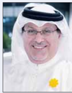
السفير صلاح المهلكي

رجال الصقوف الأمامية، وقال: "اللهم إن في الصقوف الأمامية رجالاً صدقوا ما عاهدوا الله عليه، وعينا ساهرة على حماية أمن وأوطاننا، اللهم مدهم بعونك وقوتك وتوفيقك، واحفظهم بعينك التي لا تنام، وسدد رميهم، وادخر عودنا، وانصرنا نصراً عزيزاً".