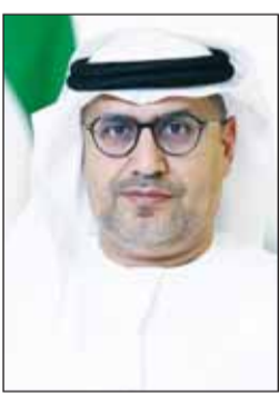
سفير الإمارات د. مطر النايدي

وفي ختام تصريحه، قال السفير الإماراتي: "نحن على يقين بأننا سنهزم العدوان الإيراني الغاشم، وسنحتفل قريباً بنصرنا"، داعياً المهولي - سبحانه - أن يحفظ الإمارات والكويت وكل دول الخليج من كل شر ومكروه.