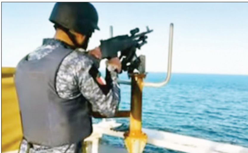
خفر السواحل جهوزية وهمة عالية

سواء للمخدرات أو الأسلحة أو غيرها، مؤكداً أن جهودهم الكبيرة تعكس مستوى عالياً من الجاهزية والانتباه. وأضاف أن منتسبي خفر السواحل يعملون بالهمة والالتزام التي تتميز بها مختلف القطاعات الأمنية في وزارة الدفاع، ويتقنات متقدمة في أداء مهامهم بما