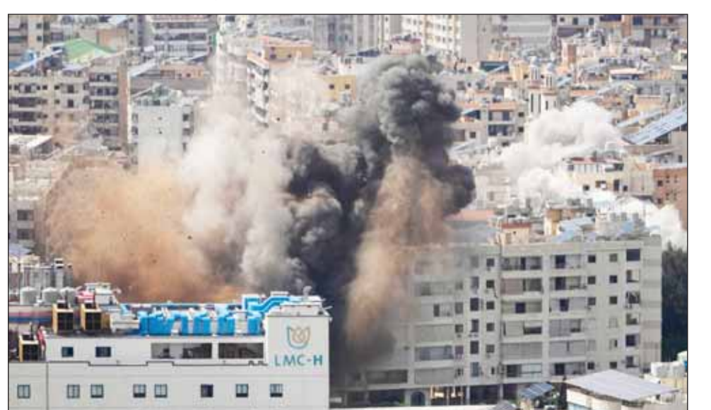
الذخاّن يتصاعد فمّ أحد أحياء بيروت جراء الغارات الإسرائيلية

رغم الضبابية التي طبعته وطغت على تفاصيله، تنفس العالم والمنطقة الصعداء فجر أمس مع إعلان الرئيس الأميركي دونالد ترامب عن وقف إطلاق النار لمدة أسبوعين في الحرب الدائرة مع إيران منذ 28 فبراير الماضي، يتخللها مفاوضات بين الجانبين للتوصل إلى اتفاق شامل للسلام. وفي خطوة متوقعة، تشكل أول اختبار للاتفاق، شنت إسرائيل أمس نحو 115 غارة على لبنان، ضمن عملية "الظلام الأبدي" التي استهدفت أمياء عدة في العاصمة اللبنانية، فضلاً عن ضاحيتها الجنوبية، معقل "حزب الله"، ما أدى إلى سقوط 254 قتيلًا و1165 جريحاً، بحسب ما أفاد جهاز الدفاع المدني اللبناني. التتمة 13