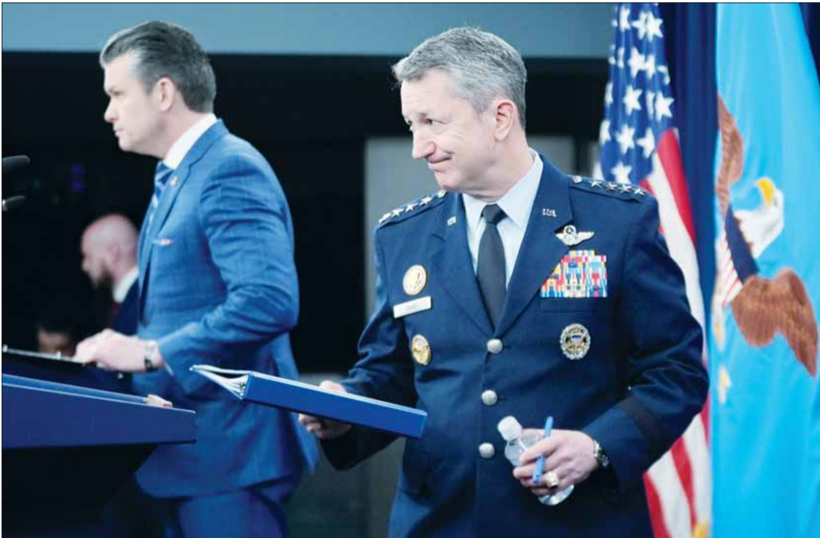
وزير الحرب الأميركي بيت هيغسيت ورئيس هيئة الأركان المشتركة دان كين يتحدثان عن الهدنة مع إيران في مؤتمر صحافي في "البنغاون" بواشنطن أمس

وفي دولة الاحتلال الإسرائيلي، أعرب رئيس وزراء الاحتلال بنيامين نتانياهو صباح أمس، عن دعم قرار الرئيس الأميركي بتعليق الهجمات على إيران، لكنه نفى شمول وقف إطلاق النار للبنان، وقال في بيان "تدعم إسرائيل جهود الولايات المتحدة لضمان ألا تمتلك إيران أسلحة نووية، ولا تشكل تهديداً لأميركا أو إسرائيل أو دول الخليج أو العالم"، لكنه نفى أن يكون وقف إطلاق النار الموقت يشمل لبنان، في وقت تتمسك فيه طهران بأن يشمل أي اتفاق لوقف الحرب، لكن التصريح الإسرائيلي يأتي خلافاً لما أعلنه رئيس الوزراء الباكستاني شهباز شريف بأن إيران والولايات المتحدة اتفقتا على وقف فوري لإطلاق النار في كل مكان بما في ذلك لبنان وسبيداً سريانه فوراً، داعياً وفدي الولايات المتحدة وإيران إلى جولة من المحادثات في إسلام آباد غداً، معلناً وفي وقت لاحق من صباح أمس أن إسلام آباد مستقبلاً وفوداً من الولايات المتحدة وإيران لإجراء محادثات تهدف إلى التوصل إلى اتفاق نهائي، وقال على منصفته "إكس"، "يسعدني أن أعلن أن إيران والولايات المتحدة والجهات المتحالفة معها اتفقت على وقف فوري لإطلاق النار في كل مكان، ومن ضمن ذلك لبنان وأماكن أخرى، بأثر فوري"، مضيفاً "أرحب بحرارة بالمبادرة الحكيمية وأقدم بخالص الشكر والتقدير لقيادة البلدين"، متابعا "أظهر الطرفان حكمة وتفهماً لافتين وبقيا منفترطين بشكل بناء في تعزيز قضية السلام والاستقرار، ونأمل مخلصين أن تنتج محادثات إسلام آباد في تحقيق سلام مستدام وتنتقل لمشاركة المزيد من الأخبار السارة في الأيام المقبلة".