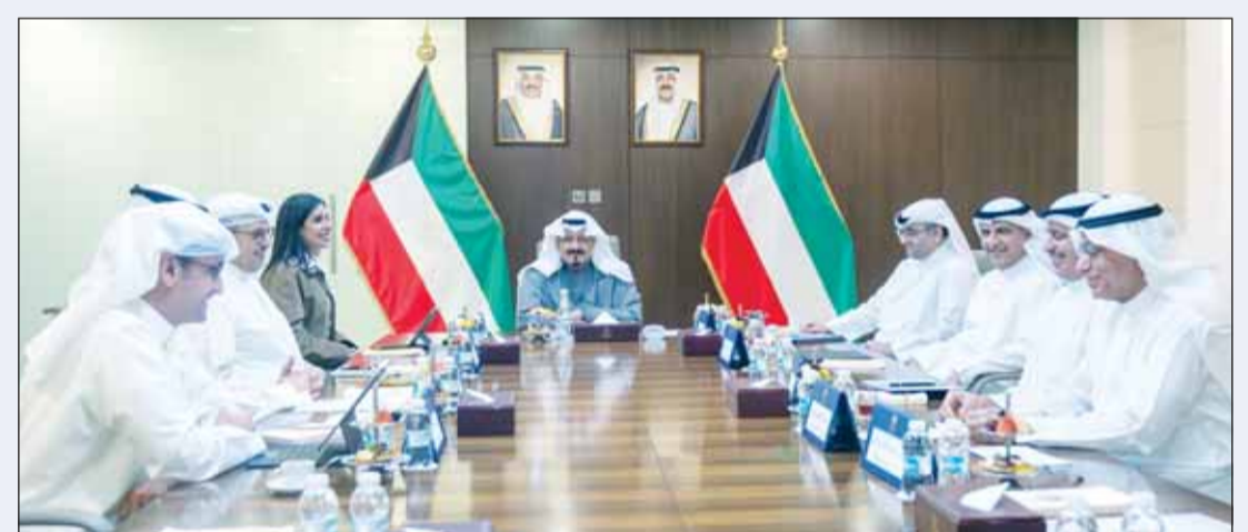
سمو رئيس مجلس الوزراء الشيخ أحمد العبدالله مترأساً الاجتماع

ترأس سمو رئيس مجلس الوزراء الشيخ أحمد العبدالله اجتماعاً، لبحث سبل تعزيز البنية التحتية واللوجستية ومتابعة إجراءات حصر وتصنيف الأراضي واستغلالها لإقامة مخازن استراتيجية تسهم في تعزيز قدرات الدولة في إدارة الإمدادات ورفع كفاءة التخزين لتلبية للاحتياجات المستقبلية لمختلف قطاعات الدولة الحيوية على أن تقدم تقارير دورية بشأن استكمال الإجراءات في المستقبل. حضر الاجتماع وزير الأشغال العامة الدكتور نورة المشعان، ووزير الدولة لشؤون البلدية ووزير الدولة لشؤون الإسكان