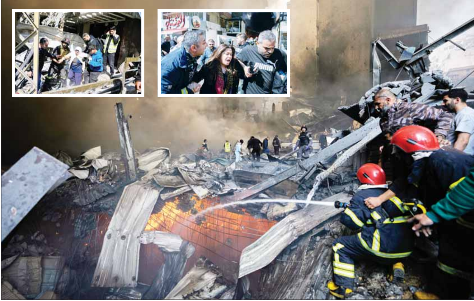
مشاهد الدمار عمّت لبنان في يوم دام، شهد مجازر إسرائيلية مروعة وأعنف قصف على بيروت والضاحية والبقاع ومناطق لبنانية عدة