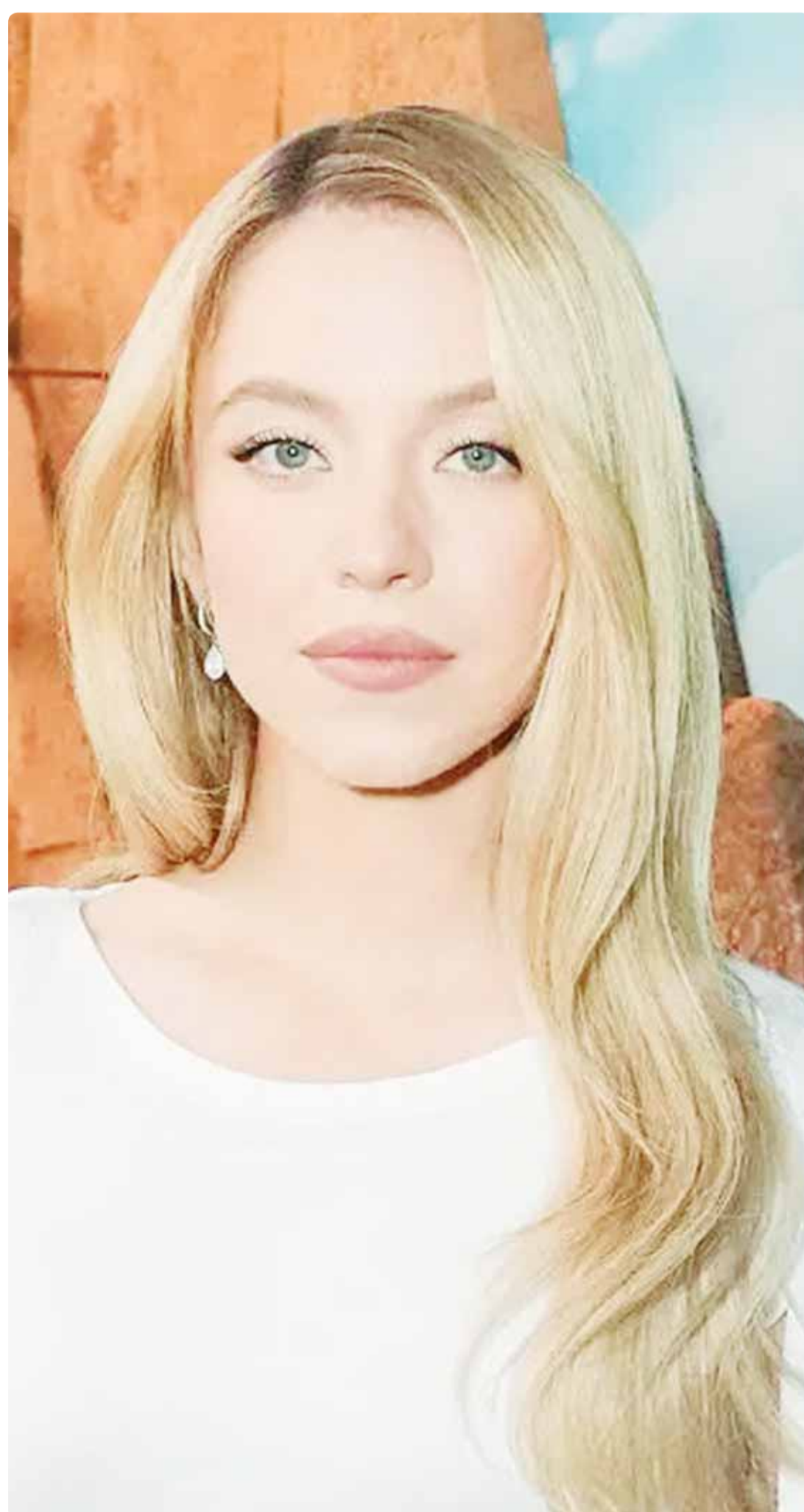
الممثلة الأميركية سيدني سويني خلال حضورها العرض الأول لمسلسل "يوفوريا" في لوس أنجلوس