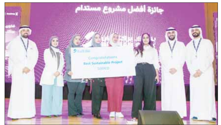
جائزة أفضل مشروع مستدام

واصل البنك نجاحاته في مجالي التنوع والتكامل لعام 2025، حيث حقق تقدماً في دعم المساواة بين الجنسين من خلال مبادرات مخصصة، مثل X Academy و Lean-In-Circles وبرامج Coded وتحديات الابتكار. كما كرّس جهوده في تعزيز تجربة عملائه من خلال الاستثمار المستمر في التكنولوجيا الرقمية، وتطبيق سياسات قوية لحماية العملاء والممارسات المصرفية الشفافة. ومن جانب آخر، استمرت حملة التوعية المالية "لنكن على دراية" في نشر الوعي المالي. وأثمرت مبادرات البنك في المسؤولية المجتمعية عن إبداعات تأثير واسع النطاق شمل قطاعات الصحة والثقافة وتمكين الشباب.