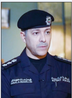
العقيد فيصل الديحاني

أوضح مدير إدارة العلاقات العامة في وزارة الدفاع العقيد فيصل الديحاني، أصحاب الأسلحة المرخصة يمكنهم تجديد تراخيصهم عبر قطاع الأمن الجنائي وفق الإجراءات القانونية المعمدة، مشيداً بتجاوب المواطنين في تسليم الأسلحة خلال المهلة التي حددتها الوزارة، دعماً للأمن العام وحماية المجتمع. وأكد الديحاني أن الوزارة تواصل تنفيذ جهود متكاملة لمواجهة التحديات الأمنية في ظل الاعتداءات الإيرانية الأثمة، وذلك عبر منظومة عمل شاملة تستند إلى خطط طوارئ مدروسة وإجراءات أمنية دقيقة. وقال الديحاني، في تصريح لتلفزيون الكويت، أن الوزارة تعتمد على خطة طوارئ متكاملة تنفذ وفق منظومة أمنية متناسقة، تضمن سرعة الاستجابة.