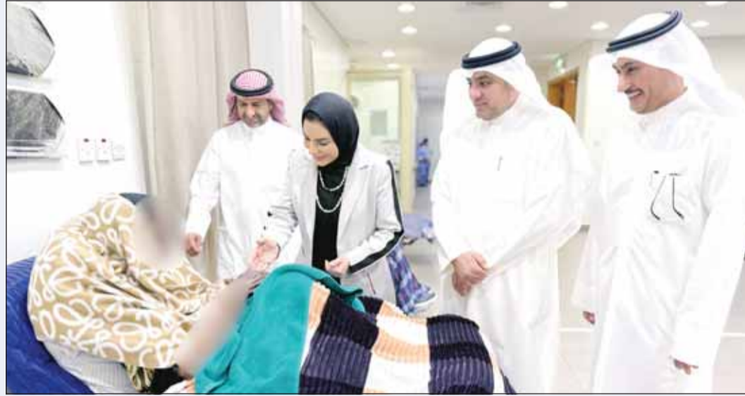
الوزيرة د. أمثال الحويلة خلال الجولة

وأضاف أن الوزارة ستعلن نتائج المتقدمين متضمنة درجة الاختبار الإلكتروني ودرجة المقابلة الشخصية والمجموع النهائي، عبر الموقع الإلكتروني الرسمي ومنصاتها على وسائل التواصل الاجتماعي فور اعتمادها، تعزيزاً لمبدأ الشفافية.