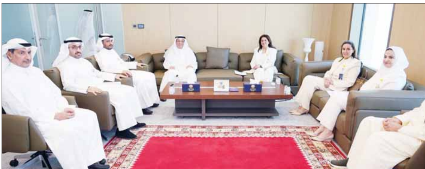
رئيس "نزاهة" د. رنا الفارس وأعضاء الهيئة قبل تقديمهم إقرارات الذمة المالية

وشددت على أهمية التكامل والتنسيق بين الجهات الرقابية والقضائية في دولة الكويت، لما لذلك من دور محوري في حماية المال العام وترسيخ سيادة القانون، مؤكدة مواصلة الهيئة أداء دورها الرقابي والتوعوي بكفاءة ووفق الأطر القانونية المعمدة. وذكرت "الهيئة" في بيان لها أن هذا الإجراء يأتي ضمن جهودها المستمرة لتعزيز ثقافة الإفصاح والشفافية، وترسيخ مبادئ النزاهة في العمل العام، بما ينسجم مع التوجهات الوطنية والالتزامات الدولية لدولة الكويت في مجال مكافحة الفساد. وأضافت أن هذه الخطوة تجسد التزام قيادة الهيئة وأعضائها بأحكام القانون رقم (2) لسنة 2016 بشأن إنشاء الهيئة العامة لمكافحة الفساد ولائحته التنفيذية، لا سيما ما يتعلق بمتطلبات الإفصاح عن الذمة المالية، بما يعكس أعلى معايير الامتثال والموكمة الرشيدة.