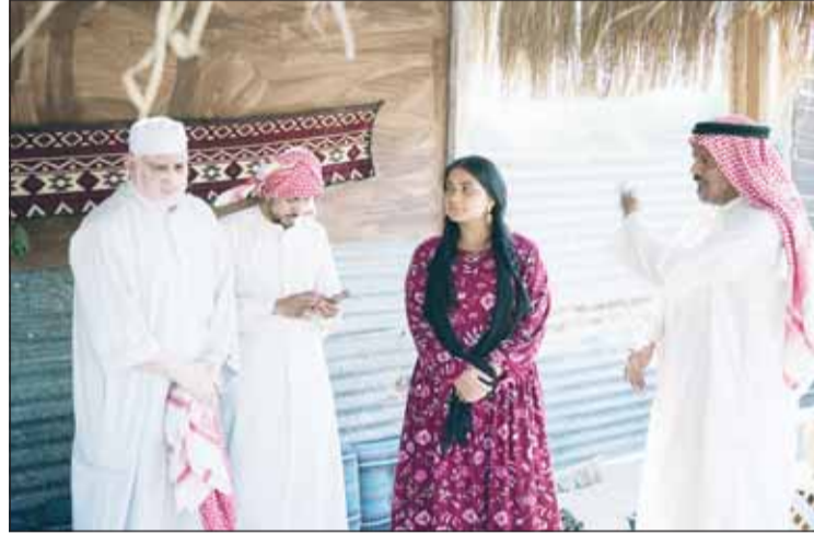
من دراما رمضان مسلسل "سوم الغيظ"