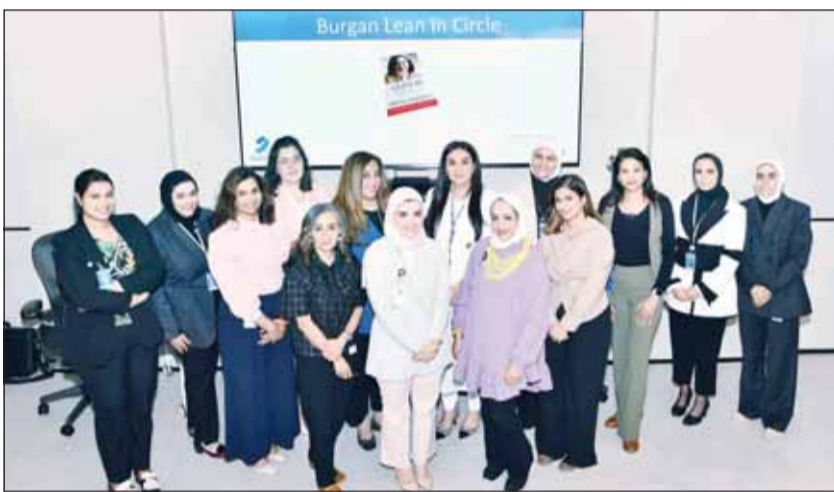
فريق البنك في إحدى ورش العمل