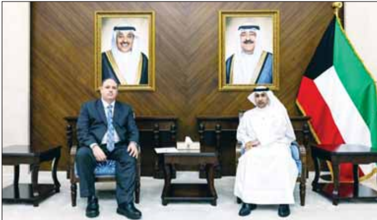
السفير عزيز الديحاني لدى تسليمه القائم بأعمال العراق زيد شنشول مذكرة احتجاج لحماية مصالحها وبعثاتها الدبلوماسية وفقاً للقانون الدولي.

وفي اول رد فعل رسمي عراقي، أعربت وزارة الخارجية العراقية عن إدانتها واستنكارها الشديدتين للاعتداء. وذكرت الخارجية العراقية في بيان لها أن الحكومة العراقية - ممثلة بوزارة الداخلية - شكلت لجنة تحقيق للوقوف على ملابسات الحادث والتحقيق في الأمدات التي رافقت الاعتداء واتخاذ الإجراءات القانونية اللازمة بحق المتورطين بما يضمن عدم تكرار مثل هذه الافعال مستقبلاً.