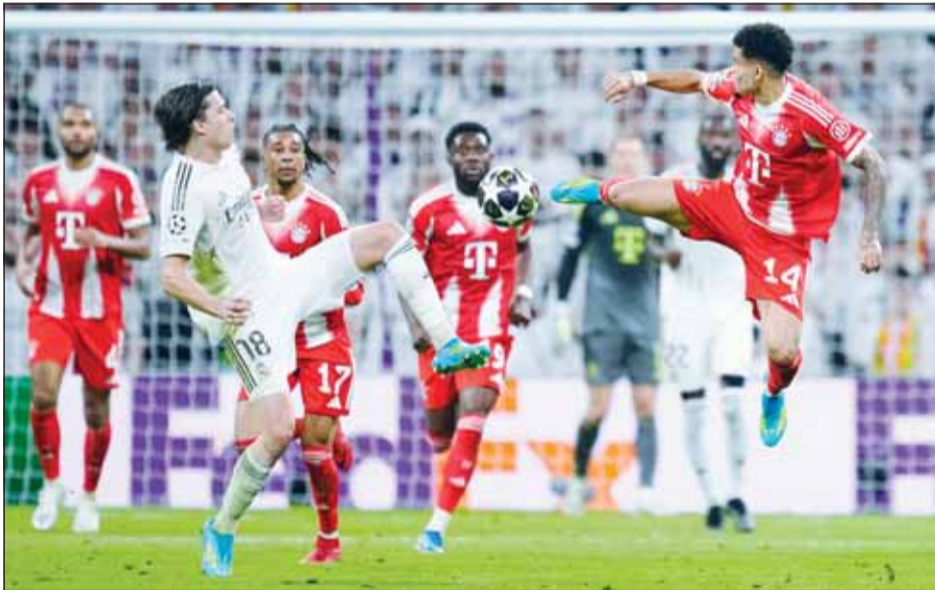
العلاق البافاريه كسر عقدة الميرنغخي وتغلب عليه

بعد 14 عاماً، كسر بايرن ميونخ عقدة ريال مدريد، وهزمه بنتيجة 2 - 1، أول من أمس، في ذهاب دور الثمانية لدوري أبطال أوروبا لكرة القدم. وانتزع بايرن ميونخ أول فوز على الريال منذ حوالي 14 عاماً، عندما فاز البافاري بفحص النتيجة 2 - 1 في ذهاب قبل نهائي دوري أبطال أوروبا موسم 2011-2012. وسيطر بايرن ميونخ على المباراة التي أقيمت في ملعب سانتياغو برنابيو، وسجل فريق المدرب فينس كوهباني هدفاً قبل نهاية الشوط الأول مباشرة عندما أرسل سيرج غنابري تمريرة متقنة إلى لويس دياز، الذي تغلب على مصيدة التسلسل وسدد كرة منخفضة تجاوزت الحارس أندري لونيون في الدقيقة 41.