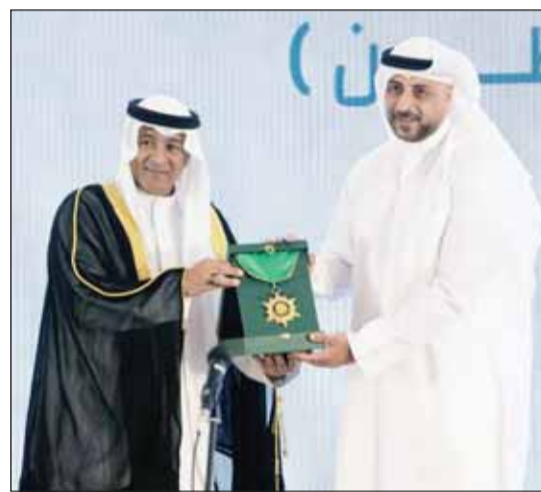
خلال تكريم البنك في إحدى المناسبات