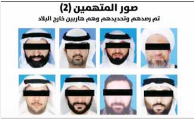
المتهمون الهاربون خارج البلاد

استخدام شركات وواجهات مهنية لتمير الأموال ضبط مبالغ مالية كبيرة بحوزة المتهمين "الداخلية": لا تهاون مع أي تهديد لأمن الوطن نقل الأموال جواً وبراً بطرق معقدة لتفادي الاشتباه