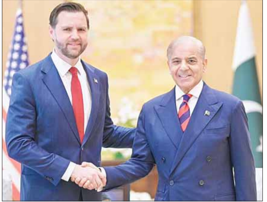
رئيس الوزراء الباكستاني شهباز شريف مستقبلاً نائب الرئيس الأميركي جيه دي فانس أمس

المحادثات يوماً إضافياً. من جانبها، نقلت وكالة أنباء "الأناسول" التركية عن مصادر باكستانية أن المحادثات بدأت عبر وساطة باكستانية، مضيفة أن الطرفين عقدا لقاءات منفصلة مع المسؤولين الباكستانيين في أحد فنادق إسلام آباد بهدف حل القضايا العالقة قبل بدء المحادثات المباشرة بينهما، كما ذكر مكتب رئيس الوزراء الباكستاني أن المحادثات انطلقت بلقاءات تمهيدية رفيعة المستوى يقبض سيرينا في المنطقة الحمراء بالعاصمة الباكستانية، حيث عقد رئيس الوزراء