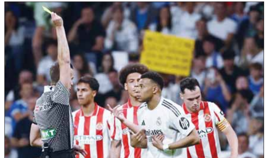
تعادل بطعم الخسارة لريال مدريد

تلقت آمال ريال مدريد بالفوز بلقب الدوري الإسباني ضربة جديدة، بتعادله بهدف نظيف مع ضيفه جيرونا أول من أمس. وبعد التعادل مع جيرونا، الذي يحتل مركزاً في وسط جدول الليفان، تمتد سلسلة غياب صاحب الأرض عن الانتصارات إلى 3 مباريات متتالية في كافة المسابقات.