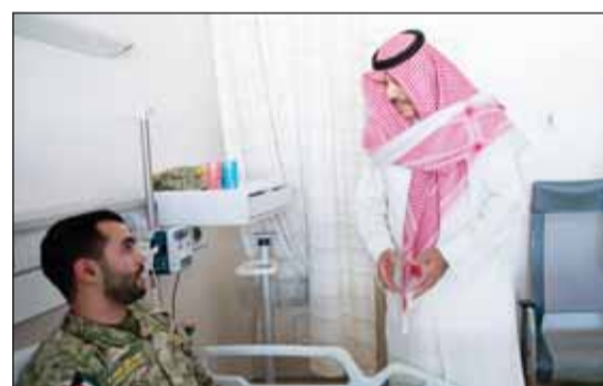
نائب رئيس الحرس الوطني الشيخ فيصل النواف لادم زيارته أحد المصابين