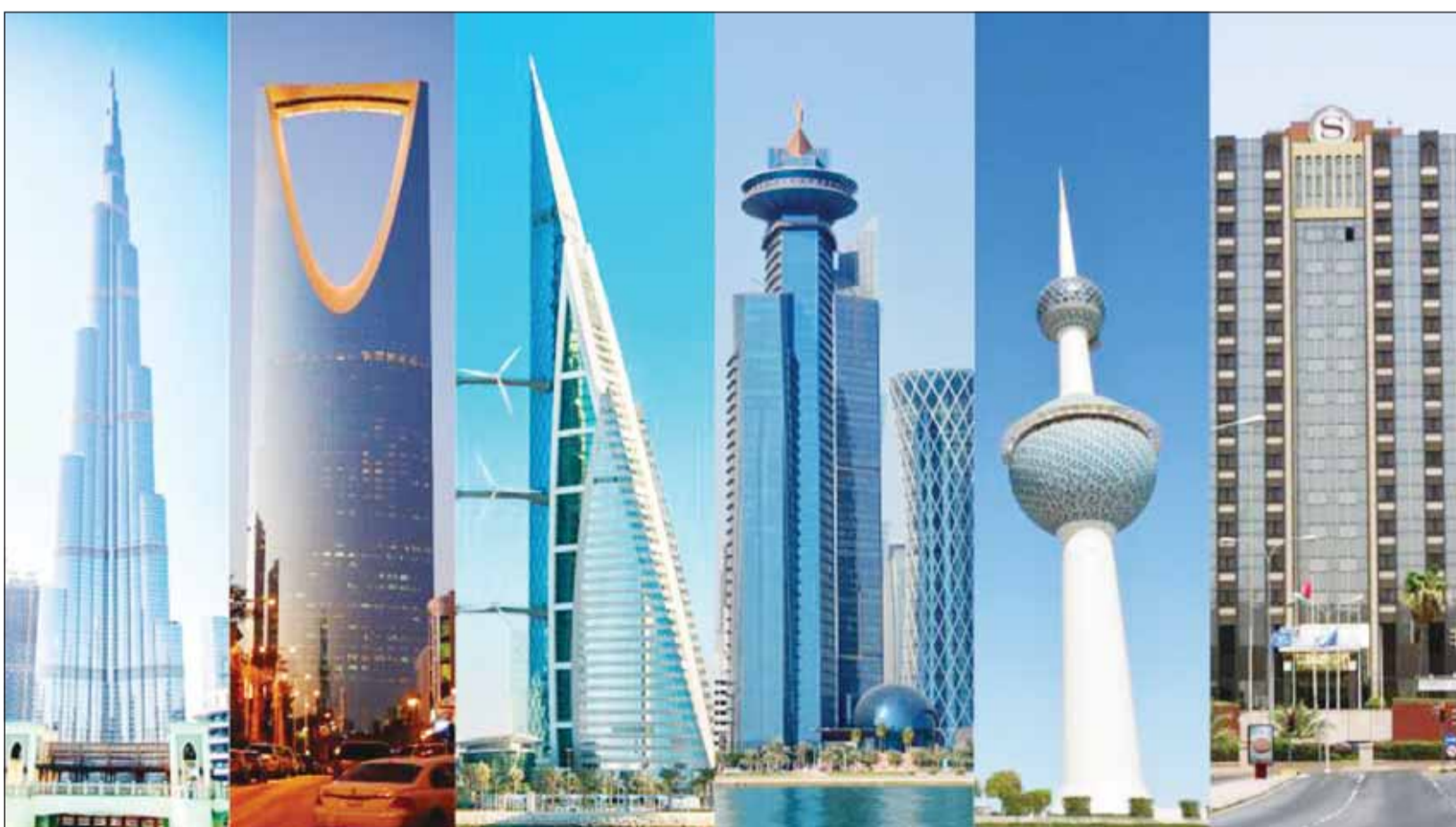
قوة خليجية موحدة لحماية الشعوب والمقدرات

قال تقرير شركة الشان للاستشارات الاقتصادية إنه بعد حرب مدمرة استغرقت 40 يوماً، تعطلت معها إمدادات لسلع مثل النفط والغاز والأسمدة، وهددت اقتصاد العالم بولوح حقيبة من الركود التضخمي، توصلت أطرافها إلى اتفاق لوقف نصف هش، وقصير الأمد لوقف إطلاق النار، ما يرحح خطأ المسابقات من جديد والعودة إلى الحرب، مطالبات أطرافها حالياً، هي نفس المطالبات التي أعلن وزير الخارجية العماني.