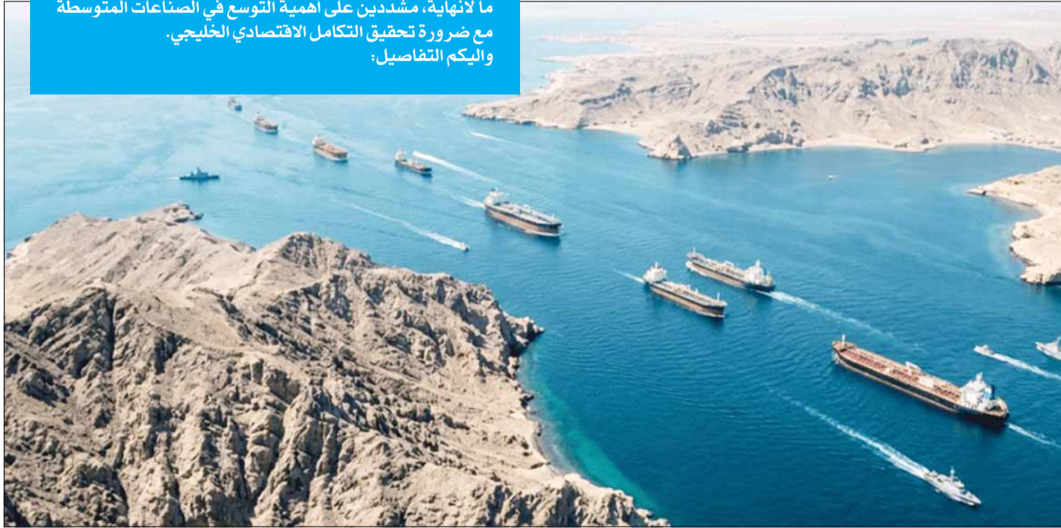
بدائل مضيق هرمز

إلى متى يظل النفط الكويتي تحت رحمة مضيق هرمز؟ وكما تكبد القطاع النفطي خسائر جراء إعلان الشؤفة القاهرة وتوقف تصدير النفط الكويتي؟ وأيها أفضل لتغطية عجز الميزانية بعد تراجع الإيرادات النفطية هل السحب من احتياطي الأجيال أم الاتجاه للدين العام؟ هذه الأسئلة وغيرها أجاب عنها لـ "السياسة" خبيران في الاقتصاد المحلي والخليجي، حيث أكدوا على ضرورة تنوع مصادر الدخل حتى لا يظل اقتصاد الكويت تحت سيطرة الإيرادات النفطية إلى ما لا نهاية، مشددين على أهمية التوسع في الصناعات المتوسطة مع ضرورة تحقيق التكامل الاقتصادي الخليجي. واليك التفاصيل: