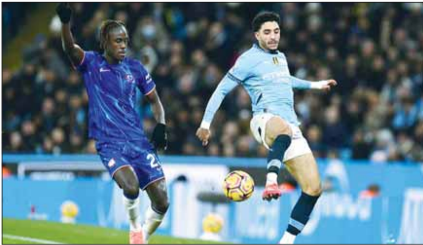
مواجهة قوية اليوم بين السيتيزن وتشيلسي

يستضيف ملعب ستامفورد بريدج اليوم، مواجهة قوية ومثيرة تجمع بين تشيلسي ومانشستر سيتي، وذلك ضمن منافسات الجولة الثانية والثلاثين من الدوري الإنكليزي الممتاز لموسم 2025-2026. ويدخل مانشستر سيتي اللقاء وهو يحتل المركز الثاني في جدول الترتيب برصيد 61 نقطة، سعياً لمواصلة الضغط على متصدر المسابقة والمنافسة بقوة على اللقب. في المقابل، يحتل تشيلسي المركز السادس برصيد 48 نقطة، ويطمح لتحقيق نتيجة إيجابية تعزز حظوظه في التقدم نحو المراكز الموهلة للمسابقات الأوروبية. من جانبه، يعتقد بيبي غوارديولا، مدرب مانشستر سيتي، إنه يتعين على فريقه حالياً أن يفوز بكل المباريات ليكون لديه فرصة للتفوق على أرسنال والتتويج بلقب الدوري.