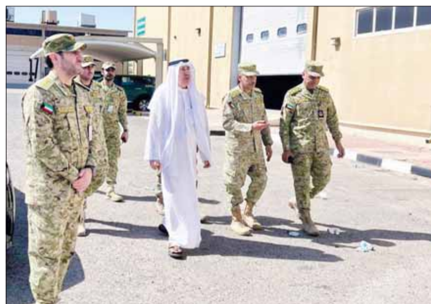
رئيس الحرس الوطني الشيخ مبارك المحمود يتفقد موقعاً تعرض للاستهداف بطائرات مسيرة

كما عبّرت المملكة عن "تضامنها مع دولة الكويت الشقيقة حكومة وشعباً"، مجددة "دعمها الكامل لكل ما تتخذه الكويت من إجراءات تحفظ سيادة وأمن واستقرار الكويت وشعبها الشقيق".