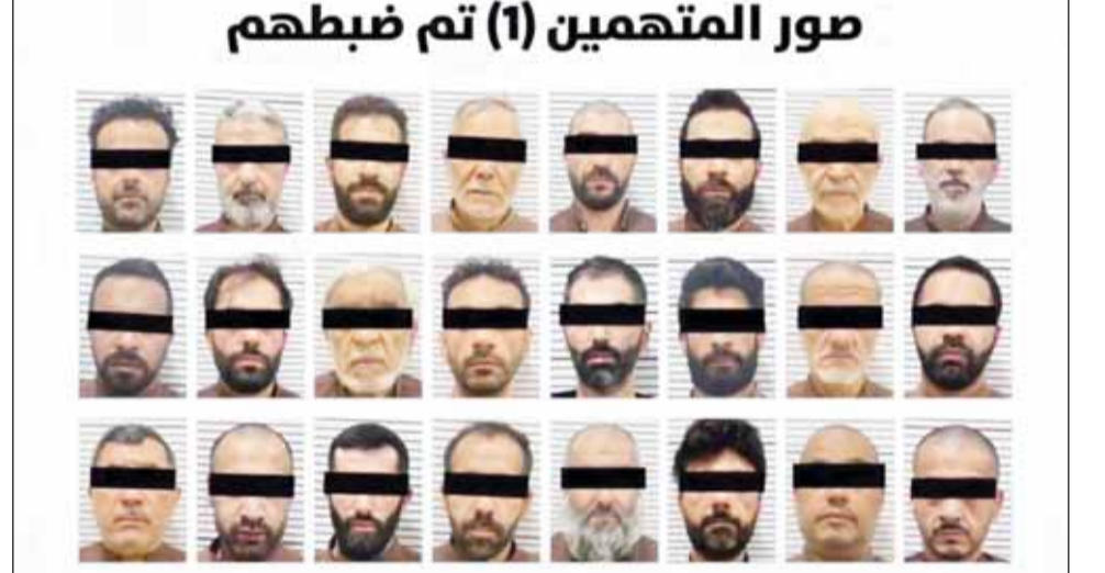
أعضاء الشبكة 24