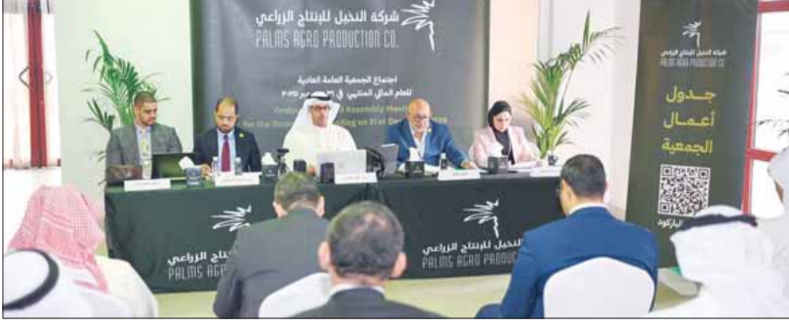
جانب من "عمومية" النخيل

الوطنية في مواجهة المتغيرات الإقليمية تمثل جزءاً من صلاية الدولة نفسها، لافتاً إلى أن شركة النخيل للإنتاج الزراعي في مساهمتها في المشاريع البيئية والتشجير ليست فقط جزءاً من نشاطنا التشغيلي، بل تمثل التزاماً وطنياً تجاه مستقبل الكويت، ودعماً عملياً لجهود الدولة في تحقيق الاستدامة البيئية وتعزيز جودة الحياة للأجيال القادمة".