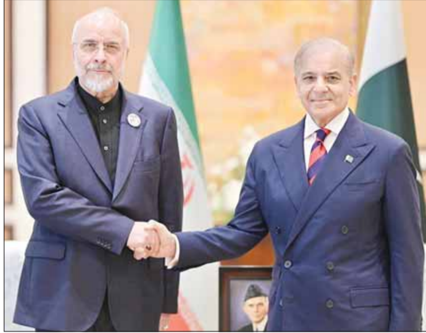
... ومستقبلاً رئيس وفد إيران المفاوض رئيس البرلمان الإيراني محمد باقر قاليباف (أب)

واشنطن، عواصم - وكالات. بالتزامن مع إعلان الرئيس الأميركي دونالد ترامب بدء بلاده فتح مضيق هرمز، وانطلاق المحادثات الثلاثية الأميركية الإيرانية الباكستانية في إسلام آباد عصر أمس، كشف مسؤول أميركي أن سفناً تابعة للبحرية الأميركية عده عبرت مضيق هرمز في خطوة لم يتم تنسيقها مع إيران، وهي المرة الأولى التي خضت فيها ذلك منذ بداية الحرب التي فتحت في 28 فبراير الماضي، ونقل موقع "أكسيوس" عن المصدر القول إن المدمرات الأميركية عبرت "هرمز" دخولا وفروجا لإثبات حرية الملاحة في المياه الدولية، مؤكداً أن السفن لم تتلق أي تحذير إيراني أثناء عبورها. وبينما أكد الرئيس الأميركي دونالد ترامب أن المضيق سيفتح قريباً جداً أمام حركة الملاحة، قائلًا على منصة "إكس" إن بلاده ستعمل قريباً على تطهير الممر الملاحي، مضيفاً أن خطر الأفعاب الإيرانية التي زرعت في الممر سيؤول قريباً، قائلًا: "بدأنا عملية تطهير مضيق هرمز، خدمة لدول العالم كافة، بما في ذلك الصين واليابان وكوريا الجنوبية وفرنسا وألمانيا وغيرها، ومن المدهش أنهم لا يملكون الشجاعة أو الإرادة للقيام بهذا العمل بأنفسهم". وفق تعبيره، كشفت صحيفة "نيويورك تايمز" الأميركية أن عدم عبور إيران على جميع الأفعاب التي زرعتها في مضيق هرمز حال دون إعادة فتحه بشكل كامل.