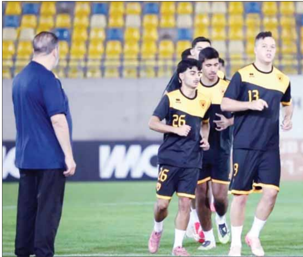
معلول طلب مباراة ودية واحدة فقط فبه قطر

التي اقيمت الأربعاء الماضي. ويجري الجهاز الإداري لفريق الكويت جهوداً للتخفيف لإقامة مباراة ودية ثانية قبل المغادرة إلى قرغيزستان بعد غد الثلاثاء، يضع من خلالها الجهاز الفني "المسائه الأخيرة" على التشكيلة التي ستخوض لقاء الشباب.