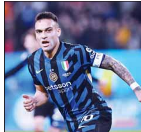
الأرجنتيني لوتارو مارتينيز

يعتقب عشاق الكرة الإيطالية، مواجهة قوية بين إنتر ومضيفه كومانو اليوم، على ملعب "جوزيبي سينجياليا"، ضمن منافسات الجولة 32 من الدوري الإيطالي 2025-2026. ويلتقي اليوم أيضاً، جنوى مع ساسولو، وبارما مع نابولي، وبولونيا مع ليتشي.