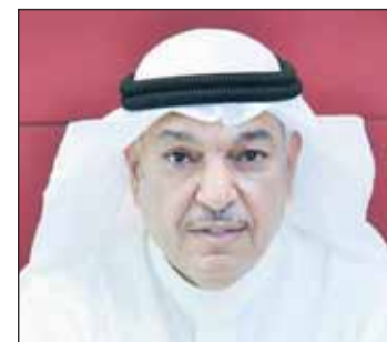
السفير صقر الغانم

أو الكويت، موضحاً أن من ينجر إلى مثل هذه الأمور يخاصب قضائياً في البلدين. ولفت إلى أنه لا يمكن أن تتعرض العلاقات لضرر أو تمس عبر من يتحدث عن وسائل التواصل الاجتماعي، مؤكداً أن العلاقات الرسمية والشعبية في أفضل حالاتها.