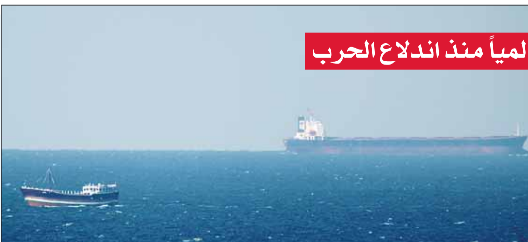
تكلفة التأمين على نقلات النفط زادت نتيجة الحرب

تشدد شركات التأمين في شروط التغطية للملاحة والطيران والطاقة