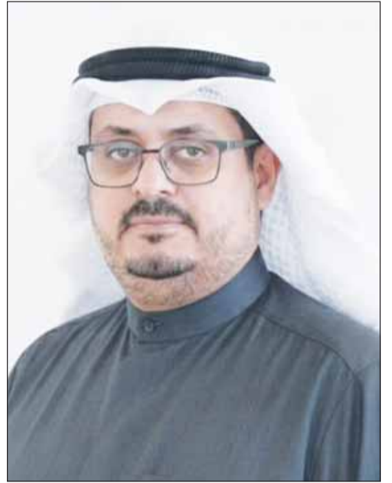
د. فيصل العدواني

■ ماذا عن اختلاف سياسات الجامعات في دول الابتعاث؟ ■ بالفعل، هناك تباين واضح، فيعض الجامعات سمحت باستمرار الدراسة بنظام التعليم عن بعد، بينما اشترطت جامعات أخرى الحضور الفعلي، وهناك جامعات حددت مواعيد نهائية لعودة الطلبة، وفي حال عدم الالتزام يتم إيقاف الدراسة مؤقتاً. ■ كيف تعاملت الوزارة مع هذه الاضطرابات المختلفة؟ ■ عملنا على التفاوض مع الجامعات لشرح الظروف الاستثنائية التي يمر بها الطلبة الكويتيون، خصوصاً من تعذر عليهم السفر في الوقت المحدد، وقد طلبت بعض الجامعات مستندات رسمية مثل تذاكر السفر الملغاة أو ما يثبت وجود الطالب داخل الكويت، وذلك لدعم موقفه أمام الجهات المختصة، خاصة فيما يتعلق بإجراءات التأشيرات الدراسية. ■ هل يتم التعامل مع الجامعات بشكل جماعي أم فردي؟ ■ في كثير من الحالات يتم التعامل بشكل فردي لكل طالب، نظراً لتعدد الجامعات واختلاف أنظمتها، حيث تضم دول الابتعاث مئات الجامعات، ما يتطلب دراسة كل حالة على حدة قبل بدء التفاوض.