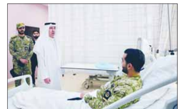
الشيخ مبارك المحمود يزور أحد المصابين في المستشفى