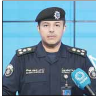
العميد ناصر بوصليب

الجمعة، أن القوات المسلحة رصدت خلال الـ24 ساعة الماضية 7 مسيرات معادية داخل المجال الجوي الكويتي، تم التعامل معها وفق الإجراءات المعمدة. وقال المتحدث الرسمي باسم الوزارة العقيد الركن سعود العطوان، خلال الإيجاز الإعلامي للتطورات والأحداث العملية، إن "العدوان الإيراني الأثم استهدف عدداً من المنشآت الحيوية التابعة للحرس الوطني، ما أسفر عن إصابة عدد من منتسبي الحرس"، موضحاً أن المصابين "يتلقون العلاج، وبالتالي مستقرة". وأشار إلى أن العدوان الإيراني استهدف "أدى إلى أضرار مادية جسيمة". وذكر العقيد العطوان أن "مجموعة التفقيش والتخلص من المتفجرات التابعة