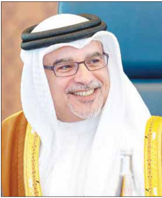
ولي العهد في مملكة البحرين الأمير سلمان بن حمد آل خليفة

رواتب العاملين في "الخاص" لشهر أبريل من صندوق التأمين