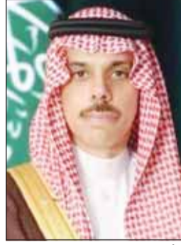
الأمير فيصل بن فرحان آل سعود