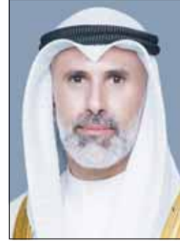
وزير الخارجية الشيخ جراح الجابر

وفي السياق ذاته، تلقى الوزير أحمد اتصالاً من وزير الشؤون الخارجية في جمهورية الهند، سوبر اهانانام جايشانكار، جرى خلاله بحث تطورات الأحداث والجهود المبذولة بشأنها. وناقش وزير الخارجية في الاتصالات الثلاثة الجهود الرامية للتعامل مع التطورات الراهنة، إلى جانب استعراض سبل تعزيز الأمن والاستقرار على المستويين الإقليمي والدولي في ظل التحديات القائمة.