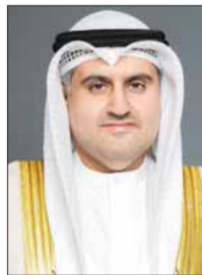
وزير العدل المستشار ناصر السميح

وأضاف أن الحصيلة المنجزة حتى الآن بلغت 237 قانوناً، شملت 21 مرسوماً جديداً، و54 مرسوماً معدلاً، و8 مراسيم بإلغاء قوانين، و77 اتفاقية دولية، و77 طلب موافقة مبدئية لمذكرات تفاهم دولية قيد الإبرام، بما يعكس استمرار المراك التشريعي وأهمية التعاون الدولي للكويت.