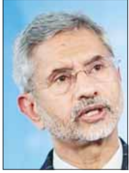
الوزير سوبر اهانانام جايشانكار