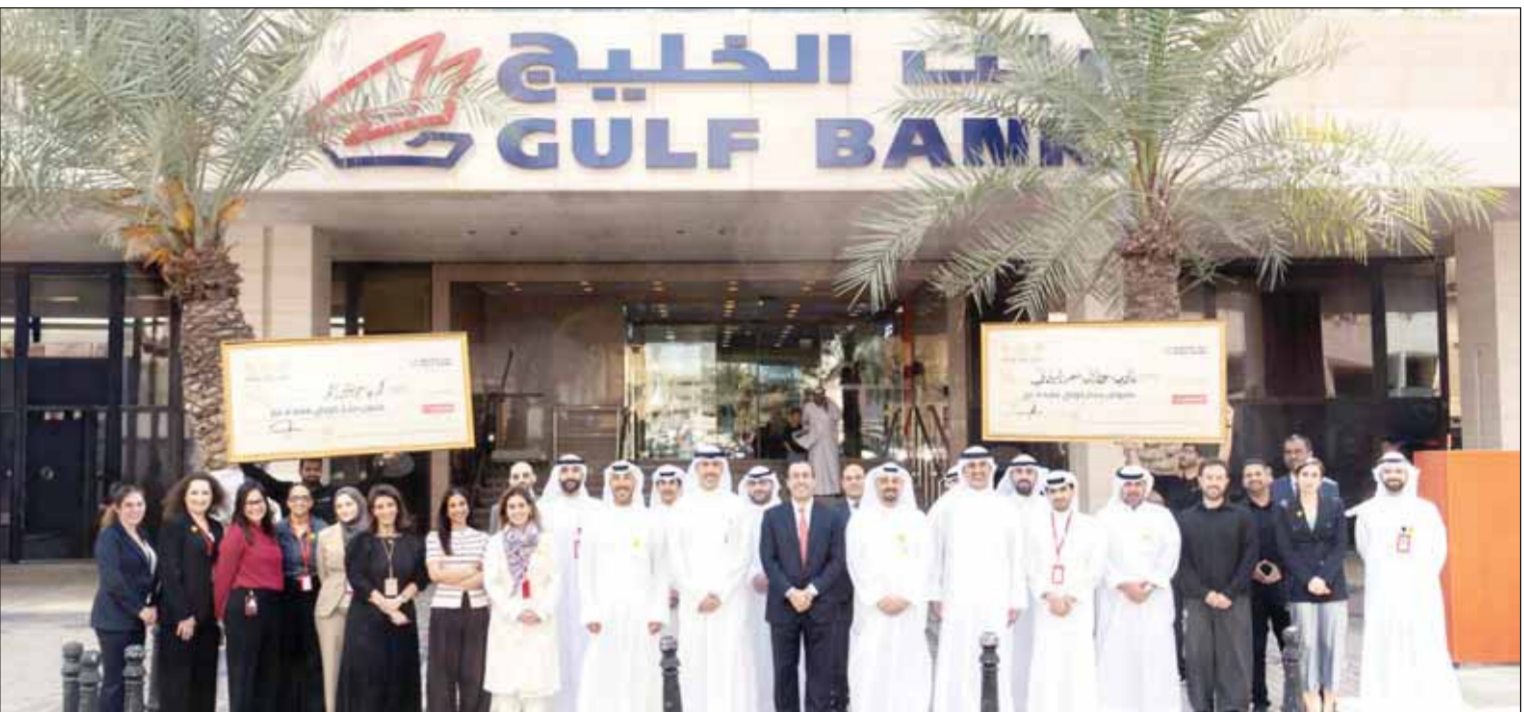
صورة جماعية للرابرة الترفيهية امام المقر الرئيسي لبنك عقب انهاء السحوبات

باسل الأسد: نبارك لجميع الفائزين ونتمنى حظاً أوفر لباقي العملاء في السحوبات المقبلة