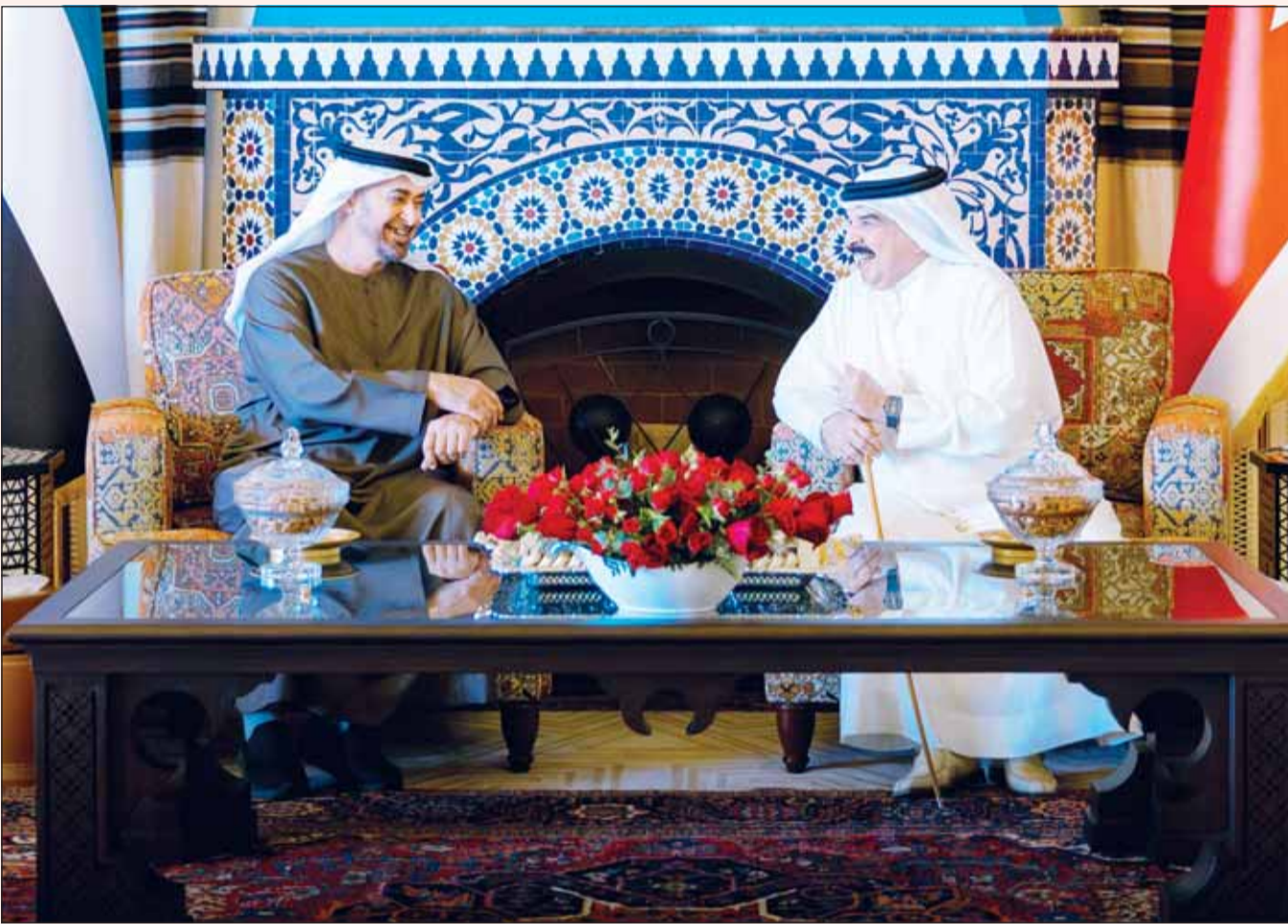
العاهل البحريني الملك حمد بن عيسى مستقبلاً رئيس الإمارات الشيخ محمد بن زايد خلال زيارته القصيرة التي قام بها للمنامة أمس (بنا)