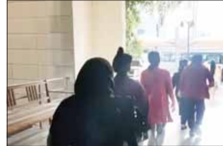
فض التجمع العمالي في أحد المواقع

أعلنت الهيئة العامة للقوى العاملة عن تعاملها مع حالتها تجمهر عمالي خلال يومين متتاليين، وذلك في إطار جهودها المستمرة لحفظ حقوق العمالة وتنظيم سوق العمل، بالتنسيق مع وزارة الداخلية ممثلة في قطاع الامن العام. وقالت الهيئة - في بيان صحفي - ان الجهات المختصة لديها تلقت بلاغاً من قطاع الامن العام يفيد بوجود تجمهر لأكثر من 400 عامل، انتقل على اثره فريق من ادارة علاقات العمل والفريق المختص بالشكاوى الجماعية والميدانية الى الموقع وتم التعامل مع الحالة وفض التجمهر بالتنسيق مع القيادات الامنية المختصة. واضافت، جرى الاستماع الى عدد من العمال للوقوف على اسباب التجمهر والتوقف الجماعي عن العمل، حيث تبين وجود خلافات بين مجموعة من العمال واصحاب العمل، وعلى اثر ذلك استدعي صاحب العمل