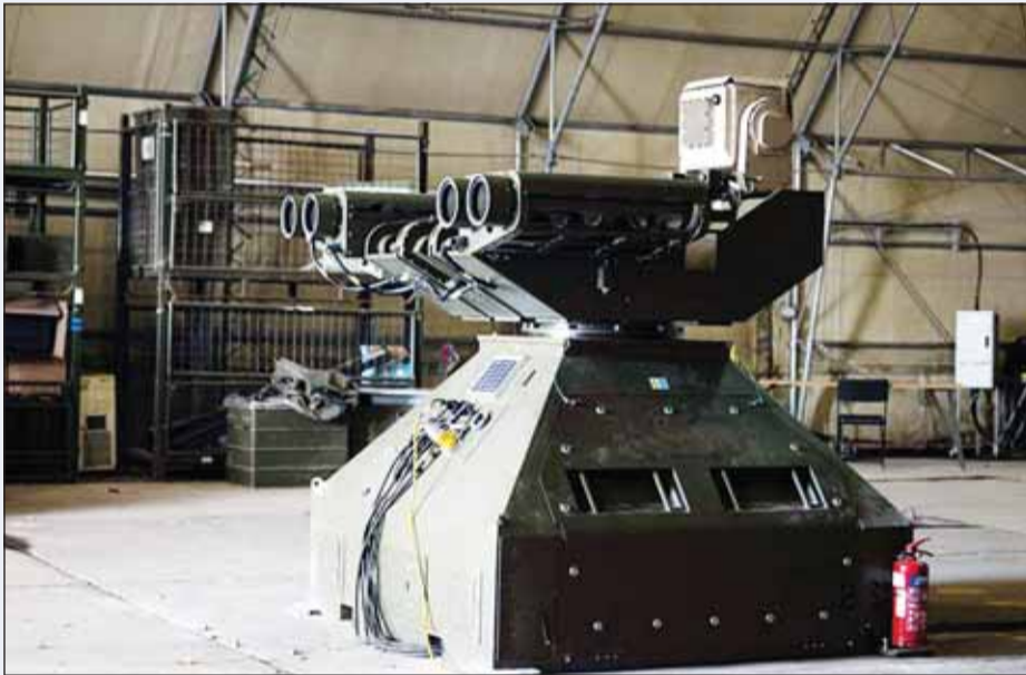
منظومة "رايبيد سانتري"