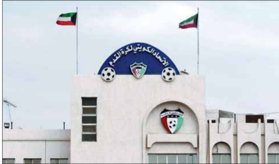
اتحاد القدم يستقبل طلبات الترشح للعضوية حتى الساعة 09:00 مساء اليوم