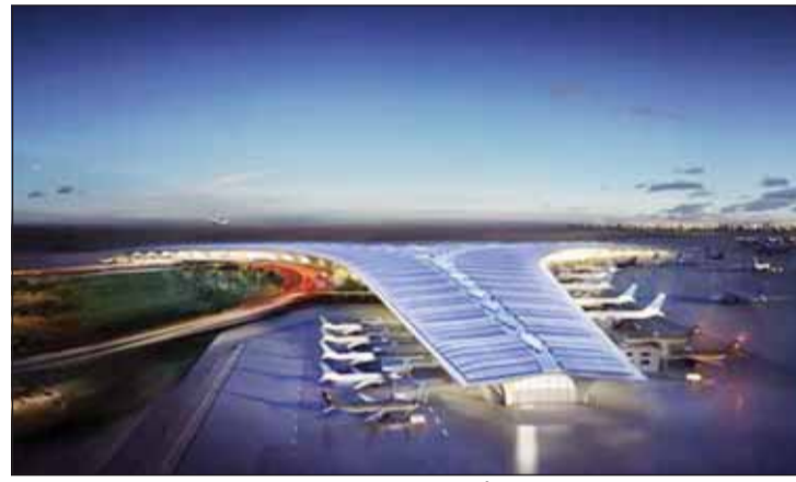
مبنى مطار الكويت الدولي "تيم 2" أبرز مشاريع التنمية

42 جهة حكومية شاركت في 133 مشروعاً تنموياً بمراحل مختلفة