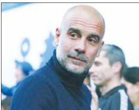
غوارديولا سعيد بالفوز على تشيلسي

أعرب الإسباني جوسيب غوارديولا، المدير الفني لفريق مانشستر سيتي، عن سعادته بفوز ناديه الكبير 3 - صفر على مضيفه تشيلسي، في قمة مباريات المرحلة 32 لبطولة الدوري الإنجليزي الممتاز لكرة القدم أول من أمس. وأشعل مانشستر سيتي سباق المنافسة على لقب المسابقة هذا الموسم، عقب فوزه على تشيلسي، حيث يطمح لاستعادة البطولة التي غابت عنه في الموسم الماضي لمصلحة ليفربول. واستفاد مانشستر سيتي من خسارة منافسه أرسنال (المتصدر)، بالمعاجة 1 - 2 أمام ضيفه بورنموث، السبت، في ذات المرحلة، حيث يحتل حاليا المركز الثاني برصيد 64 نقطة في المركز الثاني، بفارق 6 نقاط خلف الفريق الملقب بـ(المدفعية).