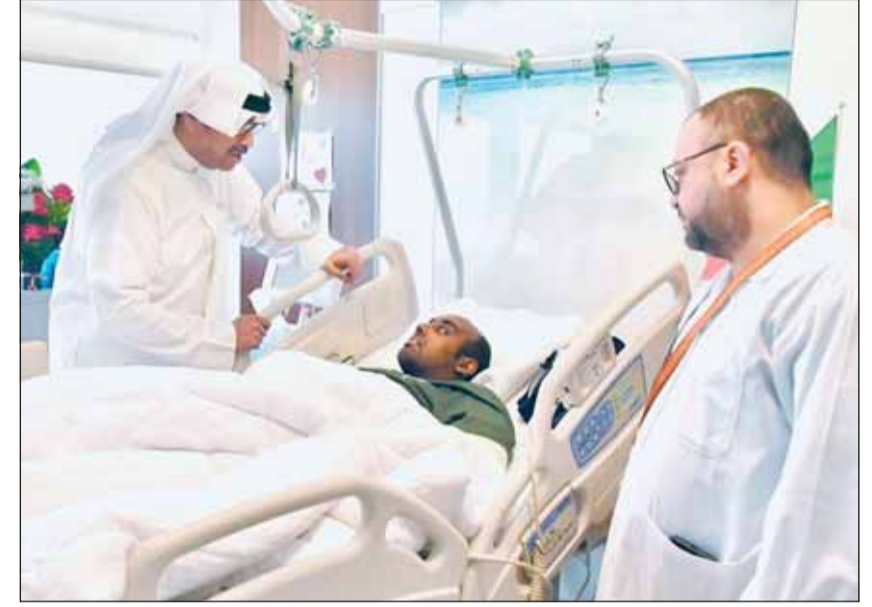
وزير الدفاع الشيخ عبدالله العلي يطمئن علم أحد المصابين