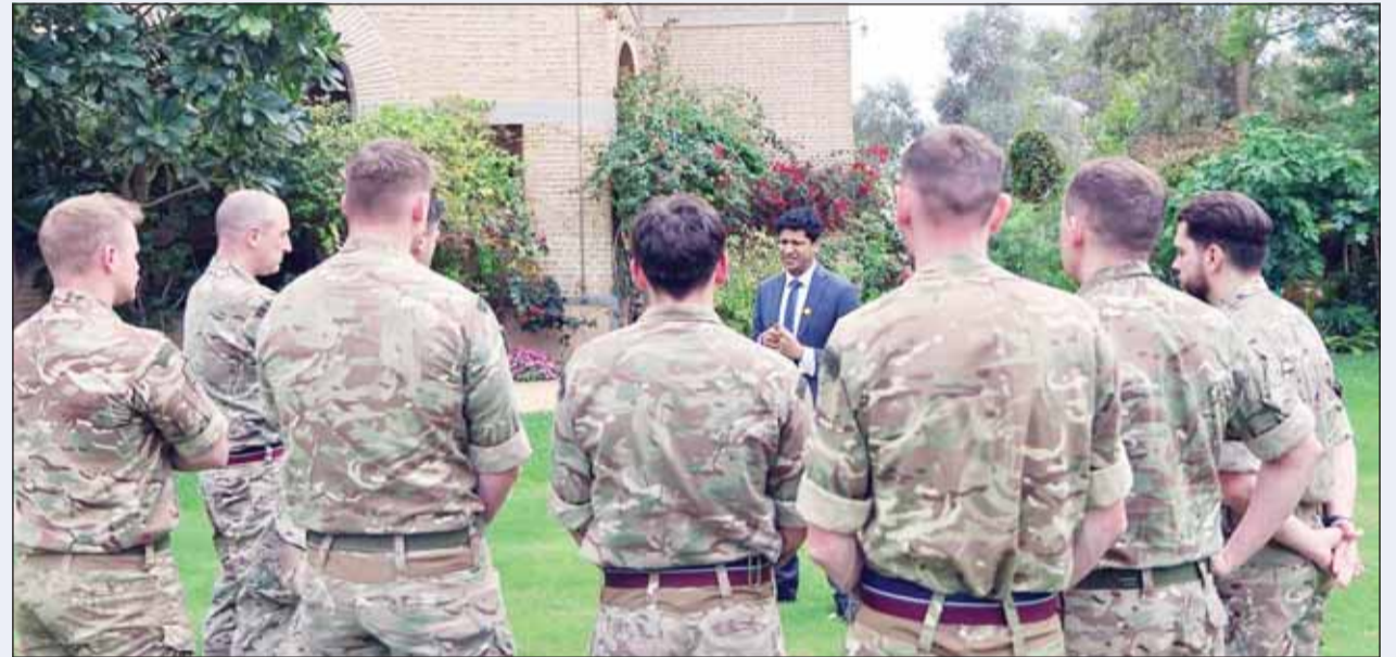
السفير قُدسي رشيد مع أفراد من فوج سلاح الجو الملكي البريطاني

واستعراض مستوى التعاون القائم مع الجهات الكويتية المختصة، في إطار الشراكة الدفاعية الوثيقة بين البلدين". وشدد السفير رشيد على أنه "رغم تحسّن الأوضاع، فإن المحافظة على الجاهزية تبقى أمراً أساسياً، مؤكداً "استمرار وقوف المملكة المتحدة إلى جانب دولة الكويت، ودعمها للقوات الكويتية في جهودها الرامية إلى حماية أمن البلاد".