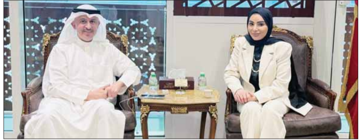
جانب من الاجتماع المشترك لوزيري الشؤون الاجتماعية دامثال الحويلة والتجارة أسامة بودي

إضافة إلى تعزيز الشراكة بين الجهات الحكومية لتحقيق الاستفادة في القطاع الزراعي. وأوضح أنه تم خلال الاجتماع استعراض منصة رقمية متكاملة تهدف إلى تنظيم عمليات التسويق والتوزيع بما يضمن الجودة والشافية وتعزيز كفاءة المتابعة والرقابة ومناقشة سبل تفعيل المنصة بما يحقق زيادة المبيعات للمنتج المحلي ويوفر فرصاً عادلة للمنتجين ويعزز ثقة المستهلك به. وذكر أنه تم التأكيد خلال الاجتماع على أهمية المرونة في تنفيذ هذه الخطط بما يتوافق مع المتغيرات لضمان استمرارية الدعم وتعزيز كفاءة سلاسل الإمداد الغذائي في مختلف الظروف.