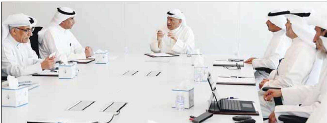
وزير التعليم العالي د. نادر الجلال مترئسا الاجتماع

يقاف التخصصات غير المطلوبة وتحديث البرامج وفق احتياجات الدولة من الكوادر الوطنية