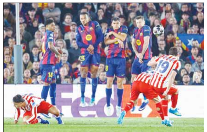
برشلونة يبحث عن التآ والريمونتادا أمام الأتلتيكو

يستعد ملعب طيران الرياض ميتروبوليتانو لاستضافة مواجهة نارية ومثيرة تجمع بين أتلتيكو مدريد وبرشلونة، اليوم، في إياب ربع نهائي دوري أبطال أوروبا لموسم 2025-2026. أتلتيكو كسر لعنة "كامب نو" وهاز على برشلونة نهائياً بثنائية نظيفة، مما يعقد مهمة النادي الكتالوني الذي يرغب في العودة والاستمرار في الأبطال. كما يحتضن ملعب أنفيلد قمة أوروبية مشتعلة، حين يستقبل ليفربول نظيره باريس سان جيرمان اليوم، في إياب ربع نهائي دوري أبطال أوروبا، ويدخل باريس سان جيرمان المواجهة بمعنويات مرتفعة، بعدما حقق فوزاً مهماً في الذهاب بثنائية نظيفة، بينما يحاول ليفربول العودة مستغلاً قوة الأرض والجمهور. لا شك أن فريق برشلونة بقيادة هانز فليك يعرف كيف يحقق العودة في النتيجة بعد التأخر خلال المباريات الكبرى. منذ وصول المدرب الألماني إلى برشلونة، أصبحت القدرة على قلب النتائج من أبرز سمات الفريق الكتالوني. وأصبح من المعتاد تقريباً أن ينهي البلوجرانا المباراة بالفوز حتى لو كان متأخراً في البداية.