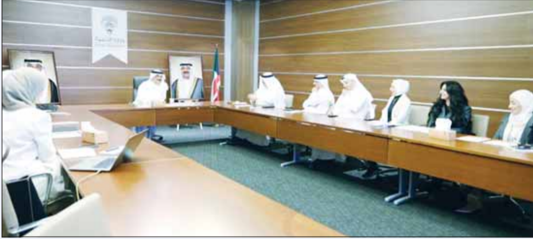
وزير التربية جلال الطببائي يترأس الاجتماع

إعداد الملفات الفنية والتوثيقية إلى جانب بحث آليات التعاون الموسمي بما يضمن تكامل الأدوار وتسريع وتيرة العمل. وأشارت إلى أن الوزير الطببائي وجه بتشكيل لجنة مشتركة تضم الجهات المعنية تتولى العمل على تدليل التحديات واستكمال متطلبات إدراج الملفات بما يعزز فرص تسجيلها ضمن قائمة التراث العالمي. وأفادت بأنه تم التأكيد على أهمية تعزيز العمل المشترك وتكثيف الجهود الفنية والتنظيمية بما يسهم في إبراز الإرث الثقافي الكويتي على الساحة العالمية والمحافظة عليه للأجيال القادمة.