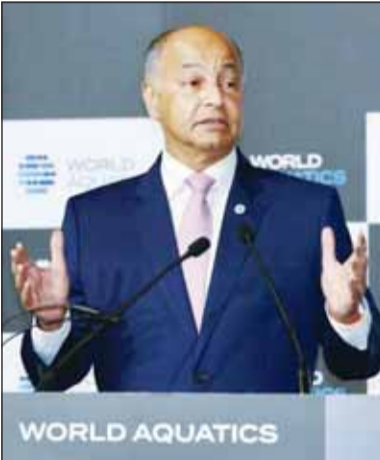
الكابتن حسين المسلم

أصدر الاتحاد الدولي للألعاب المائية برئاسة الكابتن حسين المسلم أمس، قراراً بمشاركة اللاعبين من روسيا وبيلاروسيا للألعاب المائية بنفس الطريقة التي يشارك بها نظراؤهم الرياضيون من الجنسيات الرياضية الأخرى، باستخدام العلم الروسي والبيلاروسي والنشيد الوطني والملابس الخاص لمنتخباتهم.