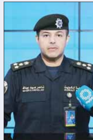
العميد ناصر بوصليب

"أمنكم غايتنا"... شعار يتجسد ميدانياً عبر جهود متواصلة، تعكس حرصاً راسخاً على حماية المجتمع وتعزيز الاستقرار... والحضور الأمني المكثف يبرز يقظة دائمة والالتزام ثابتاً بضمان سلامة الجميع وتطبيق القانون بروح المسؤولية. "الإدارة العامة للعلاقات والإعلام الأمني" رصدت مستوى الجاهزية العالية للقطاعات الميدانية في وزارة الداخلية، في إطار جهودها المتواصلة لحفظ الأمن وتأمين الطرق وتطبيق القانون، تحت شعار "أمنكم غايتنا". وأكدت أن الأجهزة الأمنية كثفت انتشارها عبر نقاط التفقيش والدوريات في مختلف المناطق، بما يعكس جاهزية كاملة للتعامل مع مختلف الحالات، وضمان سلامة المواطنين والمقيمين. وشددت الإدارة على أن هذه الإجراءات تأتي ضمن خطة أمنية متكاملة، تهدف إلى تعزيز الاستقرار، وترسيخ هيبته القانون، ورفع مستوى الطمأنينة في المجتمع، مع استمرار العمل الميداني على مدار الساعة.