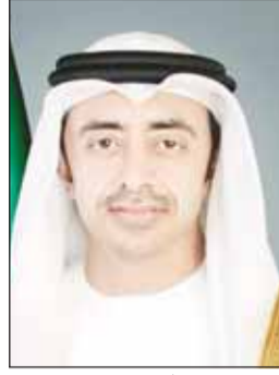
الشيخ عبدالله بن زايد