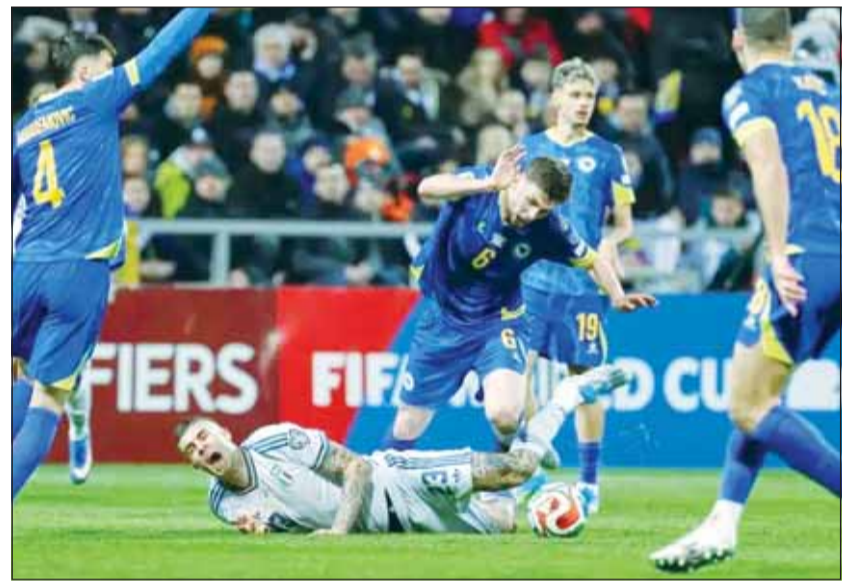
إيطاليا خرجت من تصفيات المونديال علمه يد البوسنة

بدوره، سيكون أرسنال أكثر الفرق المرشحة للعبور في ربع النهائي حين يستضيف اليوم، سبورتنغ لشبونة البرتغالي وفي لعبته فوز 0-1 ذهاباً خارج الديار. يخاطر فريق ريال مدريد الإسباني لكرة القدم بإشراك نجمه كيليان مبابي "المقنع" في مواجهة بايرن ميونخ، وتعرض المهاجم الفرنسي لصابة في الرأس في المباراة التي تعادل فيها الفريق مع جيرونا 1-1 يوم الجمعة الماضي، حيث