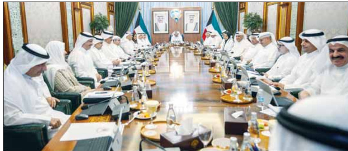
سمو رئيس مجلس الوزراء الشيخ أحمد عبدالله مترشاً اجتماع مجلس الوزراء

استمع مجلس الوزراء إلى شرح قدمه وزير الدفاع الشيخ عبدالله العلي الصباح حول آخر مستجدات الأوضاع في المنطقة والتطورات العسكرية الحالية في ضوء الاعتداءات الإيرانية الأثمة على دولة الكويت.