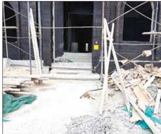
عدم التزام بأشتراطات السلامة