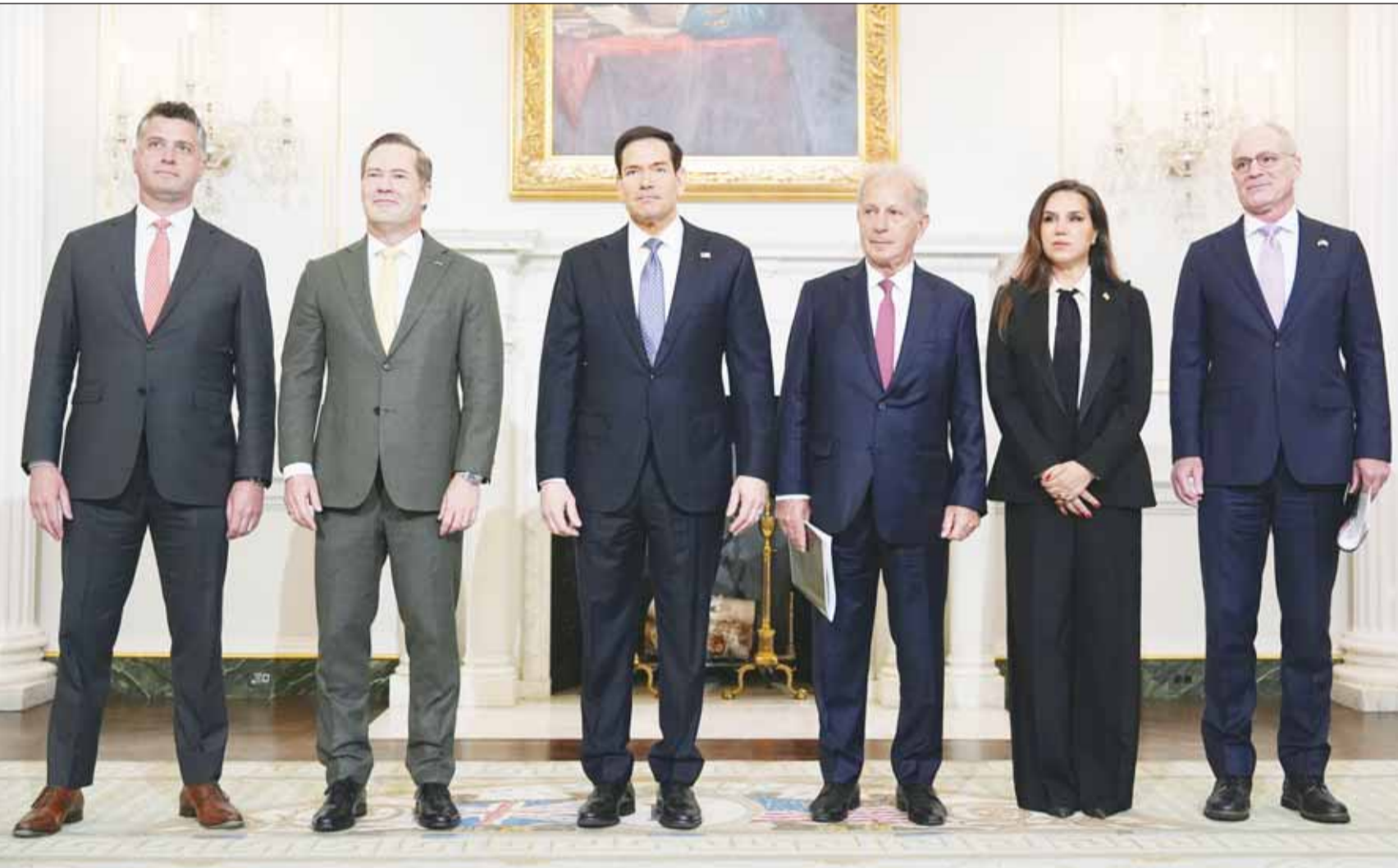
مستشار وزارة الخارجية الأميركية مايكل نيدهام وسفير أميركا لدى الأمم المتحدة مايك والتز وزير الخارجية ماركو روبيو وسفير أميركا لدى لبنان ميشيل عيسه وسفيرة لبنان لدى واشنطن وسفير إسرائيل (أب)

فصلاً عن بلدة تبينين وشعبا وكفرتينبت، بينما انتشرت صورة لجندي من لواء غفغاتي الإسرائيلي وسط بنت جبيل أمس، واقفاً أمام جدار تذكاري لقتلى "حزب الله" الذين سقطوا خلال مواجهات سابقة مع إسرائيل، بينما أعلنت مصادر إسرائيلية أن لواء غفغاتي قام بأسر عدد من عناصر "حزب الله" في البلدة ونقلهم إلى الأجهزة الأمنية داخل إسرائيل لاستكمال التحقيق، وذلك في أعقاب تطويق البلدة التي تبعد نحو 5 كلم عن الحدود، من قبل القوات الإسرائيلية وسقوطها عسكرياً، وتكتسب بنت جبيل رمزية خاصة لحزب الله تتجاوز أهميتها الميدانية والاستراتيجية، حيث ألقى فيها الأمين العام السابق للحزب حسن نصر الله خطاب التحرير غداة انسحاب القوات الإسرائيلية من الجنوب إثر احتلال دام 22 عاماً، وفي احتفال ما سمي بـ "النصر" بعد حرب يوليو 2006، اتخذها كمنصة لإطلاق مقولته الشهيرة التي وصف فيها إسرائيل بأنها "أوهن من بيت العنكبوت"، بعد ما شهدت المدينة معارك عنيفة خلال حرب العام 2006 من دون أن تتمكن القوات الإسرائيلية من السيطرة عليها.