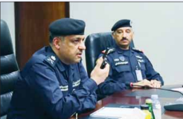
اللواء عبدالوهاب الوهيب يتحدث خلال الزيارة التفقدية

أكد وكيل وزارة الداخلية اللواء عبدالوهاب الوهيب، أول من أمس، أن التواصل المباشر والتكامل بين مختلف الجهات يعد ركيزة أساسية لتعزيز الجاهزية وتحقيق الاستجابة الفاعلة لمتطلبات المرحلة. وقالت (الداخلية) في بيان صحفي إن ذلك جاء خلال زيارة تفقدية قام بها اللواء الوهيب لقوات الأمن الخاصة للاطلاع على سير العمل ومستوى الجاهزية ومتابعة انتشار القوة في مواقع المسؤولية حيث استمع خلالها إلى شرح حول آلية العمل والتنسيق المشترك مع الجهات العسكرية.