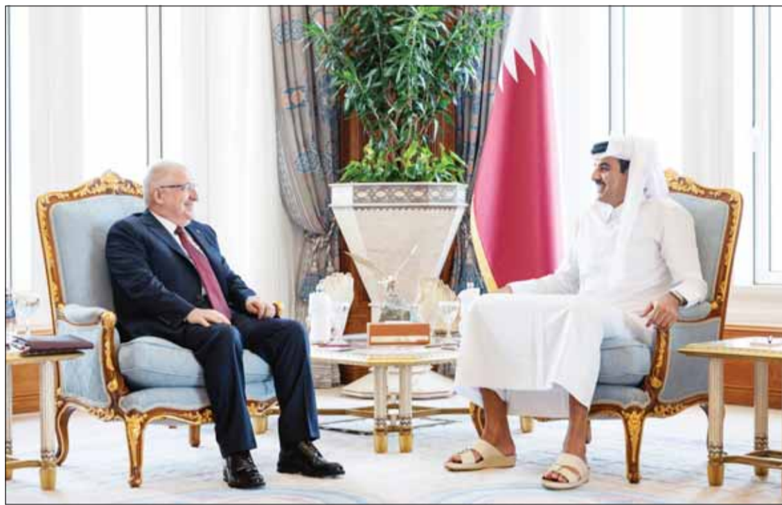
أمير قطر الشيخ تميم بن حمد مستقبلاً وزير الدفاع التركي يشار غولر في الديوان الأميري بالدوحة أمس (قنا)

من قبل أي طرف، ويجب ألا تكون هناك شروط مسبقة لفتحه، مؤكداً صمود اقتصاد قطر ودول المنطقة رغم التحديات. ونفى المتحدث باسم الخارجية القطرية إجراء أي مناقشات بين قطر وإيران بشأن دفع أموال لوقف الهجمات الإيرانية على بلاده، واصفاً أي ادعاءات بإجراء مثل هذه المناقشات بأنها "لا أساس لها من الصحة".