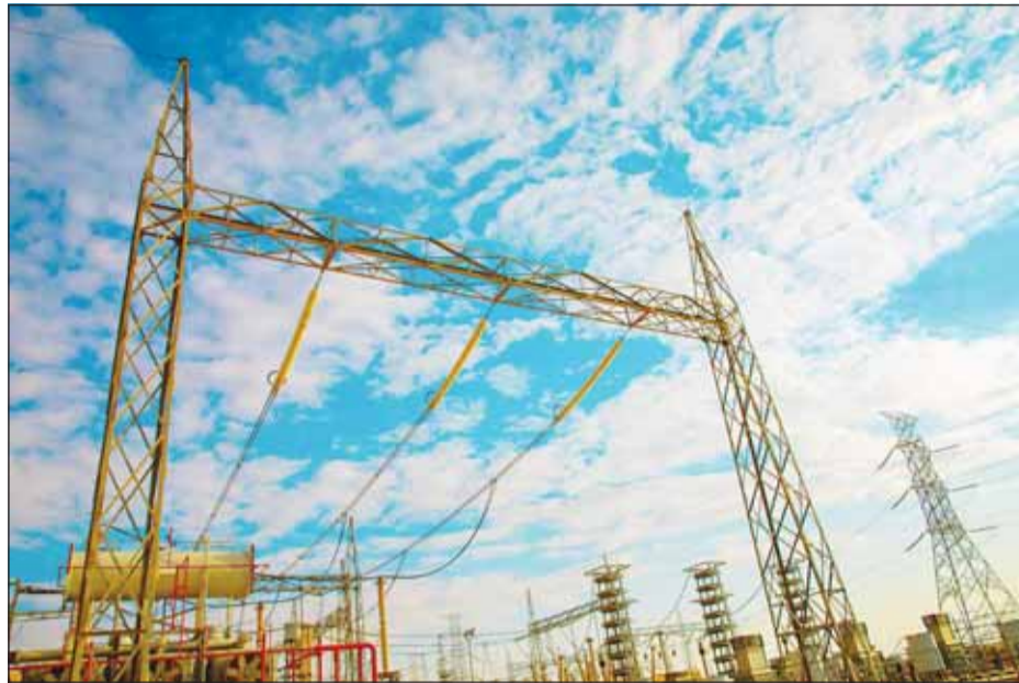
شبكة الربط الكهربائي الخليجي

علمت "السياسة" أن قيمة العقد الذي أمالته وزارة الكهرباء والماء والطاقة المتجددة أخيراً إلى ديوان المحاسبة، الخاص باستيراد الطاقة الكهربائية من خلال هيئة الربط الكهربائي الخليجي، للفترة من مايو المقبل حتى مارس 2027، بلغت 283,286 مليون دينار. وأملت الوزارة العقد إلى ديوان المحاسبة للمراجعة والتدقيق واستكمال إجراءات الرقابة المسبقة، باعتباره من العقود الخاضعة لرقابة الديوان، لضمان سلامة الإجراءات قبل إبرام العقد مع الهيئة والبدء في التزويد بكميات الطاقة الكهربائية المتفق عليها. وتلجأ الوزارة إلى الاستعانة بالربط الخليجي لتأمين احتياجاتها من الطاقة الكهربائية وضمان استقرار الشبكة الوطنية خلال فصل الصيف، الذي ترتفع فيه الأحمال إلى مستويات قياسية نتيجة زيادة الاستهلاك المصاحبة لارتفاع درجات الحرارة، وما يترتب عليها من تشغيل مكثف لأجهزة التكييف، التي تستهلك ما يقارب 70 في المئة من إنتاج الطاقة الكهربائية. ويهدف استيراد الطاقة كذلك إلى توفير مرونة زمنية تتيج إجراء أعمال الصيانة الدورية لومدات إنتاج القوى الكهربائية وتقطير المياه في مختلف المحطات، وفق الخطة المعتمدة، لا سيما الومدات القديمة التي تعمل الوزارة على تأهيلها وإعادةها إلى الخدمة، إلى جانب الومدات الجديدة الجاري تشغيلها. في موازاة ذلك، تواصل الوزارة بالتعاون مع الهيئة العامة للشراكة بين القطاعين العام والخاص استكمال