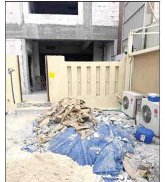
تراكم مواد البناء المهملّة وعدم رفعها

أعلنت إدارة العلاقات العامة في البلدية عن قيام الفريق الرقابي لإدارة السلامة في محافظة الأحمدية بالتفتيش على الأعمال الإنشائية وتوفير وسائل الامن والسلامة ورصد المخالفات في مواقع الإنشاء والترميم واتخاذ كل الإجراءات الرقابية بحق المخالفين والتأكد من مدى الالتزام بلوائح ونظم أعمال السلامة.