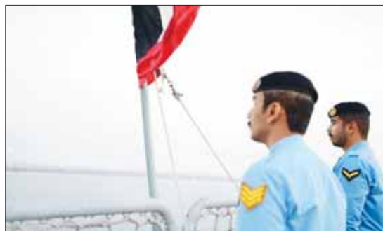
رجال القوة البحرية