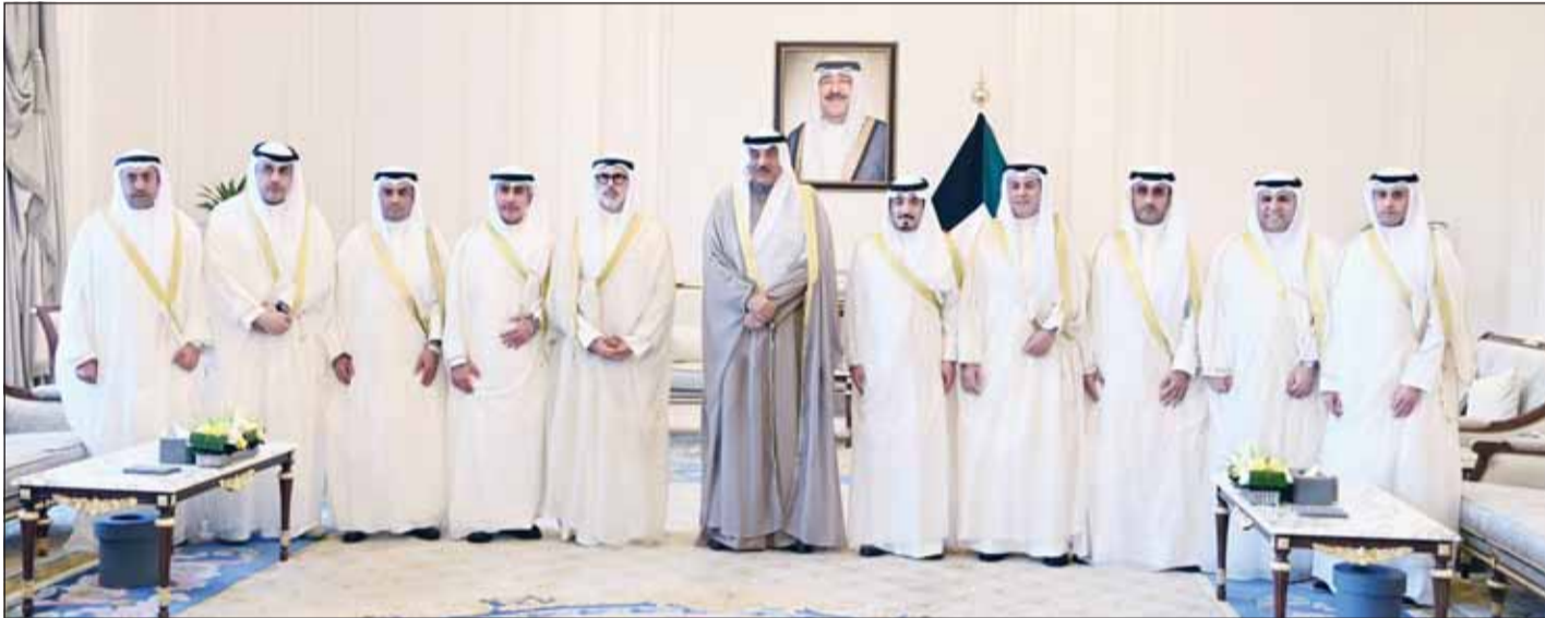
سمو وليه العهد الشيخ صباح الخالد متوسطاً وزير الخارجية الشيخ جراح الجابر ورؤساء البعثات الدبلوماسية الجدد

هيوستن، ومحمد خالد العجران قنصلاً عاماً لدولة الكويت لدى الجمهورية الإيطالية في مدينة ميلانو وشمال إيطاليا، ومشاري صالح المزيني قنصلاً عاماً لدولة الكويت لدى جمهورية ألمانيا الاتحادية في مدينة فرانكفورت، وذلك بمناسبة توليهم مهام مناصبهم الجديدة. حضر اللقاء الشيخ ثامر جابر الأحمد رئيس ديوان سمو ولي العهد وكبار المسؤولين في الديوان.