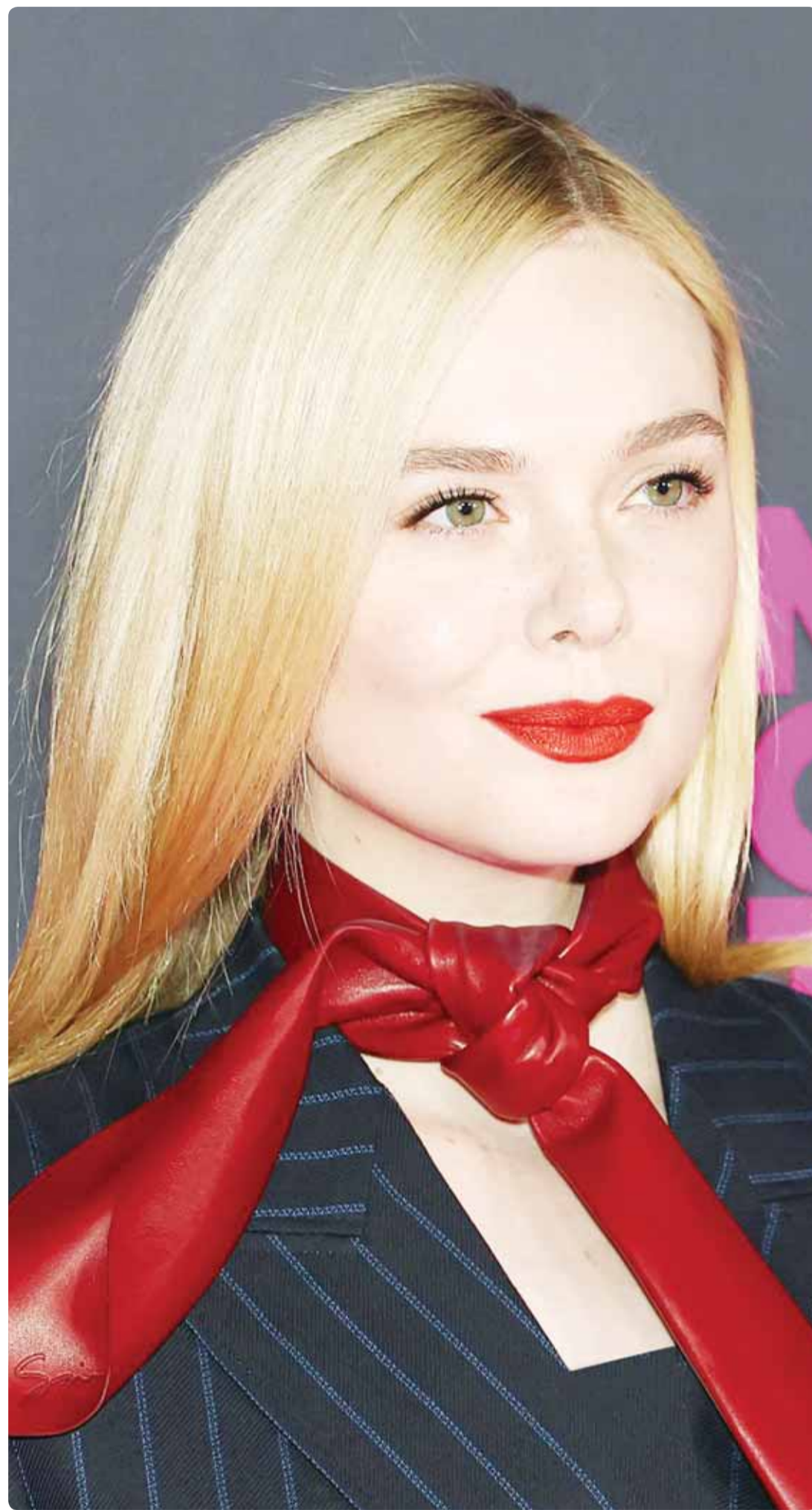
الممثلة الأميركية إيل فانينغ خلال حضورها عرض فيلم "مارغو لديها مشاكل مالية" في نيويورك