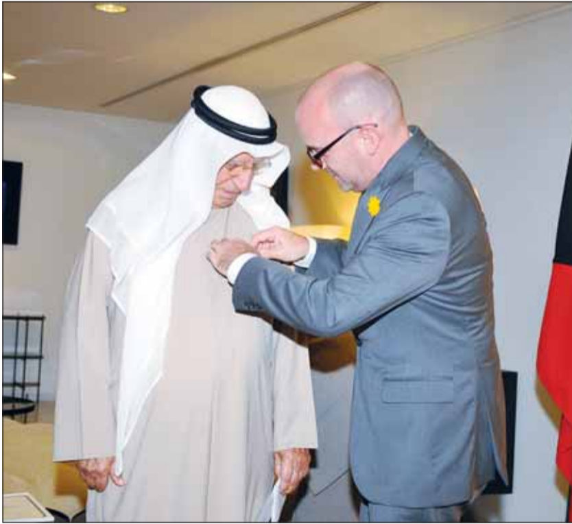
السفير الفرنسي أوليفييه غوفان يقبل صباح الريس وسام الفنون والآداب

وأكد أن العلاقات الفرنسية الكويتية تتميز بمتانتها على المستويين الرسمي والشعبي، مشدداً على أهمية الدور الذي تلعبه الثقافة في تعزيز هذا التقارب.