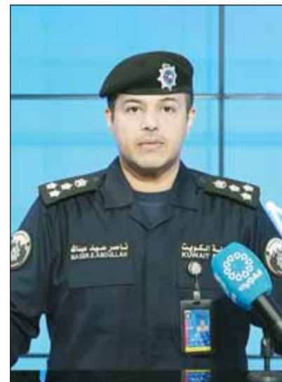
العميد ناصر بوصليب

وأشار إلى أن "الداخلية" تهيب بالمواطنين تأجيل أنشطة الصيد في المناطق البرية كإجراء احترازي، يعكس الوعي والمسؤولية، ويسهم في توفير بيئة آمنة تمكن الجهات