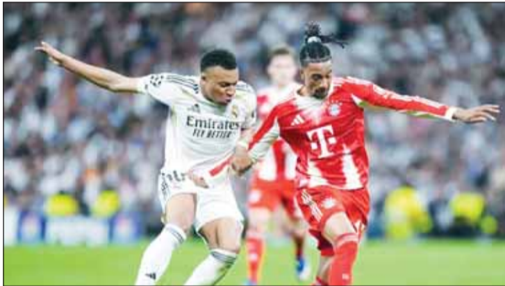
مبابي يقود هجوم الميرينغفي رغم الإصابة

ولم يفز بايرن على الريال على أرضه منذ قبل نهائي 2012 عندما فاز بركلات الترجيح في إسبانيا. وأعلن فريق ريال مدريد أمس، قائمة فريقه، التي ستواجه بايرن ميونخ وتمثلت أبرز مقابلات القائمة في غياب راؤول أسينسيو، الذي تم استبعاده من رحلة الفريق الإسباني إلى ميونخ. ولم يتواجد اللاعب المولود في جزر الكناري، والذي شارك أساسياً ولعب 90 دقيقة كاملة في التعادل 1-1 مع جيرونا يوم الجمعة بالدوري الإسباني، بشكل مفاجئ من قائمة الفارو أرييولا.