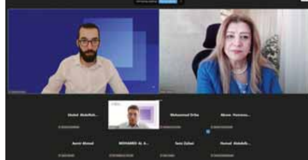
جانب من الندوة الافتراضية

ناقشت الندوة أن التوكنيزيشن لا يُعد مجرد تطور تقني، بل يمثل تحولاً هيكلياً في كيفية إدارة وتداول الأصول، حيث يسهم في: ● خفض التكاليف التشغيلية عبر تقليل الوسطاء. ● تسريع عمليات التسوية من أيام إلى دقائق أو ثوان. ● تعزيز الشفافية من خلال تسجيل العمليات بشكل آلي. ● إتاحة الاستثمار لشريحة أوسع، خاصة صغار المستثمرين. ● تحسين كفاءة الأسواق وزيادة فرص التنوع الاستثماري. ● تم التطرق خلال الندوة إلى عدد من التحديات، أبرزها: ● الحاجة إلى أطر تنظيمية واضحة تحمي المستثمرين. ● قضايا حفظ الأصول الرقمية (Custody). ● السيولة في الأسواق اللقنوية. ● الأمن السيبراني والتوافق بين الأنظمة المختلفة. ● الإطار القانوني لتحديد الملكية والمقوق المرتبطة بالتوكنات.