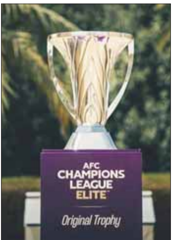
الآسيوي يوصف بزيادة عدد أندية النخبة

أعلنت لجنة المسابقات في الاتحاد الآسيوي لكرة القدم، أمس عن حزمة من الإصلاحات الهيكلية التاريخية لبطولة دوري أبطال آسيا للنخبة، تستهدف "رفع مستوى التنافسية والقيمة التسويقية" للبطولة الأعلى في القارة، وذلك اعتباراً من موسم 2026-2027.