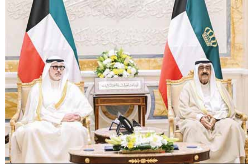
سمو أمير البلاد الشيخ مشعل الأحمد لده استقباله وزير الخارجية الشيخ جراح الجابر

ونواف ضيدان بوشيبية سفيرا فوق العادة ومفوضاً لدولة الكويت لدى الجمهورية الجزائرية الديمقراطية الشعبية، وتركي خالد المكراد سفيرا فوق العادة ومفوضاً لدولة الكويت لدى جمهورية أوزبكستان، ومحمد راشد العميري سفيرا فوق العادة ومفوضاً لدولة الكويت لدى جمهورية طاجيكستان، وفهد يوسف المسعود قنصلاً عاماً لدولة الكويت لدى الولايات