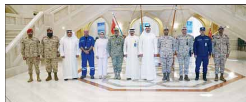
وكيل وزارة النفط الشيخ نمر المالك متوسطاً فريق العمل المعني بإنشاء مركز وطني لإدارة الأزمات

وتطوير السياسات اتخاذ القرار وتبادل المعلومات بشكل فوري ودقيق. وأشار إلى أنه جرى خلال الاجتماع التأكيد على أهمية الدور المحوري للقواعد النظمية في منظومة إدارة الأزمات نظراً لحساسيتها وتأثيره المباشر على الاقتصاد الوطني. واتفق الجانبان وفق البيان في ختام الاجتماع على استمرار التنسيق المشترك وتشكيل فرق عمل متخصصة لدراسة الجوانب الفنية والتشغيلية ووضع خطة عمل واضحة لدعم إنشاء المركز وتحقيق أهدافه الاستراتيجية.