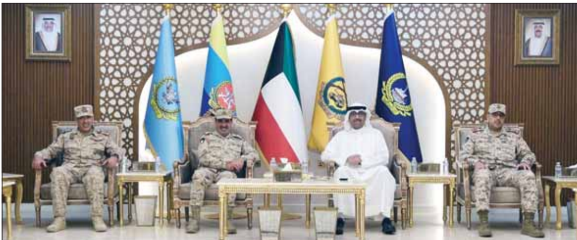
وزير الدفاع الشيخ عبدالله العلي خلال الزيارة الميدانية إلى القوة البحرية

جال على وحدات القوة البحرية وأكد اعتزاز القيادة بإخلاصهم وزير الدفاع: المتغيرات الراهنة تستدعي أعلى درجات اليقظة