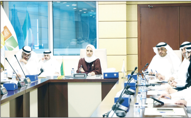
وزيرة الدولة للتنمية والاستدامة د.ريم الفليج ترأست الاجتماع

وجاهزية عالية. من جهتها، قالت المدير العام للهيئة العامة للبيئة بالتكليف نوف بهباني، إن الاجتماعات من شأنها رفع كفاءة الاستجابة السريعة وتوحيد الجهود بما يعكس الجاهزية الوطنية والتكامل الموسمي في التعامل مع المستجدات البيئية الراهنة فضلاً عن تعزيز جاهزية خطط الطوارئ لضمان حماية البيئة وصون الصحة والسلامة. وأوضحت بهباني أن التعاون بين الجهات المعنية متكامل عبر منظومة عمل مشتركة تقوم على تبادل البيانات والتنسيق المستمر، مبيّنة أن الاجتماع ضم جهات عدة من بينها الهيئة العامة لشؤون الزراعة والثروة السمكية ومعهد الكويت للأبحاث العلمية والمركز الوطني للأمن السيرياني والهيئة العامة للغذاء والتغذية وموسسة البترول وتوابعها. وأضافت، إن الجهات المشاركة عرضت خلال الاجتماع خطط الاستجابة وآليات التنفيذ لكل جهة ضمن إطار تكامل موحد مع إبراز الجهود المبذولة في الرصد والمتابعة والتعامل مع المؤشرات البيئية بما يعزز منظومة الإنذار المبكر ويدعم اتخاذ القرار المبني على البيانات العلمية.