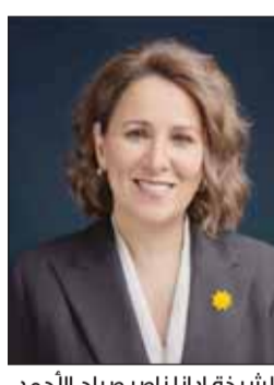
الشيخة ادانا ناصر صباح الأحمد

خلال التنمية الفكرية والإسهام الفاعل في المجتمع، ويصفتها رئيساً للجامعة، وتواصل الدكتور أسيل العوضي مسيرة التميز وتعزيز مكانة الجامعة كأحد المؤسسات الرائدة في التعليم العالي في الكويت والمنطقة وذلك من خلال تطوير البرامج الأكاديمية ودعم كفاءة أعضاء هيئة التدريس وتوسيع نطاق الشراكات الاستراتيجية والارتقاء بمخرجات التعليم والبيئة الأكاديمية. وأرعت أسرة الجامعة الأميركية في الكويت عن ترحيبها بالدكتورة العوضي متطلعة إلى ما ستقدمه قيادتها من رؤى استراتيجية وجهود أكاديمية تسهم في تعزيز مسيرة الجامعة والارتقاء بمستوى التميز وترسيخ مكانتها كمؤسسة رائدة في محليا ودولياً.