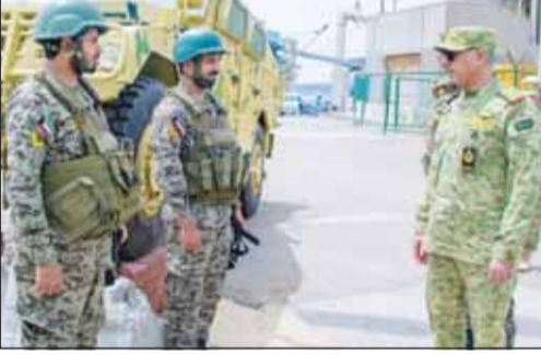
الفريق الركن حمد البرجس متحدثاً إلى رجال الحرس الوطني

قام وكيل الحرس الوطني الفريق الركن حمد البرجس بزيارة تفقدية أمس لعدد من مواقع المسؤولية التي تتولى قوة الواجب تأمينها. وأكد الفريق البرجس - في بيان صحفي - أهمية المحافظة على أعلى درجات الجاهزية والانضباط بما يعزز قدرة وحدات الحرس الوطني على دعم وإسناد أجهزة الدولة والمساهمة في ترسيخ أمن واستقرار البلاد في ظل قيادتها الرشيدة. ونقل إلى المنتسبين تحيات وتقدير قيادة