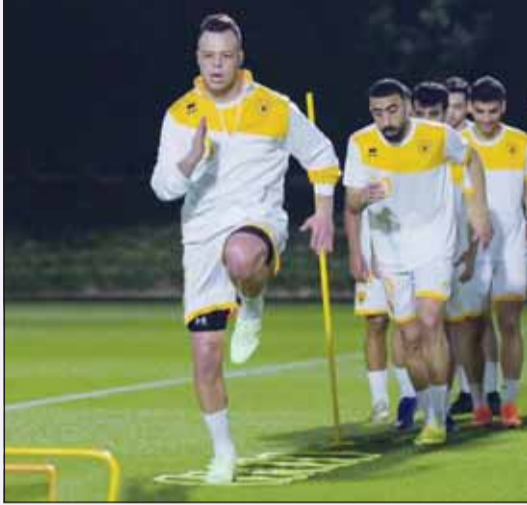
تدريب سابق لفرق القادسية ضمن استعداداته لدوره أبطال الخليج