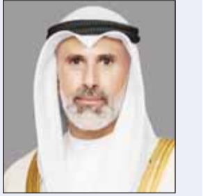
وزير الخارجية الشيخ جراح الجابر

وزير الخارجية ناقش هاتفياً مع نظيره الغاني أوضاع المنطقة