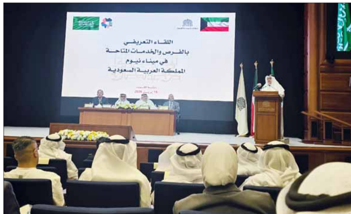
جانب من عرض مرئي عن ميناء نيوم

المدير العام لغرفة تجارة وصناعة الكويت رباح عبد الرحمن الرباح، قال إن ميناء نيوم أحد أبرز مشاريع التحول الاقتصادي في المملكة، مؤكداً أنه يمثل مرحلة جديدة في تطوير منظومة التجارة والخدمات اللوجستية على المستويين الإقليمي والدولي. وأضاف أنه في ظل الظروف الاستثنائية التي تمر بها المنطقة، تستدرك بكل تقدير القيادة الحكيمة لسمو الأمير الشيخ مشعل الأحمد، وسمو ولي العهد الشيخ صباح الخالد، مثمناً جهود الجهات الحكومية والأمنية في حماية استقرار البلاد، إلى جانب ما تبذره وزارة التجارة والصناعة من جهود لضمان انسيابية حركة البضائع وتسهيل سلاسل الإمداد، بما يسهم في توفير السلع الأساسية