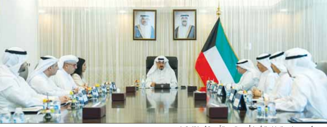
سمو رئيس مجلس الوزراء الشيخ أحمد عبدالله مترنسا الاجتماع

استكمال كل البيانات الفنية المتعلقة بالأراضي لاتخاذ الإجراءات بشأنها