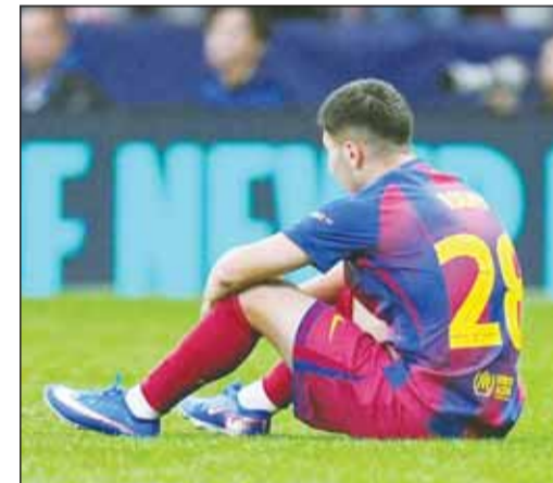
ألتيكو مدريد رقص على أحزان البرشا فبع الأبطال