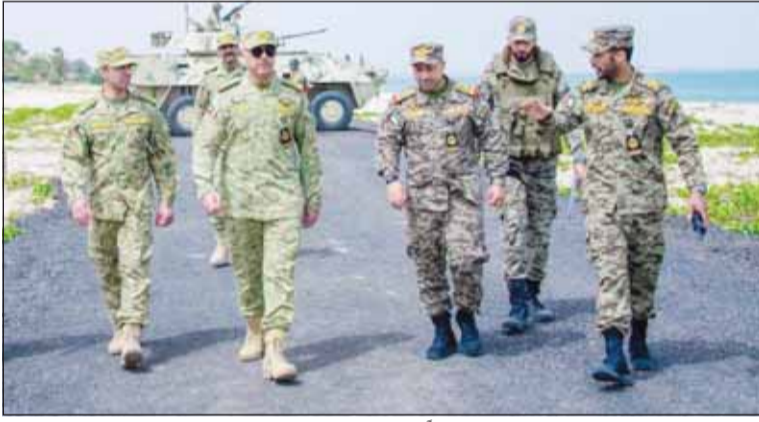
الفريق الركن حمد البرجس لدم تفقده عدداً من مواقع المسؤولية

تفقد عدداً من مواقع المسؤولية وكيل "الحرس" لـ "قوة الواجب" استمروا بأعلى جاهزية