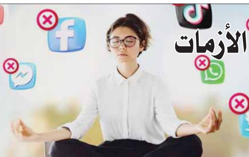
"الديتوكس الرقمي" ... يعزز الصحة ويعيد التوازن

□ السيف: خلق مساحة قبل النوم خالية من الهواتف والأخبار