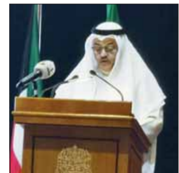
الرباح متحدثاً في اللقاء