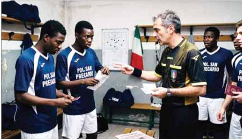
هجوم إعلامي على الحكم بربكاربو

شهدت ملاعب الدرجة الثانية في إيطاليا واقعة وصفتها الصحافة الإيطالية بـ"المفزرة"، بطلها حكم لقاء سان فيدينزيو وبوليس بورتيا سان بريكاريو. ووفقاً لتقرير صحيفة "غازيتا ديلو سبورت" الإيطالية، قام الحكم قبل انطلاق المباراة بإيقاف لاعبين من الفريق الضيف (من أصول أفريقية) مطالباً إياهم بإحضار "تصاريح الإقامة"، بحجة أن وثائقهم قد تكون "مزورة". وفي المقابل، لم يطلب الحكم الوثائق ذاتها من لاعب آخر "أبيض البشرة" يحمل جنسية مزدوجة، مما كشف عن تحيز لوني واضح. وأشارت الصحيفة إلى أن الحكم ليس "مسؤولاً قضائياً" ليطالب بتصاريح الإقامة، فدوره يقتصر على التحقق من بطاقات اللاعبين الصادرة عن الاتحاد وهوياتهم الشخصية، مؤكدة أن الاتحاد الإيطالي هو المسؤول مسبقاً عن مراجعة قانونية وضع أي لاعب قبل قيده. استحضرت الصحيفة في تقريرها كلمات الأسطورة "ليجان تورام" حول معاناته مع العنصرية، واصفة ما حدث في غرفة الملابس بأنه تحول إلى "نقطة تفتيش" أمنية لا علاقة لها بالرياضة. وطالبت "غازيتا" الاتحاد الإيطالي للكرة بالتدخل العاجل لتصحيح ما أسماه بـ"الخلل اللوني" لدى بعض الحكام الذين يربطون بين لون البشرة والشكوك الأمنية.