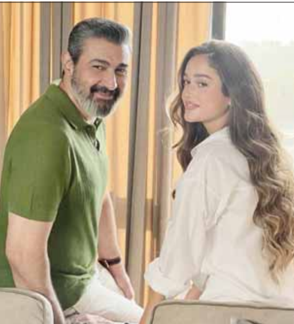
مع ياسر جلال