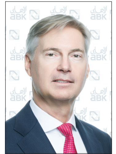
جيل جان فان دير تول