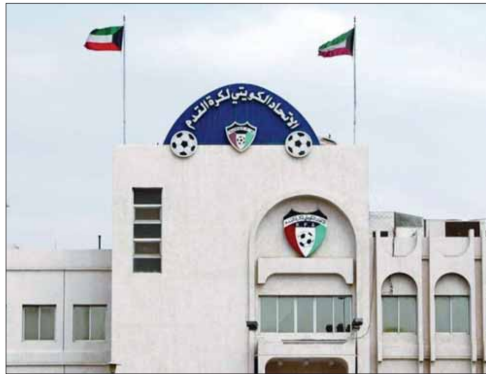
انتخابات صعبة لاتحاد كرة القدم يوم 20 مايو المقبل