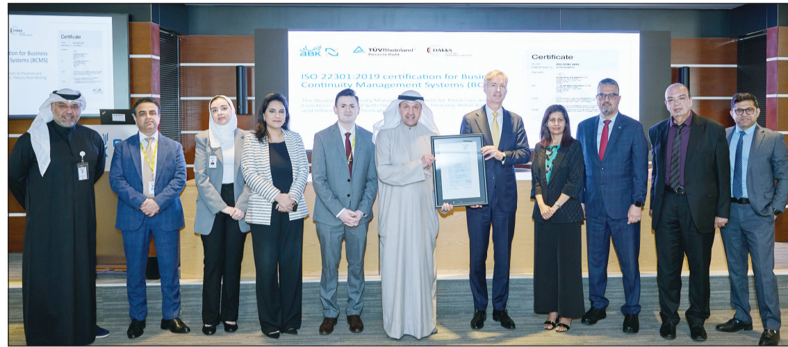
خلال الاحتفال بالحصول على الشهادة