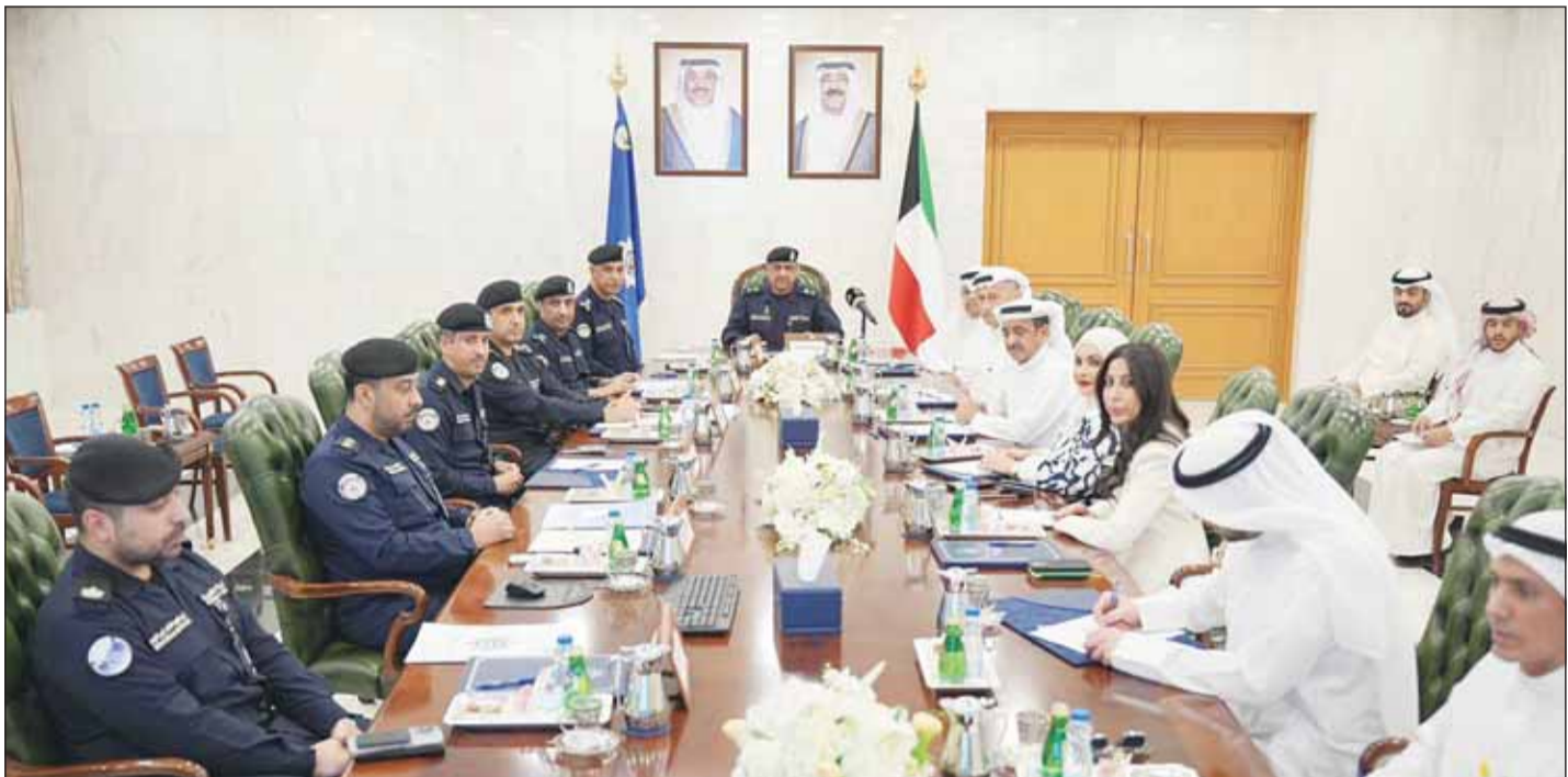
وكيل "الداخلية" اللواء عبدالوهاب الوهيب مترئسا الاجتماع التنسيق مع اتحاد وكلاء السيارات

إجراءات تنظيمية تراعي الجوانب الأمنية ومصصلحة الكويت