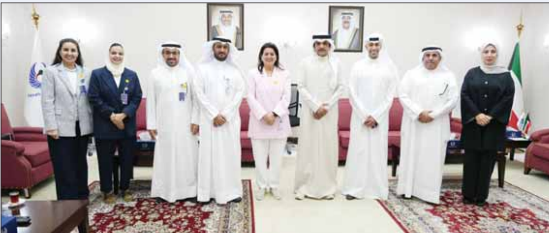
خلال استقبال رئيس جمعية الشفافية

"نزاهة" وديوان المحاسبة: تعزيز الشراكة وتكامل الأدوار الرقابية