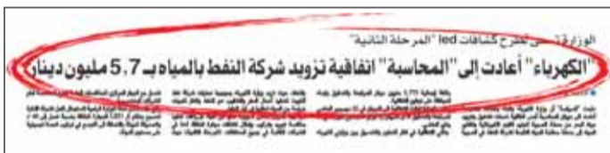
عقد السياسة الأربعاء 1 أبريل

أن الكلفة التقديرية للعقد الواحد تفوق الـ 75 ألف دينار ما يستوجب طرح العقد من خلال الجهاز وفقاً للقوانين المعمول بها. ووفقاً للإجراءات المتبعة ستطلب الوزارة من الجهاز طرح العقود أمام الشركات المصنفة التي ستقوم بدورها بتقديم الطعّات وقتها من قبل الجهاز وإطالتها للوزارة لدراستها وإعداد التوصية الفنية التي بناء عليها سيتم اتخاذ قرار الترسية على الطعّات الأفضل والمطابقة للاشتراطات الفنية ومن بين العقود المهمة المدرجة، عقد وصيانة وتحديث نظام المعلومات الجغرافية GIS الذي يشكل منصة فنية استراتيجية لإدارة الأصول والبنى التحتية لشبكات الكهرباء والماء والطاقة المتجددة.