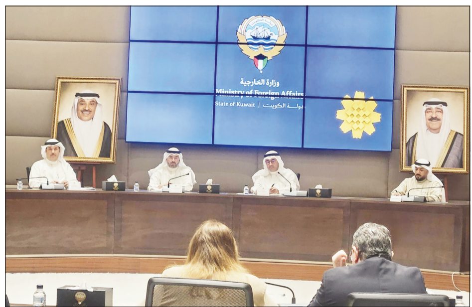
الشيخ المهندس حمود المبارك خلال الاجتماع مع سفراء دول الاتحاد الأوروبي

بحث رئيس الهيئة العامة للطيران المدني الشيخ المهندس حمود المبارك الصباح أمس مع سفراء دول الاتحاد الأوروبي المعتمدين لدى البلاد التعديلات التي تواجه القطاع وسبل تطويره. وقال الشيخ حمود الصباح، إن الاجتماع رفيع المستوى الذي نظّمته وزارة الخارجية تناول موضوعات مهمة تتعلق بقطاع الطيران المدني في الكويت والأوضاع المالية لمطار الكويت الدولي جراء العدوان الإيراني الآثم. وأضاف، إن الاجتماع تناول أيضاً سبل دعم شركات الطيران وتطوير بيئة النقل الجوي بما يعزز مكانة دولة الكويت كمركز إقليمي للنقل الجوي. وأوضح أن الاجتماع استعرض كذلك أبرز التعديلات والفرص في قطاع الطيران المدني وسبل تعزيز التعاون المشترك مع بما يخدم المصالح المشتركة ويدعم مسيرة التنمية الكويتية. وأعرب الصباح عن خالص الشكر والتقدير لوزارة الخارجية ومساعد الوزير لشؤون أوروبا السفير صادق معرفي على حسن الدعوة والتنظيم، مؤكداً أهمية مثل هذه اللقاءات في تعزيز أطر التعاون الدولي وتبادل الخبرات.