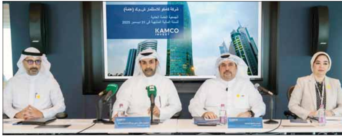
جانب من الجمعية العمومية

وعززت كامكو إنفست التزامها بمبادئ البيئة والمجتمع والحوكمة (ESG) ضمن عملياتها التشغيلية، مركزة على رفاهيّة الموظفين، والشركات المستدامة، وتمكين الشباب، واستمر برنامج التدريب للطلاب والفرجين لدينا في كونه ركيزة أساسية لهذه الاستراتيجية، حيث نما عدد المتدربين من 47 متدرباً في عام 2024 إلى 79 متدرباً في عام 2025.