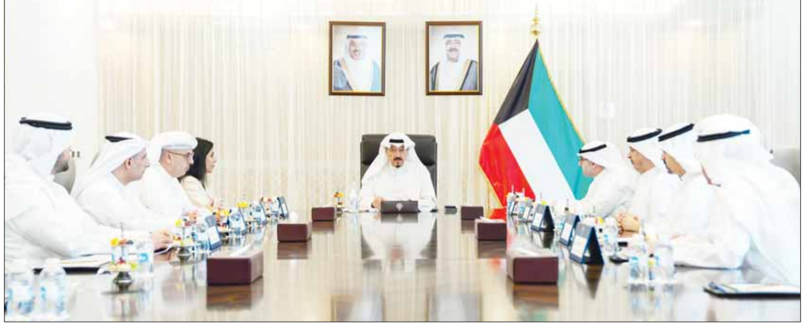
سمو رئيس مجلس الوزراء الشيخ أحمد العبدالله مترأس الاجتماع المخصص لبحث سبل تطوير البنية التحتية واللوجستية

اسمح QRcode لزيارة الموقع الإلكتروني: aljarallah.com