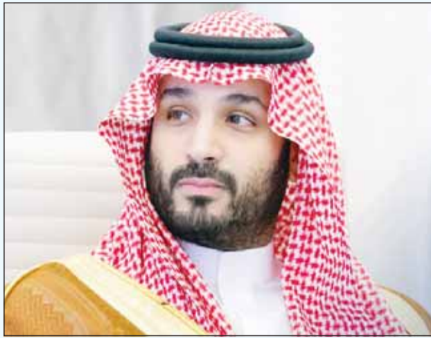
ولي العهد السعودي الأمير محمد بن سلمان