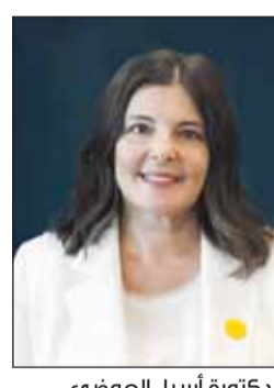
الدكتورة أسيل العوضي

أعلن مجلس الأمناء بالجامعة الأميركية في الكويت بقيادة الشبيخة ادانا ناصر الصباح عن تعيين الدكتورة أسيل العوضي رئيساً للجامعة، في خطوة تعكس مسار التطوير المؤسسي والنمو الأكاديمي. ويؤكد اختيار العوضي التزام الجامعة في استكمال مسيرة التميز في مجالات التعليم والبحث العلمي وخدمة المجتمع لما تتمتع به من خبرة أكاديمية وقيادية واسعة حيث كُرست مسيرتها المهنية لخدمة التعليم العالي والتربية. وعلى امتداد مسيرتها، أظهرت الدكتورة أسيل التزاماً راسخاً في تطوير العملية التعليمية والارتقاء بجودة التعليم وتمكين الشباب من