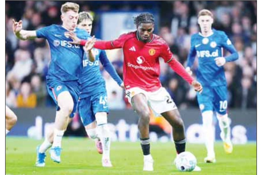
فوز مهم للشياطين الحمر في "البريميرليغ"

بقي تشيلسي غارقاً في دوامة الهزائم بخسارة جديدة على ملعبه ووسط جماهيره أمام مانشستر يونايتد بنتيجة صفر-1، أول من أمس، ضمن منافسات الجولة الثالثة والثلاثين من الدوري الإنكليزي الممتاز.