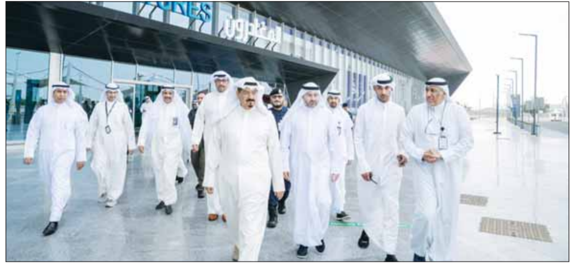
سمو الشيخ أحمد عبدالله والشيخ عبدالله العلي ورئيس "الطيران المدني" الشيخ حمود الصباح خلال الجولة التفقدية

سموه استمع ووزير الدفاع ورئيس "الطيران المدني" إلى شرح عن خطط إعادة التشغيل