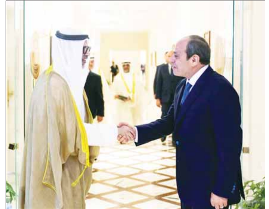
الرئيس السيسي مستقبلاً وزير الخارجية الشيخ جراح الجابر