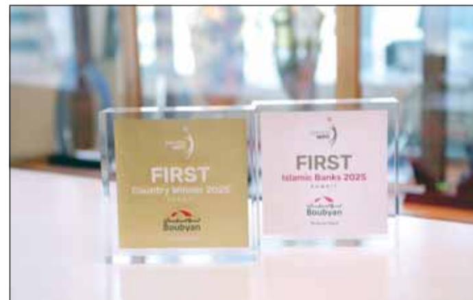
جوائز سيرفس هيرو لبنك بوبيان

ويعتمد مؤشر "سيرفس هيرو" في تقييمه على استفتاء يمتد على مدار عام كامل، يشمل آراء المستهلكين الذين يقومون بتقييم الشركات بناءً على تجربتهم الفعلية، وذلك وفق مجموعة من المعايير تشمل سلوك الموظفين، سرعة الاستجابة، ودقة تنفيذ العمليات، والتفاعل الإيجابي مع مختلف احتياجات العملاء، وهو ما ساهم في بناء بيئة عمل تدعم التميز في الخدمة وتعزز من جودة التفاعل مع