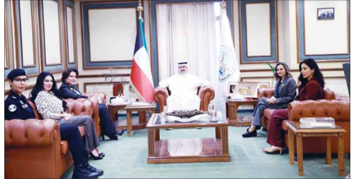
محافظ العاصمة الشيخ عبدالله سالم العليم لدم استقباله عضوات مجالس المحافظات

بين المحافظات يسهم بشكل مباشر في تدليل العقبات وسرعة إنجاز المشاريع الميدانية إلى جانب النهوض بمنظومة التعليم عن بُعد وتطويرها بما يتماشى مع الرؤية الطموحة للدولة في تحقيق التنمية الشاملة والمستدامة.