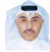
الشيخ م. فهد داود الصباح