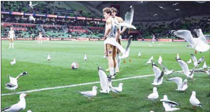
طيور النورس تغزو الملعب خلال المباراة

شهدت مباراة كرة قدم، لحظة أعادت الأذهان مشهد غزو الطيور للعالم، في فيلم الفريد هيتشكوك الشهير، "الطيور". ولم يكن ظهور النورس في ملعب ملبورن أمراً جديداً لجماهير كرة القدم في أستراليا، لكن ما حدث خلال مواجهة ملبورن فيكتوري ونيوكاسل جيتس في الدوري الأسترالي، الجمعة الماضية، أمراً مفاجئاً للعبدين من متابعي كرة القدم حول العالم. وشهدت المباراة، التي انتهت بالتعادل 2-2، تدخلًا لافتًا من أسراب النورس، التي غزت أرضية ملعب "أمي بارك"، خاصة في الدقائق الأخيرة، مما تسبب في إرباك سير اللعب، وعودة ما تتوقف مباريات كرة القدم عند تواجد حيوان أليف أو طائر في الملعب، لكن غزو أسراب النورس هو مشهد غير معتاد في كرة القدم.