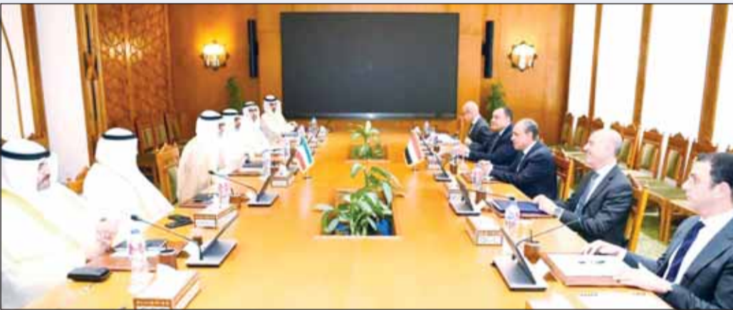
جانب من المباحثات بين الجانبين الكويتي والمصري