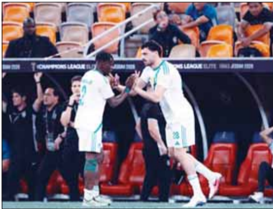
مواجهة قوية تنتظر الأهلية اليوم

يستعد فريق الأهلي السعودي، حامل لقب دوري أبطال آسيا للنخبة، لخوض تحد جديد في رحلة الدفاع عن لقبه، وذلك عندما يلقي نظيره الياباني فيسيل كوبي اليوم في الدور قبل النهائي من البطولة.