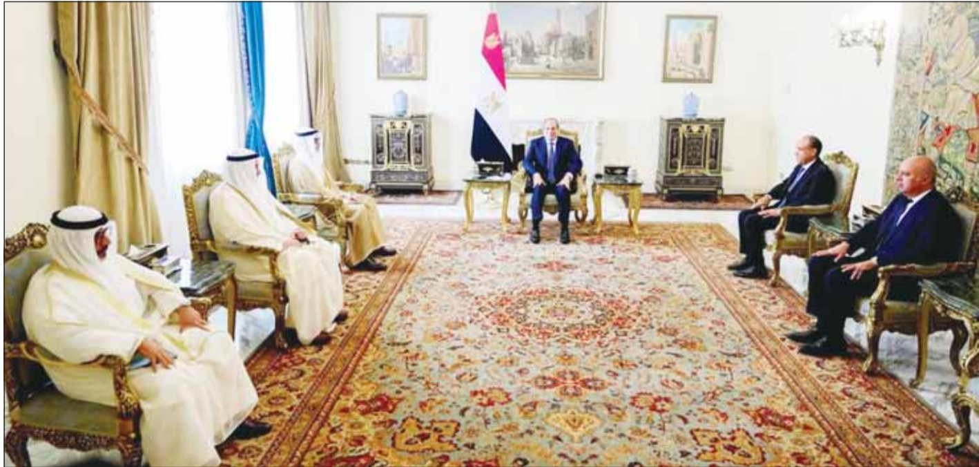
الرئيس السيسي خلال لقائه وزير الخارجية الشيخ جراح الجابر بحضور سفير الكويت غانم الغانم ومساعده الوزير لشؤون مكتب وزير الخارجية المفوض عبدالله العبيدي

وزير الخارجية: نشمن مواقف مصر التاريخية في دعم استقرار الكويت | نشيد بوقوف القاهرة الدائم إلى جانب أمن دول الخليج العربي | نتطلع إلى تكثيف التشاور والتنسيق مع مصر لصون أمن الدول العربية