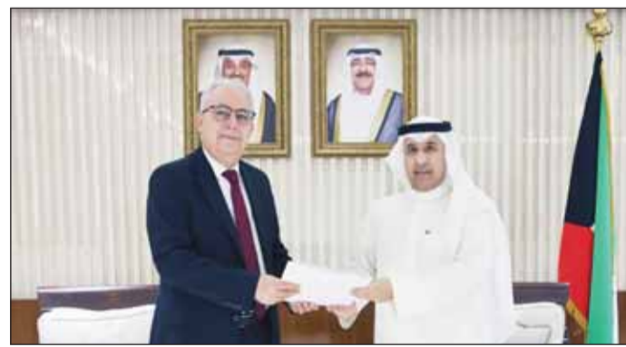
السفير عزيز الديحاني لادم تسلمه رسالة وزير الخارجية المغربي من السفير علي ابن عيسى

ونقل الشيخ جراح الصباح تحيات سمو الأمير الشيخ مشعل الأحمد وسمو ولي العهد الشيخ صباح خالد إلى الرئيس السيسي وتمنيات سموهما له بتمام الصحة وموفق العافية وللشعب المصري الشقيق المزيد من التقدم والازدهار.