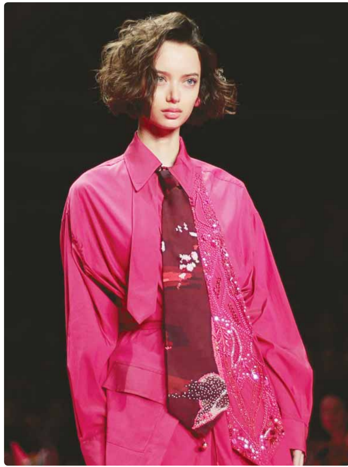
عارضة في زي من مجموعة إيزابيلا كاييتو الجديدة أثناء عروض أسبوع ريو دي جانيرو للموضة

القاهرة - وكالات، تحوّل حفل زفاف في محافظة البحيرة شمالي مصر إلى مأساة، إثر انهيار مقايئ شرفة منزل بالطابق الثاني، ما أسفر عن سقوط سبعة من المدعوين، وإصابةهم بجروح حرجة. وبدأت المأساة حين امتدح عدد من المدعوين داخل الشرفة لمتابعة مراسم الزفاف، إلا أن الشرفة لم تتحمل الثقل الزائد، ما أدى إلى انهيارها بشكل كامل