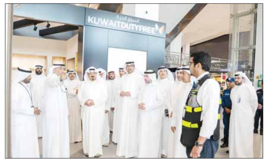
سمو رئيس الوزراء الشيخ أحمد عبدالله يطالع علمه جاهزية المرافق فيه المطار

تفقد سمو رئيس مجلس الوزراء الشيخ أحمد عبدالله، أمس، مطار الكويت الدولي برفقة وزير الدفاع الشيخ عبدالله العلي ورئيس الهيئة العامة للطيران المدني الشيخ حمود الصباح. وعقد سمو رئيس مجلس الوزراء في زيارته اجتماعا استمع خلاله إلى شرح من المسؤولين حول خطط إعادة التشغيل والإجراءات المتخذة لضمان انسيابية الحركة التشغيلية بما في ذلك جاهزية المرافق ومنظومات الأمن والسلامة إضافة إلى التدابير الاحترازية المعتمدة. كما قام بجولة تفقدية شملت صالات المغادرة والوصول ونقاط التفتيش الجمركي ومنظومة مناولة الأمتعة وأنظمة التشغيل والدعم الفني إضافة إلى الاطلاع على أفر التجهيزات في منطقة مدرج الطائرات والخدمات الأرضية. وأكد سموه ضرورة التنسيق الكامل بين الجهات المعنية لضمان جاهزية مطار الكويت الدولي للتشغيل وفق الخطط المعتمدة وبما يسهم في دعم حركة النقل الجوي في البلاد، مثنيا الجهود الكبيرة التي تبذلها الكوادر الوطنية والفنية في تجهيز المطار وضمان عودة حركة الملاحة الجوية بصورة طبيعية بعد فترة التوقف التي فرضتها الظروف الاستثنائية.