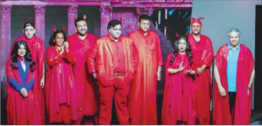
مسرحية "عيال ابلبس"