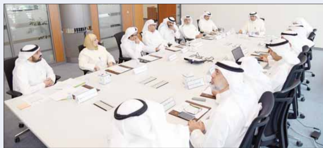
جانب من اجتماع اللجنة التنفيذية في "التطبيقي" برئاسة د.حسن الفحاح

بشكل فوري عبر قنواتها الرسمية المعتمدة، داعية جميع الطلبة إلى متابعة هذه القنوات بشكل مستمر، واستقاء المعلومات من مصادرها الرسمية، تجنباً لتداول الشائعات أو المعلومات غير الدقيقة. من جهة أخرى، دعت عمادة القبول والتسجيل بالهيئة الطلابية المقيدون بمقابل مادي إلى مراجعة العمادة لاستكمال إجراءات سداد الرسوم الدراسية الخاصة بالفصل الدراسي الثاني للعام (2025/2026)، وذلك ضمن إطار تنظيم العملية الأكاديمية وضمان استمرارية تسجيل الطلبة دون معوقات. وأوضحت العمادة أن فترة المراجعة تبدأ اعتباراً من غد الثلاثاء 21 أبريل وتستمر حتى الخميس 23 الجاري خلال ساعات الدوام المحددة من الساعة التاسعة صباحاً وحتى الثانية عشرة ظهراً. وبيّنت أن استقبال الطلبة سيكون في مقر عمادة القبول والتسجيل - مراقبة المسجل العام - في مبنى رقم (2) بالدور الثاني في منطقة العديلية، شديدة على أهمية الالتزام بالمواعيد المحددة لتفادي أي تأخير قد يترتب عليه إيقاف التسجيل أو تعطيل الإجراءات الأكاديمية. وأكدت العمادة أن هذه الخطوة تأتي في سياق الحرص على تسهيل إجراءات الطلبة وتنظيم آلية سداد الرسوم، بما يضمن انسيابية العملية التعليمية واستكمال متطلبات الفصل الدراسي وفق اللوائح المعتمدة، داعية جميع المعنيين إلى المبادرة بالمراجعة خلال الفترة الممتدة.