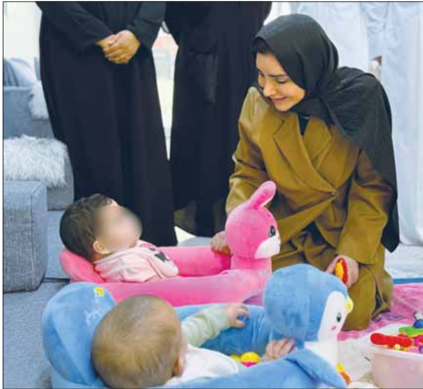
الوزيرة الحويلة لمدى تفقدها دار الاطفال