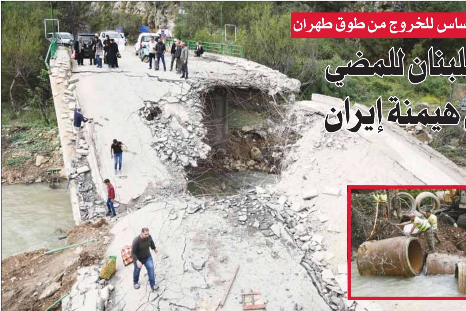
نارجون لبنانيون يعبرون جسراً مدمراً سبباً على الأقدام أثناء عودتهم أمس إلى منازلهم وفيه الإضرار لجود الجيش اللبناني خلال قيامهم بإنشاء جسر مؤقت لتسهيل عودتهم إلى قرية طير فلسايه أمس

وتحديداً على صعيد تنفيذ حصرية السلاح، وأشارت المعلومات إلى أنه كان للسعودية دور أساسي في التوصل إلى وقف إطلاق النار في لبنان، من خلال المشاورات المكثفة التي جرت على خط بيروت - الرياض - واشنطن، سعياً لوضع حد لاستمرار الاعتداءات الإسرائيلية، على أن تستمر المملكة في جهودها من أجل أن يكون وقف النار نهائياً وشاملاً في مرحلة لاحقة، مع انطلاق قطار التفاوض. ووسط هذه الأجواء، تفاعلت الانتقادات التي وجهها مستشار المرشد الإيراني علي أكبر ولايتي للرئيس الشهيد رفيق الحريري وتجاره السياسي، حيث رد "فكار المستقبل" على ولايتي، فاعتبر أن ما صدر عن الأخير يظهر رفضاً لنهج الاعتدال الوطني اللبناني والعربي الذي تبناه تيار الحريري، مشدداً على أن هذا النهج قام على رفض الانجرار إلى مشاريع الفتنة ورفض أي محاولات لمصادرة القرار اللبناني أو إدخاله في صراعات إقليمية، وأشار للتيار إلى أن لبنان دفع أثماناً باهظة نتيجة التدخلات الخارجية في شؤونه، معتبراً استعادة الدولة قرارها السيادي في التفاوض تمثل خطوة أساسية نحو تثبيت الاستقرار بعيداً عن أي منطق وصاية، ومؤكداً أن تيار الحريري مستمر في التمسك بثوابته، وفي مقدمها حصرية السلاح بيد الدولة، وبسبب سلطتها على كامل الأراضي اللبنانية وانكارها قرار السلم والحرب تحت سقف "لبنان أولاً".