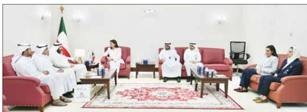
مجلس إدارة "نزاهة" مستقبلاً رئيس وأعضاء جمعية "المحاسبين"

أدوات الرقابة المالية الحديثة. وأضافت الرقابية، والعمل على تبادل الخبرات أن الجانبين أكداً خلال الاجتماع أهمية إطلاق مبادرات نوعية تسهم في الوقاية من الفساد وتعزيز الثقة في البيئة التكامل بين المؤسسات المهنية والجهات