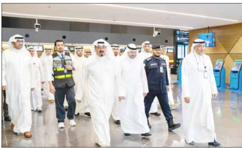
جانب من الجولة

□ جهود كبيرة تبذلها الكوادر الفنية لتجهيز المطار وعودة حركة الملاحة □ تنسيق كامل بين الجهات المعنية لضمان تشغيل المطار وفق الخطط