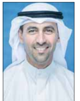
نواف السعود الصباح

في رسالة القيادات النفطية للعاملين في "مؤسسة البترول" والشركات التابعة أكد الرئيس التنفيذي لمؤسسة البترول الكويتية الشيخ نواف السعود الصباح أن الكويت تعرضت لاعتداءات إيرانية آثمة على مدى ستة أسابيع نتيجة خلافات ليس للكويت أي طرف فيها مثنياً في الوقت ذاته من خلال فيديو بثته المؤسسة على حسابها في موقع "إكس" على دور عمال القطاع خلال أزمة الحرب قائلا: "تسلم يمانكم". ومن جانبه، قال العضو المنتدب للموارد البشرية والخدمات الشاملة هشام الرفاعي إن مرحلة الحرب وتداعياتها اختبرت صبر العاملين في القطاع حيث واجهنا تحديات من واقع العمل.