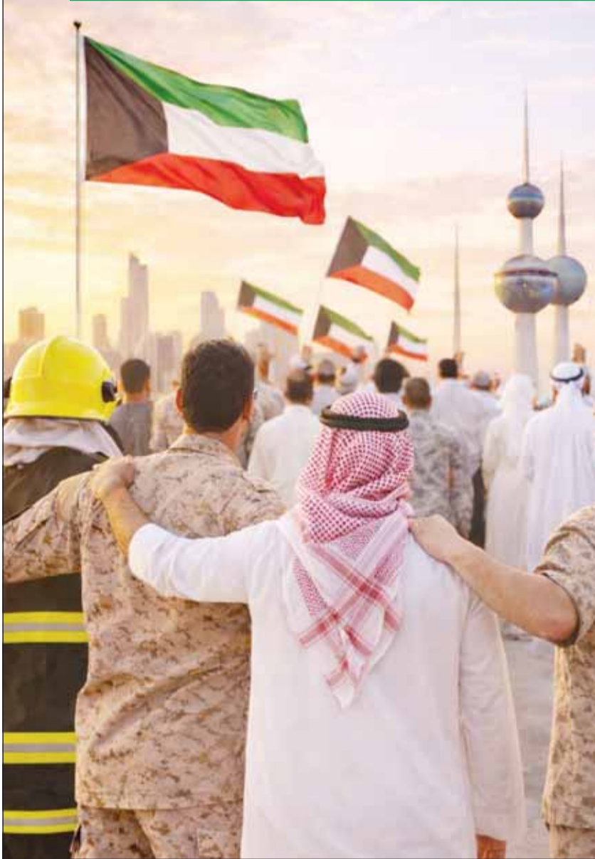
صورة مولدة بالذكاء الاصطناعي