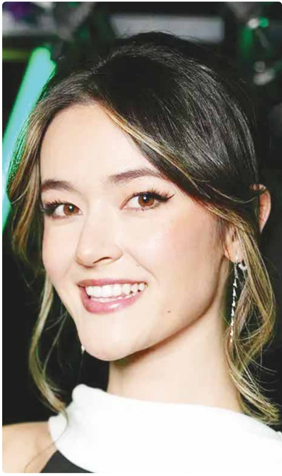
المغنية البريطانية جيد سكوت خلال حضورها حفل توزيع جوائز "بافتا" في لندن