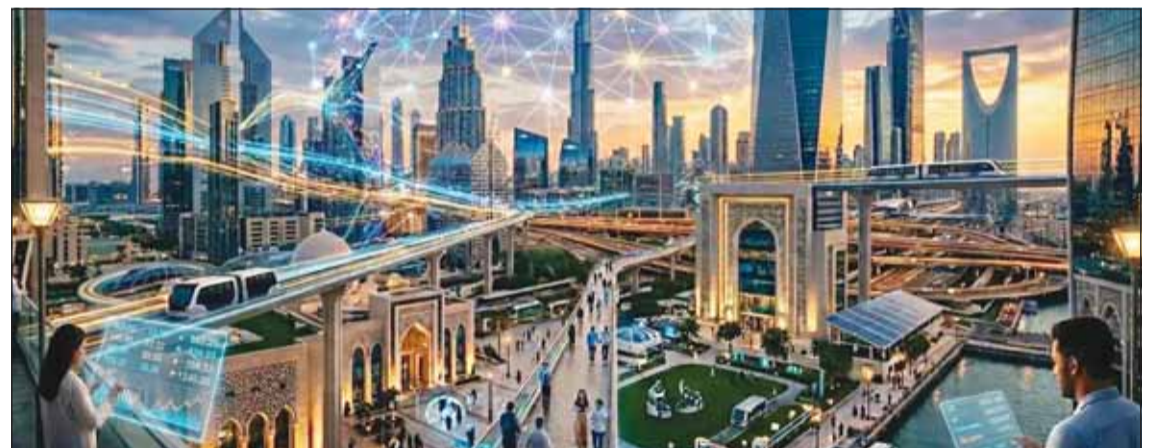
صورة مولدة بالذكاء الاصطناعي