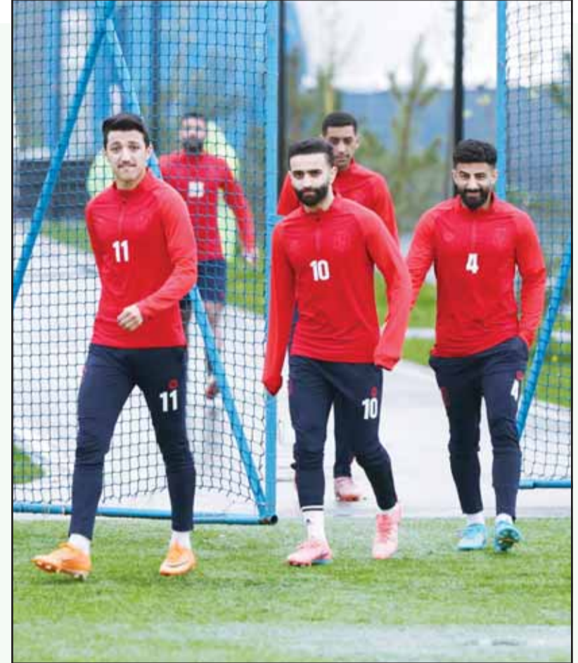
لاعبو الكويت أمام تحد جديد