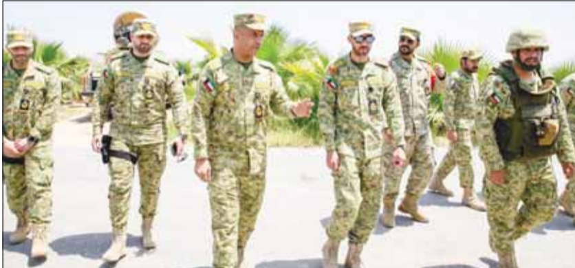
المعاونون للشؤون المالية في الحرس الوطني اللواء رياض طواربي لدى تفقده مواقع المسؤولية

وتقدير قيادة الحرس الوطني، رجال الحرس في تأمين المواقع مشيداً بالجاهزية العالية معرباً عن اعتزازها بالدور الحيوية بمختلف مواقع والروح المعنوية لمنتمسي الوطني الكبير الذي يؤديه ووصدات الحرس الوطني، الحرس.