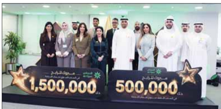
صورة جماعية تجمع الإدارة التنفيذية وفريق البنك خلال السحوبات