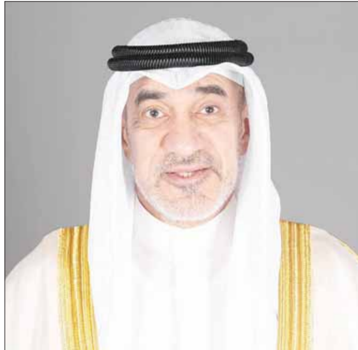
النائب الأول ووزير الداخلية الشيخ فهد اليوسف