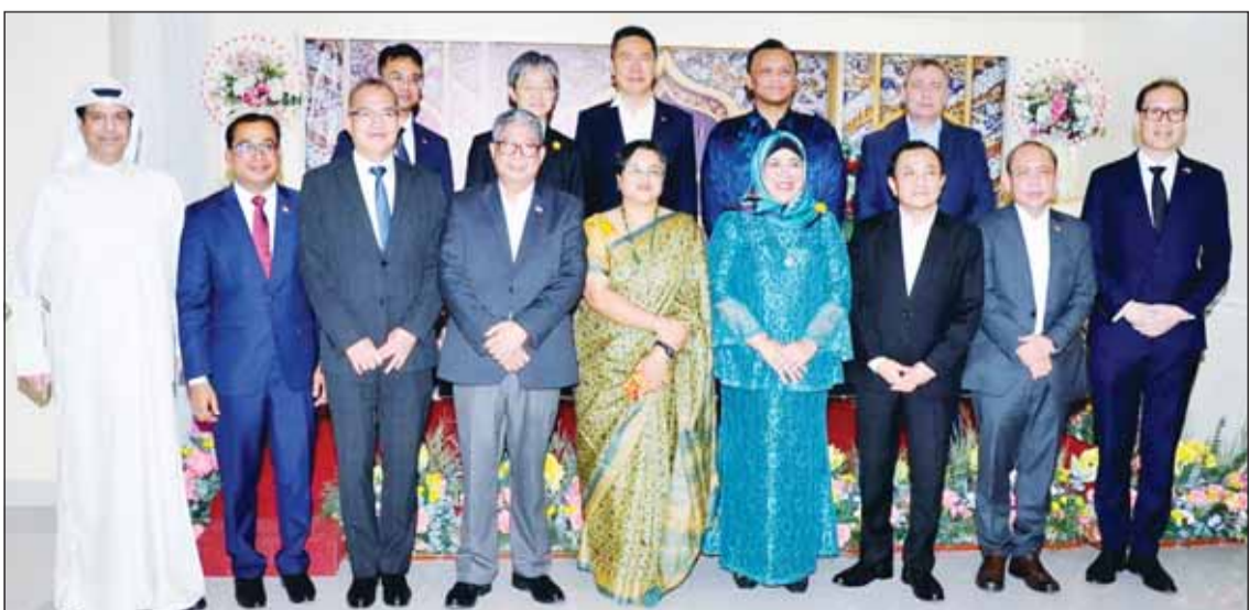
(تصوير - سامر شقير)