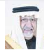
عبدالله بن محمد آل الشيخ