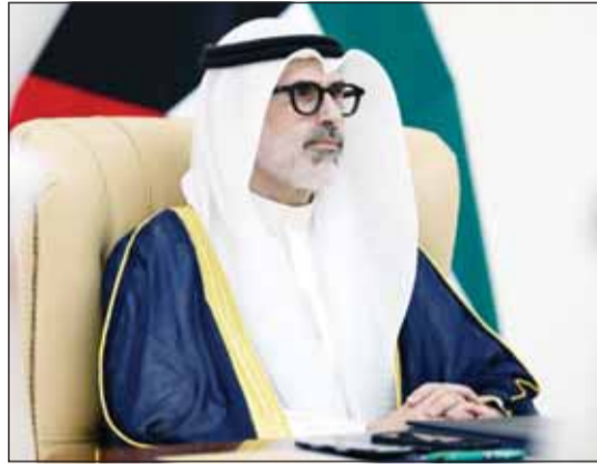
الشيخ جراح الجابر

ممثلاً سمو أمير البلاد الشيخ مشعل الأحمد، ترأس وزير الخارجية الشيخ جراح جابر الأحمد، أول من أمس الجمعة، وفد دولة الكويت المشارك في أعمال الاجتماع الدولي حول حرية الملاحة في مضيق هرمز، الذي انعقد برئاسة مشتركة من الرئيس الفرنسي إيمانويل ماكرون ورئيس وزراء بريطانيا كير ستارمر، وبمشاركة رفيعة المستوى من دول شقيقة وصديقة، ونوقشت فيه، عبر تقنية الاتصال المرئي والمسموع، تداعيات الوضع القائم في المضيق. وفي كلمة دولة الكويت، نوّه الشيخ جراح الجابر بالجهود المقدرة للجمهورية الفرنسية وللمملكة المتحدة، ولجميع الشركاء الدوليين، والرامية إلى تهيئة بيئة آمنة للملاحة البحرية عبر مضيق هرمز، اتساقاً مع المصالح الاقتصادية الدولية المشتركة التي تقتضي تسريع تعافي سلاسل التوريد وأمن الطاقة والغذاء. ودد وزير الخارجية موقف دولة الكويت الثابت إزاء وضع مضيق هرمز، كهمر مائي دولي طبيعي وفق ما رسخته قواعد القانون الدولي واتفاقية الأمم المتحدة لقانون البحار للعام 1982، والتي تكفل حق المرور العابر، مؤكداً رفض الكويت أي تدابير أحادية، أو محاولات لاستحداث أو فرض وتكريس وضع قائم جديد يخالف الأطر القانونية الدولية. وشدد الشيخ جراح الجابر على ضرورة العمل بمسارات متوازنة لتكثيف الجهود الدبلوماسية الساعية لضمان حرية وأمن وسلامة الملاحة البحرية عبر مضيق هرمز، إلى جانب ضمان امتثال الجانب الإيراني لقرار مجلس الأمن 2817، والتزامه التام بقواعد وأحكام القانون الدولي واتفاقية الأمم المتحدة لقانون البحار.