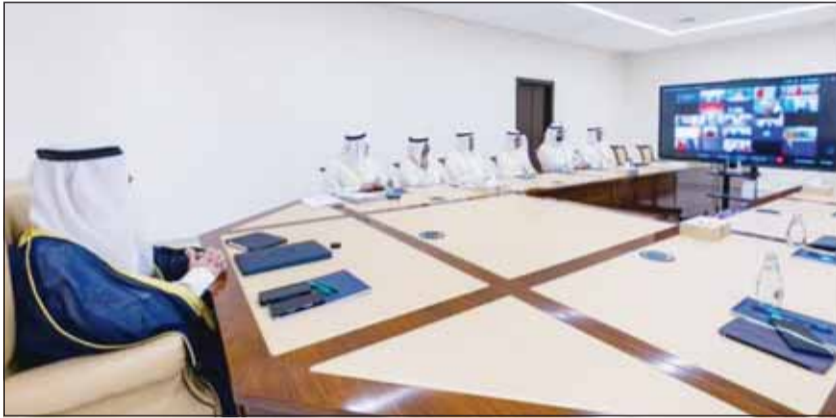
مشاركة الكويت في الاجتماع الدولي حول حرية الملاحة في مضيق هرمز

جراح الجابر: نثمن جهود الشركاء الدوليين لتأمين الملاحة في المضيق