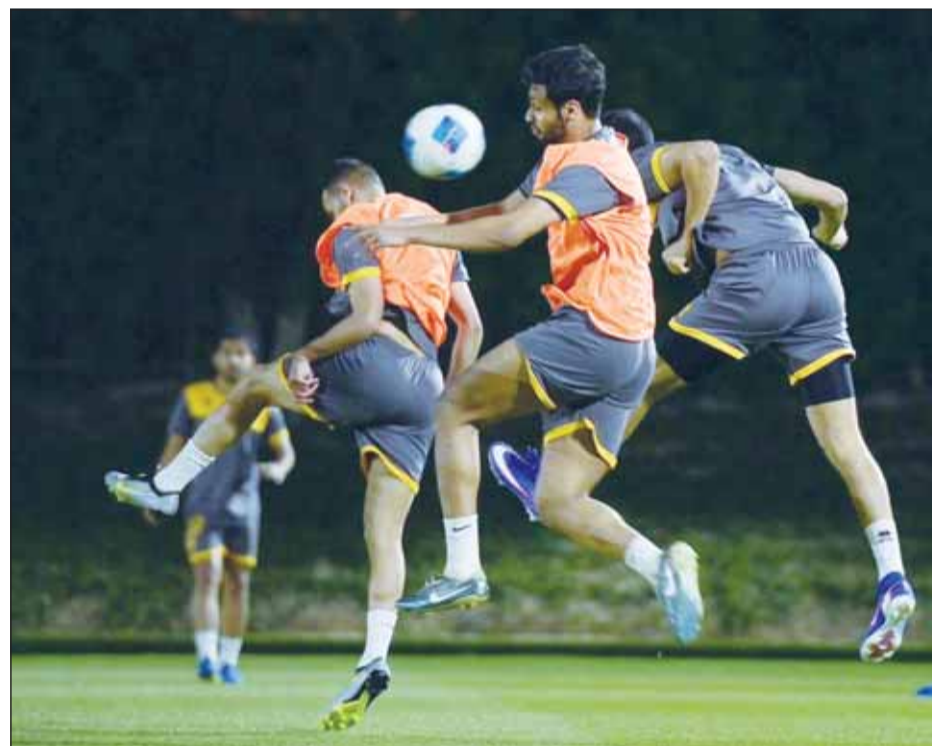
جانب من تدريبات القادسية في الدوحة

ويطمح "الأصفر" إلى استثمار خبرته في البطولة، بعدما حجز مقعده في نصف النهائي برصيد 10 نقاط، عقب فوز حاسم في الجولة الأخيرة، وهو ما يمنحه دفعة قوية قبل مواجهة الريان، كما يسعى إلى المنافسة على اللقب، وعدم تكرار ما حدث الموسم الماضي، بعد تسر