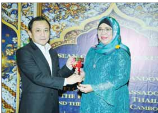
السفيرة الإندونيسية تسلم سفير بروناي برئاسة "آسيان"

تنظيمية وشهر رمضان والتطورات الإقليمية، معربة عن أملها في استكمالها خلال الفترة المقبلة تحت رئاسة بروناي. وأعربت السفيرة الإندونيسية عن ثقتها بقدرة بروناي دار السلام على قيادة اللجنة نحو مزيد من النجاحات، مؤكدة دعمها الكامل للرئاسة الجديدة.