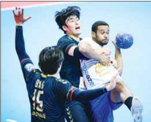
من لقاء الأزرق واليابان بكأس آسيا الأخيرة