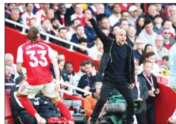
غوارديولا يؤكد حسم اللقب إذا خسر اليوم

أقر بيب غوارديولا بأن مساعي مانشستر سيتي للفوز بلقب الدوري الإنكليزي الممتاز ستنتهي إذا خسروا أمام أرسنال في المواجهة الحاسمة التي ستجمع بينهما اليوم بين الفريقين صامحيي المركزين الأول والثاني. تقلص الفارق الذي يتصدر به أرسنال الترتيب إلى ست نقاط بعد هزيمته المفاجئة على أرضه أمام بورنموث، تلاها فوز مانشستر سيتي الحاسم على تشيلسي في عطلة نهاية الأسبوع الماضي، مع وجود مباراة موبلة لفريق غوارديولا.