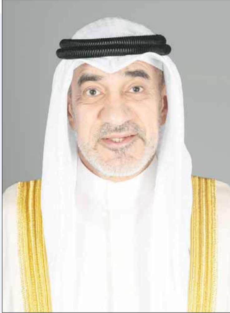
النائب الأول وزير الداخلية الشيخ فهد اليوسف