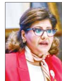
الشيخة جواهر الدعيج

بقانون رقم (11) لسنة 1996 مضية أن دولة الكويت ناقشت ثلاثة تقارير دورية أمام اللجنة أقرها في سبتمبر 2021 حيث تلقت زمرة من التوصيات التي سيبنى عليها إعداد التقرير الدوري الرابع.