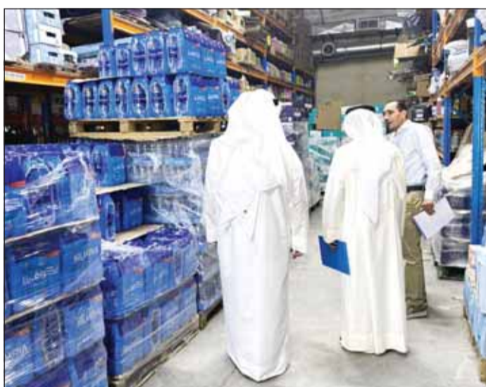
جولة علم أحد الأسواق