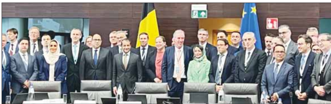
السفير نواف العنزي خلال الاجتماع التاسع للتخالف العالمي في بروكسل

دعم تنفيذ حل الدولتين، مؤكدا ضرورة الالتزام بما ورد في إعلان نيويورك لإنهاء النزاع في غزة وتحقيق سلام عادل وشامل. كما أعاد التأكيد على دعم دولة الكويت للحكومة الفلسطينية وضرورة تمكينها من الاضطلاع بمسؤولياتها بشكل كامل وفعال في جميع الأراضي الفلسطينية المحتلة بما في ذلك قطاع غزة والعمل على إعادة توحيده مع الضفة الغربية بما فيها القدس الشرقية.