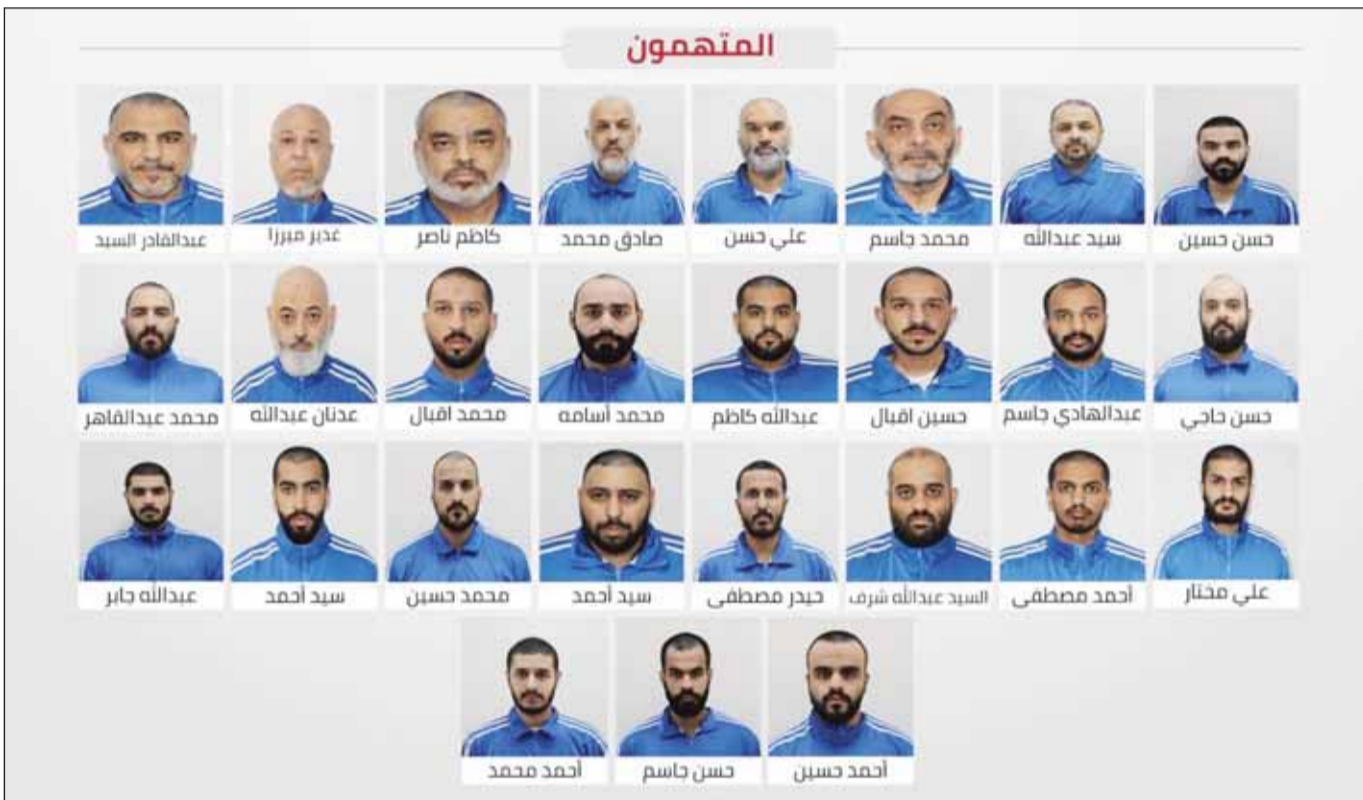
صورة نشرها جهاز أمن الدولة الإماراتي لأعضاء التنظيم الإرهابي المرتبط بإيران والذي تم تفكيكه والقبض على عناصره أمس

بحزم لأي تهديدات تمس الأمن العام، داعيا المواطنين والمقيمين إلى الإبلاغ عن أي نشاط مشبوه عبر القنوات الرسمية بما يعزز منظومة الأمن والاستقرار. أكد وزير الصناعة والتكنولوجيا المتقدمة في الإمارات سلطان الجابر أن الاقتصاد العالمي لا يتحمل المزيد من عدم اليقين، مشدداً على أن مضيق هرمز لا يمكن أن يستمر في العمل تحت التهديد، وقال الجابر على منصة "إكس" إنه خلال 50 يوماً على إغلاق المضيق، تم تعطيل نحو 600 مليون برميل من النفط، مضيفاً أن الضغط تصاعد على الغاز الطبيعي المسال ووقود الطائرات والأسمدة والمواد الأساسية التي يعتمد عليها العالم، محذراً من أن كل برميل مفقود يرفع الفواتير على الأشخاص العاديين في كل مكان، مشدداً على أن الاقتصاد العالمي لا يتحمل مزيداً من عدم اليقين وأنه لا يجوز استخدام المضيق للتهديد، وتابع قائلاً "علينا تسمية الأشياء بأسمائها، فالدفع مقابل المرور الآمن ابتزاز"، مؤكداً أن مضيق هرمز ممر عالمي يجب أن يعود إلى العالم كما كان تماماً. من جانبه، أكد المستشار الديبلوماسي لرئيس الإمارات أنور قرقاش أن بلاده لن تعود إلى الوتيرة السابقة في العلاقات، مؤكداً أنه لا يمكن القبول بالاعتقان والتهديد والعوان كواقع جديد في الشرق الأوسط، قائلاً إن العدوان الإيراني على دول وشعوب الخليج العربي وتدابيراته يمثل محور اهتمام الإمارات، مشدداً على ضرورة المراجعة والمصارحة وتقديم ضمانات قبل أي عودة لمسار العلاقات، معتبراً منتدى أنطاليا للديبلوماسية بتركيّا فرصة لفهم ملامح المرحلة الجديدة وتغيرات المشهد السياسي باعتبارها أول ملقّي بعد الحرب.