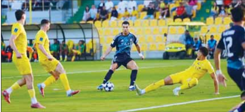
الدون سجل فيه شبكات النصر الإماراتية

سجل كريستيانو رونالدو قائد النصر السعودي في 25 بطولة مختلفة حول العالم طوال مسيرته وذلك بعدما افتتح أهداف فريقه في شبكات الواصل الإماراتي ضمن ربع نهائي دوري أبطال آسيا 2 أول من أمس.