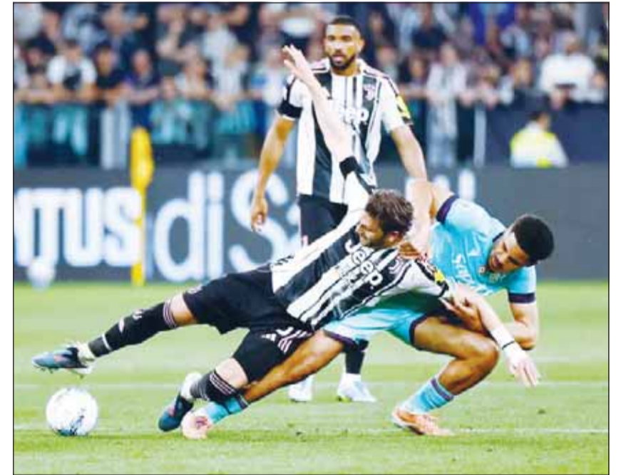
السيدة العجوز تعبر بولونيا بالكالتشيو

عزز يوفنتوس آماله في بلوغ منافسات دوري أبطال أوروبا لكرة القدم الموسم المقبل، وذلك بعد فوزه على ضيفه بولونيا 2-صفر أول من أمس ضمن منافسات الجولة 33 من الدوري الإيطالي لكرة القدم. وتقدم يوفنتوس عن طريق جوناثان ديغيد ثم أضاف كيرفين تورام الهدف الثاني في الدقيقة 57. ورفع يوفنتوس رصيده إلى 63 نقطة في المركز الرابع، بينما يملك بولونيا 48 نقطة في المركز الثامن.