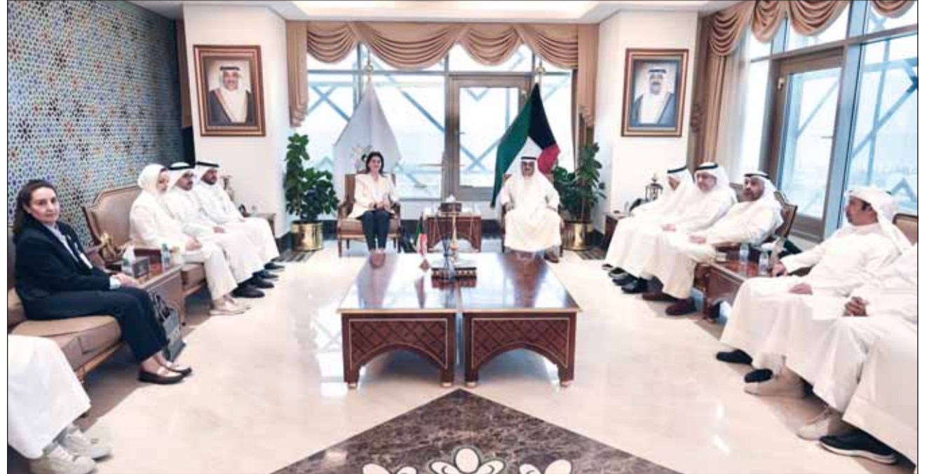
النائب العام سعد الصفران مستقبلاً رئيسة "نزاهة" رنا الفارس

وتعزيز دقة التحريات، والاستفادة من أفضل الممارسات لدى الجانبين. وأضافت أنه تم التوافق على تعيين ضابط اتصال من كل جهة لتسهيل التنسيق المباشر، ومتابعة سير البلاغات المحالة من الهيئة إلى النيابة العامة، والعمل على تدليل أي معوقات إجرائية قد تؤثر نظرها، إلى جانب التنسيق الدوري بشأن حالة البلاغات ومآلاتها.