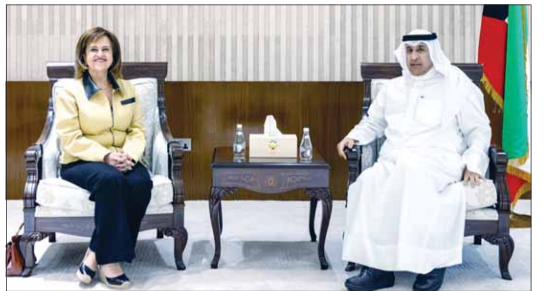
نائب وزير الخارجية بالوكالة السفير عزيز الديحاني مستقبلاً نسرين ربيعان

التقى نائب وزير الخارجية بالوكالة السفير عزيز الديحاني، أمس، ممثلة المفوضية السامية للأمم المتحدة لشؤون اللاجئين في دولة الكويت نسرين ربيعان بمناسبة انتهاء فترة عملها.