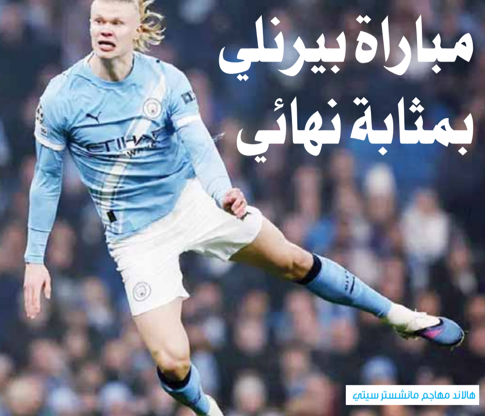
هالاند مهاجم مانشستر سيتي