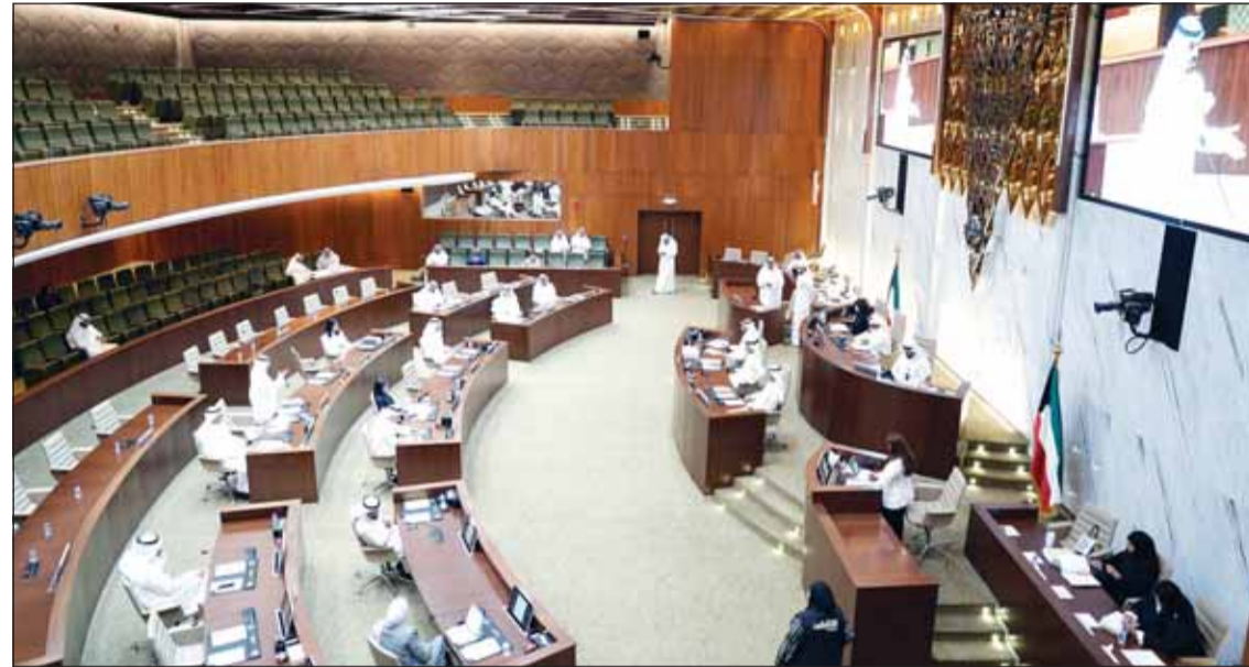
جانب من الجلسة

مقترح تنظيم الحركة المرورية في مقبرة الصليبخات إلى لجنة العاصمة بالمجلس | تعديل قرار تطوير شاطئ العقيلة وإلزام المستثمر تقديم دراسة مرورية تفصيلية | تخصيص مسار لخطي مياه الصرف من موقع محطة ضخ الجبراء الجديدة إلى "كبد الشمالية"