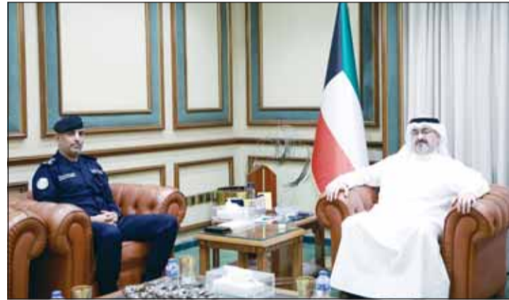
محافظ العاصمة الشيخ عبدالله سالم العلي مستقبلاً العميد (حقوقية) عبدالعزيز العمر

استقبل محافظ العاصمة الشيخ عبدالله سالم العلي في مكتبه امس مدير أمن المحافظة العميد (حقوقية) عبدالعزيز العمر، بحضور مدير إدارة العلاقات العامة وخدمة المواطن بمحافظة العاصمة المقدم تركي البيدان. شهد اللقاء بحث عدد من الموضوعات المتعلقة بالإجراءات المتخذة لتعزيز الاستجابة السريعة ورفع مستوى الجاهزية الأمنية في كافة مناطق المحافظة، بما يسهم في حماية المواطنين والمقيمين ودعم الأمن والاستقرار في العاصمة. وأكد المحافظ أن الأمن الركيزة الأساسية في مسيرة التنمية الشاملة، مشيراً إلى أن اليقظة الأمنية والتفاني في العمل الذي يجسده رجال الأمن يسهم في فرض سيادة القانون وحماية الممتلكات العامة والخاصة. وأشاد بالجهود الأمنية المتواصلة والأداء الاعترافي لرجال الأمن في التصدي الحازم