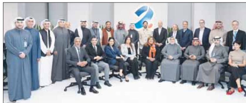
صورة جماعية لموظفي البنك