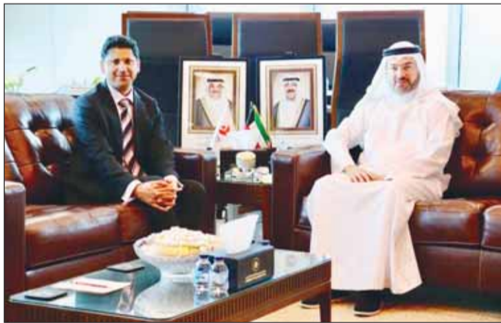
الشيخ حمود المبارك مستقبلاً سفير المملكة المتحدة قدسيه رشيد

بحث رئيس الهيئة العامة للطيران المدني الشيخ حمود المبارك الصباح، أمس، مع سفير المملكة المتحدة لدى الكويت قدسي رشيد سبل تعزيز التعاون الثنائي بين البلدين لا سيما في مجال الطيران المدني. وقالت هيئة "الطيران المدني" - في بيان صحافي - إن اللقاء تناول استعراض أوجه التعاون المشترك بين الجانبين، وبحث سبل تطوير العلاقات الثنائية في المجالات المرتبطة بقطاع النقل الجوي بما يسهم في دعم الشراكة بين البلدين الصديقين. وأضافت، تم كذلك تبادل وجهات النظر حول تعزيز التعاون في مختلف مجالات الطيران المدني وتطوير آفاق التنسيق المشترك بما يخدم مصالح البلدين ويدعم نمو قطاع النقل الجوي.