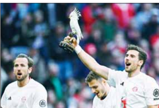
تمثال الببغاء المسروق من أحد المطاعم

ورغم أن اللاعبين أعادوا التمثال لاحقاً إلى المطعم، إلا أن المطعم قرر إهدائه للنادي للمساهمة في تحقيق النجاحات، ليحتول التمثال إلى نوع من التهمة التي، بحسب صحيفة "بيلد"، ستفرج "للتغز" في كل مرة يحقق فيها النادي لقباً.