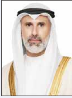
الشيخ جابر الجابري

أجرى وزير الخارجية الشيخ جراح الجابري، أمس، اتصالاً هاتفياً مع نائب رئيس مجلس الوزراء وزير خارجية دولة الإمارات العربية المتحدة الشقيقة الشيخ عبدالله بن زايد آل نهيان.