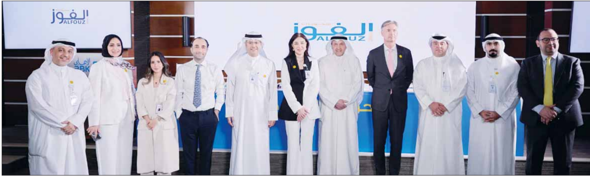
لقطة جماعية على هامش السحبوبات