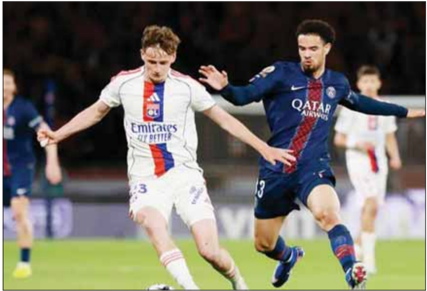
ليون فرمل سان جيرمان بالدوري

أشعل أولمبيك ليون صراع المنافسة على بطولة الدوري الفرنسي بعدما هزم مضيغه باريس سان جيرمان بهدفين مقابل هدف في الجولة 30 من عمر المسابقة أول من أمس.