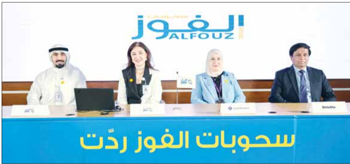
ممثلو البنك وشركتي التدقيق الخارجي خلال السحبوبات

أحدث التقنيات في السحبوبات مع مواصلة الابتكار وتقديم أفضل المنتجات المصرفية باستمرار من أجل تلبيّة تطلعات جميع الشرائح لدينا".