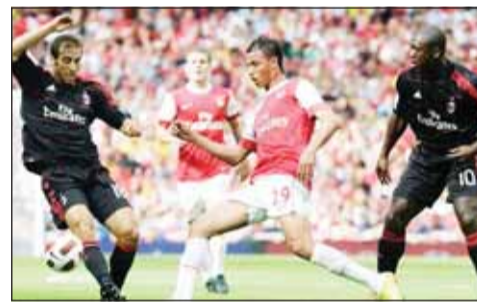
فلاميني أغنى لاعب كرة قدم

وفي الوقت نفسه، تعززت سمعة شركة "جي إف بيوكيمكالز" في مجال الاستدامة بفضل إنتاجها الرائد لمضخ الليفولينيك، الذي يقلل انبعاثات ثاني أكسيد الكربون الناتجة عن تصنيع منتجات مثل المنظفات بنسبة تصل إلى 80٪.