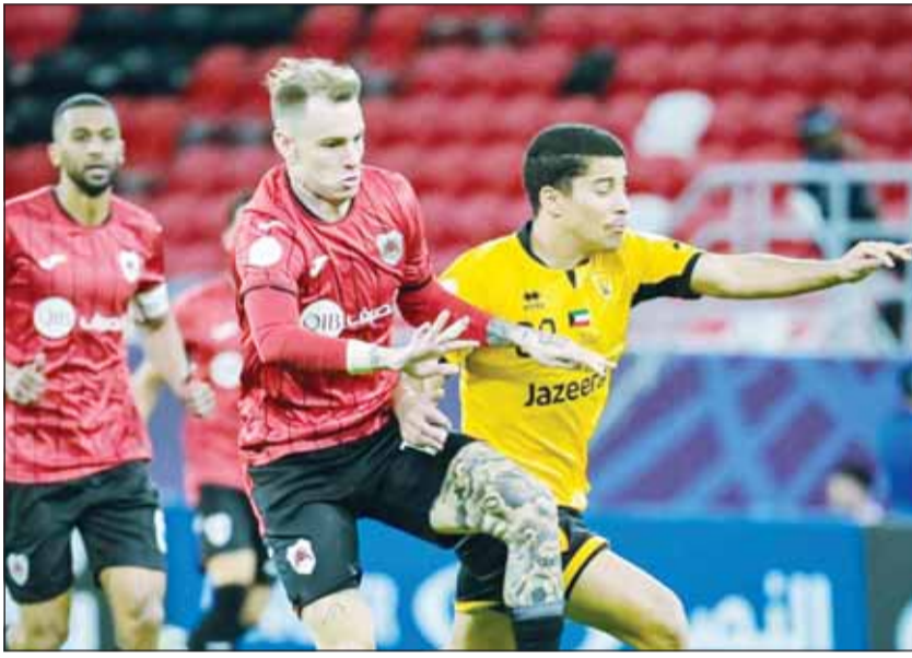
القادسية لم يقدم الأداء المطلوب أمام الريان

المواجهة بتفاصيل صغيرة داخل أرضية الملعب.