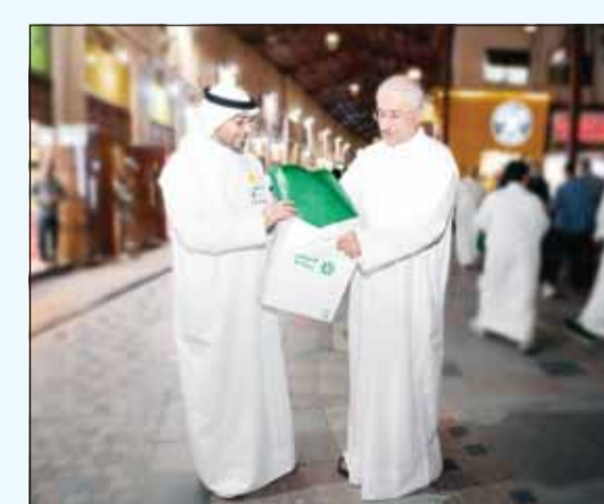
جانب من حملة توزيع الأعلام

أعلن البنك التجاري الكويتي دعمه ومشاركته في الحملة الوطنية "علم الكويت فوق كل بيت" التي أطلقها مركز العمل التطوعي برئاسة الشبيخة أمثال الأحمد الجابر الصباح بهدف تعزيز قيم الانتماء الوطني وترسيخ رمزية العلم الكويتي في نفوس المواطنين والمقيمين، وذلك في إطار التزامه بالمسؤولية الاجتماعية والوطنية. وجاءت مشاركة "التجاري" في هذه المبادرة الوطنية من خلال توزيع أعلام الكويت على المارة في مواقع حيوية، حيث حرص فريق البنك على مشاركة الجمهور لنشاط وطني مميزة عكست مشاعر الفخر والاعتزاز بالهوية الكويتية وسط تفاعل واسع من مختلف فئات المجتمع.