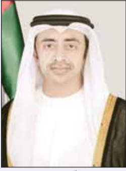
الشيخ عبدالله بن زايد