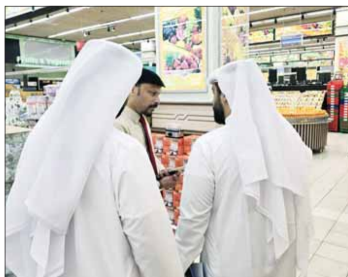
موظفو الجهاز يتابعون حركة السوق أولاً بأول

الاقتصادي والتحليل المستمر تشكل منظومة عمل متكاملة، تهدف إلى تعزيز الجاهزية الموسمية، ورفع كفاءة المتابعة، ودعم سرعة الاستجابة لأي مؤشرات تستدعي النظر أو التحقق، بما يتناسب مع اختصاصات الجهاز ودوره في حماية البيئة التنافسية. ويدعو الجهاز جميع الفاعلين في الأسواق إلى الالتزام بالقوانين والأنظمة واللوائح ذات الصلة، والتعاون مع الفرق المختصة وتقديم البيانات والمعلومات المطلوبة، بما يسهم في تعزيز كفاءة الأسواق والحد من أي ممارسات قد تضر بالمنافسة أو تؤثر على توازن السوق. كما يدعو المستهلكين وأصحاب الأعمال إلى الإبلاغ عن أي ممارسات يشعبه في مخالفتها لقواعد المنافسة عبر قنواته الرسمية، مؤكداً استمراره في استقبال البلاغات والاستفسارات والتعامل معها وفق الإجراءات القانونية المعمدة. ويؤكد الجهاز في الوقت ذاته أن هذه الجهود تأتي دعماً لجهود الدولة في المحافظة على استقرار الأسواق، وتعزيز بيئة اقتصادية قائمة على العدالة وتكافؤ الفرص وحرية المنافسة، بما يعكس إيجاباً على كفاءة الأسواق وثقة المتعاملين فيها.