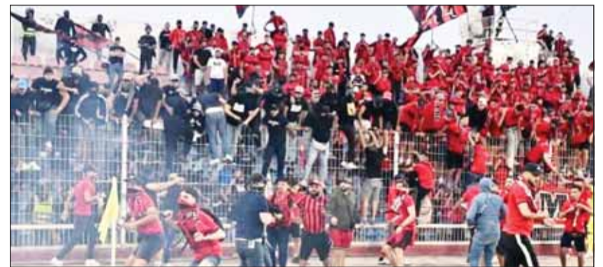
جماهير الاتحاد وأسفي اشتبكت فيما بينها

شهدت مباراة اتحاد العاصمة الجزائري ومضيفه أولمبيك أسفي المغربي أول من أمس، أحداثاً موسقة، بسبب مناوشات بين جماهير الفريقين نزل على إثرها بعض أفراد من المشجعين إلى أرضية الملعب وتحولت المواجهة إلى حدث خارج عن الإطار الرياضي، بعدما طغت عليها أجواء مشحونة وأعمال عنف تسببت في تأخير صافرة البداية. وسرعان ما خرجت مجريات هذه المباراة عن نسقها المعتاد بسبب الفوضى داخل الملعب وأعمال العنف المتبادل بين الطرفين على المدرجات وعلى أرضية الملعب، وكان كل طرف قد اتهم الطرف الآخر بالوقوف وراء هذا الشغب وأعمال العنف ما عكس صورة سلبية وسيئة عن كرة القدم الأفريقية، قبل أن يتدخل المتظمون لإعادة الأمور إلى طبيعتها، حيث تأخر انطلاق المباراة لنحو ساعة و20 دقيقة. واقتضت اتحاد العاصمة الجزائري التعادل أمام مضيفه أولمبيك أسفي المغربي بنتيجة 1-1، في إياب قبل نهائي كأس الكونفيدرالية الإفريقية، ليتأهل إلى النهائي ويلاقي الزمالك المصري. وصعد اتحاد العاصمة عن طريق تطبيق قاعدة الهدف خارج الأرض، بعد أن تعادل الفريقان ذهبا من دون أهداف في الجزائر.