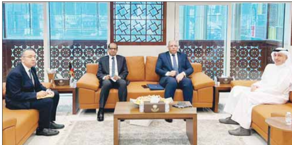
وزير التجارة والصناعة أسامة بومي والسفير المصري محمد أبو الوفا

بحث وزير التجارة والصناعة أسامة بومي امس، مع سفير جمهورية مصر العربية لدى البلاد محمد أبو الوفا سبل تعزيز التعاون المشترك بين البلدين لا سيما في ما يتعلق بمفالم الأمن الغذائي. وذكرت الوزارة في بيان لـ (كونا) أن اللقاء تناول بحث آفاق تطوير العلاقات الثنائية بين الكويت ومصر في المجالات التجارية والاقتصادية والصناعية والاستثمارية بما يسهم في تحقيق المصالح المشتركة للبلدين الشقيقين. وأضافت أن الجانبين استعرضا فرص دعم التعاون وتوسيع الشراكات في مختلف القطاعات الحيوية بما يعزز التبادل التجاري ويدعم مسارات التنمية. وبيّنت أن الاجتماع يأتي في إطار حرص دولة الكويت على توطيد علاقاتها مع الدول الشقيقة وتعزيز التعاون المشترك في مختلف المجالات.