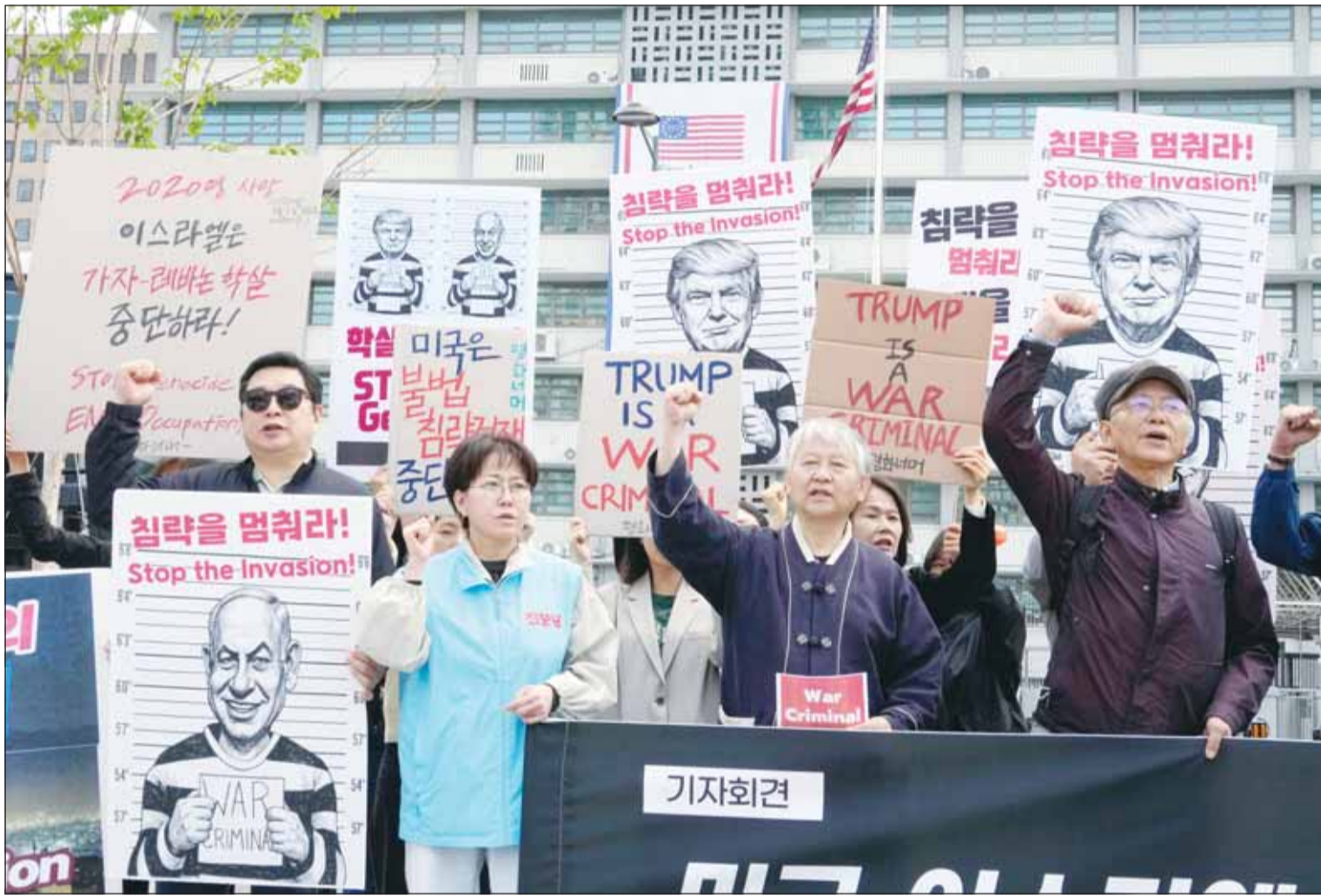
كوريون جنوبيون يرفعون صور الرئيس الأميركي دونالد ترامب ورئيس وزراء الاحتلال الإسرائيلي بنيامين نتانياهو خلال احتجاجات منددة بالحرب على إيران أمام السفارة الأميركية بسول أمس

في غضون ذلك، كرر الرئيس الأميركي دونالد ترامب التلميح إلى انقسامات النظام الإيراني، قائلاً على منصفه "ثروت سوشيل" إن إيران غير قادرة على ترتيب أمورها، مضيفاً أن على الإيرانيين أن يكونوا أكثر ذكاءً في أقرب وقت، وكتب قائلاً "إيران لا تعرف كيف توقع اتفاقاً غير نووي.. من الأفضل لها أن تصيغ أكثر حكمة قريباً"، وفي رسالة تحذير جديدة، أرفق ترامب منشوره بصورة أظهرته يحمل رشاشاً وخلفه مشهد حربي، بينما كتب بما معناه "ولي زمن اللطف"، وبالتزامن، أفاد مسؤولون أميركيون بأن الرئيس دونالد ترامب وجه مساعديه للاستعداد لحصار طويل الأمد على إيران، كاشفين لصحيفة "وول ستريت جورنال" أن ترامب اختار خلال اجتماعات عقدت مؤخراً مواصلة الضغط على الاقتصاد الإيراني وصادرات النفط عبر منع الشحن من وإلى موانئها، وأوضح المسؤولون أنه رأى أن الخيارات الأخرى مثل استئناف القصف أو الانسحاب من الصراع، تنطوي على مخاطر أكبر مقارنة بالإبقاء على الحصار، وقال مسؤول أميركي رفيع إن الحصار يضغط بقوة على الاقتصاد الإيراني، في ظل صعوبات تواجهها طهران في تخزين نفطها، ما أدى إلى تجديد محاولات التواصل مع واشنطن، وأضاف المسؤولون أن ترامب لا يعززم حالياً التراجع عن مطلبه بأن تتعهد إيران، كحد أدنى، بتعليق تخصيب اليورانيوم لمدة 20 عاماً مع القبول بقيود لائحة.