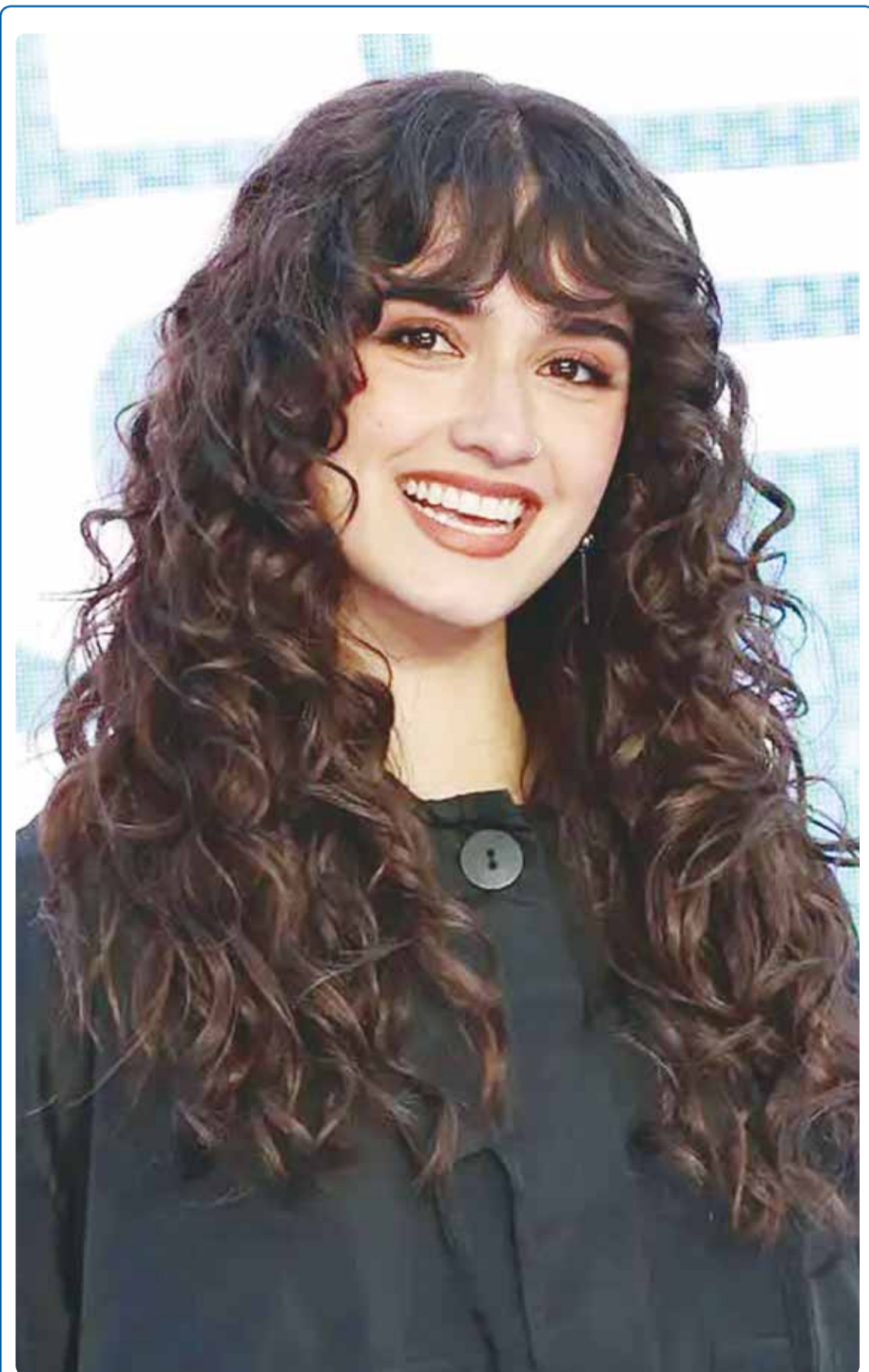
الممثلة الانكليزية آشا بانكس خلال حضورها فيلم "اضربني بقوة ولفظ" في لندن

نيودلهي- وكالات، وثقت كاميرات المراقبة لحظة تحوّل أجواء السكينة داخل مسجد في منطقة بادشاه ناغار الهندية إلى حالة من الدعر، بعدما تسلل ثعبان إلى قاعة الصلاة أثناء سجود المصلين. ويظهر المقطع المتداول للثعبان وهو يخرج فجأة من مقدمة الصفوف، متحركاً بين المصلين الذين لم يدركوا في البداية ما يحدث. ومع اتضاح المشهد، عمت الفوضى المكان، إذ قطع المصلون صلواتهم على الفور، واندفعوا مبتعدين في اتجاهات مختلفة، في محاولة لتفادي الخطر. وكانت اللحظات القليلة التي وثقها الفيديو كفيلاً بإثارة موجة واسعة من التفاعل على منصات التواصل الاجتماعي، حيث عبّر كثيرون عن صدمتهم من الحادثة.