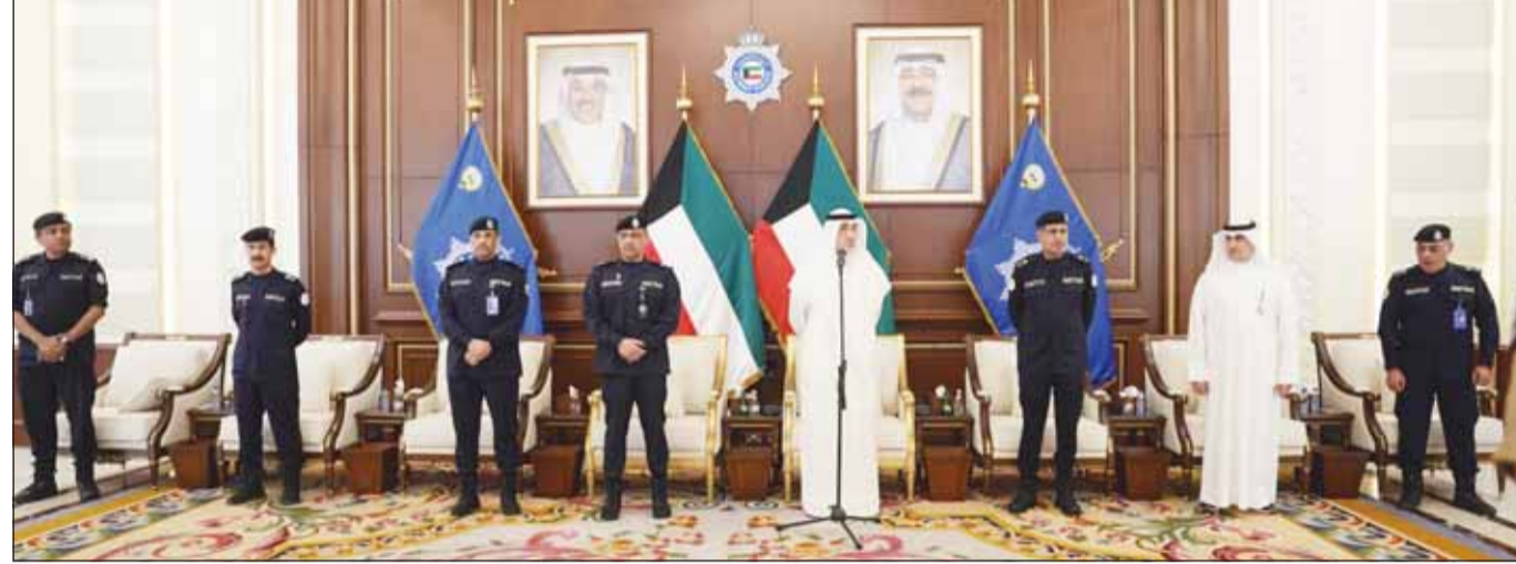
النائب الأول الشيخ فهد اليوسف منسوطاً قيادات "الداخلية"

مأضون في تمكين الكوادر الوطنية والارتقاء بالأداء المؤسسي | تعزيز كفاءة المنظومة الأمنية ومواكبة متطلبات المرحلة