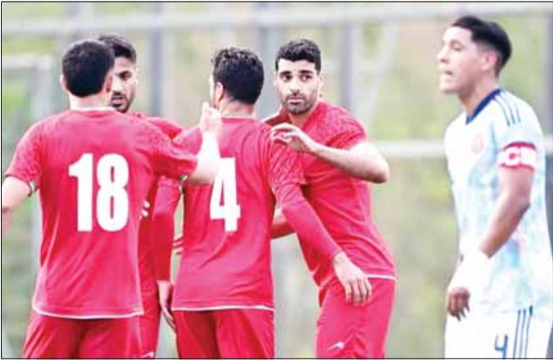
مشاركة إيران في المونديال غير مؤكدة حتى اليوم

شهدت كواليس كرة القدم العالمية تطورا دراماتيكيا قبل أسابيع قليلة من انطلاق كأس العالم 2026، حيث فُتِحَ غياب وفد الاتحاد الإيراني على أعمال كونغرس الاتحاد الآسيوي، المنعقد في مدينة فانكوفر الكندية.