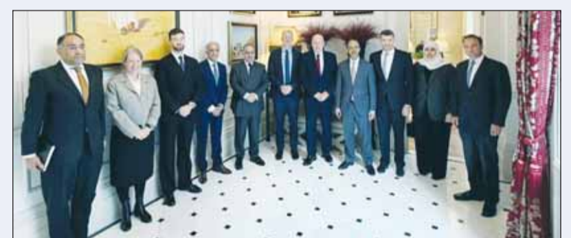
السفير المنيج متوسطاً وزير الدفاع والقوات المسلحة البريطانيين وسفراء الدول الخليجية

وذكرت سفارة الكويت في لندن - في بيان - أنه تم خلال اللقاء مناقشة العلاقات الدفاعية الخليجية - البريطانية وبحث سبل تعزيزها وتطويرها. كما تمت الإشارة بمستوى التعاون الدفاعي القائم بين الكويت والمملكة المتحدة الذي يعكس متانة العلاقة التاريخية التي تجمع البلدين الصديقين.