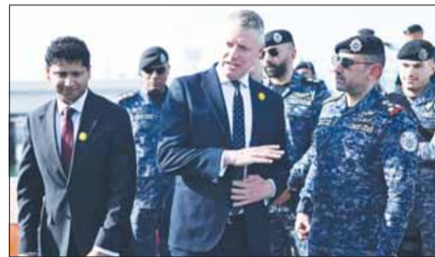
الوزير لوك بولارد مع الشيخ مبارك الصباح