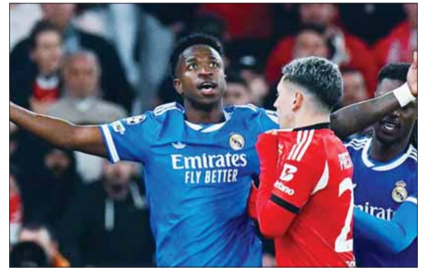
حادثة بريستيانا وفينيسوس ساهمت في تعديل قوانين اللعبة

يواجه اللاعبون الذين يغطون أفواههم أثناء مشادات مع المنافسين، خطر تلقي بطاقة حمراء خلال كأس العالم 2026، وذلك ضمن مبادرة جديدة تهدف إلى مكافحة العنصرية، بحسب ما أعلن الاتحاد الدولي لكرة القدم (فيفا) أول من أمس. وأكد "فيفا" أن هذه القاعدة تعد واحدة من تعديلين على قوانين اللعبة سيتم تطبيقهما في كأس العالم المقررة هذا العام.