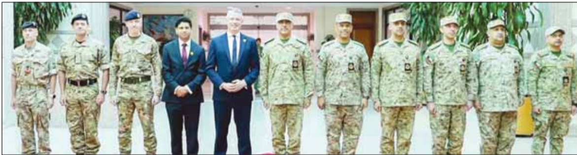
وكيل الحرس الوطني الفريق الركن حمد البرجيس مستقبلاً وزير الدولة لشؤون الجاهزية والصناعات الدفاعية البريطاني لوك بولارد بحضور كبار الضباط

استقبال الفريق البرجيس للوزير البريطاني وسفير المملكة المتحدة لدى دولة الكويت قُدسي رشيد والوفد المرافق لهما وذلك في إطار تعزيز علاقات التعاون المشترك وتبادل الخبرات بين الجانبين.