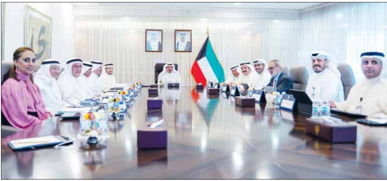
سمو رئيس الوزراء الشيخ أحمد العبدالله مترأساً اجتماع المجلس الأعلى للبتترول

ترأس سمو رئيس مجلس الوزراء الشيخ أحمد العبدالله الاجتماع 130 (2/2026) للمجلس الأعلى للبتترول، أمس، وناقش المجلس البنود المدرجة على جدول أعماله والتي تشمل المشاريع المعتمدة من قبل مؤسسة البترول الكويتية وشركاتها التابعة واستراتيجيتها المرتبطة بهذه المشاريع واستمع المجلس إلى شرح لتداعيات خروج دولة الإمارات العربية المتحدة الشقيقة من منظمة الدول المصدرة للنفط (أوبك) و(أوبك+).