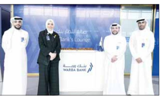
جانب من جناح بنك ورة لتوديع المسافرين في T4