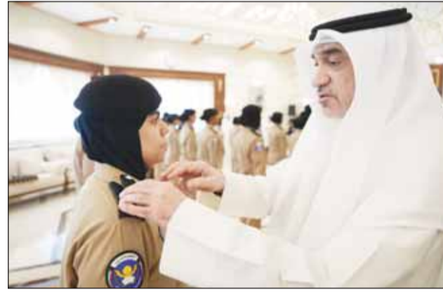
النائب الأول الشيخ فهد اليوسف يقلد أحد الضباط رتبته