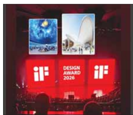
جناح الكويت الأفضل في التصميم والابتكار