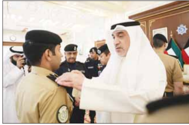
... ويقلد ضابطاً آخر بحضور اللواء الوهيب