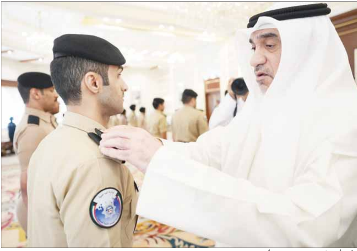
النائب الأول الشيخ فهد اليوسف يقبل أحد الضباط برتبته

■ منيف نايف فيما قلد عددا من الضباط برتبهم الجديدة، ووسط تأكيدات على أن الوزارة شهدت حركة ترقيات واسعة، شدد النائب الأول لرئيس مجلس الوزراء وزير الداخلية الشيخ فهد اليوسف على أن "المرحلة المقبلة تتطلب مواصلة العمل بروح المسؤولية والانضباط، بما يسهم في تعزيز أمن الوطن واستقراره". وأكد النائب الأول أن "وزارة الداخلية ماضية في دعم وتمكين الكوادر الوطنية، والارتقاء بمستوى الأداء المؤسسي، بما يعزز من كفاءة المنظومة الأمنية ويواكب متطلبات المرحلة". (راجع ص2) وإذ هنا الضباط المرقيين، أكد اليوسف أن نيل هذه الرتب يأتي تنويهاً لما بذلوه من جهود مخلصه وعطاء متميز في مختلف مواقع عملهم. وقال، إن رجال وزارة الداخلية سيظلون العيون الساهرة على أمن الوطن، يعملون يعزيمة لا تلين وإخلاص لا ينقطع، مشيراً إلى أن المرحلة الراهنة تتطلب أعلى درجات الجاهزية واليقظة، والتعامل بحزم مع كل ما من شأنه المساس بأمن البلاد، في ظل توجيهات القيادة الحكيمة.