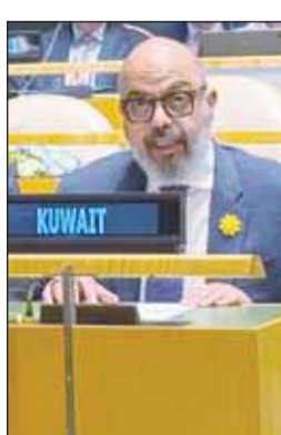
طارق البنائي متحدثاً

غير النووية، مؤكدا أهمية تنفيذ قرار عام 1995 بإنشاء منطقة خالية من الأسلحة النووية في الشرق الأوسط. وفي السياق، أدان الاعتداءات الإيرانية على دول الخليج والأردن، معتبرا أنها تهدد الاستقرار الإقليمي، وتؤكد الترابط بين نزع السلاح والأمن. كما شدد على حق الدول في الاستخدام السلمي للطاقة النووية، مع تعزيز دور الوكالة الدولية للطاقة الذرية. ولفت البنائي إلى وجود اختلال واضح في تنفيذ التزامات المعاهدة، في ظل استمرار بعض الدول النووية في تحديث ترساناتها وتعزيز عقائد الردع النووي، بما يتعارض مع نص وروح المادة السادسة. ودعا المجتمع الدولي إلى الاطلاع بمسؤولياته، مجددا المطالبة بانضمام الكيان الإسرائيلي المحتل إلى المعاهدة والامتناع للشرعية الدولية. وختم البنائي بالإشادة بالمجهود، واصفا إياه بأنه "لمحة مفصلية" في مسار المعاهدة، معربا عن أمله في أن يسفر عن وثيقة ختامية تتضمن خطوات ملموسة تعيد الثقة وتعزز فعالية النظام الدولي لعدم الانتشار.