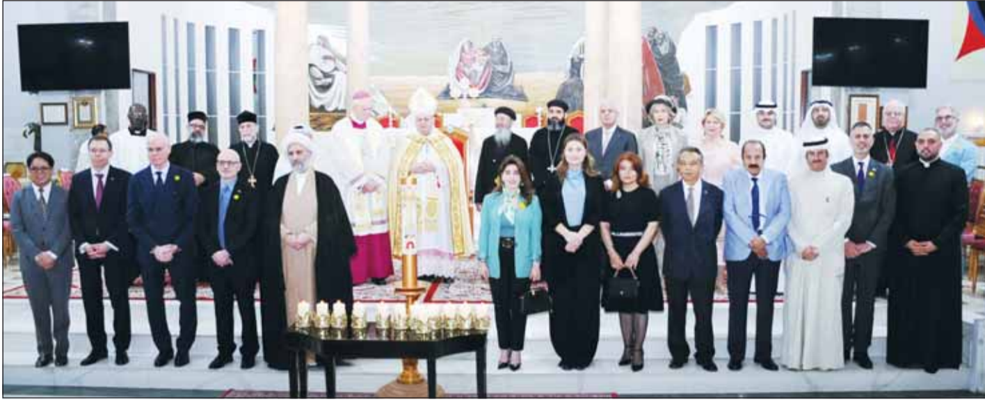
السفير البابوي المطران يوجين نونجت والمطران أدو بيراردني بتوسطان الحضور خلال المناسبة

في مشهد يعكس روح التآلف الديني والتعايش المجتمعي، أقيم مساء أول من أمس دعاء من أجل السلام في دولة الكويت ومنطقة الشرق الأوسط، وذلك في الكنيسة الكاثوليكية "كاثدرائية العائلة المقدسة"، بحضور عدد كبير من السفراء وأعضاء السلك الدبلوماسي من مختلف الدول، يقدهم السفير البابوي للكاتيكات المطران يوجين نونجت، في تأكيد على البعد الدولي للدعاء وأهميته في ظل التحديات الإقليمية. وترأس الصلاة المطران أدو بيراردني، النائب الرسولي لشمال الجزيرة العربية، تحت عنوان "الصلاة من أجل ديرة الخير - دولة الكويت"، حيث استلهم في تأمله إنجيل عظة يسوع على الجبل، مؤكداً أن "صنع السلام غالباً ما يسيرون عكس التيار، فيختارون الموار في أوقات الانقسام، ويزرعون الرجاء حين يتفشى اليأس".