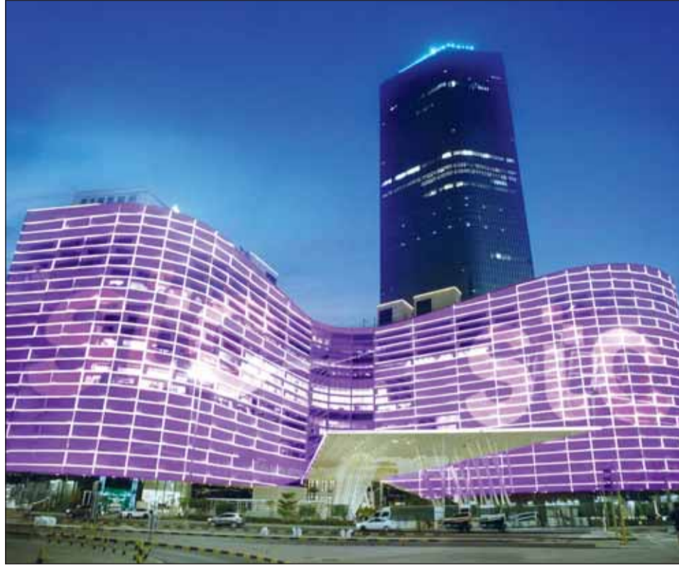
STC في قلب العاصمة