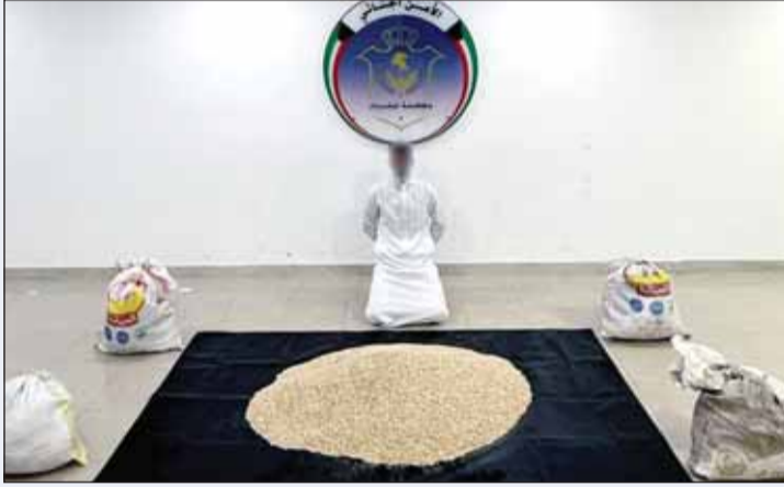
المتهم وأمامه المضبوطات بعد القبض عليه

□ الشحنة مسجلة على أنها مواد غذائية... والمخدرات كانت مخبأة بطريقة سرية ومبتكرة