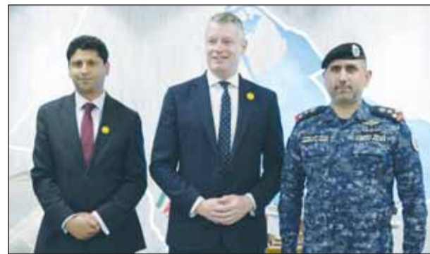
الوزير لوك بولارد مع الشيخ مبارك الصباح والسفير البريطاني قُدسي رشيد

وأكد بولارد تقديره لقيادة الكويت واحترافية قواتها المسلحة في حماية البلاد والمنطقة، كما وجّه الشكر