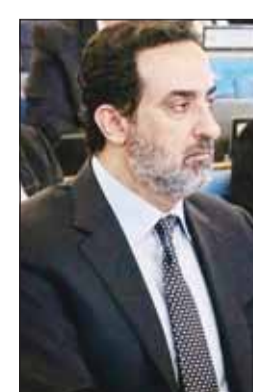
السفير ناصر القحطاني

أن هذه التداعيات لا تقتصر على دول المنطقة، بل تمتد لتشمل دولاً في أفريقيا وآسيا وأمريكا اللاتينية، ما يعكس الترابط الوثيق بين أمن الملاحة والأمن الغذائي العالمي.