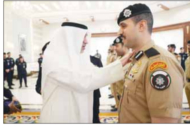
... ويقلد آخر

شهدت وزارة الداخلية حركة واسعة من الترقيات شملت عدداً كبيراً من الضباط في مختلف القطاعات الأمنية في إطار حرص وزارة الداخلية على دعم منتسبيها وتمفيزهم. وقاد النائب الأول لرئيس مجلس الوزراء وزير الداخلية الشيخ فهد اليوسف، أمس، عدداً من الضباط رتبهم الجديدة، وذلك بحضور وكيل وزارة الداخلية اللواء عبدالوهاب الوهيب، وعدد من الوكلاء المساعدين وروساء القطاعات الأمنية. وهنا اليوسف الضباط المرقيين بهذه المناسبة، مؤكداً أن نيل هذه الرتب يأتي توجيهاً لما بذلوه من جهود مخصصة وعطاء متميز في مختلف مواقع عملهم، وأن المرحلة المقبلة تتطلب منهم مواصلة العمل بروح المسؤولية والانضباط، بما يسهم في تعزيز أمن الوطن واستقراره. وأكد اليوسف أن رجال وزارة الداخلية سيظلون العين الساهرة على أمن الوطن، يعملون بعزيمة لا تلين وإخلاص لا ينقطع، مشيراً إلى أن المرحلة الراهنة تتطلب أعلى درجات الجاهزية واليقظة، والتعامل بحزم مع كل ما من شأنه المساس بأمن البلاد، في ظل توجيهات القيادة الحكيمة. كما شدد على أن وزارة الداخلية ماضية في دعم وتمكين الكوادر الوطنية، والارتقاء بمستوى الأداء المؤسسي، بما يعزز من كفاءة المنظومة الأمنية ويؤكد متطلبات المرحلة. حضر مراسم التقليد عدد من القيادات الأمنية، حيث أهدروا عن تهنيتهم للمرقيين، متمنين لهم التوفيق في أداء مهامهم ومسؤولياتهم القادمة.