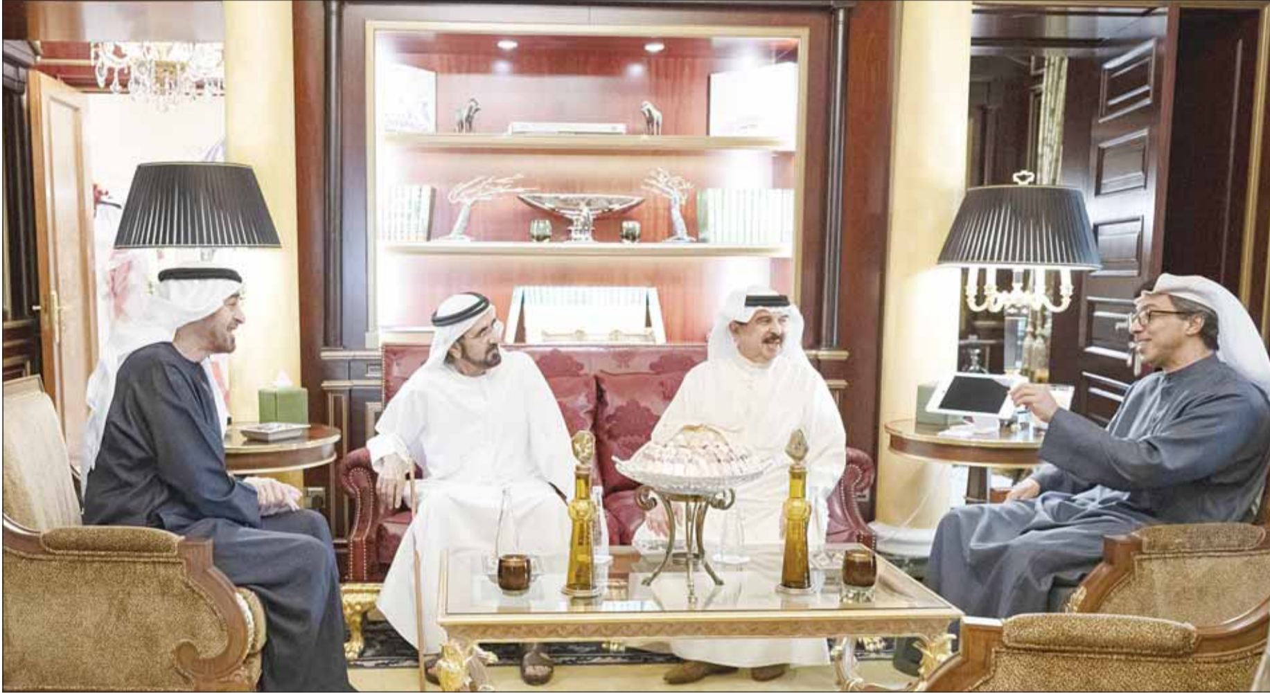
عاهل البحرين الملك حمد بن عيسى ورئيس الإمارات الشيخ محمد بن زايد ونائب رئيس الإمارات حاكم دبي الشيخ محمد بن راشد خلال اجتماعهم في أبوظبي أمس

الزياني أن تحقيق السلام الإقليمي المستدام يتطلب معالجة شاملة لمصادر التوتر والتصعيد والخزاعات في المنطقة، بما يشمل حل الأزمة الإيرانية من خلال حوار جاد وبناء يضمن امتثال إيران لمبادئ حسن الجوار وأحكام القانون الدولي واحترام سيادة الدول، مؤكداً أنه يتوجب على إيران ضمان حرية الملاحة في مضيق هرمز وسائر الممرات المائية الحيوية وإيقاف برامجها النووية والصاروخية ورفض الاعتداءات غير المبررة بالإضافة إلى عدم التدخل في الشؤون الداخلية لجاراتها.