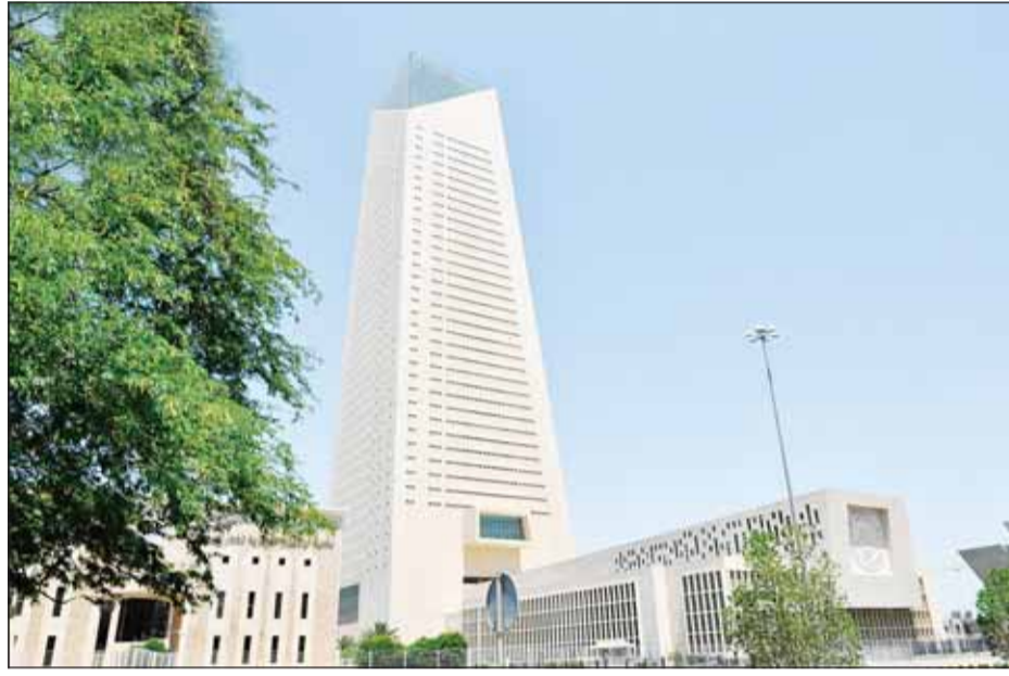
مبنى بنك الكويت المركزي

أعلن بنك الكويت المركزي امس إصدار سندات الخزنة وتورق الدين العام بالنهاية عن وزارة المالية بقيمة إجمالية بلغت 100 مليون دينار كويتي "نحو 330 مليون دولار أمريكي". وقال "المركزي" في بيان صحفي إن أجل الإصدار خمس سنوات وبمزايا تنافسي موحد العائد عند 250,3 في المئة مبيناً أن تقطيع الإصدار بلغت 3,74 مرة.