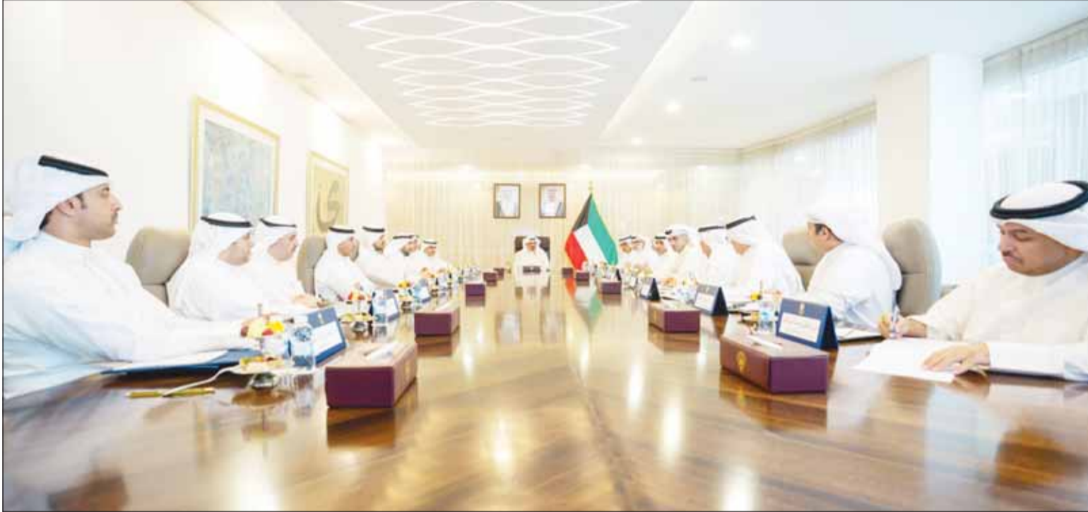
سمو رئيس مجلس الوزراء الشيخ أحمد العبدالله مترأساً اجتماعاً بشأن ملاحظات ومتطلبات مجموعة العمل المالي "FATF"

□ دعم التكامل وتعزيز آليات التنسيق والمتابعة بين الجهات الحكومية المختصة