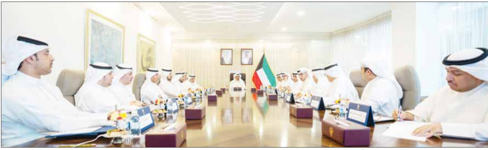
سلمو رئيس مجلس الوزراء الشيخ أحمد عبدالله مترأساً الاجتماع

البنك المركزي للبنوك المحلية في 26 مارس الماضي، وأوضح الرقاعي أن الإجراءات الحكومية تتضمن مواصلة دفع الإنفاق الرأسمالي الموجه للمشاريع التنموية مع التركيز على استكمال المشاريع القائمة وتعزيز الشراكة مع القطاع الخاص وتسريع الدورة المستندية للمشاريع الحكومية. وأشاد بالإجراءات الأخيرة لـ "المركزي" التي منحت البنوك مرونة أكبر في متطلبات السيولة والكفاية الرأسمالية مع توجيه الشركات الخاضعة لرقابته إلى التعامل بليجابية النتمة 10