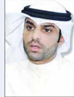
المستشار ناصر البدر

أصدرت محكمة الجنايات "دائرة أمن دولة والأعمال الإرهابية" برئاسة المستشار ناصر البدر، وعضوية القضاة عمر المليفي وعبدالله الفالح وسالم الزايد، أمس، أحكامها في قضية "التفريعات" المرتبطة بنشر وإعادة نشر محتوى عبر وسائل التواصل الاجتماعي خلال فترة سابقة.