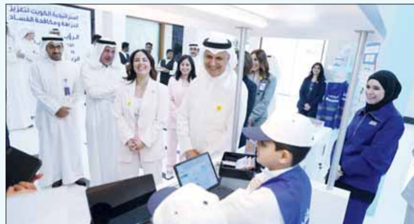
جانب من زيارة الوطني لمقر نزاهة