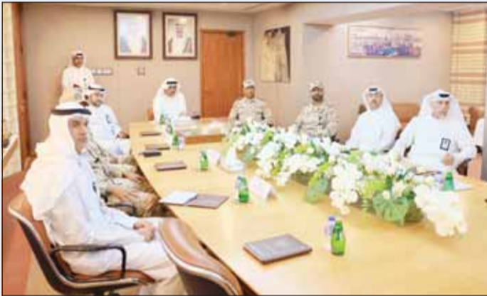
وزير الدفاع الشيخ عبدالله العلي خلال زيارة قطاع الشؤون الفنية

أجرى وزير الدفاع الشيخ عبدالله علي السالم زيارة تفقدية إلى قطاع الشؤون الفنية في الوزارة، حيث كان في استقباله وكيل الوزارة الدكتور عبدالله مشعل الصباح وعدد من القيادات العسكرية.