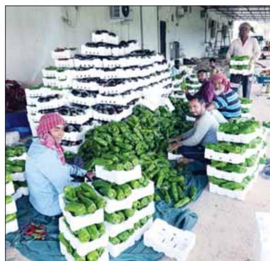
عمال يوظبون اتاج المزرعة

في الوقت ذاته إلى حماية المنتج الكويتي، وذلك بوضع حد أدنى (مريح) للمزارع، ينطلق من المزارع على منتج الزراعي المحلي، كما تضع حداً أعلى لهذا المنتج لحماية المستهلك، مذكراً بأن المزارع الكويتي أثبت نفسه أيام جائحة "كورونا"، وها هو يثبت نفسه أيام أزمة "مضيق هرمز". وحث جهاد الحميدان، مزارعي الكويت على استمرار نشاطهم الزراعي طوال أشهر الصيف الحارة، مهما كلفهم هذا الأمر من مال وجهد ووقت، خصوصاً في هذه الأيام الصعبة التي تمر بها في الكويت والمنطقة، على أن توفر لهم الدولة الكهرباء والماء المعالج بدلاً من إلقائه في البحر، وأن توفر للمزارع الكويتي منافذ التسويق الوجيهة، ليصل إنتاجه الزراعي من الخبز الأول لجموع المستهلكين في طول الكويت وعرضها بأسعار مريحة للمنتج ومناسبة للمستهلك.