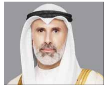
الشيخ جراح الجابر

تلقى وزير الخارجية، الشيخ جراح جابر الأحمدي، أمس، اتصالاً هاتفياً من وزير خارجية المملكة العربية السعودية الشقيقة الأمير فيصل بن فرحان بن عبدالله آل سعود، حيث تم خلال الاتصال مناقشة تطورات الأحداث الراهنة في المنطقة والجهود المبذولة بشأنها، وسبل تعزيز الأمن والاستقرار الإقليمي والدولي.