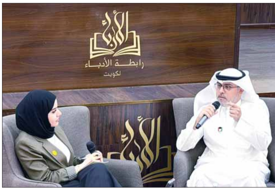
جانب من الجلسة

بالدقة، وحرصاً على تجنب الوقوع في أخطاء تاريخية، وفكرة أن هناك قارئ يحاسب أنا أفضلها على القارئ السليبي، فأنا أريد من القارئ أن يكون شريكاً، وليكن رقيباً في مسألة الخطأ". ووفيها يخص قدرة الأدب على التعبير عما تعجز نثرات الأخبار عن نقله، قال السنعوسي، "بالطبع، الأدب أقدر على ذلك، فنثرات الأخبار تنقل في نهاية المطاف أرقاماً ووقائع، بينما يمنحك الأدب، والرواية تحديداً، حكاية متكاملة تعيش فيها مع الشخصيات وتلامسها عاطفياً، وخلال مئات الصفحات، يمكن للعمل الروائي أن يقدم عمقا وتجربة إنسانية أوسع بكثير مما يقدمه خبر عاجل، غير أن ميزة الخبر هي السبق اللحظي". وذكر السنعوسي، أن تجربة الأديب إسماعيل فهد إسماعيل، تظل مغايرة في هذا السياق ومنها سباعية "الحديثات زمن العزلة"، لافتاً أنه أكثر من أخلص لثيمة الغزو، مضيفاً أن الأدبية ليلي العثمان أيضاً