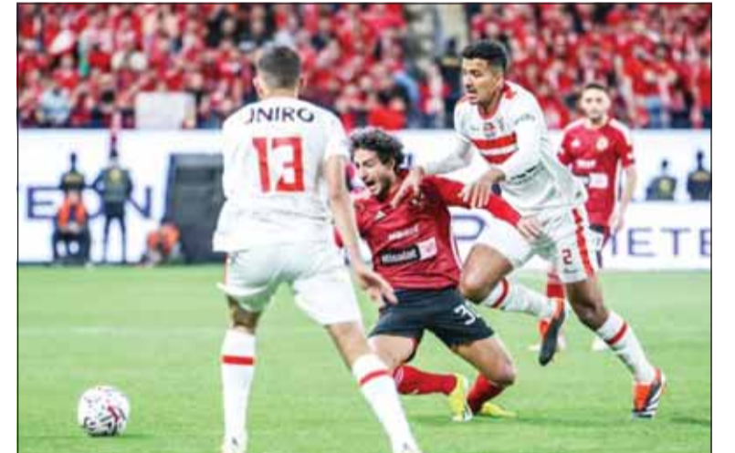
إثارة ومثمة تنتظر جماهير الأهلي والزمالك الليلة

تدخل بطولة الدوري المصري مراحل الحسم، ووصلت إلى الدرجة القصوى من الإثارة قبل ثلاث جولات فقط من خط النهاية، خاصة في مجموعة التتويج باللقب، حيث تشهد المرحلة الخامسة ثلاث مباريات قوية، على رأسها ديربي القاهرة، حيث يستضيف الزمالك نظيره الأهلي في الساعة 08:00 مساءً اليوم الجمعة بستان القاهرة، ويسبق ذلك مواجهتها بيراميدز مع إنبي، وسيراميك كليبواترا مع المصري البورسعيدى. ويتصدر فريق الزمالك جدول ترتيب البطولة برصيد 50 نقطة، يليه بيراميدز بـ47 نقطة ثم الأهلي، 44 نقطة وبفارق نقطة واحدة عن سيراميك كليبواترا صاحب 43 نقطة في المركز الرابع، وكل منهما خاص ثلاث مباريات فقط في مجموعة