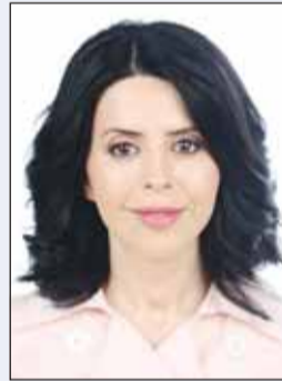
د. دلال العثمان

أصدرت مدير الهيئة العامة لشؤون ذوي الإعاقة د. دلال العثمان تعميما بشأن عودة الدوام الرسمي للمعاد بالهيئة لكافة الموظفين بنسبة 100٪. نص التعميم في المادة الأولى على "عودة قوة العمل الرسمية بالهيئة بنسبة 100٪ اعتباراً من الأحد المقبل"، وفي المادة الثانية "عودة نظام العمل بالفترة المسائية"، أما المادة الثالثة فنصت على "إعادة ساعات الدوام الرسمي المعتاد" بنظام الدوام الصباحي 7 ساعات. ومقت المادة الرابعة، على التقيد الكامل بقرار مجلس الخدمة المدنية رقم (41) لسنة 2006 بشأن قواعد وأحكام وضوابط العمل الرسمي وتعديلاته، بينما أوقفت المادة الخامسة العمل بتعميم ديوان الخدمة المدنية الخارجي رقم (4) لسنة 2026 بشأن تحديد عدد العاملين بالجهات الحكومية في ظل الظروف التي تمر بها المنطقة، وتعميم ديوان الخدمة المدنية الخارجي رقم (7) لسنة 2026 بشأن نظام الدوام الرسمي بعد انتهاء شهر رمضان المبارك.