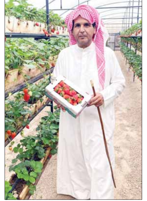
الفاولة من مزرعة المطيري