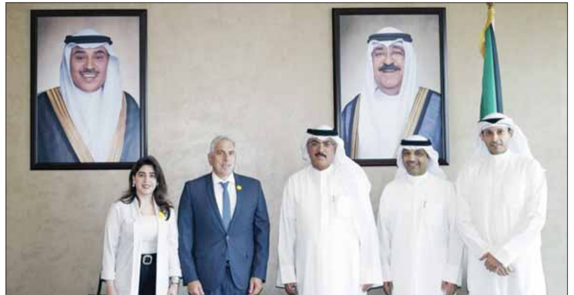
وزير التربية سيد جلال الطيباني يستقبل السفير اللبناني غادي الخوري والقنصل ميا العضم

وأكدت الوزارة أهمية تنظيم مواعيد الفعاليات بما لا يؤثر على الجدول الدراسي أو يشكل تشغيلاً للطلبة، مع منع إقامتها خلال فترات الاختبارات أو المراجعات، إضافة إلى حظر دعوة شخصيات من خارج الوزارة أو التواصل مع أي جهة خارجية دون الحصول على الموافقات الرسمية قبل