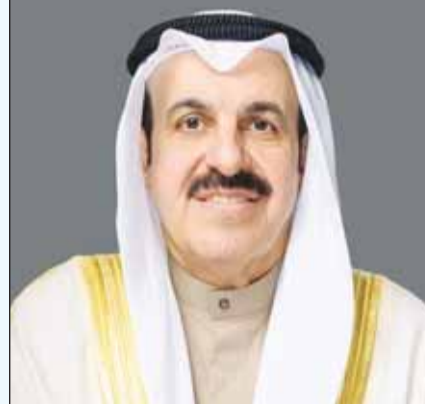
وزير المالية د. يعقوب الرفاعي