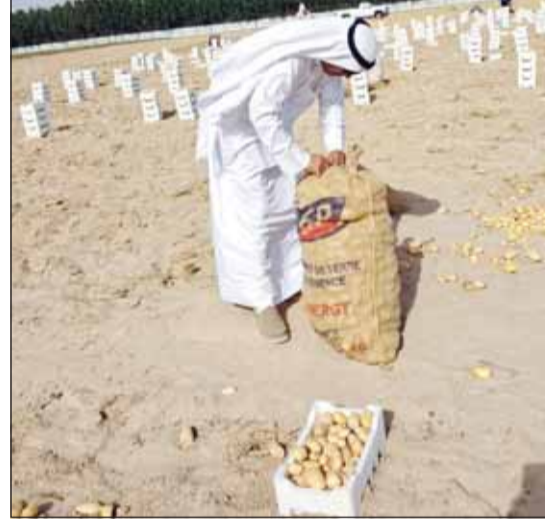
جمع محصول البطاطا

ويعكس هذا الإنتاج جهوداً وطنية متواصلة لتطوير القطاع الزراعي، والاستفادة من الموارد المتاحة لزيادة نسب الاكتفاء المحلي، ودعم الاستدامة الغذائية، كما يؤكد أن الخير يثمر كلما وجدت الإرادة والعمل، والإخلاص للبلاد والعباد.