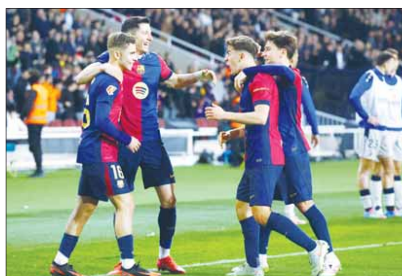
البرشا ربما يحسم اللقب غداً

لكن الطريق نحو اللقب لن يكون مفروضاً بالورود، فزيارة ملعب "إل سادار" لطالما كانت اختياراً معتاداً للفريق الكبري، وأوساسونا هذا الموسم يقدم صورة فريق صلب على أرضه، لا يخسر بسهولة ويمتلك قدرة واضحة على قلب النتائج في اللحظات الحاسمة. ويذكر برشلونة أن أي نتيجة غير الفوز قد تبقي باب الأمل مفتوحاً لريال مدريد، ولو نظرياً، وتوجب الاحتفال إلى جولات لاحقة، وربما إلى الكلاسيكو نفسه.