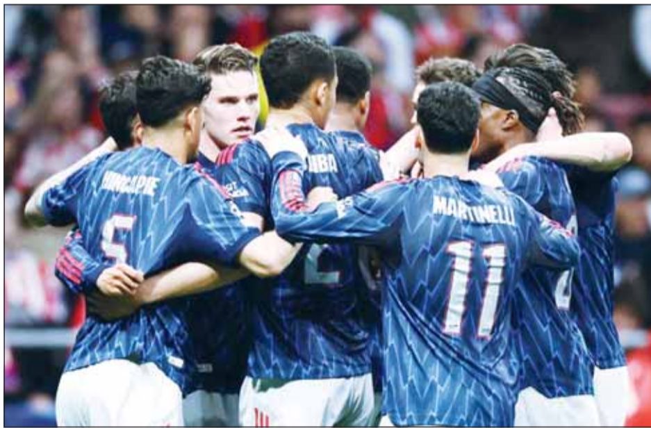
الارسنال عاد بنقطة من اسبانيا

عاد آرسنال يتعادل ثمين من خارج أرضه مع اتلتيكو مدريد بنتيجة 1-1 في ذهاب قبل نهائي دوري أبطال أوروبا، اول من امس. وتقدم آرسنال بهدف في الشوط الأول، سجله فيكتور جيوكربيس من ركلة جزاء في الدقيقة 44. ورفع جيوكربيس رصيده إلى 5 أهداف في 13 مباراة بدوري الأبطال هذا الموسم. وفي الشوط الثاني، أدرك اتلتيكو التعادل بركلة جزاء أخرى سددها جوليان أليزار في الدقيقة 56، ليحتفل بهدفه العاشر في 14 مباراة بالمسابقة القارية. بهذا التعادل يتأجل الحسم لمباراة الإياب التي ستقام الثلاثاء المقبل على ملعب الإمارات في العاصمة البريطانية لندن.