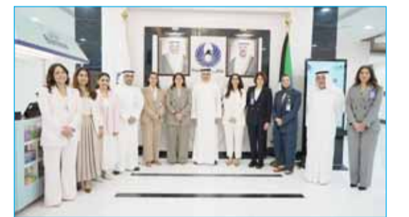
الصقر والفارس استعرضا إنجازات "Bankee" ودوره في تعزيز الوعي المالي