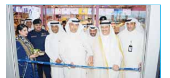
الفقاعان دشن فرع "الكويتية" بـ "الجھراء": التورتات وراء ارتفاع أسعار وقود وتذاكر الطيران