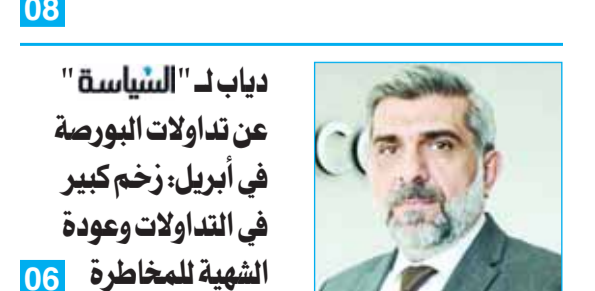
دياب لـ "السياسة" عن تداولات البورصة في أبريل: زخم كبير في التداولات وعودة الشبهة للمخاطرة النتمة 06

"سنتكوم" قدّمت سيناريوهات لموجة ضربات... ومجتبى: لا مكان لأميركا بمستقبل الخليج