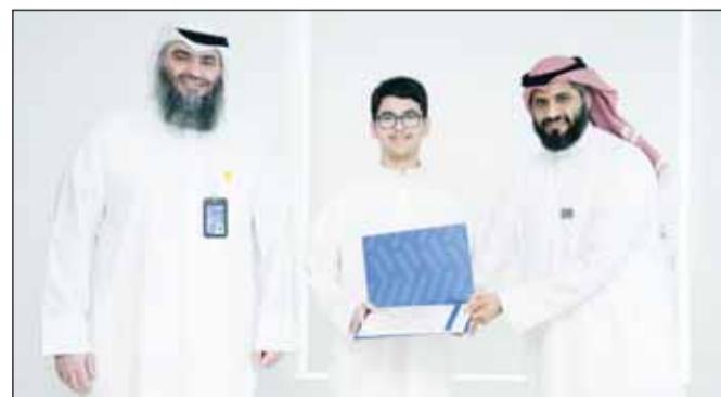
جانب من تكريم الفائزين