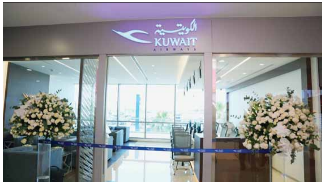
مكتب الكويتية الجديد في "الجهراء مول"