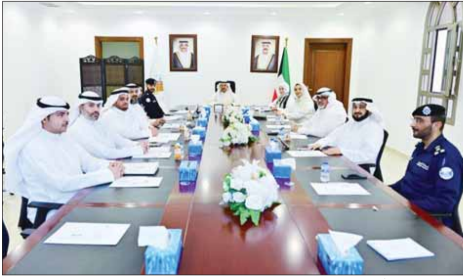
محافظ الفروانية الشيخ عذيب الناصر مترأساً اجتماع لجنة التطوير والمبادرات

تكاملاً الجهود بين الجهات الحكومية والعمل بروح الفريق لتحقيق الأهداف التنموية