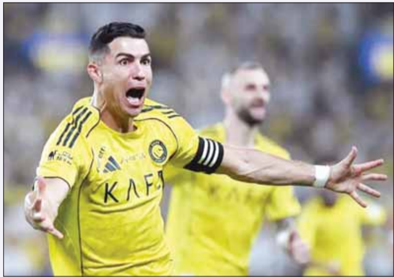
رونالدو سعيداً بالهدف الأول للنصر

اقترب فريق النصر خطوة أخرى من لقب الدوري السعودي للمحترفين، بفوز ثمين على الأهلي 2 - 0 اول من امس ضمن منافسات الجولة الثلاثين. وبعد أيام قليلة من تتويج الأهلي بطلا لدوري أبطال آسيا للنخبة للموسم الثاني على التوالي، تلقت آمال فريق المدرب الألماني ماتياس يابسله في المنافسة على اللقب المحلي صدمة بالخسارة من المتصدر النصر. وسجل البرتغالي كريستيانو رونالدو قائد النصر هدف التقدم في الدقيقة 76، ثم أضاف الفرنسي كينغسلي كومان الهدف الثاني في الدقيقة 90. ورفع النصر رصيده إلى 79 نقطة بفارق 8 نقاط عن الهلال الوصيف، علماً بأن النصر خاض مباراة أكثر، أما الأهلي فلهديه 66 نقطة في المركز الثالث.