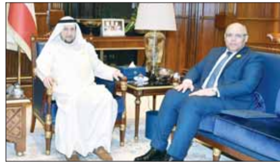
الوزير شريدة المعوشي مع سفير جمهورية مصر العربية لدى دولة الكويت محمد أبو الوفا سيل تعزيز العلاقات الثنائية والتعاون في مختلف المجالات، وذلك خلال لقاء عقد في قصر السيف.

بحث نائب رئيس مجلس الوزراء وزير الدولة لشؤون مجلس الوزراء شريدة المعوشي مع سفير جمهورية مصر العربية لدى دولة الكويت محمد أبو الوفا سيل تعزيز العلاقات الثنائية والتعاون في مختلف المجالات، وذلك خلال لقاء عقد في قصر السيف.