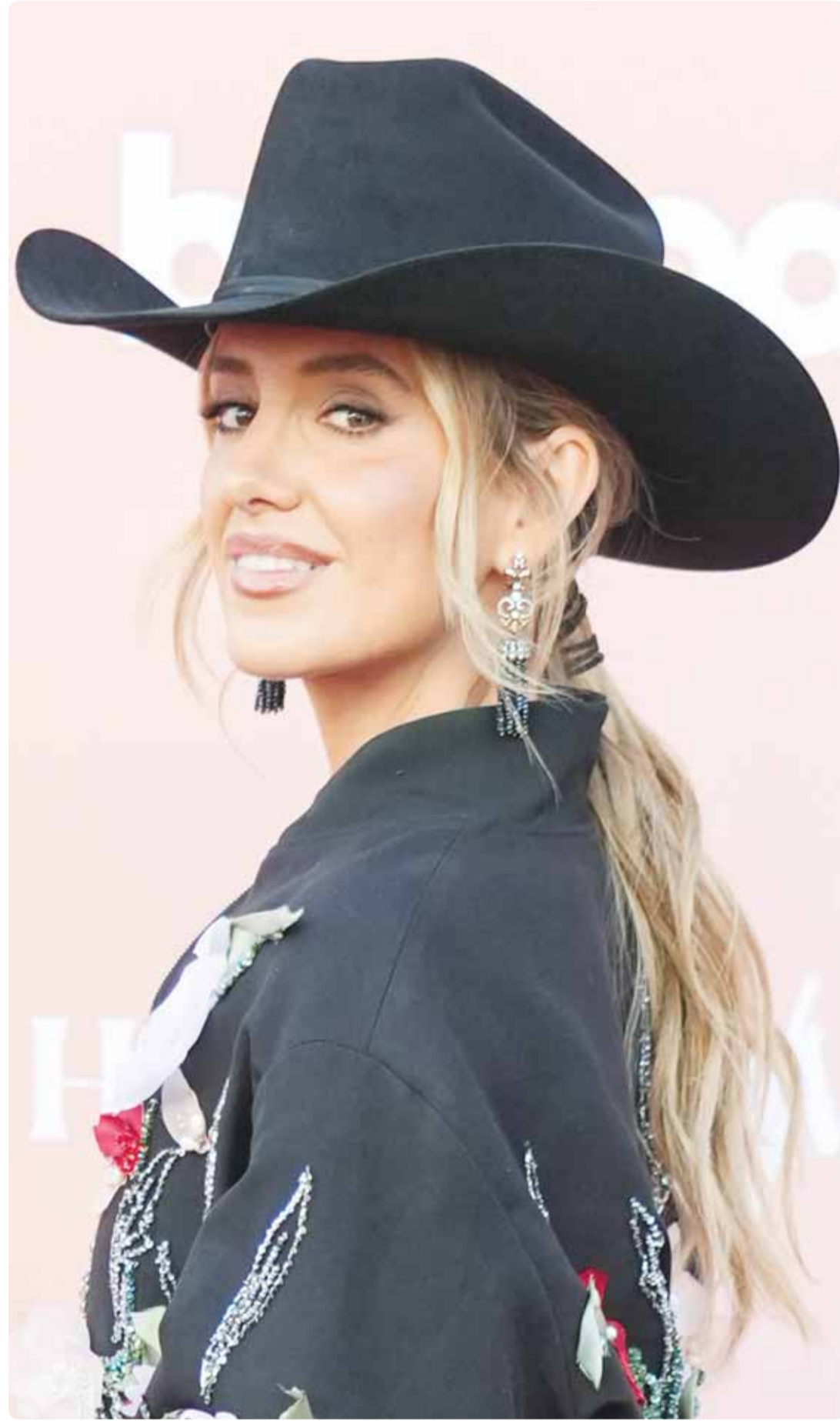
المغنية الأميركية لينيني ويلسون خلال حضورها حفل "نساء في الموسيقى" في لوس أنجلوس

الإيرانيون يبحثون في الشوارع لأنهم يعانون الظروف المعيشية الصعبة، كارتفاع الأسعار، وأزمات الجفاف والماء، وانخفاض سعر العملة الإيرانية، مع البطالة والفقر، ما جعل بعضهم يعتقد الأديان الأخرى، كما ورد في صحيفة "نيويورك تايمز" يوم 25 مارس 2018، وفي مقالة نشرتها مجلة "ايكونومست" البريطانية يوم 23 يناير 2021، وظهر المنين لفترة حكم شاه إيران، فالحياة كانت أفضل في عهده، وشعر آخرون أن شبابهم ضاع، وهم يستمعون للبرنامج النووي. خلال الشهرين الماضيين أطلقت إيران المسيرات والصواريخ على بلدان الخليج المسالمة، فالتحت بها أصابات بشرية، وتضررت منشآت، ولطالما نصحن إيران، فلم تفرأ دروس التاريخ، لذلك نقول: إن معاناة الإيرانيين ستطيح بالنظام القائم يوماً ما، وعسى أن يكون قريباً.