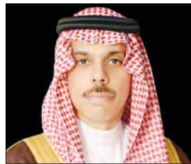
الأمير فيصل بن فرحان

تلقى وزير الخارجية، الشيخ جراح جابر الأحمدي، أمس، اتصالاً هاتفياً من وزير خارجية المملكة العربية السعودية الشقيقة الأمير فيصل بن فرحان بن عبدالله آل سعود، حيث تم خلال الاتصال مناقشة تطورات الأحداث الراهنة في المنطقة والجهود المبذولة بشأنها، وسبل تعزيز الأمن والاستقرار الإقليمي والدولي.