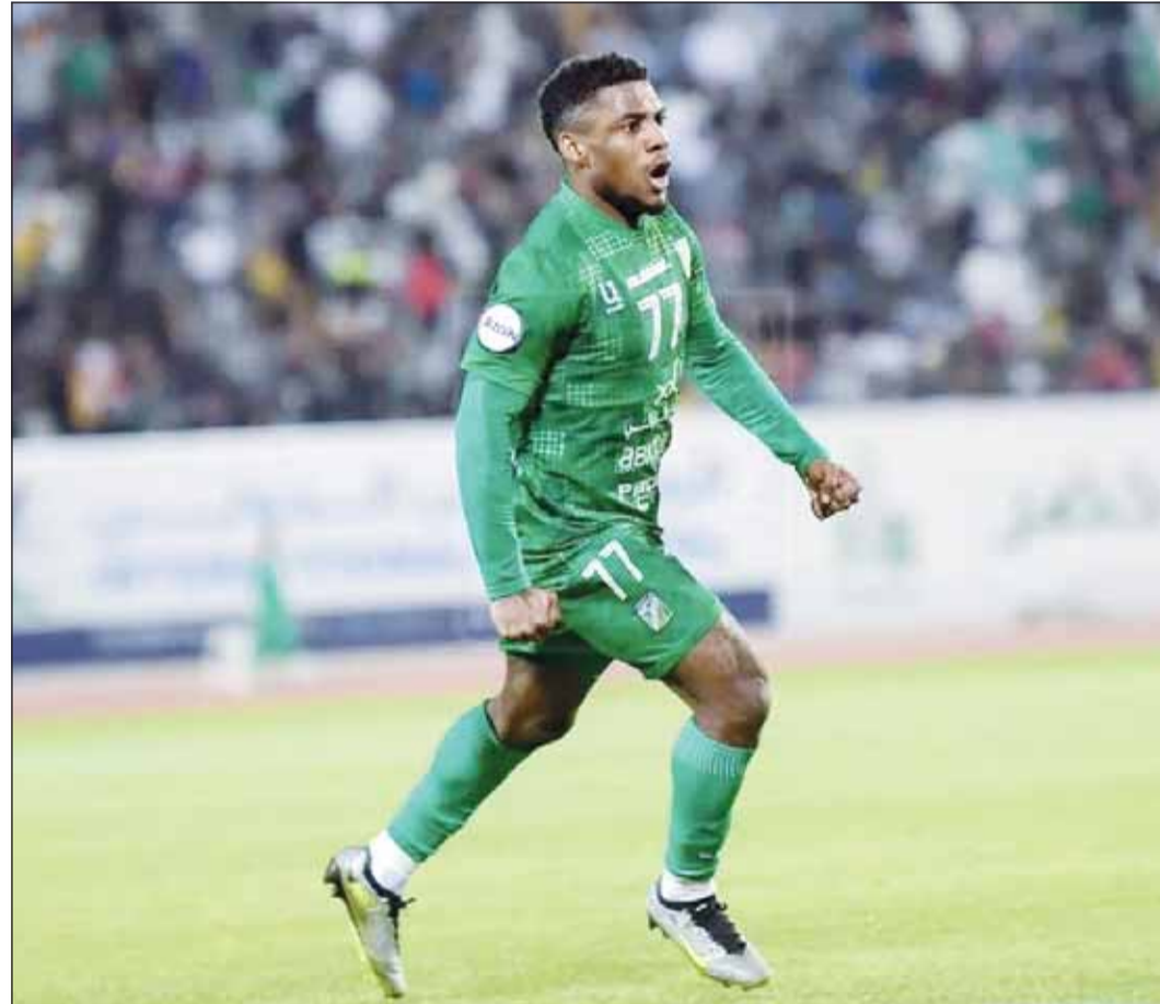
ايوالا يحضه بثقة العربي