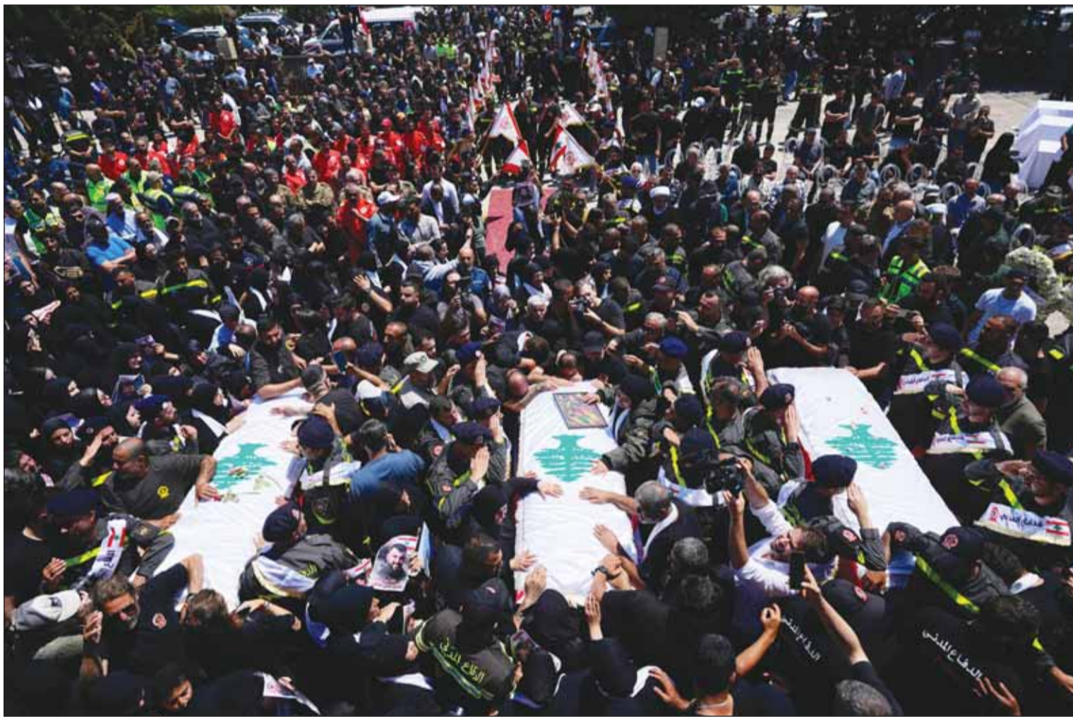
آلاف اللبنانيين يشاركون في تشييع ثلاثة من عناصرها قتلوا بغارة إسرائيلية استهدفت بلدة مجدل زون في قضاء صور جنوب لبنان أثناء تنفيذهم مهمة إنقاذ

إلى مناطق تحتلها قواته في جنوب لبنان، إن "أي تهديد، في أي مكان، ضد مجتمعاتنا أو قوتنا، بما في ذلك ما بعد الخط الأصفر وشمال الليطاني، سيُقضى عليه"، زاعماً أن جيش الاحتلال حقق الأهداف التي حددتها حكومة إسرائيل في الداخل اللبناني، وقد يُطلب منه الاحتفاظ ببعض مواقفه في المستقبل، بينما أصيب نحو 12 جندياً بانفجار مسيرة مفتحة بمدرعة في منطقة شومرا، وقالت إذاعة جيش الاحتلال إن اثنين من الجنود أصيبوا بجروح متوسطة فيما وصفت إصابات الآخرين بالطفيفة، مبيئة أن عدداً من الجنود أصيبوا بمخالب هلع. في غضون ذلك، تصاعدت الاعتداءات الإسرائيلية، حيث قتل نحو 11 وأصيب نحو 24 وفقد ثلاثة آخرون في سلسلة غارات إسرائيلية استهدفت نحو أربع بلدات بجنوب لبنان، وتعرض منزل عائلة موظف في مجلس الجنوب في بلدة النجنية - قضاء صور لغارة إسرائيلية غادرة، ما أدى إلى انهياره بشكل كامل على روس قاطنيه، وقال مجلس الجنوب إن مصير الموظف وابنه والدة لا يزال مجهولاً في ظل منع فرق الإسعاف من الوصول إلى موقع الغارة، مناشداً الجيش اللبناني وقوات "اليونيفيل" ولجنة "المكانيزم" تسريع الاتصالات لوصول فرق الإسعاف لمعرفة مصير الموظف وعائلته، بينما شجّعت مديرية الدفاع المدني اللبناني ثلاثة من عناصرها قتلوا بغارة إسرائيلية استهدفت بلدة مجدل زون في قضاء صور جنوب لبنان أثناء تنفيذهم مهمة إنقاذ، وشهدت مراسم التشييع في مركز الدفاع المدني الإقليمي بمدينة صور جنوب لبنان، مشاركة المدير العام للدفاع المدني عماد فريش ومسؤولين ومشد من الأهالي، وشملت المراسم العناصر مسين علي ساطي، وهادي جهاد ظاهر ومسكين إبراهيم غصوني الذين قتلوا الثلاثاء بعدوان إسرائيلي أثناء تنفيذهم مهمات إنقاذ وإسعاف.