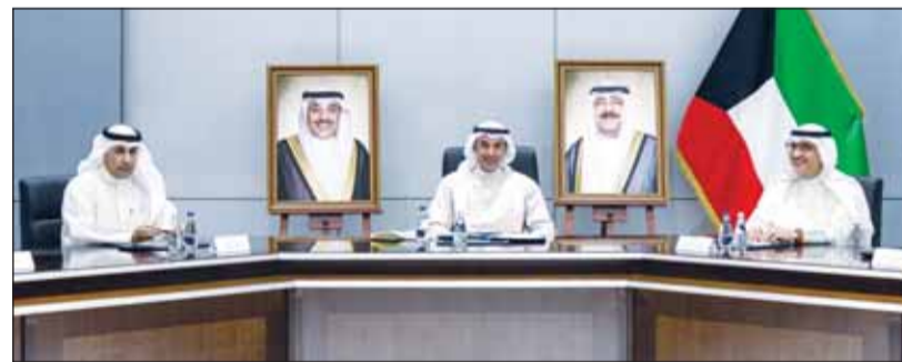
نائب وزير الخارجية حمد المشعان مترأساً الاجتماع

ترأس نائب وزير الخارجية السفير حمد المشعان اجتماعاً لمجلس السلكين الدبلوماسي والقنصلي في ديوان عام الوزارة بمشاركة مساعدي وزير الخارجية أعضاء المجلس.