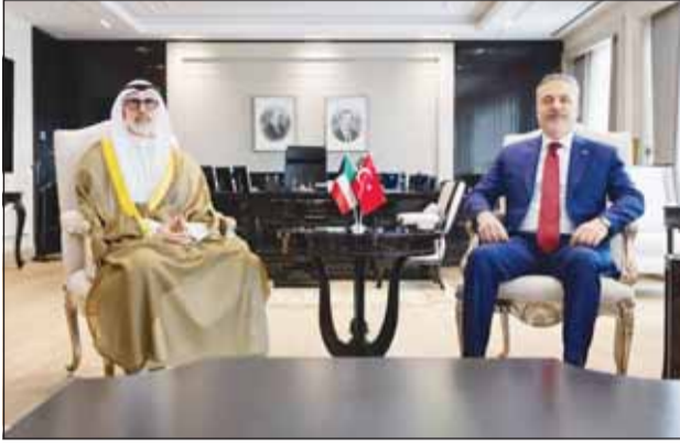
وزير الخارجية الشيخ جراح الجابر خلال لقائه نظيره التركي هاكان فيدان

وأعرب خلال الاتصال عن إدانة دولة الكويت للاعتداءات التي تعرضت لها دولة الإمارات، مؤكداً وقوف الكويت الكامل إلى جانبها، ودعمها لكل ما تتخذه من إجراءات لحفظ أمنها واستقرارها وصون سيادتها.