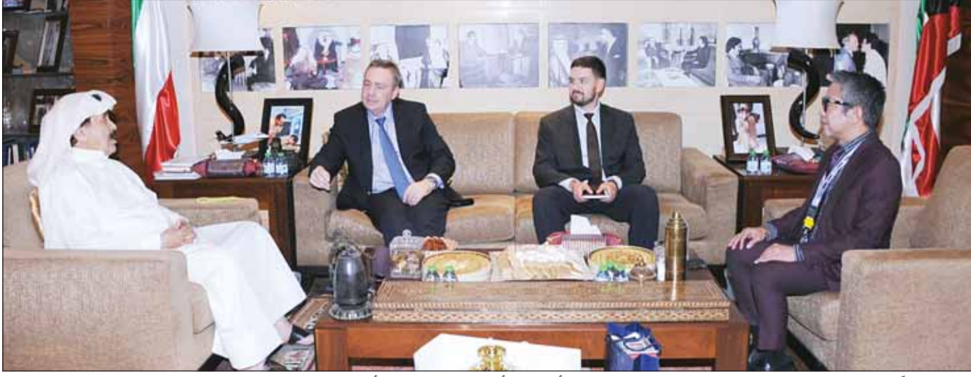
العميد الجارالله والسفير الروسي فلاديمير جيلتوف والملحق الديبلوماسية أليكساندر أندرييف والزميل مارلون أكوينو ماليناو