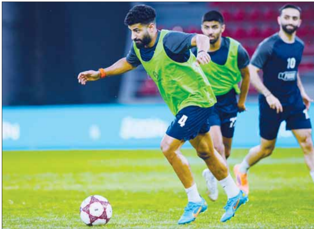
الكويت يواصل تدريباته اليومية لنهائي التحدي

ومن ضمن المقترحات أن يستكمل ما تبقى من منافسات