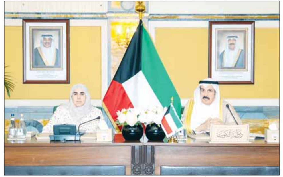
وزير المالية د. يعقوب الرفاعي وأسبل المنيفي خلال الاجتماع

كما تمت الموافقة بالإجماع على مقترح دولة الكويت باستقطاع (10%) من صافي أرباح عام 2025 لدعم الشعب الفلسطيني، بما في ذلك دعم صندوق الأقصى ولجنة القدس الشريف، والموافقة على مقترح تعديل اتفاقية إنشاء المؤسسة العربية لضمان الاستثمار واقتنام الصادرات بما يسهم في تطوير إطارها التنظيمي وتوسيع نطاق خدماتها.