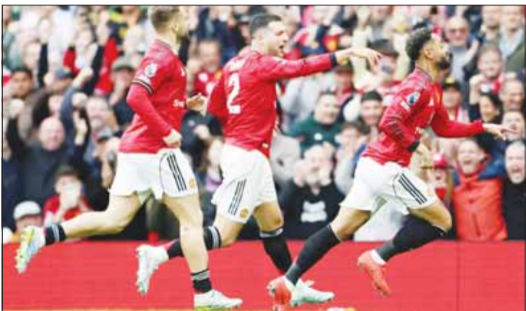
فرحة الشياطين الحمر بالفوز

واصل مانشستر يونايتد نتائجه الرائعة في بطولة الدوري الإنكليزي الممتاز لكرة القدم، بعدما تمكن من إفساد (ريمونتادا) ضيفه وغريمه التقليدي ليفربول في قمة مباريات المرحلة 35 للمسابقات.