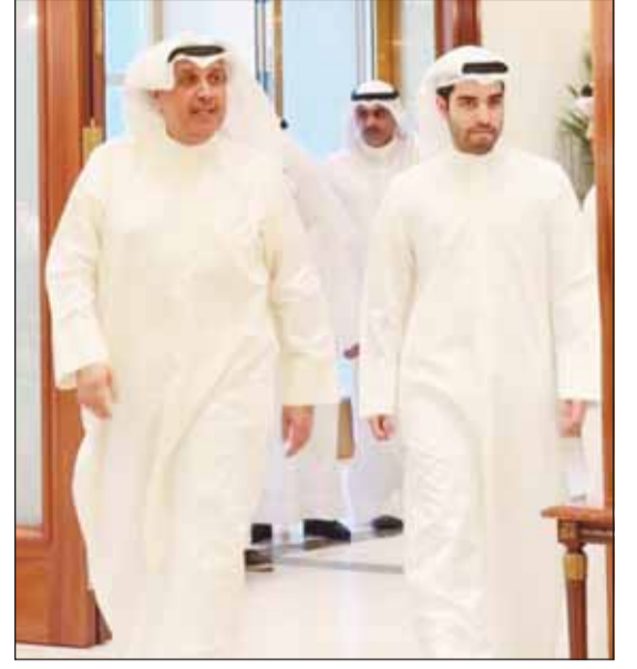
الشيخ حمد جابر العلي