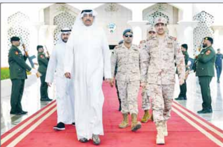
وزير الدفاع الشيخ عبدالله العلي لدم مغادرته الى تركيا

غادر وزير الدفاع الشيخ عبدالله العلي البلاد، صباح أمس، متوجهاً إلى جمهورية تركيا الصديقة، وذلك لتلبية دعوة من وزير الدفاع التركي، يرافقه نائب رئيس الأركان العامة للجيش اللواء الركن طيار صباح جابر الأحمد، وعدد من كبار الضباط والقادة من وزارتي الدفاع والداخلية والحرس الوطني. وكان في وداعه لدى مغادرته البلاد رئيس الأركان العامة للجيش الفريق الركن خالد الشريماني ووكيل وزارة الدفاع الشيخ الدكتور عبدالله المشعل الصباح.