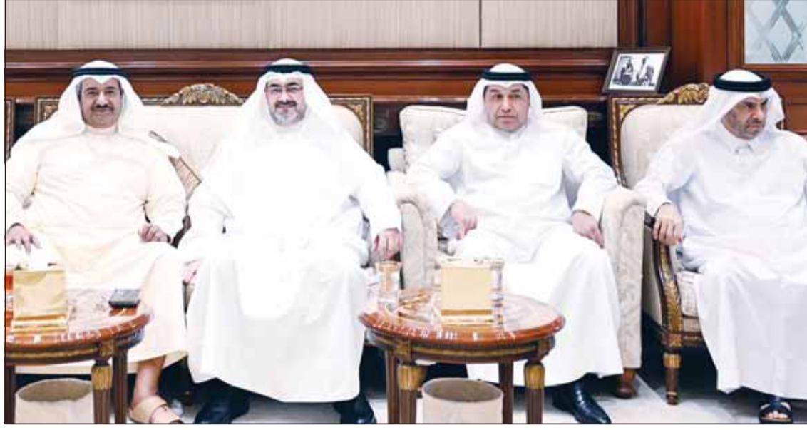
السفير القطري علي آل محمود ويدر الرزحان والشيخ عبدالله السالم وإياد الثويني