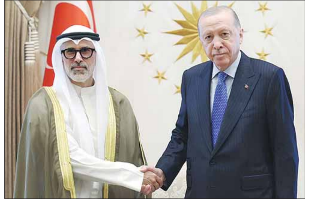
الرئيس التركي رجب طيب أردوغان مستقبلاً وزير الخارجية الشيخ جراح الجابر

من جهة أخرى، التقى وزير الخارجية الشيخ جراح الجابر، أمس، نظيره التركي هاكان فيدان، وتم خلال اللقاء استعراض العلاقات الثنائية الوثيقة بين البلدين والشعبين الصديقين، والتأكيد على أهمية مواصلة تعزيز أطر التعاون، واستمرار التنسيق والتشاور بينهما في مختلف المجالات وعلى جميع المستويات،