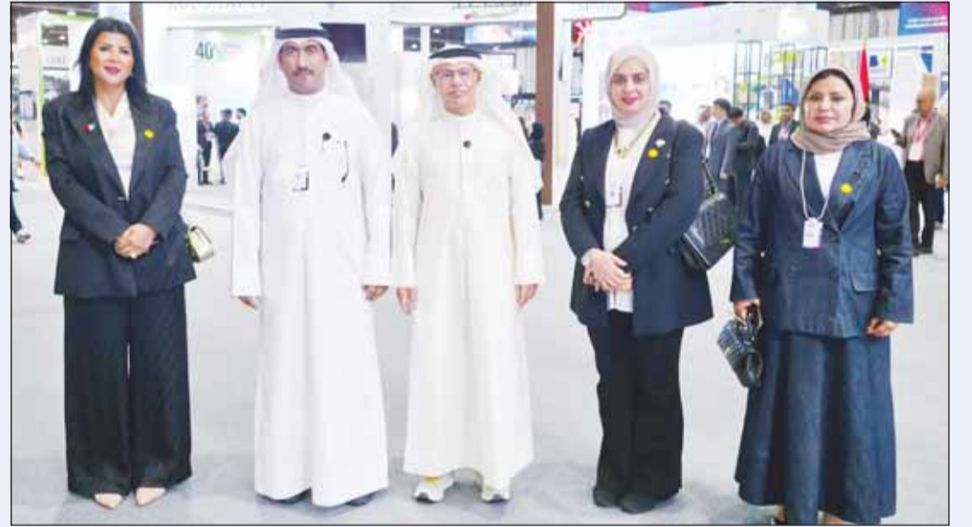
د. عادل الزامل متوسلاً وفد الوزارة المشارك في المعرض

أبو ظبي - "كونا"، أكد وكيل وزارة الكهرباء والماء والطاقة المتجددة د. عادل الزامل أن مشاركة وفد الوزارة برؤاسته في منصة "اصنع في الإمارات" تأتي حرصاً على تعزيز أواصر التعاون الإقليمي وتبادل الخبرات في مجالات الطاقة الكهربائية والمياه والطاقة المتجددة بما يدعم توجهات التنمية المستدامة ويواكب التحولات العالمية في قطاع الطاقة.