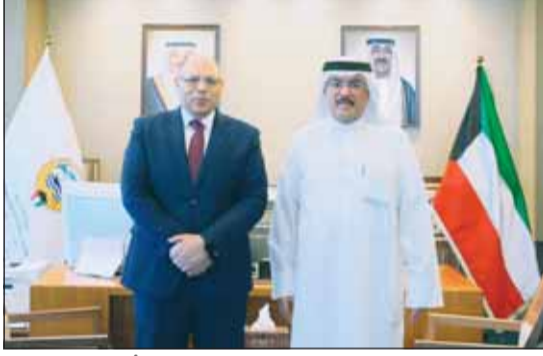
الوزير سيد جلال الطيبياي، مستقبلاً السفير محمد أبو الوفا

استقبل وزير التربية المهندس سيد جلال الطيبياي، في مكتبه صباح أمس وفداً من سفارة جمهورية مصر العربية لدى الكويت، برئاسة السفير محمد أبو الوفا، وذلك بحضور نائبة السفير نورا عبدالهادي، ومستشار السفير محمد عبدالمعطي، والمستشار التعليمي بالملحق الثقافي بالسفارة المصرية د. أمينة أبوالمكارم. تناول اللقاء سبل تعزيز أوجه التعاون المشترك بين البلدين في المجالات التربوية والتعليمية، إلى جانب بحث عدد من الموضوعات ذات الاهتمام المشترك، بما يسهم في دعم وتطوير العلاقات الثنائية. وتطرق اللقاء إلى عمق العلاقات التاريخية التي تربط دولة الكويت وجمهورية مصر العربية، وما تقوم عليه من أسس راسخة من الأخوة والتفاهم المشترك، مشيرين إلى أهمية استمرار التنسيق والتعاون بما يخدم المصالح المشتركة للبلدين.