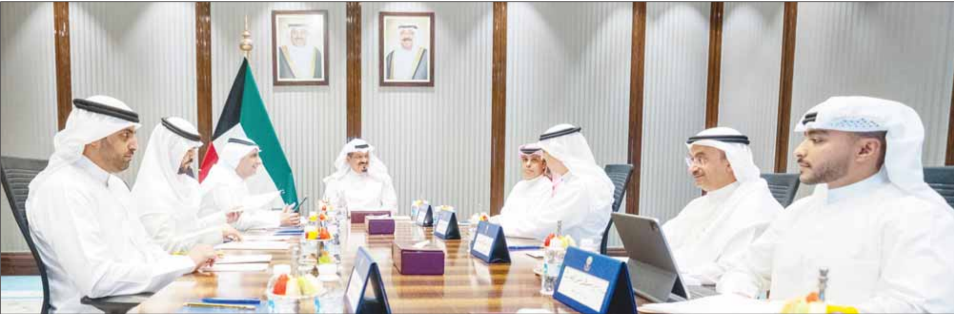
سمو رئيس الوزراء الشيخ أحمد العبدالله مترأساً الاجتماع

ترأس سمو رئيس مجلس الوزراء الشيخ أحمد العبدالله اجتماعاً لبحث ومتابعة إعادة هيكلة الأجهزة الحكومية والمؤسسات العامة في الدولة. ووجه سمو رئيس مجلس الوزراء بمراجعة الهياكل الحكومية وإعادة تنظيمها بما يسهم في استثمار موارد الدولة ويضمن بناء منظومة إدارية متطورة تتسم بالكفاءة والشفافية والقدرة على مواكبة المتغيرات المستقبلية. حضر الاجتماع وزير الدولة للشؤون الاقتصادية والاستثمار عبدالعزيز ناصر المرقيب، والمستشار بديوان رئيس مجلس الوزراء الدكتور خالد الفاضل ومدير عام هيئة تشجيع الاستثمار المباشر الدكتور مشعل جابر الأحمد ورئيس ديوان رئيس مجلس الوزراء بالإنابة الشيخ خالد محمد الخالد، والأمين العام لمجلس الوزراء صالح سليمان الملا.