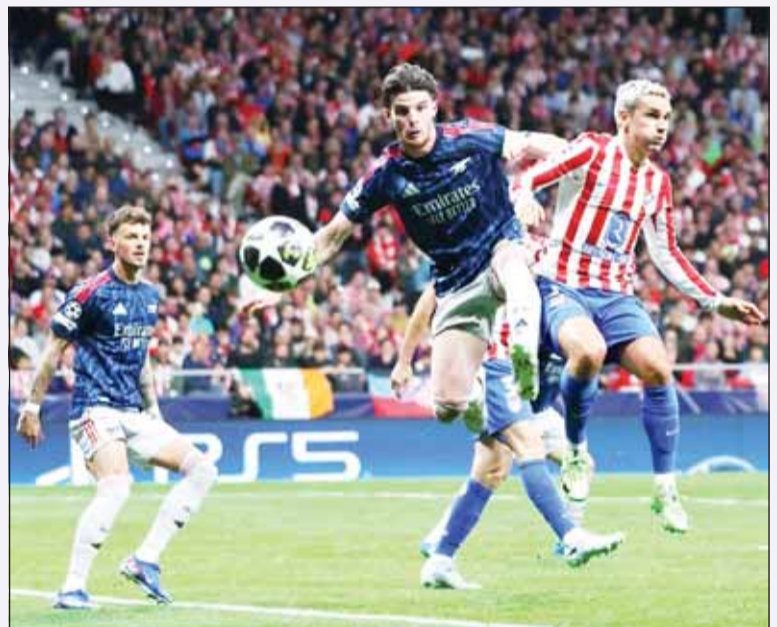
مواجهة آرسنال وأتلتيكو لا تقبل القسمة علم اثنين

يستضيف ملعب الإمارات اليوم، مواجهة من العيار الثقيل تجمع بين آرسنال وضييفه أتلتيكو مدريد، في إياب نصف نهائي دوري أبطال أوروبا لموسم 2025-2026، في لقاء يُنتظر أن يحمل الكثير من الإثارة والحسم.