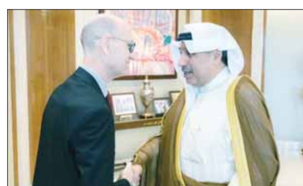
الشيخ حمد جابر العلي مستقبلاً سفير مالطا د. جورج زاميت

استقبل وزير شؤون الديوان الأميري الشيخ حمد جابر العلي، ورئيس ديوان سمو ولي العهد الشيخ ثامر جابر الأحمد، سفير جمهورية مالطا لدى الكويت د. جورج سعيد زاميت. ويبحث الجانبان خلال اللقاء العلاقات الثنائية بين الكويت وجمهورية مالطا، وسبل تعزيزها وتطويرها في مختلف المجالات، إلى جانب استعراض الفرص المتاحة لتوسيع آفاق التعاون بما يخدم المصالح المشتركة.