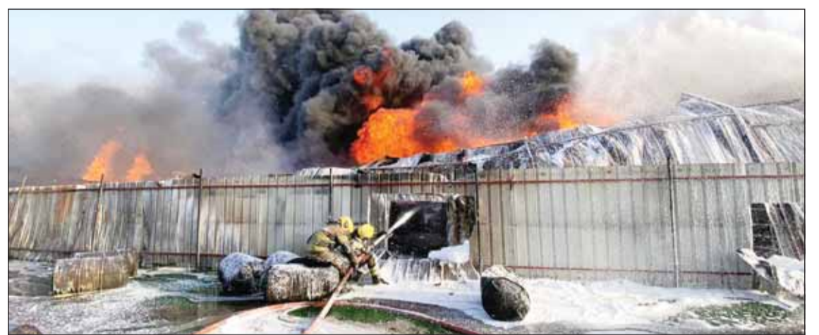
أبطال الإطفاء... صورة أرشيفية خلال تعاملهم مع إحدى الحرائق