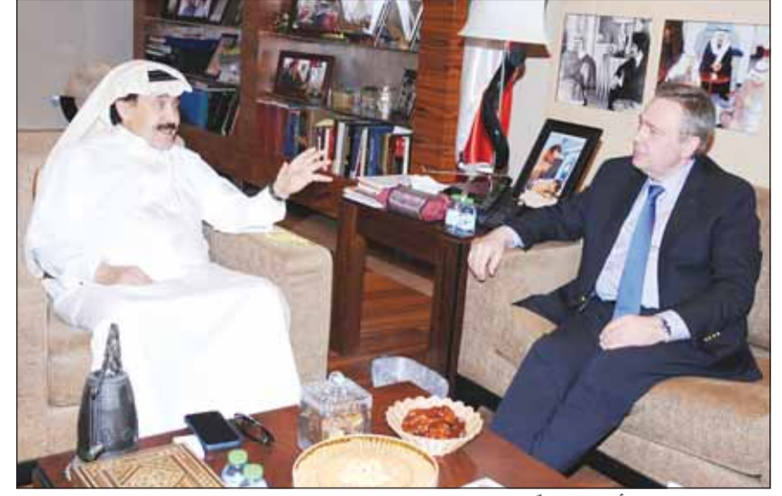
العميد رئيس التحرير أحمد الجارالله خلال استقباله السفير الروسي فلاديمير جيلتوف