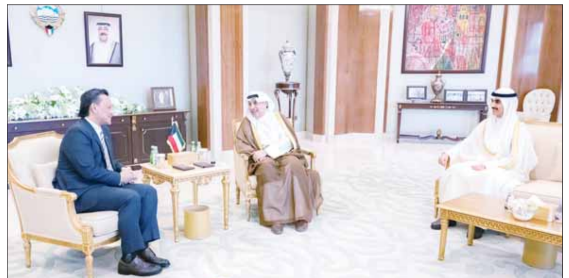
الشيخ حمد جابر العلي والشيخ ثامر جابر الأحمد لدم لقاتهما سفير ماليزيا علاء الدين محمد نور