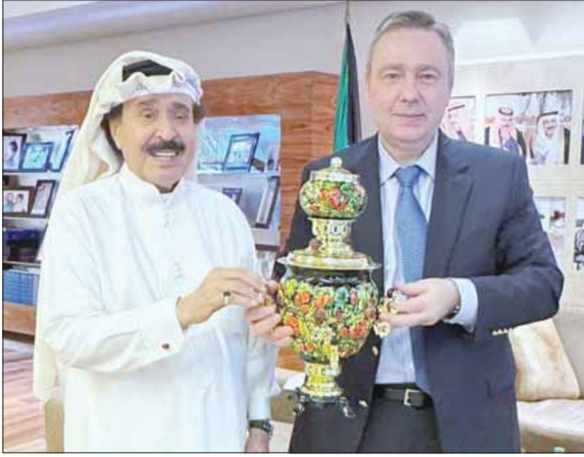
السفير الروسي يقدم هدية تذكارية لرئيس التحرير