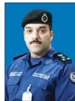
العميد محمد الغريب

على سلامة المجتمع. وأشاد العميد الغريب بالدور البطولي الذي يقوم به رجال الإطفاء في جميع المراكز، مؤكداً أنهم خط الدفاع الأول في مواجهة الحرائق والحوادث والكوارث وأنهم يجسدون أسمى معاني الشجاعة والتفاني في سبيل حماية الأرواح والممتلكات رغم ما يواجهونه من مخاطر جسيمة أثناء تأدية واجبه الإنساني والوطني. ووجد العميد الغريب التأكيد على أن قوة الإطفاء العام مستمرة في تطوير قدراتها البشرية والفنية وتعزيز جاهزيتها لمواجهة مختلف التحديات، داعياً الجميع إلى التعاون والالتزام بإرشادات السلامة للحد من الحوادث وحماية الأرواح من مخاطر الحريق.