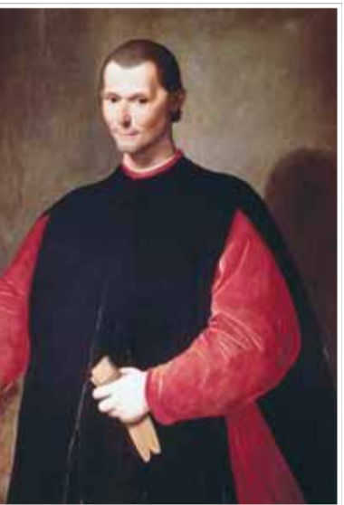
كتاب "الأمير" لمكيافيلي

إضافة نوعية في حقل التاريخ المقارن للفكر السياسي، ويسهم في فهم الصلات الفكرية بين العالم العربي وأوروبا، إلى جانب إبراز دور الترجمة في إنتاج المعرفة وتحولات الدولة الحديثة.