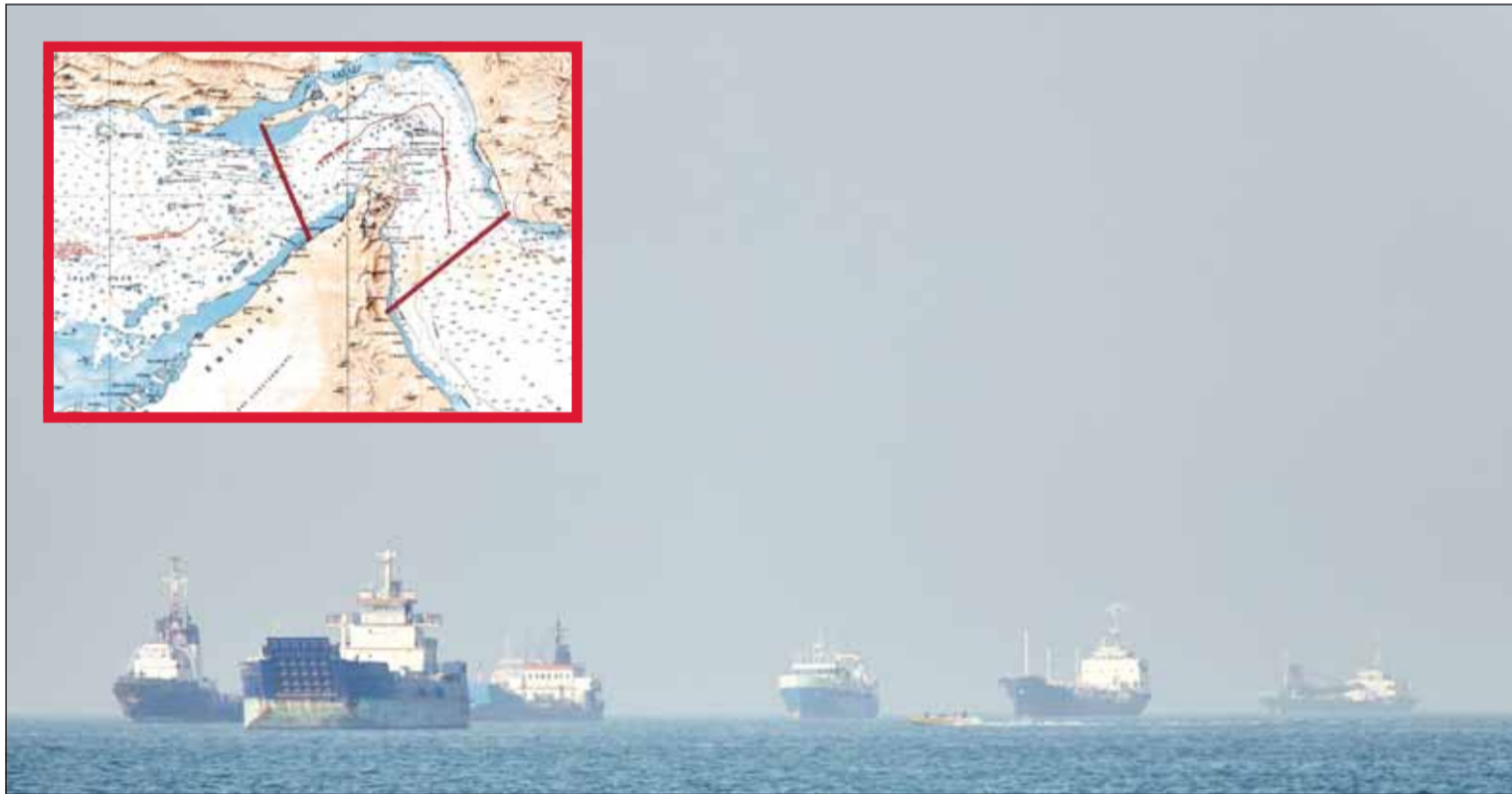
سفن الشحن والبضائع السائبة وسفن الشحن العامة في عرض البحر بمضيق هرمز قبالة ميناء بندر عباس الإيراني وفيه الاضرار خريطة محدثة نشرها "الحرس الثوري" تظهر الوضع فيه المضيق