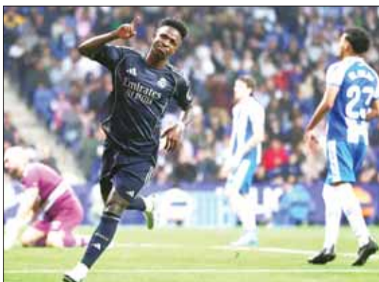
تألق فينيسيوس بقاء إسبانيول

وبهذا الفوز تتأجل احتفالات برشلونة باللقب، لكن ربما لمدة أسبوع واحد فقط إذ يحظى الفريق الكتالوني بفرصة الحسم أمام منافسه التقليدي مطلع الأسبوع المقبل.