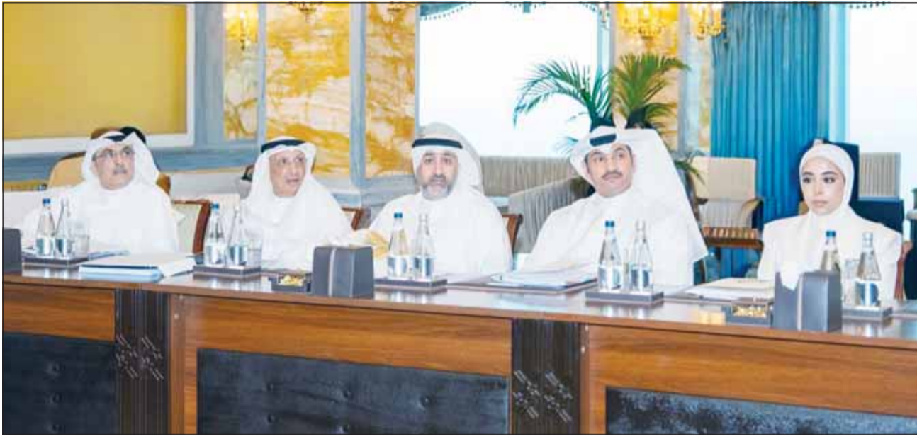
أعضاء الجانب الكويتي المشاركون

موافقة بالإجماع على مقترح الكويت استقطاع 10% من أرباح 2025 لدعم الشعب الفلسطيني