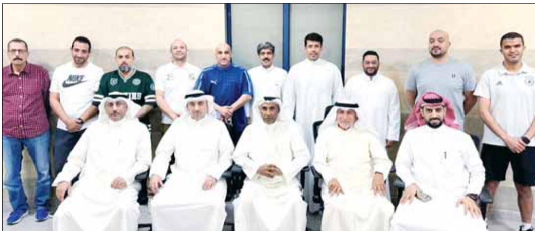
من اجتماع السكواش مع الأندية

وفي ختام الاجتماع، أعرب العمران عن تمنياته بالتوفيق لجميع الأندية المشاركة، وتحقيق النتائج المرجوة فيها تبقى من منافسات الموسم الرياضي.