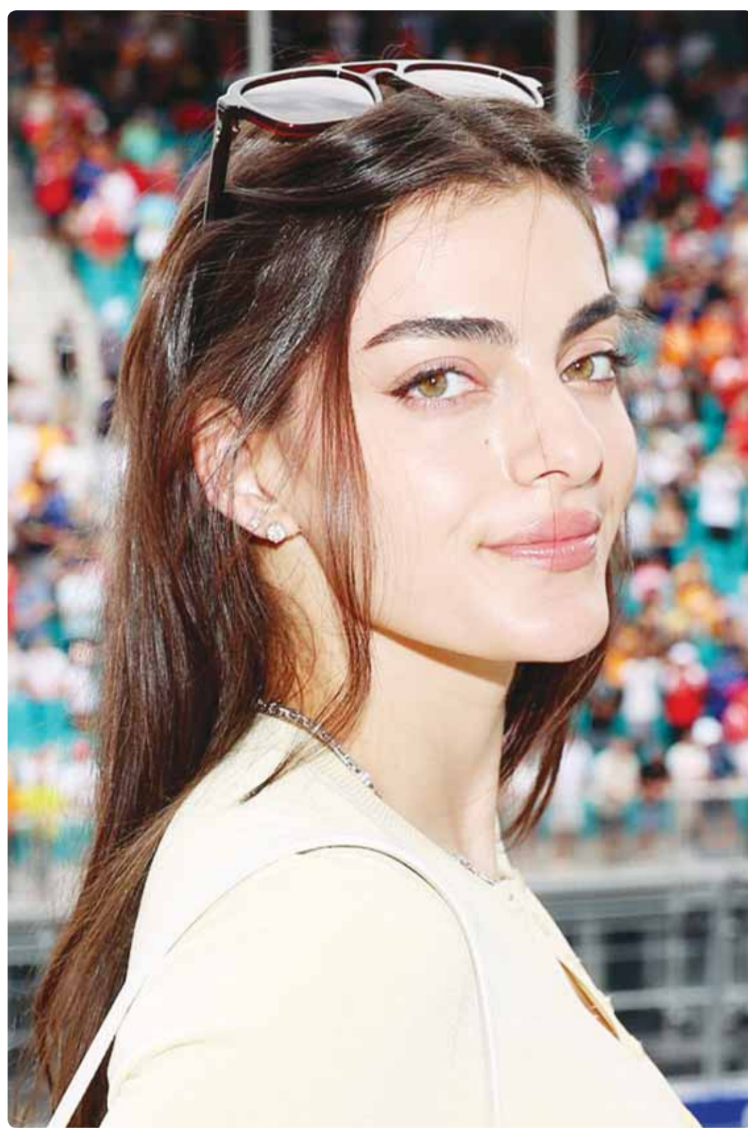
عازرة الأرياء الأميركية توني بريديغر خلال حضورها حفل "أصدقاء المشاهير" في ميامي

فهذا الشعب يرغب في التخلص من النظام القائم الذي حرمهم من الكرامة والحرية، وأبسط مقومات الحياة الكريمة، وسلب منهم كل شيء، أي ان الشرق الأوسط سيكون أفضل حالا مستقبلا، وفقا لتحليل أجنبي.