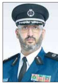
الواء طلال الرومي

أثبتوا كفاءة مهنية واقتداراً عملياً واستجابة سريعة للحوادث الطارئة